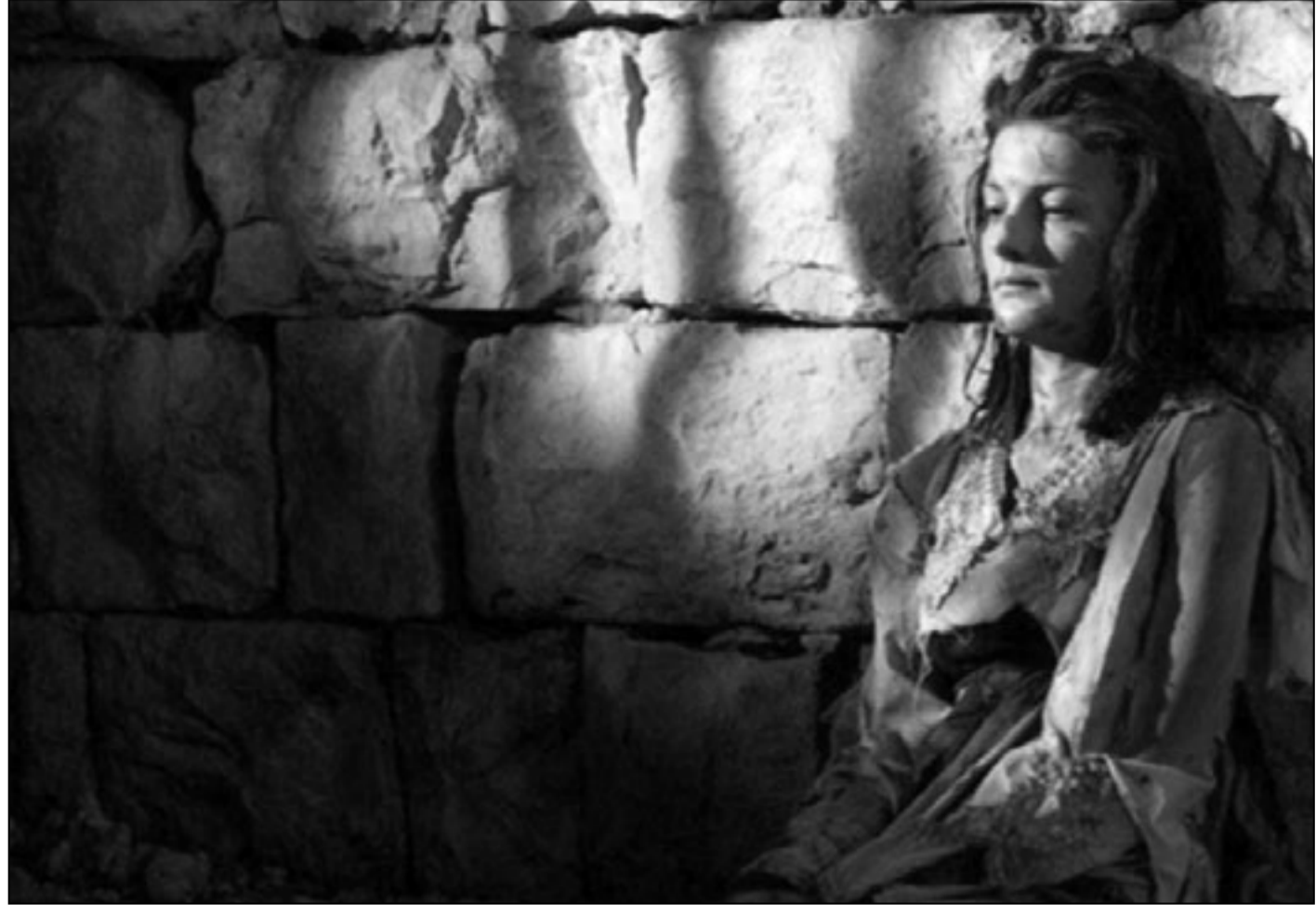
لقطة من مسلسل «أنا القدس»

شارع عبدالعزیز هو اسم واحد من الشوارع العتية الرئيسية الهامة في قلب القاهرة بالقرب من ميدان التحرير وشارع الأزهر وش كلوت بك وش الفجالة، هذا الشارع