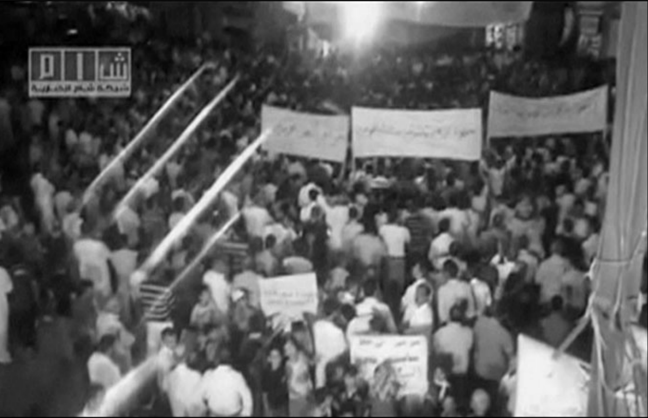
سوريون يتظاهرون في منطقة الرستن

الخليجي الست إلى وقف فوري لاعمال العنف وأي نشاط مسلح وانتهاء سفك الدماء واللجوء إلى العسكرة واجراء اصلاحات جادة وضرورية. وتقول منظمات حقوقية ان قوات الامن السورية قتلت 1600 مدني على الاقل منذ تفجر الاحتجاجات التي استلهمت الانتفاضات العربية التي اطاحت بريثسي مصر وتونس.