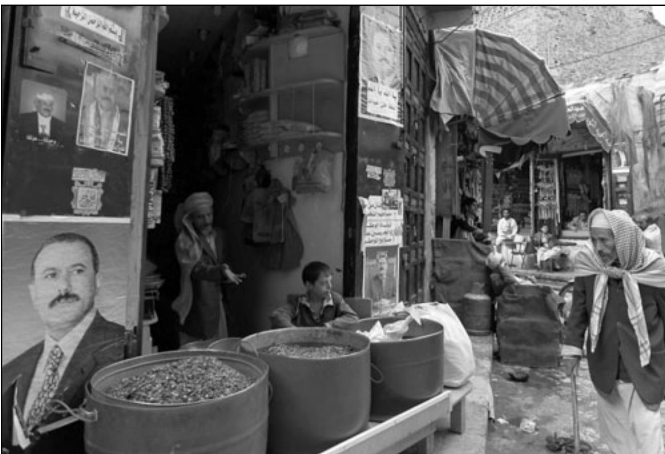
أحد المارة يمر أمام محل في المدينة القديمة بصنعاء وصور الرئيس اليمني معلقة على جدرانها