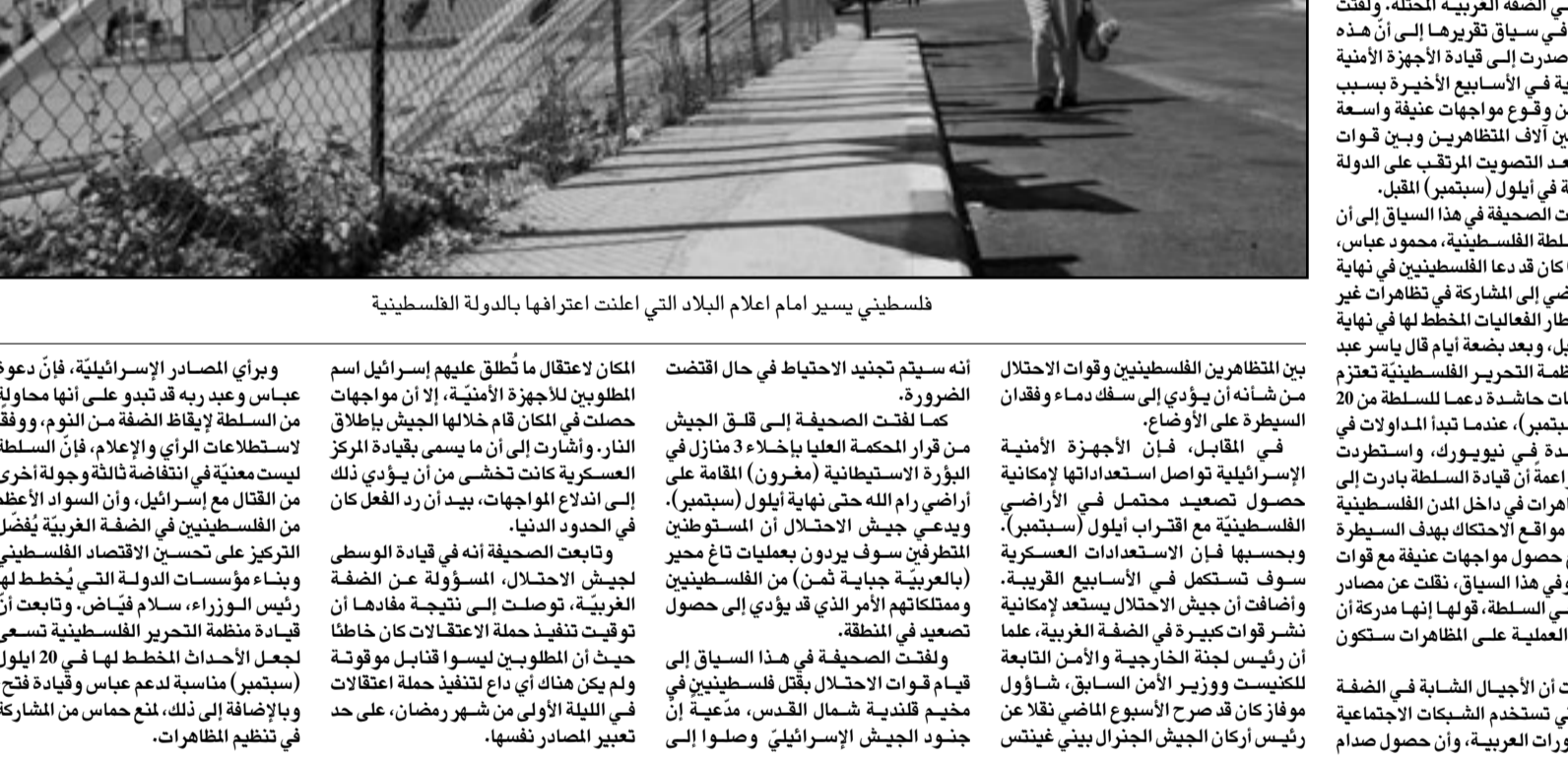
فلسطيني يسير امام اعلام البلاد التي أعلنت اعترافها بالدولة الفلسطينية

قرب حلول شهر أيلول (سبتمبر) المقبل الذي تنوي فيه القيادة الفلسطينية التوجه للامم المتحدة لطب اعتراف دولي بدولة على حدود العام 1967 وعاصمتها القدس الشرقية. حذر ليبرمان من أن السلطة تجري استعدادات للقيام بـ «أعمال عنف وسفك الدماء على نطاق لم يسبق له مثيل في أيلول المقبل»، وزعم ليبرمان الذي يتزعم حزب «إسرائيل بيتنا»، الهزيمة المتشددة أن السلطة الفلسطينية تنوي إرسال آلاف الفلسطينيين لهزيمة حاجزي الرام