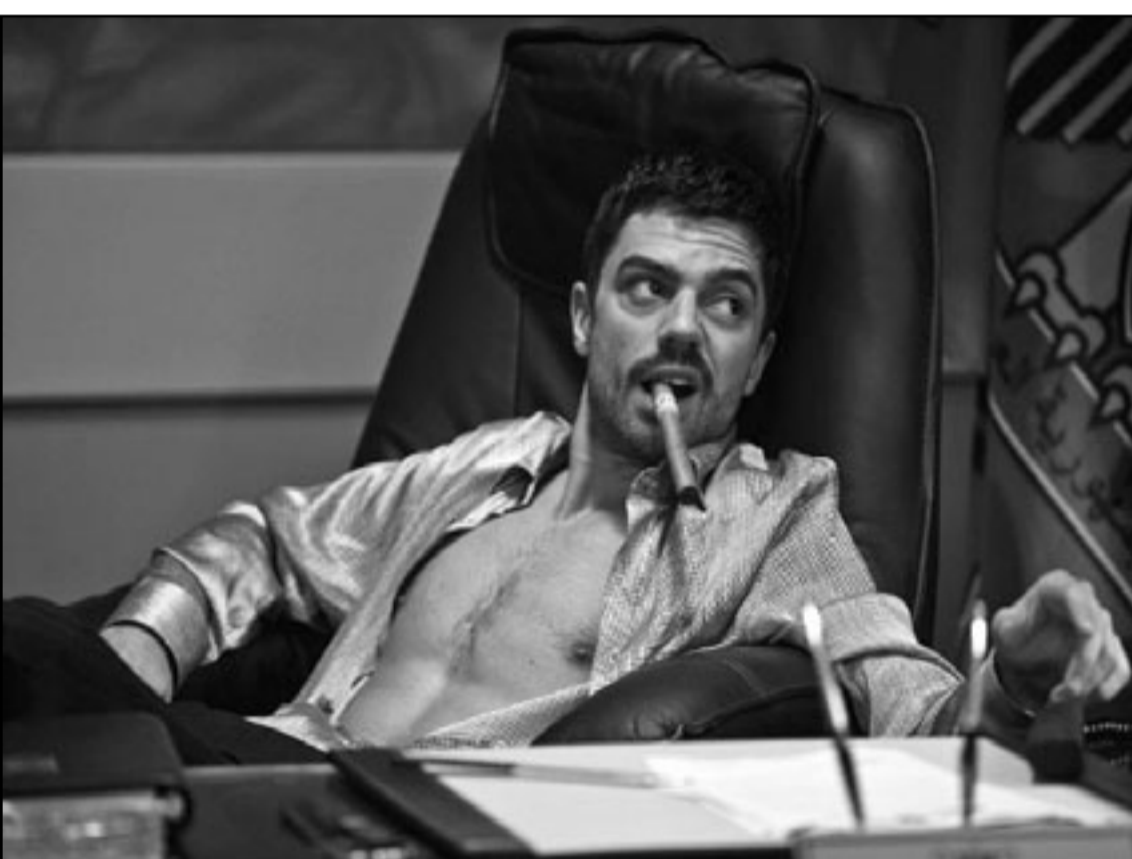
دومينيك كوبر في دور عدي صدام حسين

يرى نقاد الفيلم الهوليوودي «شبيه الشيطان» والذي يحكي قصة لطيف يحيى الرجل المقترض انه شبيهه عدي صدام حسين، لا يمكن تصديقها. مع ان صناع الفيلم يقولون انه قائم على «قصة حقيقية»، ولكن من يهتم، فالفيلم يقول ان شخص شريف، وسيتم عرض الفيلم في نهاية الشهر الحالي، ويقوم الممثل البريطاني دومينيك كوبر بلعب دور الاثنان عدي ويحيى حيث يصور الحياة المتوحشة والغريبة التي عاشها عدي وهو يقتل ويعتصب النساء، في الوقت الذي كان شبيهه يلعب دور من يحبه من الرصاص والافتيات. ولكن قصة يحيى تتور حولها الشكوك خاصة ان عدداً من دائرة عدي المغلقة قالوا ان القصص التي يحكيها لا يمكن تصديقها او التسليم وبوقوعها، وكان يحيى قد حاز اهتماماً عندما ظهر في أوروبا في التسعينات من القرن الماضي واثار مظهره الذي يشبه عدي الكثير من القصص والقرارات الصحافية، وقابله وكالات استخباراتية اجنبية حيث اخبرها انه عاش حياة عريضة كشبيهه لعدي صدام، الذي قتله قوات خاصة امريكية في تموز - يوليو 2003 مع شقيقه قصي وابنه، وقال انه انقلب على عدي عندما حاول الاخير قتله لان صديقه له اقتربت منه أكثر مما يجب، وحقت مذكراته مبعات كبيرة وجلبت له الشهرة، وقصة يحيى في تفاصيلها تصلح للشاشة السينمائية فهي تحكي قصة رجل ابن عائلة ثرية لها صلات مع