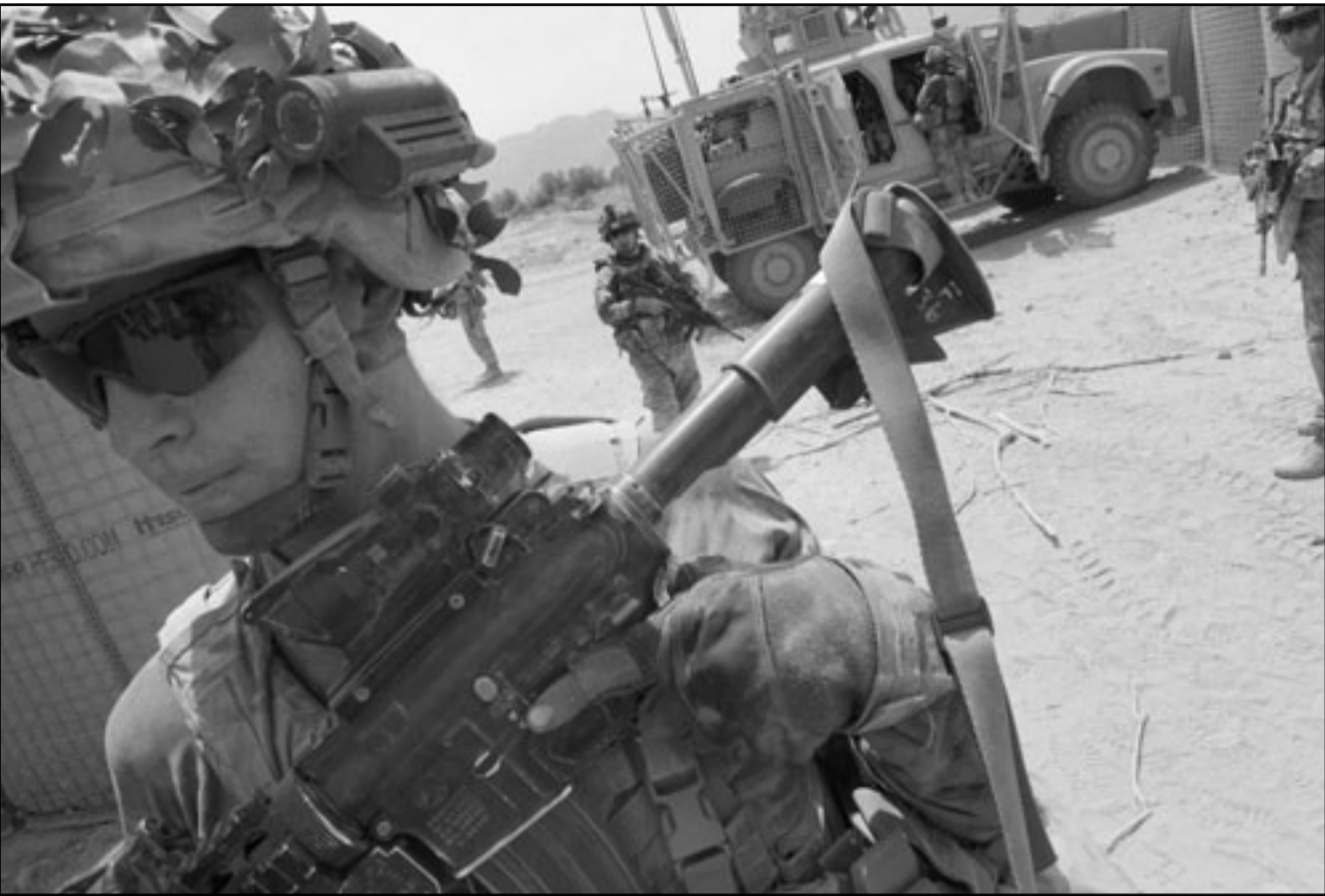
جنود امريكيون في مكان حادث تحطم الطائرة المروحية في باكستان

عواصم - وكالات: كشف مسؤول حكومي امريكي عن أن معظم الجنود الذين قتلوا جراء إسقاط طائرة (إيساف) في افغانستان ينتمون إلى الوحدة التي نفذت عملية قتل زعيم تنظيم (القاعدة) أسامة بن لادن في باكستان في أيار/مايو الماضي. ونقلت شبعة (سي إن إن) الامريكية، امس الأحد، عن المصدر قوله إن 22 جنديا امريكيا من أصل 31 قتلوا على متن المروحية التي سقطت في افغانستان فجر السبت، ينتمون إلى القوات الخاصة. وأضاف أن معظمهم من الوحدة نفسها التي نفذت عملية اغتيال بن لادن. وأشار المسؤول إلى أن الطائرة قد تكون سقطت بغير أن مسلحين في إقليم إردوك المضطرب الواقع وسط شرق افغانستان.