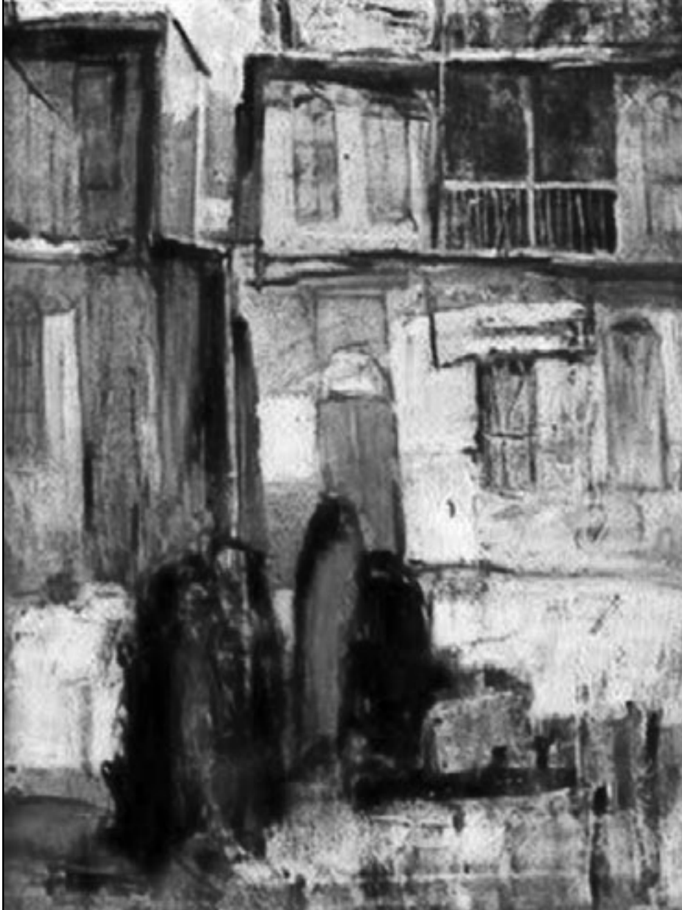
«سوسة وشناشل بغدادية» لفائق حسن

وإذا ما تمعنا جيدا في الأثر الذي تركه فائق حسن في المشهد الفني الحديث في العراق نستدر أن شخصيته كانت أهم من رسومه، هل كان معلما جيدا؟ كان هناك الكثير من معلمي الفن الجيدين في العراق، على سبيل المثال: رسول علوان، غالب ناهي، رافع الناصري، محمد مهر الدين غير أن واحدا من هؤلاء لم يترك لونه في خيال طلابه متلقا فعل فائق حسن، لا يزال هناك من يؤمن بعبقريته معتبرا إياه رساما استثنائيا، وحين نقول له ان الرجل كان رساما عاديا فإنه لا يرى في ذلك القول إلا نوعا من الكفر، لقد استأنس الكثيرون إلى أفكارهم القديمة يوم كانوا طلابا ومضوا بها إلى حتوفهم، لم يعد في الإمكان اليوم تغيير شيء من قناعاتهم، وكما أن فرأى تلك القناعا حتى قد أفسدت الكثير من المواهب، فمن كان يرى في فائق حسن رساما عظيما لا يمكنه سوى أن يحذو حذوه، في الانتحال واقع لم يعشه أحد، فتي ارتجانا طبيعة نتم يرها أحد، كان هناك الكثير من الكتب في رسوم الرجل، لذلك سحرت رسومه عيون من لم يكن الرسم يعني لهم سوى حيلة تسرق النظر بعيدا عن خيال البيت، كانت تلك الرسوم تسرد وقائع حياة، هي مزيج من السير الذاتية وكهايات الشعر العربي القديم، بالنسبة لتلك الفئة لم يكن الرسم مهما بل كان ما يُرسم هو الأهم، وكان فائق حسن مخلصا إلى ما يُرسم، لكن بطريقة ليست صادقة دائما، ذلك لأن نظره لم تكن تقع إلا على المشاهد التي تبدو فيها الحياة انتصارا محققا بيهاء كبرى، بالنسبة لفائق