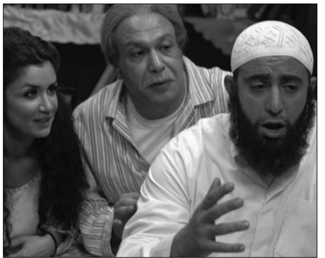
لقطة من فيلم «ابن القنصل»