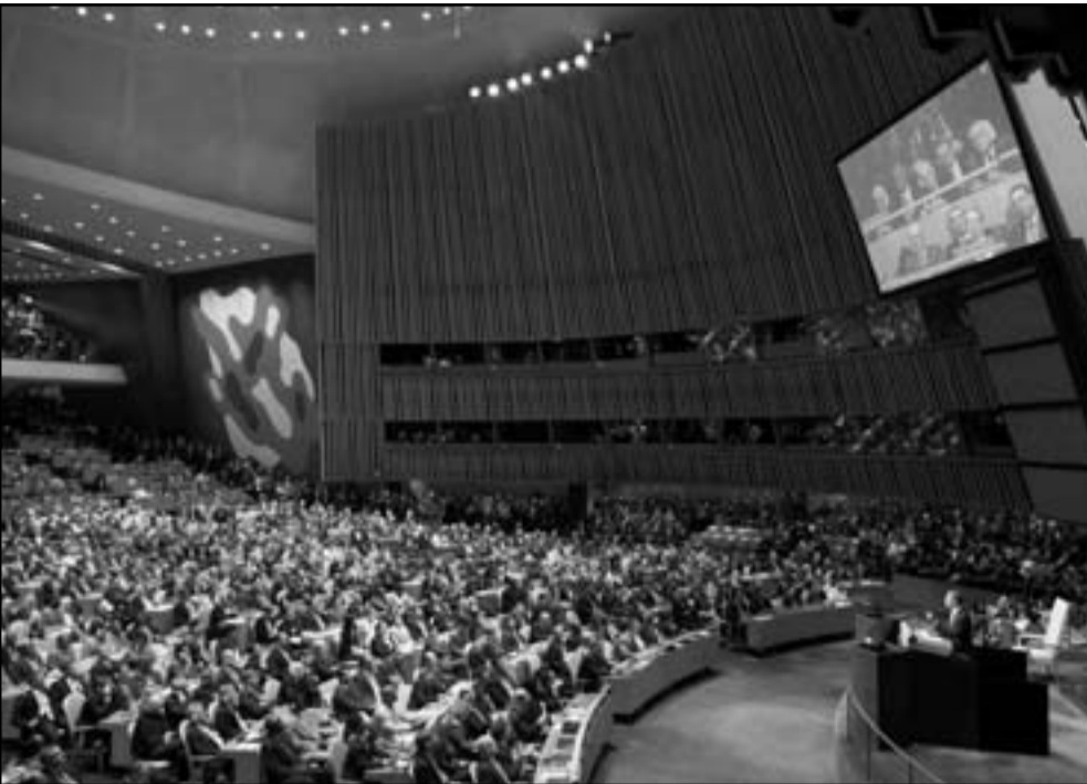
نقل القضية الفلسطينية الى الجمعية العمومية بعقد الوضع

تدويل القضية الفلسطينية الى الجمعية العمومية بعقد الوضع في هذه الاثناء، الحقيقة، تدويل الصراع لا يبدو سيئا. فهذا افضل بكثير من انتفاضة اخرى، وعلى أي حال يصعد الامريكيون الفلسطينيين الذين يبدون مستائين ومحيطين. المشكلة هي ان نقل القوة الى الاسرة الدولية ومؤسساتها هي قصة متقلبة، فانت تعرف اين يبدأ