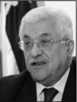
عباس يتحمل مسؤولية العشل