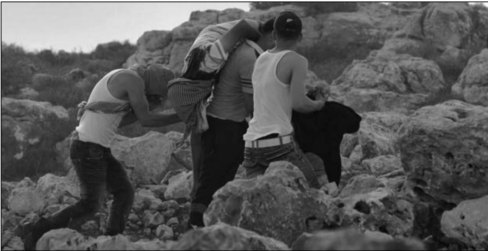
شبان فلسطينيون يحملون زميلا لهم اصاب بجرح في رأسه خلال تظاهرة قرب نابلس واستشهيد في وقت لاحق