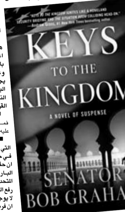
سيناتور بوب غراهام

الذي ذلك من المحتمل ان تكون هناك انسانة تشبهها تماما. حسنا، من ناحية المشاكل المالية يبدو انها تشبه قليلا واحدة مثل آني ليفوفيتز... لا تعليق الشخصية التي تشبهك كثيرا تقتل مباشرة في بداية الكتاب، هل كان ذلك من اجل الا يكون تدخلك كبيرا في الرواية؟ السيناتور بيلينغتون ليس الشخصية المناسبة، لكنه حاول جهده، فعليا، لقد واجهت زوجتي صعوبات مع الرواية ولنفس هذا السبب بالتحديد. لقد جعلتها حزينة حين قرأت عن موتي وعن جنازتي وعن تلك الاشياء، لكن هذه هي الحياة. هل كان التقابل متعمدا بين موظفي الخدمة المدنية والمعينين سياسيا؟ الرواية تأسس فعلا على الثقة في هؤلاء الذين قضاوا حياتهم المهنية في الخدمة المدنية. حسنا، تجربتي السياسية، لسوء الحظ، هذا ليس وضعا نادرا، اذ ان لديك موقفا سياسيا لديه جدول اعمال خاص، وبشكل متكرر وتحت اشراف وثيق من احد رؤسائه السياسيين. مذن ان كتبت