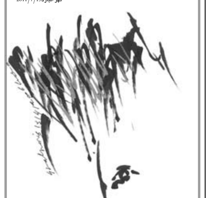
نهر البارد 13/7/2011