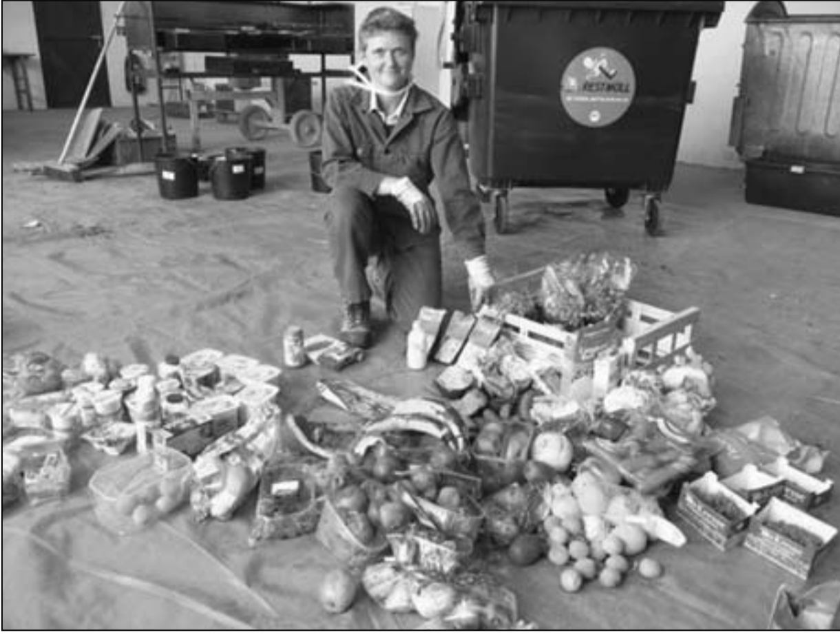
«تذوق النفايات» (القدس العربي)

من المناظر التي نشاهدها في الفيلم هو مشهد المتاجر الكبرى عندما تقوم فرق البحث فيها بمراجعة مخزون الأغذية ومدى تاريخ صلاحيتها وهو الأمر الذي يتم فيه القاء ما بين 500 إلى 600 طن سنوياً عندما تقترب تاريخ صلاحيتها من الإنتهاء.