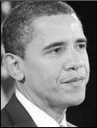
اواما بدأ في خطابه صهيونيا

يمكن ان تنتهم بالطبع ابو مازن بالمسؤولية