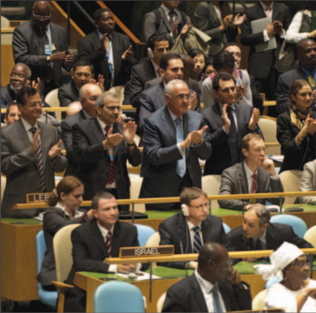
الرئيس الفلسطيني محمود عباس يعرض نسخة من طلب عضوية فلسطين في الامم المتحدة... والى اليسار وفود اعضاء الجمعية العامة يرحبون بخطابه فيما ساد الوجود الاسرائيلي

تمسك بالمقاومة السلمية وحق العودة واصر على رفض الاستيطان و«يهودية اسرائيل»