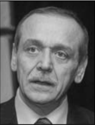
عديرة: انتهي دور الوسيط الامريكي