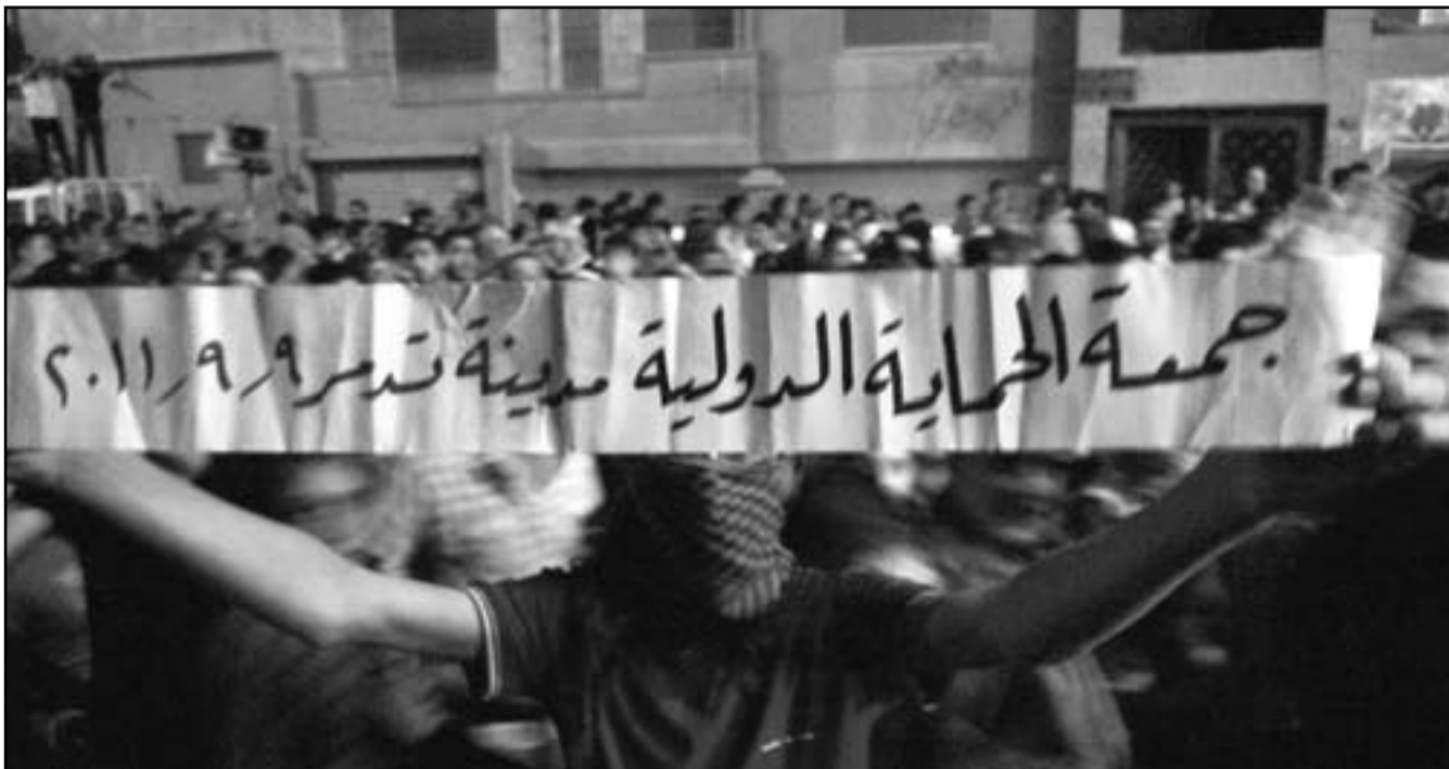
تظاهرة في مدينة تدمر السورية اطلق عليها جمعة الحماية الدولية

فيسيوك نداء جديدا للتظاهر الجمعة تحت شعار «وحدة المعارضة».