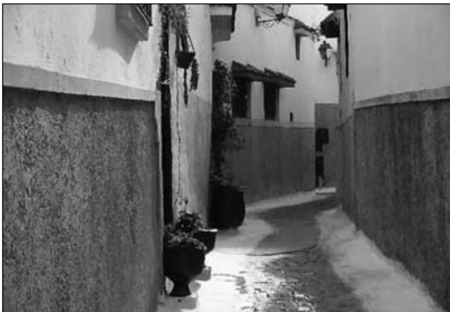
أحد أحياء مدينة سلا

■ سلا (المغرب) – رويترز: قال منظّمون إن أحدث مهرجان دولي لفيلم المرأة بسلا قرب الرباط يهدف إلى إعادة التّألق إلى المدينة الغارقة في مشاكل الإجماد والهجرة القروية والتخلف وهي المدينة التي إجماد بناؤها إلى آلاف السنين وتعاقبت عليها حضارات تاريخية متنوعة.