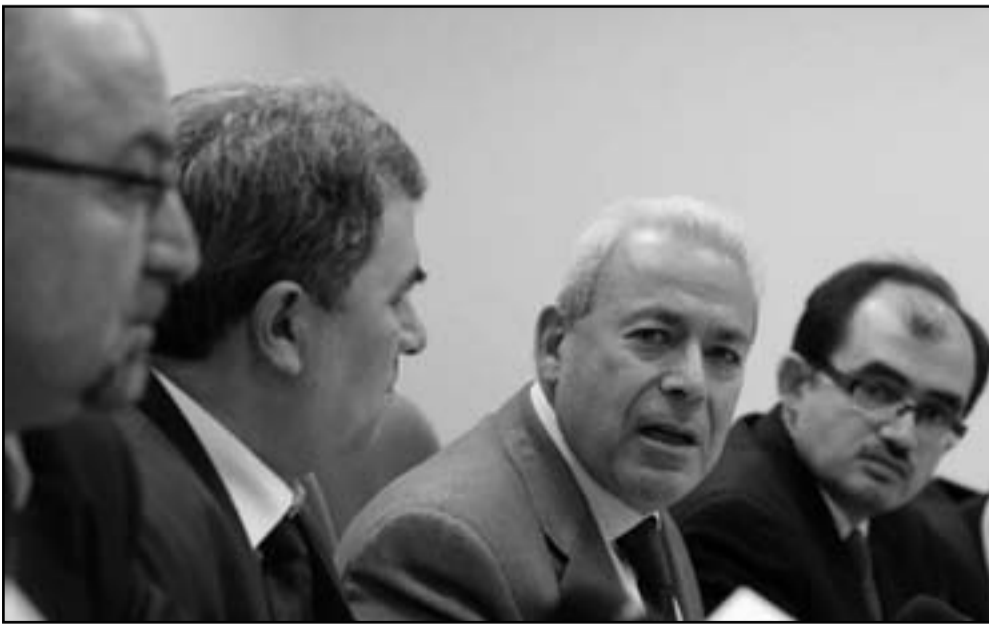
رئيس المجلس الوطني السوري برهان غليون وعضاء الوفد السوري لدى اجتماعه مع مسؤولين روس في موسكو

كان غليون، الأكاديمي المقيم في باريس، دعا روسيا الاثنين إلى تغيير موقفها إزاء «النظام الاستبدادي» للرئيس السوري بشار الأسد. وقال «لقد حان الوقت لأن نغير القيادة الروسية موقفها إزاء نظام لا يزال يتجاهل دعوات لبدء إصلاحات وإطلاق حوار مع المعارضة بشأن تحول سلمي نحو الديمقراطية». يذكر أن موسكو استقبلت وفدين من المعارضة السورية خلال الفترة الماضية، كما كانت استخدمت حق النقض (الفيتو) في مجلس الأمن الدولي ضد مشروع قرار أوروبي مدعوم من واشنطن لإدانة «العنف» في سورية.