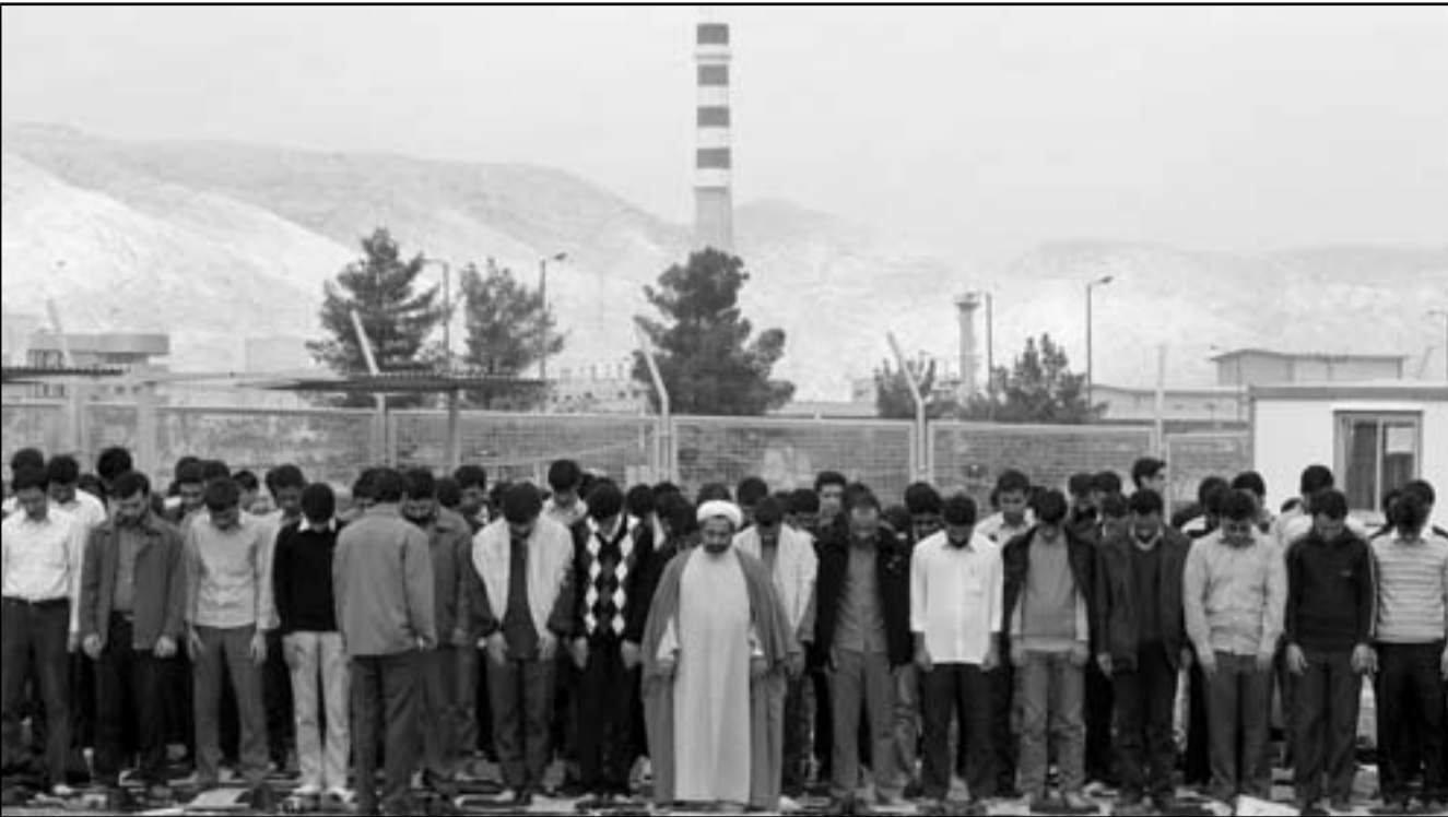
إيرانيون يؤدون الصلاة أمام المفاعل النووي في اصفهان