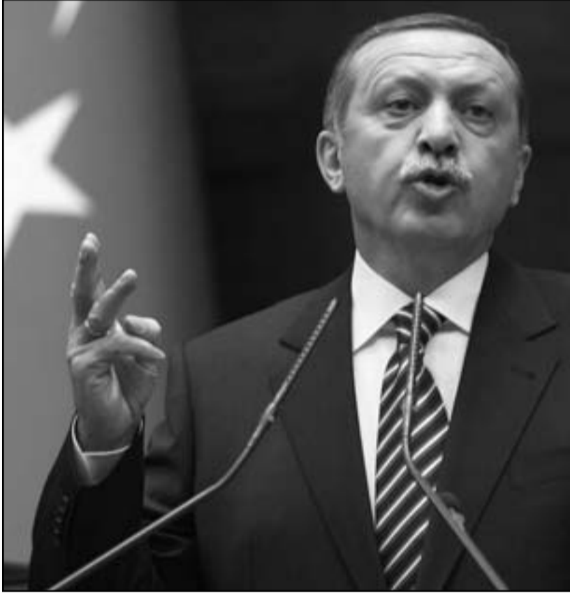
رجب طيب اردوغان يتحدث أمام البرلمان التركي

وأعاد استخدام اللدبانات لاستعادة السيطرة على مدينة حماة في أغسطس آب تكريما سحق والده الرئيس الراحل حافظ الأسد لانفاضة قبل نحو 30 عاما ودفع الأمين العام للأمم المتحدة بان جي مون لاتهامه بأنه فقد «أي شعور إنساني». وحذر وزير الخارجية الفرنسي إن جوييه الأسد الشهر الماضي من أن «القمع الوحشي» في سورية «سينتهي بسقوط