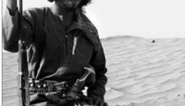
لقطة من فيلم «نجوم الصحراء»

وأضاف المخرج: «لجأ الفريق لهذه التقنية بهدف إظهار جمال الإبل وقيمتها لدى أبناء الولاية الإماراتية». وراس فريق التصوير الكندي ديلين ريد ونفذت شركة كريف بوست في تورونتو الإنتاج النهائي.