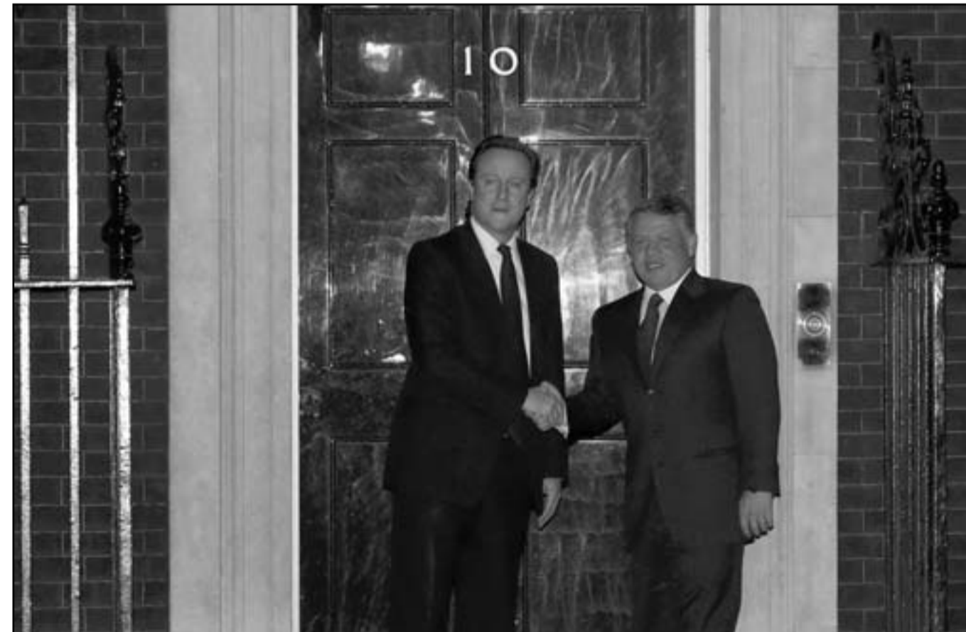
العاهل الاردني الملك عبد الله يصادف رئيس الوزراء البريطاني ديفيد كامرون امام مقر الحكومة البريطانية في 10 داو ونغ ستريت في لندن عقب اجراء محادثات حول التطورات في المنطقة