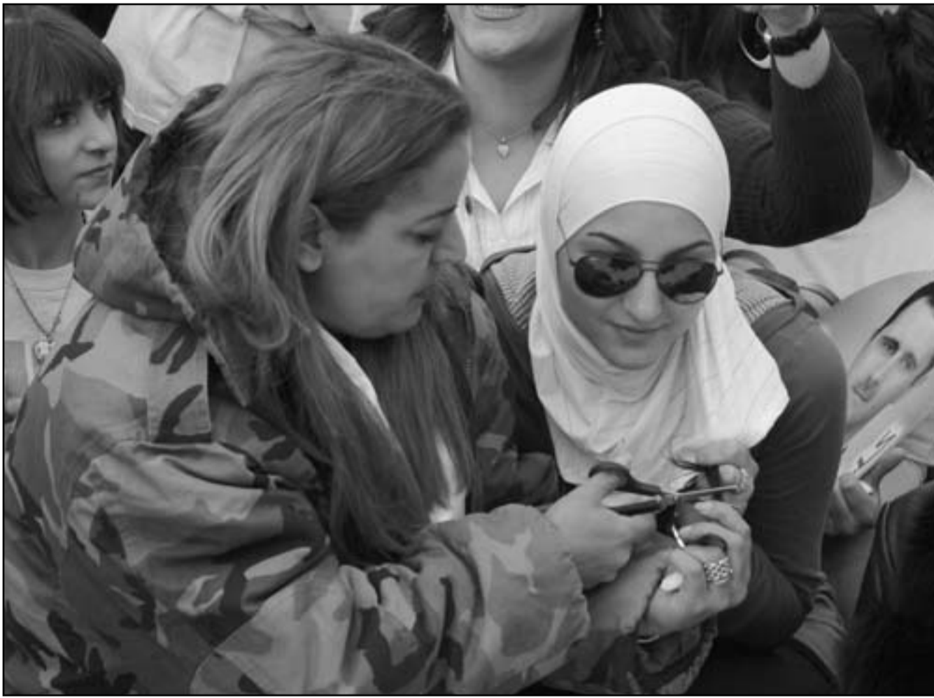
سوريون مؤيدون لتيار الاسد يتظاهرون في دمشق