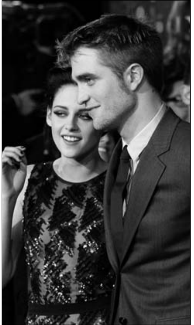
روبرت باتينسون وكريستين ستيوارت