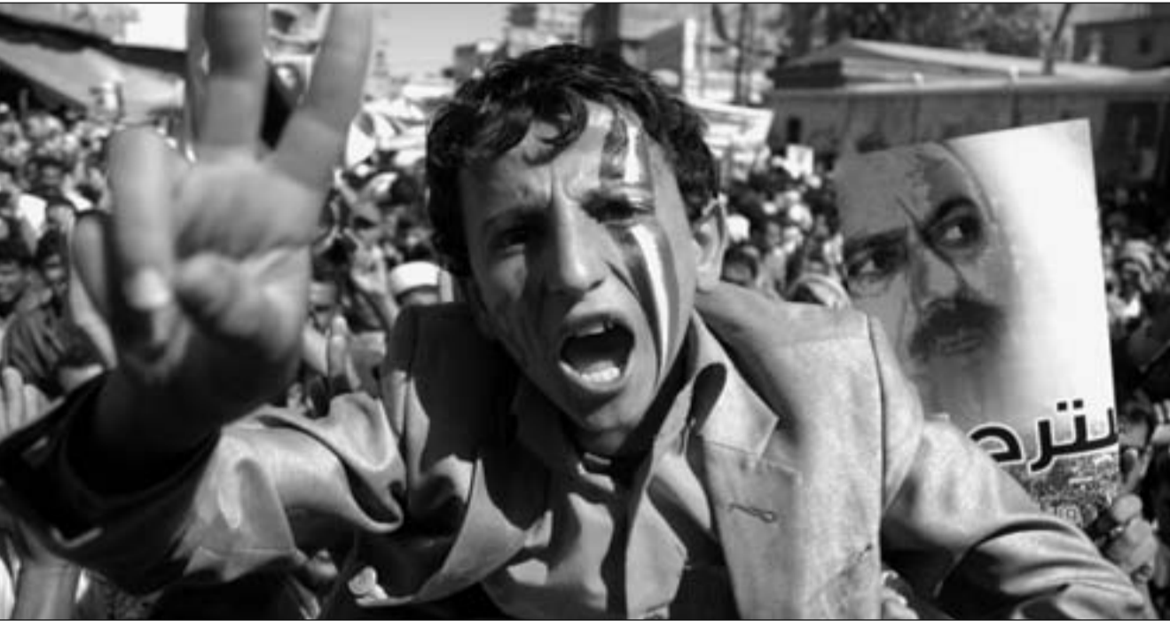
مظاهرات يتنادون بسقوط نظام علي صالح في صنعاء أسس

ومذ السبب الماضي دعا الثوار إلى الإضراب الشامل في مدينة تعز تنديداً بالمجازر التي ارتكبتها قوات النظام ضد المتظاهرين ضد الدعوة العالمية عام، استجاب لهذه الدعوة العالمية من موظفي وعاملات وتجارة المدينة، غير أن هذا الإضراب خقق المدينة وأصابها الحياة فيها بالشلل التام. العديد من الشخصيات الخبوية في تعز اتهمت نظام صالح بأنه يمارس (عمليات انتقام) و(تطهير مناطق) ضد أبناء محافظة تعز، لأنهم أول من فتحوا الثورة الشبابية الشعبية ضد نظامه في تعز، حيث انطلقت الشرارة الأولى للثورة اليمنية، وبالتالي تمارس قوات نظام صالح أن يشعل المجازر ضد تعز، ولم تلتزم بأي اتفاق هدنة لوقف إطلاق النار في تعز، رغم تنفيذ العديد من اتفاقيات الطرفيين المتصارعين، وفقد الأمان فيها إلى حد كبير،، وفقاً للعديد من سكان الشهيرة الماضية بين القوات الموالية لصالح وبين نظيرتها من القوات القبلية المؤيدة للثورة. وأخيراً أكد أحد القريبين من صالح (القدس العربي) أنه سمع صالح قبيل محرقة تعز بأيام يقول «لا أخشى تعز، رغم ساقطها بطعم عسكر، غير أن نظرة صالح هذه خايت أمام التحرك غير المسبوق لرجال الأرياف المسلحين الذين تحفصوا لحماية شباب الثورة في تعز المطالبين بالسلامة للنظام.