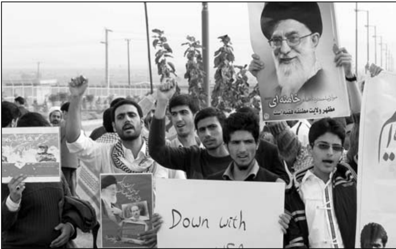
إيرانيون يحملون صورة المرشد الأعلى للجمهورية آية الله علي خامنئي ولقائمه تندد بأمريكا أمام محطة نووية في إيران

أجل التدريب لكن أيضا في إطار الردع، ومن رأيي أن يكون لنا وجود من خلال نظام التناوب - برا وبحرا وجوا». وقال ديمبسي «قبل عام 2001 كنا وحينما كنا نرأس هيئة الأركان ستكون قاتلة أجب «بالقطع». لكن تلك المفاوضات انهارت مع اصرار واشنطن على محاكمة اي جندي أمريكي متهم بارتكاب أخطاء أمام المحاكم الأمريكية لا العرفية. وقال ديمبسي «قبل عام 2001 كنا وحينما كنا نرأس هيئة الأركان ستكون قاتلة أجب «بالقطع».