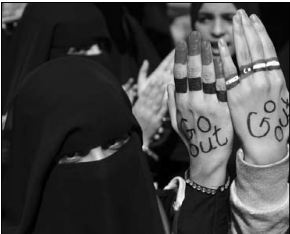
متظاهرة يمنية تطالب برحيل صالح

واعتبر وفد الامم المتحدة إلى اليمن جمال بن عمر اللاشأ أنه يمكن التوصل إلى «تسوية» بين السلطة والمعارضة لإيجاد مخرج لازمة التي تعصف بالبلاد منذ حوالي عشرة أشهر.