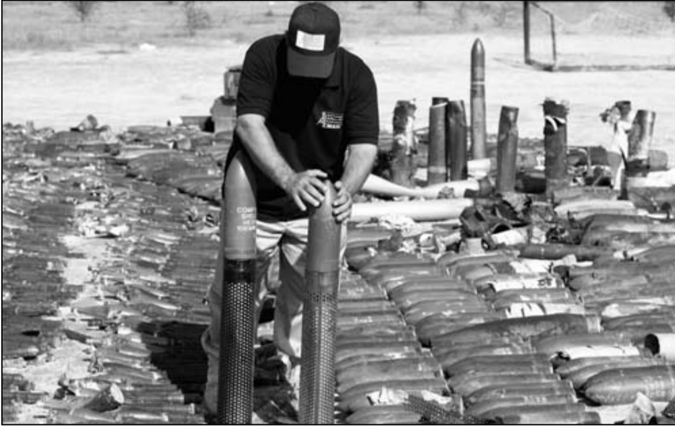
أحد موظفي المجلس الانتقالي يعرض على الصحفيين الأسلحة التي جمعت من الثوار