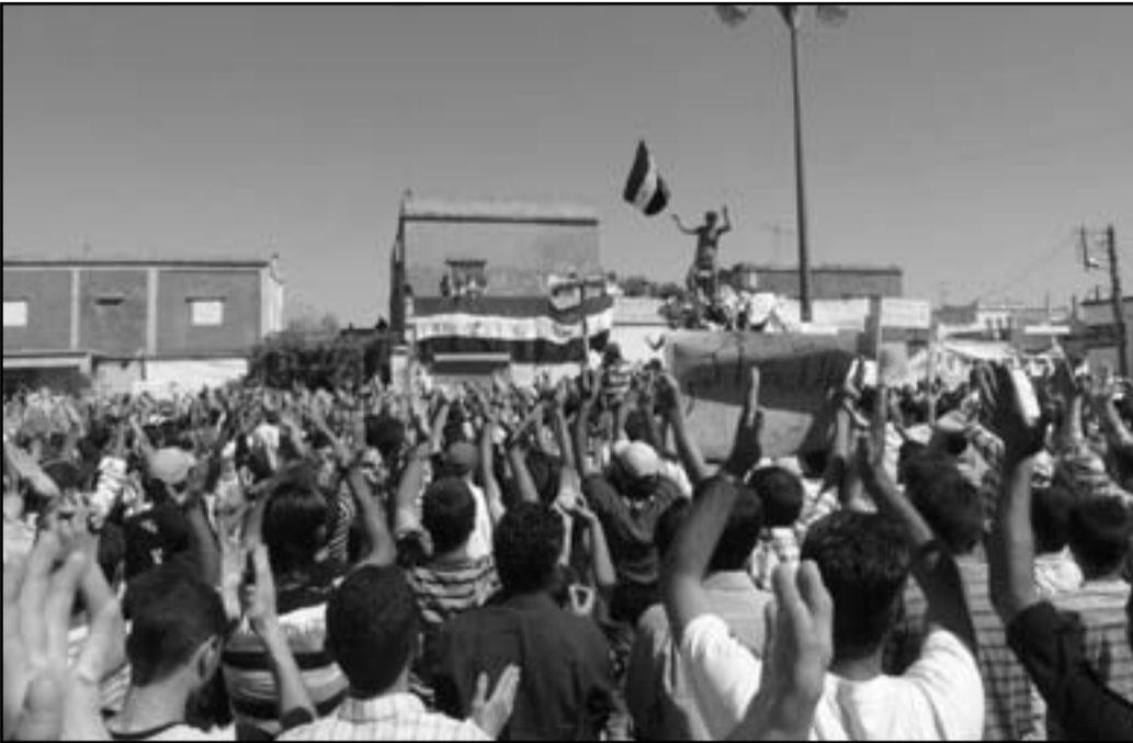
الغرب لا يحرك ساكناً لمنع الأسد من قتل شعبه

ويحاول جرحى المظاهرات ألا يصلوا الى المستشفيات لكتمهم بذلك بمنعهم من علاج مناسب لأن العيادات الخاصة قليلة أو بالواقع مغلقة يعوزها المعدات والخبرة لعلاج جرحى إطلاق النار كما ينبغي. يتم التعيير عن الاقنافية في الخطر الذي الاخلال بحقوق الانسان التي أصيب بها كثير من المنظمات الدولية التي تتناول هذا الشأن بما يجري في سوريا ايضا، ويرغم تقارير عن جرحى توجهوا ليساعدوهم.