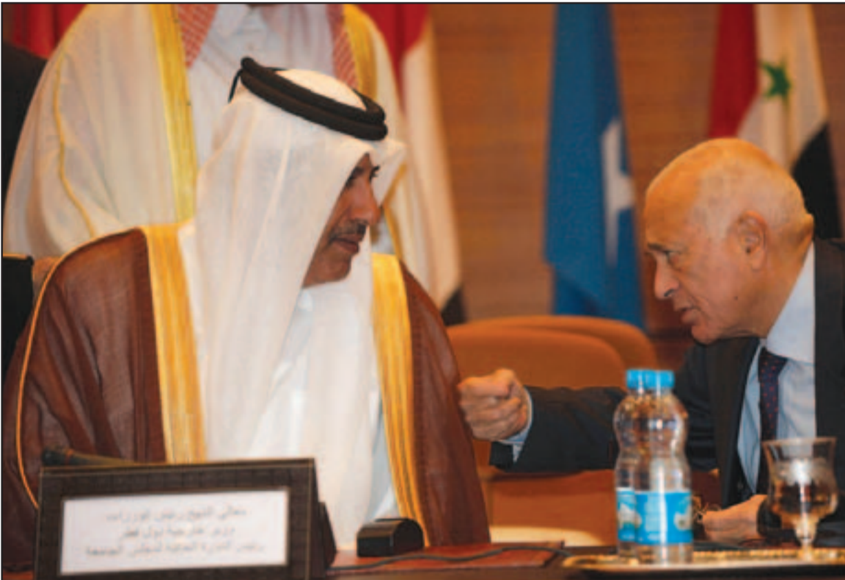
نبيل العربي الامين العام للجامعة الدول العربية في حديث جانبي مع رئيس وزراء قطر حمد بن جاسم اثناء اثناء اجتماع الجامعة العربية في الرباط