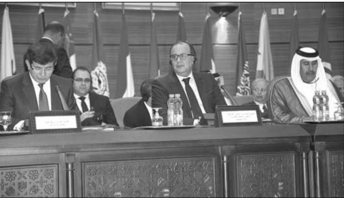
وزير الخارجية المغربي الطيب الفاسي يتوسط نظيره التركي احمد اوغلو (يمين) والشيوخ حمد بن جاسم آل ثاني (يسار)