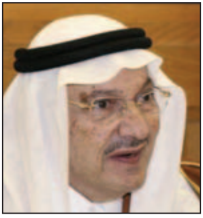
الامير طلال بن عبد العزيز

اعلن الامير طلال بن عبد العزيز مساء امس الاربعاء عن استقالته من هيئة البيعة السعودية، عبر موقعه الرسمي على الشبكة العنكبوتية. وجاءت الاستقالة في جملة مقتضية جدا كالتالي: «استقالة الامير طلال من هيئة البيعة، بعد ان رفع للملك عبد الله، اعلان الامير طلال بن عبد العزيز استقالته من هيئة البيعة»، وهذه الهيئة هي التي تعنى باختيار الملك وولي العهد في المملكة، وانتشاها العاهل السعودي في عام 2006. ولم يوضح الامير عبر موقعه أسباب الاستقالة، الا ان مهتمين بالشأن السعودي قالوا له «القدس العربي» ان استقالة الامير طلال جاءت تعبيراً عن امتعاضه من تجاوز الملك عبد الله له في ولاية العهد والتي اصدر العاهل السعودي قرارا بتعيين اخيه الأصغر الأمير نايف بن عبد العزيز وزير الداخلية وليا للعهد مع احتفاظه بوزارة الداخلية، متجاوزا نحو ستة من الأمراء ممن يكبرونه سنا. وهيئة البيعة المؤلفة من 35 اميرا ويرأسها عميد آل سعود الامير مشعل بن عبد العزيز، الاخ غير الشقيق للملك عبد الله، تختار ولي العهد بأثره اعضاءها.