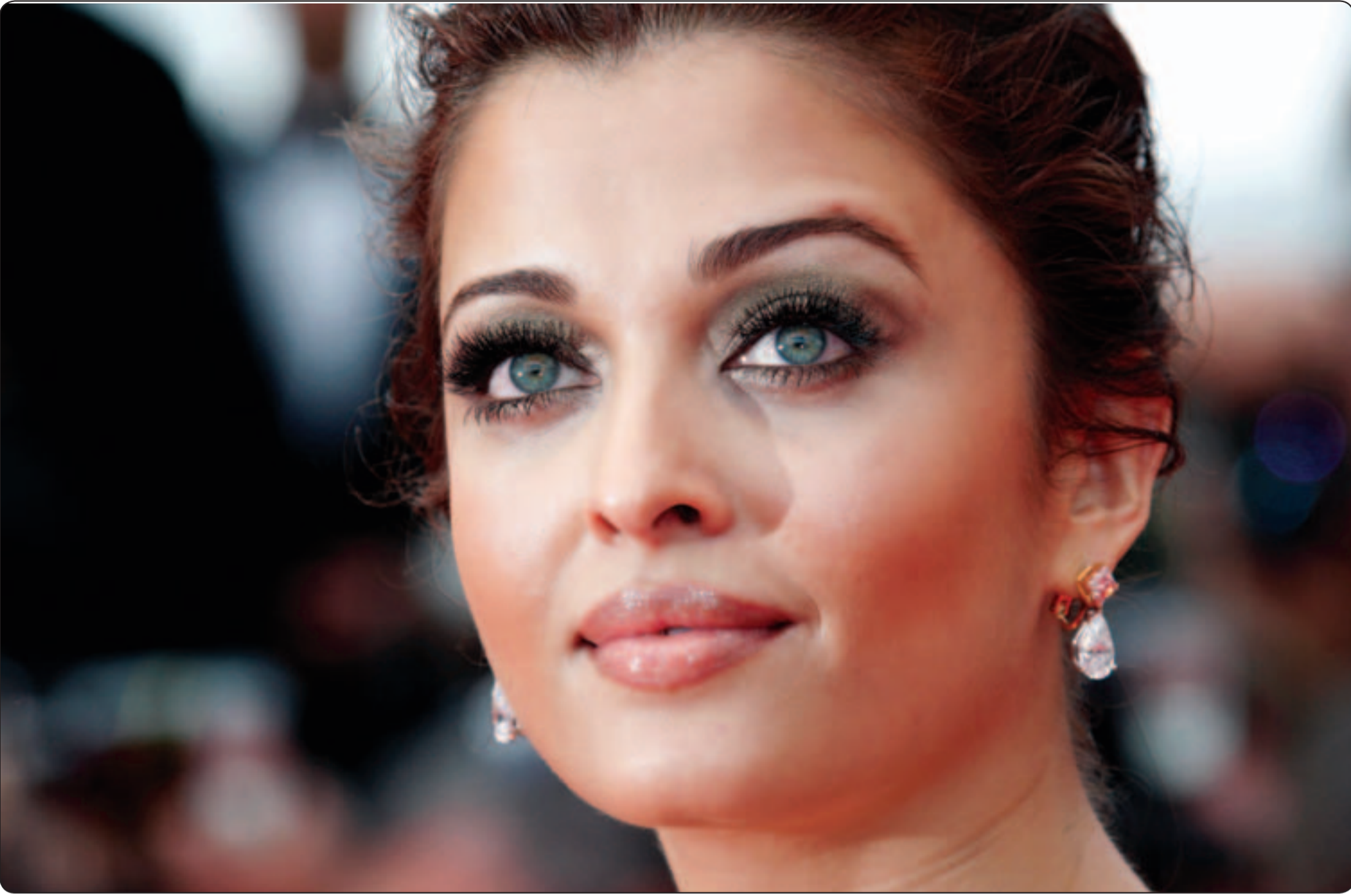
المطلة الهندية أشورايا راي باتشان زرقق بملودة، وأعلن زوج الممثلة غير «تويتير» أن جد المولودة النجم الهندي الكبير اميتاب باتشان فخور جدا بحيثيته