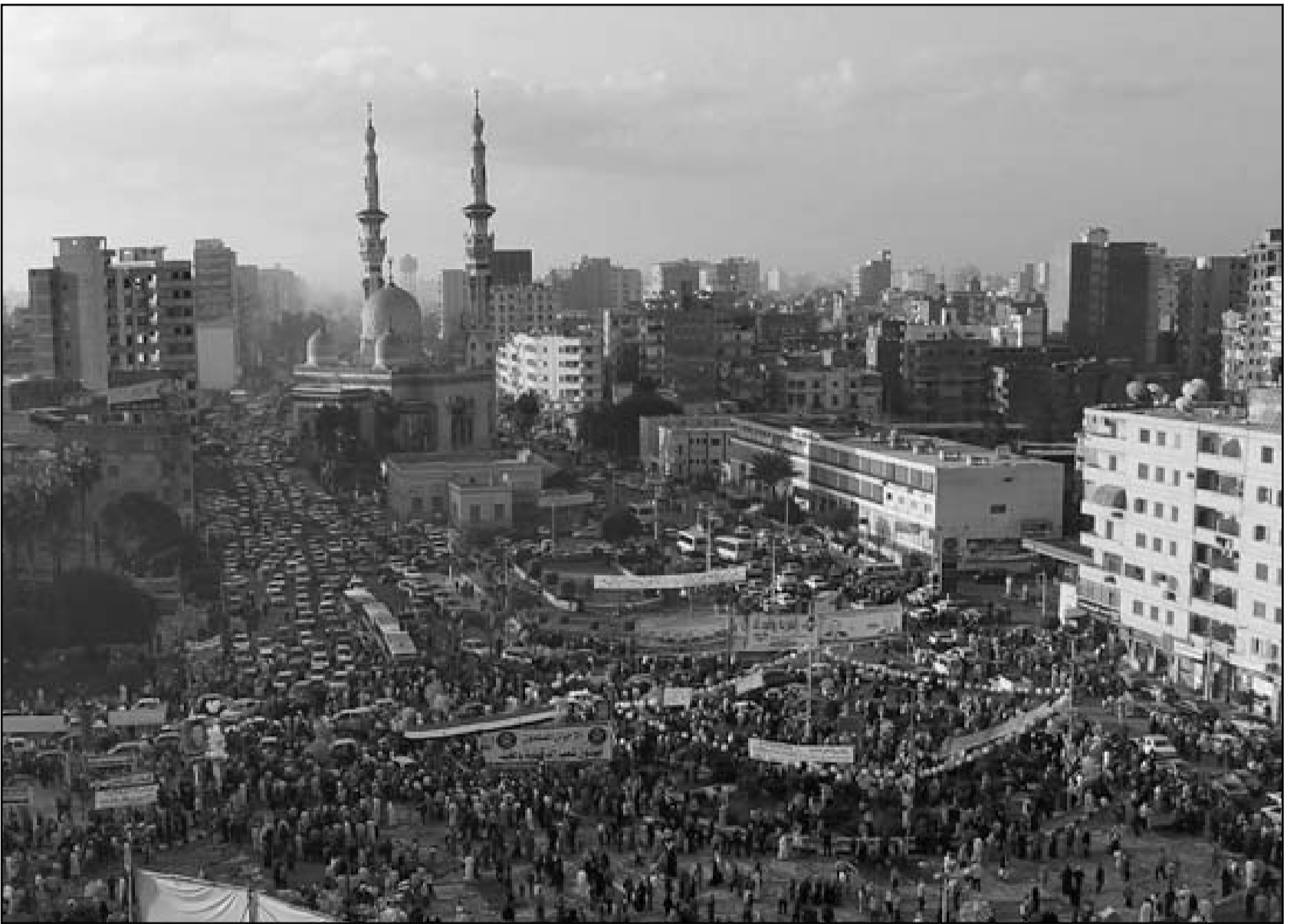
جموع من الإخوان المسلمين في القاهرة