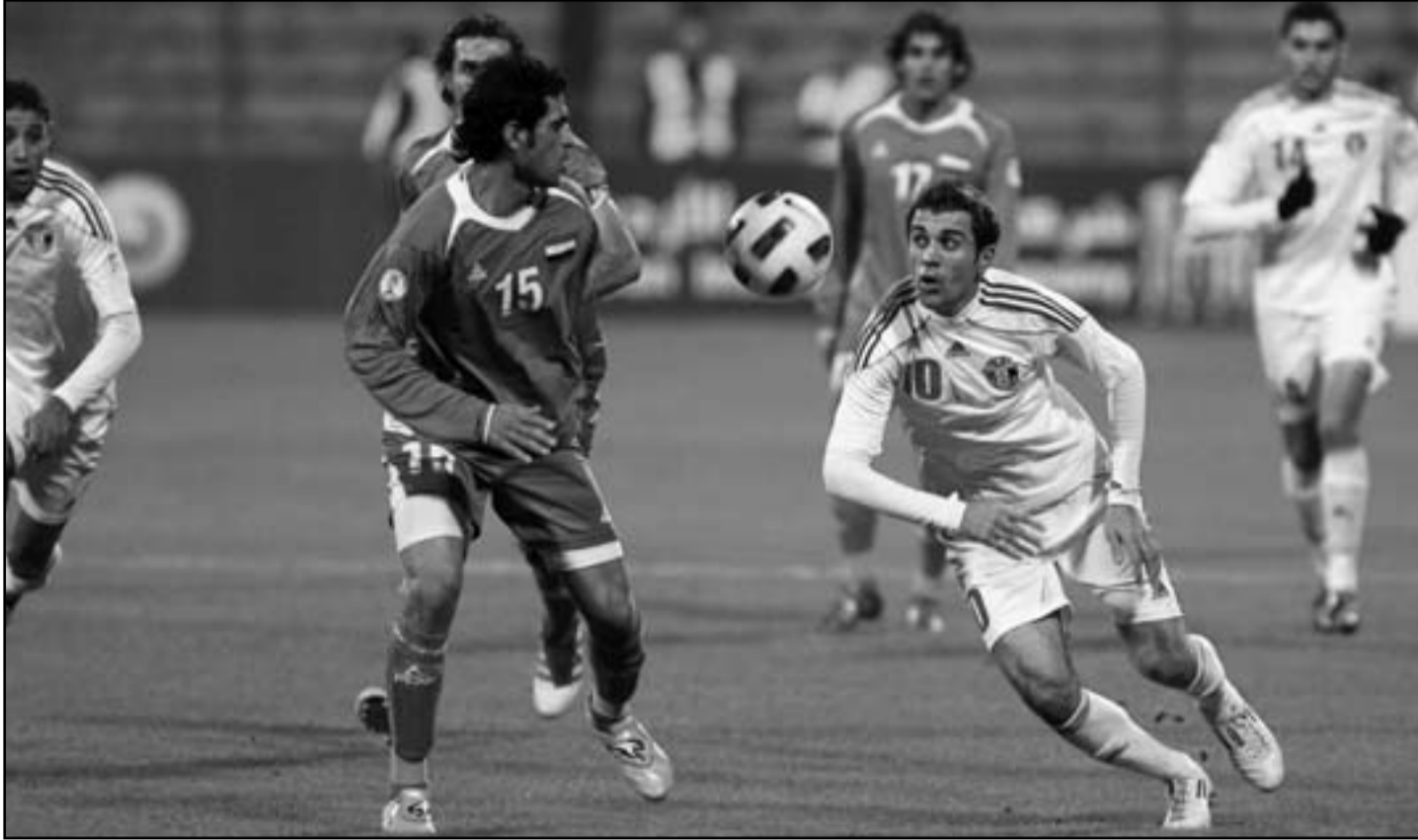
لقطة من مباراة الاردن والعراق في سياق التاهل في تصفيات كأس العالم الآسيوية

إكتشاف حقيقة سياسية ديمغرافية طالما حاولوا تجاهلها نصف الجمهور الشجع في اللاعب عراقي تماما.