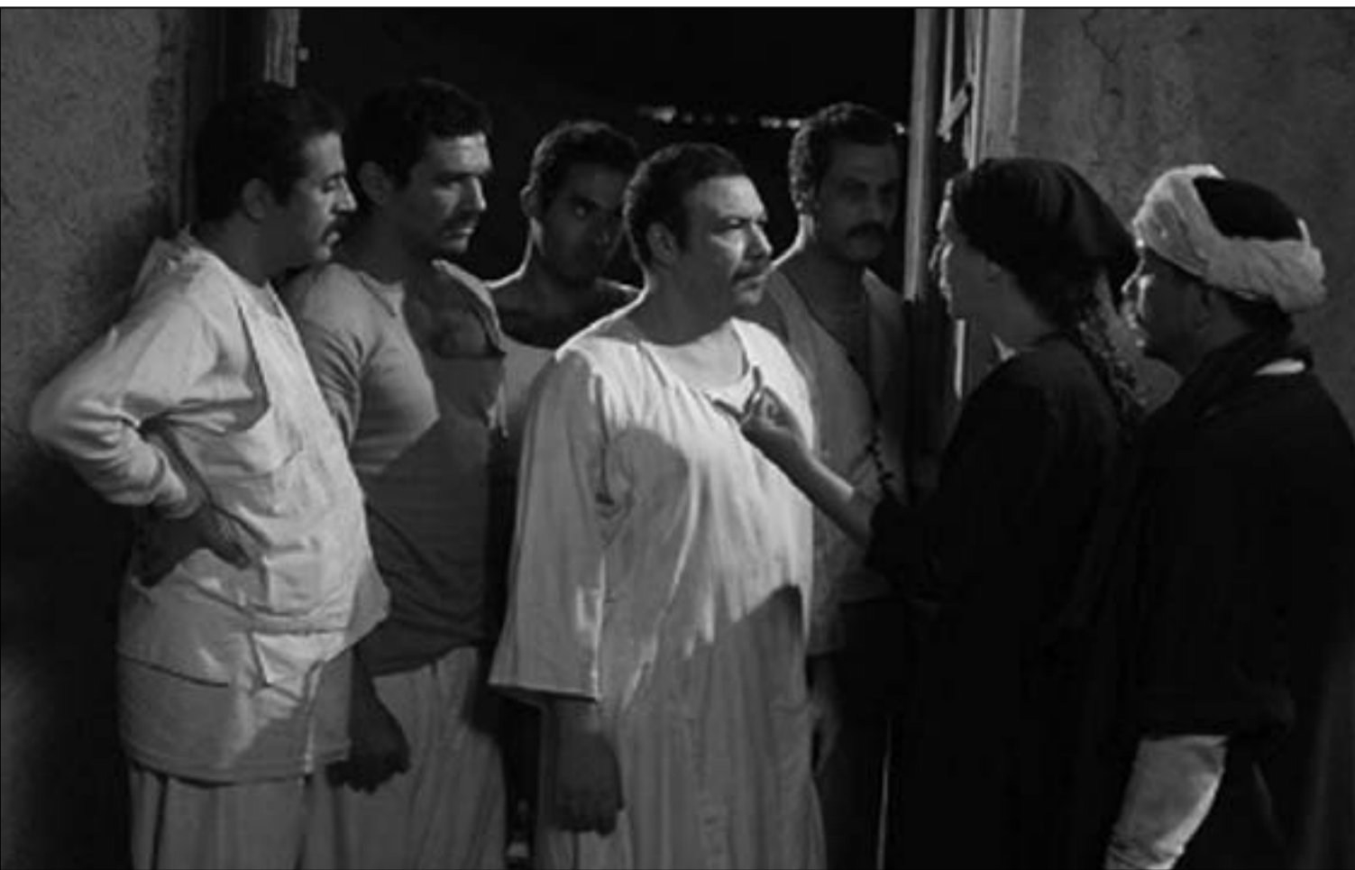
لقطة من فيلم «كف القمر»

شملهم تحت سقف واحد هي نفسها التي فرقت معهم في غياب الدليل والقوة وجعلتهم عرضة للاستبداد لا سيما أن الشقيق الأكبر يحرف عن المسار الصحيح ويات مشغول بما يؤمن بحياته ويضمن له الثروة، وقد استغرفته الحياة بتفصيلها فلم يستطع إحكام قبضته على إخوته كما كان فانفرط العقد وكان في انتظار كل منهم جريمة فضاخ وبكر وجوده ويس توعدت نشاطاتهم وغيابهم وفقدوا قنهم في «نكري» شقيقهم الأكبر واعلنوا عصيانهم عليه إلا أنه ظل حريصاً عليهم ولكن حرصاً زاهم عناداً فهم يرفضون الوصاية وينزعون إلى الحرية والاستقلال وهي الإشكالية التي كانت محور الأحداث، الفرق بين الحماية والوصاية وحدود تطبيق كل منهما دون إشعار الأطراف الأخرى بالقعق فتمه أوامر كثيرة تربط كل الشخصيات ببعضها، أولها صلة الرحم والتمائم الرجعية واحدة تمثلها الأم التي يوصيها بهم الحنين المتأرجح بجعد السافات ويوصلهم بها الدم الجاري في عروقهم الواصل من كفتها إلى كوفهم وأجسادهم، غير أن الأحقاد المترسبة في النفوس أكبر من محاولات الإقواء ومهارات