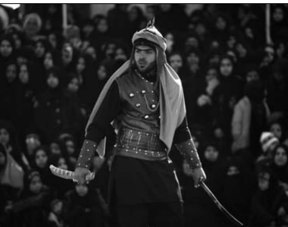
من مراسم احياء ذكرى عاشوراء

وبعد صلاة الظهر جرت اخر المراسم التي تعرف