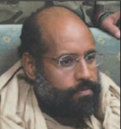
سيف الاسلام القذافي

عواصم - وكالات: أعلن مسؤول لبيبي أن مسيرة كبرى ستنتقل اليوم الأربعاء تدعو لإنهاء كافة مظاهر التسلح في طرابلس بعد أعمال عنف وقعت في الأيام الأخيرة.