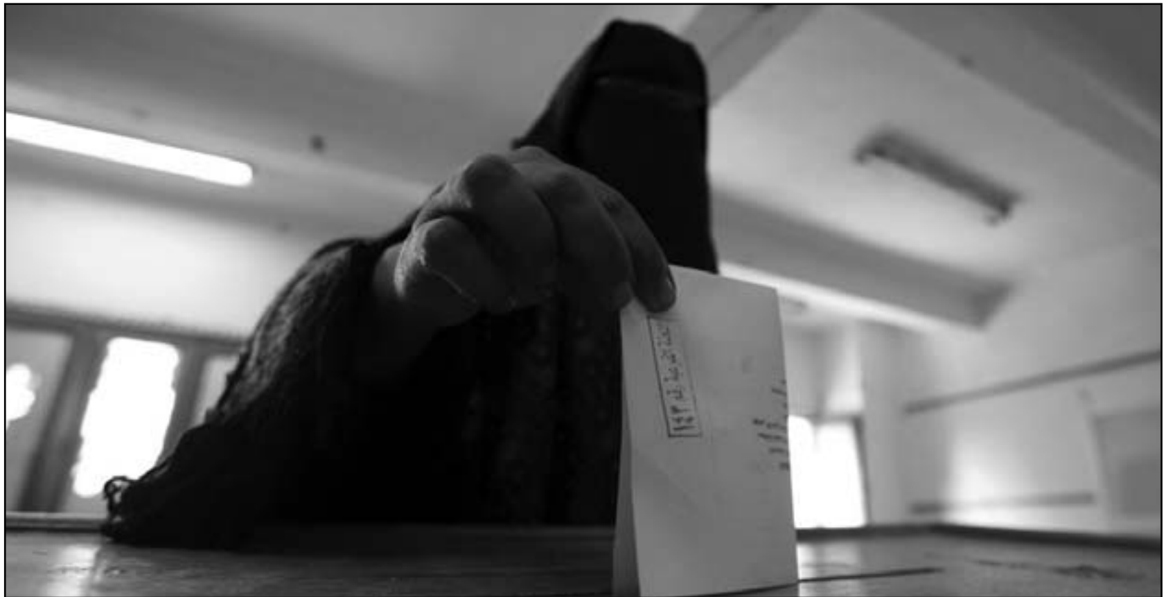
سيدة مصرية منقبة تدلي بصوتها في القاهرة

الأخطاء الإدارية والتنظيمية سريعا في العملية الانتخابية في اليوم الثاني من جولة الإعادة واختار خطوات عاجلة لتوفير المناخ اللائم لعملية الفرز».