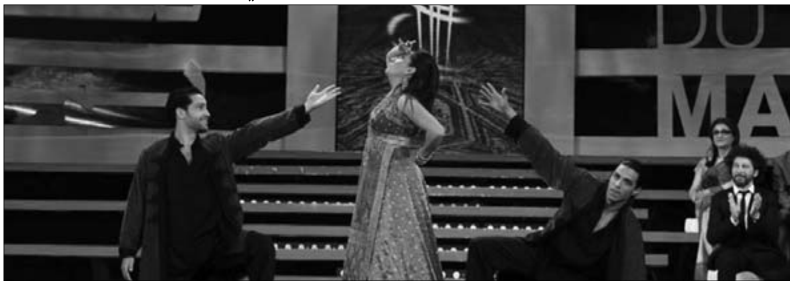
أحد عروض المهرجان