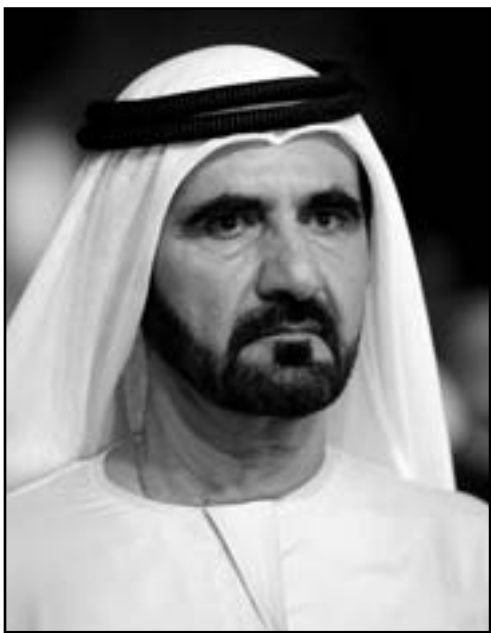
حاكم دبي الشيخ محمد بن راشد آل مكتوم

أوروبية أخرى بإجراءات دبلوماسية إزاء طهران، ونشيد المنطقة أجواء ترقب وحذر، مع تردد تقارير تفيد بأن إسرائيل تعزم توجيه ضربة جوية تستهدف مواقع نووية إيرانية، ربما قبل نهاية العام 2011 الجاري.