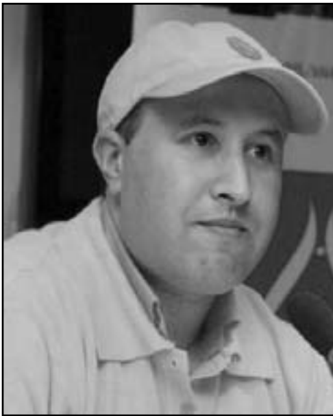
الصحافي المغربي رشيد نيني