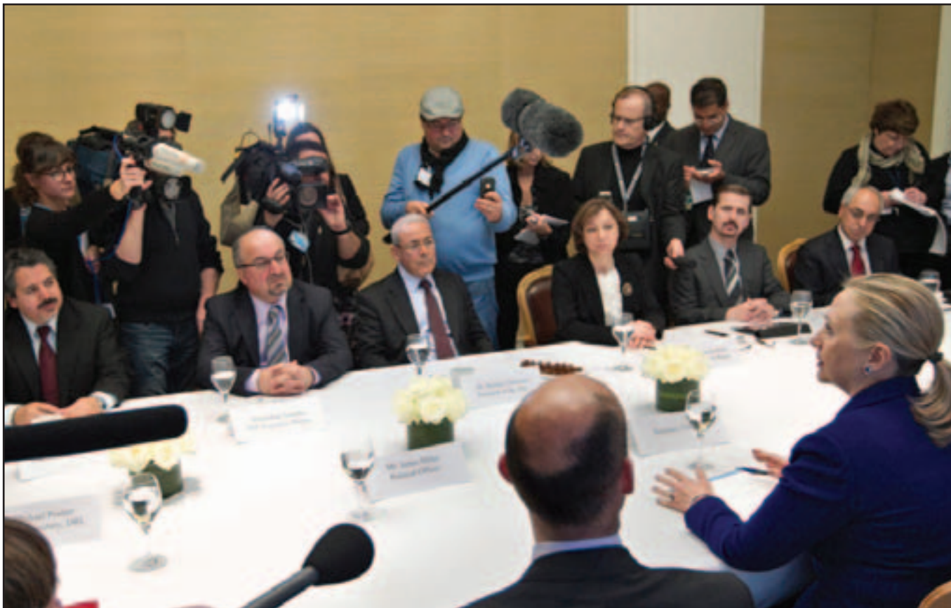
وزيرة الخارجية الامريكية هيلاري كلينتون لدى اجتماعها بوفد من رموز المعارضة السورية في سويسرا أمس

دمشق بسبب «تهديدات جدية»، وردت دمشق باستدعاء سفيرها في واشنطن. في الوقت نفسه عاد السفير الفرنسي في سورية اريك شوفالبييه الى دمشق الثلاثاء بعدما كان استدعي للتشاور في منتصف تشرين الثاني (نوفمبر) اثر اعمال عنف استهدفت المصالح الفرنسية في هذا البلد. الى ذلك لم تعط الجامعة العربية جوابها بعد على التهدييات التي اطلقتها السلطات السورية على البروتوكول الذي ينظم عمل المراقبين المفترض ارسالهم الى سورية، وأكد النظام السوري الاثنين استعداده لان يقبل بنسروط، قدم مراقبين من الجامعة العربية للتحقيق في العنف على الارض. (تفاصيل ص 4)