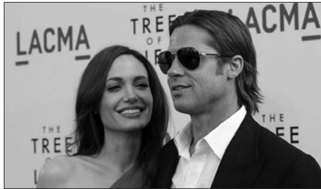
براد بيت، إنجلترا جولي