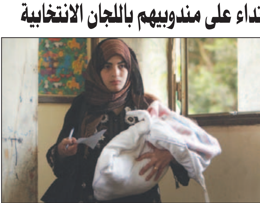
سيدة مصرية مع طفلها في لجنة انتخابية بالقاهرة أمس

و دعا الحرية والعدالة وسائل الإعلام وخاصة الملوكة لعدد من رجال الأعمال التي بعضها مناس له والنقص الأخر ما زال متصلا بالنظام السابق الى احترام عقلية (تفاصيل ص 3)