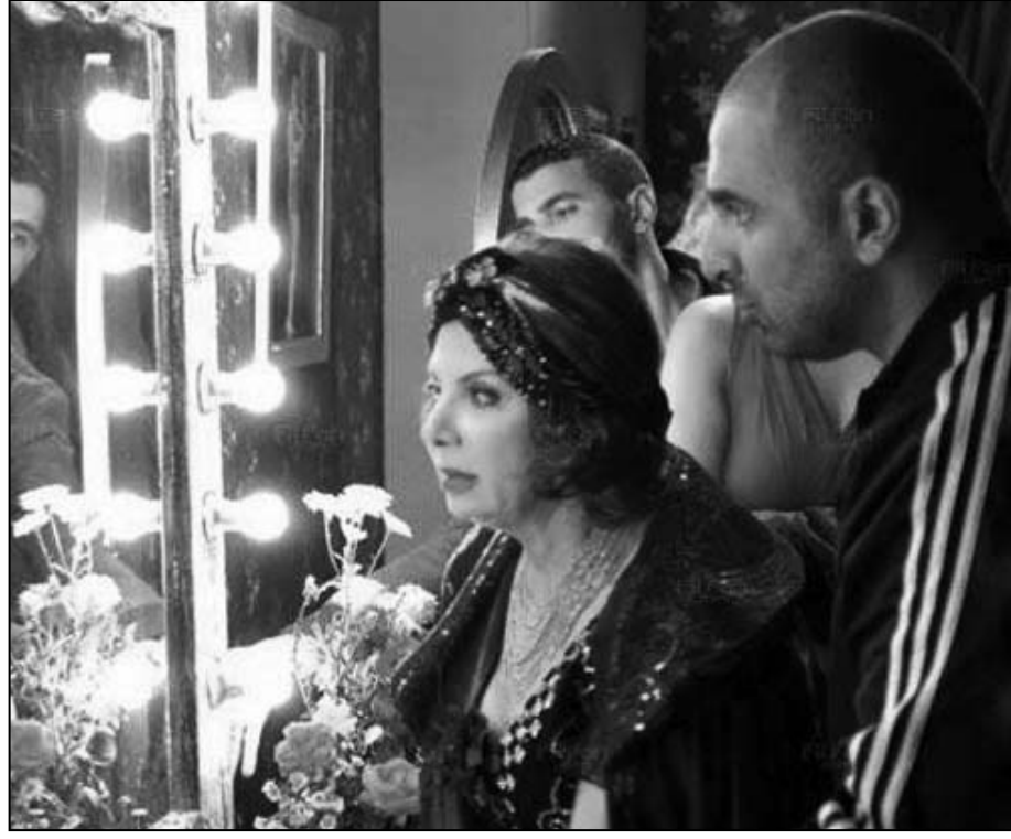
لقطة من مسلسل «كاريوكا»