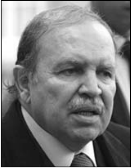
عبد العزيز بوتفليقة