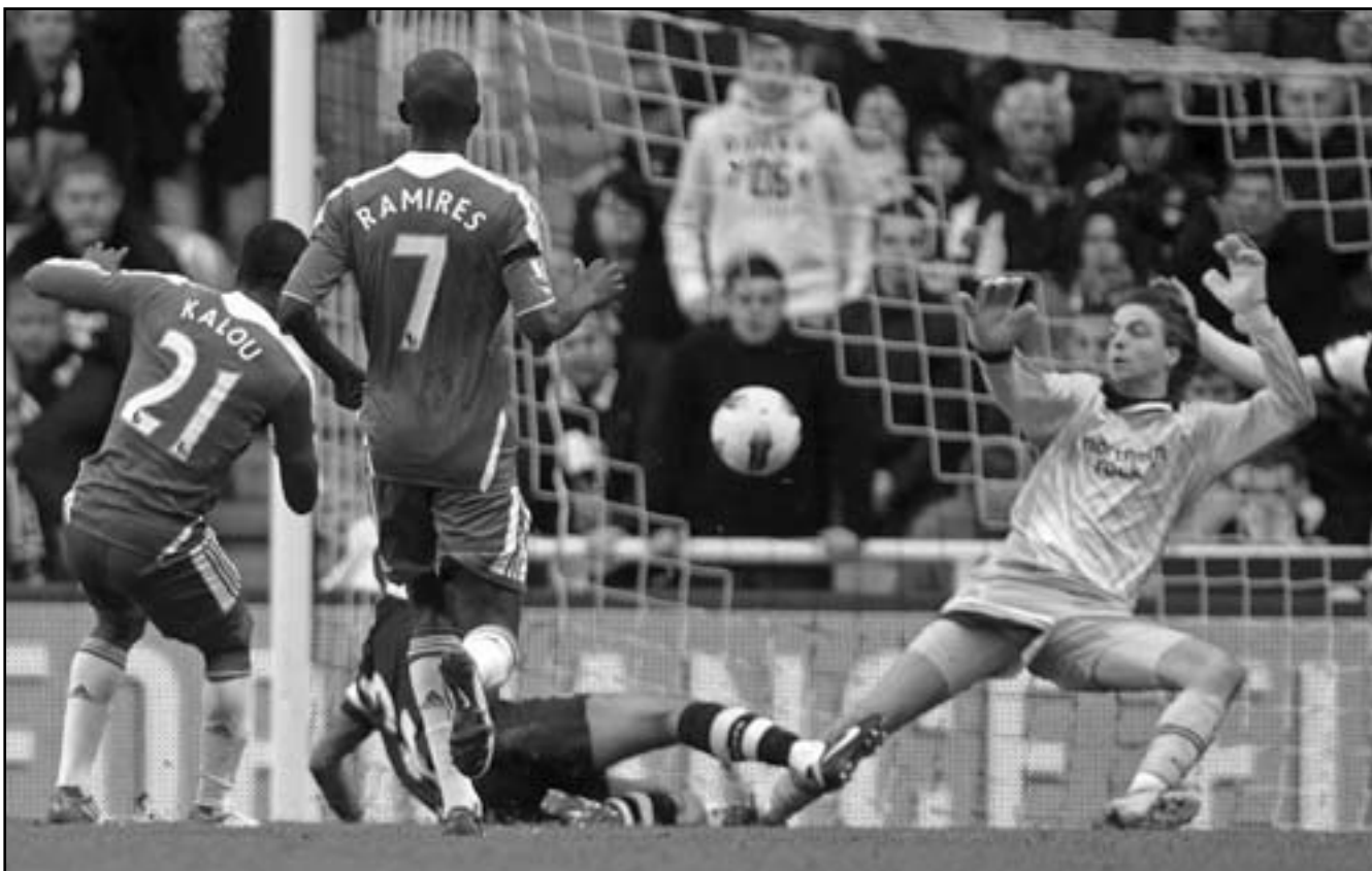
سالمون كالو نجم تشيلسي (يمين) يسدد الهدف الثاني في مرمى نيوكاسل