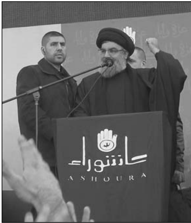
الشيخ حسن نصر الله لدى القاته كلمته

بوابة الصراع العرقي والمذهبي»، كما دعا الى «التنبه من هذا الامر جيدا»، مؤكدا في هذا السياق على «تجنب اي خطاب مذهبي لانه يخدم اسرائيل وأمريكا».