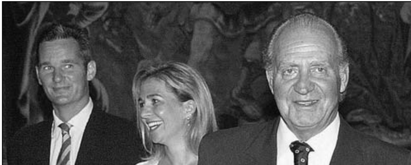
الملك خوان كارلوس وابنته كريستينا وصهره إنيانكي أوردانغرين

ويأتي قرار ملك اسبانيا خوان كارلوس في محاولة منه لتحسين صورة