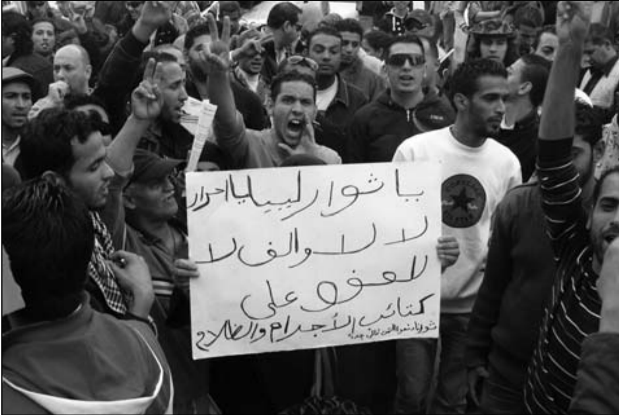
مظاهرون في بنغازي يرفعون بافظة ترفض العفو عن قوات القذافي

■ بنغازي (ليبيا) - ا ف ب: بدأ عشرات من الشباب الناشطين في منظمات المجتمع المدني الليبية في مدينة بنغازي شرق ليبيا بعد ظهر الاثنين اعتصاماً مفتوحاً بميدان الشجرة الذي يعتبر مركز انطلاق الثورة الليبية في منتصف شباط (فبراير) الماضي التي أطاحت بحكم معمر القذافي، وذلك في ما وصفوه بـ«ثورة لتصحيح المسار».