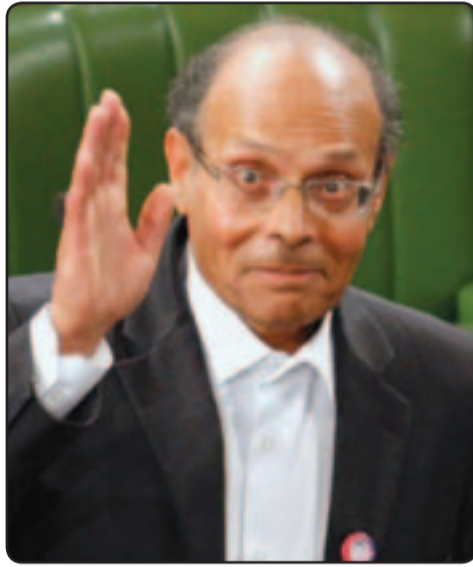
الرئيس المنتخب منصف المرزوقي

يصلح.. ويرأس المرزوقي المنحدر من الجنوب التونسي، حزب المؤتمر من أجل الجمهورية (يسار قومي) الذي أسسه في 2001. وحقق هذا الحزب بفضل سمعة زعيمه وحنكته بشكل خاص، نتيجة لم يتوقها المحللون، وفاز بـ 29 مقعداً في انتخابات المجلس الوطني التأسيسي ليحل ثانياً بعد حزب النهضة الإسلامي (89 مقعداً). ونقلت وكالة الأنباء التونسية الرسمية عن الجريبي قولها مساء أمس الإثنين في أعقاب انتخاب أعضاء المجلس الوطني التأسيسي منصف المرزوقي رئيساً لتونس خلال المرحلة الانتقالية، إن تصويت المعارضة بورقة بيضاء هو رسالة إلى جميع التونسيين مفادها أن هذه المرحلة ليست بمرحلة التأسيس لمنظومة ديمقراطية.. وكانت المعارضة قد أعلنت أنها قررت التصويت بالأوراق البيضاء في انتخابات رئيس البلاد، باعتبار أن منصب رئيس الجمهورية «أفرغ من محتواه».. وعلى هذا الأساس، انتخب أعضاء المجلس الوطني التأسيسي منصف المرزوقي رئيساً للجمهورية بـ 153 صوتاً مقابل 3 أصوات وصوتين محتفظين، بينما قدمت المعارضة أوراقاً بيضاء وصل إلى 44 صوتاً احتجاجاً على عدم احترام مبدأ التوازن بين السلطات. وقالت الجريبي إن هذه المرحلة التي تمر بها تونس، ليست بمرحلة التأسيس لمنظومة ديمقراطية لأنه «تم سلب رئيس