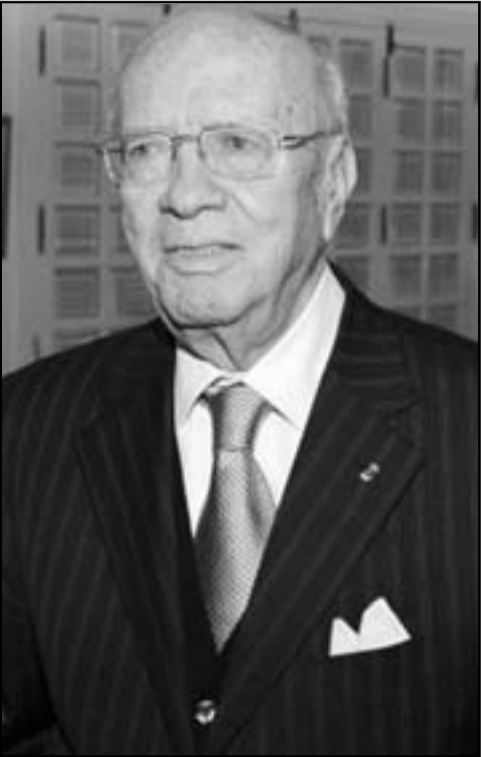
الباجي قائد السبسي

الحكومة المقبلة بلغت بانها ستلتزم به. وفازت حركة النهضة الإسلامية في الانتخابات وهي بصدد تشكيل حكومة ائتلاف مع حزبين علمانيين.