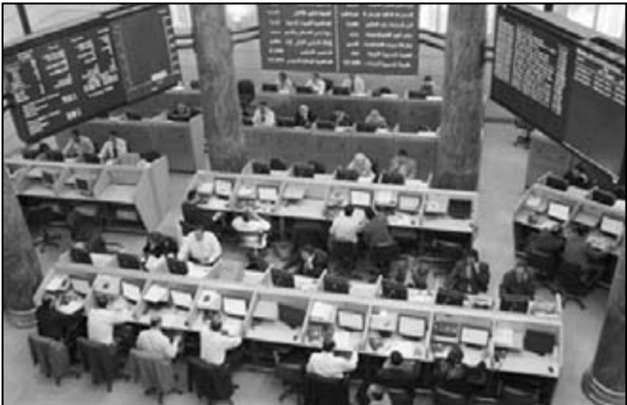
تعاملون في البورصة المصرية

ومن جهة قال المدير التنفيذي للشريك البرتغالي «نأمل في أن نصبح فاعلين أساسيين في سوق القرض الأيجاري بالجزائر».