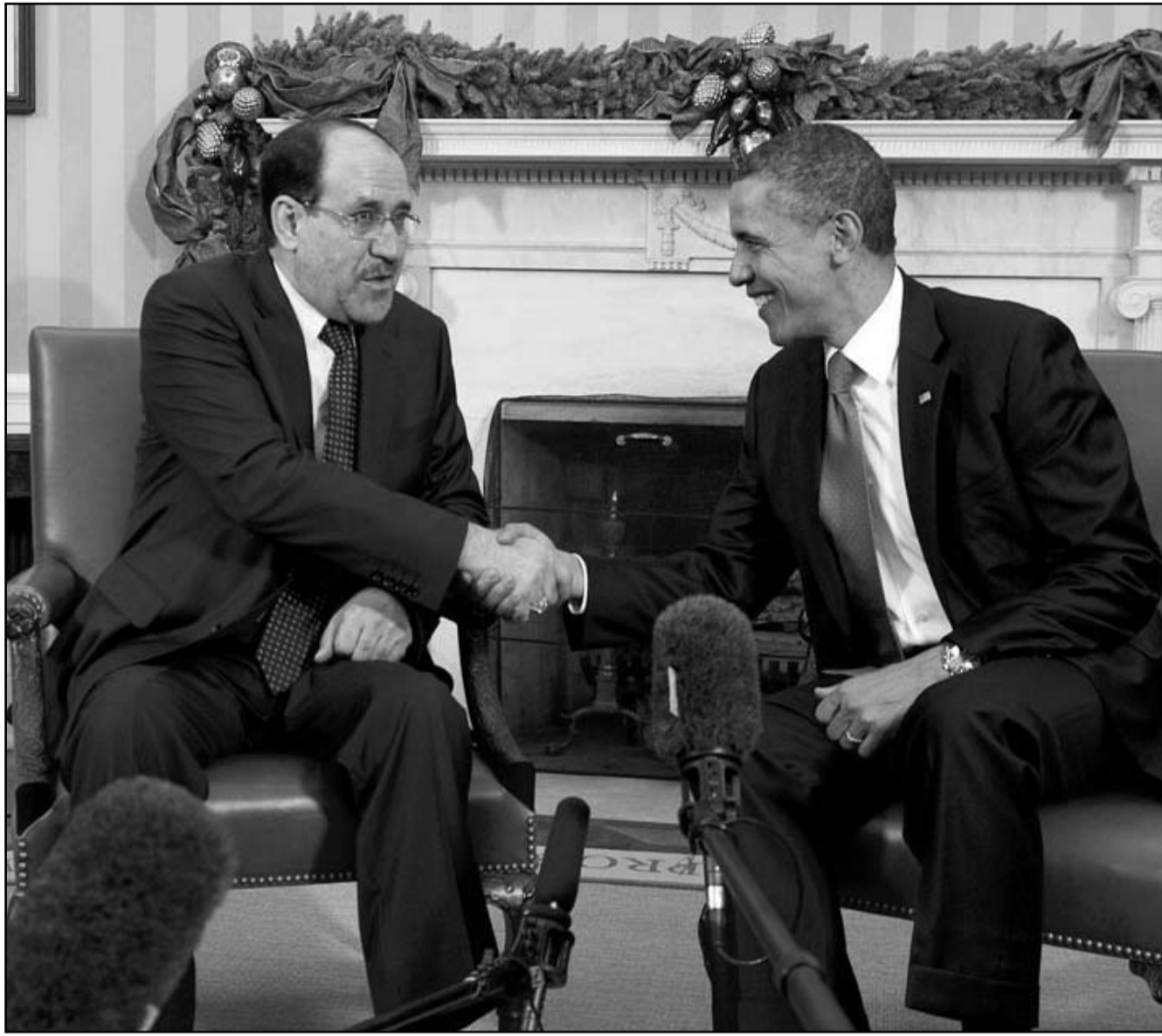
بارك أوباما أثناء استقبله نوري المالكي في واشنطن

ورفض غنيم «الاتهامات والادعاءات» التي توجهها بعض القوى المتنافسة للكتلة من أن أعضاءها وقياداتها هم «أشخاص غير ملتزمين دينيا ويدعون لإباحة الحريات بما يخالف الشريعة»، مشددا على أن «النتائج الهائلة التي حققتها تلك الكتلة تثبت وجودها وبأهل سنقف بالمرصاد ونفخس القوة ضد من يريد أن يحولها لأفغانستان». وأضاف: «نحن نرفض استغلال أي منبر ديني في الدعاية السياسية سواء مسجد أو كنيسة هذا ميدانا... ولكننا لا نستطيع أن ندخل كل جامع ونمنع الخطيب من أن يقوم بعمل دعاية لترشح أو حزب معين وكذلك الأمر بالنسبة للكنيسة». وتابع أن «الكتلة رغم حداثة عمرها الأزني حققت نتائج هائلة وحصدت ما يقرب من نسبة 15 % من نتائج المرحلة الأولى بالانتخابات ولا يمكن تصديق أن كل هذه النسبة جاءت من أصوات الأقباط فقط». وأردف «متناجحا أثبتت زيف الاتهامات التي كيدت لنا بأننا كتلة قبطية وكتلة الخبيثة.. نحن كتلة مصرية والمصريون يختلفون طوائفهم وشرائعهم صوتوا لنا... من صوتوا لنا يعرفون أننا نريد الحرفا على هوية مصر وحريتها.. مصر بلد مسلمة... أغلبية الشعب مسلم وسندافع ضد من يريد أن يجعلها أمريكا أو ليهولنا وبأهل سنقف بالمرصاد ونفخس القوة ضد من يريد أن يحولها لأفغانستان».