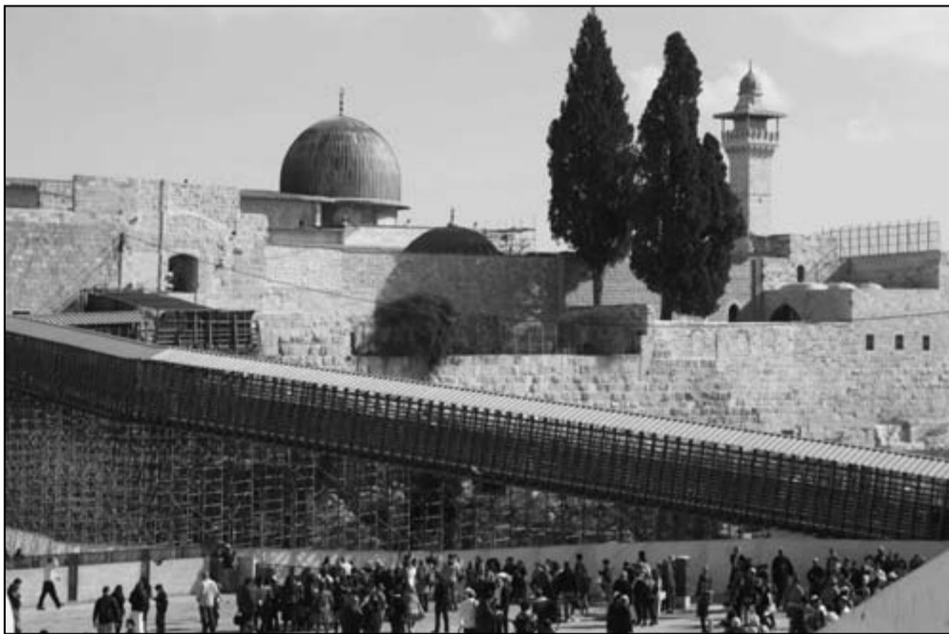
مظهر عام لجسر باب المغاربة المؤدي إلى المسجد الأقصى بعد إغلاقه أمس

تم تجميد اعمال دعم مراب المغاربة في حين تواصل فحريات التقيب الاثرية. وتعهدت اسرائيل التي وقعت معاهدة سلام مع الاردن في 1994، باشراف الملكة على المقدسات الاسلامية في المدينة. والمسجد الأقصى هو اول قبليتي المسلمين وثالث الحرمين بعد المسجد الحرام في مكة المكرمة والمسجد النبوي في المدينة المنورة.