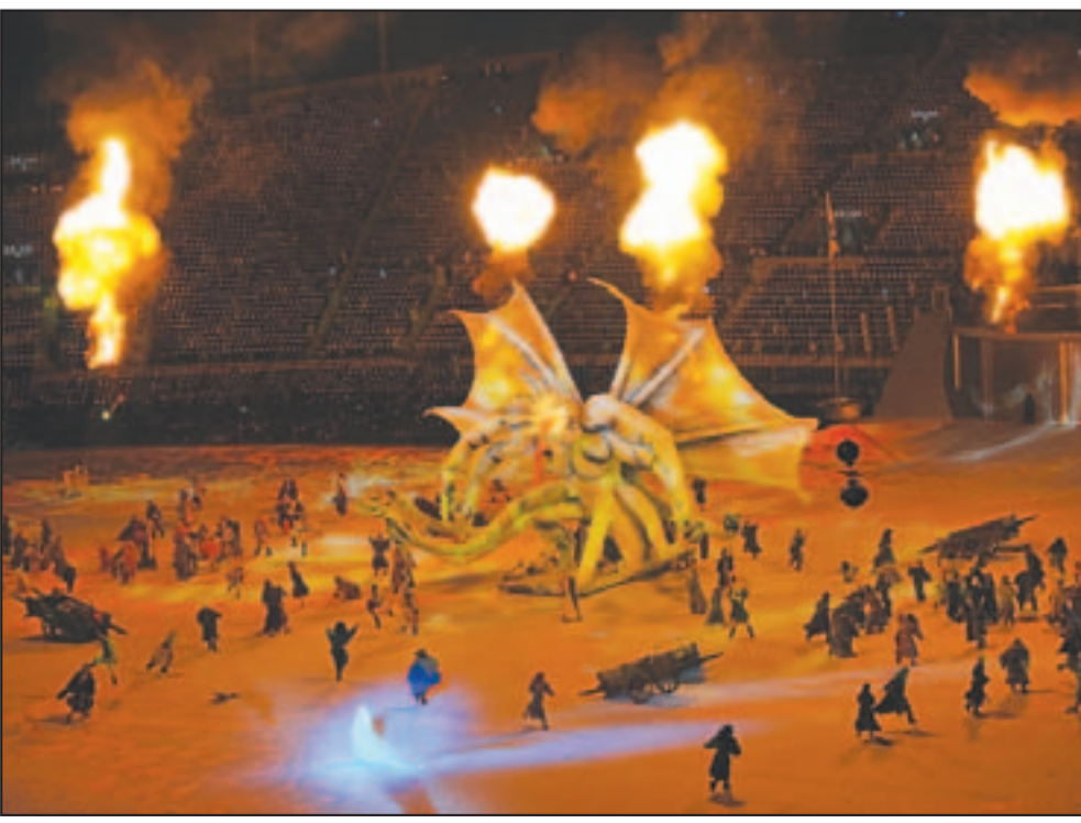
لقطة من الاحتفال بافتتاح دورة الألعاب العربية في الدوحة عاصمة قطر التي شهدت عروضاً مثيرة ويشارك فيها خمسة آلاف من نجوم الرياضة العرب وتستمر حتى 24 من الشهر الحالي.

● المنظمة الإسلامية للتربية والعلوم والثقافة -إيسيسكو- تعقد اجتماعاً في باكو عاصمة أذربيجان بعنوان: تطوير المناهج الدراسية للارتقاء بتعليم الفتيات: الواقع والتحديات والأفاق» خلال الفترة من 12 إلى 15 الدوة برعاية السلطان قابوس بن سعيد.