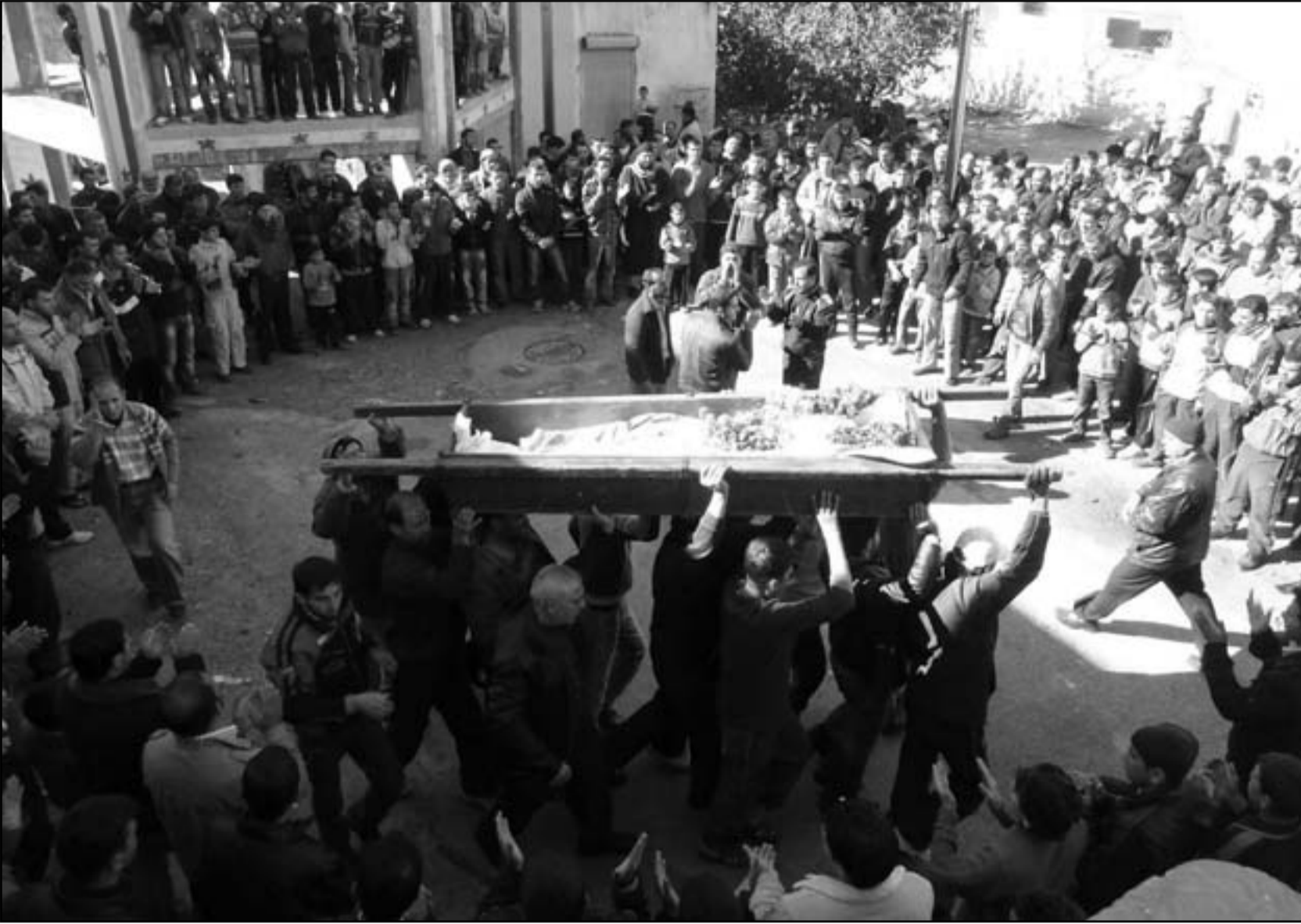
سوريون يشيعون قتالهم في حمص

الأسد، فلفت باراك إلى أن الوضع في سورية على خلاف الوضع المصري، إذ هناك إمكانات ضئيلة في أن يسيطر الإخوان المسلمون على السلطة، أما رئيس الموساد السابق مائير دغان، فقد قال في محاضرة بكنية ثنائيا إن الأسد نجح خلال الفترة القصيرة الماضية، من خلال بعض الإجراءات والعمليات العسكرية في تحسين الأوضاع الأمنية، ومحاولة إحكام السيطرة على زمام الأمور في دولته، على حد تعبيره، لافتاً إلى أن سقوط الأسد يصب في مصلحة الدولة العبرية.