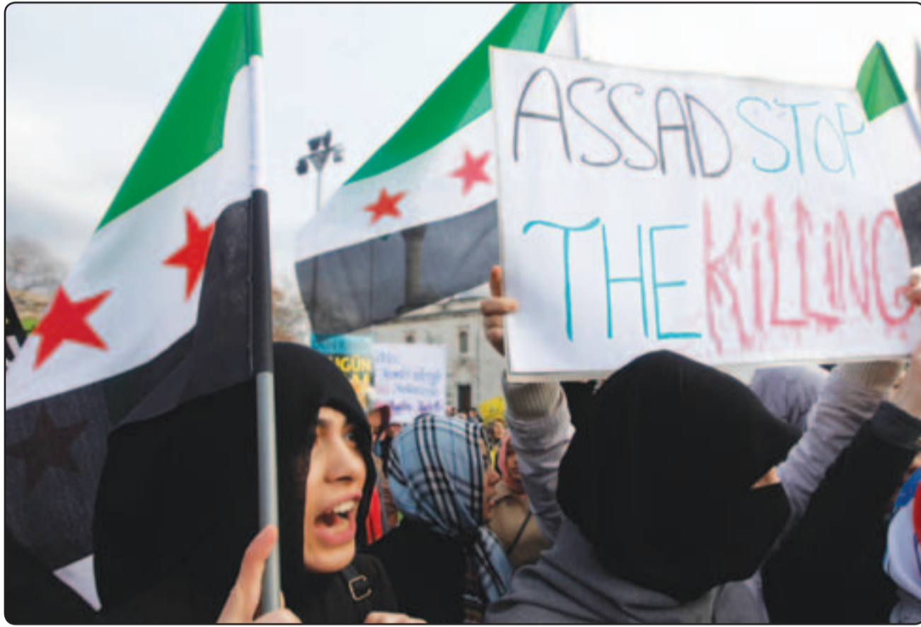
سوريون يتظاهرون في اسطنبول للمطالبة باسقاط نظام الرئيس بشار الاسد

الانتفاضة ضد الأسد قبل نحو تسعة اشهر مما أثار مخاوف من انزلاق سورية نحو الحرب الأهلية. وشهد الاثنين أيضاً ثاني أيام «اضراب الكرامة» الذي حظي بدعم واسع في معازل الاحتجاجات في أنحاء البلاد والذي قال نشطاء إن قوات الأمن حاولت كسره بالقوة والتهديدات، ووردت تقارير عن مقتل اربعة أشخاص امس على يد قوات الأمن في محافظة حمص حيث تقول الحكومة انها قتلت «معضبات إرهابية مسلحة»، يتم التحكم فيها من الخارج، وقالت الوكالة العربية السورية للأنباء (سانا) إن الجيش قتل متعمداً واصاب آخرين واعتقل زعيماً، وقتل شخص واحد واصيب سبعة في ادلب عندما فتحت قوات الأمن النار عليهم، وقال سكان إن دبابات فتحت نيرانها على احياء تسكنها أغلبية سنية في حمص حيث تماسك الاضراب وقاطع الناس الانتخابات إلى حد كبير، وقتلت شقيقة صبياً عمره 14 عاماً.