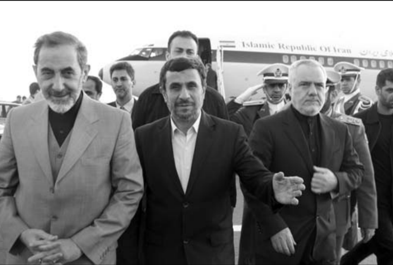
الرئيس الإيراني أحمدی نجاد، إبان عودته إلى طهران بعد الزيارة الرسمية التي قام بها لفنزويلا ونيكاراغوا وكوبا وأوكراور

يمكن أن يقل بذلك»، وعسكريا، الأمر الذي يضر بمصالح كافة الأطراف المعنية». وأكد الزياني أن «الاجتمع الدولي ملتزم بصمتا حرية الملاحة البحرية في المياه الدولية والحفاظ على الأمن والسلم في هذه المنطقة الحيوية التي توفر الطاقة للعالم أجمع». ومن العلوم إن دول الخليج تصدر ما يقرب من 90 بالمئة من نفطها بواسطة الناقلات التي تعبر مضيق هرمز ليس هذا وحسب بل إن أغلب دول الخليج تمر وارداتها عبره خصوصا تلك القادمة من دول الشرق مثل الصين واليابان وكوريا وغيرها. وقال وزير البترول السعودي علي النعيمي للجزيرة «سي، إن، إن» الاثنين إن من المستبعد في حالة إغلاق مضيق هرمز أن يستمر ذلك لفترة طويلة لكن تصاعد التوترات بين إيران والغرب يعيد على القلق ويعد عاملا سلبيا بالنسبة لأسواق النفط. وهددت طهران بإغلاق المضيق الحيوي لمخيم صادرات النفط السعودية في ظل توترات متنامية مع الولايات المتحدة وحلفائها الغربيين على مدى الشهر المنصرم. وقال وزير البترول أكبر بلد مصدر للنفط في العالم حسب نص مقابلة لبرنامج «جولبال استنشنج» الذي بثته امس الاثنين «سي، إن، إن»، شخصيا لا اعتقد أن المضيق في حالة إغلاقه سيغلق لفترة طويلة، العالم لا