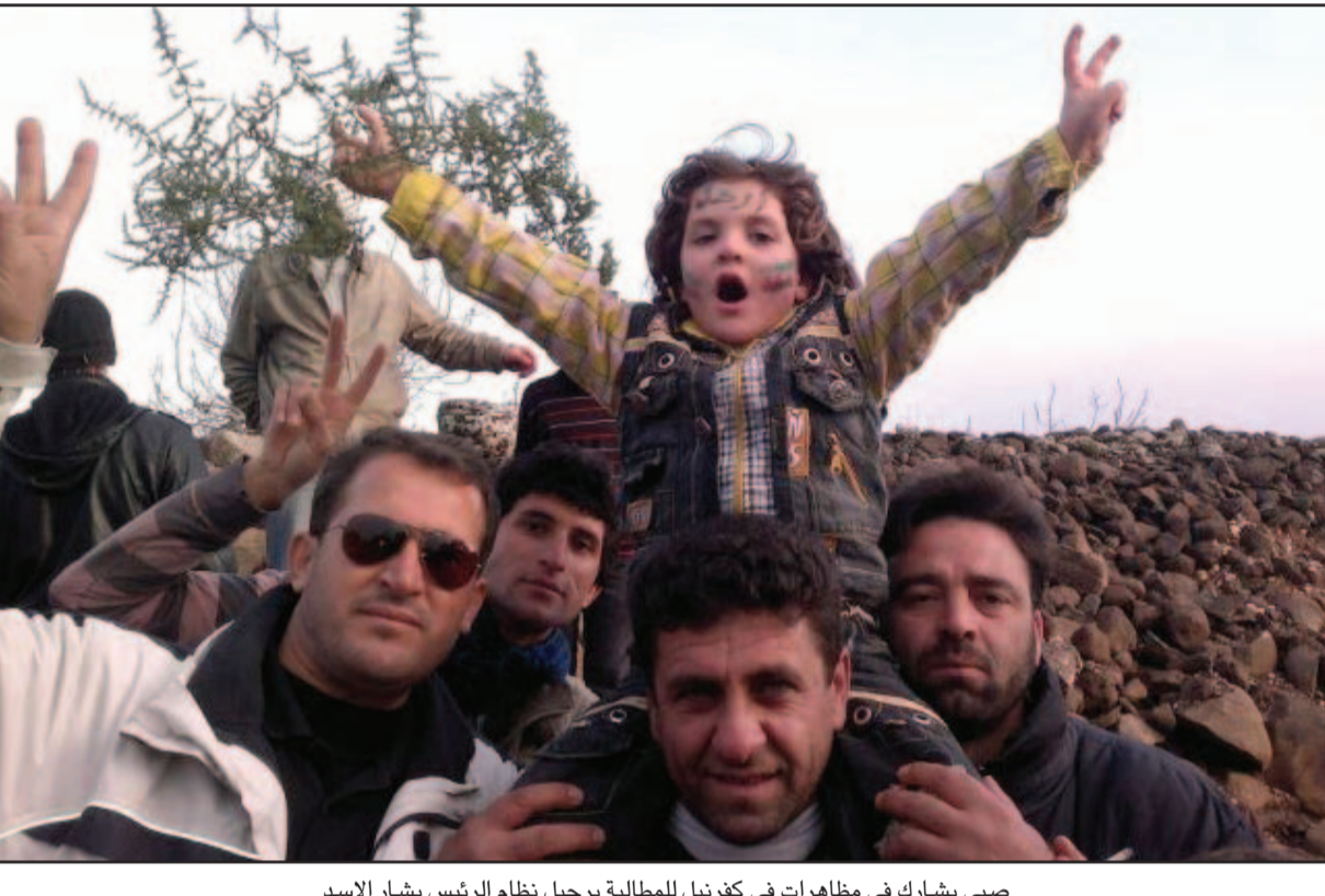
صبي يشارك في مظاهرات في كنفربل للمطالبة برحيل نظام الرئيس بشار الاسد