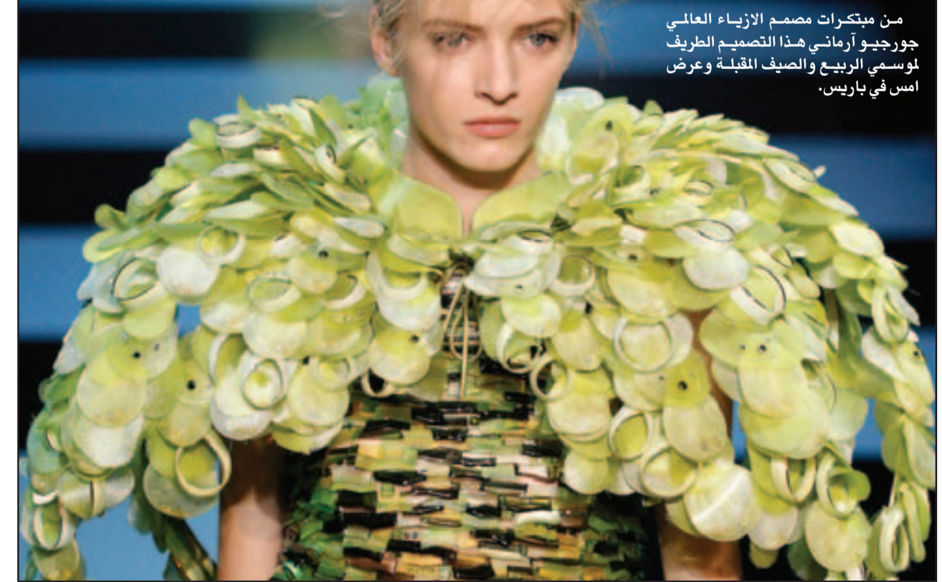
من مبتكرات مصمم الأزياء العالمي جورجيو أرماني هذا التصميم الطريف لموسمي الربيع والصف المقبل وعرض امس في باريس.