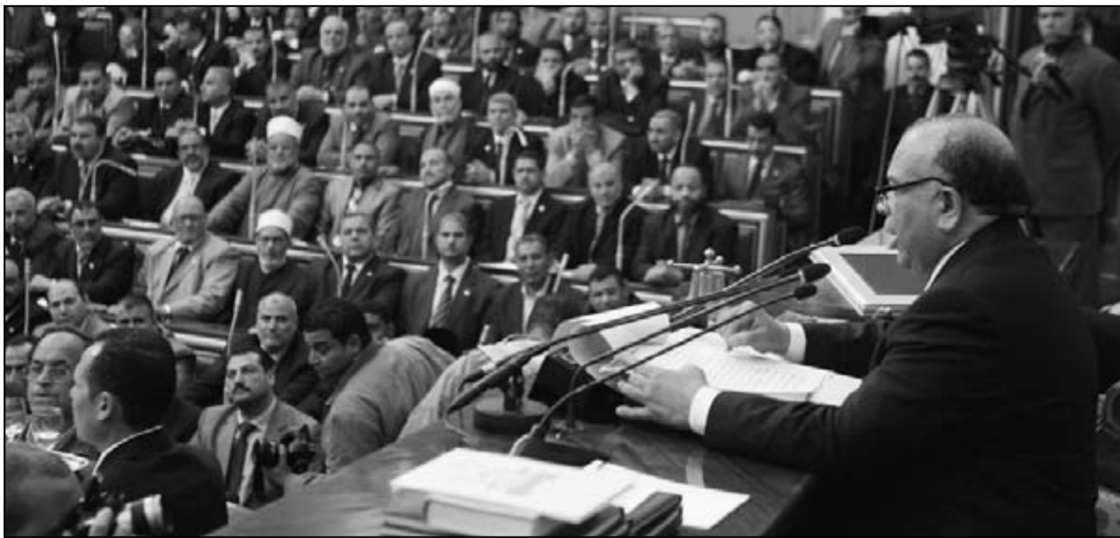
البرلمان المصري في أولى جلساته في القاهرة امس