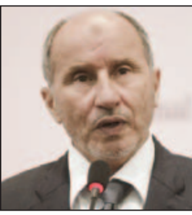
مصطفى عبد الجليل