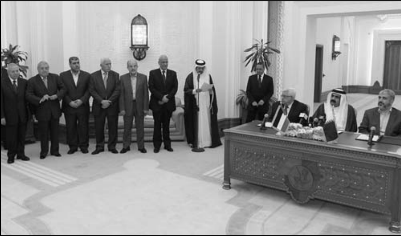
امير قطر الشيخ حمد بن خليفة آل ثاني يتوسط الرئيس الفلسطيني محمود عباس ورئيس المكتب السياسي لحركة حماس خالد مشعل لدى توقيع اعلان الدوحة