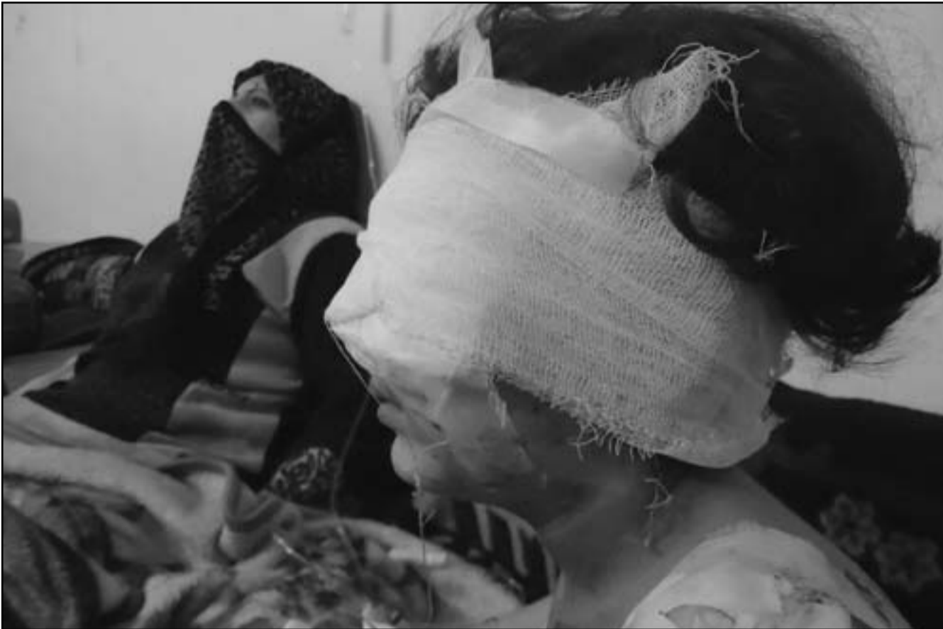
طفلة ووالدها أصيبتا في القصف الليلي على حمص

من عواقب واثار انهيار النظام السوري الذي لن ينحصر تأثيره في داخل سورية بل سيهدد الى لبنان والاردن واسرائيل. وفي النهاية فان وضع سورية اليوم بات يشبه افغانستان التي اجتاحتها السوفييت في ثمانينات القرن الماضي اكثر من عراق ما بعد 2003.