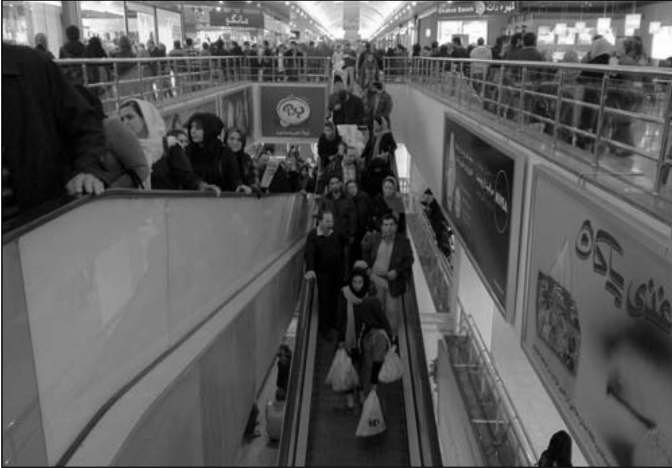
إيرانيون في أحد المراكز التجارية في طهران

ويحاول الجمهوريون استغلال تحفظ ادارة اوباما على شن هجوم على إيران، إذ يتهمه ميت رومني الذي يتصدر مرشحي الحزب الجمهوري بـ«المهانة» ويحاول بذلك انتقاد ملف السياسة الخارجية الامريكية.