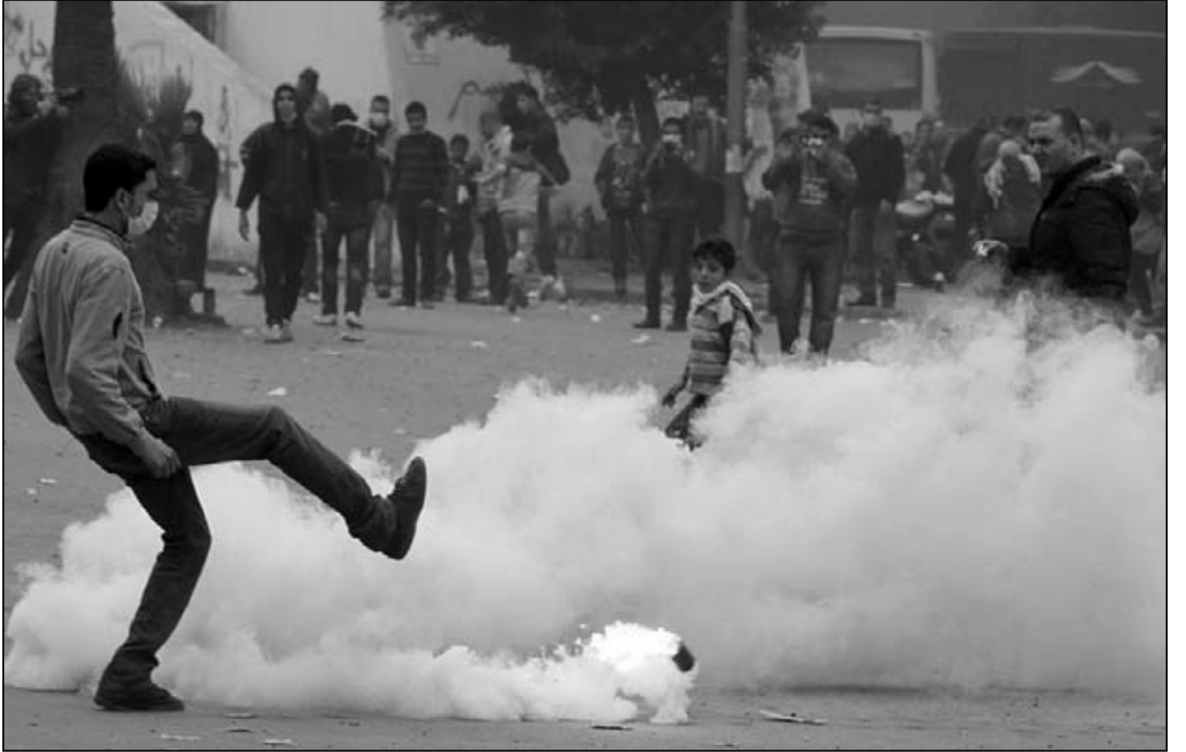
مصري يبعد قنبلة دخانية خلال مواجهة مع قوات الامن بالقاهرة امس

وجود معلومات لديها تشير إلى أن ما حدث كان مؤامرة مدبرة بشكل احترافي، وقد عرض اللواء محمود فتحي حكمدار محافظة بورسعيد اليوم «الأثنين» الخطة الأمنية التي وضعتها مديرية الأمن بالمحافظة لتأمين المباراة الدامية - التي جرت بين فريقى الأهلي المصري والبورسعيدى الأسبوع الماضي، على لجنة تقصي الحقائق التابعة لمجلس الشعب. وصرح بأنه تم عقد اجتماع موسع يوم 19 يناير الماضي حضره قيادات المديرية لوضع النقاط الرئيسية بشأن تأمين المباراة، والتي تضمنت الاتفاق على نزول جماهير الأهلي في محطة قطار (الكاب) وهي محطة القطار التي تسيق بورسعيد بمحطة واحدة، وذلك لمنع حدوث احتكاكات بين جماهير الفريقين في حال نزولهم بورسعيد. وأضاف انه تم توفير 22 توبيسا لنقل جماهير الأهلي إلى المدينة، ولكن تلك الأتوبيسات لم تكف، فتم الدفع بـ9 حافلات نقل خاصة بجنود الأمن المركزي واستخدمتها في نقل مشجعي الأهلي. وأضاف أنه تم إجراء اتصالات مع قيادات