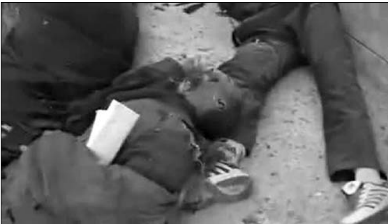
جثث القتلى ملقاة في شوارع حمص