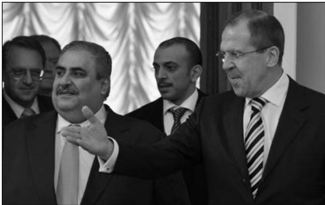
وزير الخارجية الروسي ونظيره البحريني في موسكو

ونشرت «غلوبال تايمز» في صفحتها الاولى صورة عميرة عن الموقف الصيني تصور الرئيس دمشق، بشار الاسد راعكا يصلي في مسجد في دمشق.