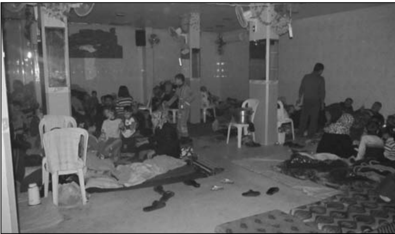
سكان بابا عمرو في احد الملاهي نتيجة القصف المتواصل

أعدّها مركز أبحاث الأمن القومي، التابع لجامعة تل أبيب ما أسماها بالإستراتيجية المتكاملة لإسرائيل لحوض الحرب الإلكترونية في العصر الحالي، مشيرة إلى أن تكنولوجيا المعلومات هي أمرهم بالنسبة لإسرائيل لا سيما في المجال الاقتصادي، مثلها في ذلك مثل بقية الدول الكبرى المتطورة التكنولوجية المختلفة تسعى بشكل مباشر وغير مباشر في عملية التطور التكنولوجي والاقتصادي الإلكتروني. وتمتثل أهداف هذه الإستراتيجية التي من المفروض أن تحققها إسرائيل، فيما يلي: إقامة مجال إلكتروني آمن في إسرائيل، يمكن الدولة من تحقيق أهدافها القومية في المجالات الإدارية والاقتصادية والاجتماعية والخارجية والعلمية، تقوية العوامل الأمنية في المجال الإلكتروني الإسرائيلي، والحفاظ على حرية العمل به لجميع طوائف المجتمع والطبقات السكانية، كسما من المفروض أن يتم تطبيق هذه الإستراتيجية وفق مبادئ العمل التالية: الاعتراف بالمجال الإلكتروني كسجال قومي جديد يجب الدفاع عنه بشكل خاص بالتعاون مع كل الجهات المعنية بذلك، تأسيس قيادة وجهاز مركزي لإدارة الحرب الإلكترونية، وضع البنية الأساسية الإلكترونية والمنظمة الأمنية على رأس أولويات الأمن القومي الإسرائيلي، بناء منظومة دفاعية إلكترونية ديناميكية وشاملة جمع القوى الحكومية والأمنية والدولية، بهدف تدعيم المنظومة الدفاعية الإلكترونية، إضافة إلى تعزيز التعاون بين القطاعين الخاص والعام للدفاع عن المجال الإلكتروني. عملت على التعاون مع الجهات الخارجية سواء الأمنية أو غيرها لتحقيق نفس