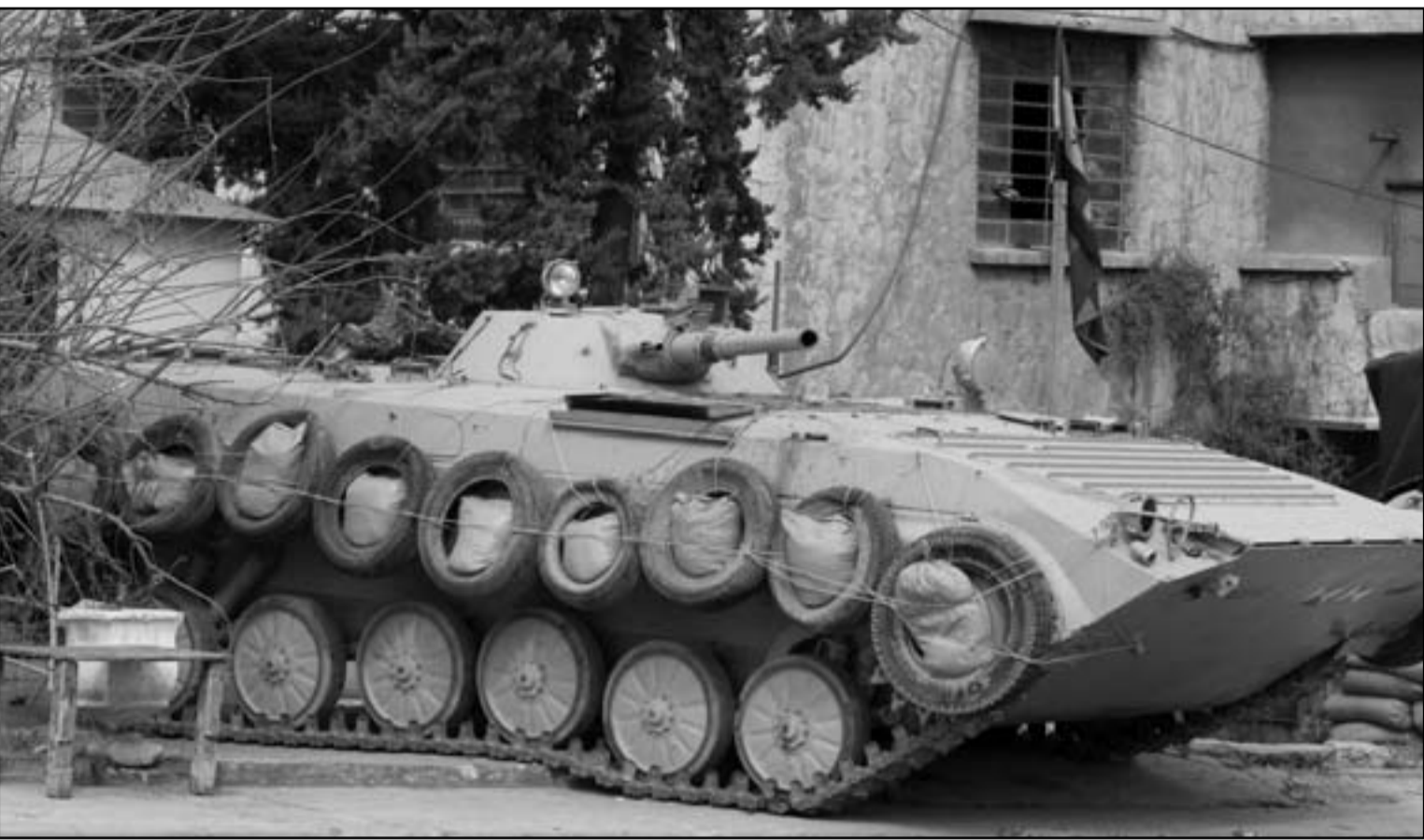
دبابة سورية تجوب شوارع حرسا قرب دمشق

نقل النفط الذي يمر في بساين حي بابا عمرو الذي يتعرض للقصف، وأضاف ان «قدائف سقطت أيضا بشكل متقطع على احياء الانشاءات وكرم الزيتون والبياضة، في حصص. وتوالت الحوادث التي استهدفت البنى التحتية في سورية حيث انفجر هذا الخط مرتين هذا الشهر كما تم استهداف خط لنقل النفط آخر بين مدينتي حمص وبانياس (غرب). ويبلغ إنتاج النفط في سورية بحسب ارقام الرسمية 380 ألف برميل في اليوم. ومنذ 15 آذار (مارس)، أوقع قمع حركة الاحتجاجات أكثر من ستة آلاف قتيل بحسب مجموعات معارضة وينسب النظام هذه الاضطرابات الى «مجموعات ارهابية مسلحة».