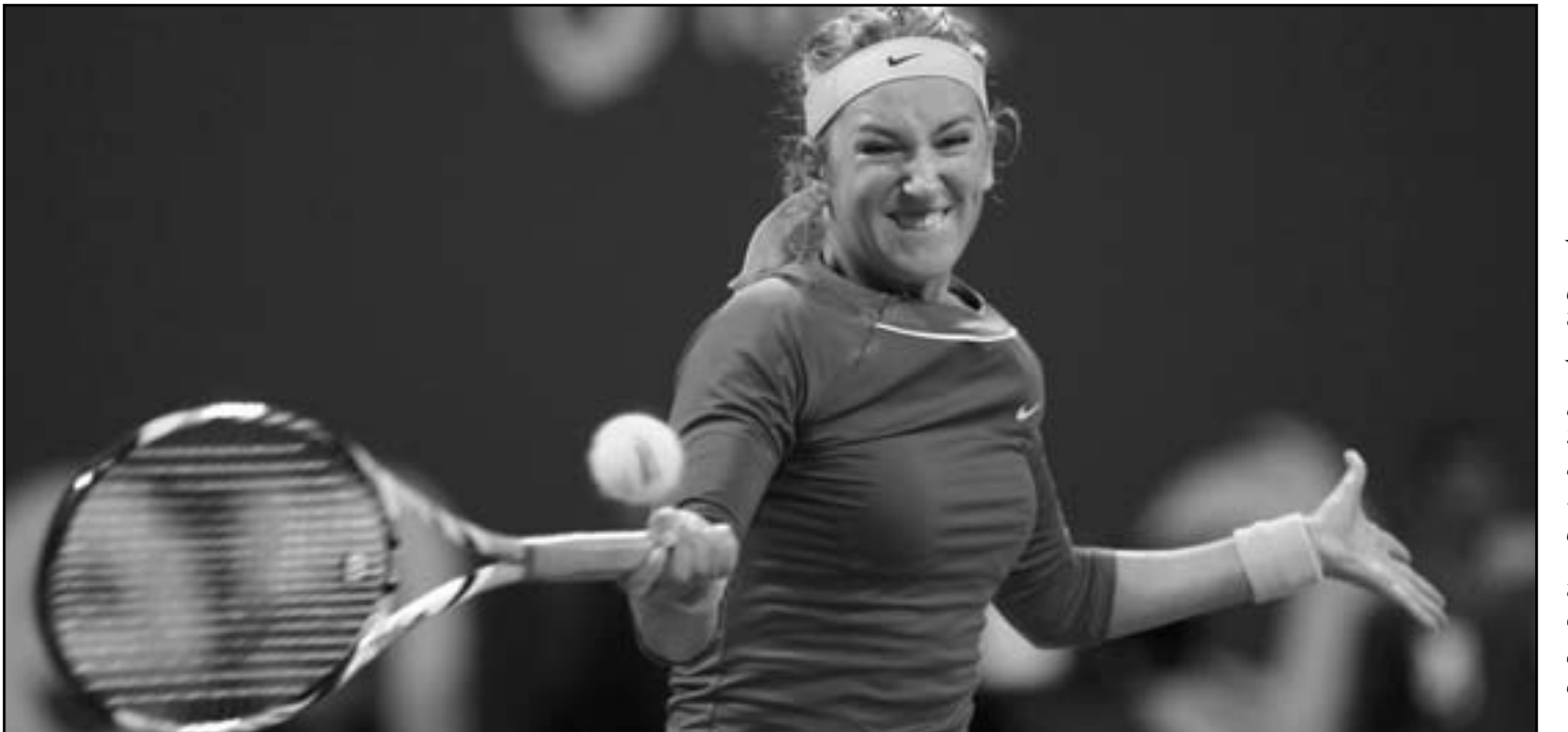
النهائية بين صفاة النجمات من أجل إحراز اللقب.

الإنجليزي فايو كاييللو الذي استقال من تدريب المنتخب الإنجليزي في وقت سابق من شباط/فبراير. وقال ريدياب «تركيزي منصب على محاولة الارتقاء بتوتنتهام في جدول الدوري قدر الإمكان. نريد حيزاً مفع في دوري أبطال أوروبا كما أن الفرصة أمامنا في كأس الاتحاد الإنجليزي». وأضاف «لم أتحدث مع أي شخص، لن أستبعد نفسي لكنني لن أشرح نفسي أيضاً». ويحتل توتنتهام المركز الثالث في الدوري الإنجليزي الممتاز بفارق سبع نقاط عن الصدارة وسيلتقي ستيفينج الأحد في دور الستة عشر بكأس الاتحاد الإنجليزي.