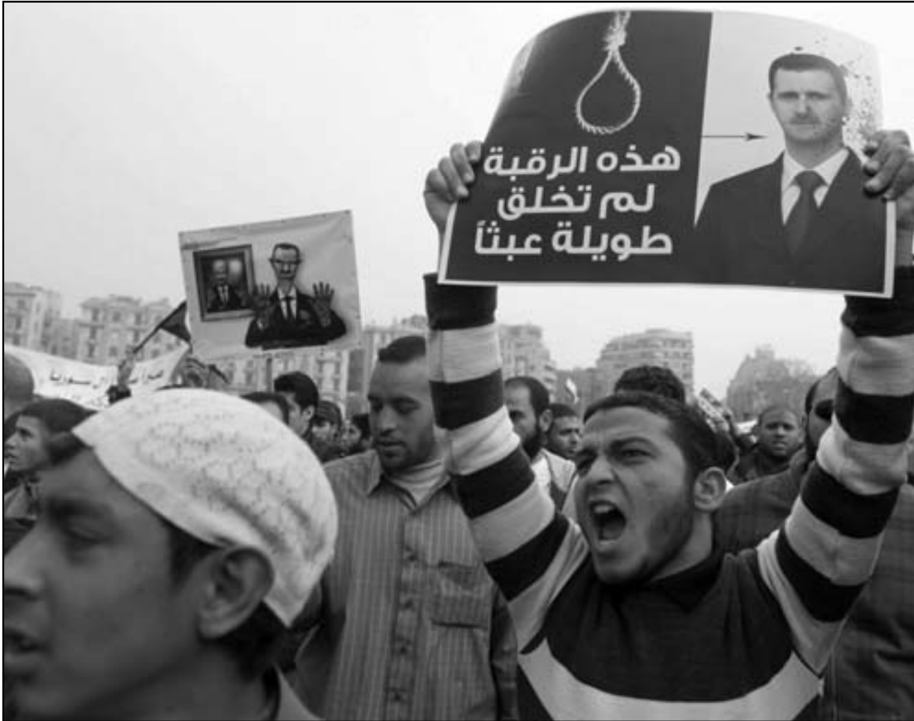
متظاهرون مصريون وسوريون في ميدان التحرير الجمعة