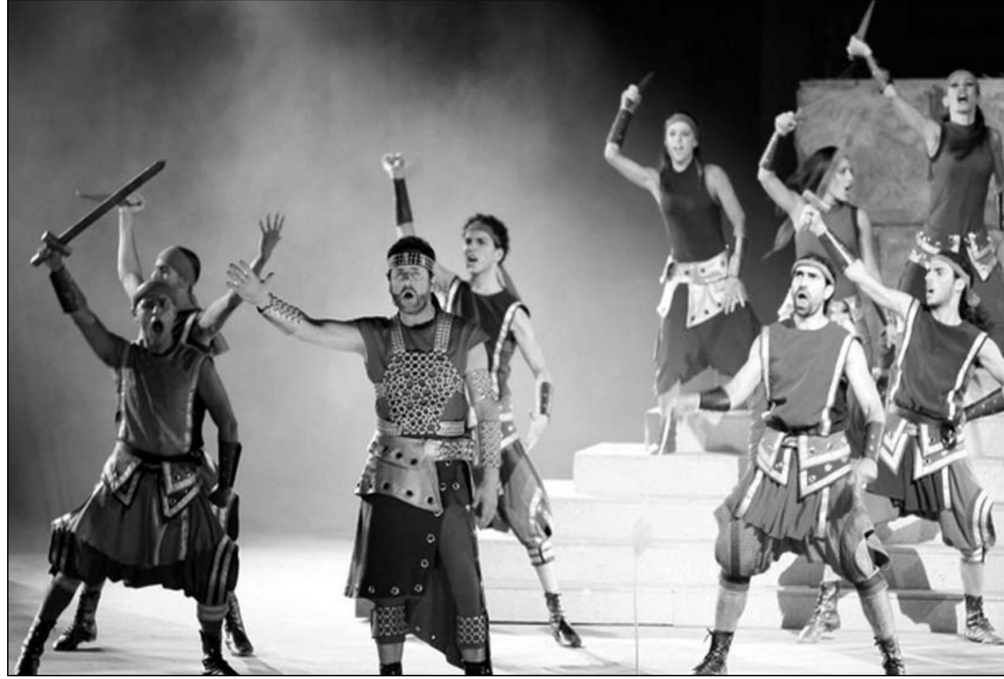
مشهد من «ع أرض الفجر»

والضمون لإيصال رسالة النص الأساسية وفي إخراج وتصميم جديدين. مع كوريوغرافيا متحركة ورقص