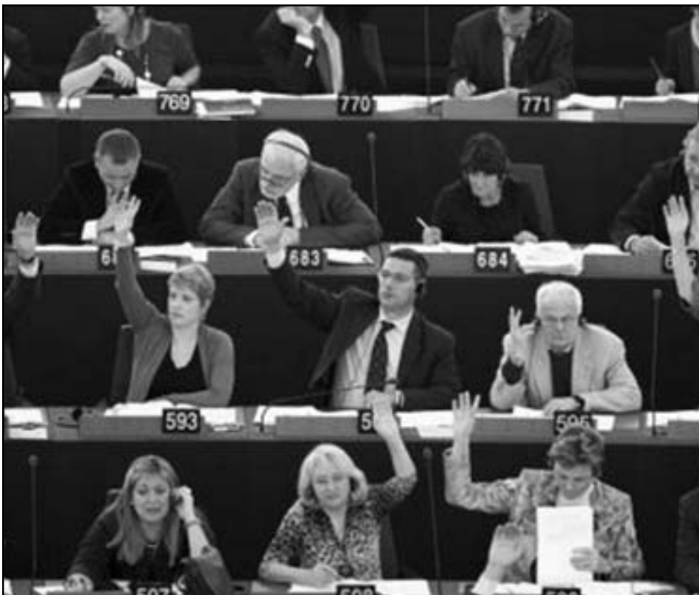
نواب في البرلمان الأوروبي خلال التصويت على اتفاقية الزراعة مع المغرب

التي يحتفلها المغرب بصفة غير شرعية، في نطاق الاتحاد الأوروبي».