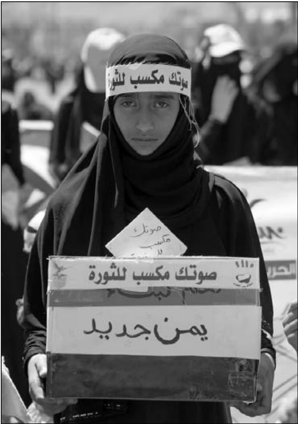
متظاهرة يمنية في صنعاء الجمعة

الجهود على صعيد الوطن العربي والعالم الإسلامي لكسر الحصار الإسرائيلي المفروض على القدس، وتصعيد التضامن الدولي مع المقدسين. وكان شيخ الأزهر أحمد الطيب قد أطلق، خلال أعمال المؤتمر، حملة دولية لنصرة القدس وأعلن مساندة منظمة التحرير الفلسطينية في شهر أبريل/نيسان المقبل لتأمين احتياجات المقدسين في مواجهة الحصار الإسرائيلي على المدينة المقدسة.