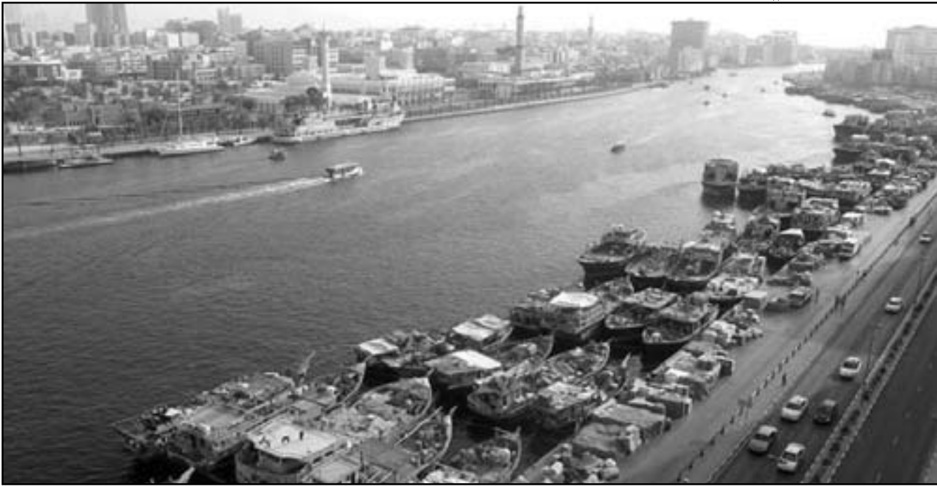
مكعب السفن الخشبية الصغيرة كالمظهر بالصورة دورا كبيرا في التجارة بين دبي وايران

مكاتب الصرافة ابوابه في منطقة ديرة إذ ما استمرت الأوضاع على حالها «لا يمكننا سوى تحويل 10 الاف دولار (الى ايران) وحتى لو فعلنا يتعين علينا أن نجيب على الكثير من الأسئلة، بالنسبة للشركات 10 الاف دولار لا تعني شيئا». ودفعه انكماش تجارته للتساؤل حول جدوى اقامته في دبي «أتيت صادرا منه ومن بينها النفط فوق 220 مليار دولار في 2010 لكنها لمطمة قوية للرعايا الإيرانيين في دبي ويتوقع مهدي أن يغلق العديد من