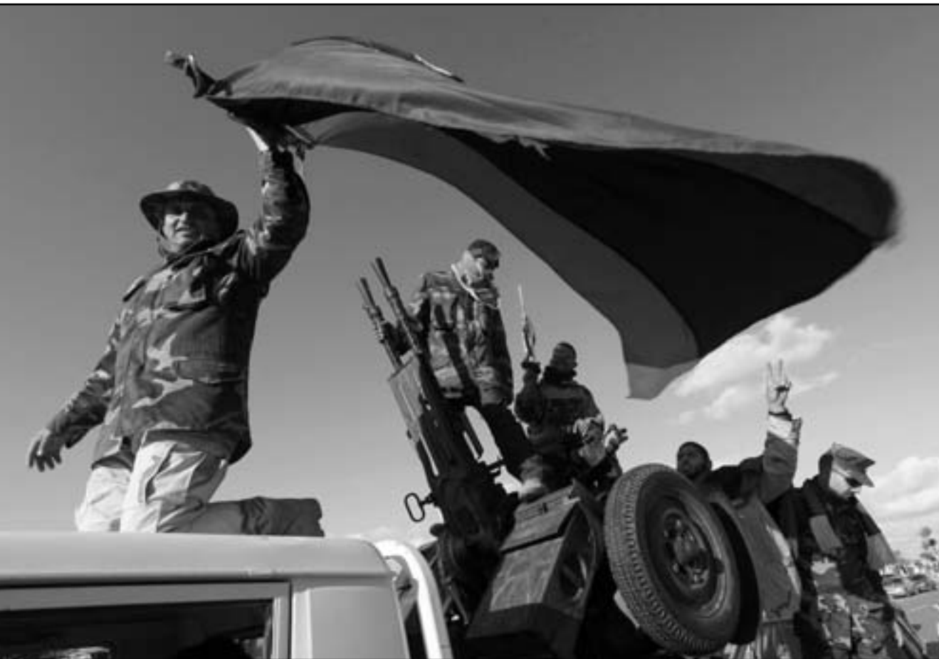
أفراد من قوات المجلس الوطني الانتقالي خلال عرض عسكري في طرابلس

واندلعت الانتفاضة الليبية في شرق البلاد حول مدينة بنغازي واستلهمت احتجاجات أطاحت برئيسي مصر وتونس المجاورتين وامتدت لآحاء متفرقة من البلاد إلى أن سقطت العاصمة طرابلس في أيدي معارضي القذافي فجأة في اب (أغسطس).