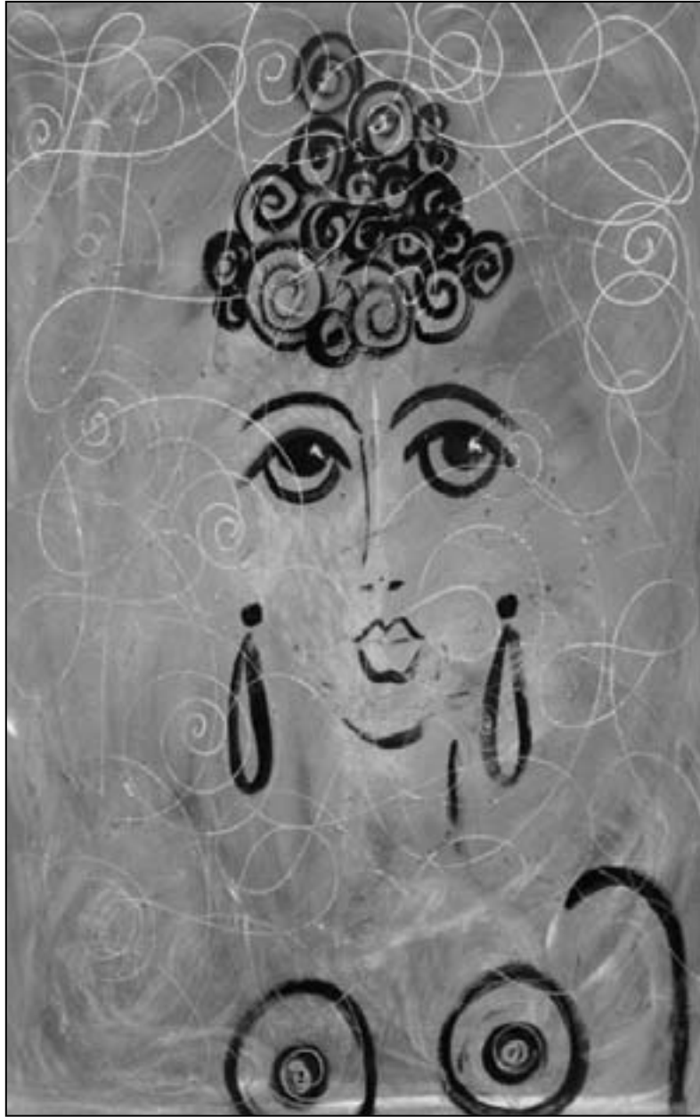
لوحة مريم مراد

فيلم البيندي عمل يسع تقييمه ما قال خورخي لويس بورخيس عن كون التاريخ الكوني هو تاريخ شخصي قبل كل شيء، في هذا الفيلم تستعمل أول دور ضمنه المنكم، تعتمد تصميه غنية بالمؤشرات