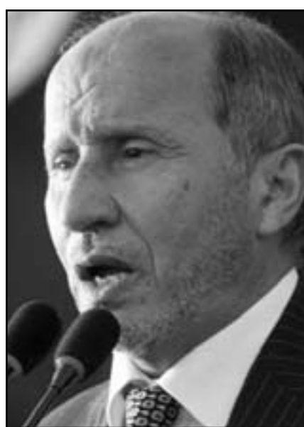
مصطفى عبد الجليل