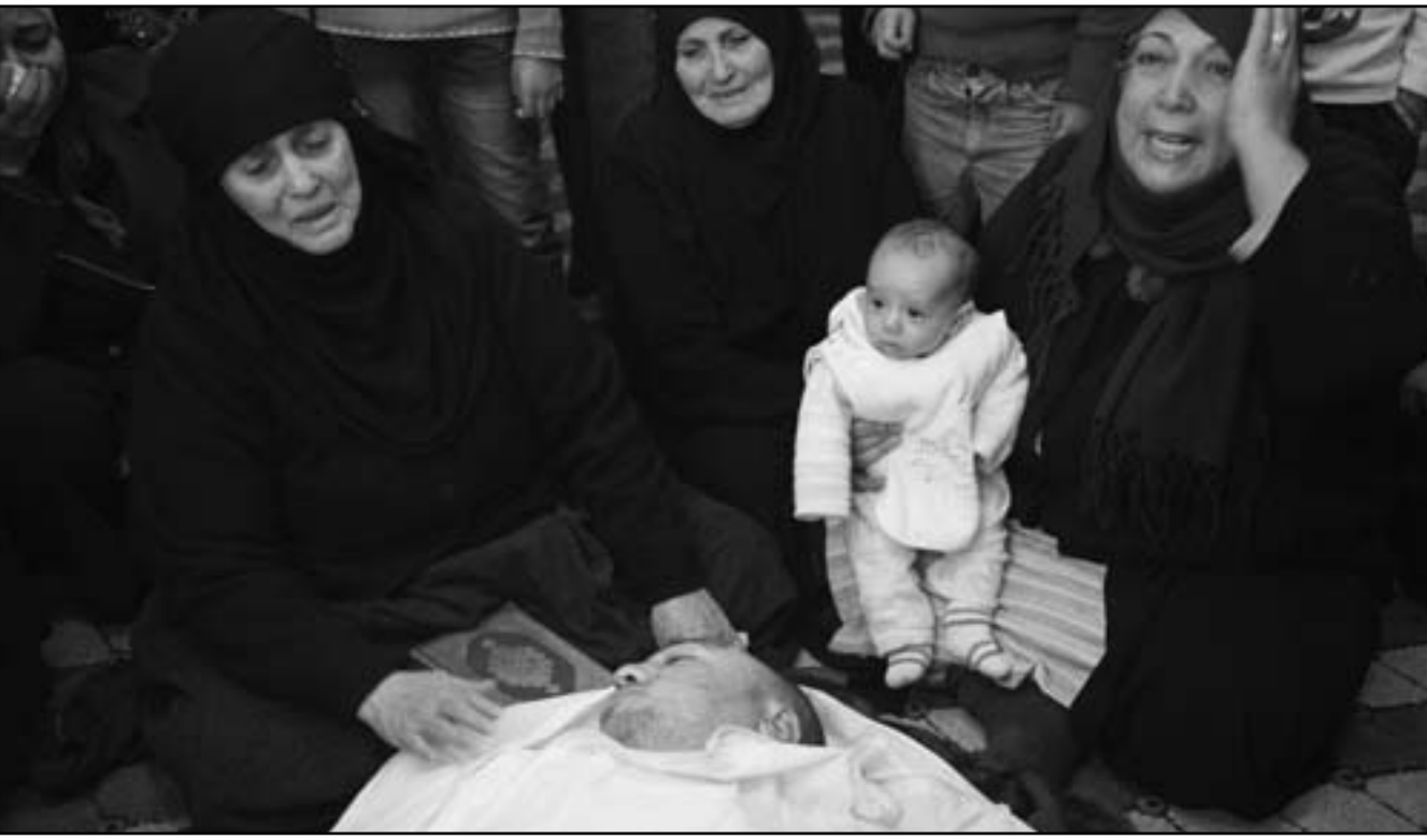
سورية تودع قريباً لها قتل في بلدة القصر

بيروت - دمشق - نيقوسيا - وكالات: وصلت القوات النظامية السورية الثلاثاء قصفها لمدنية حمص لليوم الخامس والعشرين على التوالي، وذلك بالترافق مع سقوط 90 قتيلًا في قصف على حمص. وقال الناشط محمد حمادي عبر هاتفه النرثيا من حمص وكالة الأنباء إن قوات الأمن اقتحمت بلدة حلفايا وقتلت 32 شخصًا وأصابت العشرات، بعضهم حالته خطيرة.