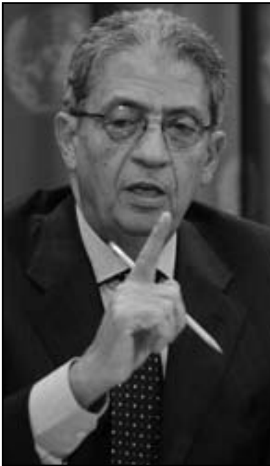
المرشح الرئاسي المحتمل عمرو موسى

التصدي للاعتداء على مؤيديه وتأمينهم بعد هذا الحادث حيث التفت المئات من أبناء الشريعة حول أعضاء حملته كدروع بشرية لعدم تمكن مثيري الفوضى من مواصلة التعدي عليهم. وأعرب موسى عن سعادته بزيارة الشريعة واللقاءات التي جرت مشيراً إلى أن إعداءات البلطجية لا تريد للشعب الخير ولا تعريف المواطنين ببرامج ومواقف المرشحين. ومن ناحية أخرى أكد المكتب الإعلامي لعمرو موسى أن السبب في الاعتداء قد يكون خصومة سياسية وأنها كانت مخططة بطريقة أو بأخرى لحساب قوى تريد إجهاد العملية الديمقراطية قاموا بتحريك بعض الحركات الفوضوية المعروفة باستخدام وضم البلطجية، مطالبا الدولة بحماية السياسيين ومرشحي الرئاسة ومناهضة الحركات الفوضوية ووقفها. وأكد المكتب الإعلامي أن موسى لم يحتجزه أحد في محافظة الشريعة خلال جولته الانتخابية هناك وأنه كان هناك بعض البلطجية مستعدون للهجوم على أعضاء