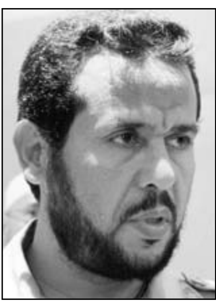
عبد الحكيم بلحاج