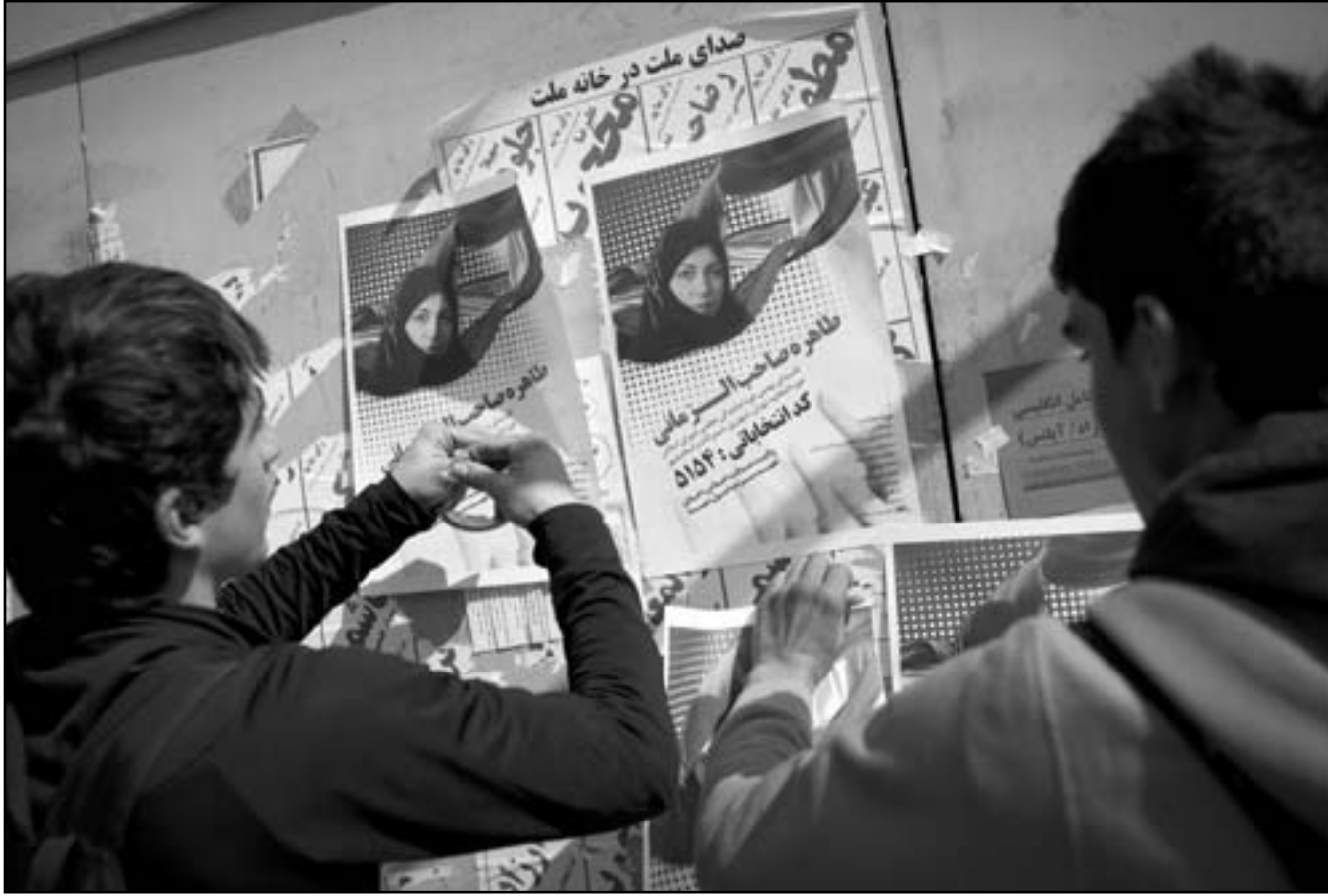
ايرانيان يقومان بتعليق ملصقات انتخابية استعدادا للانتخابات الايرانية القادمة

ويدعو مجلس الامن الدولي منذ فترة ايراني الى تعليق تخصيب اليورانيوم لكن تقاعس طهران عن الامتثال لطالب المجلس ادى الى اربع جولات من العقوبات والى اجراءات امريكية واوروبية اشد تستهدف اكبر سلعة وتصورها وهي النفط. ويقول خبراء غربيون ان مخزون ايران من اليورانيوم منخفض التخصيب قد يكون كافيا لصنع اربع قنابل نووية في حالة تخصيبه الى درجة اعلى اذا قررت القيادة الايرانية القيام بذلك.