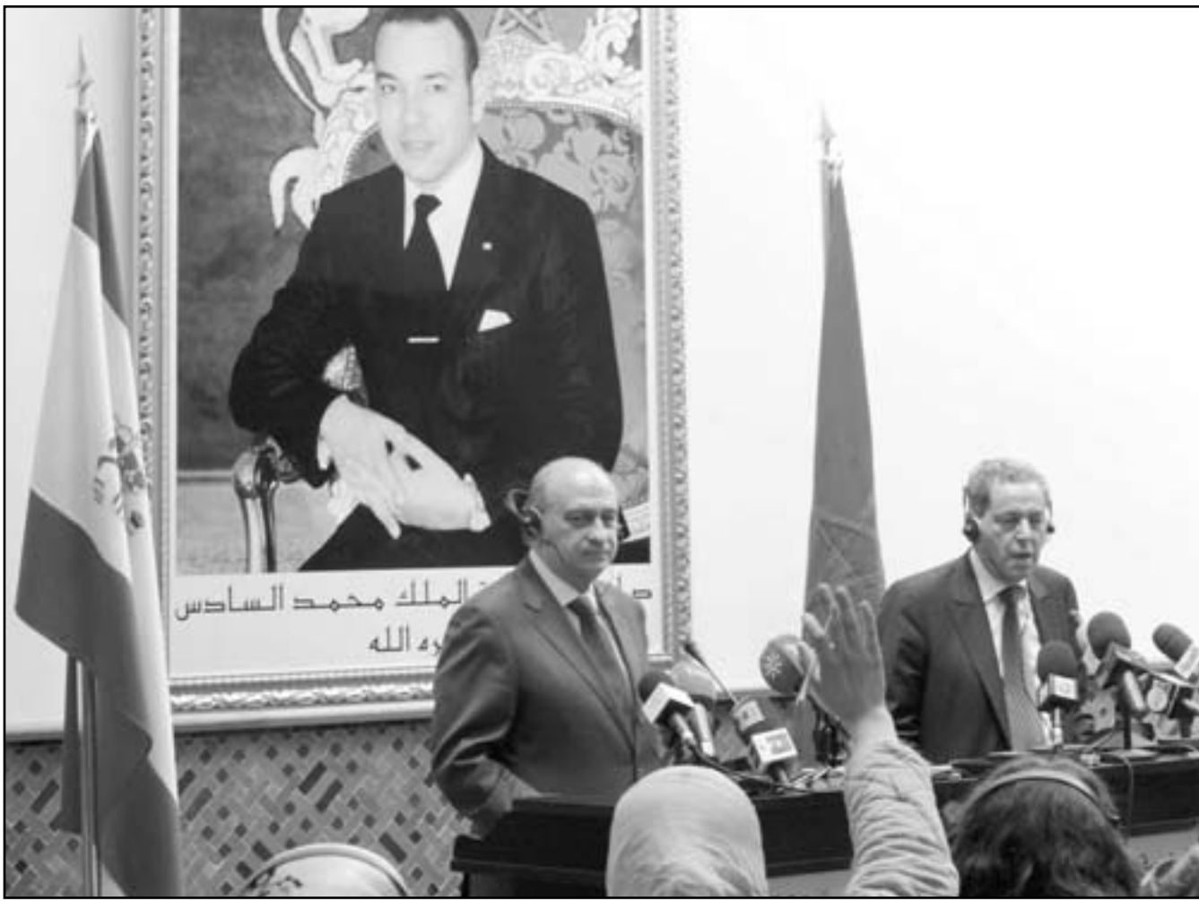
وزير الداخلية المغربي محمد العنصر خلال مؤتمر صحافي مع نظيره الاسباني خورخي فرنانديز في الرباط امس

صورهم خلال مظاهرات الاحتجاج مما ادى الى انفكاتها وغيابها عن المشهد وتراجع حزب الاصالة والمعاصرة الى المرتبة الرابعة في الانتخابات التشريعية لثاني لثلاثاء (نوفمبر) الماضي. وقال الشوباني في تصريحات نشرتها صحيفة «أخبار اليوم» المحلية امس الثلاثاء «لقد انتهى زمن «حزب الدولة» ويجب أن ينتهي معه كذلك زمن مهرجان الدولة» كما يجب أن ينتهي كل سلوك فوقي يشعر معه المواطنون بالاستعلاء والاستقواء برموز الدولة وإمكاناتها المادية والبشرية لأنها أمور غير قابلة للتحيين والخصوصة!