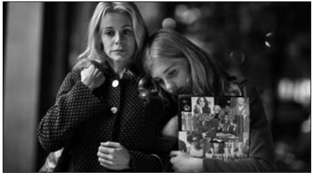
لقطة من فيلم «لا تخافي»