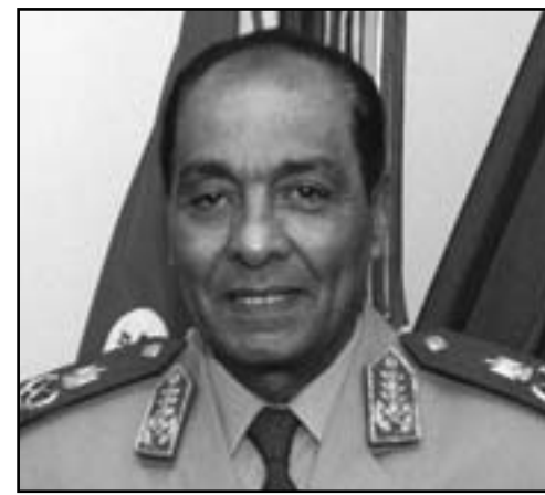
المشير محمد حسين طنطاوي

تعهد المشير محمد حسين طنطاوي رئيس المجلس الأعلى للقوات المسلحة الثلاثاء بان تكون الانتخابات الرئاسية القادمة نموذجاً للديمقراطية وعنواناً للنزاهة والشفافية. وجاء ذلك في رسالة بعث بها طنطاوي الى رئيس مجلس الشورى المنتخب الدكتور احمد فهمي الذي تلاها في جلسة المجلس الثانية عقب اعلان فوزه برئاسة المجلس. ووجه طنطاوي خالص تهنئته لأعضاء مجلس الشورى ورئيسه على عقد اولي جلساته بعد انتخابات حرة ونزيهة عبر من خلالها الناخبون عن رأيهم بكل حرية. وتقدم طنطاوي باسمي آيات التهنية لنواب المجلس على الثقة التي اولاهم اياها شعب مصر العظيم الذي ينتظر من نوابه العمل الجاد والتعاون مع مجلس الشعب في اصدار التشريعات التي تحقق امال وطموحات هذا الشعب. وقال ان هذه الانتخابات جاءت تحقيقاً للوعده الذي قطعه المجلس الاعلى للقوات المسلحة على نفسه لجموع المصريين منذ توليه مسئولية ادارة البلاد بانه لن يكون بديلاً عن الشريعة التي ارتضاها الشعب وما نحن نسلم السلطة للبرلمان الذي يعبر عن امال وطموحات الشعب المصري. وأضاف طنطاوي اننا خضنا خلال المرحلة الانتخابية اختبارات صعبة وتحديات هائلة وكانت الدولة تقف على مركزها واداه وهو جيش مصر العظيم الذي حمى الثورة وتبني كل مطالبها. وقال المشير حسين طنطاوي في رسالته الى رئيس مجلس الشورى ان القوات المسلحة ادرت ان محاولات بث الفرقة بين ابناء الشعب ستشغلهم عن عملها نحو اعادة وُستاسات