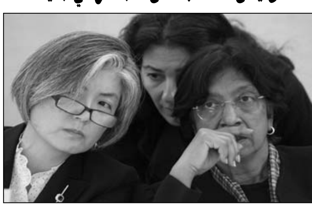
المفوضة العليا لحقوق الإنسان نافي بيلالي خلال الاجتماع

كفرت لها». ومن جهتها طالبت مفوضة الأمم المتحدة لحقوق الإنسان نافي بيلالي الثلاثاء بوقف إطلاق نار إنساني في سورية فورًا، مجددة دعوتها لإحالة الوضع السوري إلى المحكمة الجنائية الدولية.