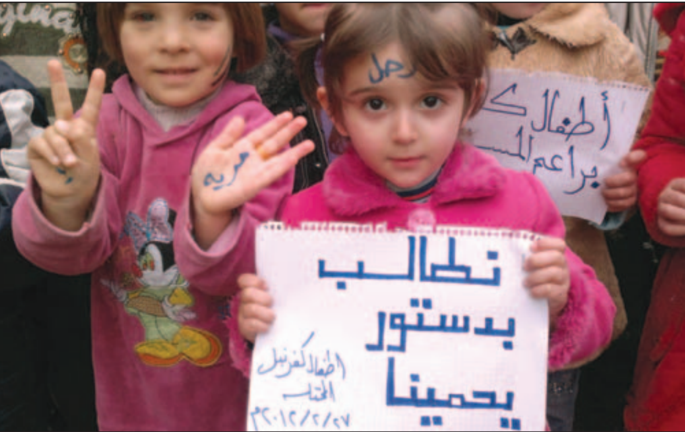
اطفال يرفعون لافتات تطالب باقرار دستور يحميهم اثناء مظاهرة في كفرنبل

وفي جنيف من المنتظر ان يدين مجلس حقوق الانسان التابع للأمم المتحدة سورية لاستخدامها الاسلحة الثقيلة في هجمات على المناطق السكنية واضطهادها المعارضين في رابع انتقاد من نوعه لاسد منذ بدء الانتفاضة في آذار (مارس) الماضي. وانسحب الوفد السوري الثلاثاء من الاجتماع، تحت ضغط الانتقادات التي وجهت الى بلاده، فيما اعتبرت الدولية للتصليب الاحمر. روسيا انه من «المهم» ان تتعاون دمشق مع اللجنة وعقد اجتماع مجلس حقوق الانسان بناء على طلب من تركيا وقطر والكويت والسعودية ايدده الغرب.