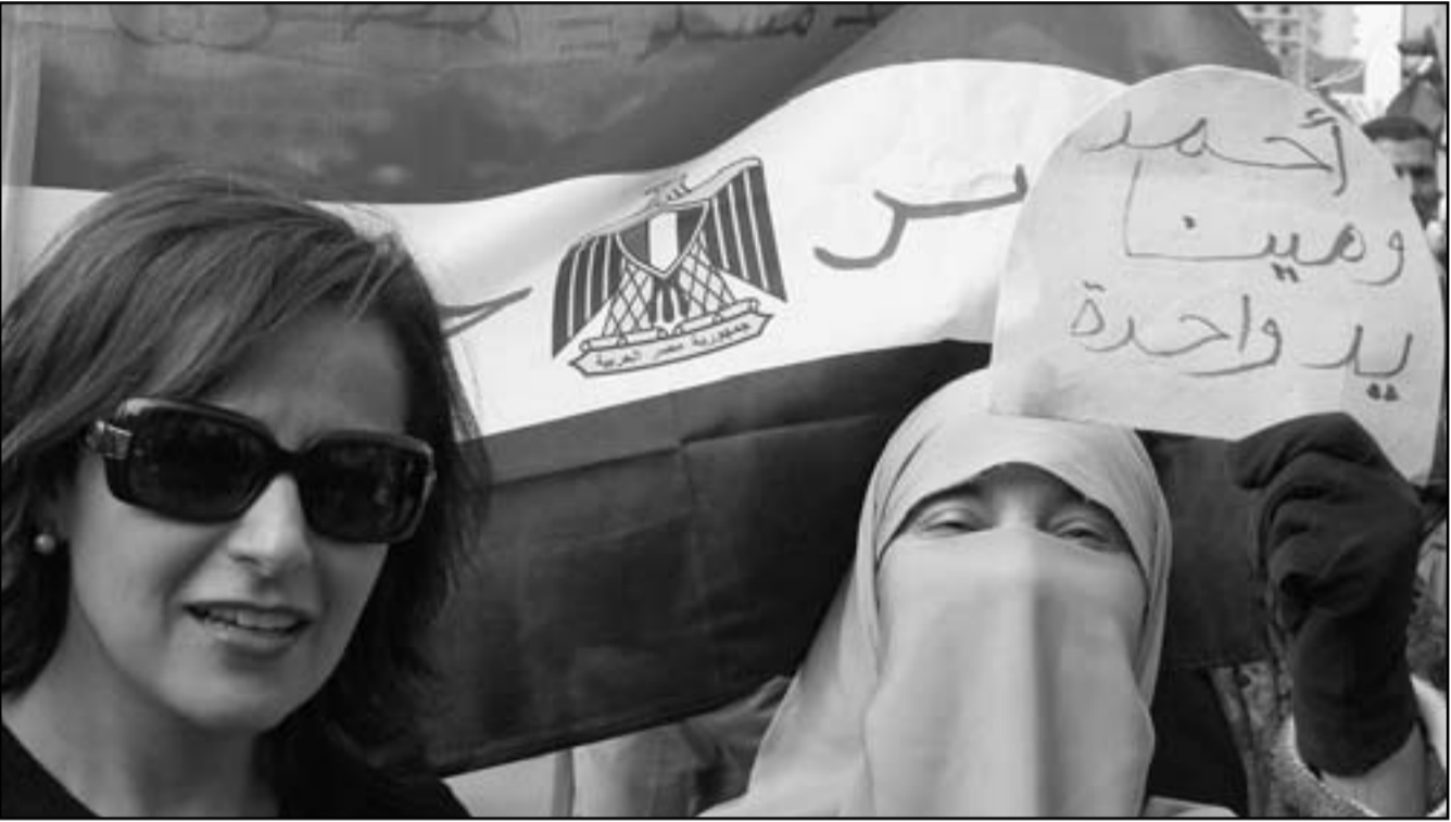
من مظاهرة معارضة للحكومة في ميدان التحرير