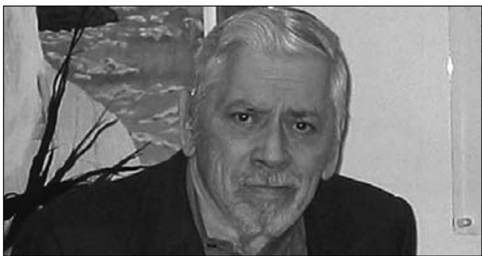
روبرت بي شيرمان

ونكرت صحيفة لوس أنجليس تايمز الثلاثاء أن شيرمان الذي فاز بجائزة الأوسكار لأفضل موسيقى تصويرية وأفضل أغنية من فيلم «ماري بوبينز» عام 1964 توفي في لندن أمس الإثنين.