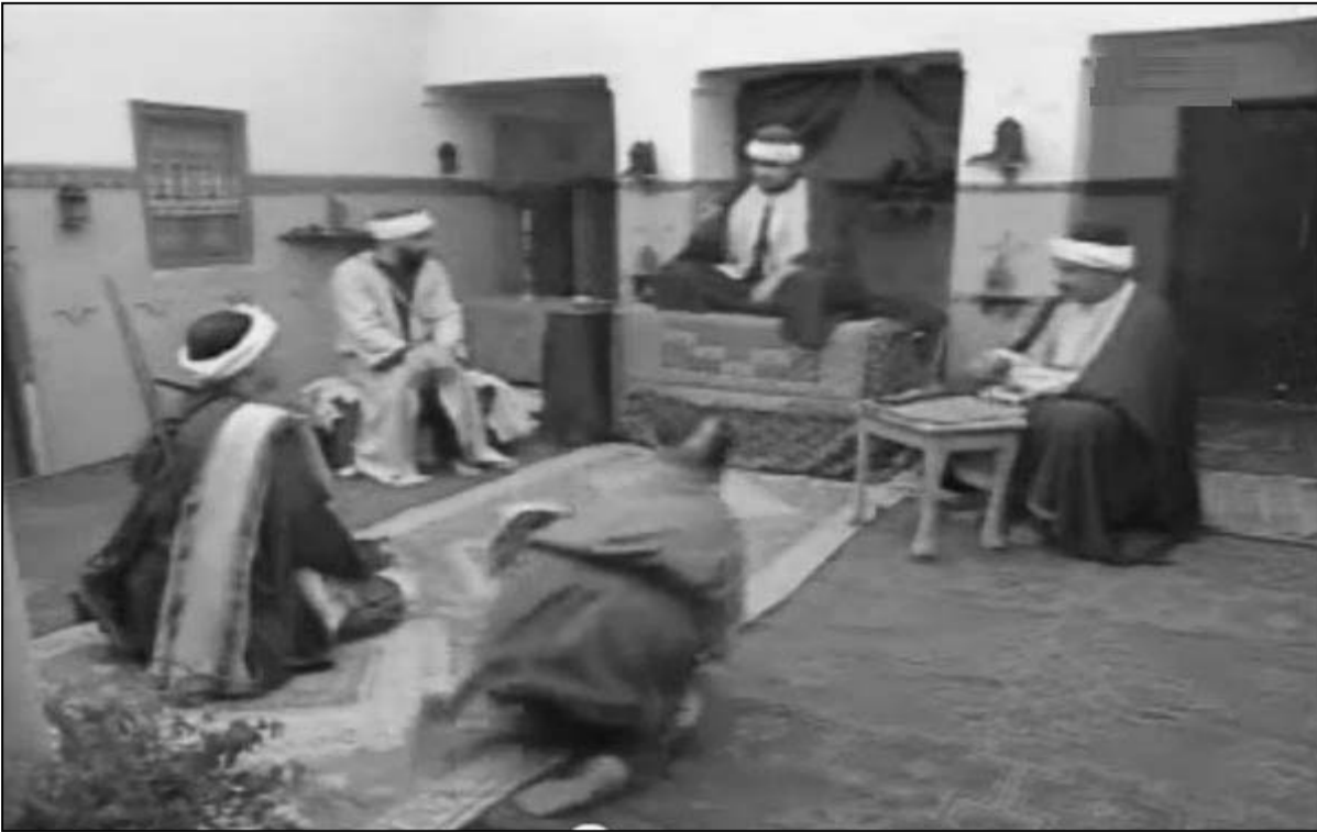
لقطة من مسلسل «حديدان»

يطوف بين القبائل بحثا عما يسد به رفق، يتحایل من أجل الأكل بكبرياء، وبذلك لا يقع في الذالة التي ستفقد تعاطف المتفرجين... كلما شمت قبيلة انتقل إلى غيرها، ينصب الفخاخ للأخريين للحصول على الملائس، على الأكل، على وسيلة نقل، يطلب من ضيوفه أن يجلبوا أكليم حديدان يطل، يحال ليضع نفسه وأولاده رغم أنه بلا عمل. وهو يمثل سر الوعي الشعبي، وعي يعان عن نفسه بوضوح في الحملات الانتخابية.