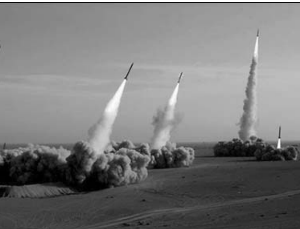
الحرب القادمة بين اسرائيل وايران ستكون حرب صواريخ

في كل ما يتعلق بحرب صواريخ، ينبغي ان نذكر ايضا بان بريطانيا تلقت الالفا من الصواريخ الالمانية في الحرب العالمية الثانية لكن عدد الخسائر ربما كان يعادل ربع ساعة قتال هي نورماندي.