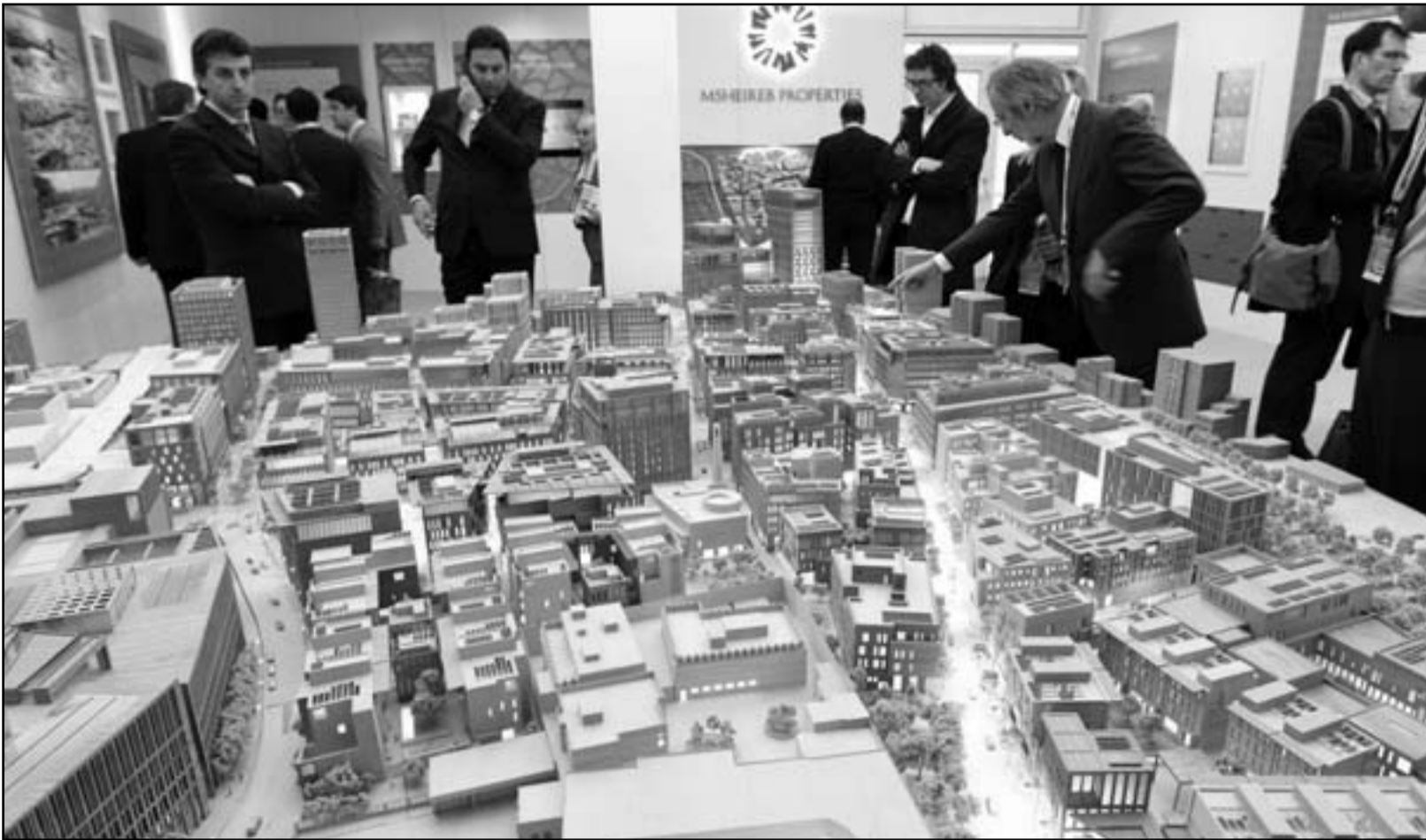
زوار في معرض مبيم العقارات ينظرون الى مجسم لمشروع عقاري ضخم في قلب الدوحة

والمطاعم والمسارح ودور السينما والمساجد، وسيكون هذا الحي أيضاً مركزاً للنشاطات ثقافية جمّة مثل زيارة البيوت القديمة التي تعود لزمن الحرب العالمية الثانية حين بدأ مستخرجو النفط الغربيون بالتوافد الى قطر للبحث عن الثروة التي ستغير تاريخ هذا البلد، وسيقوم مشروع ترميمي بالربط بين الاجزاء الثمانية في المشروع.