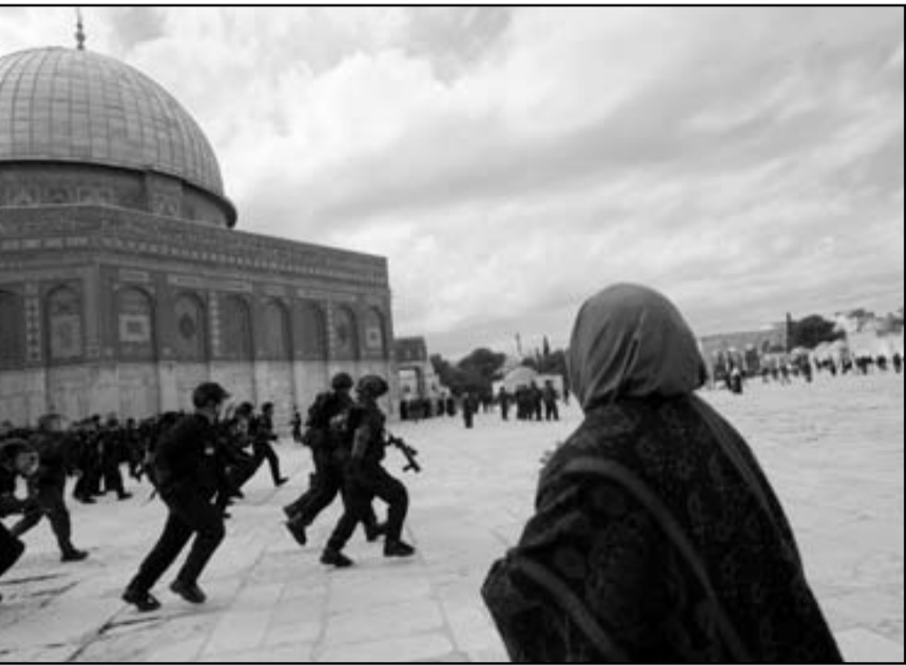
الجمتمع الدولي يرفض ضم شبر واحد من الاراضي المحتلة لاسرائيل

اسرائيل - اديمقراطية أم حكم عرقي لليهود؟ وايهما يسبق - هل سلطة القانون أم سلطة رجال الدين؟ وكيف يُعامل أبناء الأقلية العربية - هل مثل طابور خامس أم باعتبارهم مواطني اسرائيل؟. بعبارة اخرى كانت حرب الايام الستة تحقيقا للتصور الذي بسطه زئيف جابوتنسكي في مقاله «سور الحديدي» في 1923: «ان شعبنا جوا يوافق على مسائل مصيرية وعظيمة... حينما لا يُرى في سور الحديد صنع واحد، انذاك فقط تقدم مجموعات متפרقة شعاعها «الابنية» وسحرها وينتقل التأثير الى المجموعات المعتدلة... انذاك سيأتينا هؤلاء المعتدلون ومعهم اقتراحات لتنازلات متبادلة... ويستطيع الشعب ان يتعاشيا جنباً الى جنب بسلا...»