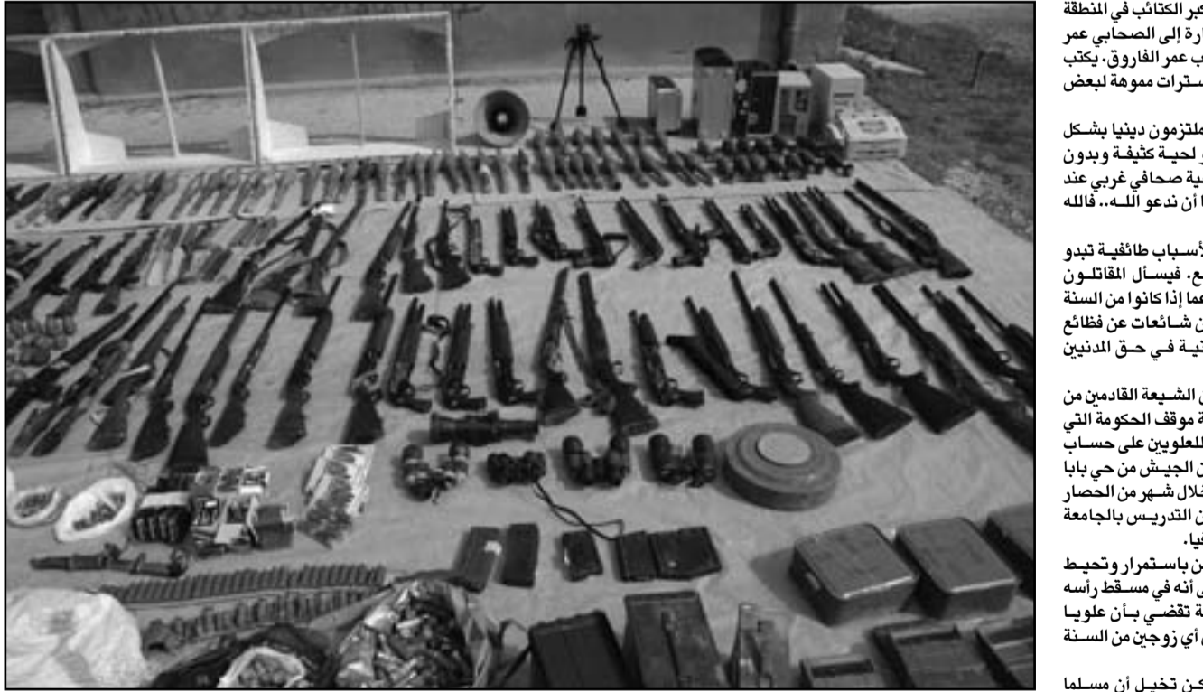
أسلحة تم مصادرتها في حمص

ويطبق على واحدة من أكر الكتاب في المنطقة اسم تجنية الفاروق في إشارة إلى الصحابي عمر بن الخطاب الذي اشتهر بلقب عمر الفاروق، يكتب الاسم بحروف ذهبية على سترات موهة لبعض المقاتلين. وبعضهم مثل ابو عمر مفلزون دنيا بشكل لافت للنظر، قال مقاتل ذو لحيته كثيفة ويبدو شارب «السلام عليكم» لحيحة ضحاكي غربي عند نقطة تفكيك، وقال «علينا ان ندعو لله.. فالله اكبر، مشوا الى السماء. كما ان الرابية والبراة لأسباب طائفية تبدو منتشرة على نطاق واسع. فيسأل المقاتلون الزائرين من العراق ولبنان عما اذا كانوا من السنة او الشيعة وكثيرا ما يقولون شائعات عن قطاع ارتكبتها «ميليشيات»، إيرانية في حق المدنيين السوريين.