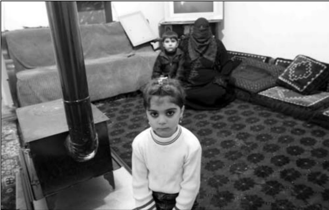
عائلة سورية لاجئة الى منطقة البقاع

والشعب، والطبقة التجارية في دمشق وحلب وضباط الجيش والأقليات خاصة المسيحية منها لا تزال آلاماً.