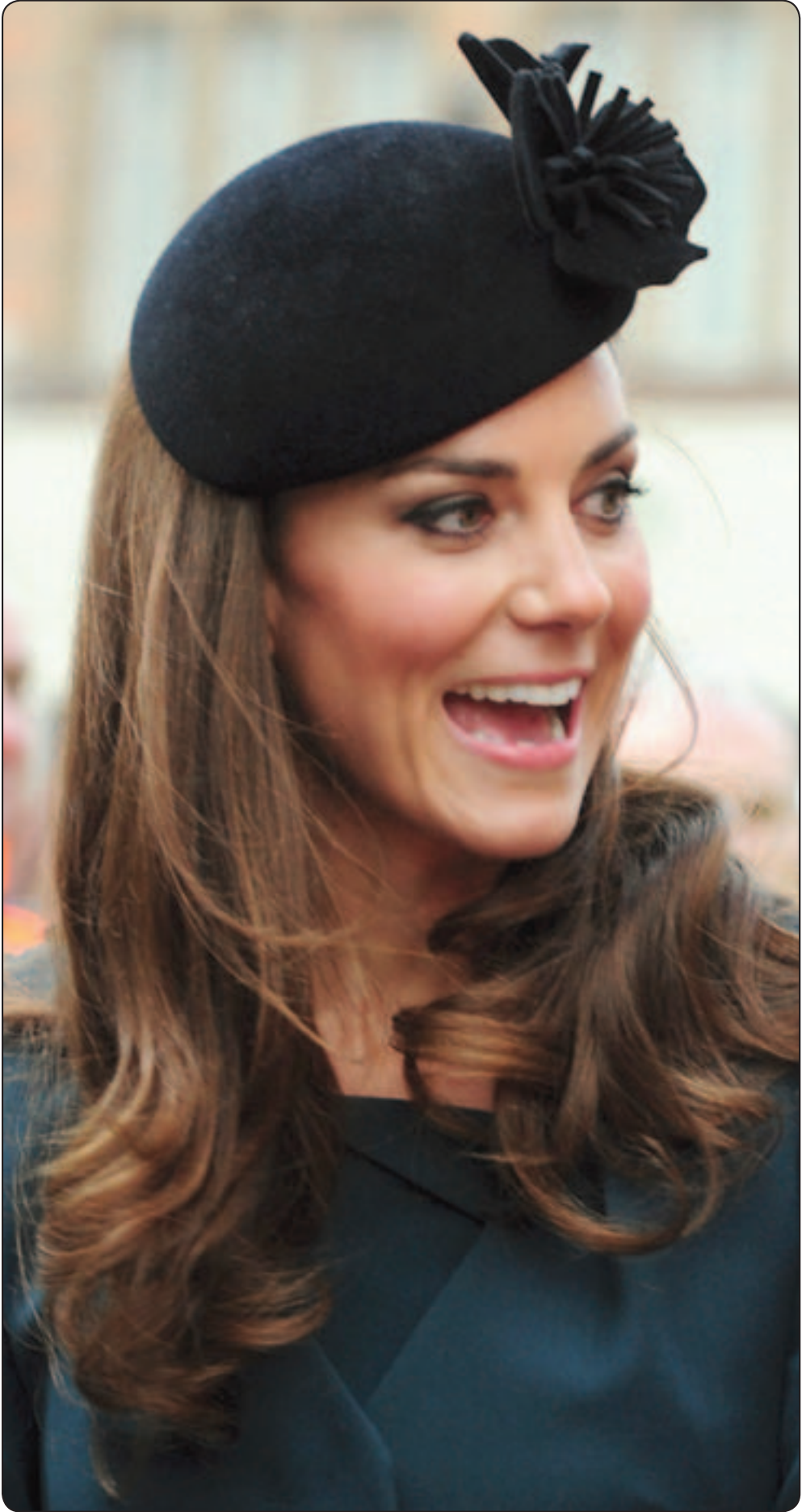
الاميرة البريطانية كاترين زوجة الامير وليام ابن ولي عهد بريطانيا قامت بمصاحبة الملكة اليزابيث الثانية في زيارة لمدينة «ليستر» ضمن جولة بمناسبة اليوبيل الالاسي (60 عاما) على تويجها.

■ واشنطن - يو بي أي: قال علماء في محطة الفضاء الدولية أنهم قد يبدؤون باستخدام أجهزة «أبياد» للوجوه كونها أسهل من حيث الاستخدام في الفضاء. وقال العلماء أنهم لطالما انظروا أن يتم تطوير جهاز لوحي يدوي يجعل حياتهم في الفضاء أسهل. وكانت شركة «أبل» كشفت في مدينة سان فرانسيسكو، عن الجيل الثالث من هذا جهاز «أبياد»، الذي أطلقت عليه اسم «ذا نيو أبياد» (الأبياد الجديد) ولم يحمل اسم «أبياد 3»، كما كان موقعا.