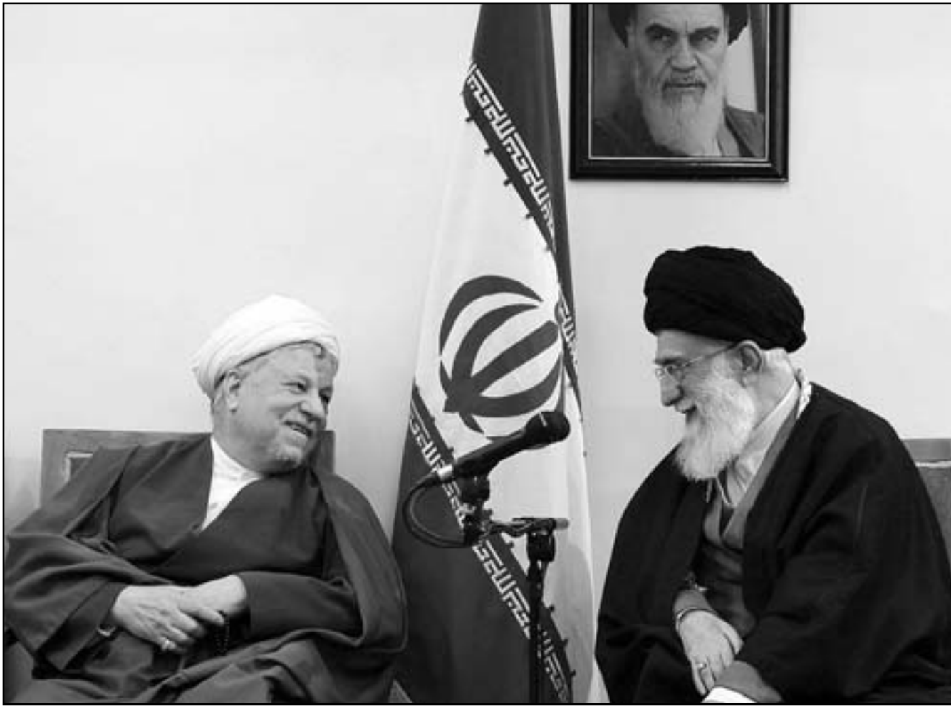
المرشد الأعلى للجمهورية في إيران آية الله علي خامنئي خلال حديث ودي مع الرئيس الإيراني الأسبق علي أكبر فخرسجاني في طهران

هو انطباعي.. نحن نطالب إيران بالتشارك معنا بشكل متفاعل وهي مطالبة ببعض الأجوبة». وأضاف «هناك منشآت نووية غير المعلن عنها.. بالنسبة لهذه المرافق والأنشطة لا نستطيع أن نقول إنها للأغراض السلمية، قد يكون هناك غيرها من المرافق التي لم يعلن عنها، ونحن لدينا دليل أو معلومات أن إيران تشارك في الأنشطة ذات الصلة في تطوير الأجهزة المتفجرة النووية».