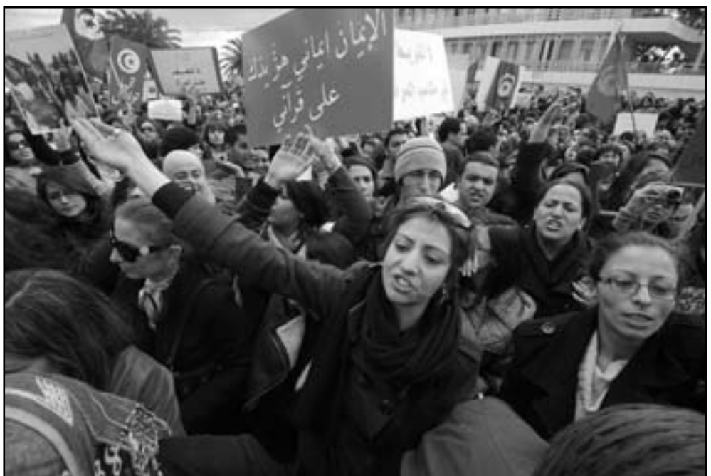
تونسيات يتظاهرن للاحتفال بيوم المرأة العالمي

منذ بداية الأزمة، السلطة الأسبوع على الجامعة باتخاذ موقف واضح، ومنذ الثامن والعشرين من تشرين الثاني/نوفمبر، يوم بدء اعتصام الطلاب والسلفيين للمطالبة بتسجيل طالبات منقيات ومنع الاختلاط، لم تشهد هذه الكلية التي يدرس فيها حوالي 13 ألف طالب أي استقرار. وجرت حوارات جديدة الأربعاء بين سلفيين وطالب نقابيين في حرم الجامعة