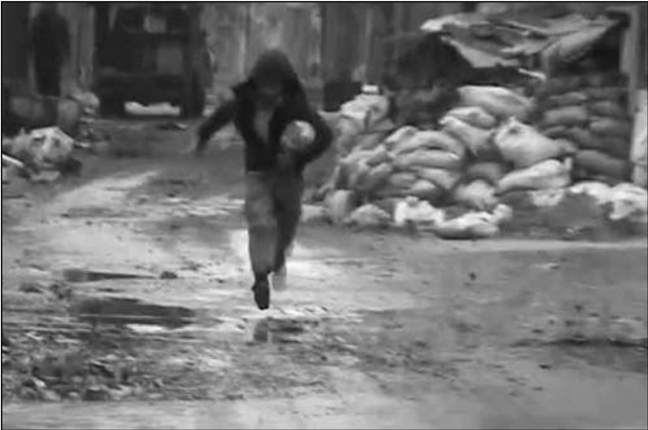
سوري يهرب من القصف على باب دتمر

سورية والاسد وحلب. واصبحت مدينة حلب التي لم تشهد تطورات الا بعضها في الجامعة محلا للناكث منها «عاجل عاجل.. ثوار حلب- عام 2010» وتقول اخرى «حلب لن تنتفض حتى لو تنازلت جيوب الفخيرا»، لكن هذا الموقف يتغير حسب الصحيفة حيث بدأت تنتشر شعارات تهاجم النظام في عدد من احيائها «بشار يا حمار.. ولم يبق املك وقت».. وتضيف ان ايام الجمعة عادة ما تشهد لعبة القبط والفارين شيخة النظام والمظاهرين، ويقول ناشطون ان النظام في تعامله مع حلب كان حذرا لان الخيبة الحاصمة المتعاقبة معه هي من حلب ولو قام بمواجهة مع المدينة وقعت كارثة على راسه.