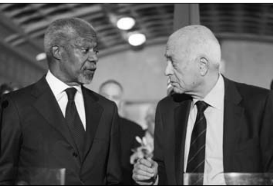
امين عام الجامعة العربية نبيل العربي لدى لقائه مبعوث الامم المتحدة لسورية كوفي انان في القاهرة

وقال المتحدث باسم وزارة الخارجية المصرية عمرو رشدي يوم الأربعاء الماضي خلال اجتماع مع موفد الأمم المتحدة والجامعة العربية إلى سورية كوفي انان رؤيته مصر القائمة على ضرورة الحفاظ على السبل المكنة على وحدة سورية الإقليمية (...). وحذر من أن طبيعة سورية الجغرافية والتبعية ستلحق ضرراً هائلاً بالمنطقة إذا ما تحول الوضع إلى حرب أهلية مسلحة ومن أن انفجار الموقف في سورية لن تقتصر آثاره