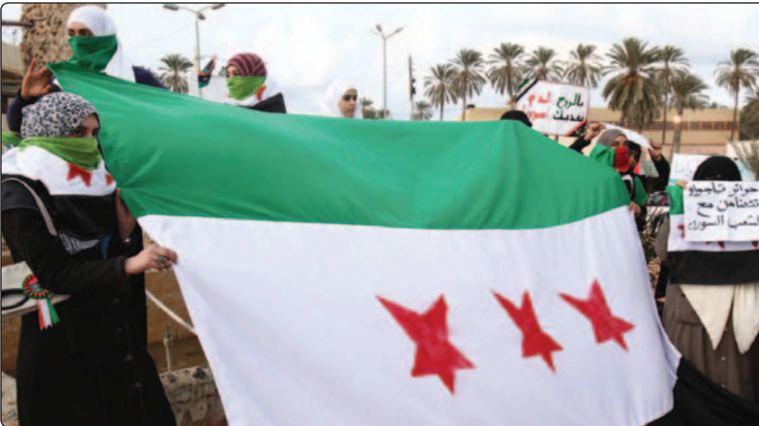
ليبيات يتظاهرن ضد النظام السوري خلال احتفالات بيوم المرأة العالمي في طرابلس