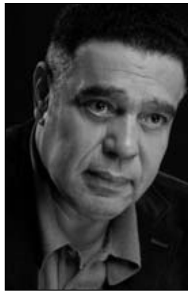
سامي العدل: ما نراه في الخليج مجرد محاولات لتجارب سينمائية