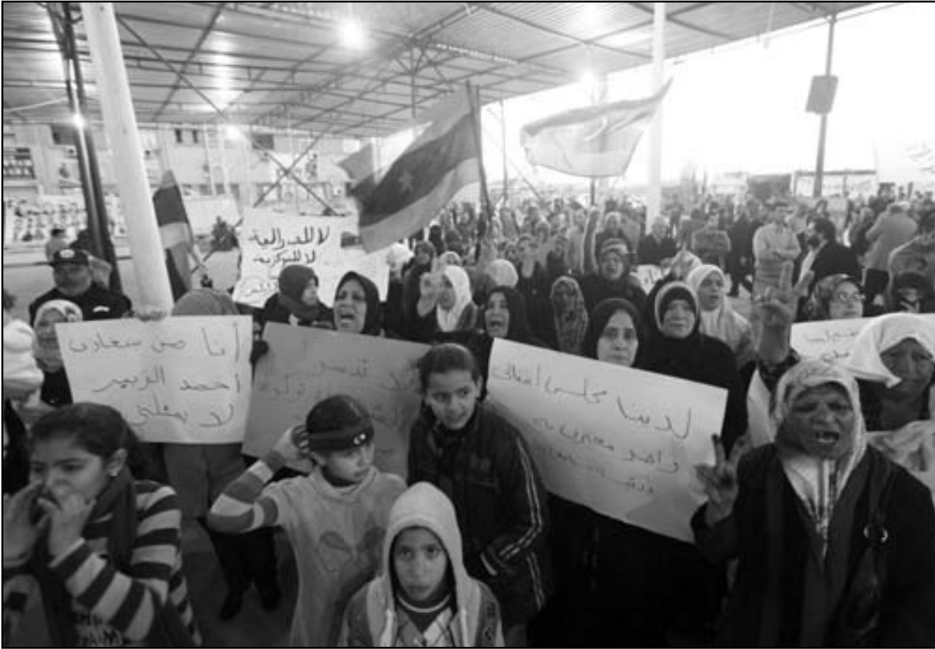
ليبيا يتظاهرون ضد الفدرالية ومؤيدون للمجلس الانتقالي

الوصاية على الشعب الليبي، وأكدت الحكومة في البيان الذي نشرته وكالة الأنباء الليبية «وال» أن شكل نظام الحكم «سوف يقرره الليبيون من خلال الدستور» كما أكدت رفضها المساس بوحدة الوطن وقاء لدماء الشهداء، وأنها ستعمل على ترسيخ اللامركزية وتوفير الخدمات لكل المواطنين، «في جميع ربوع ليبيا من خلال المجالس المحلية المؤقتة». ووصفت الحكومة الإعلان بأنه يعد تسلطاً وتسفياً في حق الشعب «مهما دعت أهدافه ودوافعه». وكشلتها الإداري، وأصدرت الحكومة الليبية الانتقالية مساء الأربعاء بياناً صحافياً حول إعلان إقامة نظام فيدرالي تحت مسمى «مجلس برقة»، أعلنت فيه رفضها للمحاولات الفردية لفرض أي نوع من