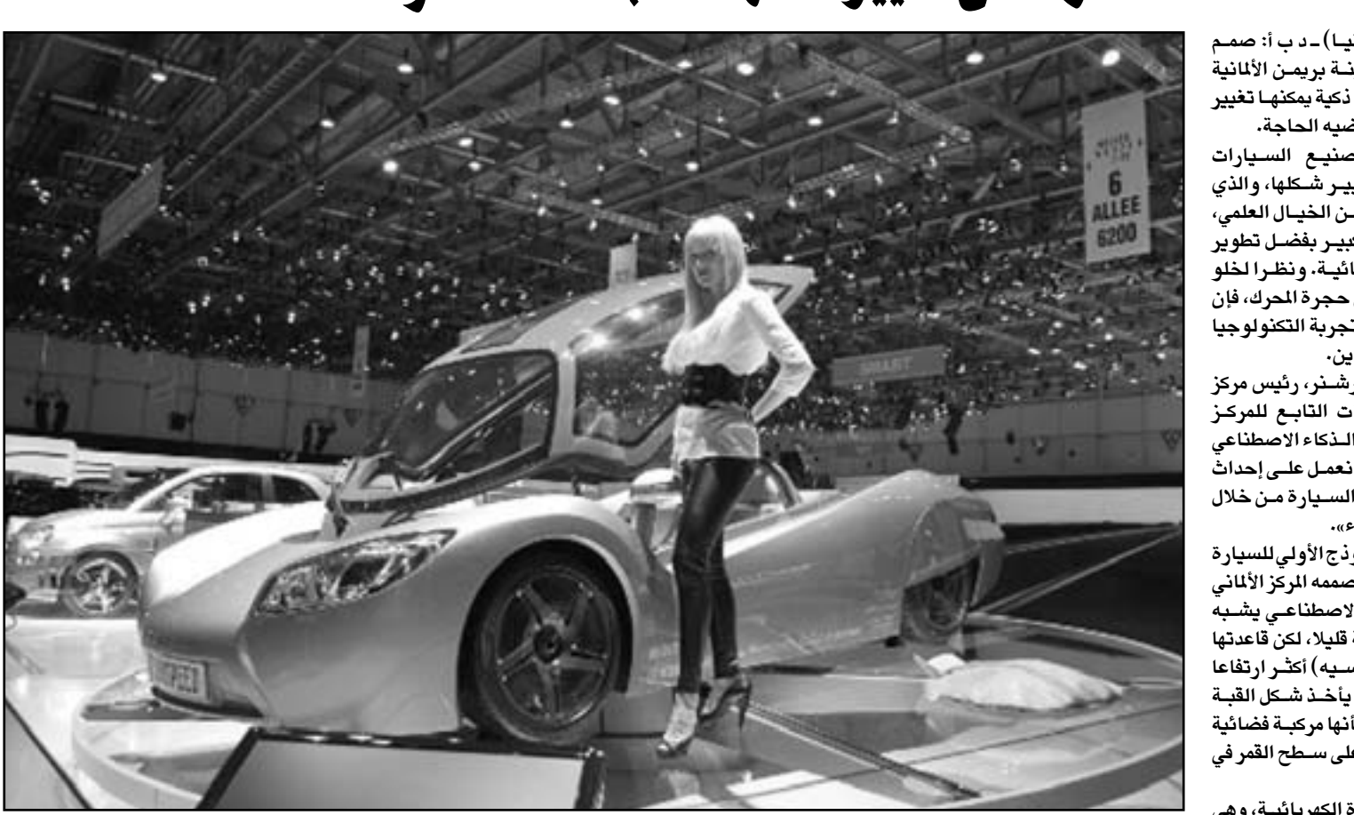
النموذج التجريبي للسيارة الكهربائية القادرة على تغيير شكلها

معدني أوشبي لتحميل البضائع. يقول كيرشتر أن مكونات السيارة دائماً ما تقتصر على الأجزاء اللازمة للغرض المطلوب، مما يوفر في الطاقة ويزيد من المسافة التي يمكن أن تقطعها السيارة. وفي الرحلات الطويلة يمكن ربط عدة سيارات ببعضها على شكل قطار تقوده السيارة الأولى، مما يساعد أيضاً على الحفاظ على طاقة البطارية. في الوقت نفسه، يمكن لسائقها باقي السيارات الخلفية في القطار الاسترخاء وقراءة الصحف نظراً لأن السيارة الذكية تنظم عملية التوصيل تلقائياً من خلال الاتصال مع السيارات الأخرى. وفي خطوة مستقبلية يتصورها الباحثون، ستستطيع السيارة السفر