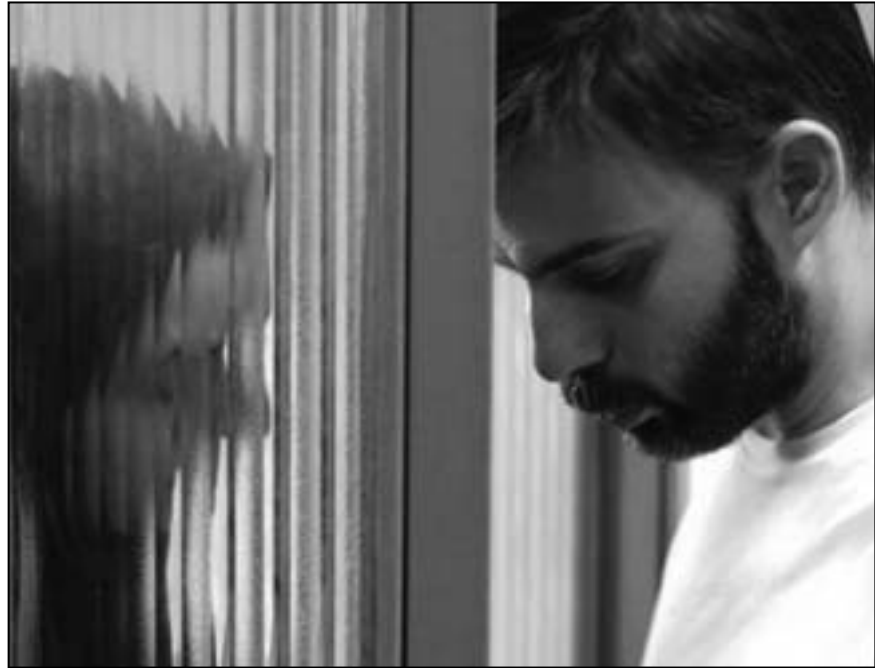
لقطة من فيلم «انفصال نادر وسيمين»

وأضاف البيان أن «المساءة» تتمثل في الحديث عن منع فيلم حصل على جوائز أحدثها الأوسكار وأن «المفارقة أنه فيلم إيراني مما يعني استحالة وجود ما يخشد الحياء» حيث لا يسمح في السينما الإيرانية بامرأة تكشف شعرها أو بالملابس بين الجنسين.