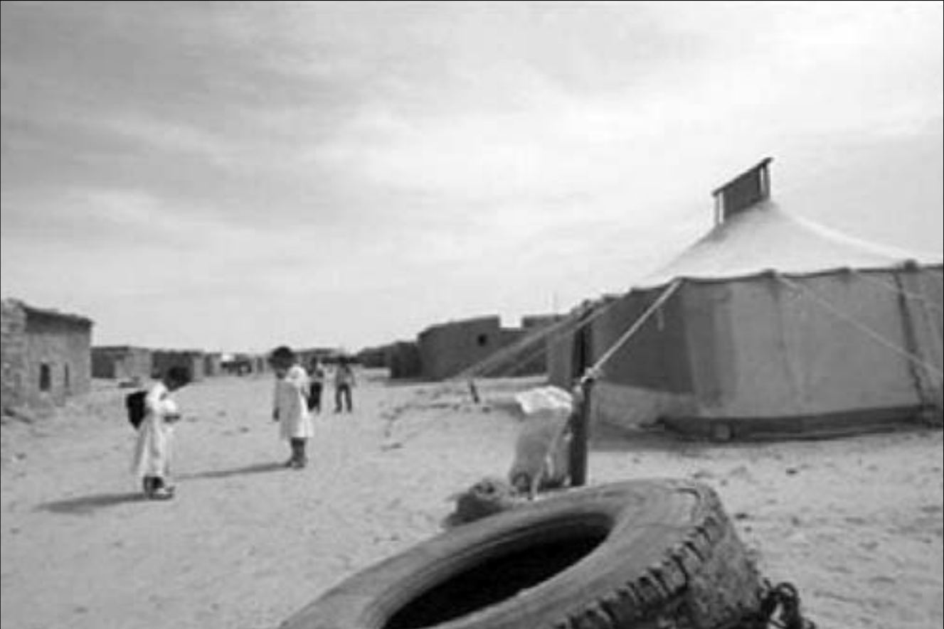
اطفال يلعبون في احد مخيمات الصحراء الغربية بمدينة تندوف

الدوليين، واتهم خطري ادوه المغرب أنه بالمطالبة والمناورة وتجاهل السلام العادل والدايم الذي يمكن لصحراويين من اختيار مستقبله بحرية ويتيح للشعوب المغاربية بناء الديمقراطية الكاملة والازدهار والاستقرار وقال إن الاوان قد حان ليضطلع مجلس الامن بمسئوليته كاملة.