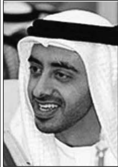
الشيخ عبدالله بن زايد

وعن انتخابات الرئاسة اعترف أمين عام جماعة الإخوان المسلمين بأن بعض المرشحين للرئاسة سعوا للرئيس الخلعوني الذي ظل دؤوباً لضمان حصولهم على أصوات أعضاء الجماعة والمؤيدين لها وشدد على أن الجماعة تقف على مسافة واحدة مع مختلف المرشحين وأنها لم تحسم أمرها بعد حتى فيما يخص المرشح