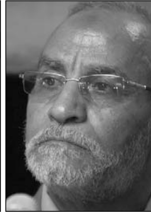
د. محمد بديع

الإسلامي. وأشار إلى أن اختيار المرشح الذي ستدعمه الجماعة في الانتخابات الرئاسية، سيتم تحديده بعد إغلاق باب الترشيح وسيتم الإعلان عنه في نفس اللحظة.