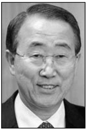
بان كي مون

ما يصل الي 6000 معتقل في منشآت تابعة للمليشيات المسلحة في ليبيا. وتواصل تحقيق مجلس الامم المتحدة لحقوق الانسان الي ان طرفي الصراع الليبي كليهما ارتكبا جرائم حرب واتهم ايضا القوات الموالية للقذافي بارتكاب جرائم ضد الانسانية.