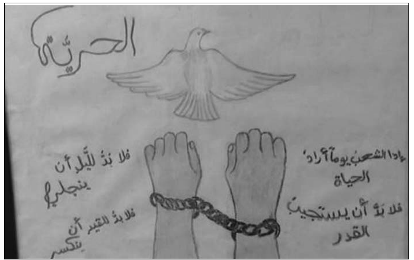
من رسوم اطفال الحرية

المعرض كان مقرراً افتتاحه في مجمع الأشرافية الثقافي في عمان، لكن السلطات ألغت الافتتاح قبل افتتاحه بخمس ساعات، وتمت ازالة اللوحات عن جدار المعرض من دون