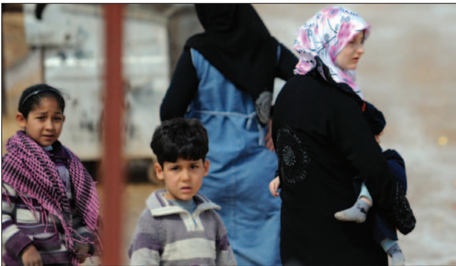
أسرة سورية لدى وصولها مخيم اللاجئين في تركيا أمس