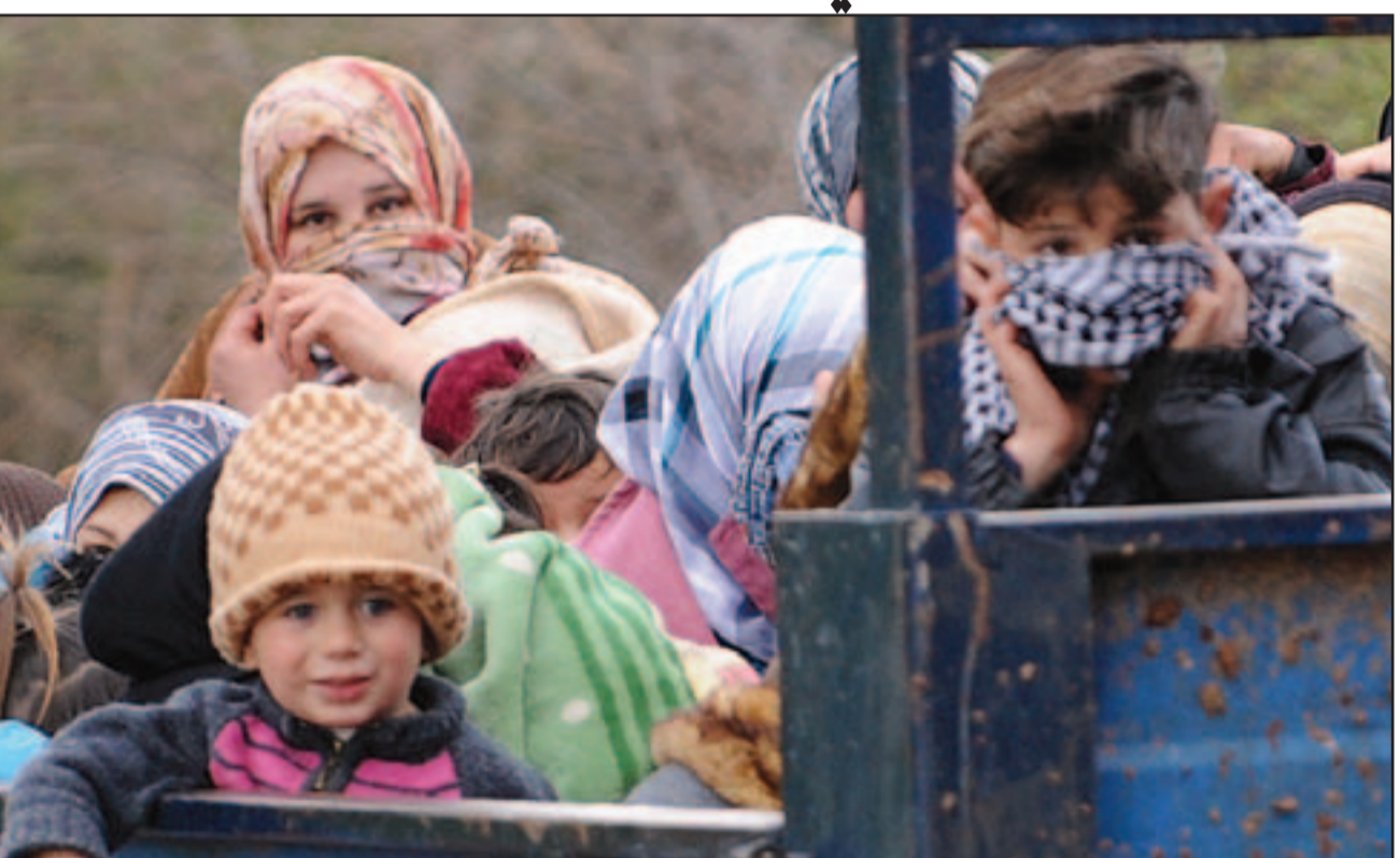
عائلات سورية تفر من منطقة ادلب على متن شاحنات في طريقها الى تركيا

■ دمشق- بيروت- نيقوسيا- وكالات: دخلت الانتفاضة السورية عامها الثاني امس الخميس مع تسجيل ارتفاع في وتيرة العنف التي اودت بحياة خمسين شخصا، في وقت قام النظام بعرض قوة عبر تجمعات ضمت عشرات الاف في مناطق عدة «من اجل سورية» ودعا لنظام الرئيس بشار الاسد، فيما لجأ السوري بمن فيهم ضابط رفيع المستوى خلال الـ24 ساعة الاخيرة هربا من اعمال العنف التي تركتها اتهمت النظام السوري بزرع الغام على الحدود المشتركة مع وصولهم. وقالت تركيا امس انها قد تدرس تاييد اقامة «منطقة عازلة» داخل الأراضي السورية للتعامل مع تدفق اللاجئين عبر حدودها الذي تزايد بسدة مع هجوم قوات الحكومة السورية على المعارضة في منطقة ادلب القريبة. وإفاد ناطق باسم وزارة الخارجية التركية سلجوك اوتال في مؤتمر صحفي في أنقرة الخميس ان «عدد اللاجئين السوريين (الى تركيا) ارتفع الى الف في يوم واحد وبلغ 14700 لاجئ». وأعلن رئيس الهلال الاحمر التركي احمد لطفي اكار الخميس ان تركيا تخشى تدفق قرابة 500 الف سوري الى اراضيها هربا من اعمال العنف في بلادهم. وحذر وزير الخارجية الفرنسي آلان جوبيه الخميس من مخاطر نشوب حرب اهلية في سورية في حال تسليم اسلحة الى المعارضة. وقال جوبيه ان «الشعب السوري منقسم بشكل عميق وان اعطينا اسلحة الى فئة معينة من المعارضة في سورية، فسوف تكون نتظم حربا اهلية بين المسيحيين والعلويين والسنة والشيعية، وقد يكون الامر بمثابة كارثة اكبر من الكارثة القائمة اليوم».