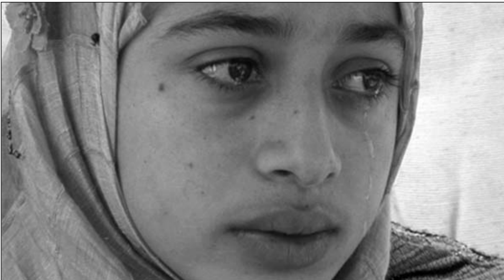
لقطة من فيلم «دموع غزة»