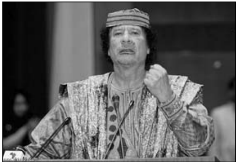
الرئيس الليبي السابق معمر القذافي

بنغازي (ليبيا) - اف ب: أعلن جهاز الاستاد الامني في وزارة الدفاع الليبية في بنغازي (شرق) الخميس انه ألقي القبض على شبكة تعمل على استغلال وخطف المهاجرين غير الشرعيين من جنسيات بنغالية وصومالية يستخدمون بعضا منهم في تجارة الرقيق. وقال آمر شعبة التحريات بالجهاز حسين خميس الساحلي «ان الشبكة تعمل على استقدام مهاجرين غير شرعيين من دولة بنغلاديش عبر الحدود المصرية الليبية بالتعاون مع سائق سيارات ليبية وصاحب المزرعة الليبي أيضا» حيث كان أكثر من 50 مهاجرا غير شرعي محتجزون. وأوضح ان «لك يتنم من خلال اتفاق كرفيق يعملون كخادم للمنزل والمزارع» لتسهيل اجراءاته وتوفير عمل له»، لافتا الى انه «فور وصول المهاجرين بطريقة غير شرعية الى بنغازي يتم احتجازهم في تلك المزرعة ويتم مطالبة اهاليهم بدفع فدية عن كل منهم تصل إلى أكثر من الف دولار في