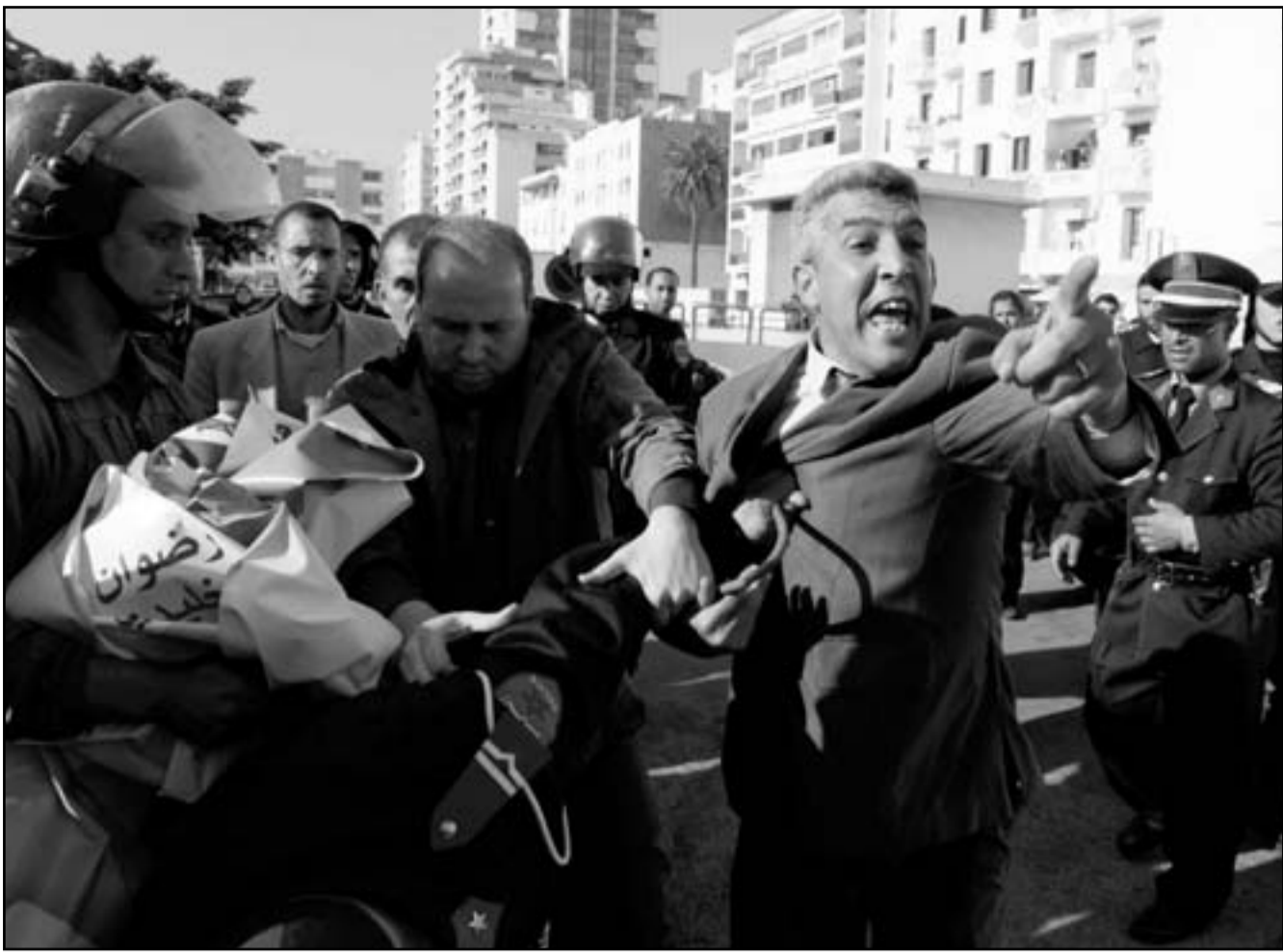
الشرطة المغربية تقوم بتعريق متظاهرين في الرباط

وقالت ناشطة مغربية على موقع «فيسبوك» الاجتماعي صباح امس في حق ثوار وجدة، المرجو النشر وقطع الطريق أمام قوات القمع بكل الأشكال المتاحة». وأكدت ان التاكيد من صحة هذا التحرك، وفي نفس الاطار قررت النيابية العامة لدى المحكمة الابتدائية بمدينة الحسيمة مساء اول امس الاربعة متابعة ثمانية أشخاص في حالة سراح مؤقتة ومتابعة شخص واحد في حالة اعتقال احتياطي بنهمته النور في المواجهات التي شهدتها مدينة بني بوعياش.