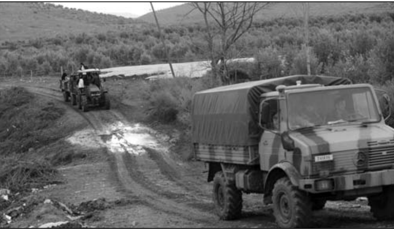
شاحنات الجيش التركي على الحدود في سورية