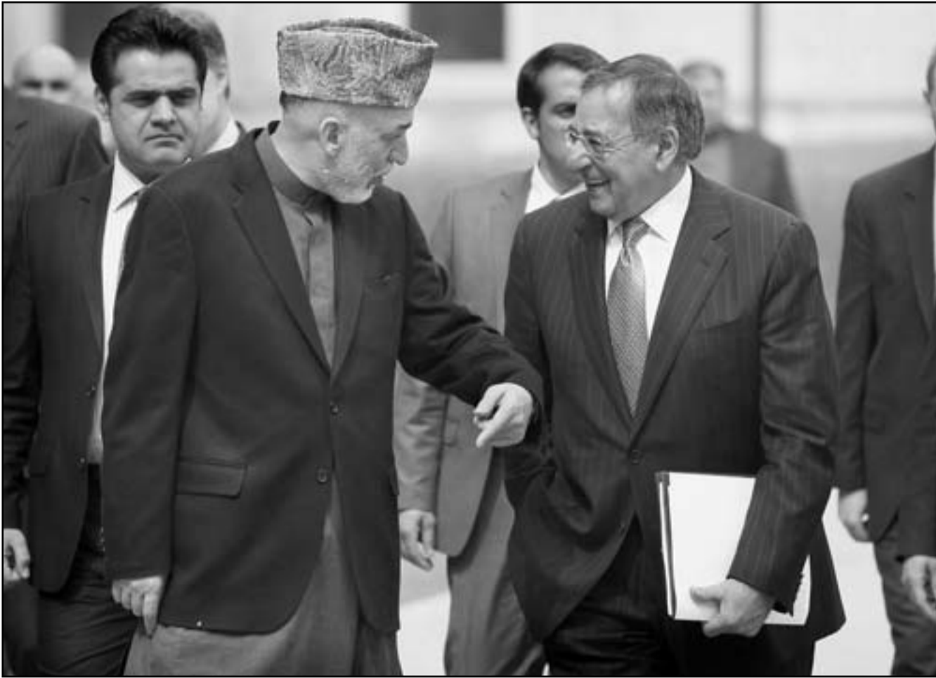
الرئيس الأفغاني حامد كرزاي في حديث ودي مع وزير الدفاع الأمريكي ليون بانيتا في كابول

تدريجيا من القوات التي يقودها حلف شمال الأطلسي قبل انسحاب معظم القوات الأجنبية المقاتلة بحلول نهاية 2014. وقال فريد هابل وهو المتحدث باسم قائد شرطة إقليم ارزكان «هذا اللغم زرعه طالبان حديثا وانفجر عندما مرت سيارة مدنية فوقه». وأضاف أن أربع سيدات وتسعة أطفال قتلوا. في أفغانستان في 2011 ليرتفع عدد الضحايا للعام الخامس على التوالي وفقا لتقديرات الامم المتحدة.