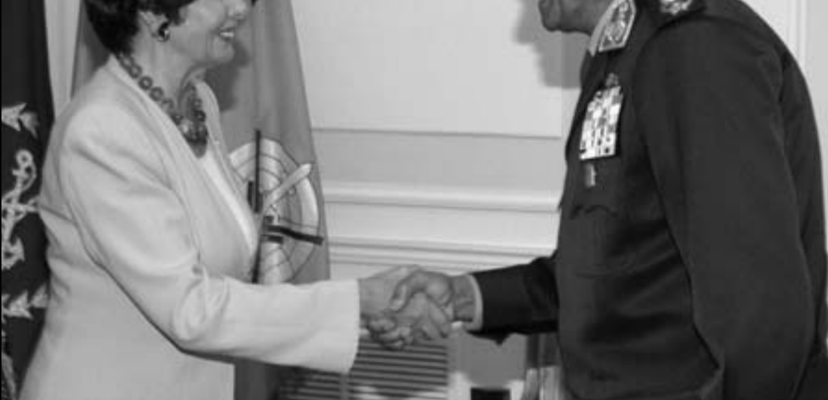
المشير حسين طنطاوي اثناء استقباله نانسي بيلوسي بالقاهرة أمس