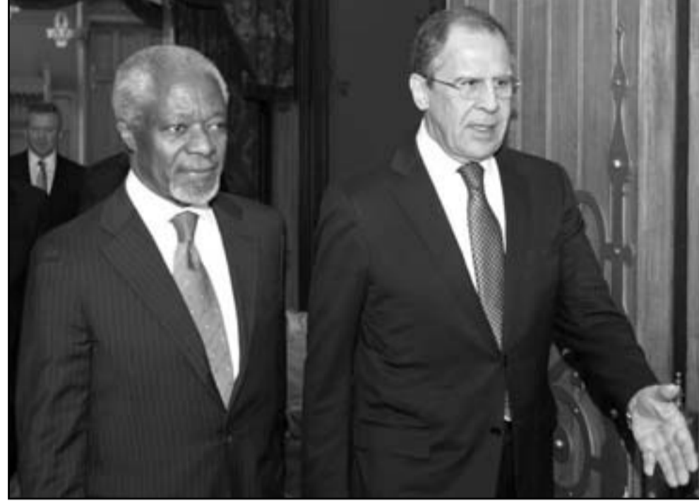
وزير الخارجية الروسي سيرغي لافروف لدى لقائه معوت الامم المتحدة كوفي عنان

دون ان تتخلى بالكامل عن نظام الاسد. ودبلوماسيا، صرح الامين العام لجامعة الدول العربية نيبيل العربي ان تحصي الرئيس السوري لن يتكون مطروحا خلال القمة العربية التي ستعقد في بغداد في 29 الشهر الحالي، موضحا ان القمة «ستبحث الموضوع السوري كيند اساسي في اطار القرارات التي صدرت من المجلس الوزاري لجامعة الدول العربية». وبدأ نائب وزير الشؤون الخارجية