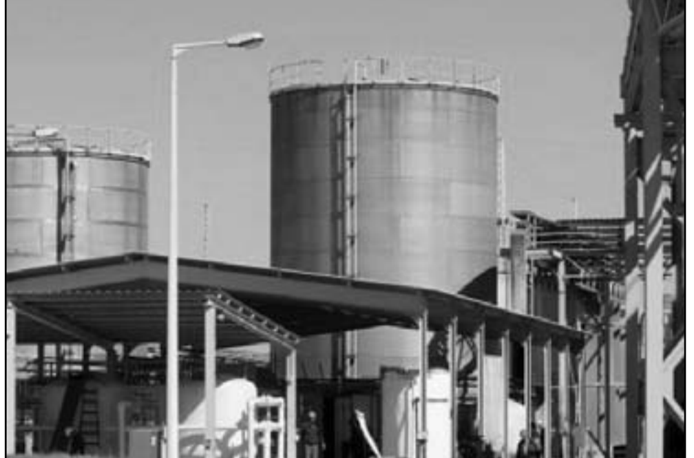
محطة توليد الكهرباء في غزة

عاد التوتر من جديد بين المسؤولين الفلسطينيين في الحكومة الفلسطينية في الضفة الغربية والحكومة المقالة في قطاع غزة، وتبادلوا الاتهامات بشأن عودة أزمة انقطاع التيار الكهربائي مجددا عن سبب توقف محطة توليد الكهرباء مجددا عن العمل، بعد نفاذ كمية من الوقود الصناعي جرى إدخالها الجمعة، وحمل كل منهما مسؤولية التأخر عن سبب الأزمة. وعادت يوم أمس أزمة انقطاع التيار الكهربائي مجددا، بعد أن أعلنت سلطة الطاقة عن وقف محطة التوليد عمليا بعد نفاذ كمية من الوقود الصناعي، كانت قد دخلت للمحطة من مصر بحرم أبو سالم الاسرائيلي يتوسط من مصر. وشعر السكان والمؤسسات الطبية والخدمات بالأزمة الجديدة، لعدم العمل بجداول الكهرباء القديم، الذي بموجبه يصل التيار للمناطق بواقع ست ساعات يوميا. وعلى مدار اليومين الماضيين تناسى السكان أزمة انقطاع التيار الكهربائي، بعد أن نعموا بتساعات توشيل قوود، جراء عودة المحطة بنصف طاقتها عن العمل، بكية القوود التي دخلت المحطة. وناشدت سلطة الطاقة جميع الأطراف باتخاذ الإجراءات الفورية لحل الأزمة القوود بشكل دائم ومتواصل، وحمله في ذلك الشغل والإطفاء للتمركز لمحطة التوليد بضرها من الناحية الفنية ويريد العمل في معداتها. وعمل الدكتور سليم فياض رئيس الحكومة الفلسطينية حركة حماس في قطاع غزة مسؤولة عودة الأزمة مجددا، وقال أن وفد حماس تخلف عن الحضور إلى العاصمة المصرية القاهرة في صلا، مقررًا بالاتفاق مع المسؤولين في مصر، لوضع الترتيبات الفنية بتحويل الحل المؤقت لموضوع قوود محطة توليد كهرباء