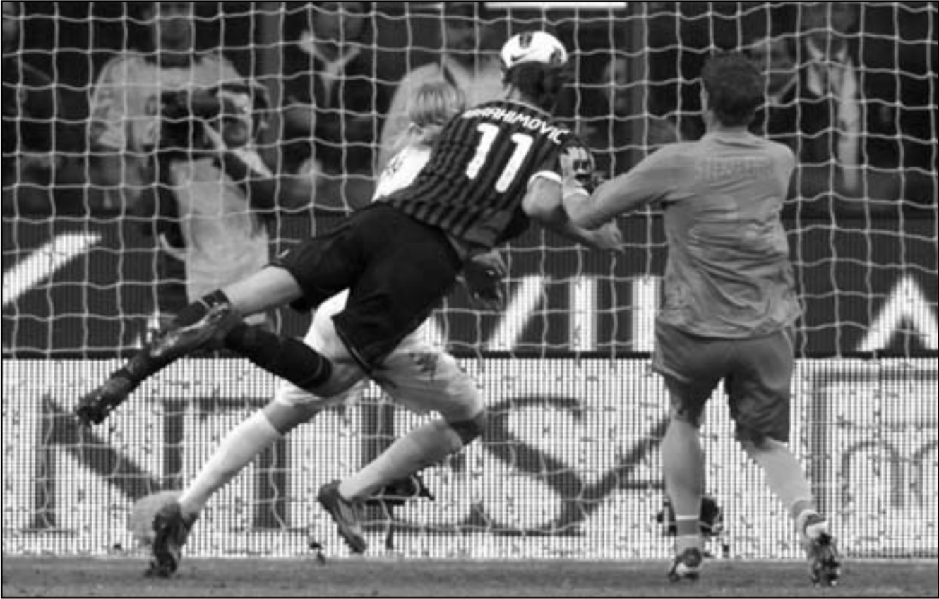
ابراهيموفيتش نجم ميلان (وسط) يسدد هدفا برأسه في مرمى روما

اللاعب تمريرة طويلة عالية ولعبها ساقطة (لوب) من فوق حارس المرمى الهولندي مارتن ستينكلنج. وسدد ميلان العديد من الكرات نحو مرمى روما في الشوط الأول ولكن هدف السبق كان من نصيب روما بعدما استغل أوسفالدو التسديدة التي أطلقها زميله دانييلي دي روسي وحولها إلى داخل شباك ميلان بعد دقيقتين من تسديدة ستيفان شعراوي نجم ميلان والتي ارتدت من القائم. واقتدت تسديدات شعراوي وإيمانوليسون وأبراهيموفيتش في الشوط الأول للكرة المطلوبة رغم سيطرة الفريق على مرمى روما. وكانت شباك ميلان تهتز للمرة الثانية في بداية الشوط الثاني بعد على مرمى روما. وختمت المباراة 1/1 هدفين على أوسفالدو كريستيان أنياني الذي حاول إبعاد إحدى الكرات ولكنه هبها إلى فرانثيسكو توتي نجم فريق روما. وأخطأ توتي في التعامل مع هذه الفرصة حيث اختار لعب الكرة ساقطة (لوب) بدلا من تسديدها بشكل مباشر وحاد في اتجاه المرمى. واحتسب الحكم ضربة جزاء لميلان في الدقيقة 33 إثر لسة يد سانجا على