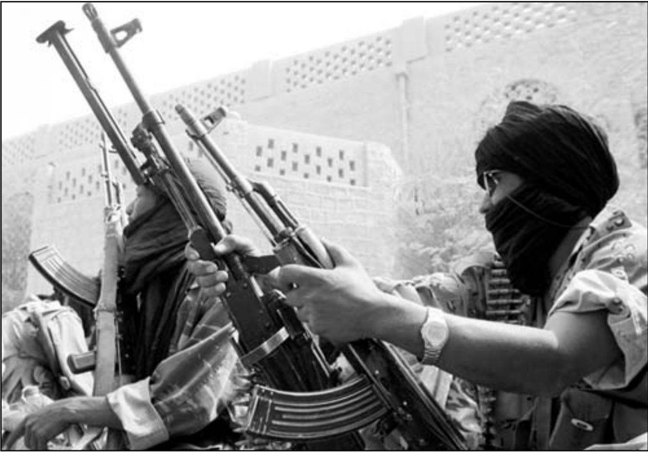
جنود ماليون خارج أسوار مدينة كيدال لحمايتها من المتمردين الطوارق

وفي اتصال هاتفي مع رئيس السنغال عبد الله واد، أكد سانوغو أن «الرئيس توري وعائلته في مكان آمن وتحت الحماية».