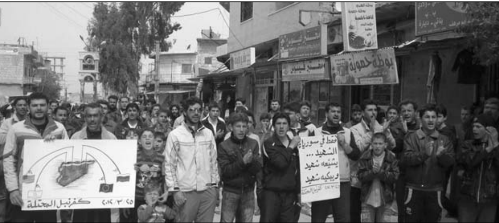
سوريون يتظاهرون في قرية كفرنبل قرب ادلب

محطة الزارة ومحطة محررة (ريف حماة) بالكامل بعد توقف تزويدها بالوقود بسبب التفجيرات الإرهابية التي استهدفت أنابيب تغذيتها وذلك بالقرب من مدينة الرست (ريف حمص)». وكتشف ان خط الغاز الذي يربط محطة توليد كهرباء الزارة بالغاز، واوضحت ان هذه العملية تمت «عبر تفجير عبوة ناسفة عند منطقة بئر الجوف الواقعة على بعد 50 كيلومترا شمال مدينة دير الزور ما أدى إلى تسرب نحو 700 ألف متر مكعب من الغاز». وكتشف ان خط الغاز الذي يربط محطة توليد كهرباء الزارة بالغاز، واوضحت ان هذه العملية تمت «عبر تفجير عبوة ناسفة عند منطقة بئر الجوف الواقعة على بعد 50 كيلومترا شمال مدينة دير الزور ما أدى إلى تسرب نحو 700 ألف متر مكعب من الغاز». وكتشف ان خط الغاز الذي يربط محطة توليد كهرباء الزارة بالغاز، واوضحت ان هذه العملية تمت «عبر تفجير عبوة ناسفة عند منطقة بئر الجوف الواقعة على بعد 50 كيلومترا شمال مدينة دير الزور ما أدى إلى تسرب نحو 700 ألف متر مكعب من الغاز».