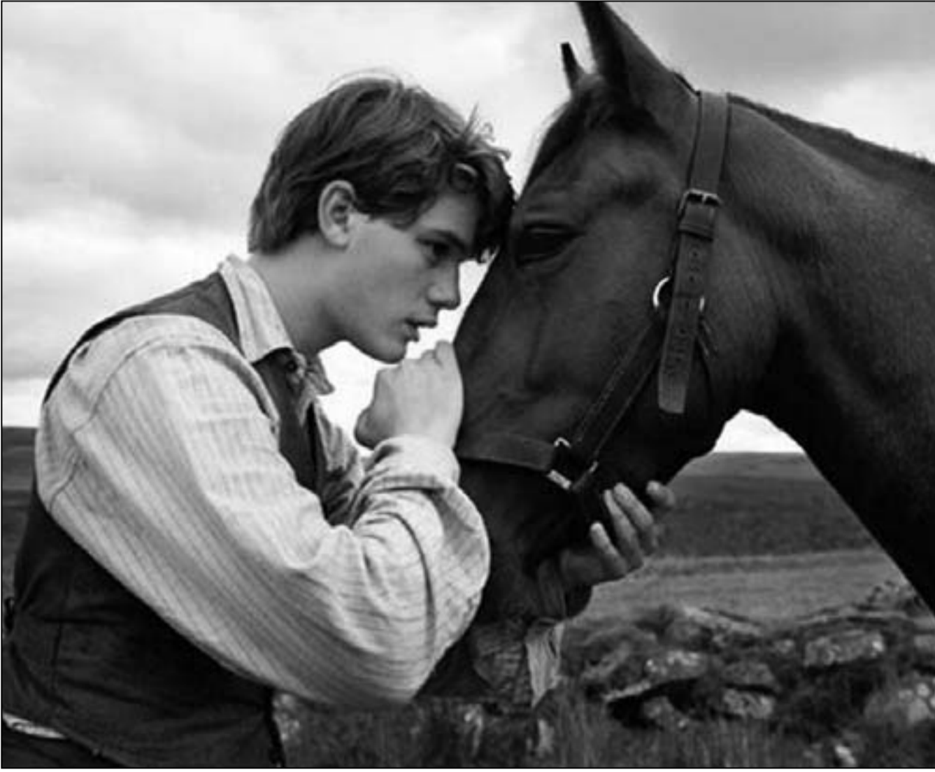
لقطة من فيلم «حصان حرب»

نجاح الحصان، وبشجاعة كبيرة، في الانفلات من معسكر العدو، وإمكانية الاعتماد عليه في الحرب من أجل تسوية ديونه التي يطالب بها صاحب المزرعة التي يكتريها، وهنا نشأت علاقة تواصل مثيرة بين الياق «البير» والحصان «جوي»، بفضلها تم إنقاذ الحصان البري من أطراف الحرب، والحوار الذي دار بينهما أكيد له معنى واحد: عبثية الحرب مقابل السلم المتصل غريزيا بين بني البشر.