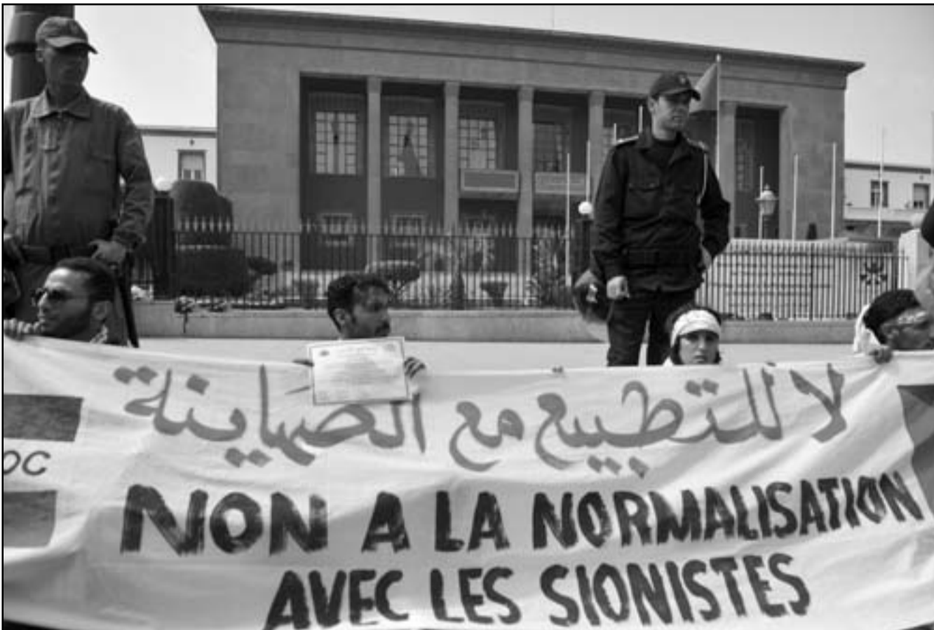
محتجون مغاربة يرفعون لافتات تدعو لنصرة القدس في الرباط