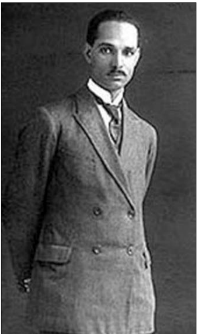
عبد الوهاب عزام

أما في مجال الجديد في الأدب لا سيما في الشعر - فكان عزام كان شاعراً - فقد قال: الشاعر العجمي هو الذي يسير على طفرته لتفسه نيلها عنها لا