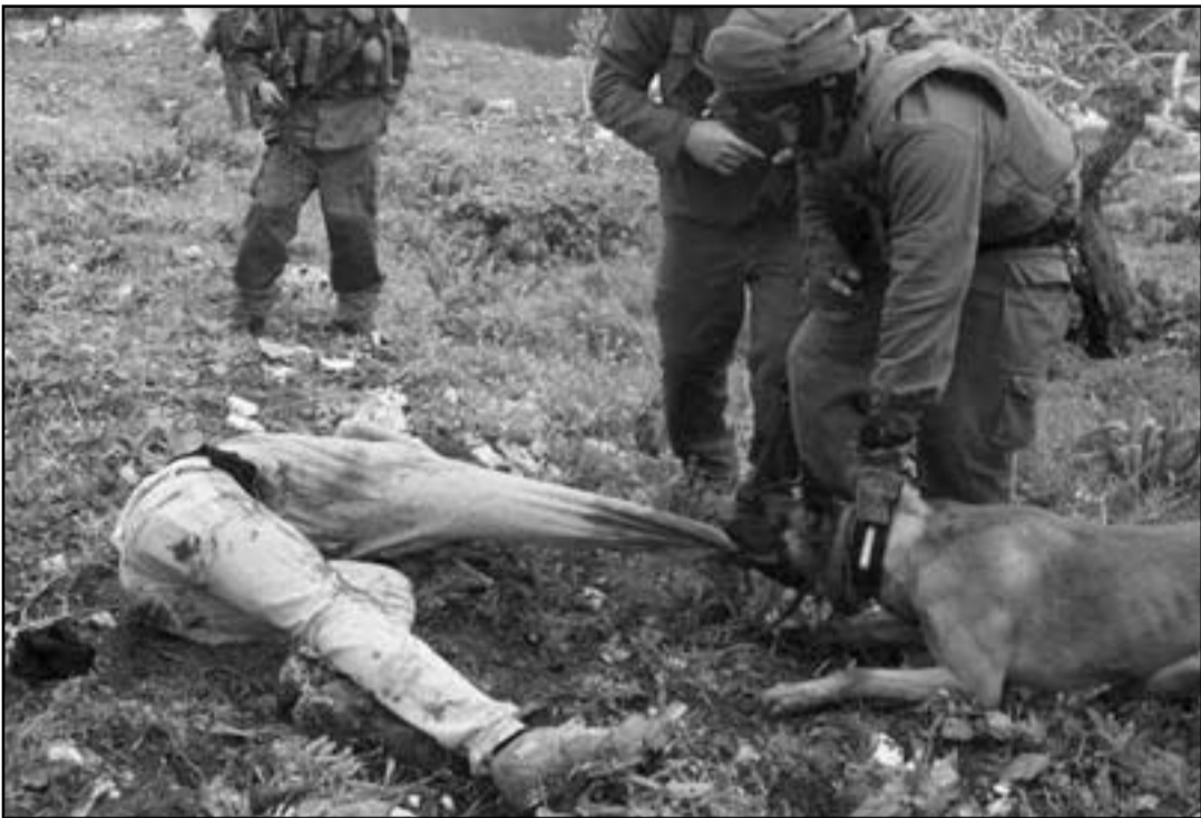
الاسرائيليون لا تزهيم الممارسات العنصرية بحق العرب

عنصرية. فمن يصمت الآن عن المالمه سيحصد ايضا على تولوز في القدس؛ اليوم بالعصي وغدا بالبنادق. لا يصعب ان نتخيل ماذا كان سيحدث لو ان ماضي من الفرنسيين داهمو امجعا تجاريا في تولوز وضربوا عماله اليهود؛ كانت اسرايل والجماعة اليهودية ستقيمان