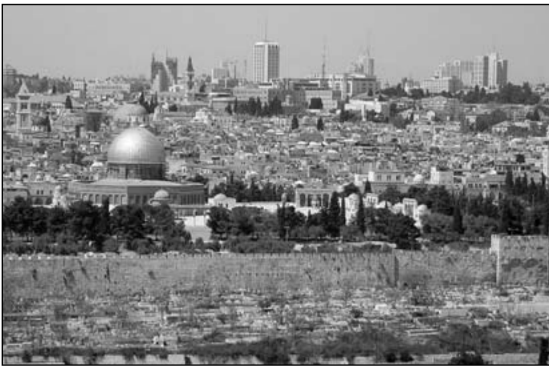
اسرايل دفعت المسيرة السلمية الى الجحيم

والانصراف. هذا، على الاقل، ما يهدد بعمله الان.