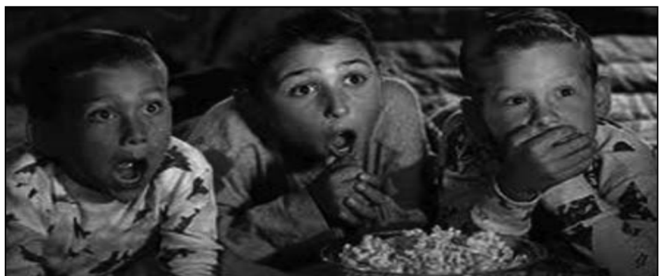
لقطة من فيلم «الساحرة الصغيرة»