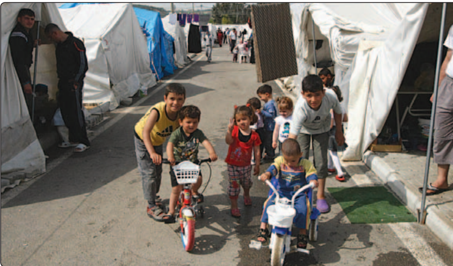
اطفال سوريون يلعبون بمحيط للاجئين في تركيا

ينابى يختار فيها الشعب من يمثله ومن يحكمه عبر صناديق الاقتراع في انتخابات حرة زبئية شفافة». كما طالبت الوثيقة بقيام «دولة مواطنة ومساواة يتساوى فيها المواطنون جميعا على اختلاف اعرافهم واديانهم ومذاهبهم واتجاهاتهم تقوم على مبدأ المواطنة ويحق لاي مواطن فيها الوصول الى اعلى المناصب... جاء ذلك فيما أعلنت هيئة التنسيق الوطنية لقوى التغيير الديمقراطي في سورية رفضها المشاركة بمؤتمر المعارضة المزمع عقده في اسطنبول اليوم الاثنين تحت عنوان «توحيد المعارضة السورية». ورأت الهيئة في بيان لها وصلت لـ«القدس العربي» نسخة منه «أن تحويل جهات غير سورية نفسها حق اختيار من يمثل المعارضة السورية في هذا المؤتمر أو في غيره، وأن تدعوهم بعد هذا للمشاركة في مؤتمر تحدد هدفه السياسي مسبقا في (الوصول إلى رؤية موحدة تتوافق مع ما يذهب إليه المجلس الوطني السوري) أمر لها لا يتناغم مع أسبسط الأصول الواجبة المراجعة ومع أبسط مبادئ الديمقراطية فحسب، وانما يعبر عن الوقت نفسه عن مسعى للوصاية السياسية على المعارضة السورية، وحشرها تحت سقف خيارات معينة لن يكون مستغربا أن تنسج مع رؤى ومصالح الجهات الداعية، أكثر مما تنسج مع رؤى والمصالح السورية الراهنة والمستقبلية التي تعبر عنها قوى الشعب الناظر والمعارضة الديمقراطية في الداخل السوري».