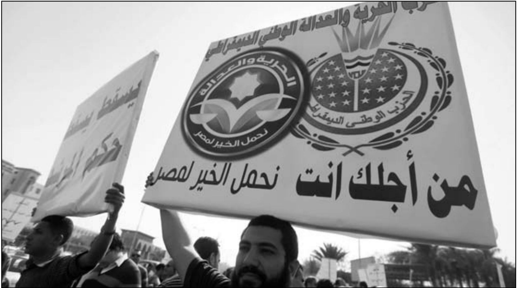
مظاهرة ضد حزب الحرية والعدالة في القاهرة أمس

الدستور الذي سيحدد السلطة التي تحكم البلاد بعدما يسلم المجلس العسكري الحاكم السلطة للمدنيين. وسيكون أمام الجمعية المؤلفة من 100 عضو ستة أشهر لكتابة دستور مما سيجعل من المستبعد الانتهاء من المهمة قبل أن تجري انتخابات في مايو أيار لاختيار خليفة لمبارك. وتعدد المجلس الأعلى للقوات المسلحة الذي يدير الأمور في مصر حالياً بتسليم السلطة للمدنيين يوم أول يوليو تموز بمجرد تولي الرئيس الجديد المنصب. ومن المتوقع أن يحدد الدستور الجديد ميزان القوى بين البرلمان والرئيس ودور الشريعة الإسلامية في التشريع والمجتمع والدور السياسي للجيش. وتذكرت وسائل الإعلام محلية إن ستة مقاعد ذهبت للنساء كما ذهبت ستة مقاعد أخرى للمسيحيين الذين يمثلون حوالي عشرة في المئة من سكان مصر الذين يتجاوز عددهم 80 مليون نسمة. (رويترز)