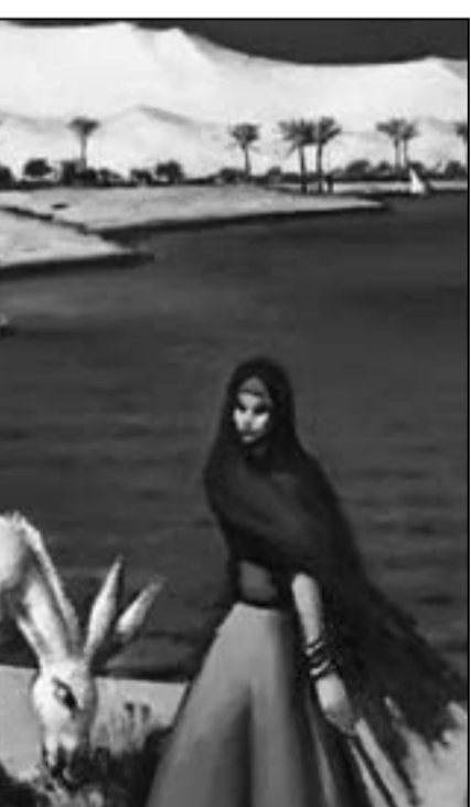
لوحة «معرض مطروح - قرب حمامات كليوباترا»، 1959 (محمود سعيد - مصري، 1964-1897)

واختتم المعرض الذي تكلف عشرة ملايين يورو فعالياته الأحد في حضور كورنيلا بيير وزيرة الدولة في الخارجية الألمانية. ويعد هذا المعرض هو أكبر مشروع ثقافي تقيمه ألمانيا في الصين حتى الآن ووصل عدد زواره طبقاً لإحصائية القائمين على تنظيمه إلى 450 ألف شخص.