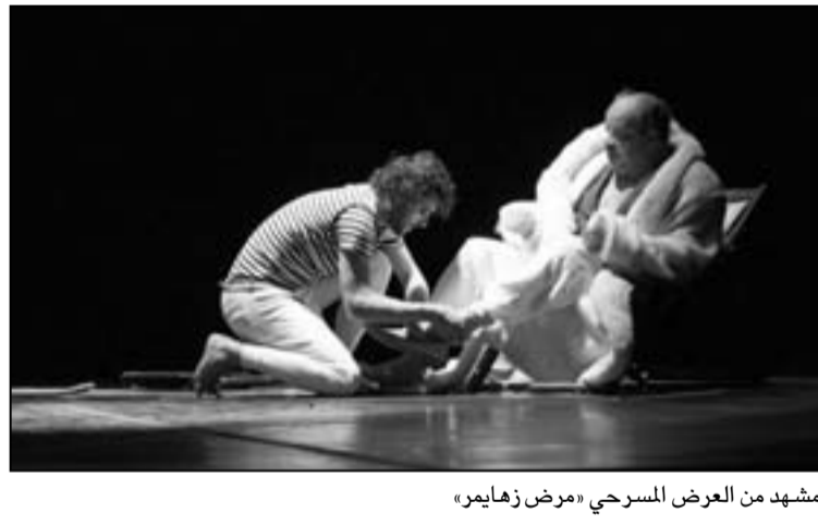
مشهد من العرض المسرحي «مرض زهايمر»