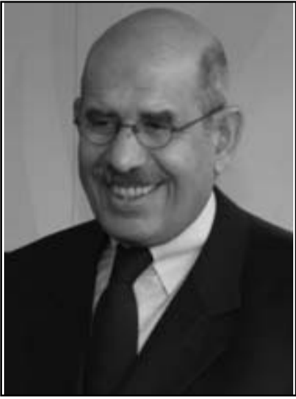
محمد البرادعي المدير العام السابق للوكالة الدولية

تفغذه القوات البحرية بتشكيلات من الاسطول الشرقي مع تشكيلات من الاسطول الخامس الأمريكي، تشمل السفن والطائرات ومشاة البحرية ووحدات الأمن البحرية الخاصة بتسائدها طائرات من القوات الجوية السعودية.