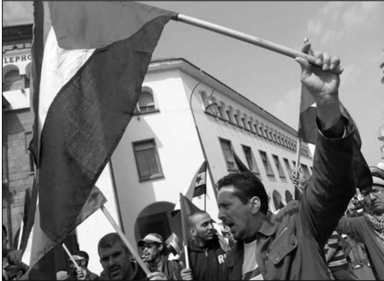
مغاربة يرفعون العلم الفلسطيني في مظاهرة «دعم القدس» في الرباط

وأشارت الصحفية إلى مشاركة ممثل إسرائيلي في الجلسة البرلمانية الثامنة للتعاون بين دول البحر المتوسط، أو ما اصطلح على تسميته به «الشراكة الأوروبية ومتوسطية»، والتي افتتحت في العاصمة المغربية، الأمر الذي أثار الكثير من الانتقادات الشعبية والتنديد بمشاركة إسرائيل، ودفع كتلة حزب «العدالة والتنمية»، الذي فاز بأغلبية المقاعد في الانتخابات الأخيرة، إلى مقاطعة الجلسة.