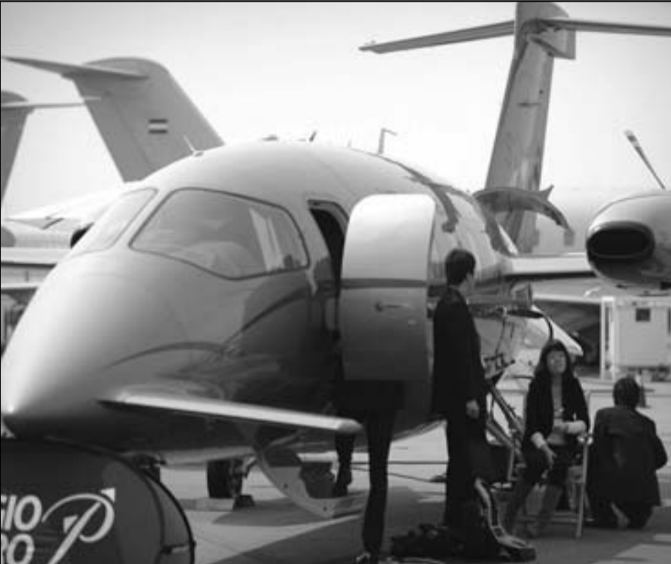
طائرة خاصة برجال الأعمال بين المعارضات في معرض طيران شنغهاي

داسو القول إن الصين تفوقت على الولايات المتحدة وأوروبا، حيث كانت أكبر سوق طائرات من حيث المبيعات العام الماضي. يذكر أن داسو واحدة من عدد قليل من شركات الصناعات الجوية التي تشترك في معرض شنغهاي لمدة خمس سنوات على التوالي من 2012 إلى 2016. يذكر أن الصين تشهد ازدهاراً كبيراً في سوق الطائرات الخاصة خلال السنوات القليلة الماضية حيث ارتفع عدد الطائرات الخاصة التي تم تسجيلها في البلاد العام الماضي إلى 132 طائرة مقابل 32 طائرة عام 2008.