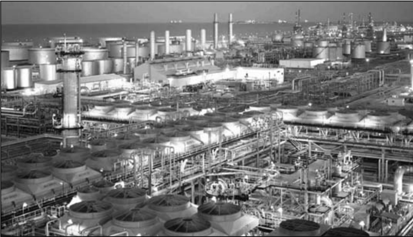
مشهد عام لصفاء الزاوية الليبية

المستهدف. وأضاف «لا تزال هناك بعض المشاكل. شركات الخدمات النفطية لم تعد بعد إلى نشاطها الكامل بعضها بسبب الأيدي العاملة والبيض لأسباب أخرى بخصوص الإدارة. حاولنا أن نساعد في حل المشاكل التي يواجهونها وبالأخص مشكلة الأيدي العاملة».