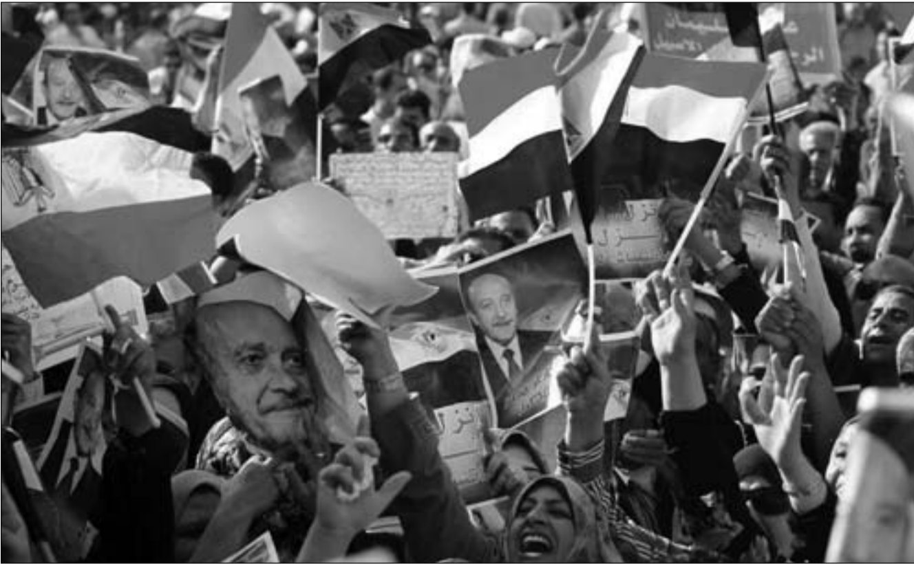
انصار عمر سليمان بميدان العباسية في القاهرة

الجمهورية ، وجاء نص البيان «الإخوة والأخوات من أبناء مصر الغالية، لقد هزنتي وفتكتكم القوية وإصرارك على تغيير الأمر الواقع بأيديكم، إن النداء الذي وجهتموه لى أمر وأنا جندى لم أعص أمراً طوال حياتي، فإذا ما كان هذا الأمر من الشعب المؤمن بوطنه لا أستطيع إلا أن ألبى هذا النداء، وأشارك في الترشح، رغم ما أوضحتكم لكم في بياني السابق من معوقات وصعوبات» . وكان المئات قد توافدوا أمام مقر أكاديمية الشرطة القديم بالعباسية استعداداً للخروج في مسيرة حاشدة إلى مقر إقامة رئيس المخابرات السابق اللواء عمر سليمان لمطالبة بالترشح في انتخابات الرئاسة .