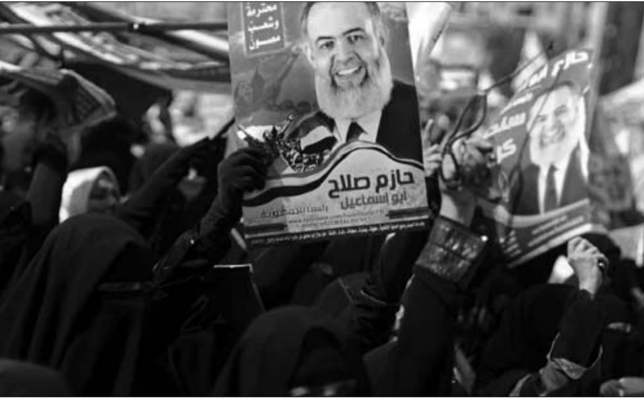
انصار حازم صلاح أبو إسماعيل بميدان التحرير في القاهرة

الدعوة في الانتخابات الرئاسية المقبلة . وفي نفس السياق ، قامت حملة أبو إسماعيل بدعوة أهالي مطروح للمشاركة في مسيرة حاشدة تنظمها الحملة ستنطلق عقب صلاة العشاء من أمام مقر الحملة بشارع الإسكندرية لتأييد ومناصرته في ترشحه للانتخابات الرئاسية . وفي محافظة شمال سيناء ، نظمت بعض القوى والسياسيات بالإشتراك مع بعض ائتلافات ، ولجان الثورة وقفة احتجاجية أمام المسجد الرفاعي بوسط مدينة العريش عقب صلاة الجمعة ، وذلك لتأييد ترشيح حازم صلاح أبو إسماعيل رئيسا للجمهورية ، وللتدبير بمنع ترشيحه واستبعاده على خلفية ما أثير حول جنسية والدته الأمريكية .