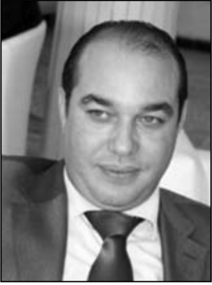
محمد أوزين وزير الشباب والرياضة