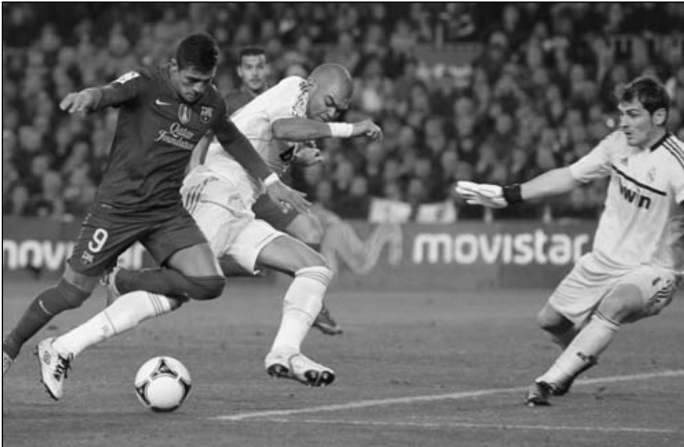
الكبس نجم برشلونة (يسار) يتغذى بالكرة خلال منافسة مع نجمي ريال مدريد بيبي وحارس المرمى ايكير كاسيلاس في مباراة الكلاسيكو

نقى اسبانيا القبرصي وتغلب عليه 2/5 اياها ليفوز 2/8 في مجموع المباراتين. ومن بين الأندية الأسبانية التي شاركت في بطولتي الأندية الأوروبية هذا الموسم، كان فياريال هو صاحب الإحراق الأبرز حيث احتل المركز الأخير في مجموعته بالدور الأول لدوري أبطال.