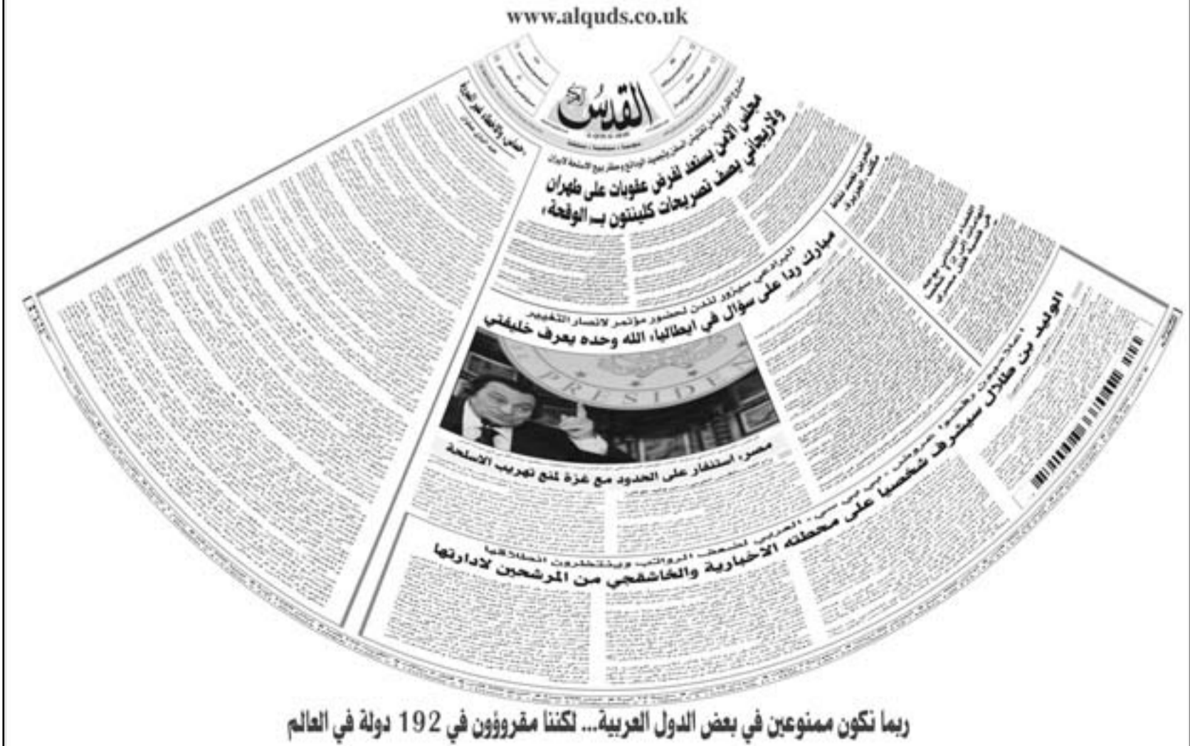
ربما تكون ممنوعين في بعض الدول العربية... لكننا مقررؤون في 192 دولة في العالم