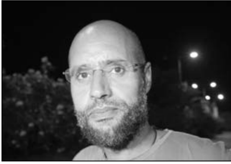
سيف الاسلام القذافي

■ الجزائر - ف ب: دعا جنرال سابق في الجيش الجزائري بلاده الى فرض «قوتها» في منطقة الساحل الافريقي وخاصة بعد التطورات في ازمة مالي، وموضحا ان الجزائر «لا يمكن ان تبقى صامتة» ازاء ما يجري على حدودها الجنوبية. وقال الجنرال محمد بن يعلى قائد القوات البحرية الجزائرية بين 2002 و2005 في مقابلة مع صحيفة «الوطن» نشرت الجمعة «لا يمكن للجزائر ان تبقى صامتة ازاء ما يجري على حدودنا الجنوبية». واضاف «يجب ان يكون لبلدنا رد فعل قويا (من خلال) فرض نفسه كقوة جوية وليس مشاهدة الاحداث وتطوراتها دون ادنى تحرك». واوضح ان الجزائر يجب تلعب دور «الوسيط الجوي بين المتنازعين وفرض لائتماماتها، وهذا ما يجب ان نفعله في مالي بالنظر الى التطورات الخطيرة» وقال «اما ان نهاجم أو نخسر». وحفظ اسلاميون مسلحون قنصل الجزائر في غاو شمال شرق مالي وستة خمسين واقتيدوا الى جهة غير معروفة. ودانت الجزائر حلف دبلوماسيها واعلنت تشكيل خلية ازمة لتابعة تطور القضية وضمان عودة المخطوفين سائين. وقال وزير الخارجية مراد مدلسي ان «الحكومة الجزائرية مستفزة لتأمين الافراد عنهم في اسرع وقت». ودعت الحكومة الجزائرية الاثنى عشر من دول «فورية» الى الشرعية الدستورية في مالي، وجددت تمسكها بالوحدة الوطنية والوحدة الترابية لهذا البلد. واوضحت الحكومة الجزائرية في بيان نشرته وكالة الانباء الجزائرية ان «الجزائر التي تبقى متمسكة بالوحدة الوطنية والوحدة الترابية مالي وحريصة على استقرار المنطقة (...) تدعو الى عودة فورية الى الشرعية الدستورية التي تستمك من مباشرة حوار بين المائتين».