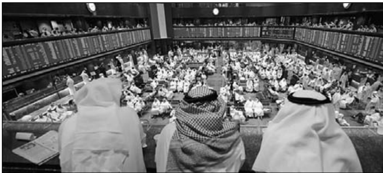
قاعة التعاملات في البورصة الكويتية

وتوقع الطراح أن يشهد سهم زين تذبذبا يميل للارتفاع خلال الاسبوع المقبل. وقال المتكلم إنه لا يوجد سبب واضح لهبوط سهم زين مرجحا أن يكون هناك مساهمون يقومون بعمليات تخارج من السهم «الأسباب تخصهم ولا تتعلق بشركة زين».