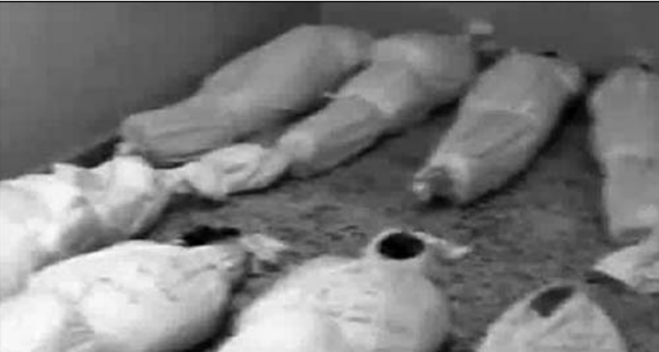
جثث القتلى جاهزة للدفن في منطقة الخالدية بعد ان شهدت المنطقة اشتباكات عنيفة مع قوات الامن

وفي محافظة الحسكة (شمال شرق) ذات الغالبية الكردية خرجت تظاهرات حاشدة رفعت فيها الاعلام الكردية والاعلام السورية قبل حزب البعث. ورد المتظاهرون هتافات تطالب بحل الرئيس السوري، بحسب ما اظهرت مقاطع بثت على الانترنت.