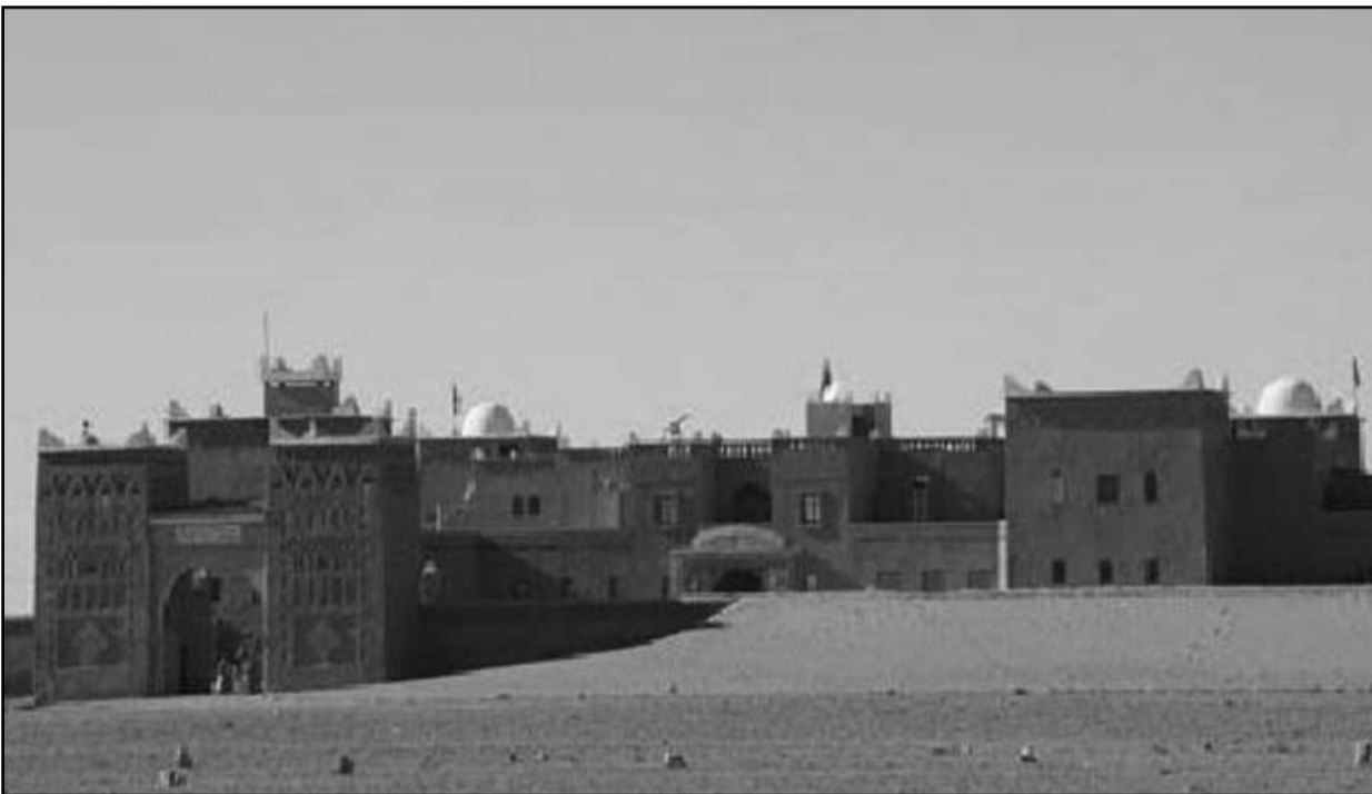
جانب من قصبة زاكورة تم تحويله إلى فندق سياحي