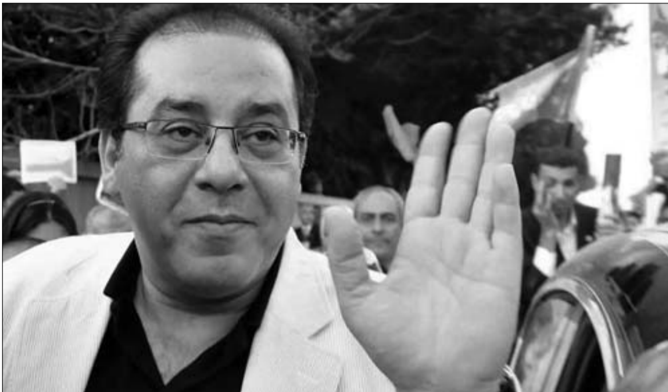
أيمن نور أمام لجنة الانتخابات الجمعة

المصرية المشير حسين طنطاوي أصدر ، أواخر مارس/ آذار الماضي ، قراراً جمهورياً يُعيد لنور اعتباره ويزيل الآثار المترتبة على حكم بسجنه خمس سنوات في قضية تزوير عام 2005، وبما يمكنه من ممارسة حقوقه السياسية ومن بينها الترشح للانتخابات الرئاسية .