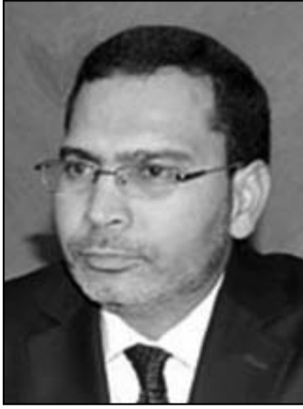
مصطفى الخلفي وزير الاتصال

وشدد الخلفي على أهمية الاستفادة من التحولات ومن المشهد السياسي الإقليمي. بهدف تعزيز التعاون والمبادلات الإقليمية ومواجهة تأثير الأزمة والركود الاقتصادي الذي يؤثر على شركاء الغرب التقليديين.