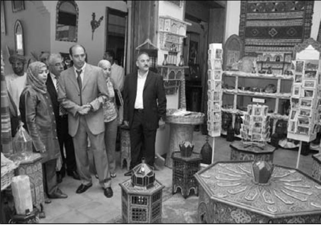
مسؤولون حكوميون ومحليون مغاربة يزورون متجرا للسلع الحرفية في مراكش