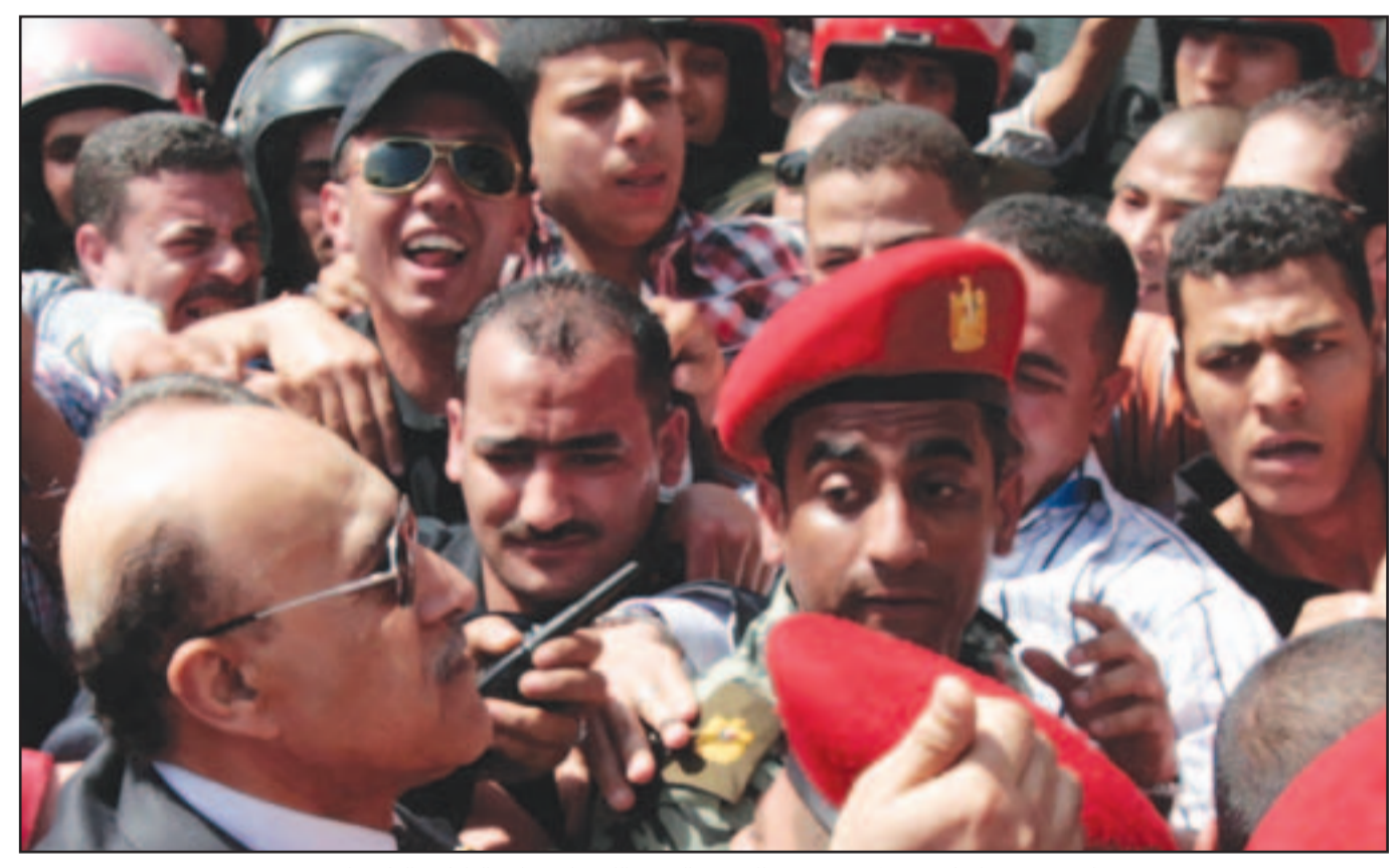
المرشح عمر سليمان يشق طريقه بصعوبة للوصول الى مقر اللجنة الانتخابية العليا في القاهرة امس