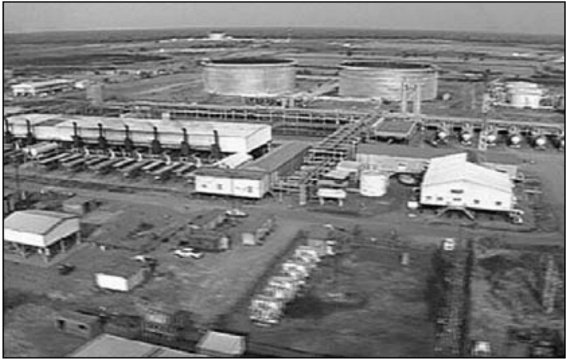
منشأة نفطية في جنوب السودان

جوبا السيطرة على حصص الخرطوم في اتحادات الشركات العاملة في الجنوب. وعرضت شريحة قدرها 2.6 مليار دولار على مدى ثلاث سنوات، شريطة أن يدفع السودان ثمن النفط الذي صادره، ويحمل غرامات التأخير للشركات الشحن، ويتراجع عن رسوم النقل والمعالجة التي يطلب بها. وفي السابق عرضت جوبا شط 2.8 مليار دولار من 5.8 مليار دولار تصفها بأنها متاخرات مستحقة على الخرطوم تتعلق بالنفط وتقسيم البلاد. وفي أعقاب تحسن كبير لاجواء بين البلدين عبر كبير مفاوضي الجنوب باقان ابوم عن أهله في التوصل لاتفاق شامل بشأن النفط والموضعات العالقة الأخرى خلال شهر أو اثنين، لكن من المرجح أن يتأخر الدوول بسبب أحداث عنف في الإلوة الأخيرة.