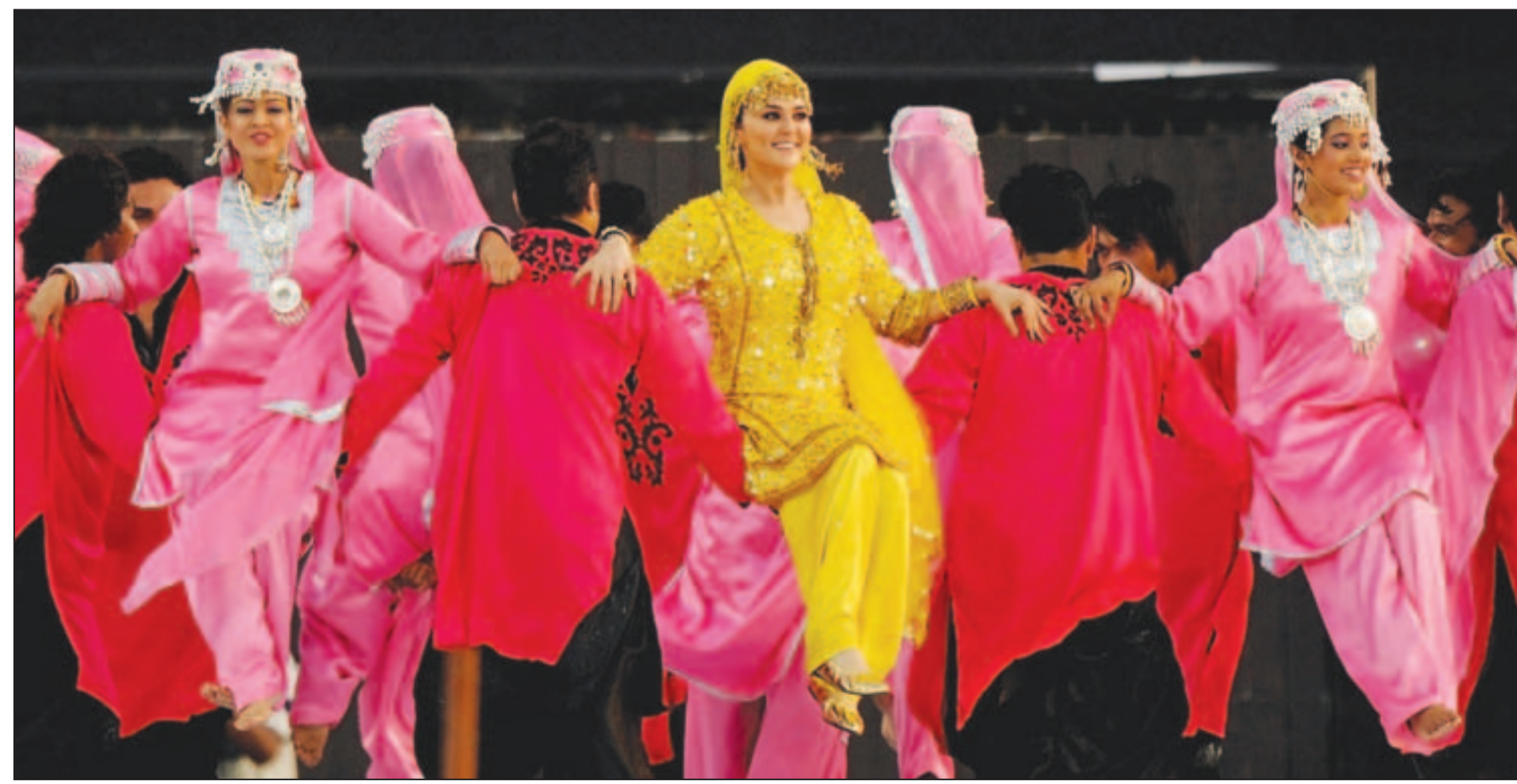
نجمة السينما الهندية بريتي زينتا تتوسط مجموعة من الراقصين والراقصات في ستاد «صوبراتا روي صاهارا» ببلدة بيون خلال الفاصل بين شوطي مباراة الكريكيت التي أقيمت هناك أمس

حسن أوريد الفكر الروائي المغربي يقدم ويوقع يوم الجمعة القادم بمدينة العراش روايته «الموريسكي» الصادرة عن دار «أبي قرقا» ويشارك في التقديم الشاعر والإعلامي إدريس علوش، والشاعر والباحث محمد العنانز. كما تقدم الرواية في مدينة شفشاون يوم السبت القادم في لقاء تنظمه وزارة الثقافة والجمعية المغربية للثقافة الأندلسية.