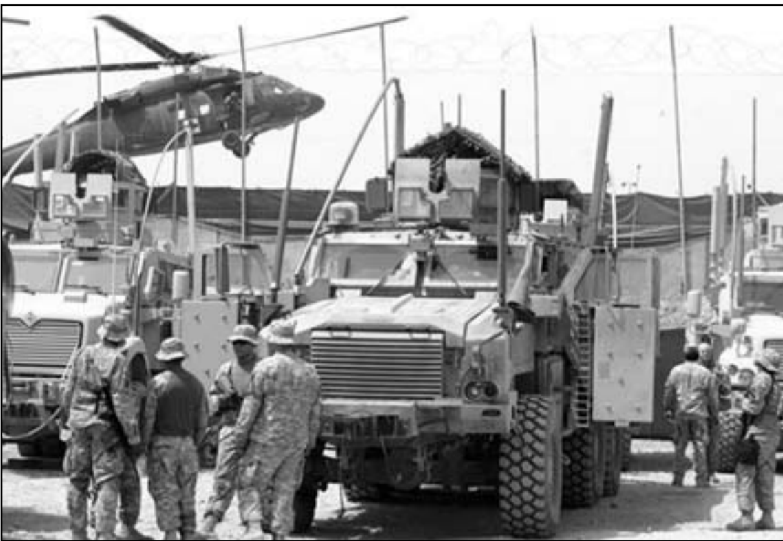
الانسحاب الامريكاني من العراق سمح لايران بالسيطرة عليه

هو طريقة الولايات المتحدة التقليدية لانشاء علاقة لايمانية لأمريكا بين هيمنة الضباط العليا للجيش العربي، وفي وقت مبكر من هذا العام وصل طيارون عراقيون في قاعدة سلاح الجو الامريكي في توسون في اريزونا كي يبدأوا دراسة كيف يستعملون طائرات اف16 وهم ينشئون علاقات بمرشديهم الامريكين. واليوم في مصر، مع صعود الاخوان المسلمين، ساعد الوقت الذي انتقلته الولايات المتحدة على تعليم الجيش المصري وتسلحه وتدريبه، بلا شك، في الحفاظ على التوجه الغربي هناك.