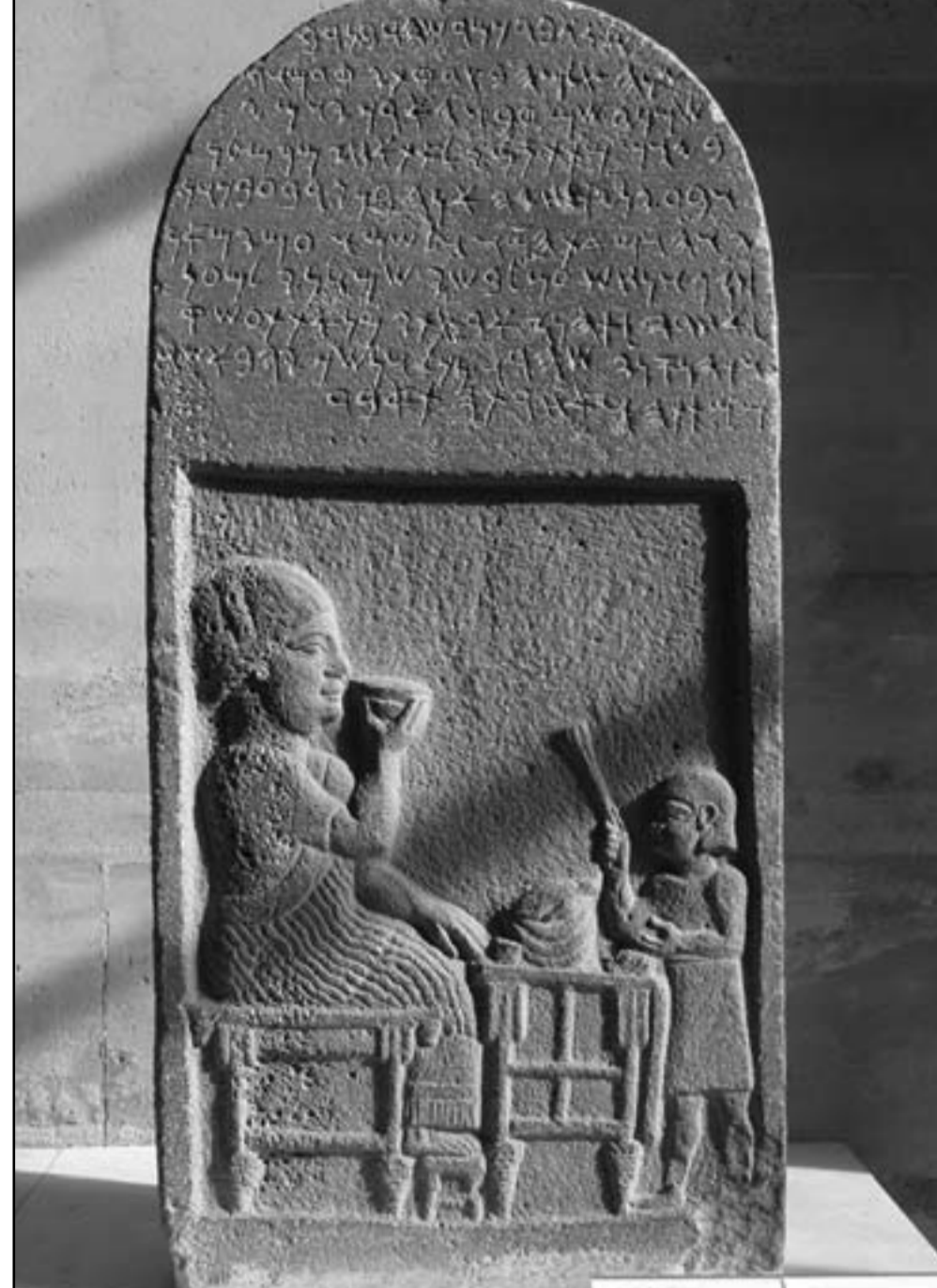
أعرب /لسان العرب.

كبريت، جبريت = في الأكدية كبريتو، وفي العربية ورد ذكرها في تفسير ابن كثير (قوله تعالى: وقد ذاب الناس والحجارة قال: هي حجارة من كبريت...).