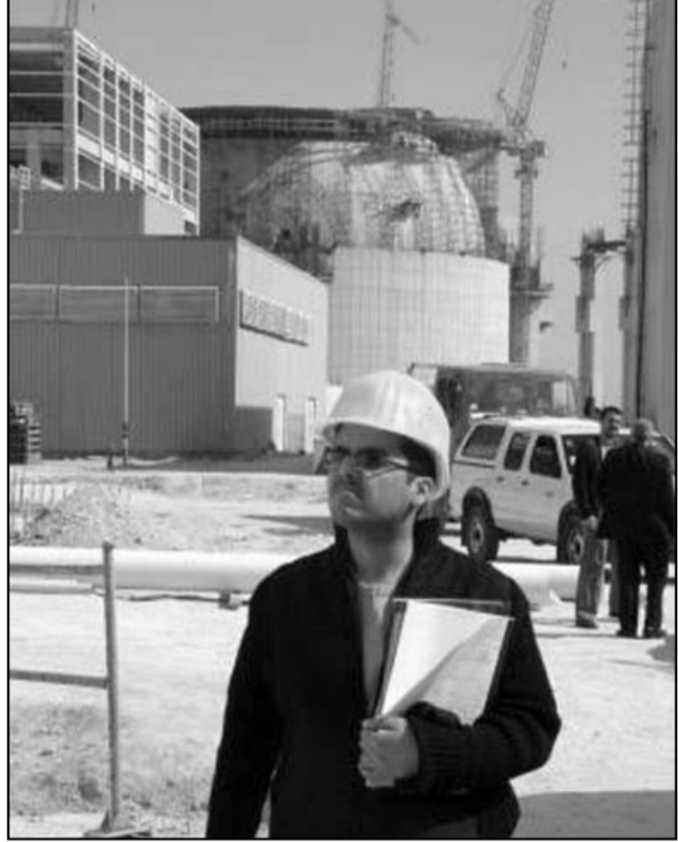
اسرائيل تثق بقدرتها على ضرب المفاعلات النووية الايرانية