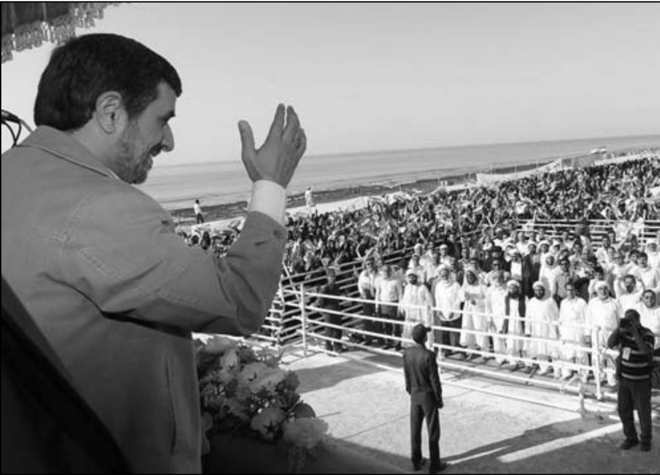
الرئيس الإيراني أحمدى نجاد يحيي الجماهير خلال زيارته لجزيرة أبو موسى

دعوه إلى مواصلة المفاوضات بينها والسداسية الدولية... وأشار إلى وجوب تعاون إيران مع الوكالة الدولية للطاقة الذرية، مشدداً على أن منظمة معاهدة الأمن الجماعي تنظر في احتمال اتخاذ الإجراءات الضرورية في حال تقادم الوضع. ويبدو، قال مندوب روسيا في المنظمة إيغور ليماكين فرولوف، إن المنظمة «تراقب الوضع حول الملف الإيراني وتدعو إلى عدم القيام بخطوات إستراتيجية»، مضيفاً «لا أحد يرغب في سيناريو استخدام القوة».