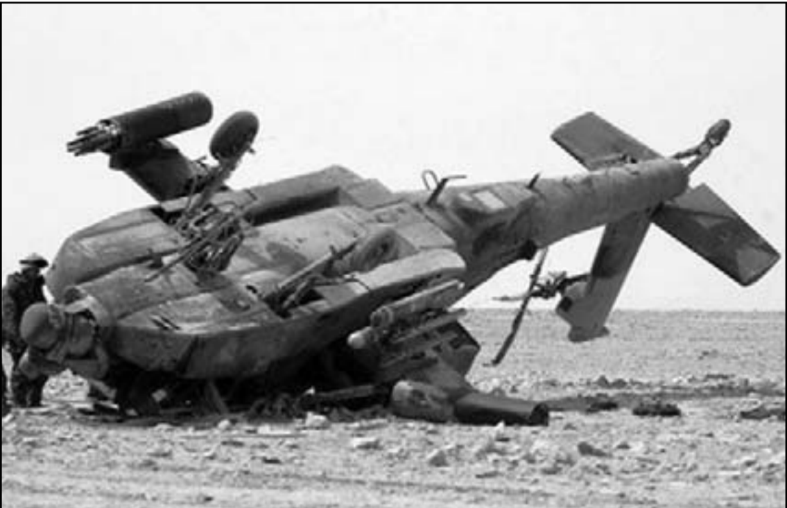
المروحية التي تحطمت خلال المناورات العسكرية المغربية وقوات المارينز في طانطان

العودة الأخيرة فانه من الصعب في الوقت القضايا أحد قادة الحزب الذي ينتمي إليه الرصيد قبل أن يصدر رسمه عفو ملكي تحت ضغط الشارع المغربي في إطار ما سمي بحراك الشارع المغربي. واكد الرصيد أن أي برنامج للحكومة يلج على محاربة الفساد وضرورة ربط المسؤولية بالمحاسبة، واصبح من واجب وزارة العدل العمل على تجسيد وتنفيذ هذا الشارع، مستندا على أن «أحد مهام القضاء الأساسية هو ردع كل المتلاعبين بالمال العام»، مشيرا إلى صدور التقرير السنوي للنسب الألية للمسئوليات قبل أيام، والذي تضمن وجود بعض الخروقات والاختلالات في تدبير بعض المؤسسات تشكيبها من أجل النظر والبحث في الخروقات التي تخالف القانون الجنائي بغية إحالتها لحقا على النيابة العامة.» وقال الرصيد أن مسألة زواج القاصرات «ترتبط أساسا بوعي الناس ومسنوهم الثقافي» و«وزارته وحدها غير قادرة على تحريك الملف بشكل إيجابي إلى بمشاركة كل مكونات المجتمع المغربي بما في ذلك المجتمع المدني والقضاة، بل يجب العمل من أجل تكييف عمليات التحسيس والتوعية على مختلف المستويات أيضا.»