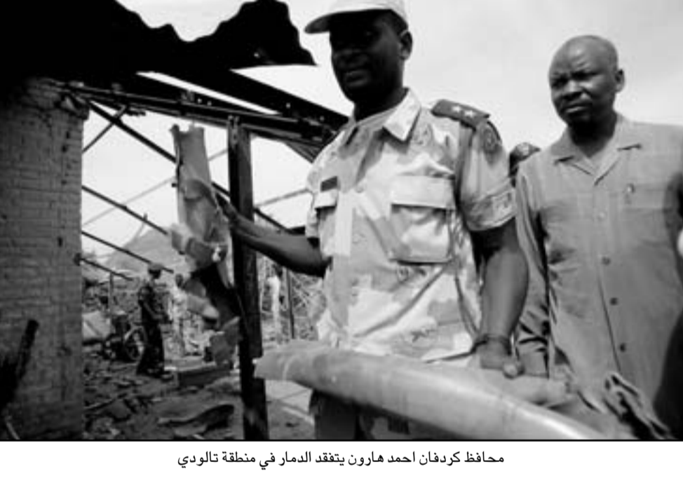
محافظ كردفان احمد هارون يتفقد الدمار في منطقة تالودي