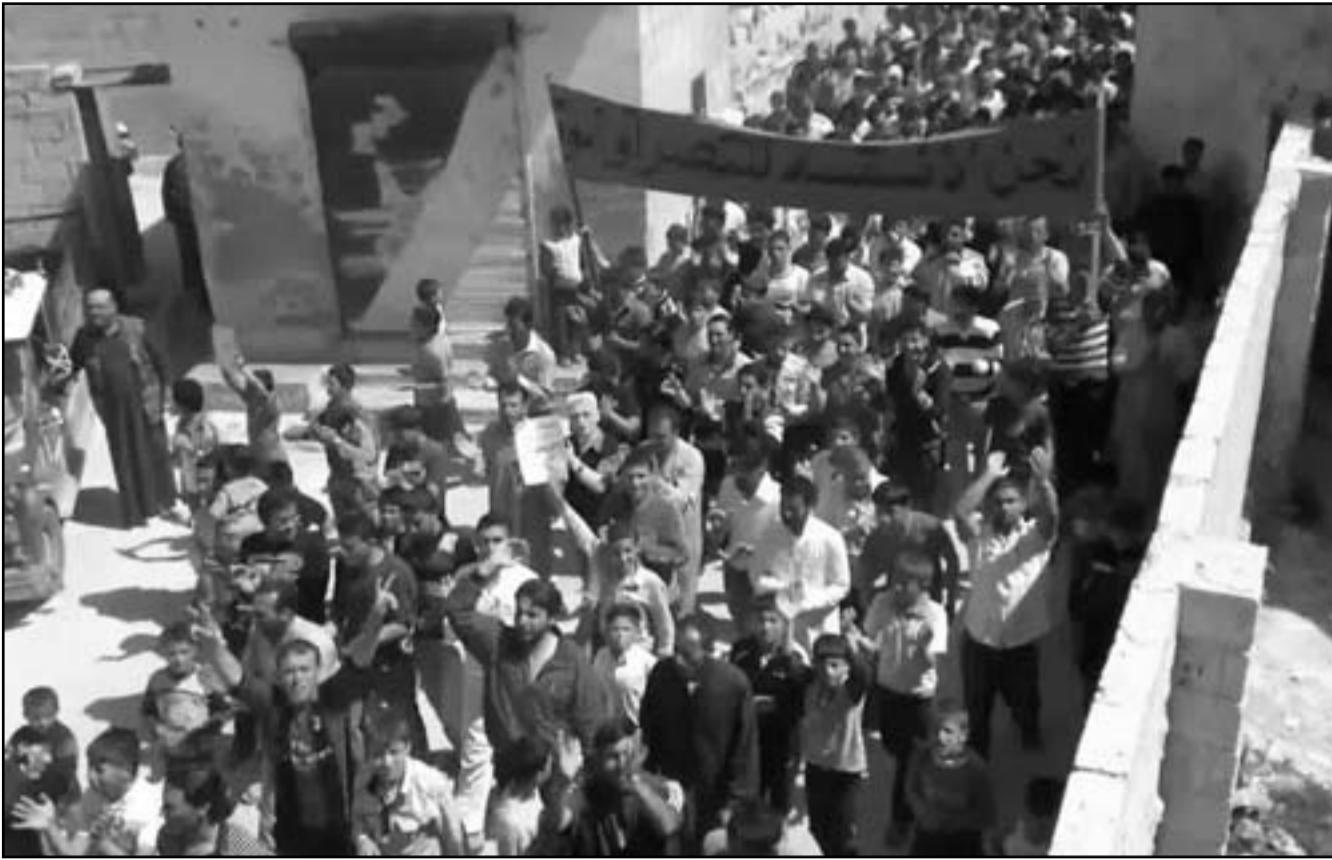
استمرار التظاهرات ضد الاسد في ريف ادلب

ونقلت الصحفية عن مواطنين في المدينة عاين الدمار قوله ان مبادرة عنان مئة من الاصل وان النظام ظل يقصف المدينة حتى ساعات قصيرة من موعد اطلاق النار. وتبدو المباني في جورة الشياح، احد احياء حمص وقد انهارت اجزاء منها، فيما تنتثر الحجارة والانقاض في الشوارع الفارغة من السكان. وفي صورة اخرى تبدو البيوت وعليها آثار زخات الرصاص.