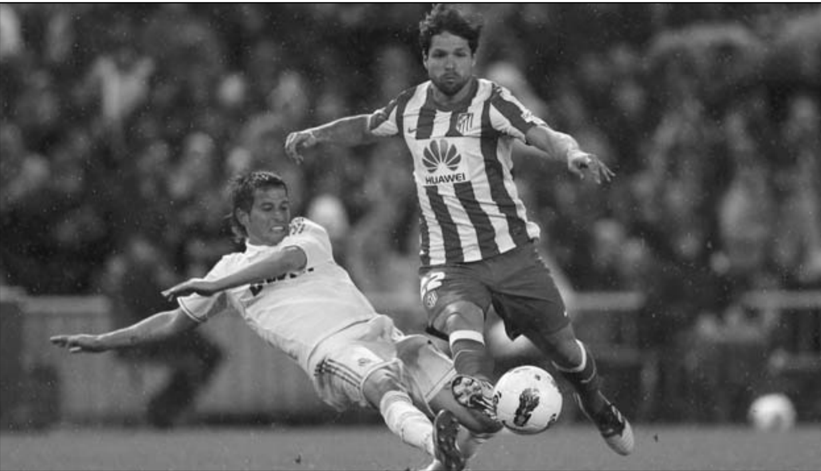
دييجو ريباس نجم اتلتيكو مدريد (يمين) في منافسة على الكرة مع فاييو كوينتراو نجم ريال مدريد

■ مدريد- رويترز: استعاد ريال مدريد فارق النقاط الأربع التي يتفوق بها على غريمه برشلونة في صدارة دوري الدرجة الأولى الإسباني لكرة القدم بعدما سجل