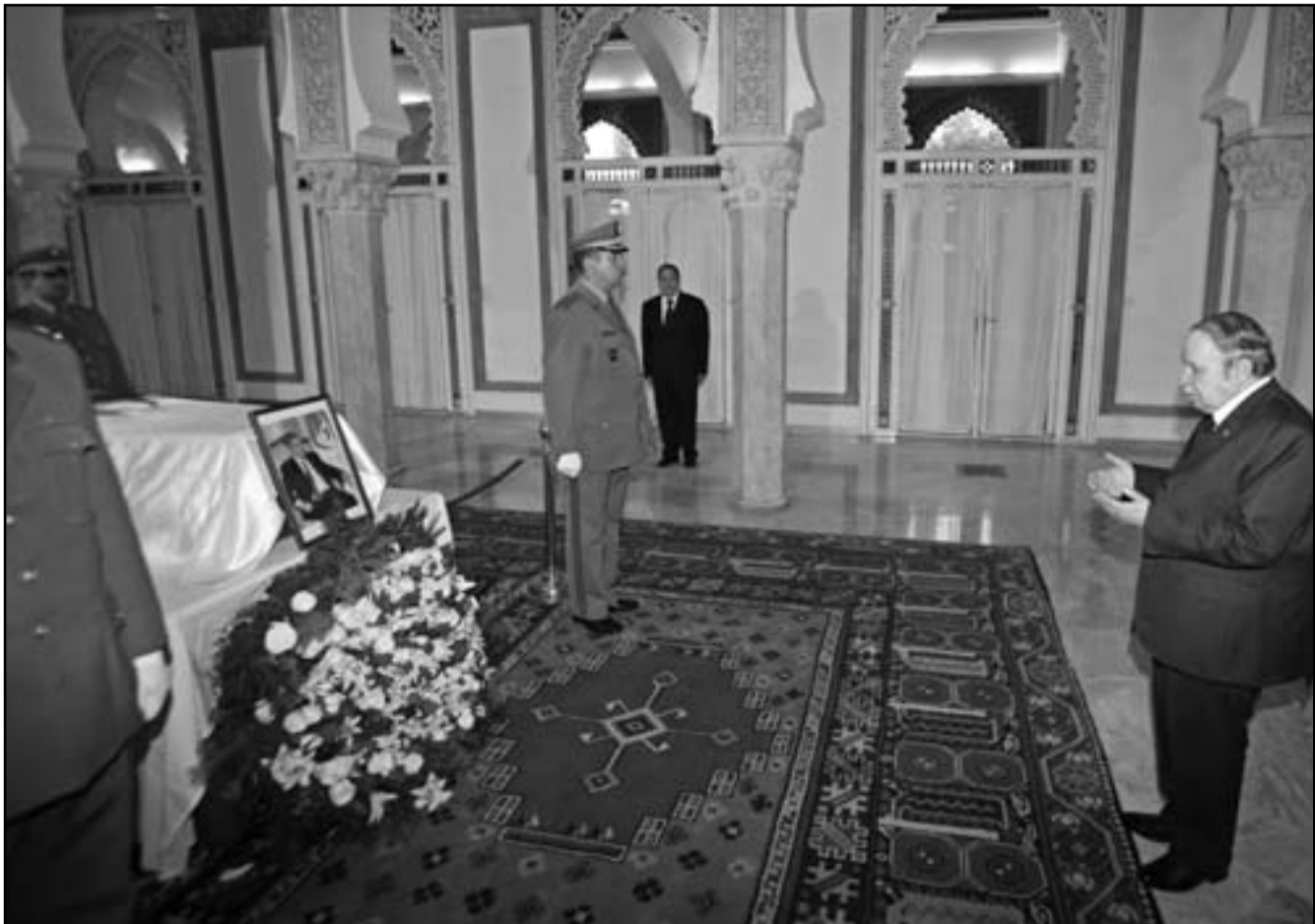
الرئيس الجزائري عبد العزيز بوتفليقة يقرأ فاتحة على روح الرئيس الأسبق أحمد بن بله في القصر الجمهوري

الرسمية السنوية بذكرى الانقلاب على بن بله، وعم على تعيين بن بله على رأس لجنة حكفاء الاتحاد الإفريقي، وظل حريصا على رعاية بن بله، وهو الأمر أيضا الذي جعل بوتفليقة يقرر أن يجعل بن بله جنزة رسمية تليق بمقامه.