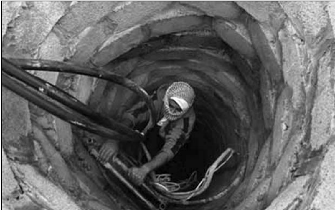
الجيش المصري لم ينجح في توفير الامن في سيناء

اسرائيل صادقت في السنة الاخيرة عدة مرات على زيادة حجم القوات العسكرية في شمال شرق سيناء، لتحسين مستوى الامن على مقربة من الحدود، ولكن لا يبدو ان القوات المصرية حققت اي تحسن. في كل الاحوال، فهي لا تنتشر في جنوبي قطاع الحدود، في المنطقة التي تطلق منها الاسبوع الماضي صاروخ غراد الى ايلات، حسب تقرير الجيش الاسرائيلي. بدلا من ذلك يصلون في مصر بيسطة النفي في ان يكون الصاروخ اطلق من ارضيه، تعزيز القوات لا ينتج حتى في منع الاضرار بالنيوب الغاز الى اسرائيل، الذي فجر هذا الاسبوع