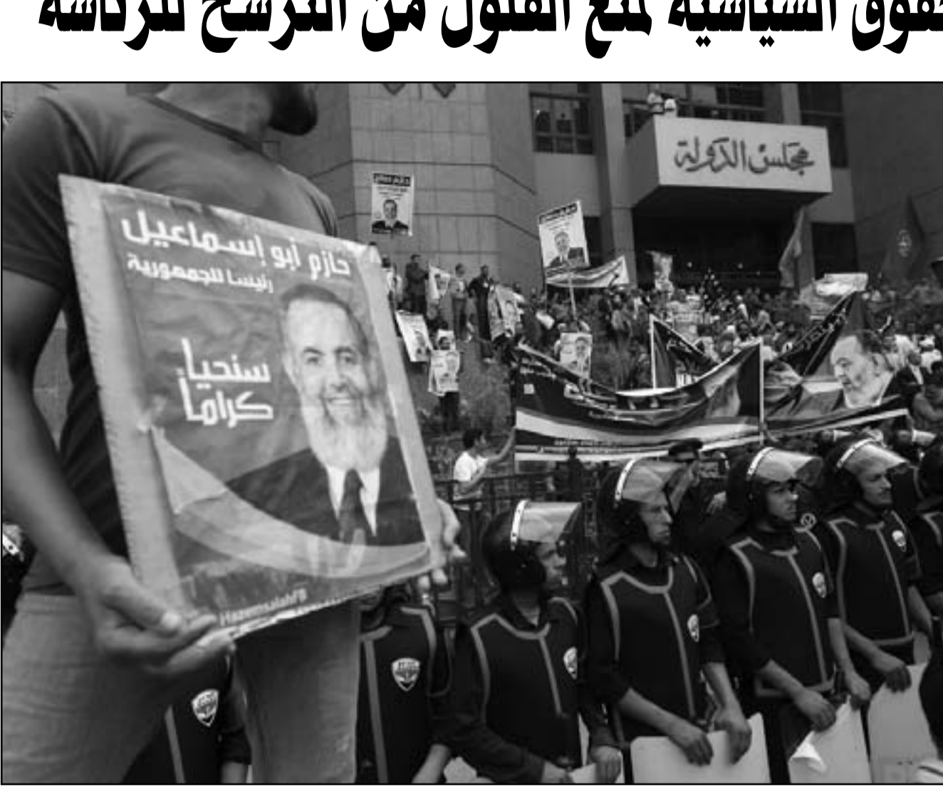
انصار المرشح حازم ابو اسماعيل في القاهرة امس

وقال التقرير انه لما كانت التشريعات المقترنة في البلاد التي مرت عبر المقول شرعا او قانونا ان الحقوق السياسية كل من عمل خلال