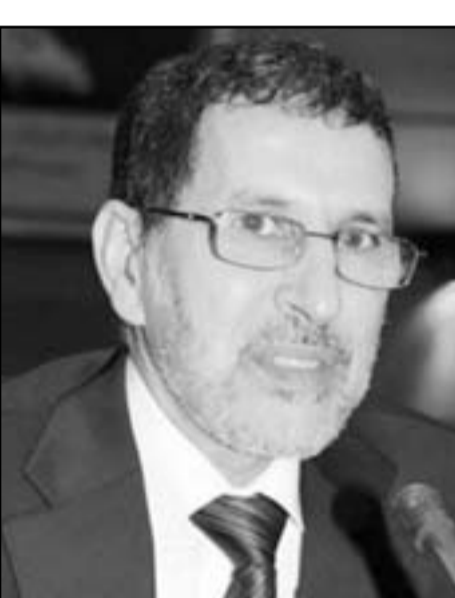
وزير الخارجية المغربي سعد الدين العثماني

موسكو - يوبي اي: قال وزير خارجية المغرب سعد الدين العثماني أمس الخميس أنه لا يجوز اتهام قوى خارجية بما يجري من أحداث في الشرق الأوسط وشمال إفريقيا. ونقلت قناة «روسيا اليوم» عن العثماني قوله بمحاضرة نظمها مجلة «الحياة الدولية» في موسكو إنه «بلا شك أن بعض الدول من خارج المنطقة لها مصالحها ومغزواها، وكان لا بد إلا الترق هذه الدول بعيدة عن الأحداث الثورية.. لكن القوى الخارجية ركبت فقط موجة الثورات، وسعت إلى عدم توفيت الفرصة السانحة وعدم فقدان مصالحها في المنطقة، بأن تركب الموجة ولكنها لم تشعلها البتة.» وأشار إلى أنه «ما كانت الاضطرابات الشعبية والثورات لتحدث لو كان الوضع في بلدان عربية كثيرة مستقرًا والنظمة فيها مفتوحة.» وأورد العثماني على سبيل المثال المغرب حيث بدأت اضطرابات شعبية فيها كما في بلدان عربية أخرى، لكن السلطات «استجابت لمطالب الشعب ونشطت عملية الإصلاحات بالرغم من مقاومة جزء من النخبة الحاكمة لها.» وذكر الوزير المغربي أن من بين الإصلاحات الرئيسية في بلاده صدور الدستور الجديد في تموز/يوليو عام 2011 وإجراء الانتخابات البرلمانية، مشيرًا إلى أن الدستور الجديد جاء ليحذف دور البرلمان على مستوى التصريح والمراقبة وتعزيز سلطة رئيس الحكومة، وأكد على مبدأ فصل السلطات وتجديد الحياة السياسية ومحاربة الفساد. وأعرب عن أمله أن تتجس خطة المبعوث الأممي والعربي المشترك كوفي أنان، لتتبع حزمة المبادرات العربية بشكل كبير، على أرض الواقع ليتمسنى للشعب السوري أن يعيش