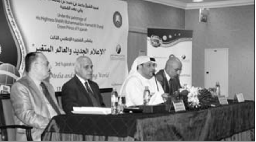
من افتتاح ملتقى الفجيرة الاعلامي الثالث

الإعلام لإقامة مثل هذه الندوات الإعلامية التي تفتح أفق العمل المشترك والتي توجت بتوقيع اتفاقية شراكة بين الجامعة والهيئة في العام الماضي مشيداً بدور الهيئة ممثلة برئيسها سمو الشيخ راشد بن حمد بن محمد الشرقي في تطوير التعاون وتبادل الخبرات بين الطرفين. وأضاف أن هذا الملتقى سيستهدف في دورته الجديدة تطورا وأصحا في عدد المشاركين ونوعية الموضوعات البحثية، وتنوعاً في مجالاته الإعلامية، وتميزاً في طريقة الجلسات والحوارات والنقاشات، من خلال التلاقي بين الأكاديمي والممارس الإعلامي، حيث سيشهد جلسات علمية متنوعة تجمع بين الجانب النظري والجانب العملي على مشهد الملتقى تجربة جديدة لم تشهدها المنتمرات العلمية سابقاً وهي مشاركة كلية طلبة للعلوم والإعلام والعلوم الإنسانية بالفجيرة ببحث علمي حول (الإعلام الجديد وصناعة المواطن). وقال عدي الطويل نائب الرئيس التنفيذي لمجموعة الفجيرة للإعلام أن هذا الملتقى سيستهدف في موضوع غاية في الأهمية وهو الإعلام الجديد والعالم المتغير وأن مجموعة الفجيرة للثقافة والإعلام تعزز بهذه التجربة والشراكة المتميزة مع كل من هيئة الفجيرة للثقافة والإعلام وجامعة عجمان للعلوم والتكنولوجيا للعام لثالث على التوالي خاصة أن هذا الملتقى سيستهدف نخبة متميزة من وسائل الإعلام المحلية والدولية وتمنى أن يخرج بتوصيات تسهم في تطوير العمل الاعلامي. وأشار الدكتور حمدي الشاعر مدير الفجيرة بقرع الفجيرة بأن الجامعة حريصة على إقامة هذه الندوات المهمة وورش العمل لتنمية المجتمع المحلي، وتأتي تنفيذها لفلسفة الجامعة في تأسيس جسر مع المؤسسات