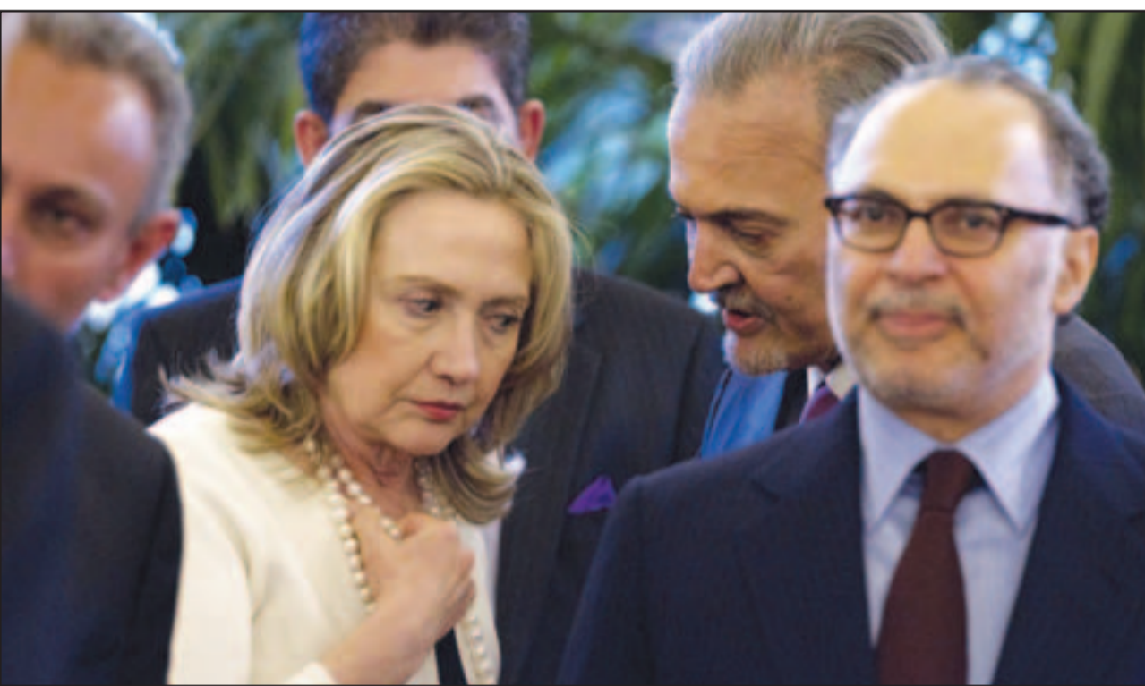
وزيرة الخارجية الامريكية هيلاري كلينتون تصغي لحديث من نظيره السعودي الامير سعود الفيصل على هامش اجتماع اصدقاء سورية في باريس اسس

الجيش السوري الحر العميد الركن مصطفى احمد الشخيع الخميس إلى تشكيل حلف عسكري» خارج اطار مجلس الامن وتوجيه ضربات الى النظام السوري، وطالب الشيخ في شريط مصور وزع على وسائل الاعلام المجتمع الدولي بتشكيل حلف عسكري من دول اصدقاء الشعب السوري خارج مجلس الامن وتوجيه ضربات عسكرية جراحية في مفاصل النظام..