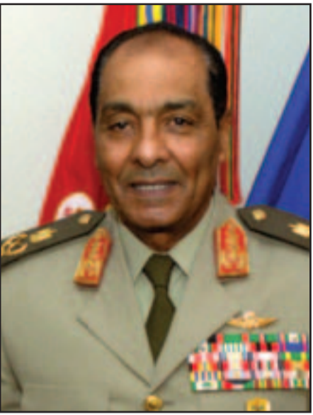
المشير حسين طنطاوي

وشددت الجبهة على ضرورة أن يتولى ممثلو الهيئات والجهات المشاركة ترشيح واختيار من يمثلهم في الجمعية التأسيسية ورفضها لأي غلبة حزبية أو سياسية من خلال عضوية تسمح بالسيطرة على التصويت بالأغلبية، وضرورة التوافق على نصوص الدستور المقترح وفي