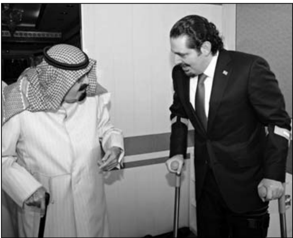
العاهل السعودي الملك عبد الله بن عبد العزيز مستقبلاً رئيس وزراء لبنان السابق سعد الحريري

عريبات كان يرد ضمنياً على أصحاب القرار الأمني والسياسي الذين صدمتهم حقيقة السيطرة المطلقة للإسلاميين على مجلس نقابة المعلمين الأولى في البلاد التي حصل الإسلاميون على نحو 70 بالمئة من مقاعد مجلسها المركزي قبل فوزهم الأسبوع الماضي بـ14 مقعداً من أصل 15 في الهيئة الإدارية. فوبيا الأخوان المسلمين بعد انتخابات المعلمين برزت على سطح الحدث في كل غرف القرار الأردنية وساهمت في التأثير على مجريات تركيبة قانون الانتخابات الجديد لكن نقيب المعلمين الجديد البعطي مصطفى الرواشد الذي صوت له الإسلاميون بوضوح يطالب ضمياً الخائفين على النقابة الوليدة التي تؤكد ان الكيانا فقد ألت عندما سألته القدس العربي إلى أن نقابة المعلمين تحكمها الأنظمة والقوانين وليس التيار الإسلامي معتبرا ومن باب الخصومة الفكرية والسياسية للإسلاميين بأن الانتخابات كانت تزيفه وعالة ومقرحا على الجميع قبول نتائج الانتخابات واحترام الصندوق.