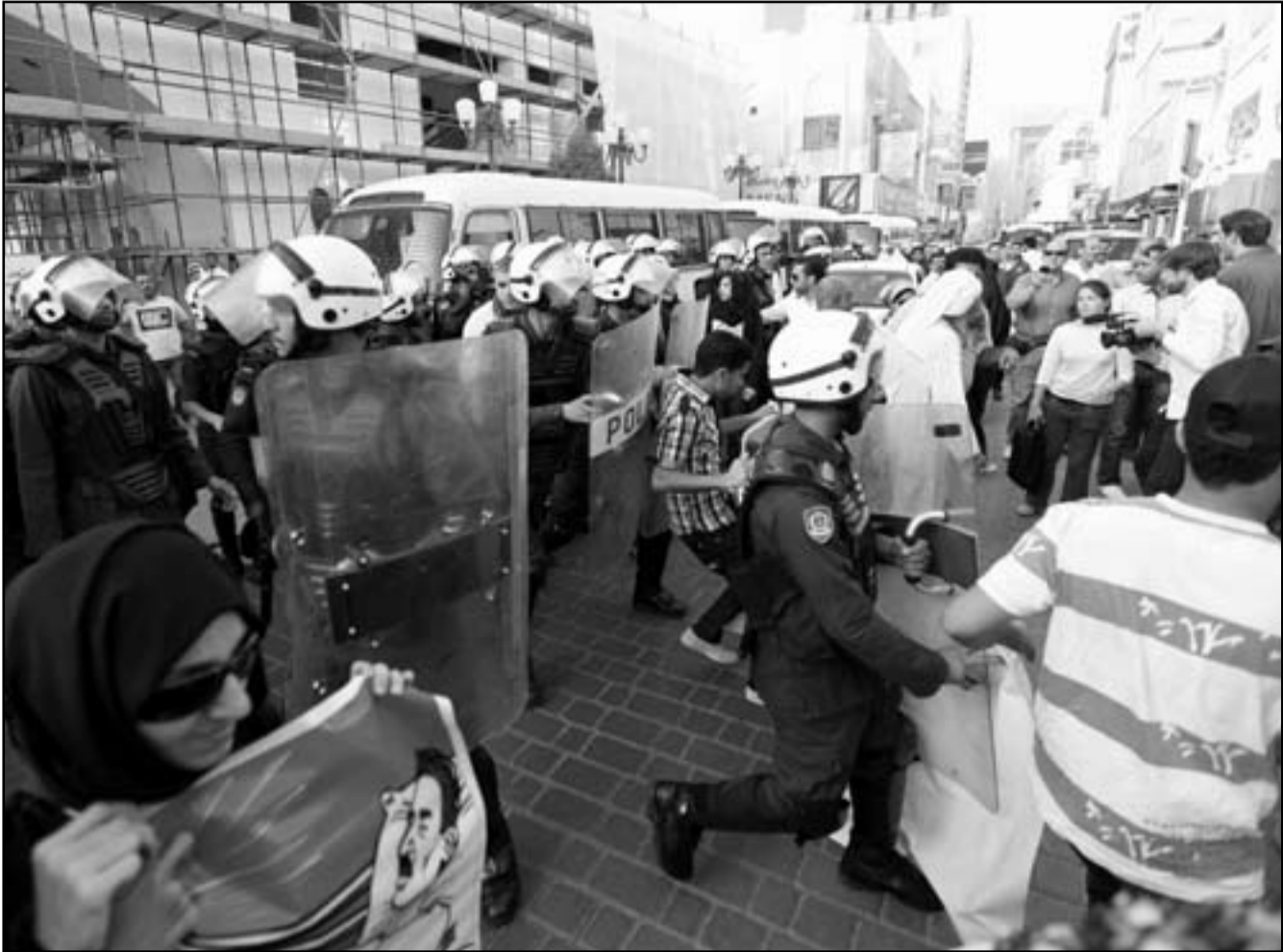
معارضون بحرينيون في مواجهات مع الشرطة شمال المنامة امس

وفي تقرير من 58 صفحة عشية سباق جائزة البحرين الكبرى في الفورمولا 1، واحد الذي سيجري في 22 نيسان/أبريل ذكرت المنظمة ان السلطات فشلت في تأمين السباق، وادعت ان قوات الشرطة لا يمكن ان تتعامل مع التهديدات التي تواجهها في المنامة. وقالت المنظمة ان قوات الشرطة لا يمكن ان تتعامل مع التهديدات التي تواجهها في المنامة. وقالت المنظمة ان قوات الشرطة لا يمكن ان تتعامل مع التهديدات التي تواجهها في المنامة.