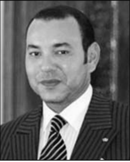
العاهل المغربي محمد السادس

وحضرت مارتين، نجلة دولور، ذلك اللقاء الأسري الذي حضره الملك محمد السادس عندما كان وليا للعهد أن أجرى تدريباً بقر الاتحاد الأوروبي عندما كان جاك دولور يرأس هذا الاتحاد. ونقل نفس المصدر أن علاقة مارتين اوبري بالمغرب توطدت منذ ذلك التاريخ، حيث أصبحت تتردد على مدينة وجدة المغربية مثلما تتردد على مدينتي ليل الفرنسية، ولا يمكنها أن تزور المغرب دون أن تتلقى دعوة شخصية من القصر الملكي.