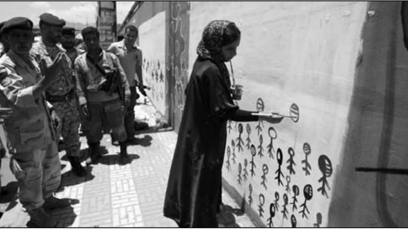
سيدة يمنية ترسم على حائط في صنعاء أمس