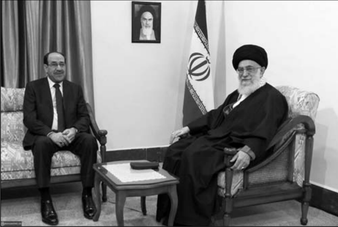
المُرشد الأعلى للثورة الإيرانية علي أكبر خامنئي خلال استقباله رئيس الوزراء العراقي نوري المالكي في طهران