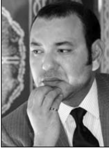
العاهل المغربي محمد السادس