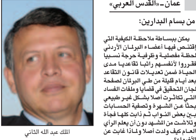
عنان - «القدس العربي» من بسام البدارين:

يمكن ببساطة ملاحظة الكيفية التي اقتنص فيها أعضاء البرلمان الأردني لحظة مفصلية وطرفية حرجة تسببا فقرروا لأنفسهم راتبا تقاعديا مدى الحياة ضمن تعديلات قانون التقاعد بعد أيام قليلة من طي البرلمان لصفحة لجان التحقيق في قضايا وملفات الفساد التي تكاثرت أصلا بشكل غير طبيعي بحفا عن الشهرة وتصفيحة الحسابات بين بعض النواب ثم ذات كلها فجأة وتلاشت من المشهد دون أن يعلم الرأي العام كيف ولدت أصلا ولماذا غابت عن الأضواء؟