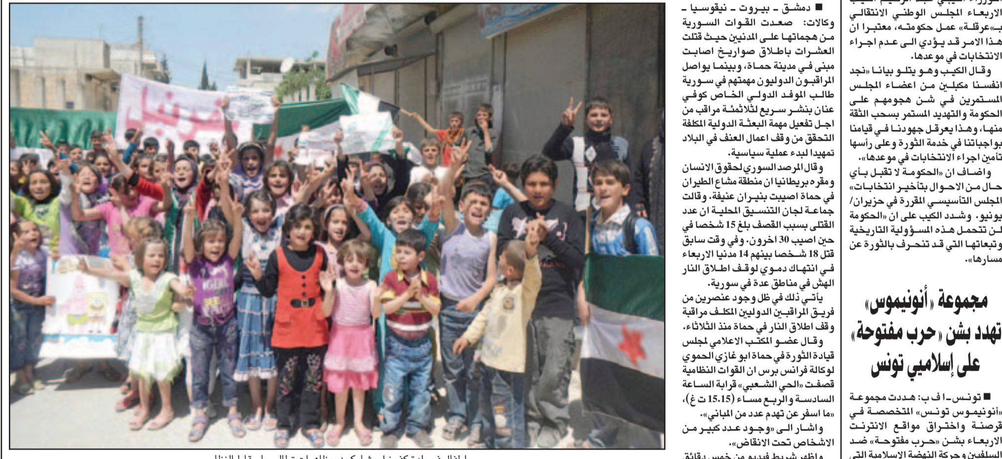
اطفال في بلدة كفر نبل يشاركون بمظاهرات تطالب باسقاط النظام

ولفتت إلى انه بعد لقائه معتملين عن المعارضة السورية في باريس أشار إلى ان الحرب مستعد لمواجهة «مرحلة أخرى» في حال فشل خطة السلام.