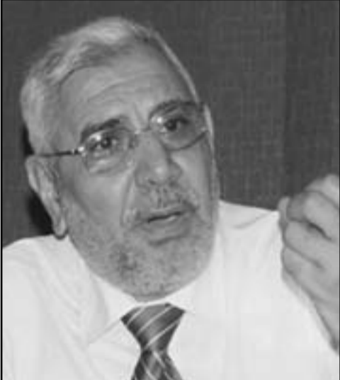
عبد المنعم أبو الفتوح

وقال «أنا أتمنى ألا ينتخب أي شخص من النظام القديم لأننا في جمهورية جديدة بأسس جديدة إدارة الدولة التي شاكروا مع النظام القديم أو ساعدوه أو التزموا الصمت تجاه الجرائم التي ارتكبت يمثلون النظام القديم» على أفكاره وعلى وسائله لا يصلحوا في المرحلة الجديدة». وصدق المشير محمد حسين طنطاوي رئيس المجلس الاعلى للقوات المسلحة الذي يدير شؤون البلاد منذ إسقاط مبارك على قانون يمنع كبار من عملوا مع مبارك من تقلد المنصب مما أدى لاستبعاد شفيق.