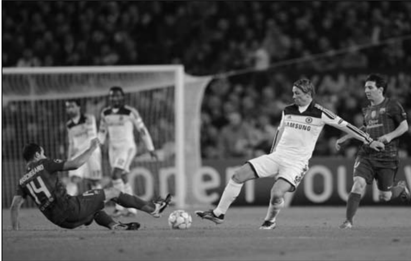
فرناندو توريس نجم تشيلسي (وسط) يسدد كرة في مرمى برشلونة

■ برشلونة - د ب أ: فجر فريق تشيلسي الإنكليزي مفاجأة من العيار الثقيل وانتزع من برشلونة الأسباني بطاقة التأهل للدور النهائي ببطولة دوري أبطال أوروبا لكرة القدم بعدما تعادل معه 2/2 باستاد «كامب نو» في إياب الدور قبل النهائي.