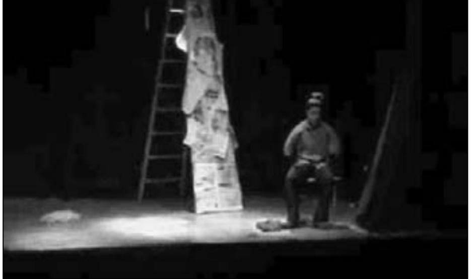
مشهد من مسرحية «أوتوبيس»

وأوضحت الجبهة أنه «يؤلمنا كمؤسسة تدافع عن حرية الإبداع أن يكون أي مدفع في مصر يعاني من كبت أو قمع للتعبير عن أفكاره بلغته الإبداعية الخاصة ويؤلمنا أكثر أن يأتي هذا الكبت من مؤسسة تدعم الفنون وترعاها لا من مؤسسة تتجادل معها وتناصر كمؤسسات الرقابة على الصفات الفنية».