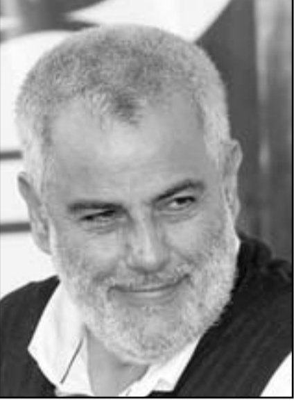
عبد الله بن كيران