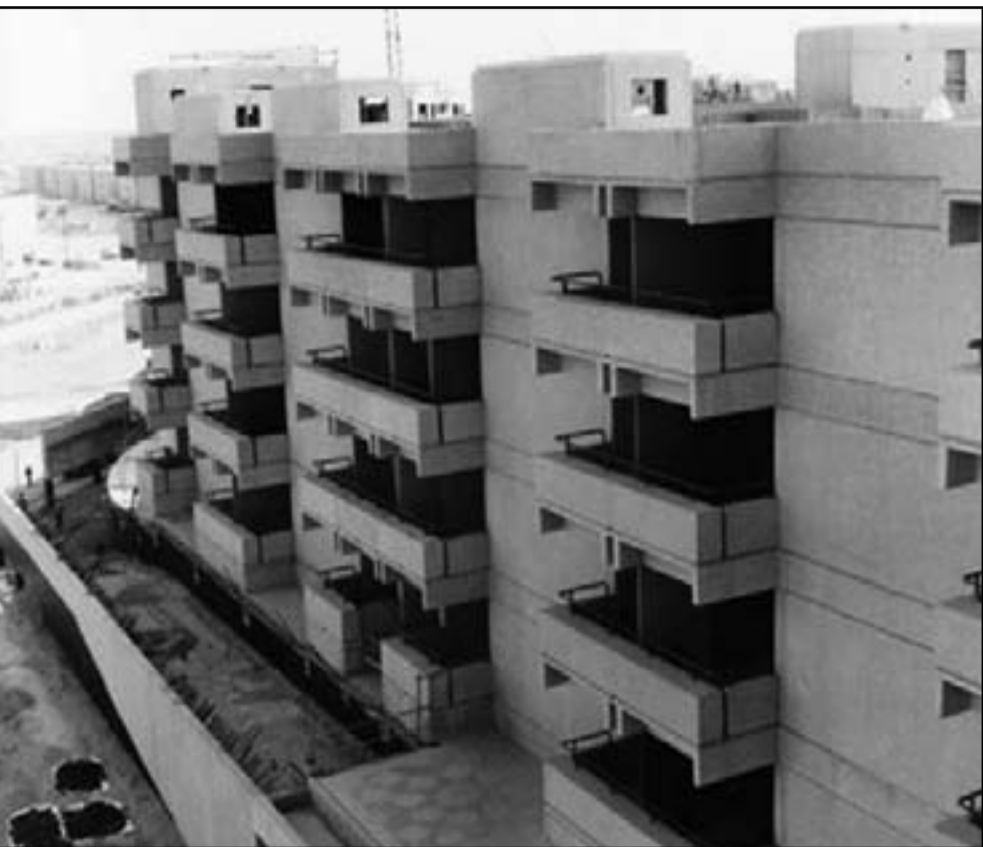
مشروع خاص شبه كامل للاسكان في جدة

الخاصة فيما يعتقد المحللون أن ذلك الرقم قد يكون أعلى بكثير من الشبائ. يقول الشهري، «كنت انتظر الوقت المناسب لانخفاض الاسعار في الرياض وتطوير مشاريع جيدة... إلا أن هذا الوقت لم يأت أبدا واعتقد أنه لن يأت». الدولار يساوي 3.75 ريال سعودي.