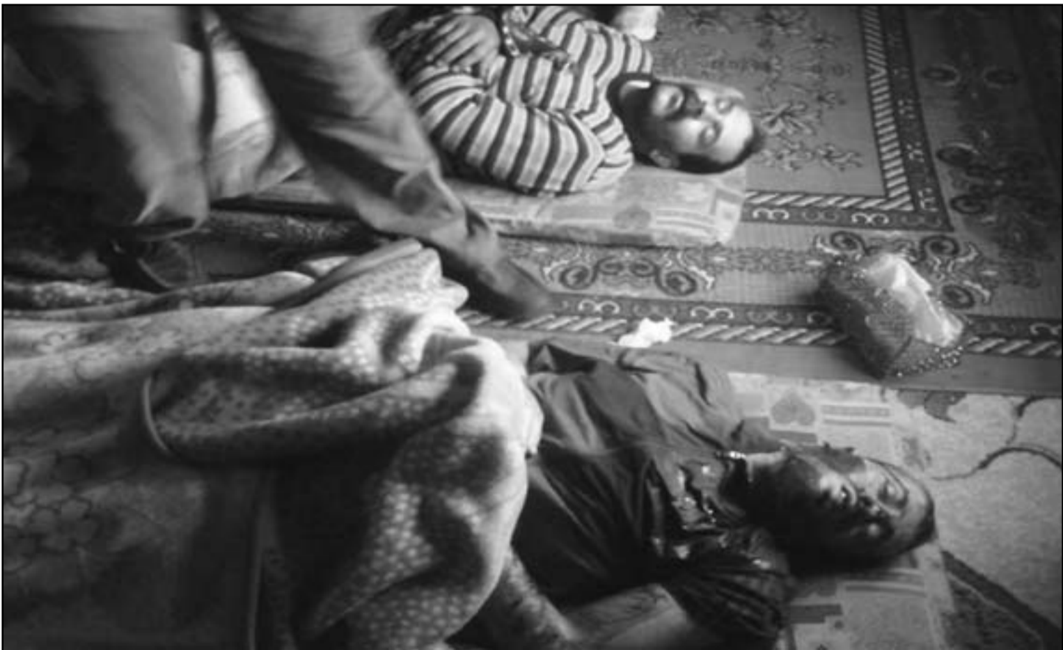
جثث القتلى بانتظار الدفن في منطقة حمص

مؤكد ان الوضع «خطير» و«غير مقبول».. وأضاف مبعوث الامم المتحدة والجامعة العربية انه «يشعر بقلق خاص» حيال تقارير تشير الى ان القوات الحكومية دخلت مدينة حماة بعد بضعة ايام من اقتحامها «كبيرا» من الناس.