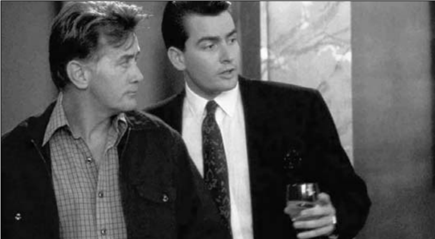
لقطة من فيلم «وول ستريت»

«بقاعة البورصات» او شركات توظيف الأموال الوهمية، ويكفي للدلالة أن أشهر ما حدث في المدينة المكتوبة «جرش»، حيث تضرر 27 ألف شخص، تخرت مدرختها البالغة قيمتها 122 مليون دينار في رمشة عين!