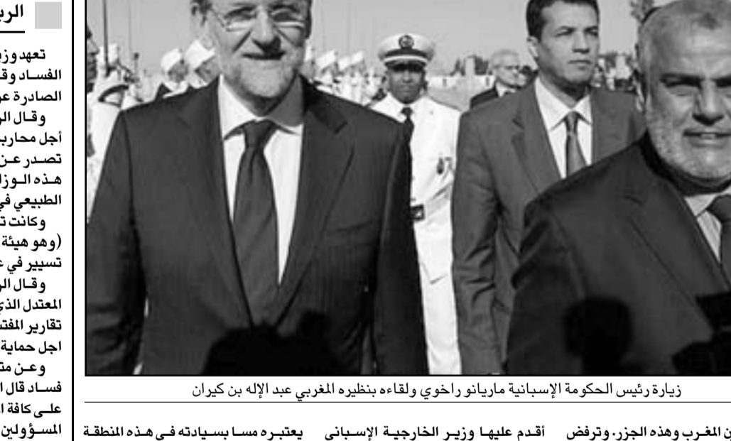
زيارة رئيس الحكومة الإسبانية ماريانو راخوي ولقاءه بنظيره المغربي عبد الله بن كيران

الفاصلة بين المغرب وهدء الجزر. وترفض جزر الكناري التفتيش عن البترول، وهو ما اعتبره مسؤولون حكوميون «ولاء للمغرب من طرف ريفيرو على حساب الولاة لإسبانيا».