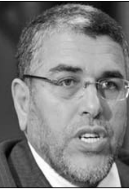
وزير العدل المغربي مصطفى الرميد