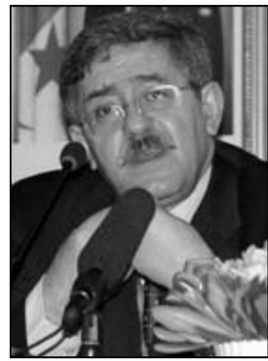
أحمد أويحيى الأحزاب ال 44 المشاركة في الانتخابات على الأغلبية في المجلس الشعبي الوطني (مجلس النواب في البرلمان).

أفسدت الاضرابات والاحتجاجات الحملات الانتخابية للأحزاب السياسية في الجزائر، كما نغصت على السلطة دعاؤها المتكررة للمواطنين بضرورة التصويت كتأفة في الانتخابات البرلمانية، والتي من المقرر إجراؤها في العاشر من أيار (مايو) القادم. تحولت الاضرابات والاحتجاجات إلى ظاهرة شبه يومية، بدأ المواطن الجزائري يعثرها جزء من يومياته سواء كان مشاركاً فيها ومعنياً بها، أو متفرجاً عليها، ورغم أن البلاد تعيش حملة انتخابية تحاول كل أطرافها، سواء تعلق الأمر بالسلطة أو الأحزاب، إقناع المواطن بضرورة التصويت والذهاب بكثافة إلى مكاتب الاقتراع، إلا أن الشارع الجزائري لا يزال يغلي على وقع الاحتجاجات. وكان الاتحاد الوطني لعمال التعليم قد شن إضراباً جديداً بداية ثالثة أيام، وذلك احتجاجاً على عدم التزام الوزارة الوصية