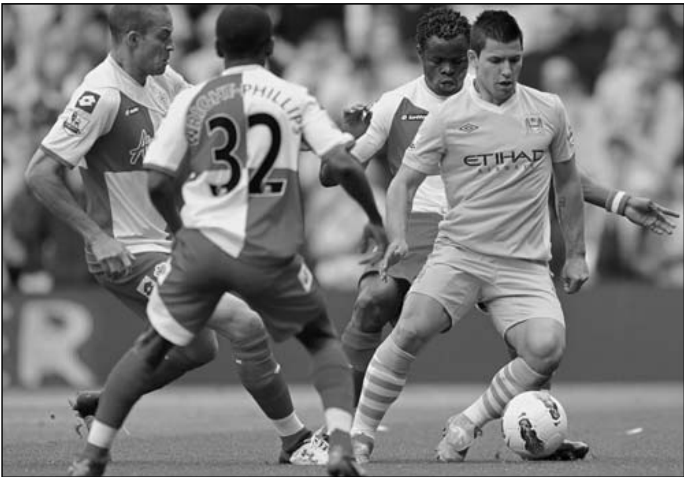
سيرجيو أجويرو نجم مانشستر سيتي (يمين) ينغرد بالكرة