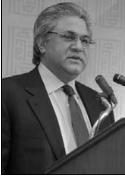
عنان - «القدس العربي»:

اعلن الدكتور نبيل هاني القدومي رئيس مجلس أمناء مؤسسة التعاون ان المؤسسة أنفقت 32 مليون دولار في العام 2011 على مشروعات تدعم بناء المجتمع الفلسطيني، واعلن خلال اجتماع أعضاء مجلس الأمناء والجمعية العمومية للمؤسسة في عمان تنفيذ المرحلة الأولى لمشروع المتحف الفلسطيني. للبدء بتنفيذ المرحلة الأولى من المتحف والتي تبلغ تكلفتها التقديرية حوالي 8 ملايين دولار، كما أشار أن المؤسسة وقعت مؤخرا مذكرة تفاهم على منحة بقيمة 28 مليون دولار، مع البنك الاسلامي للتنمية بصفتها مديرا المشاريع الصندوق الكويتي للتنمية الاقتصادية العربية لدعم الشعب الفلسطيني، وذلك دعما للبرنامج المتكامل لتطوير قرية وادي غزة، التي شهدت دمارا، اثناء الحرب الإسرائيلية على غزة سنة 2008 ويعاني سكانها من ضيق المعيشة والظروف الحياتية الصعبة، وكان مجلس أمناء المؤسسة قد راجع اداءها خلال الربع الأول من العام الحالي، حيث بلغت قيمة الصرف على قطاعات التعليم والثقافة والتنمية المجتمعية والطوارئ والساعات الإنسانية أكثر من 7 ملايين دولار، فيما بلغ حجم الإيرادات خلال نفس الفترة أكثر من ستة ملايين دولار.