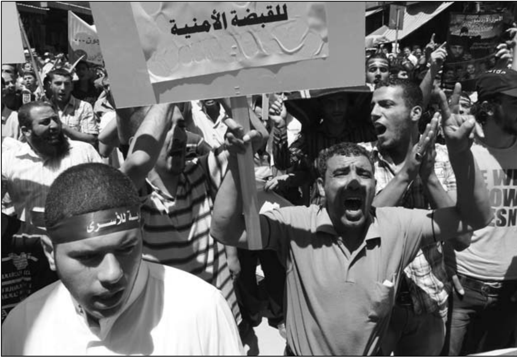
الاردنيون يتظاهرون دعما للاصلاح

الاردنية، الا انه يطالبها بتطبيق اصلاحات حقيقية، وبالاساس التقليل العميق للدعم الحكومي للوقود والكهرباء، والذي يكلف صندوق الدولة نحو 4 مليار دولار. مشكوك ان يستجيب الملك المحب للاصلاحات لهذا الطلب الذي من شأنه ان يرفع الاسعار وان يخرج الى الشوارع الاف المتظاهرين. وفي السنة الماضية أيضا حاول الملك تقليص الدعم الحكومي ولكنه سرعان ما تراجع عن ذلك ولا سيما في ضوء الخوف من انتقال الثورة العربية الى نطاق المملكة.