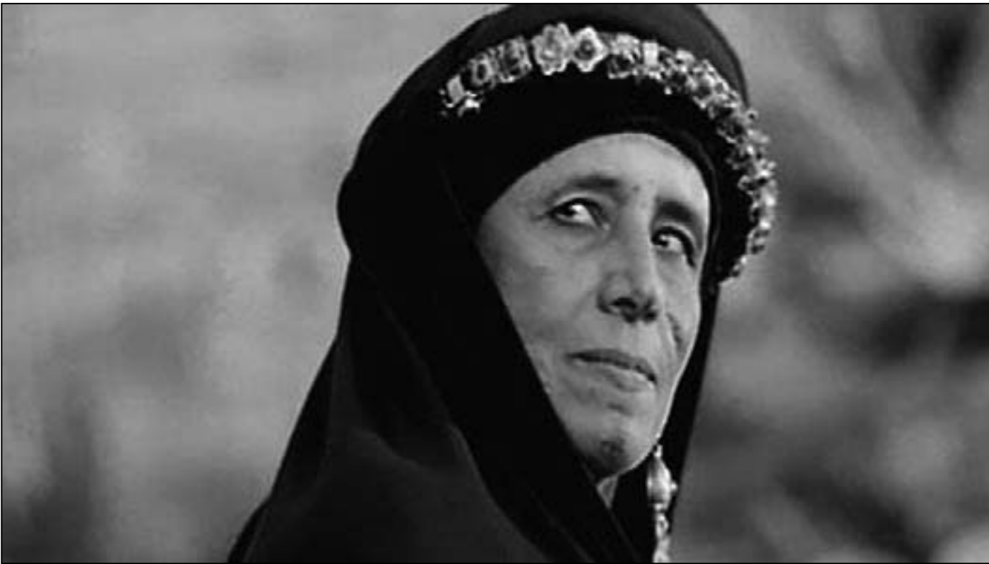
ثريا جبران في مشهد من فيلم «أركانة»