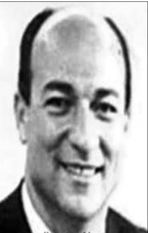
زكريا محيي الدين

تقدم المشير محمد حسين طنطاوي القائد العام رئيس المجلس الأعلى للقوات المسلحة عصر الثلاثاء جنازة العسكرية الشعبية لتشييع جثمان زكريا محيي الدين من مسجد آل رشدان بمدينة نصر، شارك في الجنازة الفريق سامي عناني رئيس الأركان ونائب رئيس المجلس الأعلى للقوات المسلحة، واللواء مراد موفى مدير جهاز المخابرات العامة، والدكتور كمال الجنزوري رئيس مجلس الوزراء واللواء محمد إبراهيم وزير الداخلية، ورئيس مجلس الشعب الدكتور محمد سعد الكتاتني، والدكتور أحمد فهمي رئيس مجلس الشورى، والدكتور علي صبري وزير الدولة للإنتاج الحربي، ومحافظ القاهرة بالإضافة إلى عدد كبير من كبار رجال الدولة ورجال الدين وعدد من كبار القادة والشخصيات العامة والمسؤولين التنفيذيين.