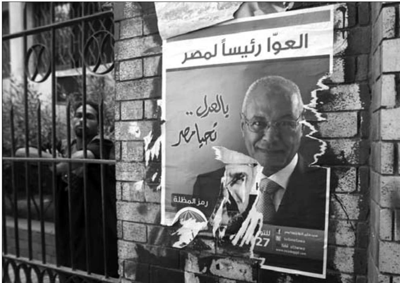
ملصق انتخابي للمرشح محمد سليم العوا في القاهرة