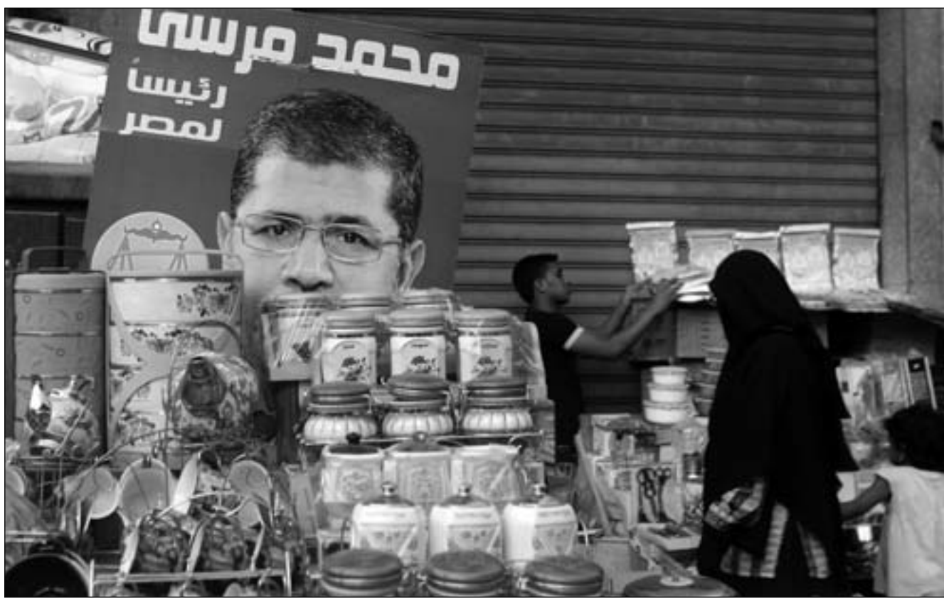
أحد الباعة الجائلين يعلق لافتة انتخابية للمرشح محمد مرسى

وأعلن المعتقلون على خلفية «أحداث العباسية»، التي وقعت قبل نحو أسبوعين، في بيان ورُعت جماعة تطلق على نفسها اسم «اللمحكات العسكرية»، اليوم وتقت يونانيثد برس إنترناشونال نسخة منه، عن خلوهم في إضراب مفتوح عن الطعام اعتبارا من الأحد القادم الموافق 20 مايو/أيار حتى تحقيق مطالبهم المتمثلة بالإفراج الفوري عنهم وعن جميع المعتقلين من دون قيد أو شرط، والغناء محاكمة الدولة أمام المجتمع العسكرية والإعتراف بحقهم في القضيض أمام قاضيهم الطبيعي، وشُدوا على أنهم (المعتقلون) لن يقبلوا أن يكونوا جزءا من المحاکات السياسية حيث أن معظم