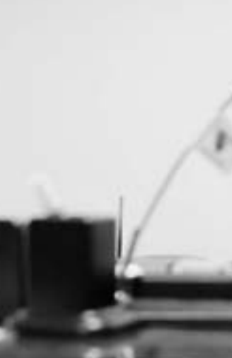
عبد الحكيم بلحاج القائد العسكري لطرابلس

تدعو إلى المقاومة المسلحة ضد نظام القذافي، الحكومة البريطانية السابقة برئاسة توني بلير بالسماح لاجهزة الاستخبارات البريطانية باعطاء الاستخبارات المركزية الاميركية (سي.آي.إيه) معلومات اتاحت تسليمه في 2004 إلى النظام السابق الذي اخضعه للتعذيب.