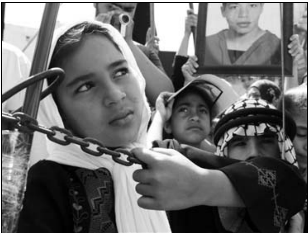
رام الله - غزة - «القدس العربي» من وليد عوض وأشرف الهور:

احيا ابناء الشعب الفلسطيني الثلاثاء الذكرى الـ 64 لنكبتهم بمسيرات شعبية التي نظمت في الضفة الغربية وقطاع غزة التي نظمت في الضفة الغربية وقطاع غزة والتذكير باسماء المدن والقرى التي هجروا منها عام 1948 وتم تدميرها على يد العصابات الصهيونية لاقامة دولة اسرائيل. وفيما نظمت مسيرات مركزية في كل من الضفة الغربية وقطاع غزة احياء لذكرى النكبة حرص المشاركون على رفع لافتات للتذكير باسماء المدن والبلدات الفلسطينية التي تم تدميرها وتهجير اهليها عام 1948، وذلك وسط شعارات تؤكد على حق العودة وتقرير المصير مقدس لا تنازل عنه ولا تقريط، وشارك في المسيرات أطفال صغار وشيوخ، وانتهت المسيرات الجماهيرية بكلمات خطابية شددت على استمرار النكبة الفلسطينية والمتمسك بحق العودة، والدعوة لاستعادة الوحدة الوطنية بين الضفة الغربية وقطاع غزة، فيما أطلقت صفارات الإنذار في تمام الساعة 12 ظهرا لمدة 64 ثانية عبر الإذاعات المدرسية ومكبرات الصوت وفي المساجد بعد سنوات النكبة، وتعطلت حركة السير، وتوقف العمل، مع قراءة الفاتحة على ارواح شهداء النكبة وفلسطين.