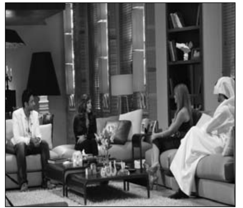
ضيوف حلقة «صولا»

هذه الهواتف في المدن العربية، ما تزال تُضخّ يومياً على الشاشات، ومن بينها «فرانس 24» التي حازت مؤخراً على مصداقية مستحقة، خسرتها بجدارة كل من الجزيرة العربية والخليجيتين. شكّل الإعلان بذكاء، صحيح، إسقاط «فستيفالي» للثورات ولما تقابلها من مجازر، ولإدراكنا كليهما، «ثُمَّبْ أب» لم يدع الأثر إلا يتعلّق بالسياسة بقدر ما أدنى من الأخلاقية في أي إبداع كان، ولو كان دعائياً، بل لا بدّ للدعائي من حرص زائد، الأمر لا يتعلّق بالسياسة بقدر ما يتعلّق بالأخلاق، وبدورها، بثورات وشهادتها وأسراها ودمائها.. وتحديداً (آخر) إن حاول إعلان «عربي» أن يكون «كثير كقول» في تذكيره بالبلد بهذه الثورات، وبالأيدي العارية، وبالصرخات التي تقطر دماً، وملصقات الشهداء والأسرى. قليل من الحياء والاحترام منكم (ومناً)، هذا ما تحتاجه الثورات بالحد الأدنى، الآن على الأقل.