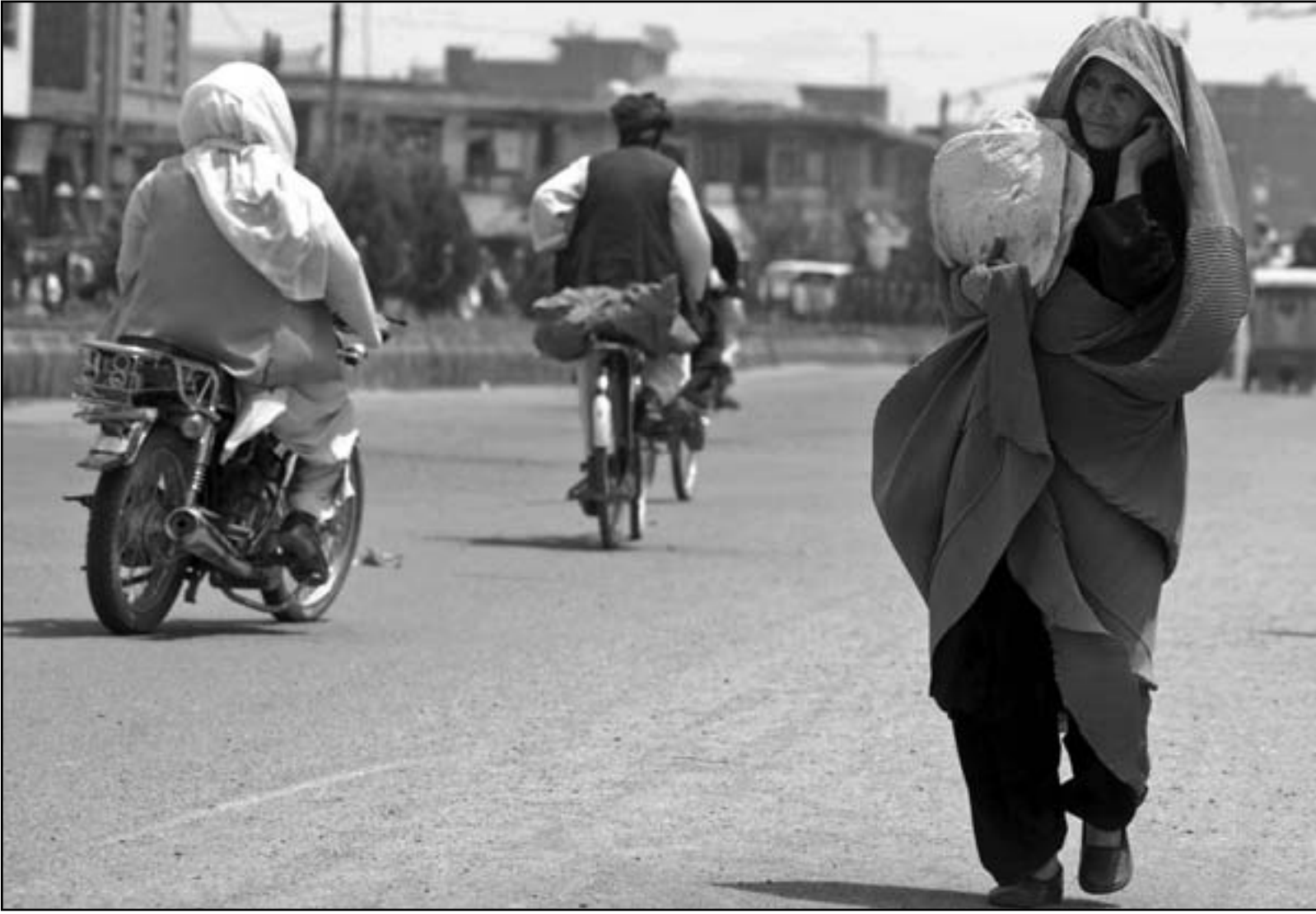
افغانية في شوارع كابول

الأمريكية من أفغانستان. وتابع أن الآن حول مهمة القوات الأمريكية من وضع استراتيجيات لمكافحة المتطرفين، مع التركيز على الحكم وإعادة الاعمار، إلى مهمة محصورة أكثر بتدريب القوات الأفغانية ومحاربة حركة طالبان. وقال كيري إن الترقية المحتملة لآن ليشغل منصب القائد العام لقيادة لعمليات حلف الناتو في أوروبا ستسمح له بالبقاء على اطلاع دائم بالسياسة الأفغانية والعمل مع قوات حلف شمال الأطلسي التي حافظت على وجودها في البلاد، بالرغم من تراجع شعبية هذه الحرب في أوروبا. وذكرت الصحيفة أن قرار تعيين آن يجب أن يبدأ بالبيت الأبيض ويمر بمجلس الشيوخ. وأعلن مسؤولون في وزارة الدفاع الأمريكية أن آن الذي كان من المتوقع أن يمضي سنتين في أفغانستان، سيرك منصبه في وقت مبكر ليستلم قيادة القوات الأمريكية في أوروبا. وأشاروا إلى أنهم لا يريدون أن يقبلوا آن من منصبه في أفغانستان في فترة العازم التي تعينها البلاد والتي تمتد من الربيع حتى الخريف المقبل. معتبرين أن استبدال آن في فصل الشتاء سيمتخ خلفه بضعة أشهر من الاستقرار قبل أن تعود المعارك، وذكرت الصحيفة أنه طلب من القائد العام لقيادة لعمليات حلف الناتو في أوروبا الأدميرال جيمس ستافريديس أن يبقى لبضعة أشهر بعد انتهاء مهمته التي تستمر 4 أعوام حتى يتمكن من العودة من أفغانستان والتخمس لاستلام منصبه الجديد.