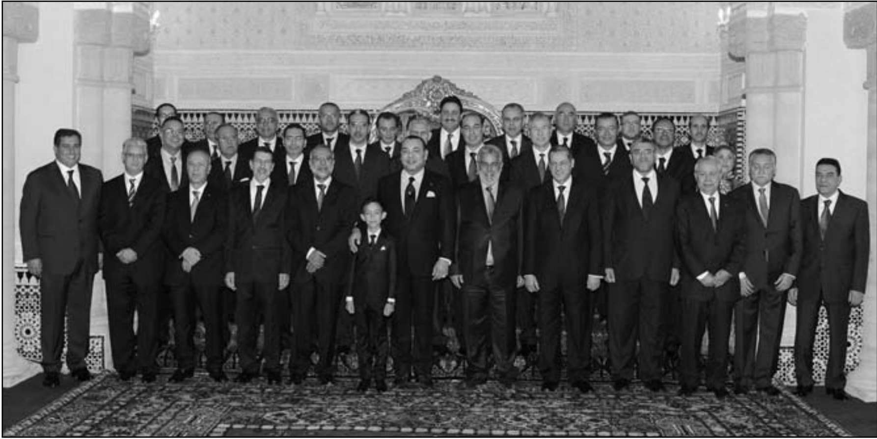
الملك محمد السادس يتوسط أعضاء الحكومة المغربية

وشدد بن كيران على أن حكومته ستعمل بالتعاون مع الجميع بروح إيجابية من أجل الوصول لما فيه صالح مجلس النواب في شارع محمد الخامس المواطنين، دون أن تنظر إلى المعارضة «كخصوم وإنما كفنافسين»، وتعين العمل معها لما فيه مصلحة المجتمع من أجل الاستجابة للانتقادات المشروعة والمعتولة للمواطنين، «التي لا يمكن إنجازها في ظرف أربعة شهور ونصف. ملف التشغيل كان أبرز الملفات التي أثرت خلال جلسة أول أمس، فاعطون لا زالوا يتظاهرون يوميا أمام مقر مجلس النواب في شارع محمد الخامس بالرباط، وبدا الغضب يصب على بن كيران وحكومته، بعدما اعتبر المعتطلون تهرب الحكومة الحالية من التزامات الحكومة السابقة بتشغيل أكثر من 4500 معطل بدون امتحان، وبين كيران يقول إن الالتحاق بالوظيفة بدون امتحان مخالف للدستور.