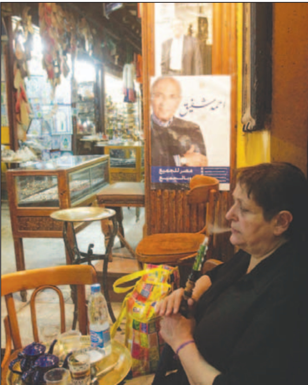
ملصقان انتخابيان لعمرو موسى واحمد شفيق على واجهة احد المحلات في خان الخليل