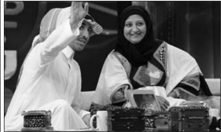
فخرية خميس في «الليلة مع فايز»

ويندرج البرنامج الجديد في إطار الخطة البرمجية التي أعدها تلفزيون دبي لتقديم برامج ذات نوعية عالية من ناحية الشكل والمضمون، ووفقا لأعلى المعايير الفنية العالية وبشروط فنية وإنتاجية تحرض مؤسسة دبي للإعلام على تقديمها على الدوام وعدم التنازل عنها سواء من ناحية الشكل أو المضمون العام لكل حلقة، في الوقت الذي يعد تواجد فايز المالكي في هذا البرنامج إضافة نوعية وخطة متقدمة في تقديم كوميديا تلفزيونية بمواصفات جديدة لم يتطرق إليها أحد من قبل