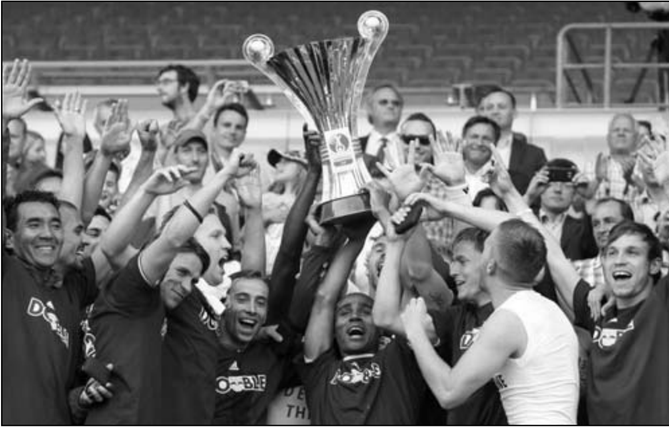
لاعب تشلى يرفعون الكأس فرحا بفوزهم على بايرن ميونخ في نهائي دوري أبطال أوروبا

«جاردريان» أنه رغم غم العبد الخيد الكثير يعيها ابراموفيتش وانفاقه الكثير على الأعمال الفنية عالية القيمة، يجب أن يكون أكثر فخرا بشراء دروجبا. وأضاف «إن بنفق رومان ابراموفيتش 24 مليون إسترليني أفضل من التي أنفقها في صفقة ضم ديديه دروجبا قبل ثمانية أعوام.