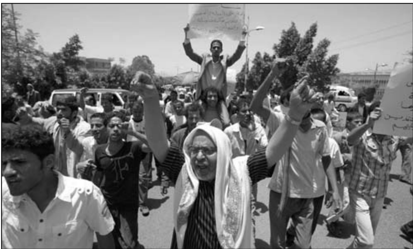
يمينون يتظاهرون في العاصمة صنعاء احتجاجا الاعتداء على طفلة قاصر

اليمنية بمحافظة الحديدة، تلقوا عقب وقوع الحادث إلى مكان أمن». وأوضح أن الشرطة ألقت القبض على أحد المشتبهين بظلوهم في هذه الحادثة عقب الهجوم بفترة وجيزة، إثر مدهامة عدد من المنازل، مؤكداً أن التهم المخبوض عليه ينتمي لتنظيم القاعدة. وذكر شهود عيان أن قوات من الشرطة انتشرت في الشوارع الرئيسية بمحافظة الحديدة بشكل مكثف، حيث شدت الأجهزة الأمنية من إجراءاتها على كافة منافذ هذه المدينة الساحلية التي كانت تعد من أكثر المناطق اليمنية أماناً وخبو من السلاح. من جهة أخرى نسب موقع «الصورة نت» الاخباري إلى مصادر أمنية قولها أن مسلحين أطلقوا وابل من الرصاص على سيارتين امريكيين الثلاثة الذين يعملون مدرين عسكريين في خفر السواحل بالحديدة مما أدى إلى إصابة أحدهم بشلل في الرقبة ويُدعى اوبريت بينما نجا الآخران. وأوضح أن «الهجوم تمكننا من الفرار ولم نثر إلى هويتهم، وأن المسلحان تواجدا بالقرب من أحد الهنجر المهجور عندما اطلقا الرصاص على العسكريين». وأوضحت المصادر أن «العسكريين امريكيين يقومون بتدريب خفر السواحل اليمني منذ 3 أشهر وأن قوات أمنية تمكنت من حمايتهم حتى