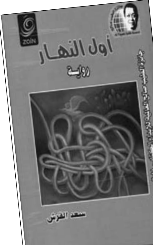
«أول النهار» للروائي سعد القرش