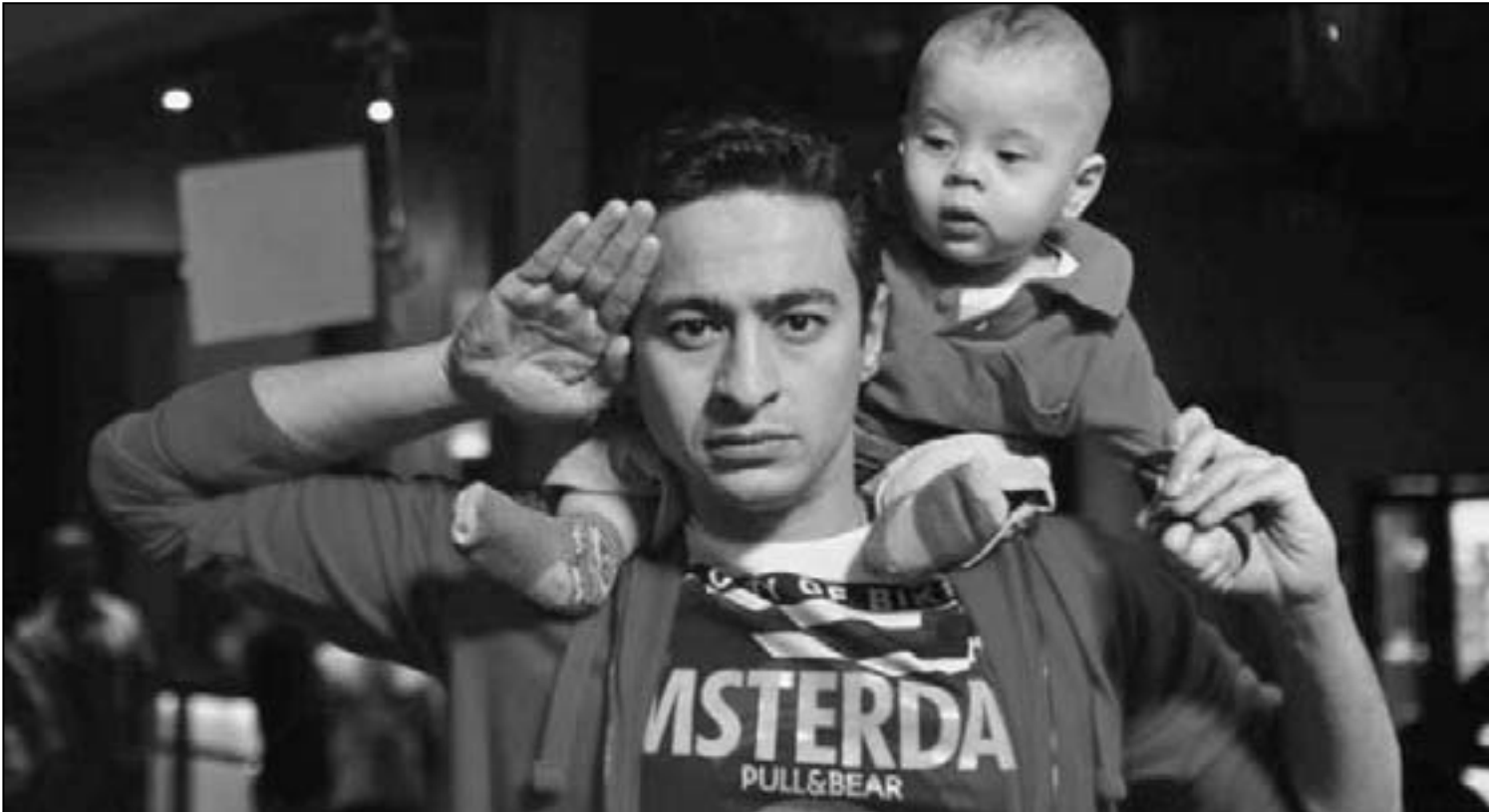
لقطة من فيلم «أمن دولت»