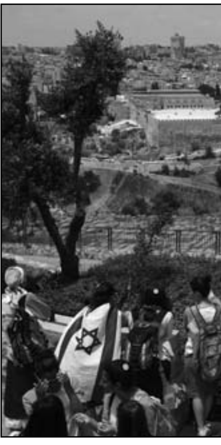
اسرائيليون تجمعوا في جبل الزيتون في القدس الاحد

وفي آذار (مارس)، 1990، اغتالت (كيون) جيرالد بول العالم الكندي الذي قام بتصوير برنامج عسكري للعراق، وذلك برفقته في العاصمة البلجيكية بروكسل، وهو ما أثر بالسلب بشكل كبير على تطوير هذا البرنامج، وفي تشرينين الأول (أكتوبر) 1995 اغتالت سريره في الفندق الأوليبيي نينغوسيا في نوفمبر 1973، وسبق ذلك في أبريل من نفس العام اغتيالها الكندي راسل القويوسي استاذ القانون في الجامعة الأمريكية بيسوت، الذي تمت تصفيته بـ2 رصاصة في باريس كما الحال بالنسبة زعتر.