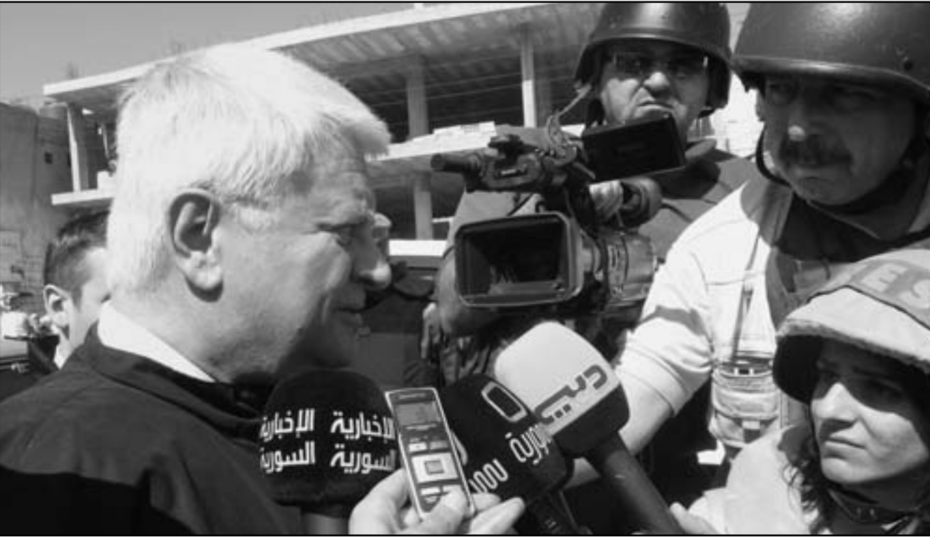
عناصر من فريق المراقبين الدوليين يتفقدون منطقة الزيداني

محسن ذات الغالبية العلوية المؤيدة للنظام في مدينة طرابلس الشمالية، ما حمل دولة الامارات والبحرين وقطر على دعوة رعاياها الى «عدم السفر» الى لبنان نظرا للتوتر الامني السائد في هذا البلد حاليا.