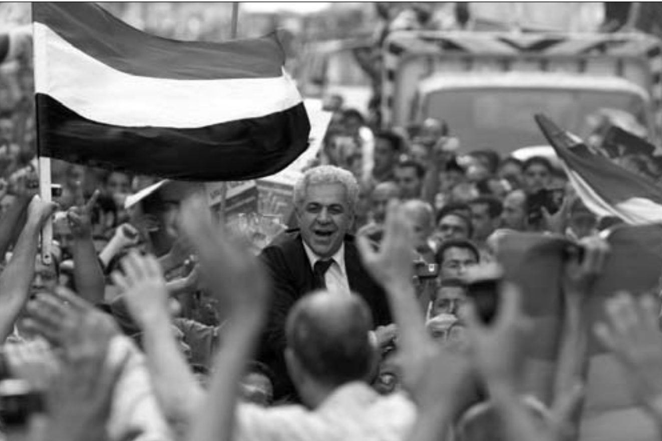
المرشح حمدين صباحي بين مناصريه في القاهرة

«المصري اليوم» الأربعة الماضي واستطلاع مركز المعلومات ودعم اتخاذ القرار التابع لمجلس الوزراء اللغوي الماضي. أعرب السياسي المصري محمد البرادعي، أمس الأحد، عن تشاؤمه من حدوث تغيير على الساحة السياسية المصرية.