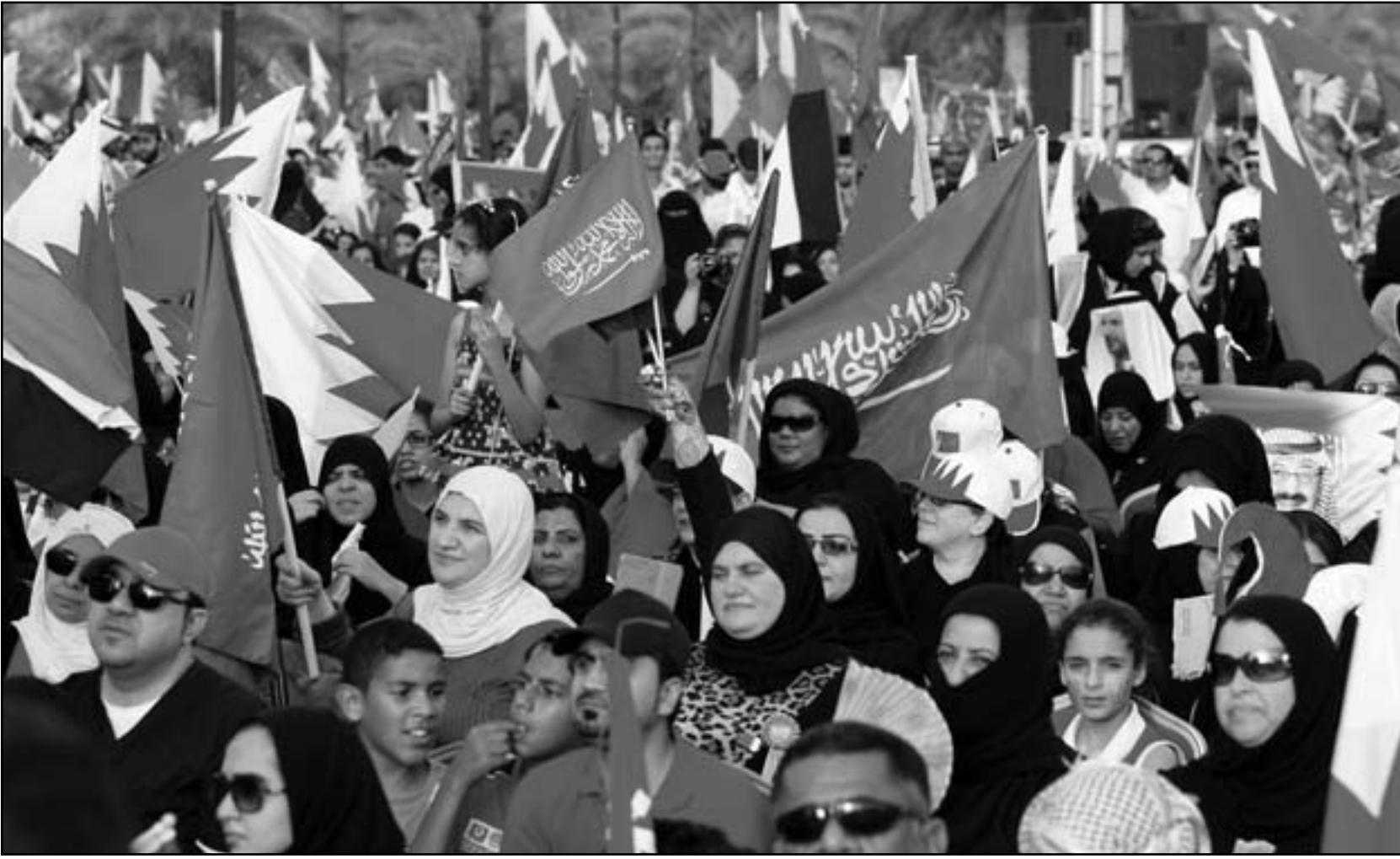
بحرينيون خلال مظاهرة تؤيد الوحدة الخليجية في المنامة

وتواصلت هذه الاحتجاجات على الرغم من حملة القمع الدامية في آذار/مارس 2011 لشهر من التظاهرات. وإيران التي تدعم المعارضة الشيعية في البحرين المناهضة لمشروع الاتحاد، نظمت الجمعة تظاهرات في طهران ضد المبادرة السعودية البحرينية. وفي اليوم نفسه، تظاهر آلاف الأشخاص في البحرين لتبني دعوة المعارضة الشيعية للاحتجاج على المشروع.