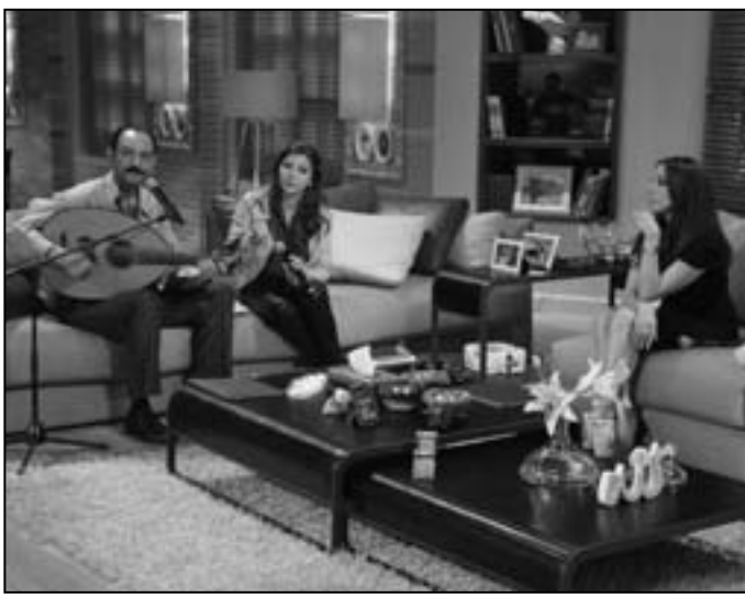
انغام أصالة وعيادي الجوهر في «صولا»

كشف محمد رياض الشقفة، المراقب العام لجماعة الإخوان المسلمين في سوريا، لدى استضافته في برنامج «مع زينة يازجي» الذي يبث امس الأحد (10 يونيو) على شاشة تلفزيون دبي، عن محاولات لإقناع بعض الدول بتزويد الجيش الحر بأسلحة متطورة، ملوحا بأن «عمر النظام السوري بات قصيرا جدا إذا حصل ذلك».