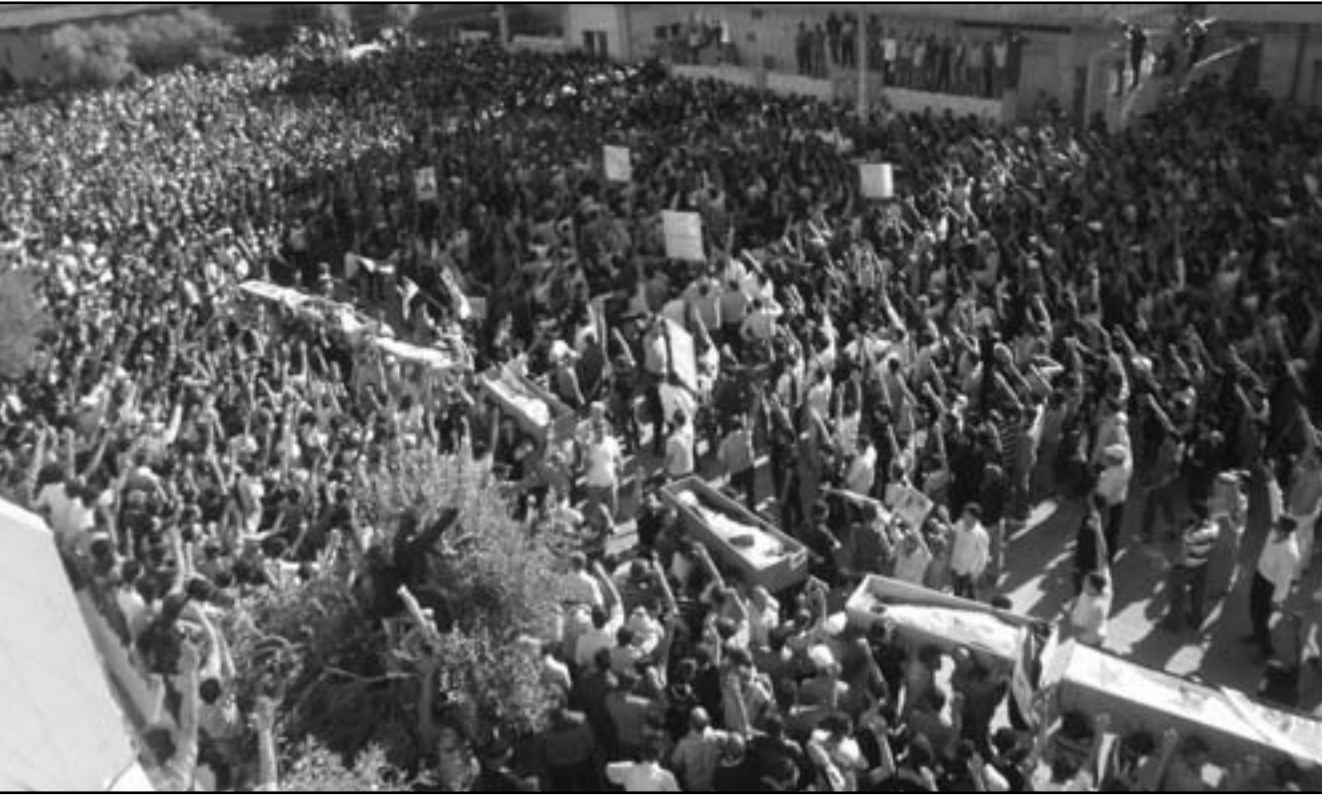
جنازة جماعية لسوريين قتلوا في القصف على درعا السبت

الرمحن لوكالة فرانس برس ان «الجيش يتعرض لكبير خسائر الان في الحفة لان مئات الثمرديين يتحصنون في هذه المنطقة الجبلية». وتقع منطقة الحفة الوعره في الريف الشمالي الشرقي من محافظة اللاذقية الحاذية للحدود التركية. ويتحصن المنشوقن، ومعظمهم عسكريون تابعون للمجالس العسكرية للجيش السوري الحر في الداخل، في هذه المنطقة، التي قتل فيها منذ 5 حزيران (يونيو) نحو 60 جنديا و46 مدنيا ومتمردا. ولتعد عبد الرحمن الي ان الساحل» لم يعد منطقة آمنة، مضيفا ان «البلاد برمتها انخرطت بالحركة الاحتجاجية» التي تنهشها منذ منتصف آذار (مارس) 2011. وأشارت لجان التنسيق المحلية التي تشرف ميدانيا على الحركة الاحتجاجية في البلاد، من جهتها، الى تجديد القصف المدفعي على المدينة بقدائف الهاون منذ الصباح. ولتفت الى اقتطاع شام للتيار الكهربائي عن المدينة والى تخوف الاهالي بسبب سوء الاوضاع الانسانية. وفي ريف حمص، سقط ثلاثة مواطنين اثر القصف الذي تعرضت له بلدة تليبية من قبل القوات النظامية التي تحاول اقتحام البلدة. كما قتل ستة اشخاص بينهم ناشط في منطقة القيسير اثر القصف الذي تعرض له المدينة. وتعرض قرية الغنطو لقصف