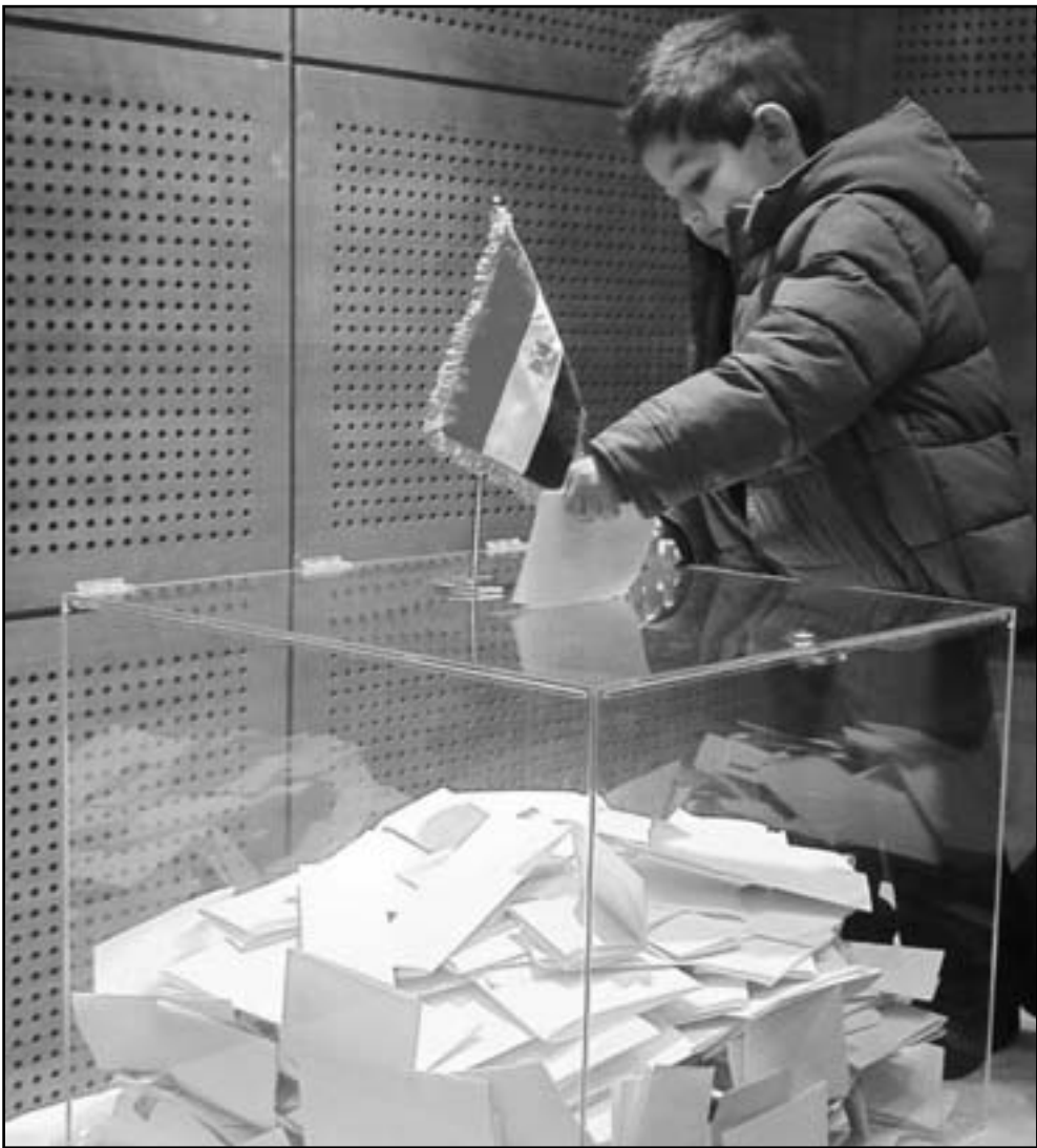
مطل مصري يضع بطاقة الاقتراع في الصندوق بالأسفارة المصرية في لندن