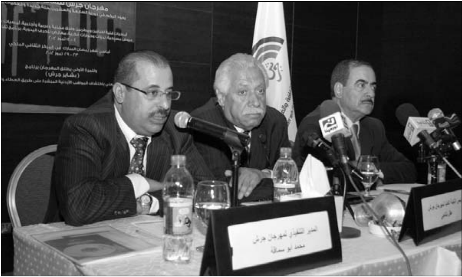
لقطة من المؤتمر الصحفي