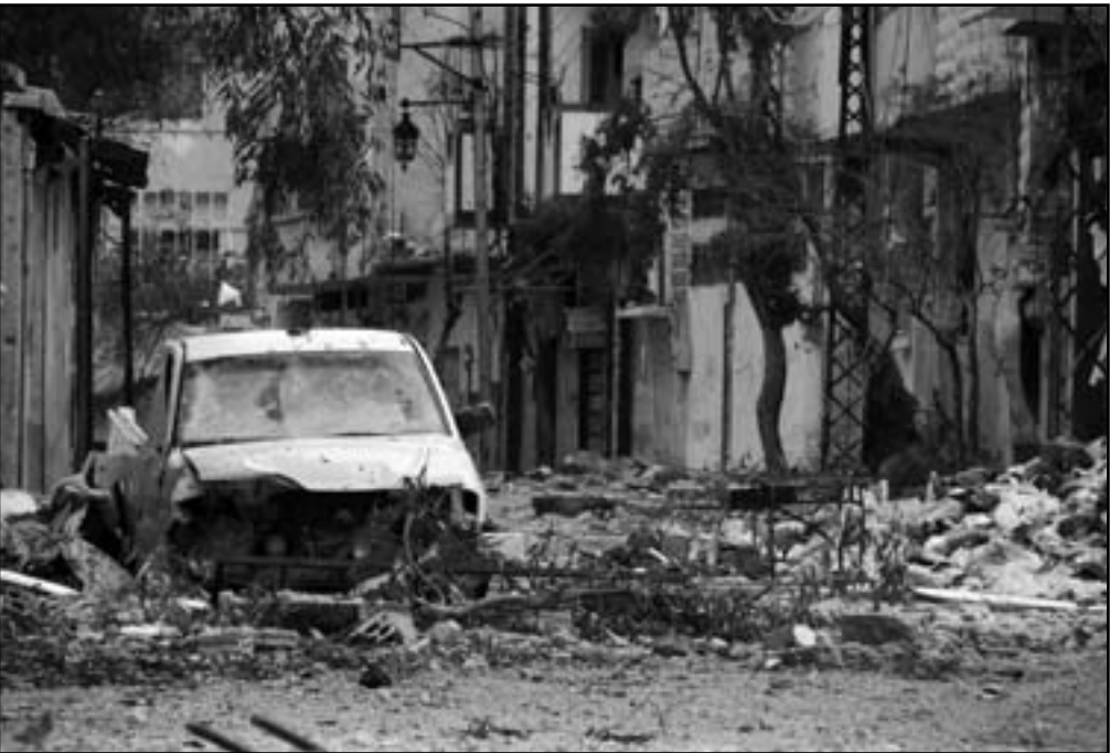
الشعب السوري المذبوح سيرحب بصفص سرايا الاسد

البناء شعيه، في حزيران من العام الماضي، بعد ثلاثة اشهر من اندلاع الاحتجاج المضرج بالدماء القى وزير الخارجية الفرنسي الين جوبييه امام الجمعية الوطنية في باريس خطبا في الموضوع السوري وقال: «ما الذي يمكننا ان نفعله؟ فرنسا لا يمكنها ان تعمل ولن تعمل في غير اطار القانون الدولي».