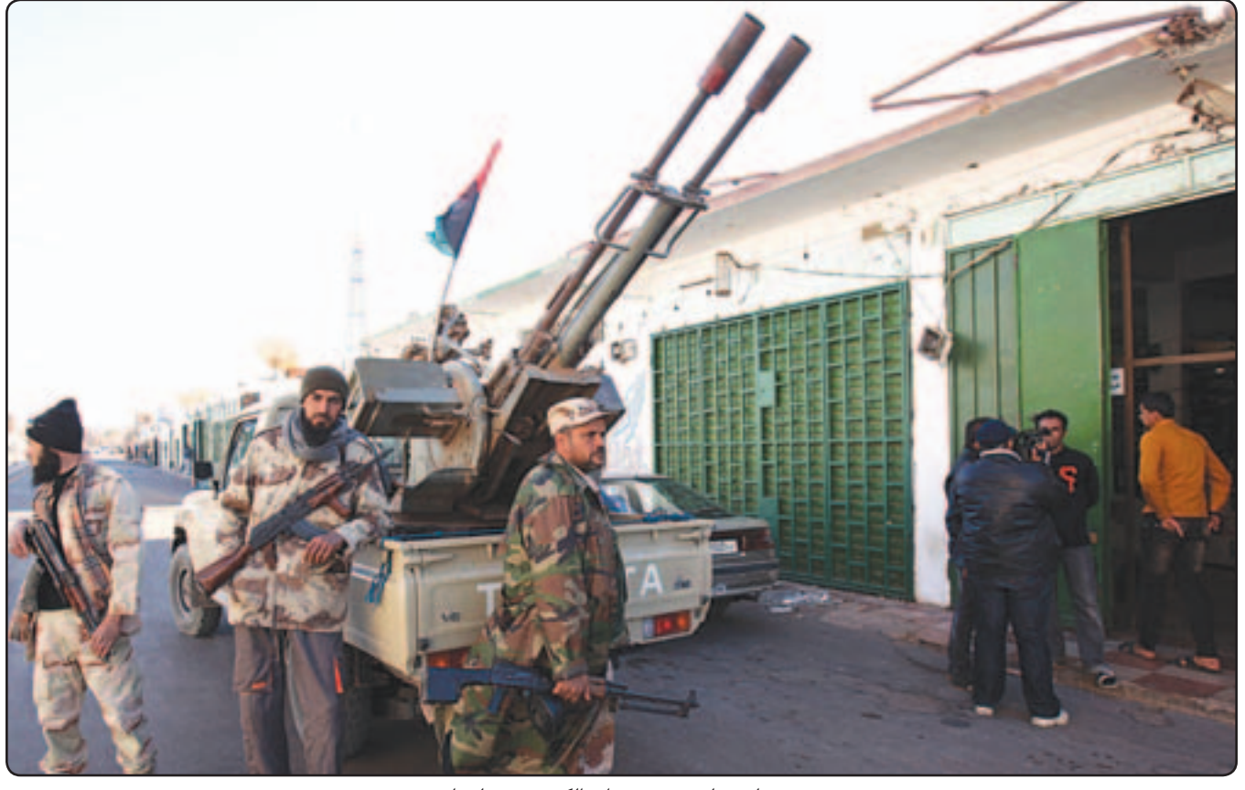
مسلحون ليبيون في شوارع الكفرة جنوب ليبيا

نحس اسام وضع مشابه للوضع الذي كان قائما في افغانستان اثناء الايام الاخيرة للحكم الماركسي، مع فارق اساسي وهو انه لا توجد قوات اجنبية نظامية على الاراضي السورية، فتركيا تلعب دور افغانستان، والسعودية تقوم بدعم قوات المجاهدين ماليًا وعسكريًا، بدعم من الولايات المتحدة الامريكية وحلفائها في الغرب. الحرب الافغانية استمرت ثماني سنوات، وانتهت بسقوط النظام، ثم بعد ذلك بحرب اهلية دموية اتت الى وصول طالبان الى سدس الحكم، ثم احتلال امريكي تحت عنوان الحرب على الارهاب والقضاء على تنظيم القاعدة وحاضنته حركة طالبان.