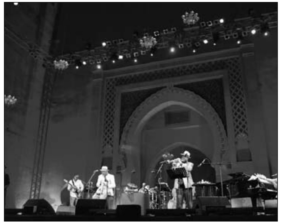
حفلي فني حول عمر الخيام