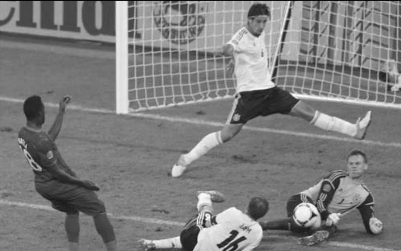
ريكاردو كوستا نجم البرتغال (يسار) فشل في تسديد الهدف في مرعى ألمانيا

وسدد كرة صاروخية من حدود منطقة الجزاء لكن الحارس الألماني تصدى لها وأخرجها إلى ضربة ركنية لم تستغل. وأتاحت أخطر فرص المباراة أمام المنتخب البرتغالي في الدقيقة 88 لكن مانويل نويير تألق في الدفاع عن مرماه وحافظ على الشباك نظيفة. ولم تسفر الدقائق المتبقية عن جديد لتنتهي المباراة بفوز المنتخب الألماني 1/صفر ليقتسم صدارة المجموعة مع نظيره الدنماركي برصيد ثلاث نقاط لكل منهما.