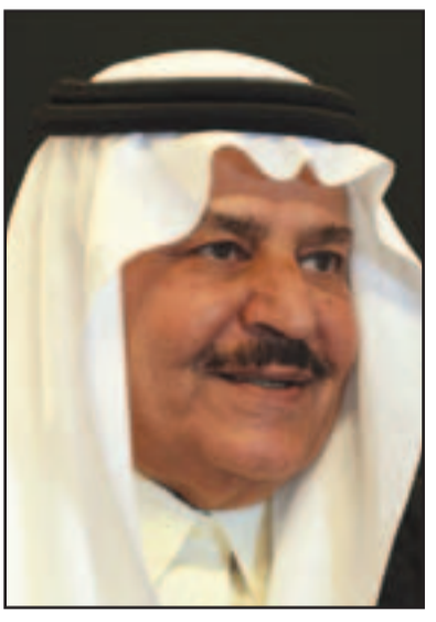
الامير نايف بن عبد العزيز

تتولى مهمة اختيار ولي العهد، ولا يعرف ما اذا كان العاهل السعودي سيفعل هيئة البيعة ام لا خاصة وأنه عين الامير الراحل نايف وليا للعهد دون الرجوع لهيئة البيعة، ويرى مراقبون ان الخلافات تكمن في اختيار ولي للعهد إضافة الى اختيار وزير للداخلية ونائب ثان لرئيس مجلس الوزراء، ليؤوب بن الملك وولي عهده في حالة غيابهما، وهي ثلاثة مناصب حيوية في المملكة، وقالت مصادر داخل العائلة الحاكمة في السعودية لـ«القدس العربي» ان الامير سلمان بن عبد العزيز (سدري) وزير الدفاع الحالي رغم انه الاقرب لولاية العهد، الا ان هذه المصادر قالت ان العاهل السعودي يريد اختيار امير شاب من العائلة، وقال متابعون للشأن السعودي ان الحديث يدور في اروقة العائلة الحاكمة عن اختيار الامير احمد بن عبد العزيز (وهو سدري) وثاني اصغر ابناء الملك الراحل عبد العزيز بعد الامير مقرن رئيس الاستخبارات، والذي يشغل منصب نائب وزير الداخلية لولاية العهد، وان يتم تعيين الامير محمد بن نايف الذي يشغل منصب مساعد وزير الداخلية ونجل ولي العهد الراحل نايف بن عبد العزيز محل والده كوزير للداخلية، الا ان هذا الترتيب سيغضب الكثيرين من ابناء الملك المؤسس والاولاد الذين يتطلعون الى تقلد منصب سيادي بمجرد شغوره سواء بالوفاة او الاعفاء.