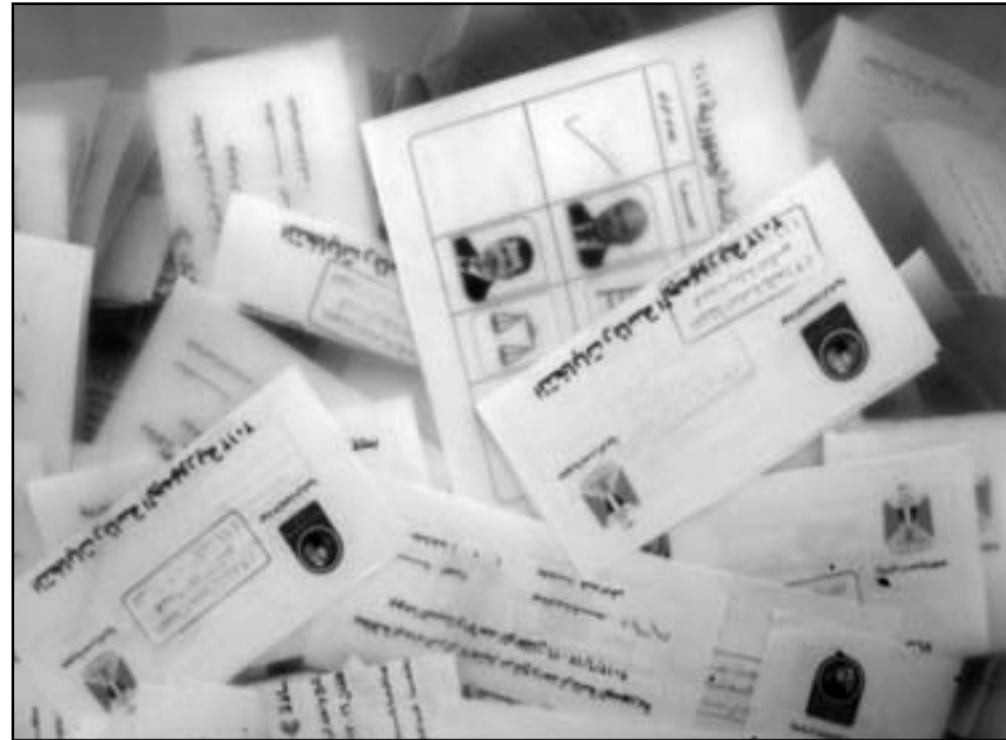
اوراق الاقتراع في احد الصناديق

القاهرة - ا ف ب: صوت المصريون الاحد في اليوم الثاني والآخر من الدور الثاني للانتخابات الرئاسية التي تشهد تنافسا محمومًا بين قيادي سابق في عهد مبارك ومرشح الإخوان المسلمين في اجواء مشحونة تنذر بمواجهة بين الحركة الاسلامية والجيش العسكري الحاكم الذي سيحفظ بصلاحيات هامة، ومن المقرر ان تعلن النتائج الرسمية الخميس لكن يرحب ان تعرف هوية رئيس مصر الجديد قبل ذلك.