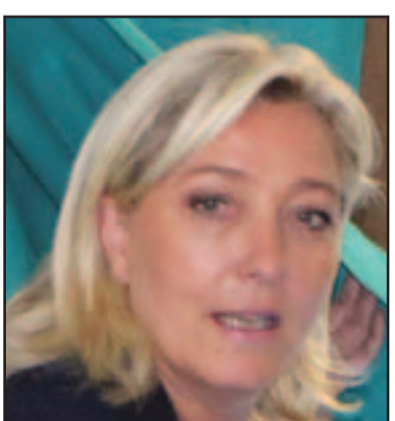
زعيمة اليمين المتطرف مارين لوين

بيروت - دمشق - القاهرة - وكالات: قتل 45 شخصا في اعمال عنف في سورية الاحد، في وقت استمر القصف والحصار المفروض من قوات النظام على احياء في مدينة حمص في وسط البلاد، فيما دعا المجلس الوطني السوري المجتمع الدولي الاحد الى «اتخاذ موقف حاسم، بعدما علقت الأمم المتحدة عمل بعثة المراقبين والسبب بتفاقم العنف في سورية. وقال عبد الباسط سيدا رئيس المجلس الوطني السوري ان هذه الايام حاسمة في تاريخ الثورة السورية، متهمًا حكومة الرئيس السوري بشار الأسد بأنها مصممة على مواصلة نشر روح الغضب والحرب في سورية، وذكر سيدا بعد اجتماع مع جماعات معارضة في إسطنبول ان المجلس الوطني السوري سيدعو «مجموعة اصدقاء سورية» التي يدعها الغرب إلى ان تتخذ إجراء إذا تمت عرقلة محادثات التوصل لاتفاق دولي بسبب استخدام حق النقض (الفيتو) في مجلس الامن الدولي. وقال سيدا في مؤتمر صحافي عقده في إسطنبول «نطالب بقوة مجلس الامن بان يتخذ قرارا حاسما عن طريق الشرعية الدولية، لكن في حال جوبهنا بغيقو