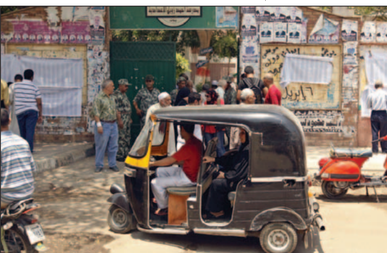
«توك توك» ينقل إحدى الناخبات الى مقر لجنة الاقتراع بمنطقة شعبية في القاهرة امس