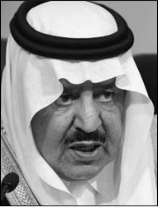
ولي عهد السعودية الامير نايف بن عبد العزيز رحمه الله

الا ان وزارة الداخلية قمت كذلك ناشطين حقوقين الامر الذي دفع بمنظمات حقوق الانسان الى انتقادها. ودليلا على نهج المحافظة، كان الامير نايف اعلن للصحافة انه لا يرى فائدة من انتخاب اعضاء مجلس الشورى، وعدمهم 150 يعينهم الملك، او من وجود النساء في المجلس. كما دفع احبانا عن رجال هيئة الامر بالمعروف والنهي عن المنكر المتهمين بسوء التصرف في بعض الاوقات. وفي الاشهر المنصرمة، حوصرت اجهزة وزارة الداخلية على عدم اطلاق تظاهرات مماثلة لما يجري في بعض البلدان العربية. وتقدم الامير نايف بالشكر علنا للسعوديين نظرا لعدم تجاوبهم مع دعوات للتظاهر اطلاقا ناشطون محليون. وتشرف وزارة الداخلية كذلك على الامن في المنطقة الشرقية الغنية بالنفط، حيث تعيش غالبية الاقلية الشيعية التي تشهد حراكا تعتبره الرياض بايعاز من ايران متهمه اياها بالتدخل في شؤونها الداخلية. واما ولي العهد الراحل علاقات جيدة في معظم اعداء العالم العربي، لكنه اتخذ موقفا متشددا حيال ايران بسبب انهاء زلاتها العام 1975. كما كانت لديه علاقات وثيقة مع الاوساط الدينية المحافظة التي تعارض تفكحا اكبر في المجتمع السعودي. ولد الامير نايف، الابن الثالث والعشرون للملك المؤسس، العام 1933 في الطائف وتولى امانة الرياض عندما كان في العشرين من العمر قبل ان ياتيا لوزير الداخلية العام 1970 ثم تم يتسلم الوزارة ناهتا العام 1975. وتم تكليف نجله الامير محمد بن نايف برنامج المناصحة لتاهيل المتطرفين المعادين من غوانتاناو، وقد تعرض في اب/اغسطس 2009 لمحاولة اغتيال نفذها احد عناصر القاعدة قادما من اليمن. الا ان وزارة الداخلية قمت كذلك ناشطين حقوقيين الامر الذي دفع بمنظمات حقوق الانسان الى انتقادها.