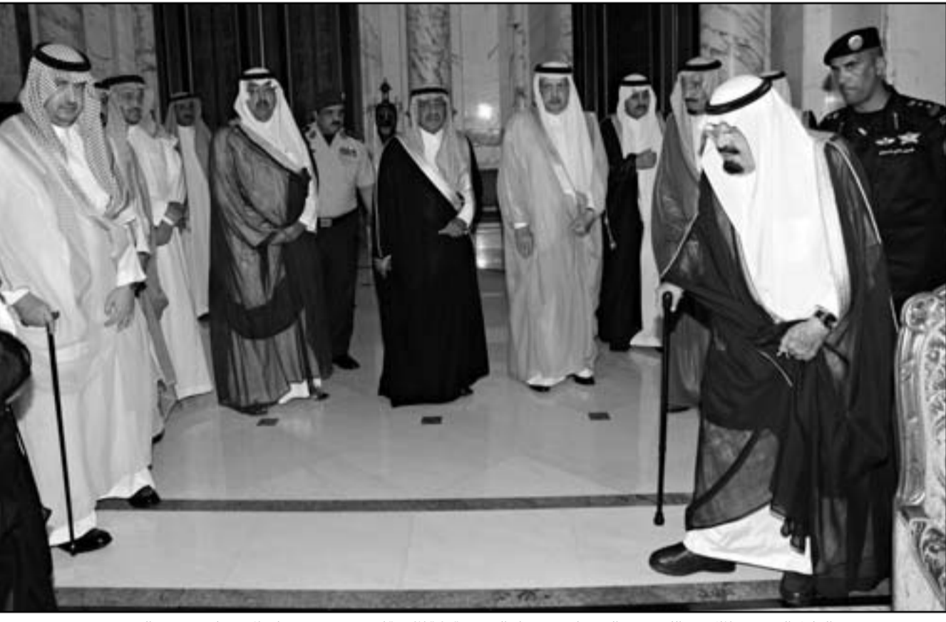
العاهل السعودي الملك عبد الله بن عبد العزيز لدى وصوله الى مدينة مكة المكرمة لحضور تشييع جنازة الامير نايف بن عبد العزيز

ووصل قادة عرب لتقديم واجب العزاء من دول مجلس التعاون الخليجي وكما وصل ملك الاردن عبد الله الثاني وشقيق ملك المغرب الامير مولاي رشيد والرؤساء الفلسطينيين محمود عباس والسوداني عمر البشير واليمني عبد ربه منصور هادي والقرغي عبد الله غول ورئيس وزراء لبنان نجيب ميقاتي، وامير الكويت صباح الاحمد الجابر الصباح، وامير دولة قطر الشيخ حمد بن خليفة آل ثاني، وملك البحرين الملك حمد بن عيسى آل خليفة، والمشير محمد حسين طنطاوي رئيس المجلس العسكري بمصر، والعديد من قادة الدول او مندوبين عنهم، جاء ذلك فيما اعلنت دول عربية الحداد على وفاة الامير نايف بن عبد العزيز، على رأسها دول الخليجية. وقرر مجلس الوزراء الاردني اعلان «الحداد العام» في المملكة الاحد على وفاة ولي العهد السعودي الامير نايف بن عبد العزيز، على ما افاد مصدر رسمي اردني. وقالت وكالة الانباء الاردنية الرسمية انه «بتوجيهات من الملك عبدالله الثاني قرر مجلس الوزراء في جلسته التي عقدها مساء السبت (الثلاثاء) برئاسة رئيس الوزراء فايز الطراونة اعلان الحداد العام في المملكة يوم غد الأحد بوفاته الامير نايف بن عبد العزيز ولي العهد وزير الداخلية السعودي». من جانب آخر، أجرى العاهل الاردني الملك عبد الله الثاني، الذي يقوم حاليا بزيارة للندن، السبت اتصالا هاتفيا بخادم الحرمين الشريفين الملك عبد الله بن عبد العزيز «اعرب فيه عن اصدق مشاعر التعزية والمواساة بوفاته الامير نايف بن عبد العزيز»، على ما افاد بيان صادر عن الديوان الملكي الاردني. واكد الملك عبد الله خلال الاتصال ان «المملكة العربية السعودية والامة العربية جمعاء فقدت برحيل سموه احد ابرز رجالاتها الذي