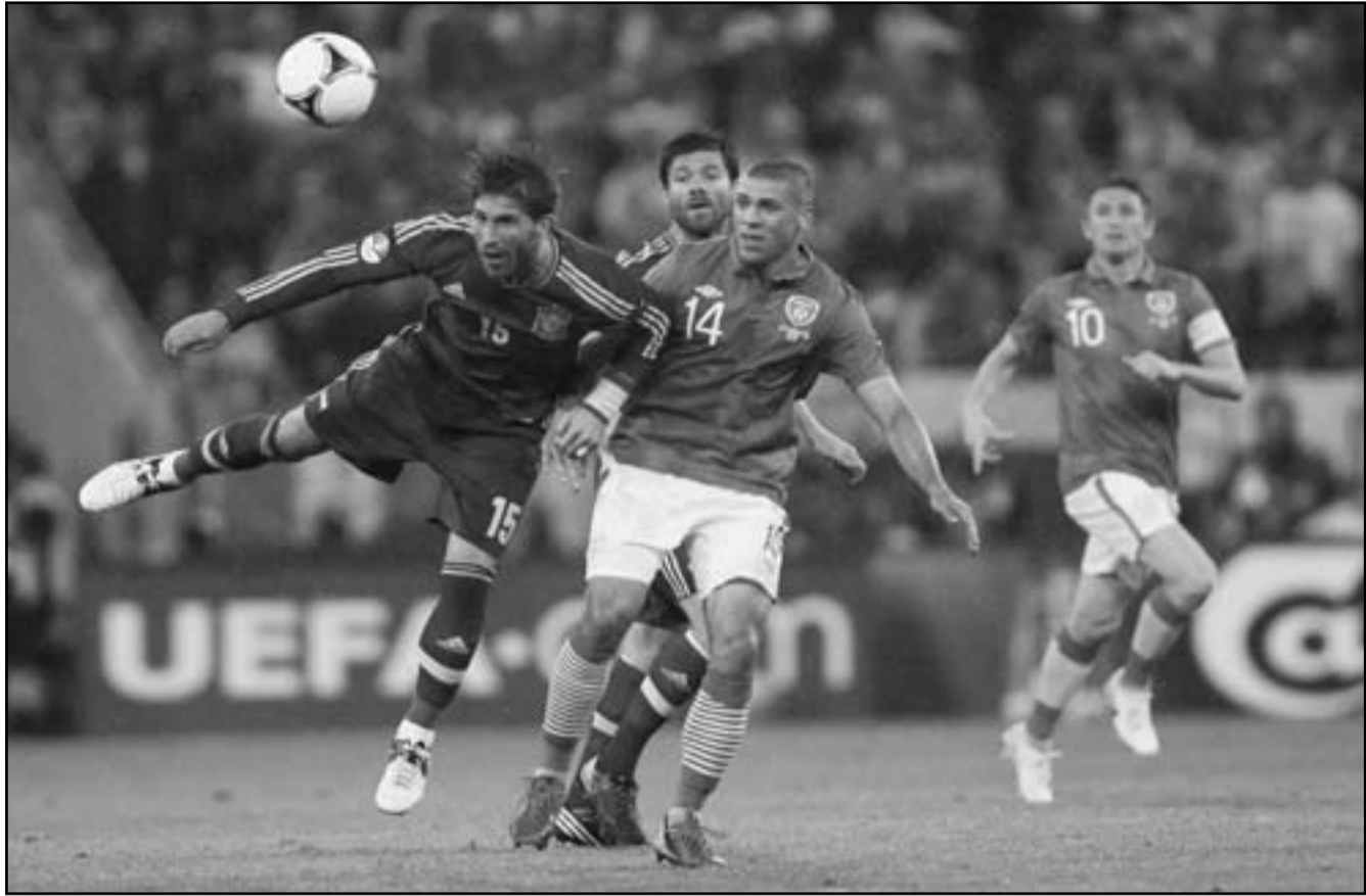
الونسو نجم منتخب اسبانيا (يسار) قفز مع زميله سيرجيو راموس في الهواء لملاحقة الكرة خلال المباراة مع ايرلندا

■ وارسو - د ب أ: تعهد المنتخب الإسباني بالفوز على كرواتيا اليوم الاثنين في الجولة الثالثة الأخيرة من مباريات المجموعة الثالثة ليورو 2012، الأمر الذي قد يسمح للفريق الإيطالي بانتزاع بطاقة التأهل الثانية إلى دور الثمانية في حال فاز الأزوري على نظيره الإيرلندي.