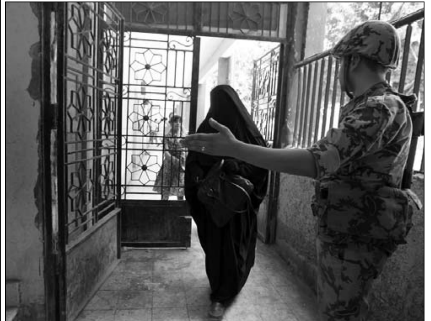
سيدة منقبة تدخل لجنة للاقتراع بالقاهرة امس

وبين الهضيبي ان الاخوان المسلمين خسروا الكثير في الاشهر الاخيرة بسبب «مراكمة الاخطاء» الناتجة عن «ادارتهم لعبة سياسية يادوات القانون (..) ولم ينتبهوا الى ضوابط المرحلة الانتقالية التي تحكم بالسياسة والتوافق وليس بالقانون والاغلبية العديدة».