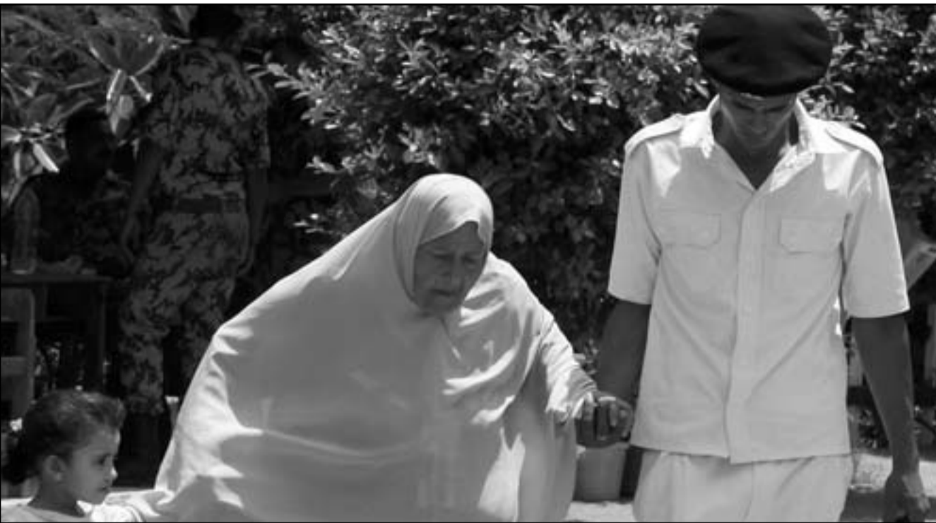
شرطي يساعد احدى الناخبات على الوصول للجنة الاقتراع بالقاهرة امس