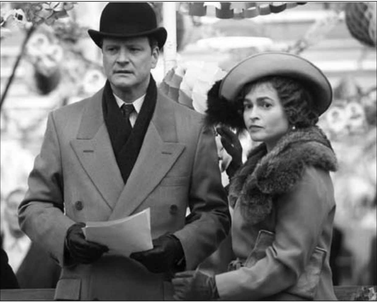
لقطة من فيلم «خطاب الملك»

انتبه أرسطو طاليس لوزن الخطابة في السياسة منذ القدم، وخصص لها كتابا. وحاليا زادت أهميتها بفضل وسائل الإعلام، لقد غدت ممارسة الحكم تجري تحت أضواء الكاميرات وتلصص الميكروفونات... وتستضيف القوات التلفزيونية يوميا عشرات المتحدثين رغم أن الخطباء الموهوبين بينهم قليلون جدا... لذا تطرقت السينما للموضوع وقدمت حكاية أمير طلب منه والده الملك جورج الخامس عملا بسيطا، قراءة خطاب على الراديو، نحن في منتصف ثلاثينيات القرن العشرين، كانت الب بى سي حينها سلاح بريطانيا الإعلامي... كان الميكروفون مدفع المرحلة... وبه يبدأ جنريك فيلم خطاب الملك 2010 من إخراج توم هوبر Tom Hooper. وهو فيلم حصل على عدة جوائز أوسكار، منها أوسكار الصورة، وفيه صورة ساحرة لا توفر على إمكانيات تحليل كيف صنعت.