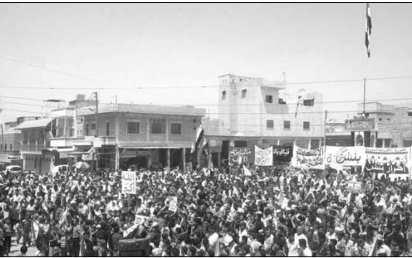
الآلاف يشاركون في تظاهرة ضد النظام في بنش قرب ادلب

والقادرة على ضرب الهدف من مسافة 180 ميلا، وعلى الرغم من كل هذه التصريحات التي صدرت عن المسؤول الروسي الا ان الحبلين تساموا عن قدرة النظام الدفاعي الروسي الذي ركبته في دول الشرق الاوسط وقدرته على الصمود امام القوة العسكرية الغربية، ومن هنا فان التصريحات هذه لا تحمل الا طابع سياسيا، كما ان الدفاعات الجوية السورية تظل ناضجة خاصة صواريخ اس-300 ذات المدى بعيد، ولعل محلل روسي من قدرة سورية على الدفاع عن نفسها في حالة تدخل الناتو، مشيرا الى ان دمشق لم تكن قادرة على الدفاع عن نفسها عام 2007 عندما هاجمت اسرائيل منشأتها النووية، على الرغم من الميزانية السنوية (500 مليون دولار) التي تخصصها سورية لشراء الاسلحة الروسية.