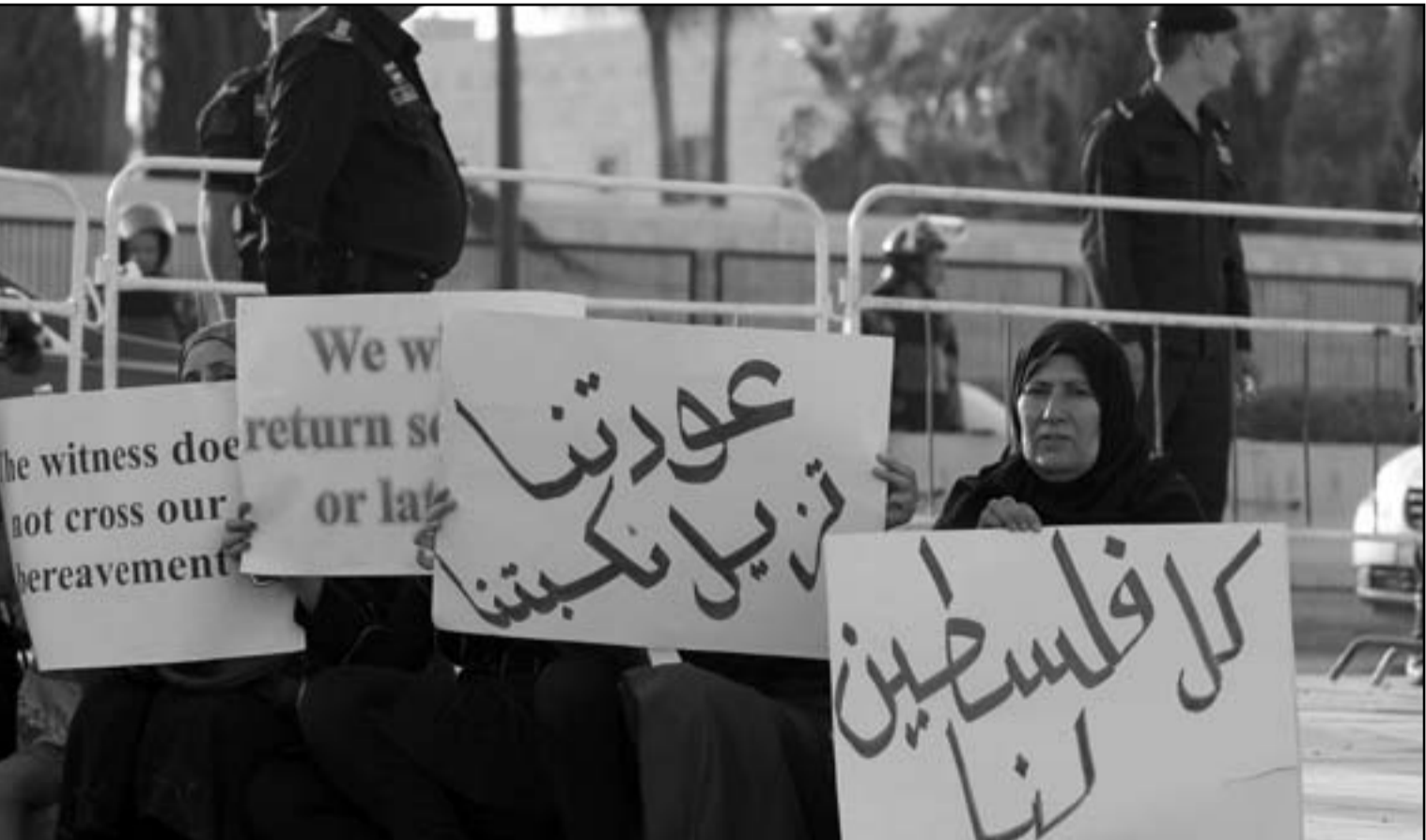
أردنيون من اصل فلسطيني يتظاهرون بساط عمان مطالبين بحق العودة

الإسلاميون بدورهم لديهم تصور مختلف لنظام الإنتخاب مؤسس ومفصل على مقاس موجات الربيع العربي وردة فعلمهم الأولى على صيغة حلف الصوت الواحد كانت إعلان التمدد بالقانون الجديد وإعتباره محاولة واضحة للفتنة بالشعب على حد تعبير القيادي المعتدل سالم الفلاحات ووصفة للتصعيد سنتهي بجبهة شعبية وطنية عرضة تقاطع الإنتخابات حسب الشيخ زكي