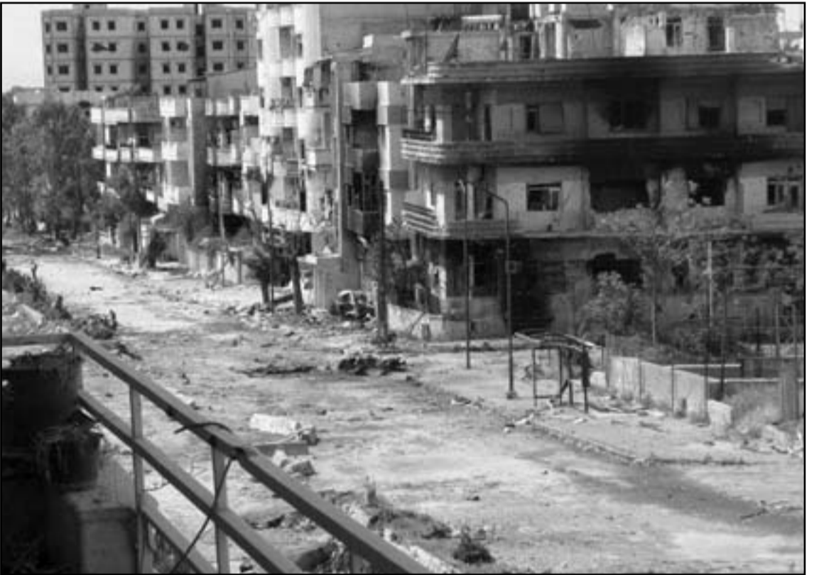
الدمية الروسي للاسد سيستعد حتى سقوطه

وحرج من ناحية الصناعة العسكرية الروسية ويمكن التخمين بانه سيستمر حتى سقوطه الاسد، ومع ذلك، يخيل أن الروس الذين اتخذوا في البداية خطا رسميا برفض التدخل في ما يجري في سوريا، أصبحوا الآن لاعبا مركزيا في ما يحصل هناك، روسيا تتخح حصانة دبلوماسية لسوريا، كي تمنع كل قرار معاد ضد سورية، في مجلس الأمن في الامم المتحدة، وفي نفس الوقت تتأكد من أن تتمكن قوات الاسد من مواصلة ضرب المعارضة بأسلحة اضافية.