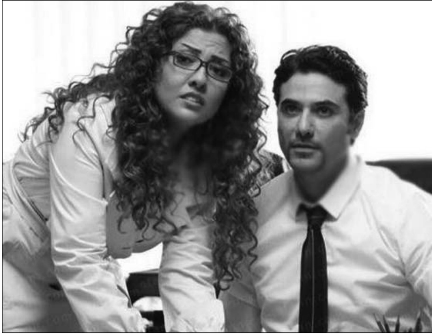
أحمد عز في لقطة من فيلم «حلم عزيز»

أول مرة يطرح للنجم الشاب أحمد عز فيلمين سينمائيين في وقت واحد هما «المصلحة» أمام أحمد السقا و«حلم عزيز» من بطولته المطلقة. التجريبتان مهمتان في مشوار أحمد عز لأن الأولى جمعه بنجم آخر فهل يمكن التجربة الثانية من النوع الكوميدي المفضل عند عز فهل طرحها لحاجة الناس للضحك وما مدى تأثير الفيلم على إيرادات بعض؟ ■ ما رأيك في الاتجاه للبطولات المشتركة التي تجمع عدد من النجوم كما فعلت بفيلم «المصلحة»؟ ■ العمل الفني عمل جماعي ولا يتفوق فيه أحد على غيره، فأراه مثل مباراة كرة القدم الجميع يساعد بعضه للوصول إلى الهدف وبالسينما تهدف إلى وصولنا لقب المشاهد وتحقق له المتعة الفنية والرسالة السينمائية. ■ تردد حدوث مشاكل بينك وبين أحمد السقا طوال تصوير فيلم «المصلحة» وهذا يجعل المنتج يخشى من جميع أكثر من نجم في فيلم واحد، ما تعليقك؟ ■ إذا كانت الشائعات ستحدد اتجاهنا الفني فهو أمر سيء جداً، أؤكد أن علاقتي مع أحمد السقا جيدة جداً ولم تحدث مشاكل فيما بيننا، والدليل على ذلك رغبتني في تكرار العمل معه مرة أخرى، فأنا شاركت بفيلم «المصلحة» من خلال ورق وسيناريو جيد كتبته وائل عبدالله، وتعاملت مع مخرجة أحب التعاون معها دائماً وهي ساندرا نشأت لأنها مميزة جداً ولها تأثير كبير في خطواتي الناجحة بالسينما. ■ كيف أجدت اللهجة البدوية بالفيلم؟ ■ جلست مع الكثير من البدو الذي ساعدوني جداً لأتعرف على طبيعة حياتهم، واكتشفت أن كل منطقة بدوية تتحدث بطريقة ولهجة تختلف عن غيرها، ولذا حاولنا الوصول إلى لهجة