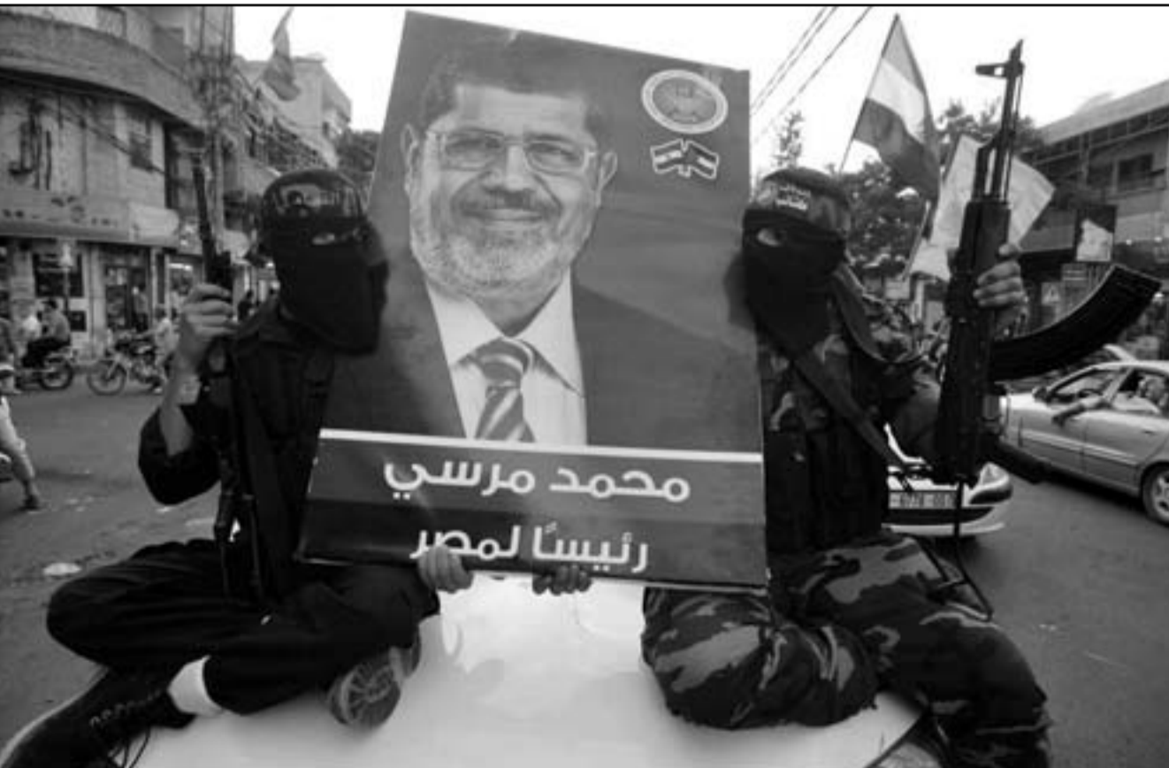
عصران من كتابات القسام يحتفلان في غزة بفوز مرسي