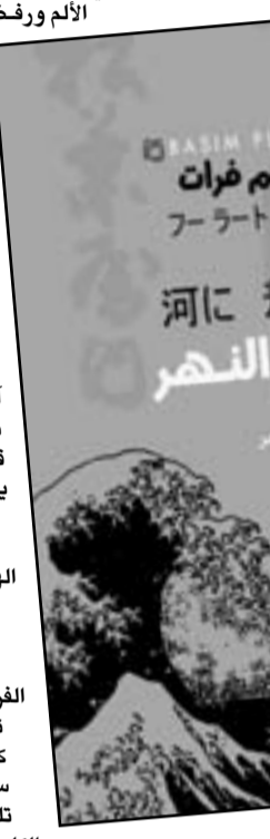
القصيدة: «الأم (الماضي)»

ويضمن الديوان نصوصا عديدة توظف المكان توظيفاً جمالياً بشكل القصيدة وأبعادها الالمانية والرمزية، تتخذ هذه القصائد في ذواتها ارتباطاً وثيقاً بتجليات إنسانية تخدم قيم الحبة والسلام والخير والتعايش والتواصل... وغيرها من القيم الإنسانية الرفيعة التي طلائها تغنى بها الشعر وجسدها بأشكال تعبيرية متنوعة، وإذا كان النضال السابقين اللذين تعاملنا معهم قد وظفوا المكان في تجلياته الحاضرة منطلقاً لتشكيل المتخيل وبناء دلالة النص، فإن الشاعر يعون في نص جميل إلى استعادة التاريخ والأسطورة وتوظيفهما لتشكيل متخيله ورؤيته للآتي، وهو نص يرحل عبر الأزمنة ليقول معانيه ويرسل إشارات.