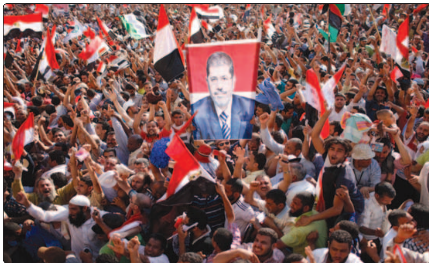
متظاهرون في ميدان التحرير بالقاهرة يحتفلون بفوز محمد مرسي بانتخابات الرئاسة