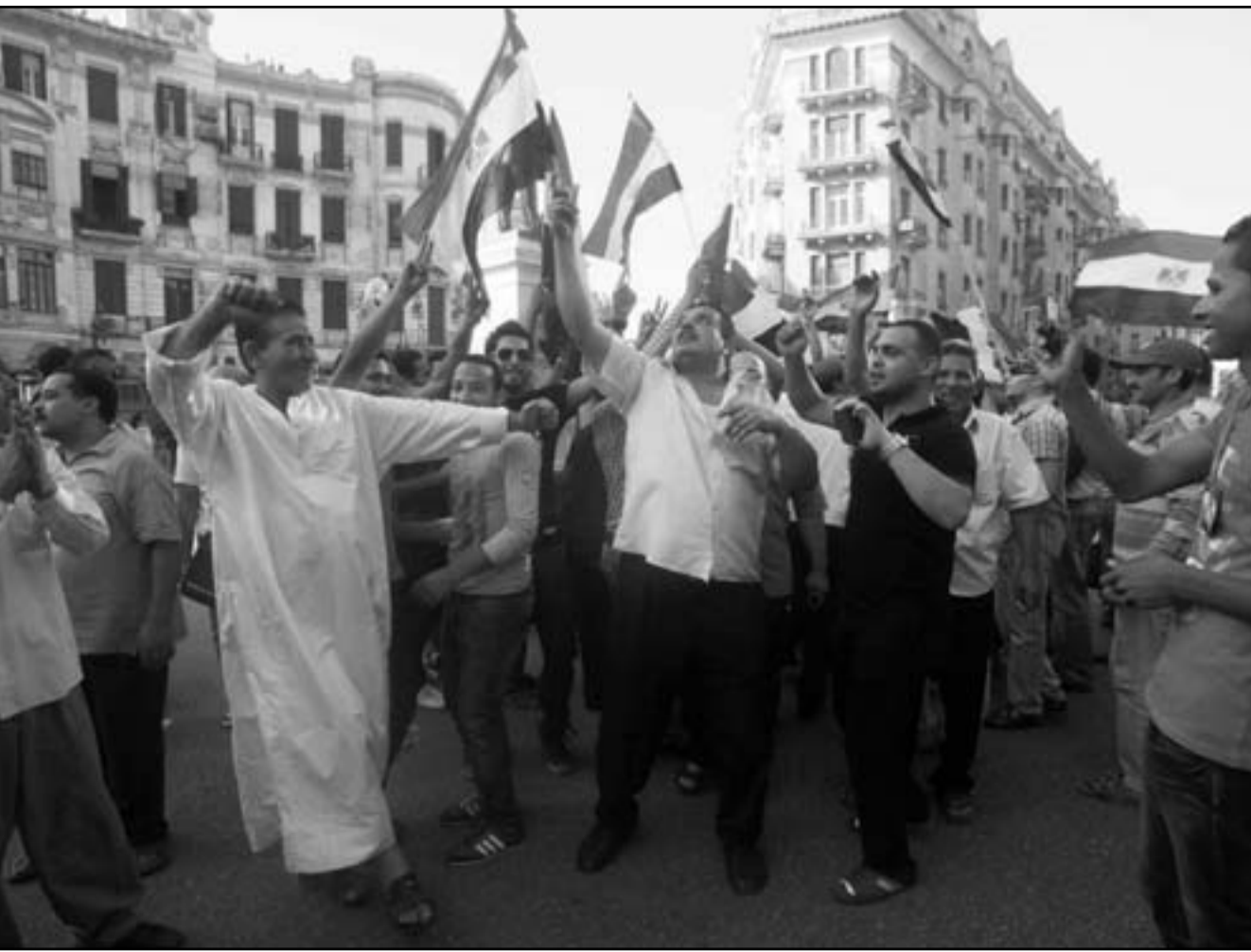
مصريون يحتفلون في القاهرة امس بفوز مرسي

البارزة بنيا فوز مرشح حزب الحرية والعدالة المصري المنتخب عن جماعة الإخوان المسلمين محمد مرسي برئاسة مصر امس الأحد، حيث تباينت ردود فعلها على وصول مرشح الإخوان إلى سدة الحكم في مصر. وذكرت صحيفة «نيويورك تايمز» على موقعها على شبكة الانترنت تعليقا على فوز مرسي أن جماعة الإخوان المسلمين باتت قريبة أكثر من أي وقت مضى من حلمها الخاص ببناء «ديمقراطية إسلامية جديدة» بعد 84 عاما من ممارسة نشاطها في الخفاء وداخل السجون. وأضافت أنه بإعلان فوز مرسي تكون الجماعة فازت بانتصار رمزي وحصلت على «سلاح جديد» في صراعها على السلطة مع المجلس العسكري الحاكم لمصر. أما صحيفة «وول ستريت جورنال» فكتبت تقول إن فوز سياسي إسلامي محسوب على الإخوان المسلمين، سوف يبعث برسائل وموجات صدمة عبر العالم العربي الذي كان خاضعا على مدار عقود