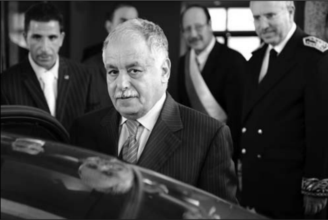
صورة اخذت خلال زيارة سابقة للبغدادي المحمودي الى تونس في العام 2010

قرار التسليم (الخاص بالمحمودي) من قبل الرئيس».