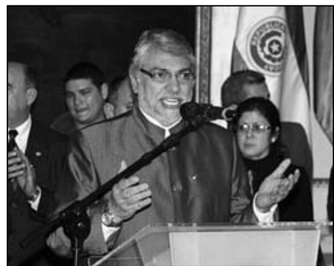
رئيس الباراغواي المغال فيرناندو لونغو

بعض البرلمانات هي التي تغذ هذه الانقلابات. والمثير أن بعض المقالات يعتبره مغالاة للغاية، وتبرز افتتاحيات الصحف أن المؤسسات العسكرية كانت تنفذ في الماضي الانقلابات ضد الرؤساء ولكن اليوم أصبحت