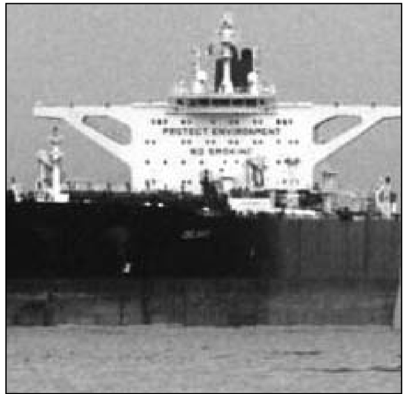
ناقلة نفط إيرانية

مدرجة ضمن عقوبات الأمم المتحدة لكن مالطا وقبرص تعرضتان لضغوط متزايدة من الاتحاد الأوروبي لوقف رفع أعلامهما على سفن مرتبطة بالحكومة الإيرانية. وترفع شركة الناقلات الإيرانية أعلاما لجزر توفالو على 11 ناقلة على الأقل من ناقلاتها النفطية البالغ عددها 39 ناقلة بينما ترفع علم تزانزيا على ناقلتين على الأقل. وأظهرت بيانات رويترز لتتبع السفن أن ناقلتين تحملان الآن اسمي «بايونير» و«إليبت» تنحدران في البحر الأحمر صوب أوروبا اليوم الأحد حيث يبدأ سريان الحظر على واردات النفط الإيراني في الأول من تموز (يوليو)، وامتنعت شركة الناقلات الإيرانية عن