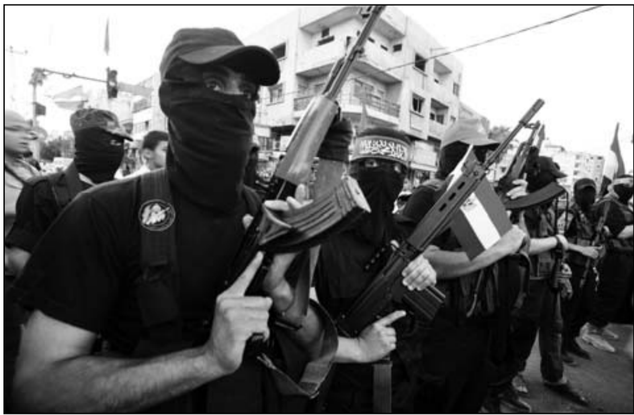
اسرائيل ستحاول التهدئة فهل لتتزم حماس؟

الجيش يعرف جيدا تسلسل الاحداث التي ادت الى اطلاق حماس النار أمس، في تقويمات الوضع التي جرت على مدى يوم امر طرح السؤال: هل ستكتفي حماس بالرد على ضرب المواطنين وستتمسك بالتزامها لمصر بالعودة الى وقف النار، ام ربما ستترجع عن هذا الالتزام وعندها سيعود الجنوب الى الاشتعال؟ الجواب سنعرفه فقط في اثناء اليوم القريب القادم. اسرائيل من جهتها ستحاول الا تثير حماسة المنطقة وتركيز نشاطها على خلايا اطلاق الصواريخ، الكرة، الان، في يد حماس.