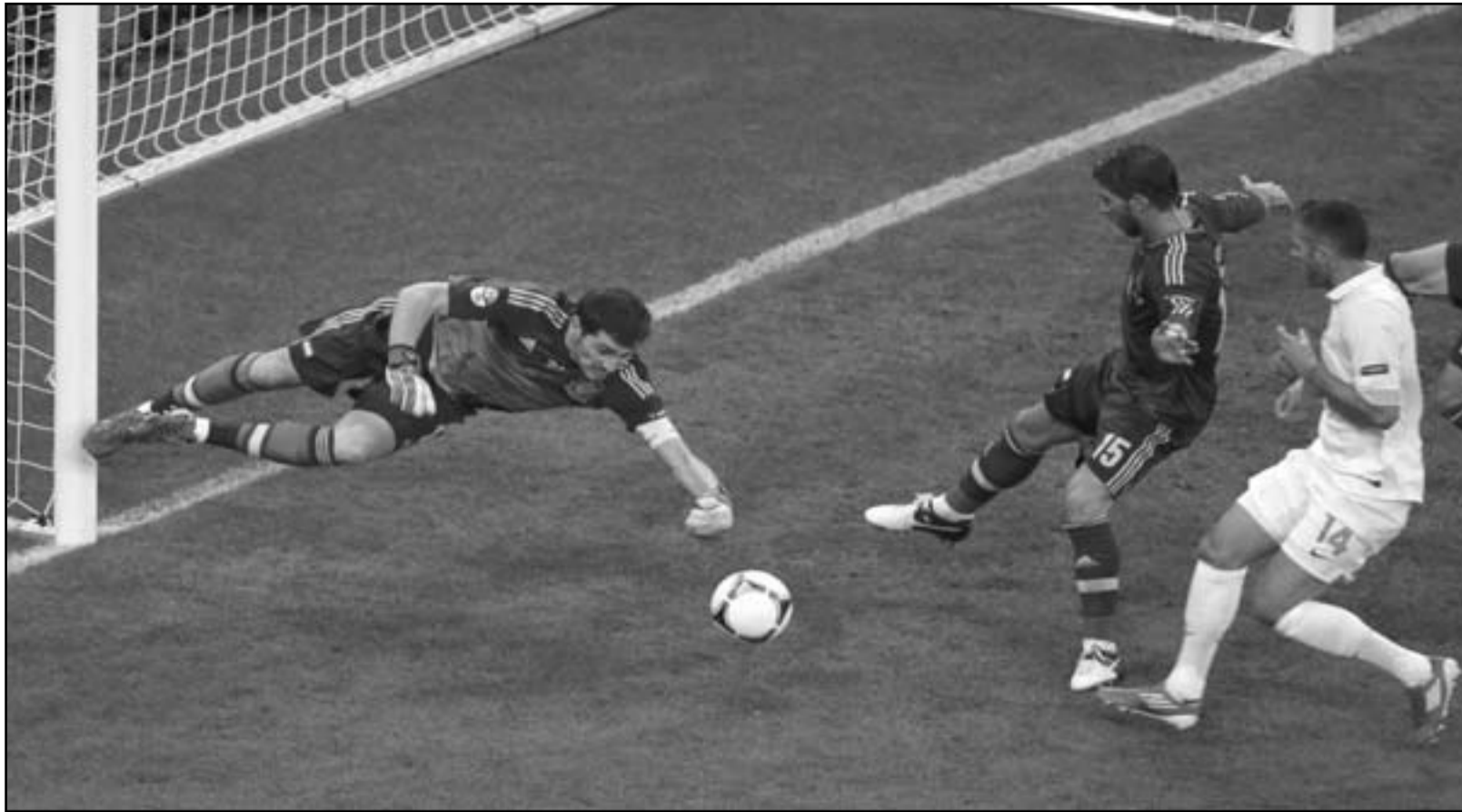
جيرمي مينيز نجم منتخب فرنسا (يمين) يراقب سيطرة حارس مرمى اسبانيا على الكرة

2012، حيث حظيت اسبانيا بنسبة 70 بالمائة من معدل المشاهدة.