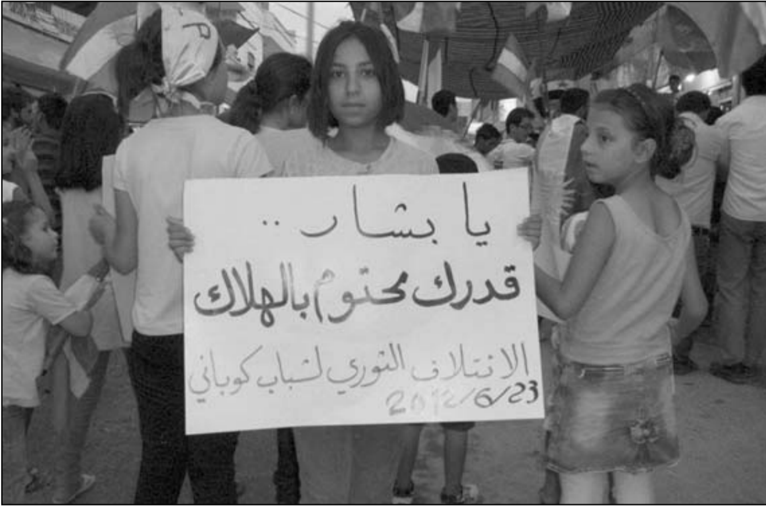
سوريون وكراد يتظاهرون ضد النظام السوري في منطقة كوبياني قرب حلب

منطقة حظر جوي فوق سورية ويشدد عقوبته على النظام السوري وكبار مسؤوليه، بحسب ما افاد مصدر رسمي. وقالت وكالة انباء الشرق الاوسط المصرية ان ذلك جاء في بيان صدر في ختام اجتماع كتب البرلمان العربي في مقر جامعة الدول العربية استمر يومين.