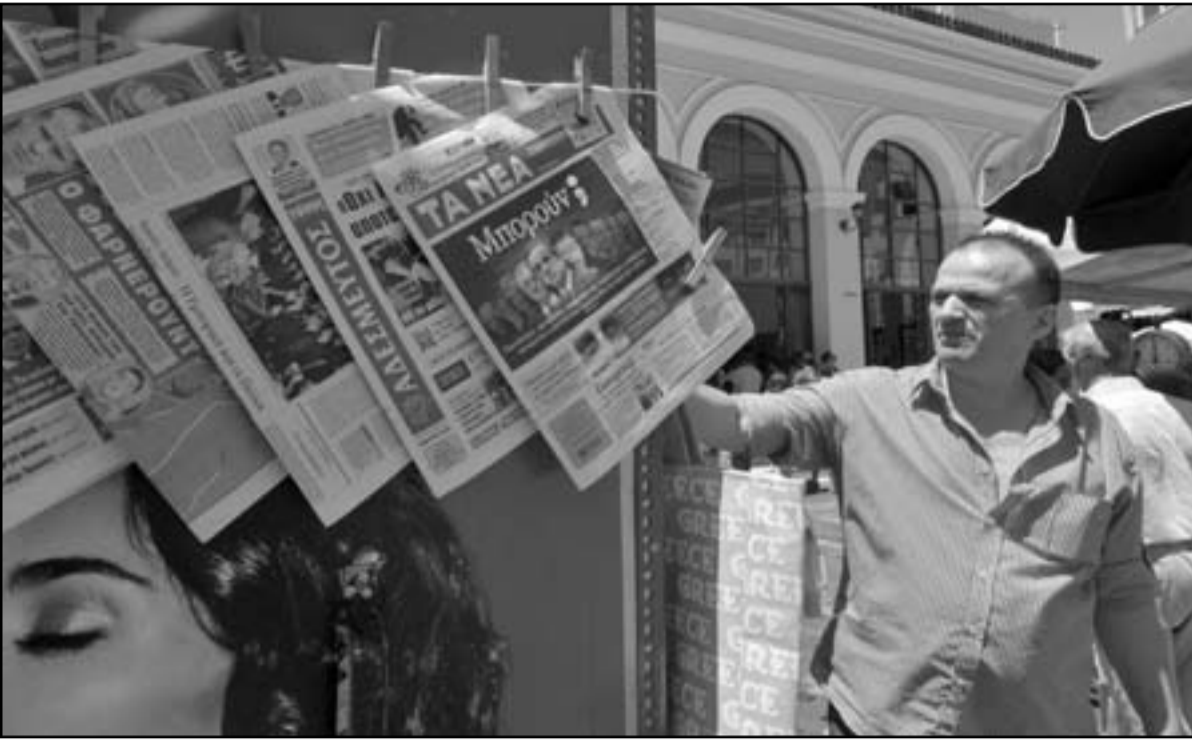
يوناني يتفقد الصحف لمتابعة مفاوضات المساعدات الإضافية للبلاد

لوزارتها تتمثل في جهود الإنقاذ التي بدأت وثمة برنامج واضح هدفه استقرار اليونان مشيرة إلى أن لجنة المدينين الماليين التابعين