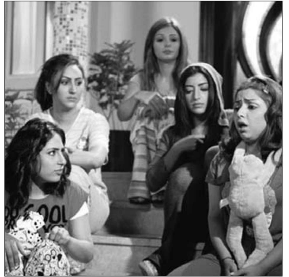
لقطة من مسلسل «ملحقات»