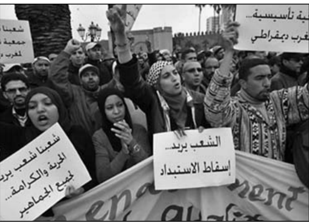
مغاربة يتظاهرون مطالبين بالبحرية والكرامة للجميع

العدالة والتنمية للحد من الفساد الذي وعد بمحاربه قبل الانتخابات؟ وهل محاربة الفساد هي نشر لوائح المستفيدين من رخص النقل؟» واعدت منيب يوم اول امس السبت باكادير، أن ضعف اليسار وتشتت جماعته العدل والاحسان شجع السياسي وقالت ان الحركة الوطنية المغربية «الحركة الوحيدة في العالم التي طالبت بالاستقلال واناضلت من أجله وعندما تحقق هذا الاستقلال لم تتسلم السلطة».