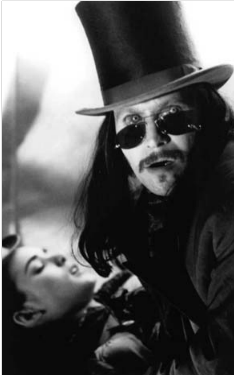
غاري اولدمان في لقطة من «دراكولا»