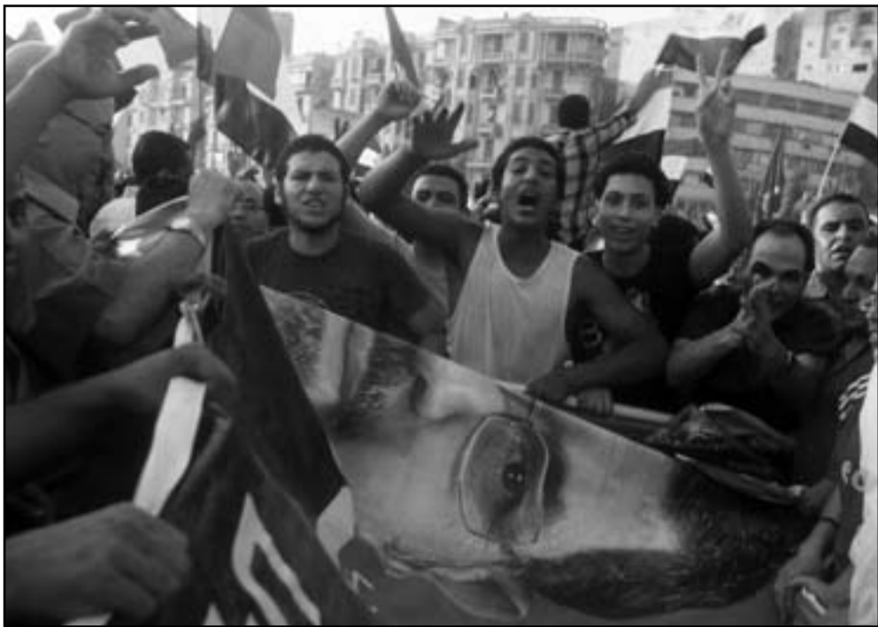
لمن ستكون الغلبة في مصر للدبابة ام للشارع؟

شهادة حل بان امتت سلسلة طويلة من الاتصالات معها. هاجم الجنرال عبد المنعم فلتو، مستشار قسم الاعلام في المجلس العسكري، هاجم واشتطن بشدة في مقابلة صحفية مع صحيفة «المصري اليوم»، لأن الجيش لم يُحِب الانتقاد الذي وجهته ووزيرة الخارجية هيلاري