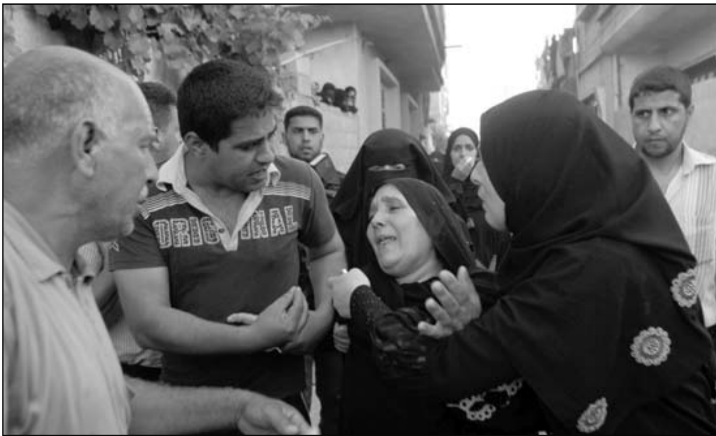
اقرب الطفل الشهيد على الـ 7 سنوات بيكونه خلال تشييع جثمانه في خانينوس

قوات الاحتلال. واتهم أبو سلمية الاحتلال بارتكاب «جرائم حرب منهجية» بحق السكان المدنيين في غزة، وطالب بتدخل دولي عاجل لـ «وقف آلة الموت».