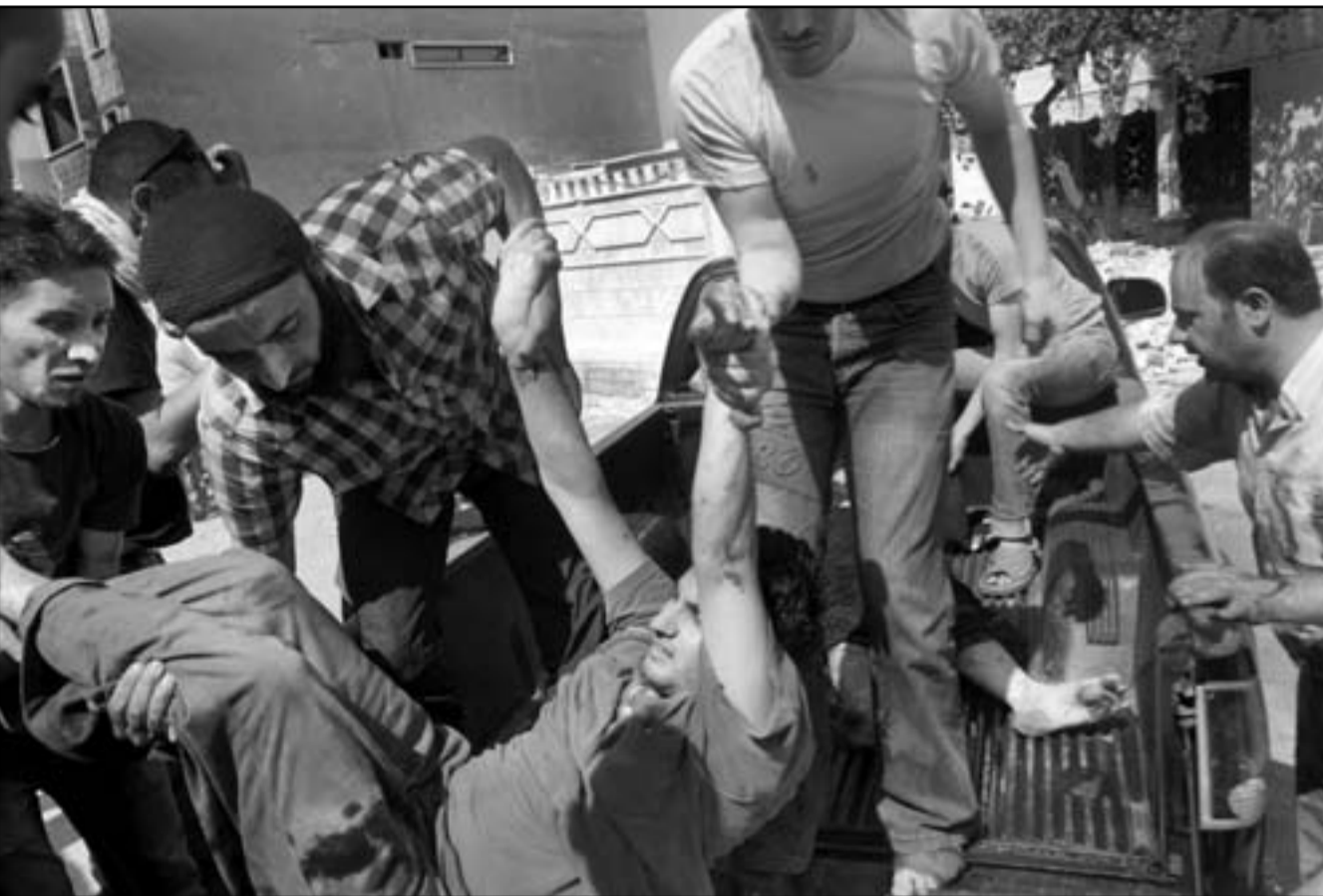
سوريون يحملون جرحيا اصيب برصاص القوات الامنية في منطقة القصير قرب حمص

رئاسة اللجنة الدولية للصليب الاحمر في الاول من تموز (يوليو) خلفا لكيلينبرغر الذي امضى 12 عاما على رأس هذه الهيئة. وعينت جمعية اللجنة الدولية للصليب الاحمر مورير ورئيسا في 19 تشرين الاول (أكتوبر) لولاية من أربع سنوات قابلة للتجديد.