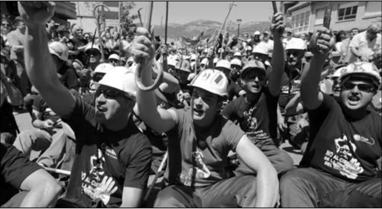
احتجاجات عمال المناجم شمال إسبانيا على خطط الحكومة لتقليص ميزانية عملهم