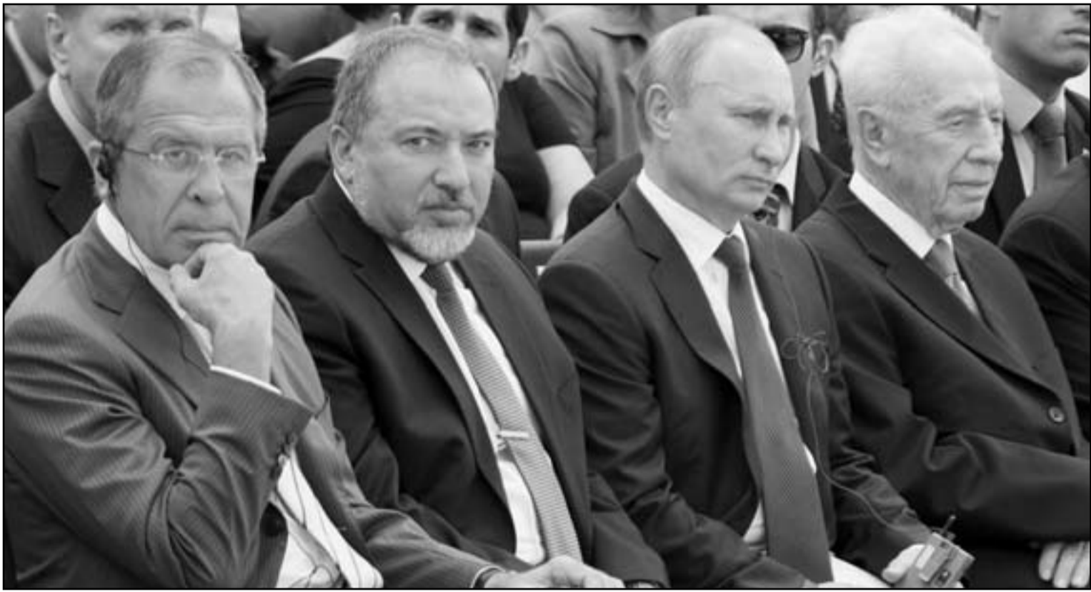
الرئيس الروسي الثالث من اليمين يتوسط الرئيس الإسرائيلي شمعون بيريس ووزير الخارجية الإسرائيلي أفغدور ليرمان وعلى اليسار يجلس وزير الخارجية الروسي سيرغي لافروف

29 بي-هـ للمهند ومينامنا. ومن المتوقع أيضاً أن تبدأ روسيا في العام الحالي بتوريد طائرات «ميج-29» إلى سورية، تنفيذاً للعقد توريد طائرات معدة للتصدير إلى الجزائر، وكذلك موسكو باختبار أولى هذه الطائرات في