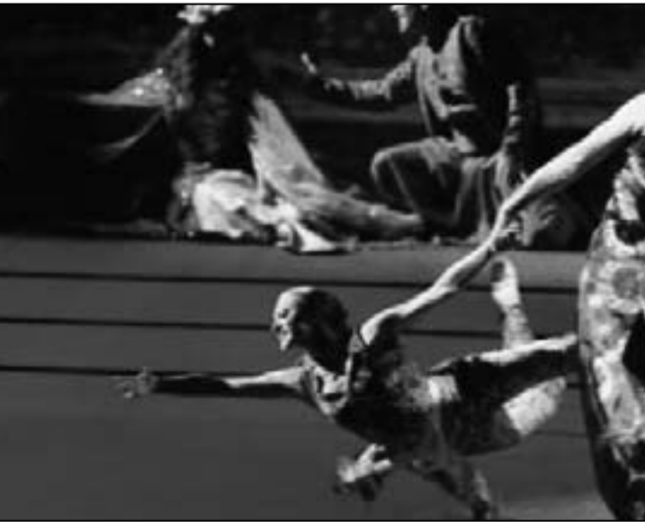
من عرض «كان ياما كان»

يمكن ان تأتي الى قصر بيت الدين من دون ان نستوي من هذا المكان... وأضاف روبرتو «لدينا لعبة خاصة في مسرح كركلا لدينا اللغة والهوية الشرقية المستوحاة من الفولكلور ولكن بأسلوب منظور بعد إضافة التقنية الغربية... هناك مزج بين التقنية المعاصرة للرقص المسرحي والهوية التراثية العربية. هذا الخليط يصنع شيئاً اسمه أسلوب كركلا والذي نراه اليوم في كل أعمال كركلا.»