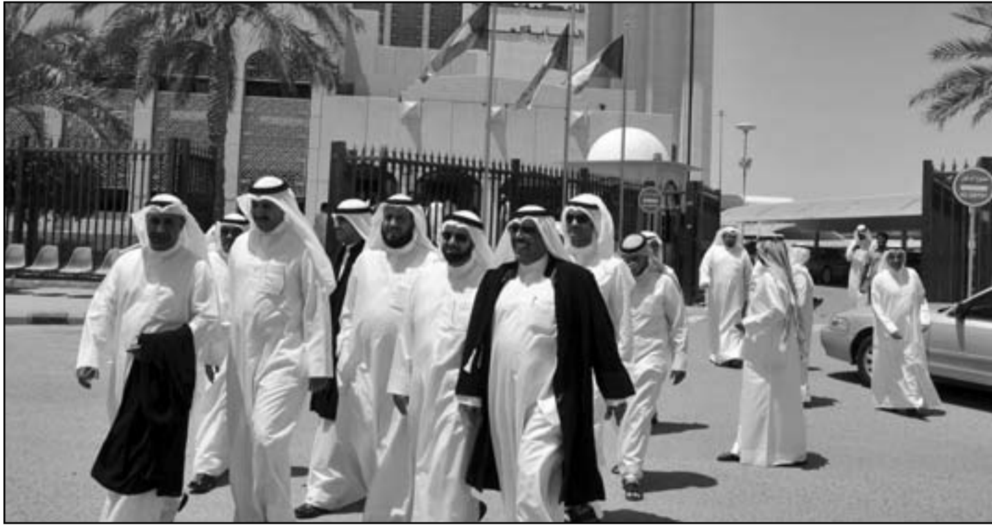
نواب وناشطون من المعارضة الكويتية يغادرون قصر العدل بعد حضورهم جلسة محاكمة 68 شخصا بينهم تسعة نواب بقضية اقتحام مقر البرلمان