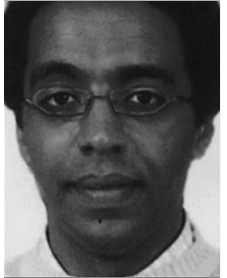
المخرج أحمد عوض