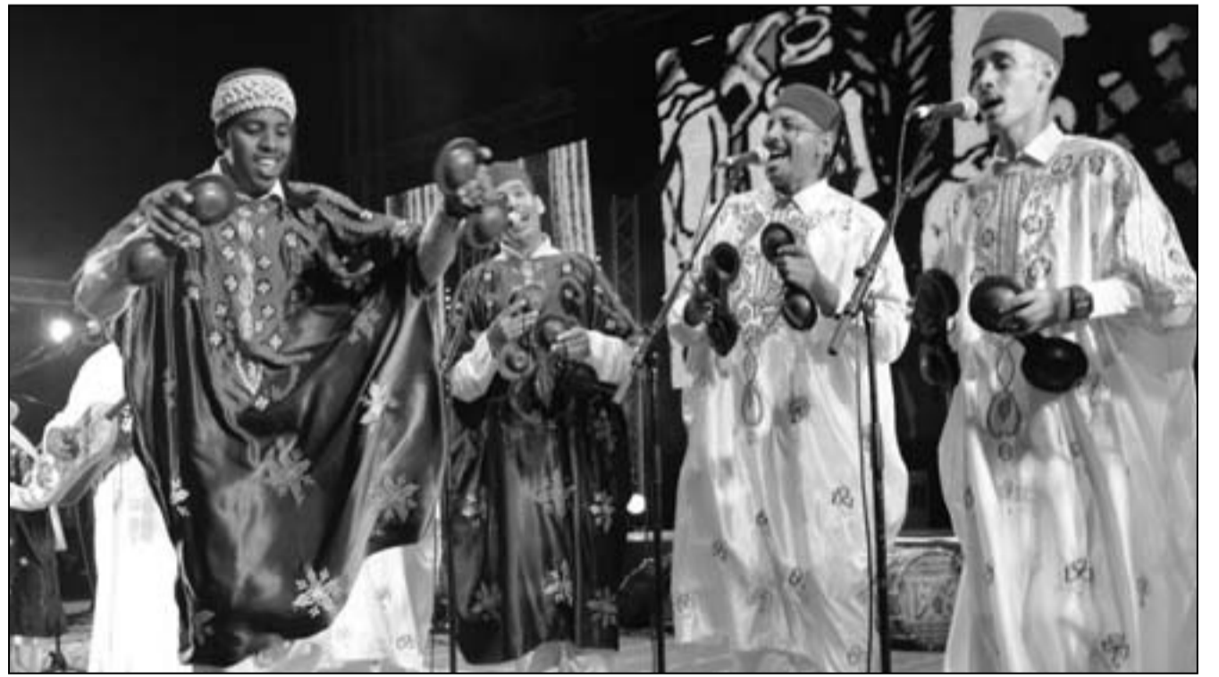
من عروض المهرجان

لحفيظ فكيرا... ويدفع المهرجان موسيقيين أغلبهم فقراء إلى عالم الشهرة حيث يقدمهم لجمهور عريض من بوسطن إلى برلين. واستضاف منظمو المهرجان هذا العام ولأول مرة منذ انطلاقه أول مرة منتدى بعنوان حركات المجتمعات وحرية الثقافات في مسعى لتشجيع حرية التعبير غير الفنون. وقال محمد نبيل بن عبد الله وزير الإسكان المغربي والأمن العام لحزب التقدم والاشتراكية إن الفن ليس محصناً من السياسة. وأضاف "توجه لنا انتقادات كثيرة كسياسيين، لكن كيف تريدون أن تريح هذه الحركة إذا لم تكن هناك مصلحة حقيقية بين العالم الثقافي وبين العالم السياسي. إذا لم تكن هناك عودة للمثقفين والثقافات إلى الفضاء السياسي، إلى الاتصال على أرض الواقع من أجل دعم الأطراف السياسية التي ترفع هذا المشروع الذي يطمحون إليه". وشاركت الممثلة المغربية لطيفة أحرار في المنتدى وقالت "لا يجب أن نحصر الفنان فقط في خلق إبداعاته ولكن أيضاً كطرفنا من تعيشه المجتمعات ولكن أيضاً كمتوجه (يونيو).