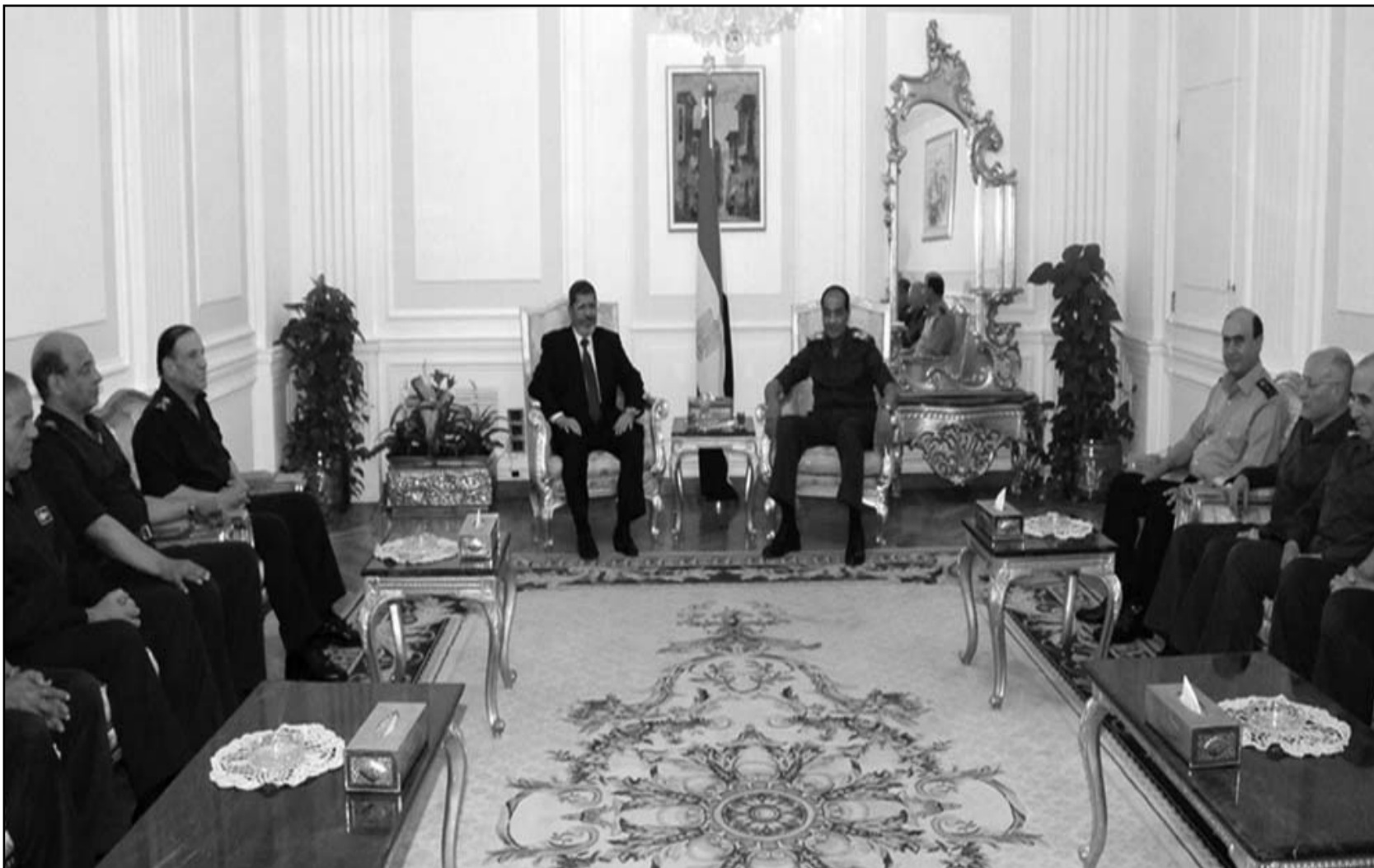
الرئيس المنتخب محمد مرسي أثناء اجتماعه مع رئيس وأعضاء المجلس العسكري في القاهرة