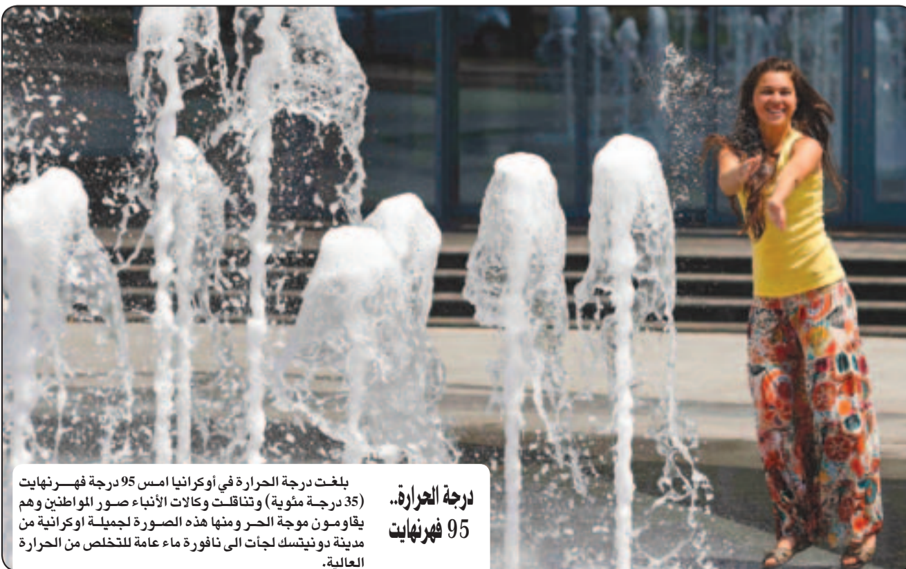
درجة الحرارة.. 95 فهرنهايت يقاومون موجة الحر ومنها هذه الصورة لجميلة اوكرانية من مدينة دويتسك لجأت الى نافورة ماء عامه للتخلص من الحرارة العالية.

هيوستن - يو بي اي: وجدت دراسة جديدة أن الرجال الذين يستخدمون العلاج الهرموني البديل يسجلون خسارة ملحوظة بالوزن. وقالت الباحثة باير فارما في برلين إن بحثاً سابقاً أظهر أن الرجال الذين يعانون من نقص في هورمون التستوستيرون يظهر لديهم بشكل ثابت تغيرات بتركيب أجسامهم، لكن التأثير الجمل على الوزن يبدو بأنه لا يتغير. لكن الدراسة الجديدة أظهرت بعد متابعة طويلة الأمد لمدة لا تقل عن سنتين، وإعطاء الرجال حقن من التستوستيرون طويل الأمد، أظهرت أن هذه الطريقة من شأنها أن تحدث انخفاضاً ملحوظاً بالوزن. وأعد الباحثون مستويات التستوستيرون إلى المعدل الطبيعي لدى 255 رجلاً يعانون من انخفاض هذه المستويات، وفي عمر يقارب 60 عاماً.