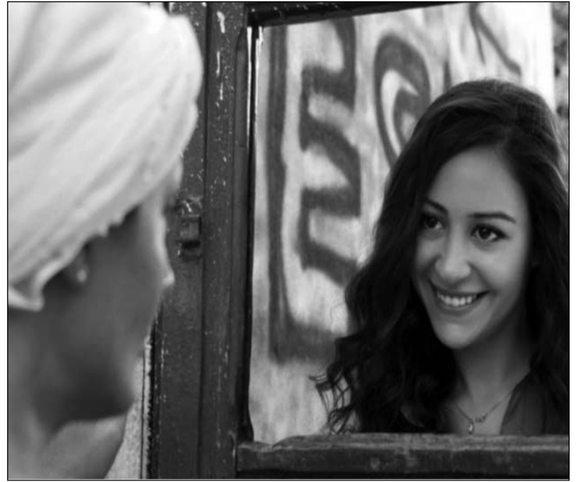
لقطة من فيلم «بعد الموقعة»