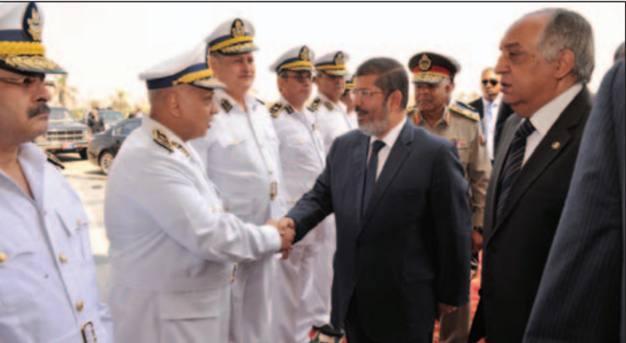
الرئيس المنتخب محمد مرسي يلتقي قيادات جهاز الشرطة مع وزير الداخلية اللواء محمد ابراهيم امس

التي الانيا باخوميوس القائمقام بأعمال البابا، فيما أكد مستشار لمصري انه سيعين قبطيا وامراة نائبين لرئيس الجمهورية.