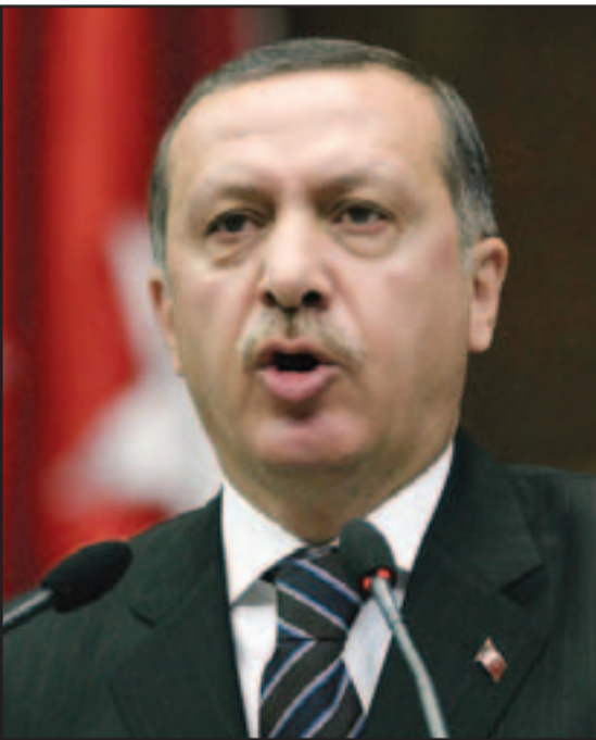
رئيس الوزراء التركي رجب طيب اردوغان