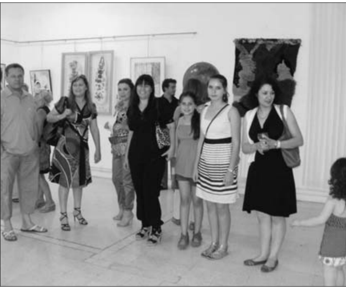
من افتتاح المعرض

* كاتبة وصحافية من (أم الفحم) - فلسطين Latifa_agh@yahoo.com