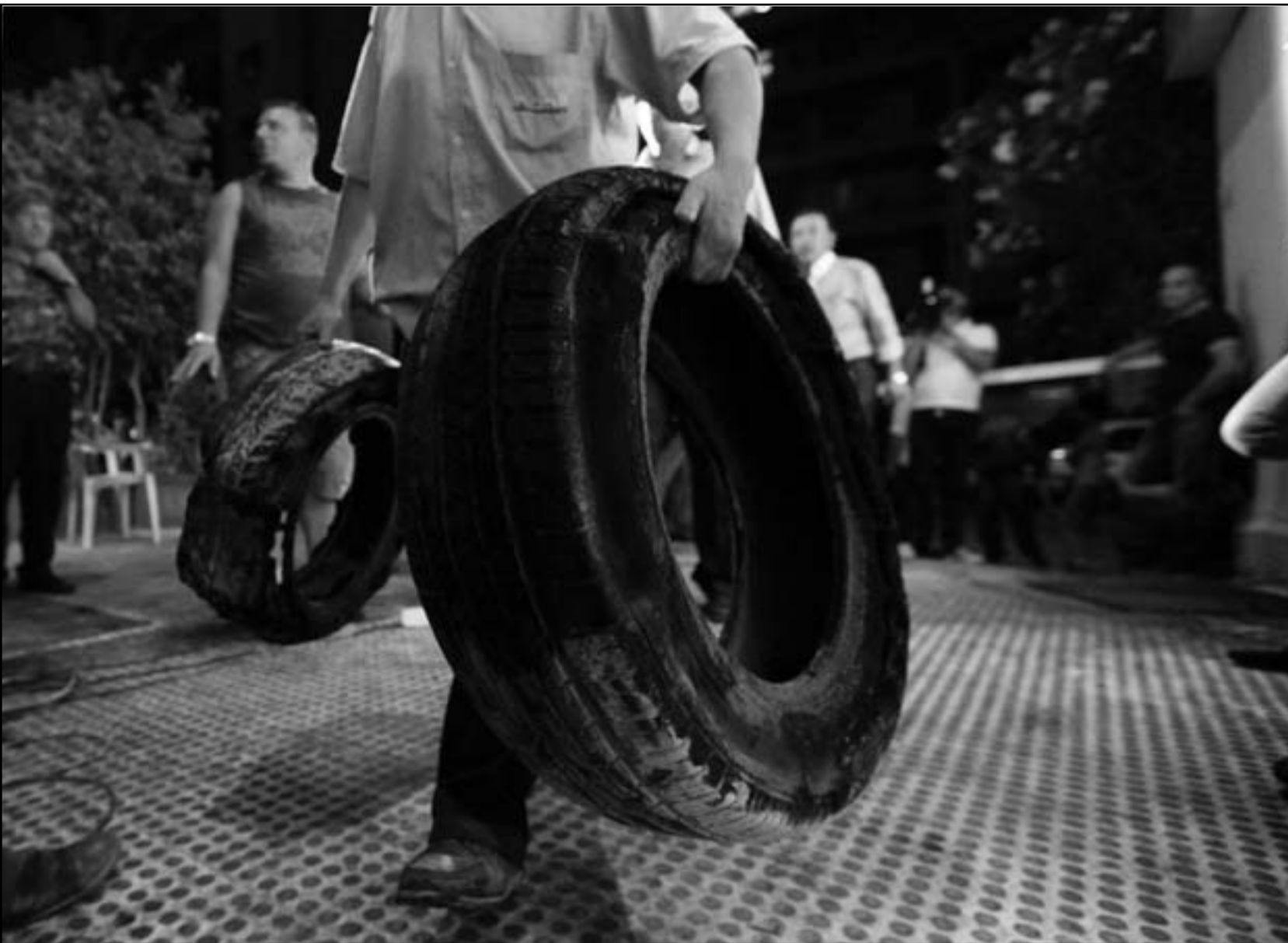
شبان ينظفون أمام قناة «الجديد» بعد الاعتداء على مقر القناة في بيروت

الذي يريعه سلاح حزب الله ويحميه ويشرف عليه. ولهذه الأسباب يزداد الانفلاش والتفكك الأمني في عدد من المناطق التي تشهد كل يوم تعد جديد على الاستقرار وعلى الحريات..»