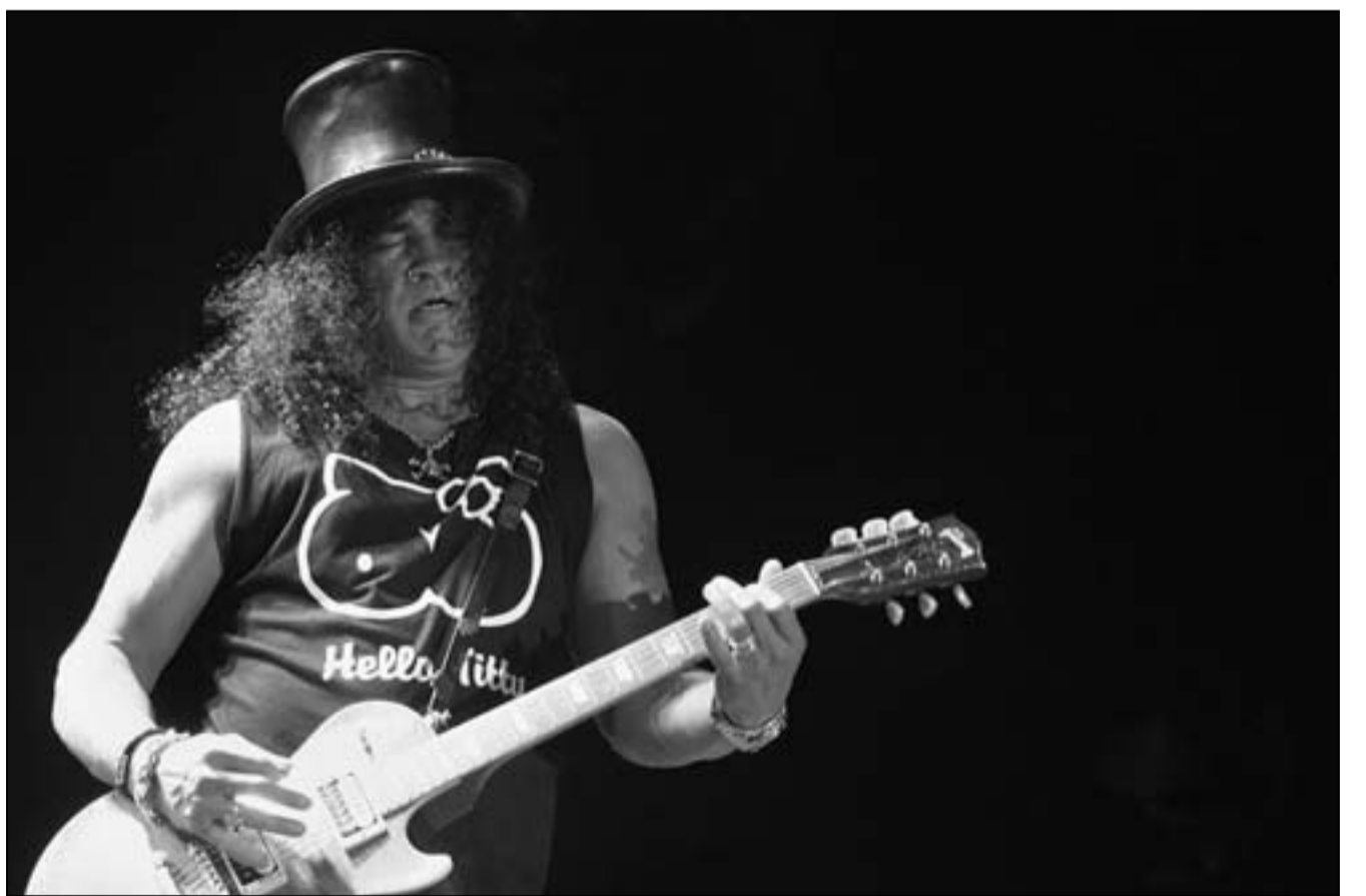
سلاش يحيي حفلاً بيبيلوس

■ بيروت - (رويترز): التقى آلاف اللبنانيين عشاق الموسيقى بين أطلال بيبيلوس التاريخية لحضور حفل أحياء عازف الجيتار العالمي سلاش الذي عزف لأول مرة في لبنان ضمن مهرجان بيبيلوس الدولي هذا العام. وكان سول هدسون المعروف فنياً باسم سلاش قائد الفريق (غانز أون روكس) لموسيقى الروك قبل أن يؤسس فريقه المعروف باسم (فيلت ريفولفر). وتشهد مدينة جبيل الساحلية اللبنانية سنويا مهرجاناً دولياً للموسيقى في فصل الصيف يشارك فيه فنانون من شتى أنحاء العالم. ويشارك في المهرجان هذا العالم مغني البلوز الأمريكي بي. بي. كينغ والمغني الفرنسي جوليان كليلر والنجم العراقي كاظم الساهر. وقالت لبنانية من جمهور حفل سلاش تدعى رشا وهي «كثير حلو وكثير إنبيسطنا أنه بهيذا الأجواء وهلا لبنان كيف عم يكون بعدي الحياة موجودة عم بتكون بين الشباب». وذكر لبناني من الجمهور أن إقبال العديد من أبناء الجيل الجديد على حفل سلاش يثبت اهتمامهم بموسيقى الروك المعاصرة لجيل سابق. وقال «كان من أحلى الحلقات الموسيقية أنه