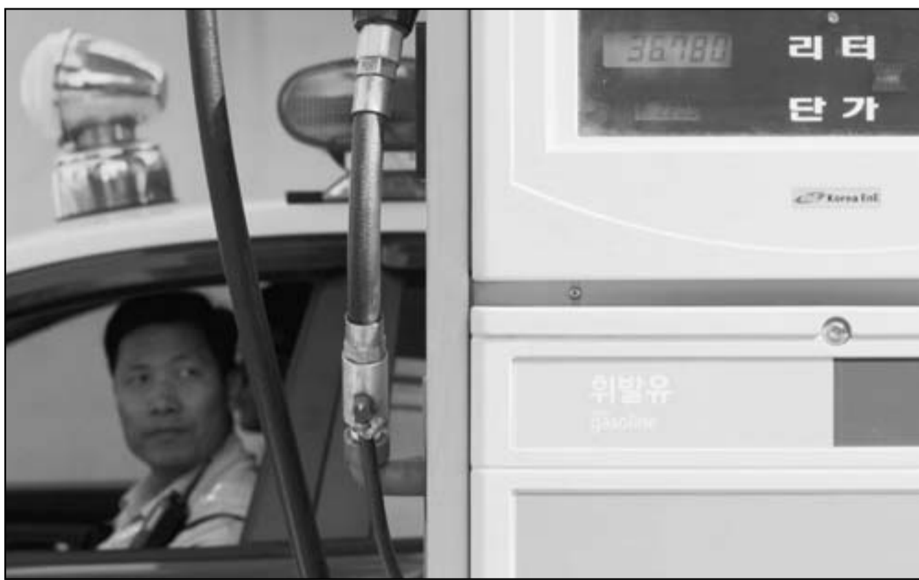
شرطي كوري يراقب محطة للبتروفي في كوريا عشية وقف الاستيراد من ايران

علاقة أخرى في نهاية العام الجاري من حوضي سفن في الصين وكان يتوقع تشدين السفن الأربع المتبقية في نهاية 2013. وقال مسؤول بارز بشركة صينية لبناء السفن إنها انتهت من بناء ناقلة عملاقة للشركة الإيرانية وأنه ليس على داية بأي تأجيل.