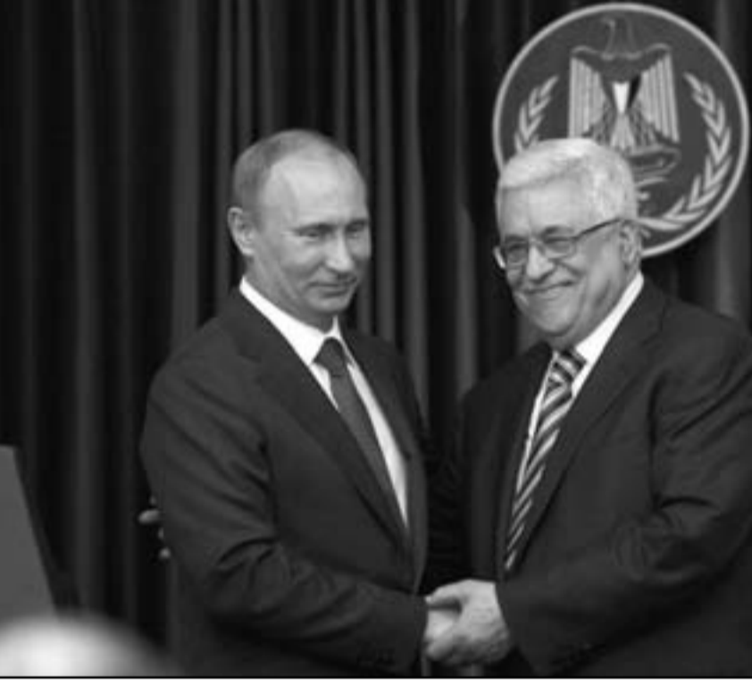
الرئيس الفلسطيني محمود عباس لدى إجتماعه مع نظيره الروسي في بيت لحم أمس

يناميان نتنياهيو السماح بنقل عتاد عسكري تبرعت به مؤسسة الامن للفلسطينية، وهو عبارة عن مدمرات واسلحة تاريخية، تحتاجها تلك القوات، وكانت روسيا تبرعت بهذه الكمية من العتاد العسكري في وقت سابق، ووصلت إلى الأردن وتنتظر إندا إسرائيليا بالعبور