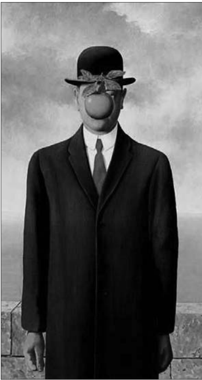
لوحة لريثيه ماغريت

أتذكر لوحة من البلجيكي ماغريت. رجال بملابس رسمية وقيعات في حالة تخليق. هل كانوا يصعدون أم يهبطون؟ لا أحد يدري. هم أيضاً لا يعرفون. حالة من انعدام الوزن يعيشها الهارب إلى حياة. كان إلى وقت قريب يظنها حياته، غير أنه يكتشف قبل أن يصلها