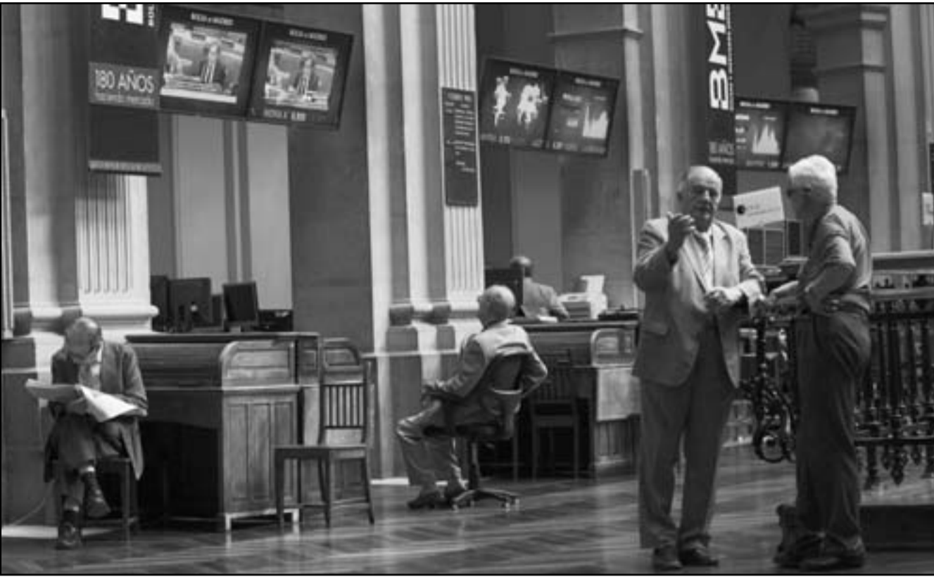
متعاملون براقبون اسواق البورصة مع تخفيض تصنيفات 28 مصرفا اسبانيا

ينبغي ان توفرها منطقة اليورو خلال عدة سنوات لاستكمال الاتحاد الاقتصادي بين الدول السبع عشرة التي تستخدم اليورو والذي تعتقد أنه ضروري لتأمين مستقبل هذه الكتلة.