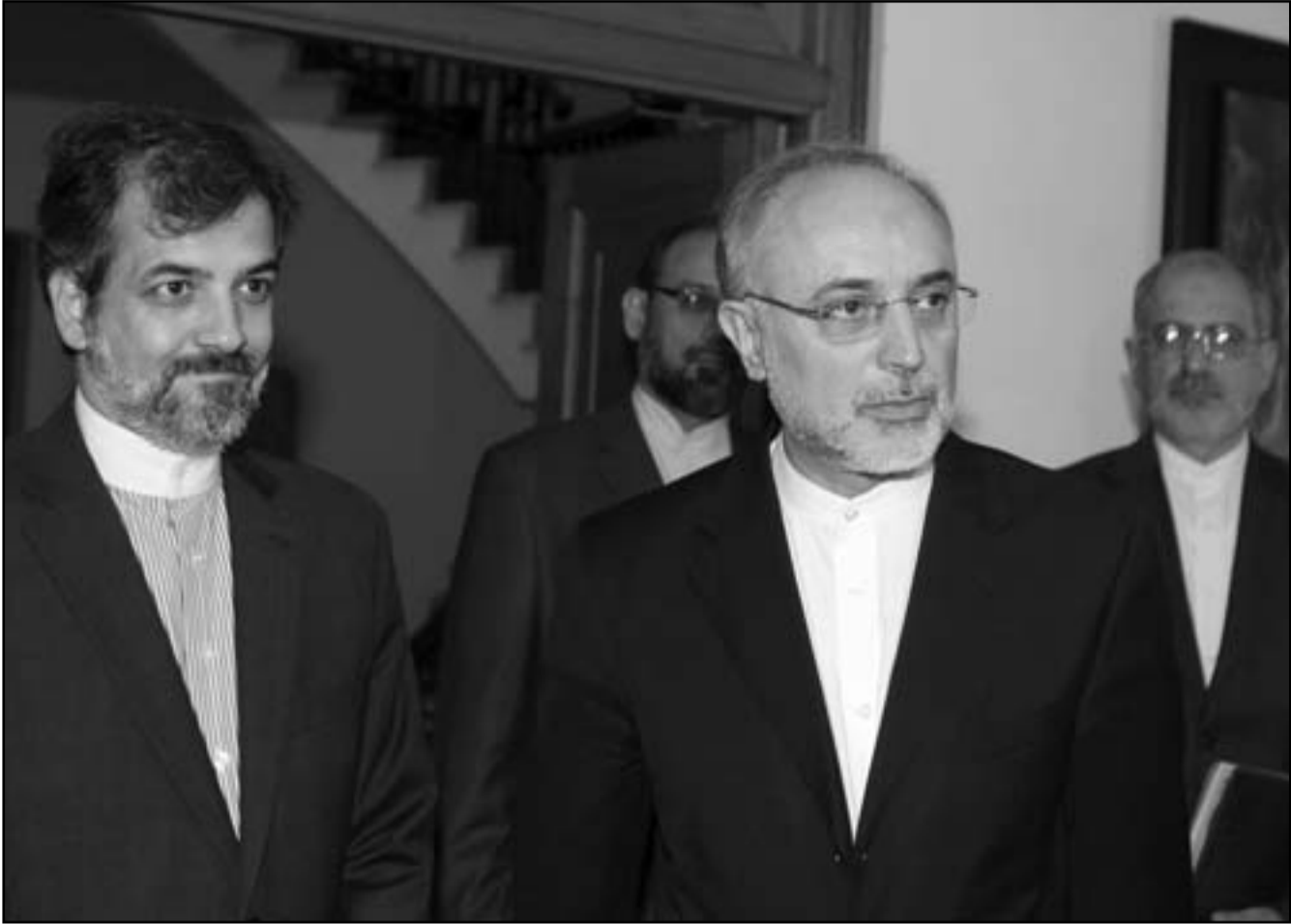
وزير الخارجية الإيراني علي أكبر صالحى خلال زيارته الى قبرص

ووصلت كاسحات الألغام الأربع الإضافية الى الخليج يوم السبت في مهمة تستمر سبعة أشهر تغطي الخليج وخليج عمان والبحر الاحمر ومناطق في المحيط الهندي. كما تشمل أيضا منطقتين متشلتان عرق زجاجة لعمليات الشحن هما قناة السويس وباب المندب وهو أقرب نقطة بين جنوب اليمن وأفريقيا. وقالت البحرية الأمريكية في بيان الليلة الماضية «تجري سفن كاسحات الألغام (أم.سي.إم) عمليات مع قوات التحالف لضمان استمرار التدفق الآمن لحركة الملاحة في الممرات المائية الدولية». وأثار التوتر بين إيران والغرب حول البرنامج النووي للجمهورية الإسلامية مخاوف من أن تحاول طهران إغلاق مضيق هرمز وهو ممر ملاحى حيوى للاقتصاد العالمى إذا منعت إيران من تصدير نفطها نتيجة للعقوبات الغربية التي ستشدد مجددا في الأول من تموز/ يوليو. ونقلت وكالة انباء الطلبة الإيرانية عن أحمد رضا بورديستان قائد القوات البرية الإيرانية قوله الاثنين أن إيران قد تستخدم نفوذاها على مضيق هرمز للدفاع عن مصالحها. وقالت الإدارة الأمريكية لمعلومات الطاقة أن أكثر من ثلث تجارة النفط المنقولة بحرا مررت العام الماضي عبر مضيق هرمز وأن حتى إغلاق لفترة قصيرة يمكن أن يرفع الاسعار بشكل