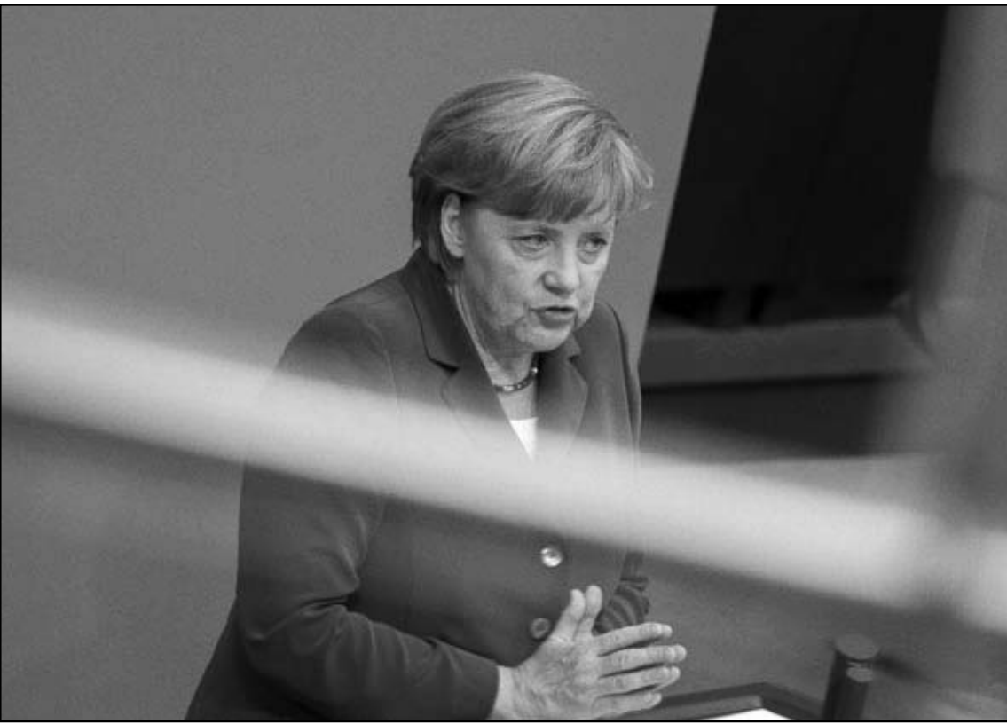
المستشارة الألمانية أنجيلا ميركل تتحدث أمام البرلمان

الذي يواجه صعوبات. وتصر الجزيرة المتوسطة العضو في منطقة اليورو بمرحلة اقتصادية صعبة بينما تستعد لتولي الرئاسة الدورية للاتحاد الأوروبي في الأول من تموز (يوليو). وقبرص هي الدولة الخامسة في الاتحاد الأوروبي التي تطلب مساعدة مالية من السلطات الأوروبية بعد اليونان وإيرلندا وأيسلندا.