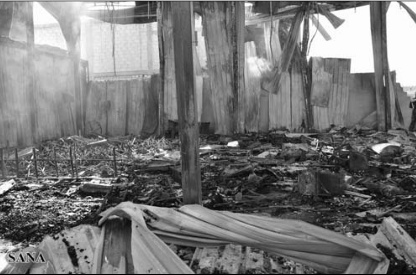
مقر قناة الاخبارية بعد الاعتداء عليه

الامم المتحدة اعطى موافقة في 1 حزيران (يونيو) ورغم معارضة الصين وروسيا على تحقيق دولي مستقل في مجزرة حلب بهدف احالة المسؤولين الى القضاء اذ يمكن ان يتهموا بارتكاب جرائم ضد الانسانية، كما افادت المفوضة العليا لحقوق الانسان نافي بيلاي. الى ذلك صرح مدير المرصد السوري لحقوق الانسان بان حصيلة ضحايا اعمال العنف التي شهدتها مناطق مختلفة من البلاد بلغ 916 قتيلا في اسبوع.