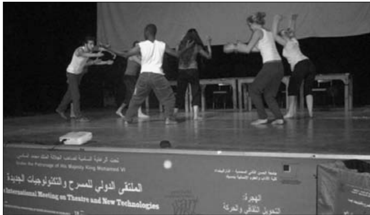
من فعاليات الدورة