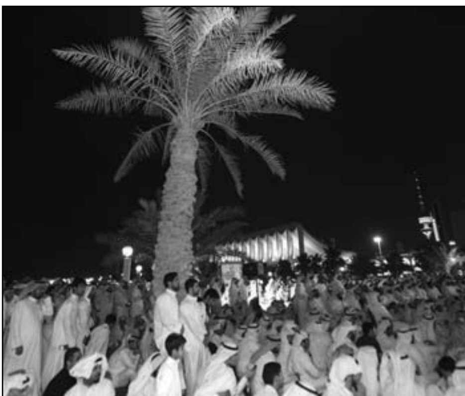
كويتيون يتظاهرون احتجاجا على قرار المحكمة الدستورية بإبطال انتخابات مجلس الامة

■ الكويت - ف ب: خرج الالف الكويتيين في وقت متأخر من الثلاثاء في تظاهرات احتجاجا على قرار المحكمة الدستورية بإبطال انتخابات مجلس الامة في الوقت الذي دعت فيه المعارضة لاقامة ملكية دستورية ونظام برلماني كامل. وقال النائب المعارض البارز مسلم البراك امام تجمع كبير استمر حتى نحو منتصف ليل الثلاثاء احتجاجا على القرار القضائي «هذه بداية الطريق إلى الملكية الدستورية». وهذه اول مرة يدعو فيها المعارضة الكويتية الرئيسية الى اصلاحات كبيرة إذ عادة ما يطالب الناشطاء الشباب بذلك. وتحدث الالف من انصار المعارضة درجات الحرارة التي زادت عن 40 درجة مئوية وتجمعا امام البرلمان في مدينة الكويت احتجاجا على حكم المحكمة. وقال أحمدني يعطي شرعية لنظام آيات الله وفي حكم غير مسبوقة، قضت المحكمة الدستورية التي تعد احكامها نهائية الاسبوع الماضي ببطلان انتخابات مجلس الامة الحالي الذي تسيطر عليه المعارضة الإسلامية والقليبية وبإعادة المجلس السابق