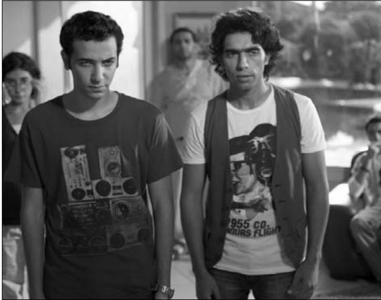
لقطة من الفيلم