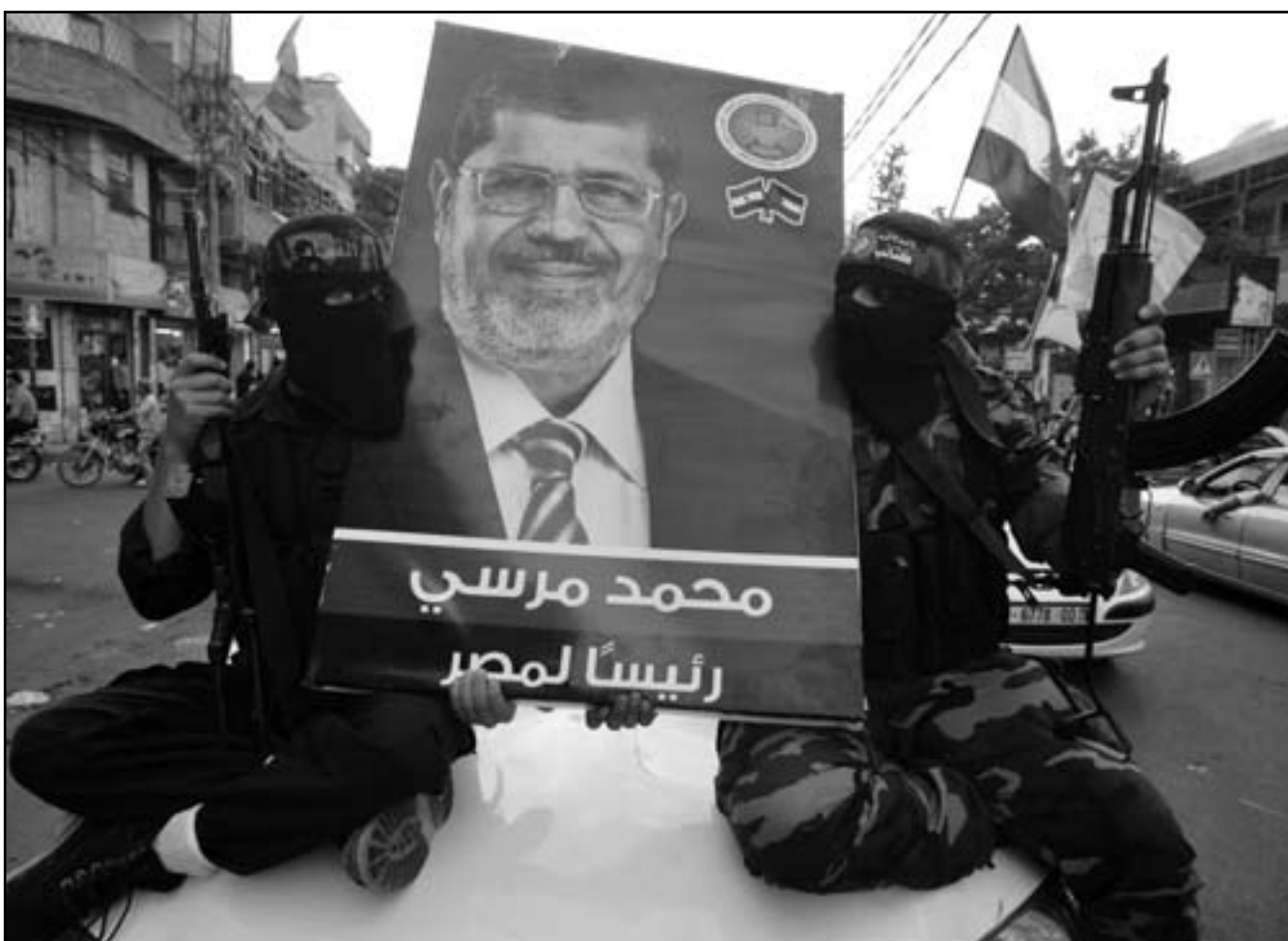
إذا انفجر بركان مصر سيخرب الدخان من غرة

اسئلة صعبة عن جدوى ومدى عمر اتفاق السلام مع مصر، وهذه اسئلة نظرية فقط، صحيح حتى اليوم.