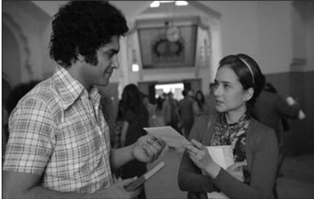
لقطة من مسلسل «ذات»