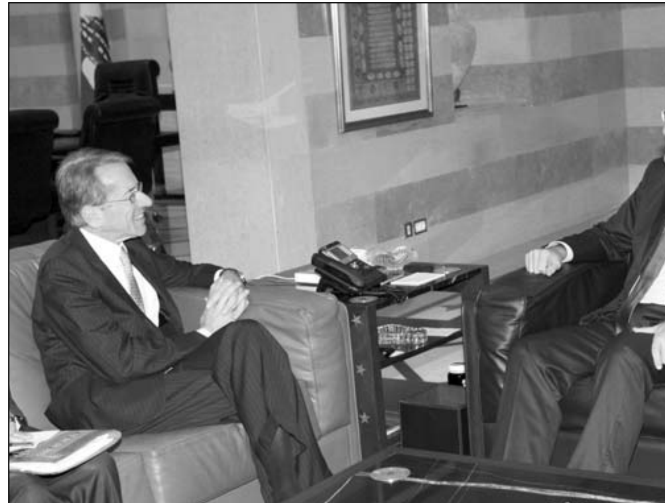
رئيس الحكومة اللبنانية نجيب ميقاتي لدى اجتماعه مع وزير الخارجية الايطالي جوليو

ووضعه في خاتمة «الرد الشيعي» على الكلام الذي تفرّقه به «الشيخ السني» أحمد الأسير، هجوماً مماثلا على مبنى قناة «أخبار المستقبل» بغرض إشعال فتيل فتنة موازية «سنية-سنية» عبر وضع الهجوم في إطار تحركات بعض الجهات التي تعبّر عن امتعاضها من زعامة آل الحريري للطائفة السنية. أما في بعبدا، فتمرد عدد من الموقوفين داخل قصر العدل ونفذوا أعمال شغب في قاعة محكمة الجنائيات، ما اضطر المحامين والقضاة الى مغادرة المكان وما لبثت فرقة من الفهود أن أعادت ضبط الوضع واعد الموقوفون الى سجن رومية، بعدما وعد النائب العام في جبل لبنان القاضي كلود كرم المتطرفين وهددهم 14 موقوفا بتسريع وتيرة المحاكمات. وكانت الخطة الامنية التي أقرها مجلس الامن المركزي واطلقها الوزير شربل بدأت صباح أمس من منطقة الشرفية في الضاحية الجنوبية الخاضعة لتفوق حزب الله، وسلكت طريقها ميدانيا بدءا من بيروت الى المناطق اللبنانية كافة بمشاركة قطعات من الجيش وقوى الامن الداخلي والقوى الامنية الاخرى وللمرة الاولى وحدة عسكرية نظامية من المديرية العامة لامن العام بكامل عتادها العسكري. وشوهدت دوريات الامن العام في الضاحية الجنوبية ويعيد في إطار الخطة الامنية المتكاملة في المناطق الممتدة من مسدرة شاتليا، محيط مجمع الجولى الاسلامي الشيعي الأعلى وصولا الى جسر صغير فمسدرة الصياد وصولا الى محيط القصر الجمهوري، وكذلك شوهدت الدوريات في محيط مارمقار، ملعب الرابية، مجمع الشهداء وفهم بناء على مطبات دقيقة لتوقيف العديد من الخارجين