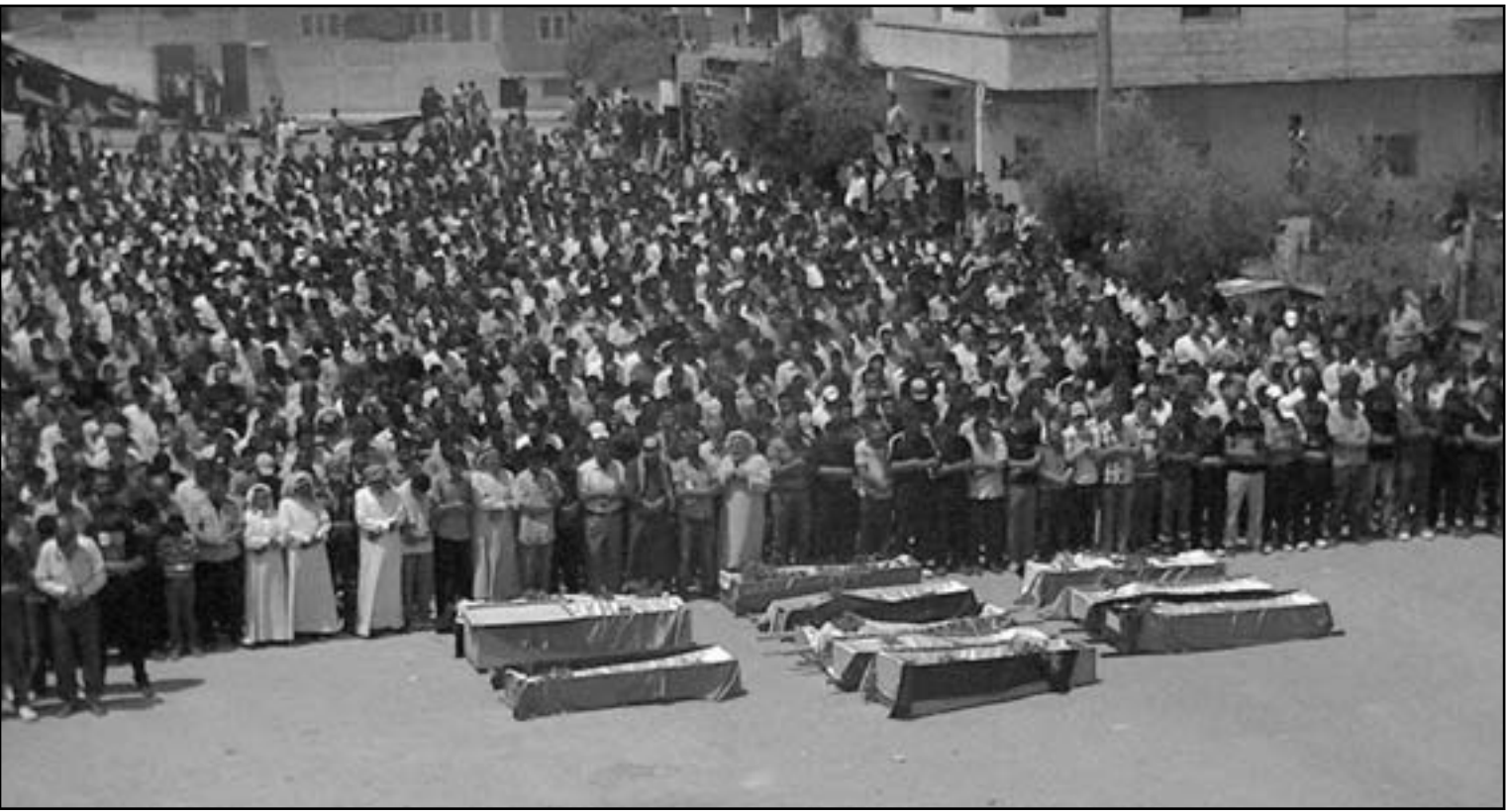
سوريون يشيعون قتالهم في درعا