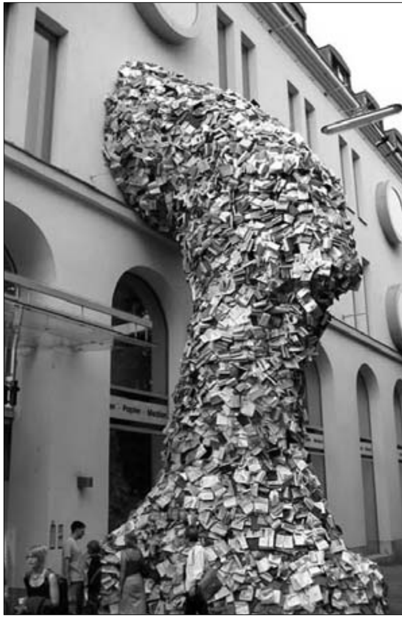
الذي كان في السابق تتحور حول العمل الفني جعل الفنان ينتج أعمالاً وفق متطلبات السوق المتعاونة والمتتالية لأن التحولات التي شهدتها العالم الرأسمالي الاحتكاري تجاه الفن مثلت مشكلاً حقيقياً للمبدع والمثقف مما دفع بالكثير من الفنانين إلى إيقاف أعمالهم الإبداعية وانتاجاتهم التشكيلية والتحول إلى برمجة إنتاجهم الفني حسب المناسبات السنوية التي تقام فيها المعارض أو حسب الدعوة للمشاركة في معرض جماعي يتكفي فيها باقتناء عمل فني أو عملين ليعرضها بأحدى قاعات الفنون أو الأروقة.

لقد مثل خروج الفنان المعاصر من فضاءات العرض التقليدية كالمعارض السنوية وأروقة الفنون والمتاحف والتظاهرات التشكيلية الخاصة والعامية، إلى الفضاءات الأخرى الأرحب الأكثر اتساعاً في هذا العالم، منحه جديداً معاصراً اتجه من خلاله الفنان إلى فضاء الشوارع والمساحات العامة والأماكن المفتوحة على الجمهور العريض، حتى أنه عمل على التوجه إلى محافل التكنولوجيا الرقمية التي تنتجها فضاءات الإنترنت بما لديها من إمكانيات