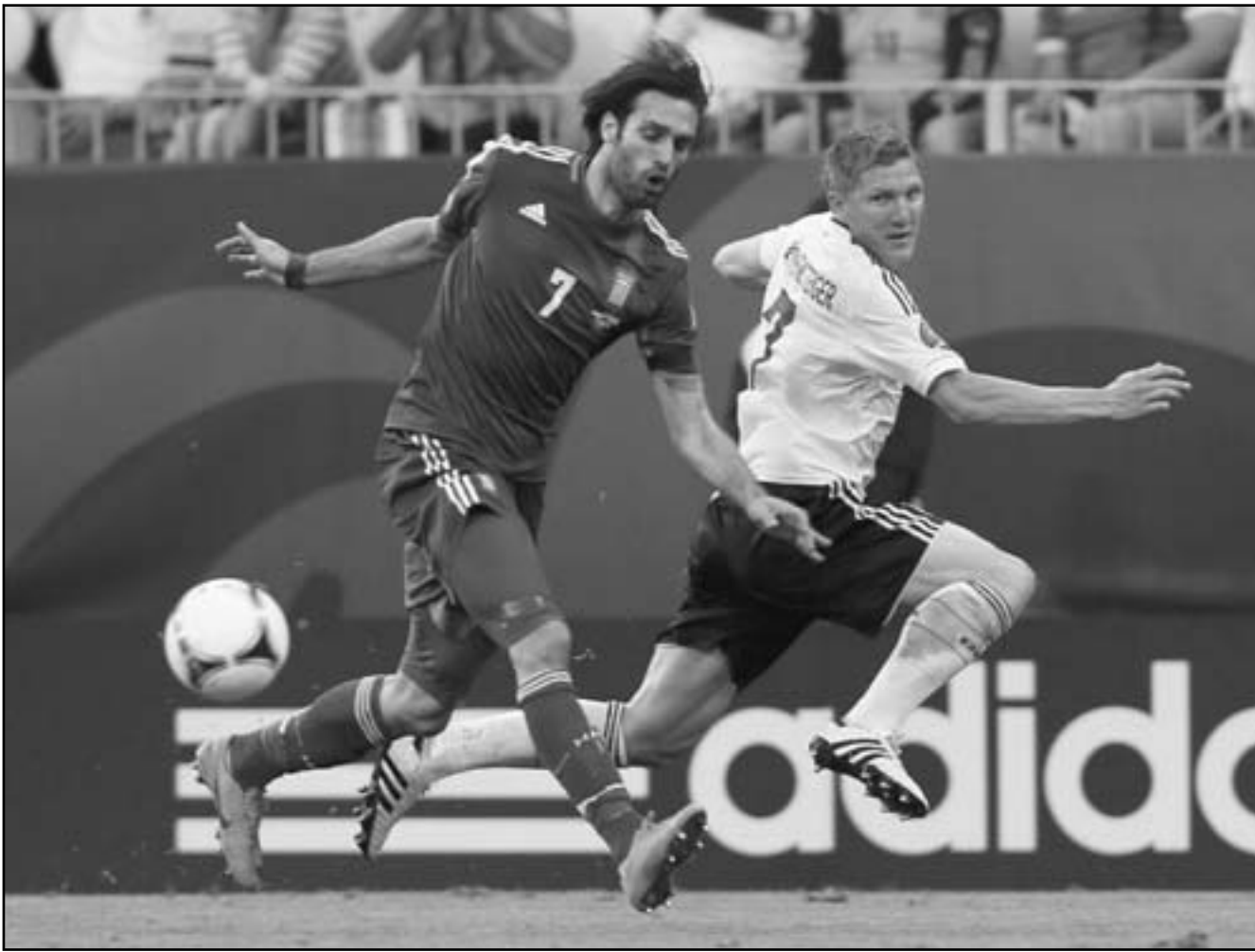
نجم منتخب المانيا باستر شوينزتر يجز (يمين) في منافسة على الكرة مع جيورجوس ساماراس نجم المنتخب اليوناني