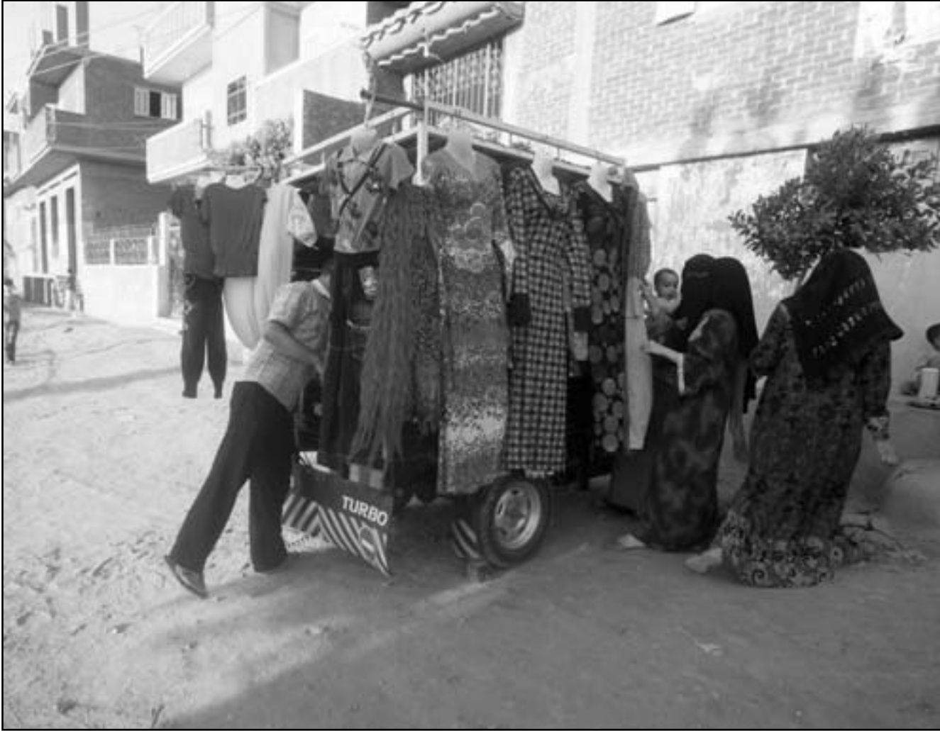
سيديات في قرية العدوة بمحافظة الشرقية مسقط رأس محمد مرسي

الأمني المتدهور في سيناء، مشيرة إلى أن تل أبيب تنظر بقلق إلى إدخال الجيش المصري عدداً قليلاً من جنوده إلى سيناء، ورغم موافقة إسرائيل على إدخال سبعة مقاتلين مصريين، خلافاً لما نصت عليه اتفاقية السلام بين الدولتين. وأنه لن يتم المس بأي جانب من العلاقات مع إسرائيل سواء كان أمنياً أو سياسياً أو اقتصادياً.