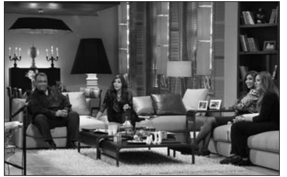
ضيوف حلقة «صولا»