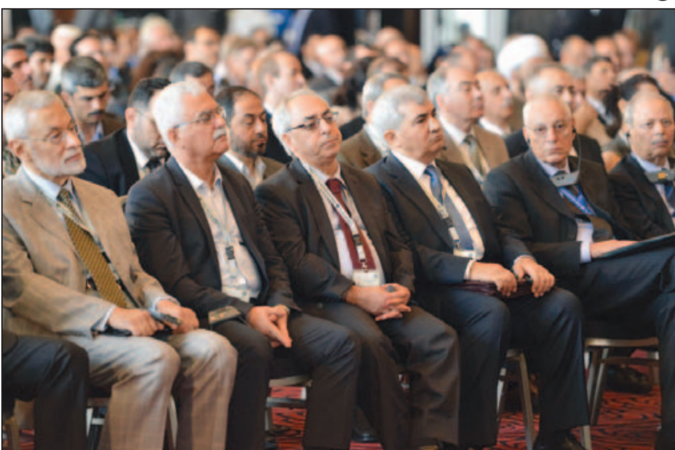
قيادات في المعارضة السورية اثناء مشاركتهم في اجتماع القاهرة أمس