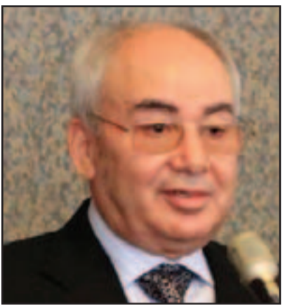
عبد المنعم الهوني

■ طرابلس - وكالات: أعلنت ليبيا أمس الاثنين أن عبدالمنعم الهوني لم يعد سفيرها لدى الجامعة العربية أو لدى مصر اعتباراً من شهر آذار (مارس) الماضي، مؤكداً أن أي تصريحات يدلي بها لا تعكس إلا نفسه، وأكدت وزارة الخارجية الليبية في بيان لها حصلت يونايتد برس انترناشونال على نسخة منه أن تصريحات «الهوني لا تكتسب أي طابع رسمي بأي شكل من الأشكال».