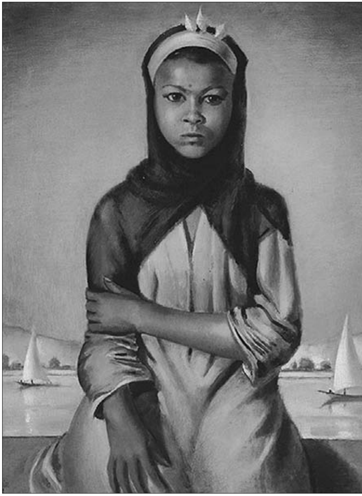
لوحة أحمد سعيد

حتى التقليد المبدع غير سموح به، لقد صنعوا لنا هبة شبحية وما علينا سوى أن نتماهى معها، هم يقررون الطعم واللون والرائحة التي يجب أن نتحلى بها، فقد