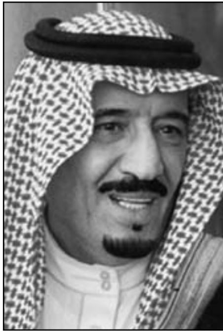
الأمير سلمان بن عبد العزيز

وزير يارز في الحكومة الأردنية وأمام «القدس العربي» ونخبه من الشخصيات المبح إلى أن المساعدات السعودية دخلت مرحلة «التسييس» وقال بوضوح بأن الأشقاء في الرياض يضغطون على عمان مالياً لأن سياستها تجاه الملف السوري لا تعجب المجموعة المتحكمة الآن في قرار القصر السعودي. لا توجد أدلة مباشرة على هذا الأمر لكن أحد الشواهد المهمة يتمثل في الملاحظة التي رصدتها نشطاء ويعلمون يومياً على تقديم المساعدات الإنسانية لأكثر من مئة ألف لاجيء سوري في الأردن. هؤلاء يتوزعون مباشرة عبر لبنان «الردية» بعد البروز عبر الهيئة الأردنية الشرفة على توزيع المساعدات وهو إمتياز تبتعاهم عبر شخصيات من تنظيم الإخوان المسلمين في الموقع. ذلك لا يعني إلا أن مربع العلاقة الأردنية السعودية مزدهم بالخلافات التي تحصل الملف السوري، فريثس الوزراء الأردني الأسبق عون الخصاونة أفاد بأنه قاوم عدة مرات ضغوطاً من أطراف عربية للمجازاة ضد النظام السوري وسلفه فايز الطراونة قال قبل يومين فقط بأن بلاده لا تتدخل بالشؤون السورية.