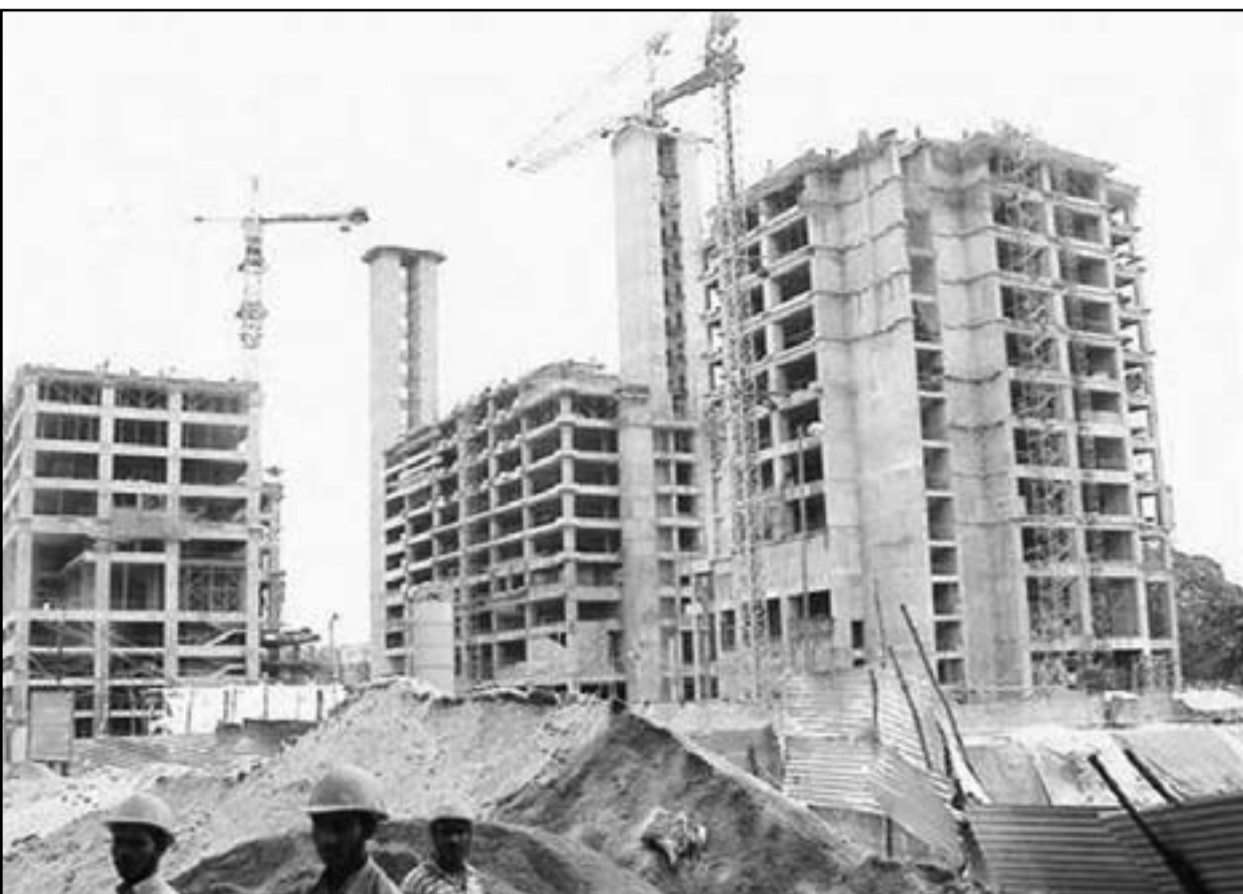
نمو متضخم في المشاريع العقارية في الرياض

■ الرياض-يو بي أي: أقر مجلس الوزراء السعودي الاثنين نظامي الرهن والتمويل العقاري الذي تنتظره سوق العقار في المملكة منذ سنوات.