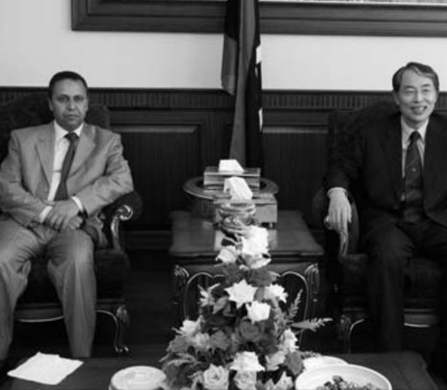
رئيس المحكمة الدولية الكوري سانغ هيون سونغ خلال مقابله وزير العدل الليبي علي حميد عاشور في طرابلس امس

وكان الموقع الرسمي لحركة النهضة على الإنترنت قد ذكر أن الرئيس المصري كلف جلته بتوديع الغنوشي في مطار القاهرة مساء السبت الماضي وتسليمه هدية عبارة عن قلادة.