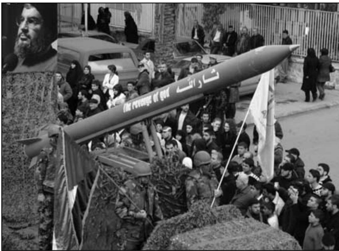
اسرائيل تخشى ان ينقل الاسد اسلحته الى حزب الله

كبهذه المنظومة نفسها جدير بكل شأن، وهي تعطي الحكومة مرتبة في ممارسة التفكير المستوطنات في كل موقع، وهم يرون في نموذج الزعيم الايدولوجي التواضع، وبالتالي نحن لسنا غير مباينين وزائغي البصر جراء ذلك».