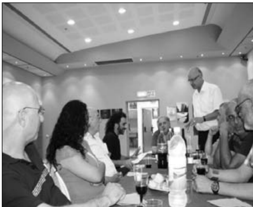
طاقم عمل «مع فائق الاحترام» في مسرح الكرمة

تصنف مسرحية «مع فائق الاحترام» ضمن الجانر المسرحي الكوميدي وتحدثت عن معلم مدرسة يرغب بالخروج إلى التقاعد بعد سنوات طويلة من الخدمة بتفان وإخلاص فترفض «المؤسسة» طلبه فيواجه مشاكل عديدة توصله إلى مواقف مرحة وحالات غير معتاد عليها. المسرحية تعكس بعض مظاهر الدور الأخرى الاجتماعي والتناقضات الحادة بين التزام الإنسان بمبادئ أخلاقية وبين الواقع القاسي الذي نضطر أحياناً للتحايل عليه من أجل مواصلة الحياة. هل ينجح الأستاذ في الخروج للتقاعد وفي نفس الوقت المحافظة على كرامته الشخصية