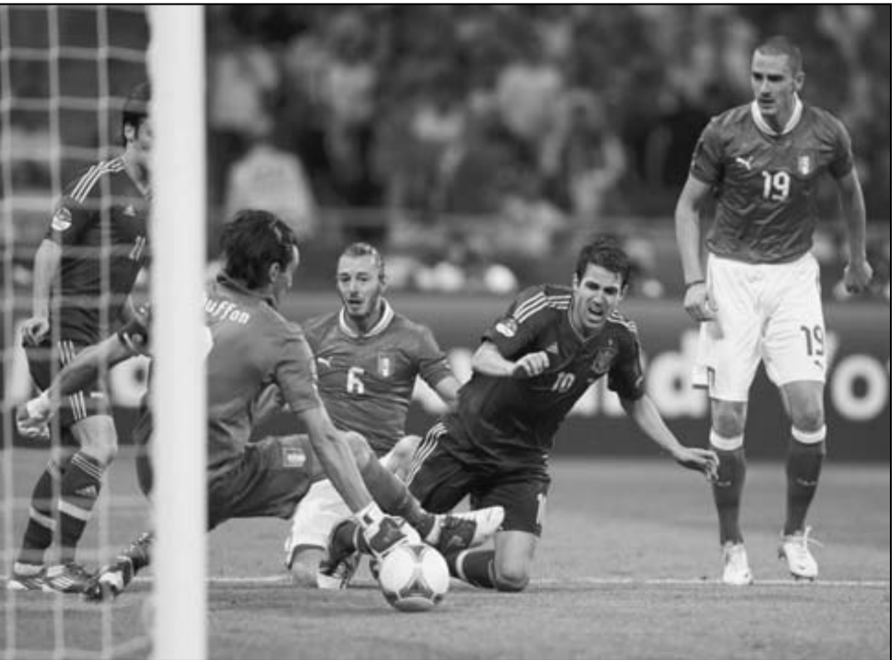
نجم منتخب إيطاليا جيانلويجي بوفون (الثاني من اليسار) انقذ المرمرى من هجمة نجم أسبانيا فايبريغاس (الثاني من اليمين)

وأعاد بليك الذي يتدرب مع بولت الفضل لزميله في مساعدته على الصعود للفة منصة التتويج في كينجستون لكن العداء الجاميكي للملعب «الوحش» ربما لن يحصل على المزيد من النضائح من بولت عقب أربعة أيام من السيطرة التامة في التصفيات الأولية.