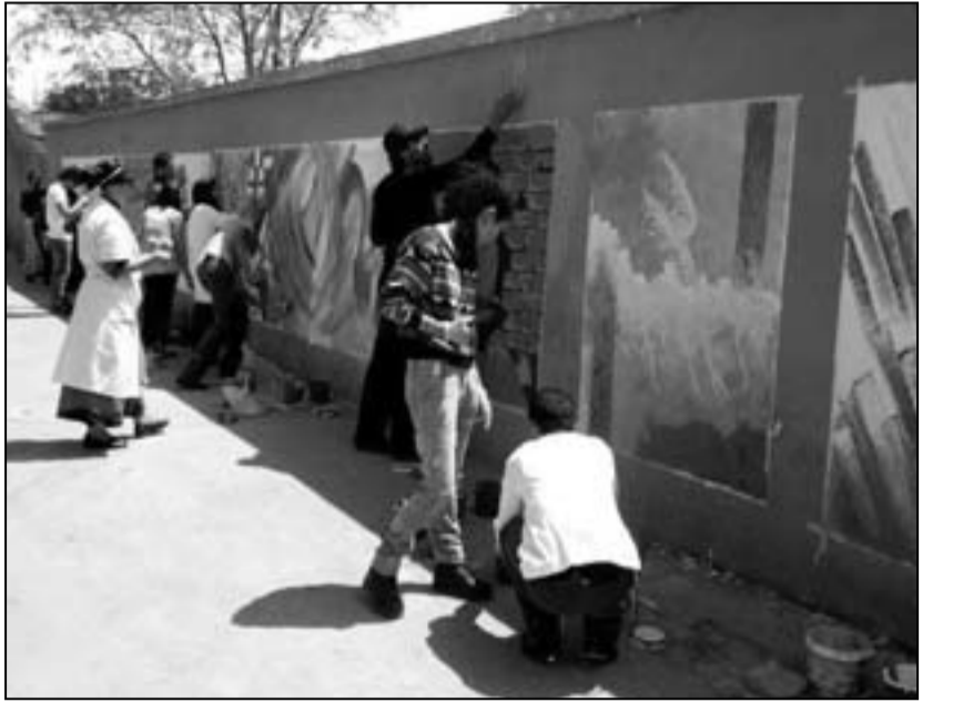
الملتقى الوطني الرابع للشباب بابن أحمد