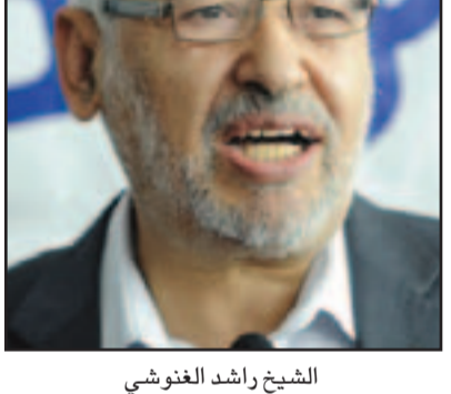
الشيخ راشد الغنوشي

نفي الدكتور ياسر علي، المتحدث الإعلامي المؤقت باسم مؤسسة الرئاسة، الاثنين، أن يكون نجل الرئيس محمد مرسي أعطى هدية لرشد الغنوشي رئيس حزب النهضة التونسي ببطار القاهرة كان الموقع الرسمي لحركة النهضة على الإنترنت قد ذكر أن الرئيس المصري كلف نجله بتوديع الغنوشي في مطار القاهرة مساء السبت، وسلمه هدية عبارة عن قلادة.