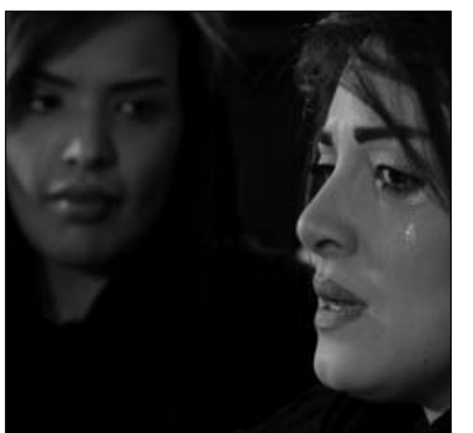
لقطة من مسلسل «أنت عمري»

ويكي «أنت عمري» قصة اجتماعية جميلة تتناول تناوّل حكاية أبٍ في مشارف الستين لديه عدد من الأبناء لكل منهم اهتمامات مختلفة في الحياة، تحدث بينهم خلافات ومواقف عدة تكشف على أثرها أمور لم تكن في الحسبان.