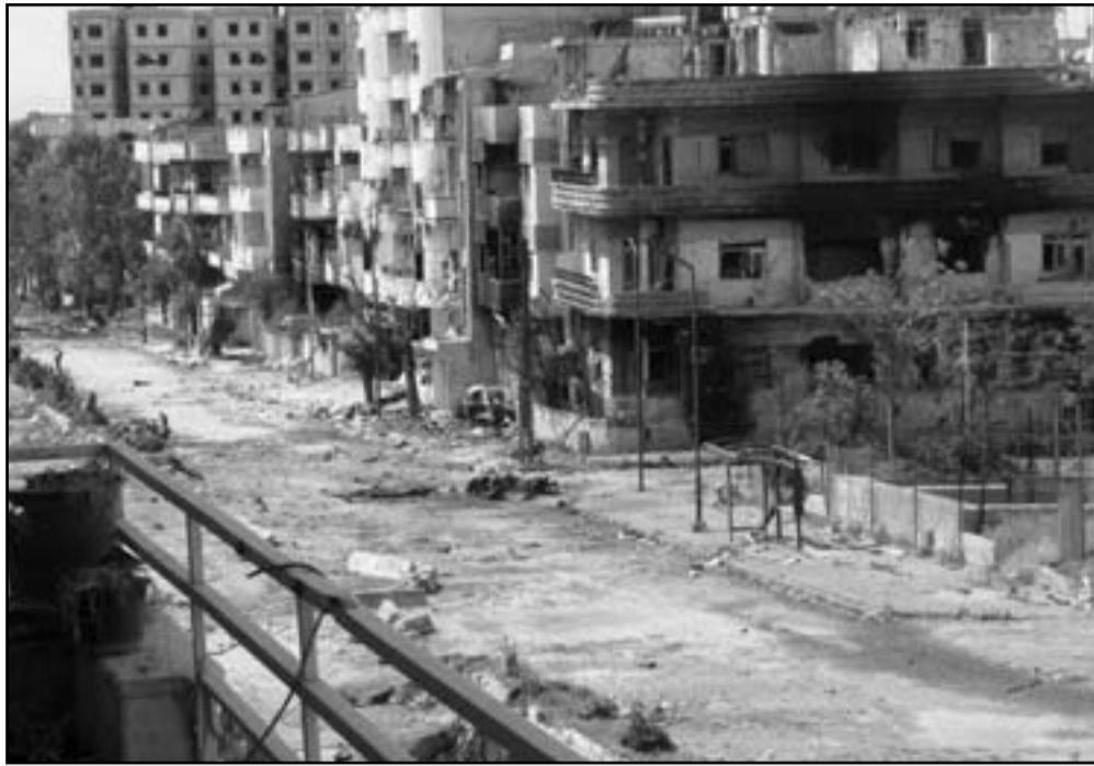
لا يمكن وقت العنف في سوريا دون جهد دولي

في مواقعهم وهم جاهزون لاستئناف نشاطهم في اللحظة التي ترى فيها الأطراف سليما الدخول في مفاوضات، النزاع هو سوري، وعلى الشعب السوري ان يجد له حلا، ولكن سيكون من السذاجة الشديدة للتفكير بانهم وحدهم سيتمكنون من وضع حد للعنف والشروع في مسيرة سياسية ذات