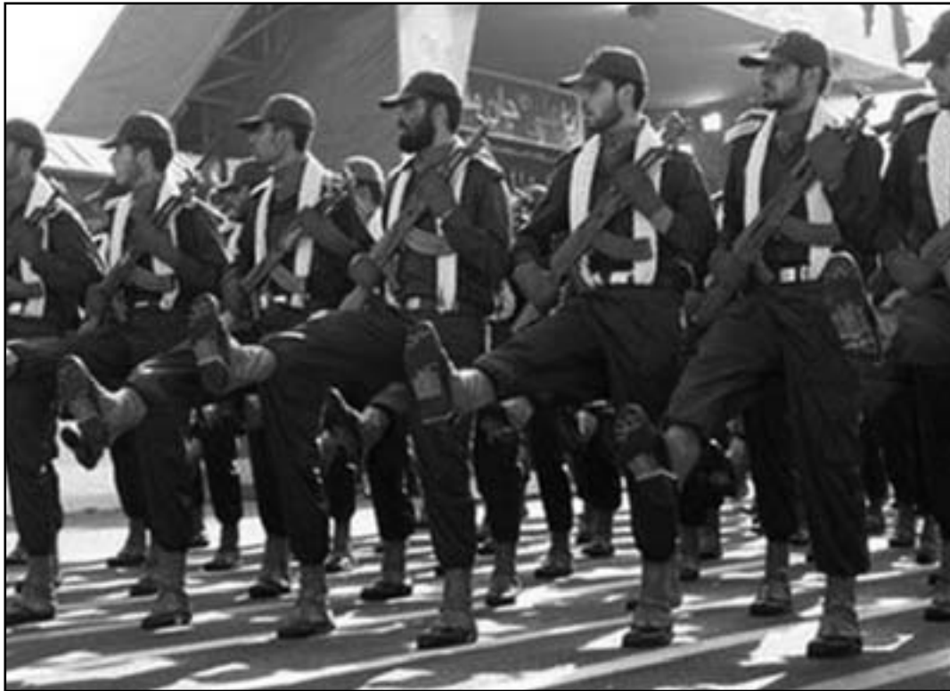
الخطر الايراني يهدد دول المنطقة جميعها

تحد ان يوجد تفكير يقضي التغيير توجه حقيقي، فما تزال التغييرات في منطقتنا في مهدها.