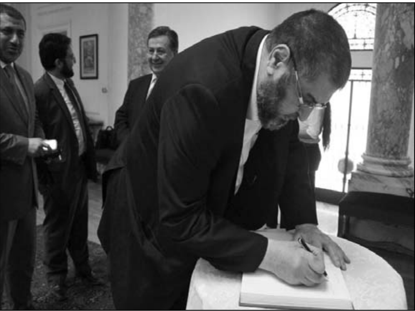
المهندس خيرت الشاطر نائب المرشد العام للأخوان يوقع في سجل الزيارة للسفارة التركية بالقاهرة أثناء زيارة وزير الخارجية التركي لمصر

جديد، لافتا إلى أن التغييرات في الأشخاص بدأت وستستمر، وسنرى شخصيات أخرى تتبوأ مناصب رفيعة، لم تكن نعرفهم، مشيراً إلى أن نظام الرجل الواحد في مصر انتهى إلى غير رجعة، وعلينا أن نأخذ بعين الاعتبار أن المشير نسطاوي طالب بتعيين وزيرين جديدين في الحكومة، أي أن الجيش يتدخل، ولكن بموازاة ذلك، فإن حركة الإخوان المسلمون تلعب دورا هاما في السياسة المصرية.