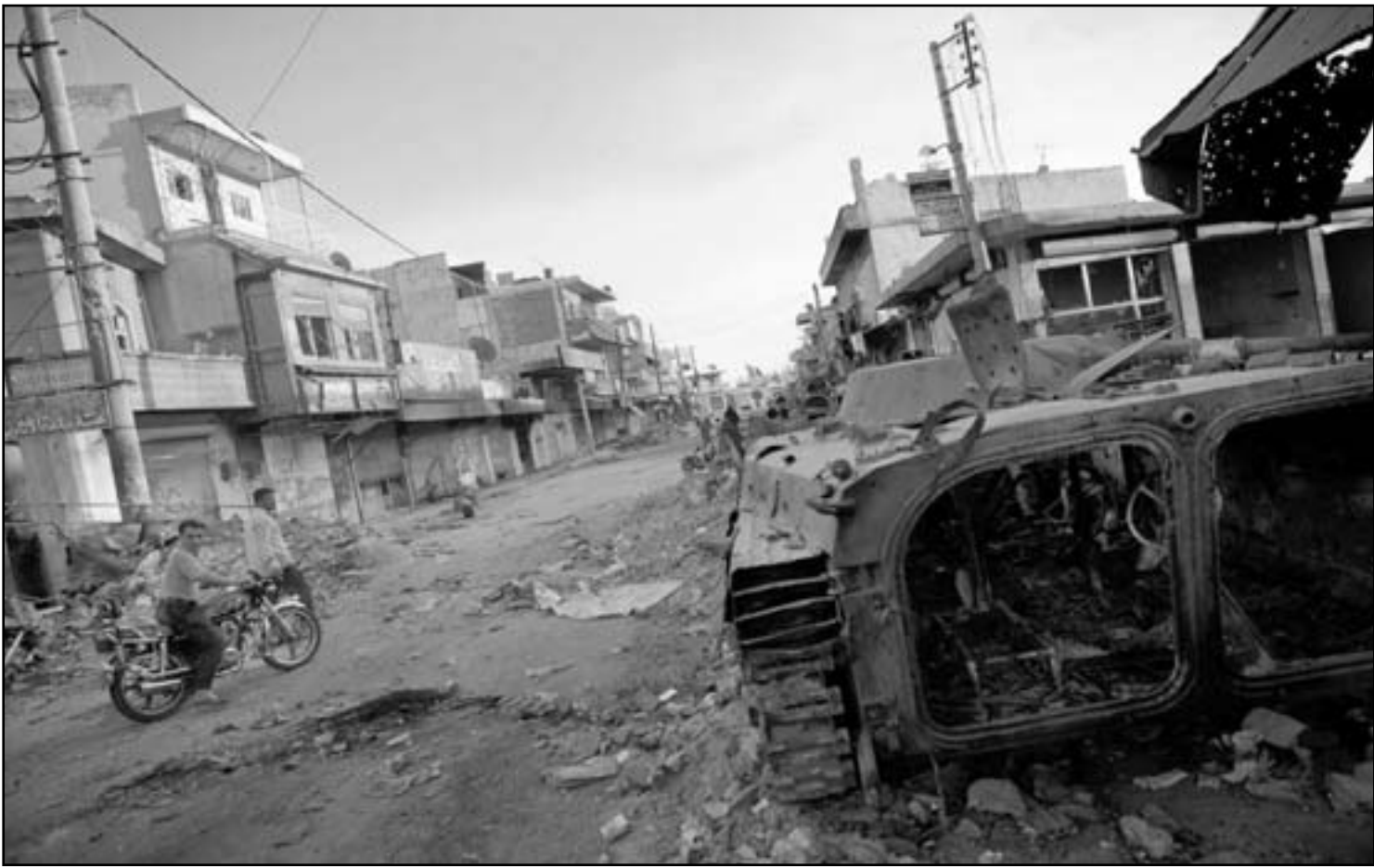
آثار الدمار في منطقة عقارب شمال حلب