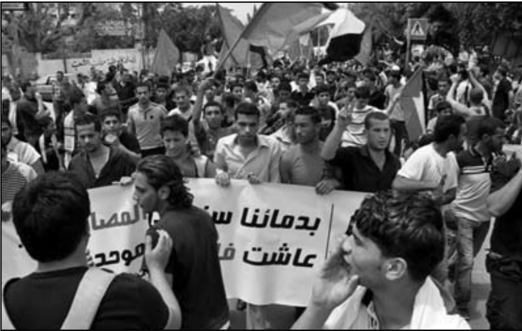
المحتاطرون الفلسطينيين يريدون ان تكف السلطة عن مساعدة الاسرائيليين

المفتش الادارة المدنية وحركة اليد الحبيبة من ضابط الارتباط الاسرائيلي، وإغلاق الطريق عن المزارع والبيوت في حين تزهزح البؤر الاستيطانية في المقابل: ان كل فاصلة من وجود السيطرة الاسرائيلية مؤلمة. كان سبب المظاهرات مجرد الدل في استعداد محمود عباس ان يجري لقاء