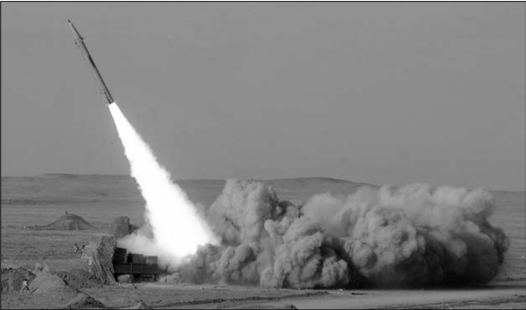
إيران تختبر صاروخا قصير المدى صحرَاء دشت كوير بوسط إيران

■ عواصم - وكالات: ذكر مسؤولون امريكيون ان الولايات المتحدة نقلت سراً تعزيزات عسكرية إلى الخليج بغية ردع الجيش الإيراني عن القيام بأية محاولة لإغلاق مضيق هرمز، وزادت من عدد المقاتلات النادرة على خلاف مع إيران في حال تصاعد الخلاف حول برنامجها النووي.