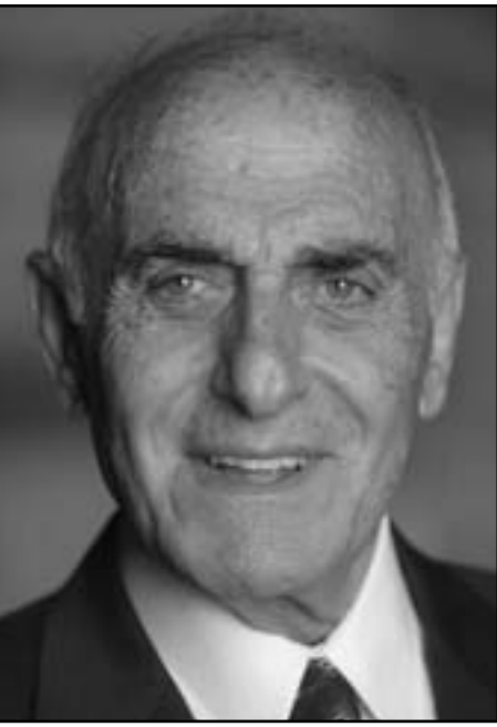
لندن - «القدس العربي»: