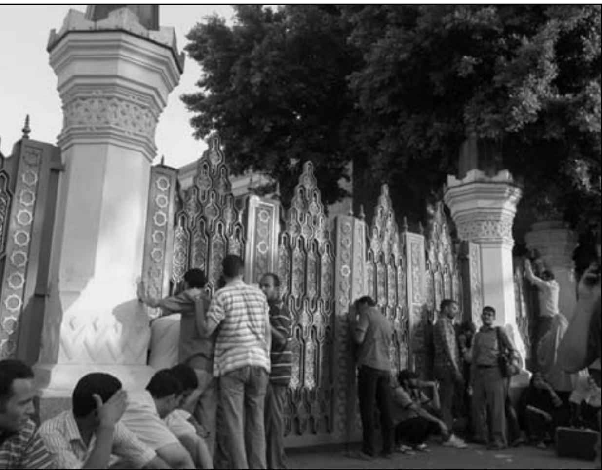
مظاهرون امام احد ابواب القصر الرئاسي بضاحية مصر الجديدة في القاهرة امس