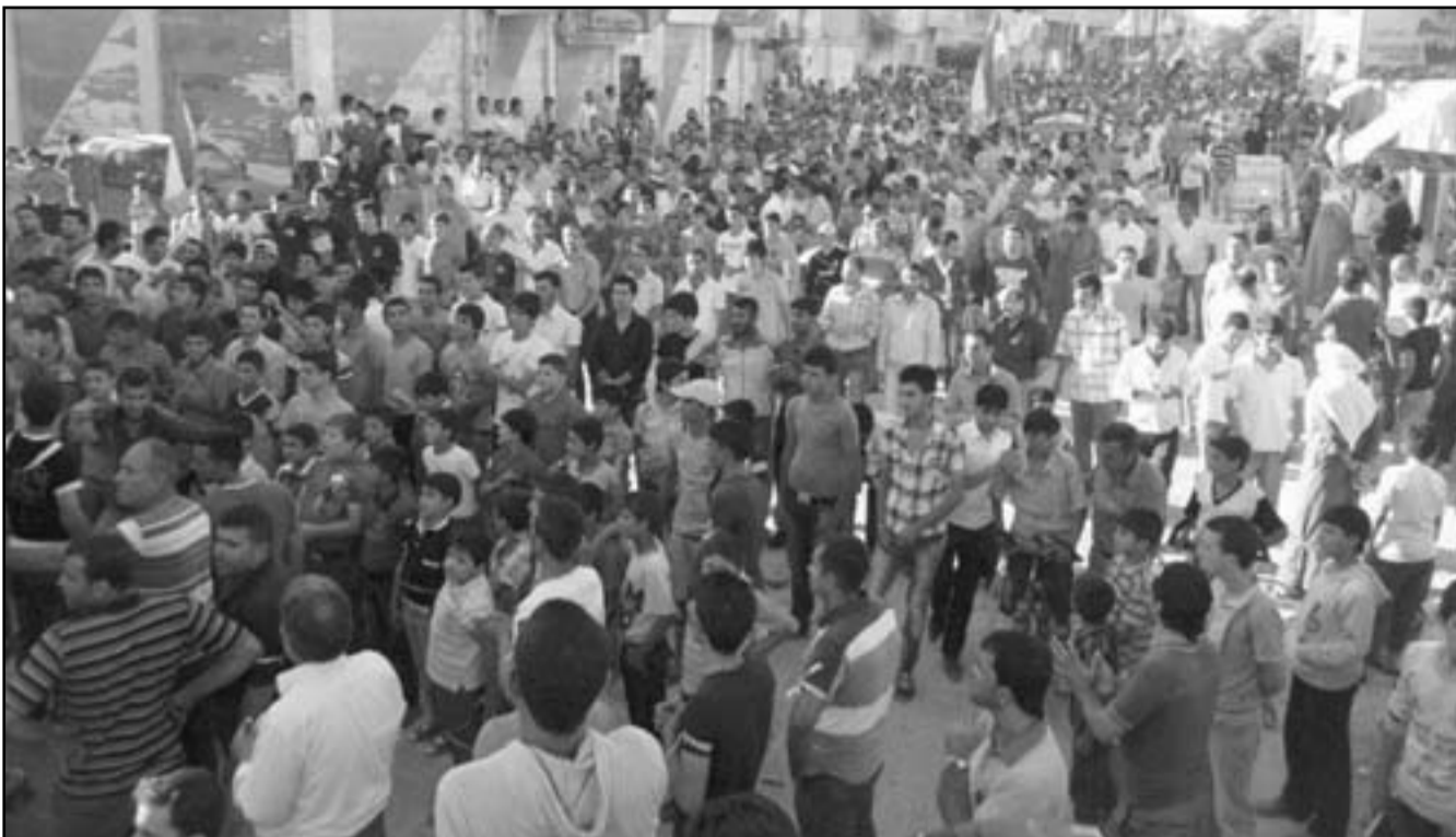
سوريون واكراد يتظاهرون ضد الاسد

بيروت - دمشق - بيلااداجي (تركيا) - وكالات: تواصل عمليات القصف والإشتباكات الأربعة في مدن سورية عدة، تركزت بشكل خاص في ريف دمشق وحمص (وسط) ودرعا (جنوب)، ما أدى إلى مقتل 19 شخصا غالبيتهم من المدنيين، في الوقت الذي إتهم فيه الرئيس السوري بشار الأسد، الحكومة التركية بالتواطؤ في الأحكام الدموية في سورية وتأمين الدعم اللوجستي لها، وإرهابيين، واعتبر أن رئيس الوزراء التركي رجب طيب أردوغان أظهر خلفيته الطائفية، وهو يحمي إسرائيل من خلال نصب الدرع الصاروخية على الأراضي التركية.