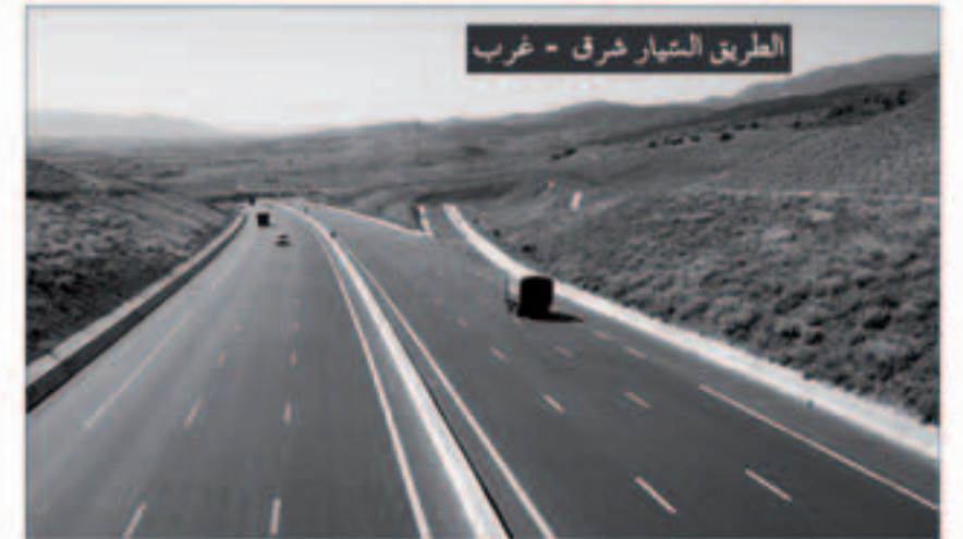
الطريق السيار شرق - غرب

كما هو معلوم، عرف الاقتصاد الجزائري منذ الإستقلال تحولات وتغيرات هامة أهمها الظروف والتحويلات التي عرفتها كل من الساحل الوطني والدولية