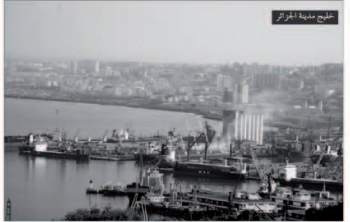
خليج مدينة الجزائر

يحتفل الشعب الجزائري وكل الأحرار في أرجاء المعمورة هذه الأيام بالذكرى السنوية الخمسين لإستقلال الجزائر بعد ثورة عظيمة ألهمت مشاعر الملايين من المستضعفين والمحرورين في الأرض ومهدت الطريق للقضاء على الاستعمار القديم في مختلف القارات وخاصة في إفريقيا.