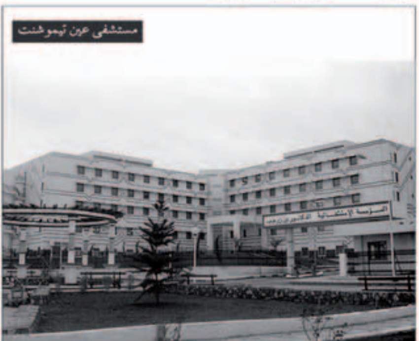
مستشفى عين تموشنت

لا شك أن الجزائر ومنذ الإستقلال عملت على وضع مبادئ أساسية تقوم عليها السياسة الصحية وذلك سعيا منها لتجسيد حق المواطن في العلاج كما نصت عليه مبادئ الثورة و دساتير الإستقلال، والذي اعتبر مكسبا ثوريا، وهو الآن حق من حقوق المواطن. هذه السياسات عرفت نجاحات وانتكاسات وذلك عبر المراحل المختلفة التي مرت بها الجزائر.