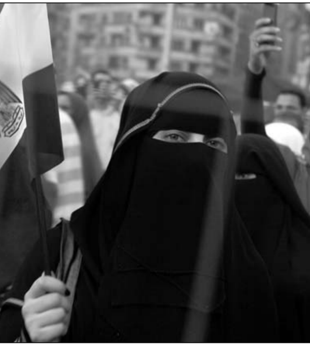
مظاهرة في ميدان التحرير مساء الثلاثاء دعما لمرسي