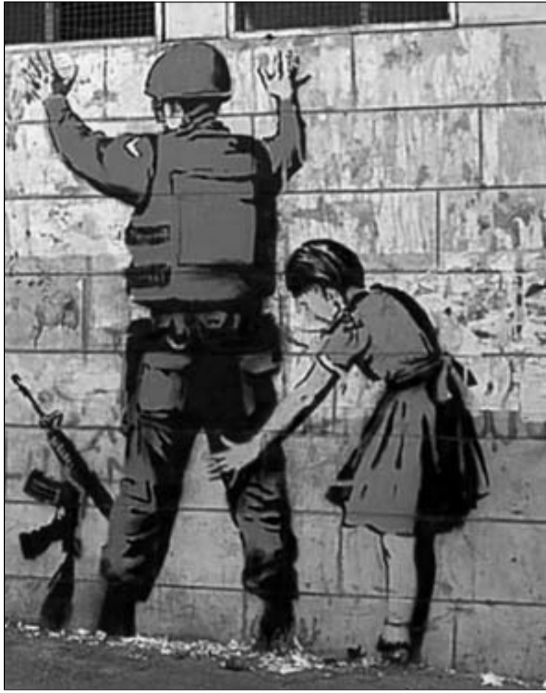
أحدى أعمال بانكسي

رسم بانكسي المشهد «مارفان ولته» أول الجنود الإنكليز للحررين من المعتقلات الألمانية سنة 1945 معتمدا في عمله على صورة نساء ورجال يلبسون ألبسة مرمقة بالية وهي في حالة حزن معتمدا في ذلك على تقنية الغرافيتي. أما تركيبة العمل فقد قسمت إلى قسمين: في المنحنى الأمامي صورة الأسلاك الشائكة، وأما خلفية العمل فقد جمعت صورة الرجال والنساء والسما،