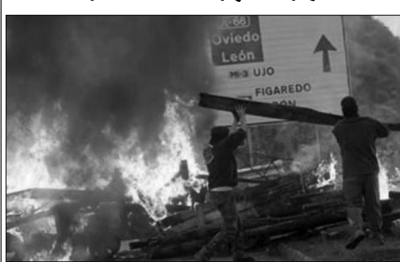
من المواجهات التي حصلت مع عمال المناجم منذ أيام

وأكدت أن أحد أفراد المجموعة التي أرسلت من أجل إحضار الرهائن أصيب في إطلاق النار خلال الاشتباكات بين الأزداد وبين جماعة التوحيد في غرب إفريقيا، مشيرة إلى أن عملية نقل الرهائن من التراب المالي إلى داخل الأراضي الجزائرية