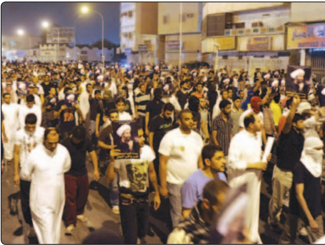
سعوديون خلال تشييع جنازة قتيل سقط في القيفيل بالمنطقة الشرقية