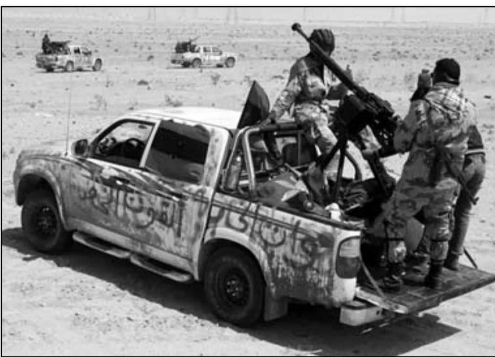
الامم الآن هو جمع السلاح من المقاتلين

وعلى سؤالى حول احترام كل الأديان اجاب: «حاليا ليس لدينا اديان اخرى، وبالتالي فهذا غير واقعي، ولكن الدستور سيعبر عن الاحترام والتسامح».