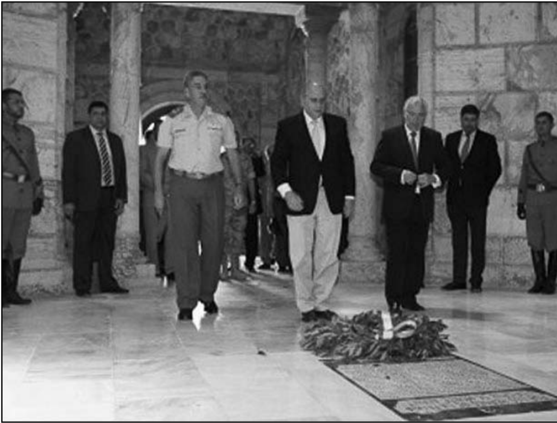
وزير الداخلية الإسباني يضع اكليل زهور على قبور اضرحة الجنود الأسبان

ونكرت مصادر أمنية أن هذا الجندي وهو برتبة ضابط صف، يبلغ من العمر 45 سنة أصيب على مستوى صدره بكسور جراء تعرضه للرشق بواسطة الحجارة، وذلك أثناء هجوم مجموعة من المهاجرين الأفارقة على السياح من أجل الدخول إلى مدينة مليبية.