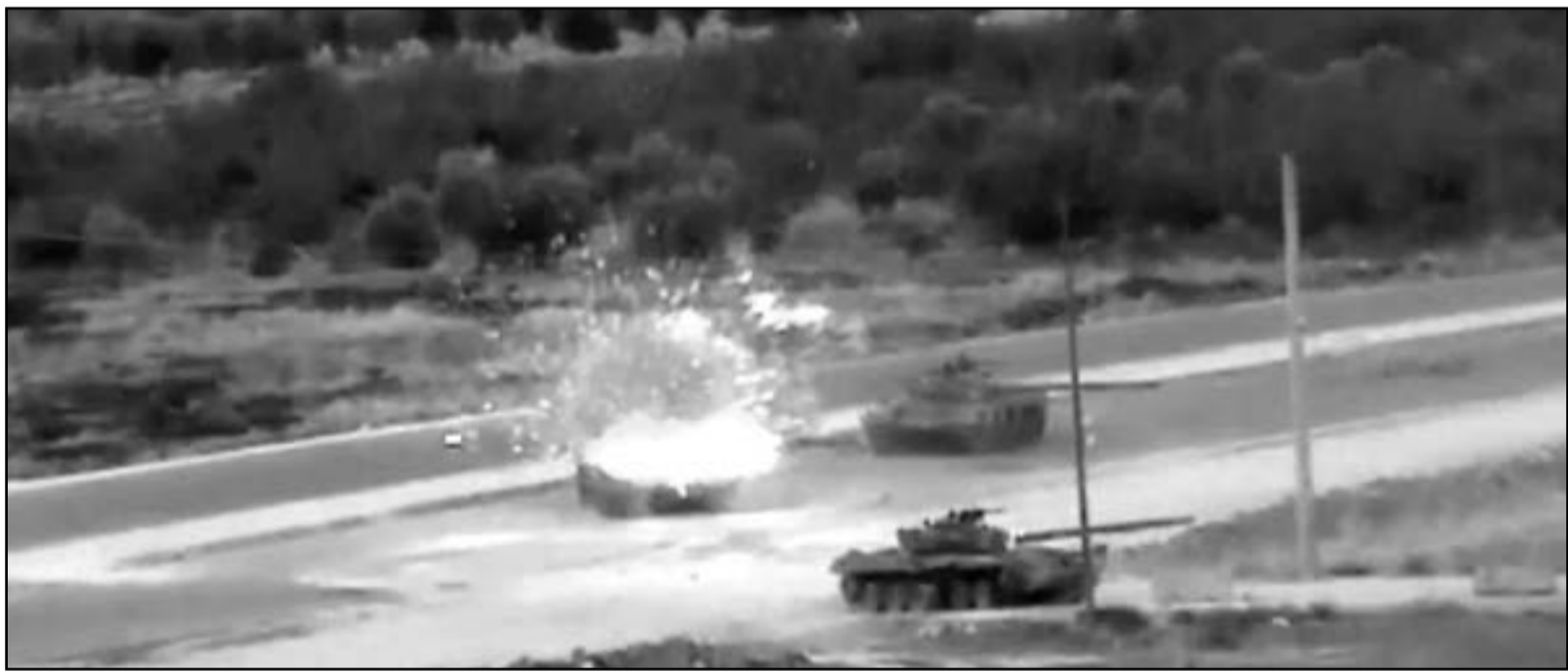
قذيفة تصيب دبابة للقوات السورية قرب الحدود التركية

وقال أحد سكان المنطقة ليو نايتد برس إنترناشيونال، ان عوة ناسفة كانت موضوعة في إحدى السيارات أمام وزارة النفط في العديوي في دمشق، انفجرت وادت الى مقتل أحد الأشخاص داخل السيارة. واضاف انه سُمع إطلاق رصاص لمدة قصيرة في منطقة العباسيين إثر حدوث انفجار. وتشهد سورية منذ 15 آذار (مارس) عام 2011 مظاهرات تطالب بإصلاحات وبإسقاط النظام، تحولت الى مواجهات بين قوى مسلحة وأجهزة الامن الحكومية، أدت الى مقتل الآلاف من الطرفين. وفيما تنهم المعارضة الحكومة بأنها تقصف البلدات وتقتل من تصفهم بالمظاهرين السلميين،