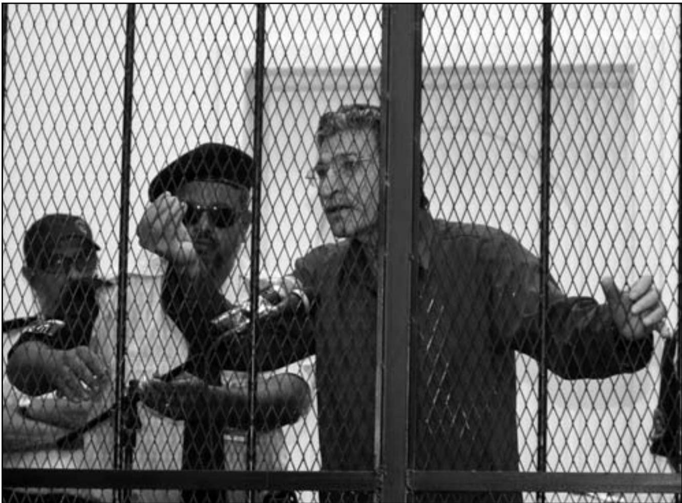
الرئيس السابق للمخابرات الليبية بوزيد دوردة يدافع عن نفسه أثناء محاكمته في طرابلس

■ «الكحول» وجاء في تقرير الصحيفة ان الطحالب التي عثر عليها في جثة غانم تظهر انه شفيق مرتين طلبا للهواء قبل ان يغرق. وصرح فيكسي بان مكتب الادعاء يريد ان يعرف من الذي اتصل بهم غانم في الايام التي سبقت موته وما حدث في الساعات الاخيرة قبل ان يلفظ انفاسه. ولم يتسن لروبرتز الحصول على تعليق فوري من المتحدث باسم مكتب الادعاء امس الاربعا. وكان غانم من اقوى رجال نظام القذافي ويسمى بـ«الزعيم» الحكومة واسرة الزعيم الراحل الى ان انشق وانضم الى صفوف المعارضة في ايار (مايو) من العام الماضي مع تدفق قوات المعارضة على العاصمة الليبية طرابلس. وكان انقلابه على النظام السابق نقطة تحول في الانتفاضة التي اطاحت بالقذافي الذي اعتقله وقتله في وقت لاحق مقاتلو المعارضة. وحامات شمس والجمعة، وقالت الشرطة انه ظل في الماء بضع ساعات منذ قرب فجر يوم 29 نيسان (ابريل). وصدم حداث غرق غانم الغامض واصفاه وزملاءه الذين قالوا حينها انهم يشكون في ان اعداءه ربما لحقوا وقتلوا الرجل الذي يعرف أكثر من اي شخص آخر عن اموال القذافي التي تقدر بالمليارات. وعثر على جثته بكامل ملابسه عائمة على سطح المياه بعد مئة ايام من منزله بالقرب من منتزه به مطامع وحانات يتردد عليه سكان فيينا لاخذ حمامات الشمس والجمعة، وقالت الشرطة انه ظل في الماء بضع ساعات منذ قرب فجر يوم 29 نيسان (ابريل). ولا يوجد سور حديدي عند حافة الماء في هذه المنطقة وليست هذه هي المرة الاولى التي يعثر فيها على جثة طافية في هذه الالحاء. وقال توماس فيكسي المتحدث باسم مكتب الادعاء لصحيفة «كوريير» اليومية «اصيب بقصور في القلب ثم غرق في الدواب، اضافة الى ذلك لم يزل العثور على ابي سواد في دمه تفوق الاستهلاك الطبيعي للكافيين