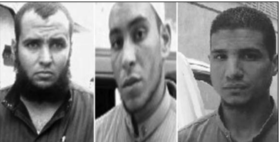
المتهمون بقتل طالب بكلية الهندسة في السويس

حياة الجنى عليه، وقررت الفتاة التي كانت بصحبة الجنى عليه أنها كانتا يجلسان سويا في مكان منظور للمارة في حديقة عامة وفوجئت بتعدى الجناة عليهما وقتل الجنى عليه، وكشف التحقيقات عن أن المتهمين من حملة المؤهلات المتوسطة وسبق اتهام أحدهم بالسرقة من أحد المساجد وأن المتهم الأول لحام كهربائي) والثاني موظف بهيئة التجميل والنظافة والثالث عامل بالترسانة البحرية. كما كشفت التحقيقات إعتراف المتهمين فترا دنيا متشددا وأنهم كانوا عصبة تدعو لفرض الأمر بالمعروف والنهي عن المنكر من وجهة آرائهم الدينية المتطرفة وأن المتهمين اتخذوا من العنف والإرهاب والقوة والترجيع وسيلة لتحقيق أفكارهم المتطرفة. كما تبين ان المتهمين تلقوا معلوماتهم الدينية في بعض الزوايا والمساجد واعترفوا بانتهاجهم للمنهج السلفى واعتيادهم على توجيه النصح والإرشاد للمواطنين لنشر تعليمات الدين وفقا لرويتهم ومعلوماتهم الدينية في بعض الزوايا والمساجد واعترفوا بانتهاجهم للمنهج السلفى، واعتيادهم على توجيه النصح والإرشاد للمواطنين لنشر تعليمات الدين وفقا لرويتهم.