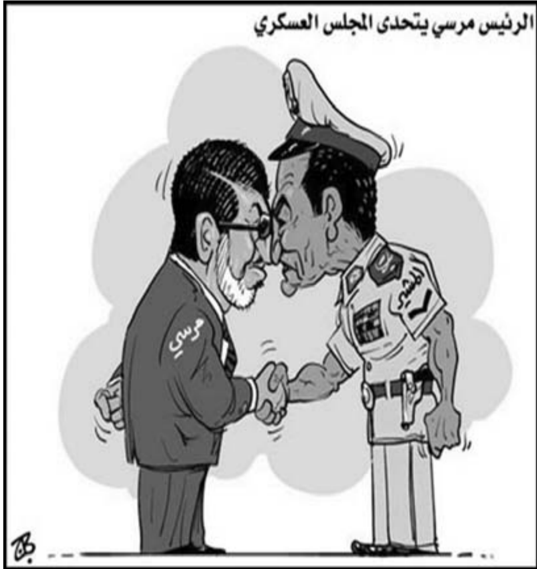
الرئيس مرسي يتحدى المجلس العسكري

البرلمان الذي يسيطرون على ثلاثة ارباع مقاعده، واعتمدا على فتاوى قانونية ودستورية من خبراء يؤيدون هذا الموقف، ولذلك اردوا ان يصححوا ما يعتقدون انه خطأ في حقهم، وسلب لانجازهم. المجلس العسكري الاعلى للقوات المسلحة الذي استحوذ على السلطة التشريعية بعد حل مجلس الشعب، تعاطى بدهاء بحسب له عندما لم يقدم على اي رد فعل غير محسوب على تحدي الدكتور مرسي بالغاء قرار المحكمة الدستورية بحل مجلس الشعب، وحول المسألة الى قضية دستورية، ومعركة قانونية بين الرئيس الجديد والمؤسسة القضائية، وادعى انه ليس طرفا، واكد على احترامه للدستور وهوية الدولة المصرية كدولة مؤسسات. وربما يجادل البعض في اوساط حركة الاخوان بان الرئيس مرسي بخطوته هذه بالتشكيك في دستورية حكم المحكمة الدستورية في حل مجلس الشعب، اراء اختيار قوة المجلس العسكري، ومحاولة انتزاع المزيد من الصلاحيات، وتأكيد هيبة كرتيش قوي، وهذا جدل ينطوي على الكثير من الصحة، ولكن مشكلة الرئيس مرسي، ان الطرف الآخر مرتبص ويملك رصيда كبيرا في التعاطي مع التحديات الصعبة، اكتسبها على مدى اربعين عاما من العمل في قلب السلطة وليس دهاليزها فقط. المنتصر في جولة التحدي الاولى هذه هو الشعب المصري الذي يتطلع الى الامن والاستقرار، ويريد من نخبته السياسية التعايش والتألف، وليس التصارع، في هذه المرحلة الانتقالية الحرجة من تاريخ البلاد. مصر تحتاج الحكمة والتبصر في هذه المرحلة وتراجع الرئيس مرسي عن قراره هو تجسيد لذلك، والمأمول ان يتم استيعاب جوانب تجربة الايام الاربعة الماضية المرعبة التي اقترنت فيها مصر من خافة هادية صدام مرعب ومدمر بين رئيس جديد ومؤسسة عسكرية قوية متهيبة لتعزيز سيطرتها على سلطة ما زالت مثبته فيها من خلف ستار.