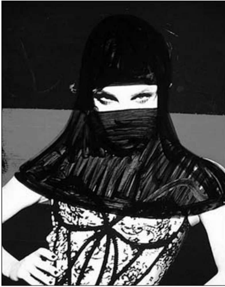
رسم أميرة الحجاب

زى ذلك فقد اعتمد بانكسي في رسمه الغرافيتي على اللون الوردى على سفاهة العنقيلن بالإضافة إلى أنه وظف القيمة الضوئية السوداء والبيضاء واللون الرمادي على الأجساد وإيحاءات الوجود ليصبح المشهد أكثر تعبيرية في هذا المشهد الحزين. إن هذا المشهد الذي عرضه الفنان بانكسي في شوارع لندن يهدف إلى التذكير بالمعتقلات النازية المأوى في مارتست أيشع أنواع القمع والاضطهاد والعنف ضد العنقيلن الإنكليز وغيرهم من جنود جيوش الحلفاء في تلك المعتقلات أياها الحرب العالمية الثانية، ومن خلال هذا المشهد الصامت الذي عرض فيه بانكسي على جمهوره صورة تعبيرية جرسية تصف بدون كلام مشهداً إنسانياً بامتياز ولاشعر خلال الحرب العالمية الثانية التي عاش مالوف الفن الذي تعارف عليه المشاهد في عروضة المتاحف الفنية و دور العرض الخاصة مما يدفع بمتابعي هذه الأعمال إلى الجدل وطرح الأسئلة والنقاش في مثل هذه المواضيع الشائكة التي لم يعتد عليها المشاهد الأوروبي، مباشرة و أثناء إيجاز الفنان لعل محطة مترو الأنفاق باريس واحد من أهمها.