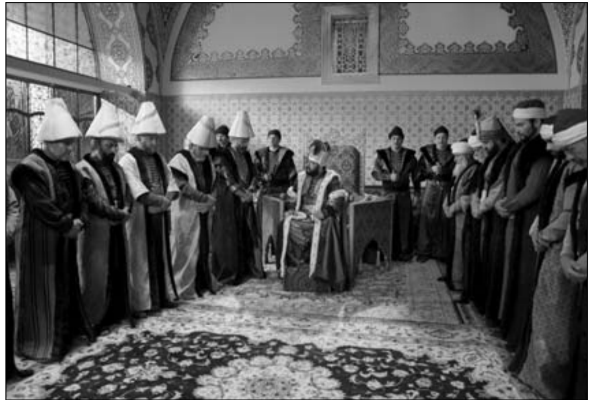
لقطة من مسلسل «أرض العثمانيين»