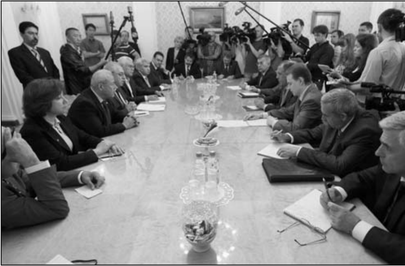
جانب من اجتماع المسؤولين الروس مع المعارضة السورية في موسكو

وذكر فاليريو برغبة فرنسا بالتوصل الى «قرار لجلس الامن بموجب الفصل 30 حزيران (يونيو) في اجتماع عقده في جنيف على مبادئ مرحلة انتقالية سورية تنص خصوصا على تشكيل حكومة تضم وزراء من الحكومة الحالية ومعارضين. الا ان المعارضة السورية أعلنت رفضها البحث في اي عملية انتقالية قبل تنحي الاسد. وقدمت موسكو الثلاثاء الى الاعضاء الـ14 في مجلس الامن الدولي مشروع قرار يمدد لمدة ثلاثة اشهر مهلة التفويض المعطى لبعثة المراقبين الدوليين الموجودة في سورية بقرار من مجلس الامن للتحقق من وقف لاطلاق النار اعلن في 12 نيسان (ابريل) ولم يتم الالتزام به، ولا يلحظ المشروع الروسي الذي حصلت فرنسا بريس على نسخة منه على فرض اي عقوبات، وتنتهي في 20 تموز (يوليو) مهلة مهمة المراقبين.