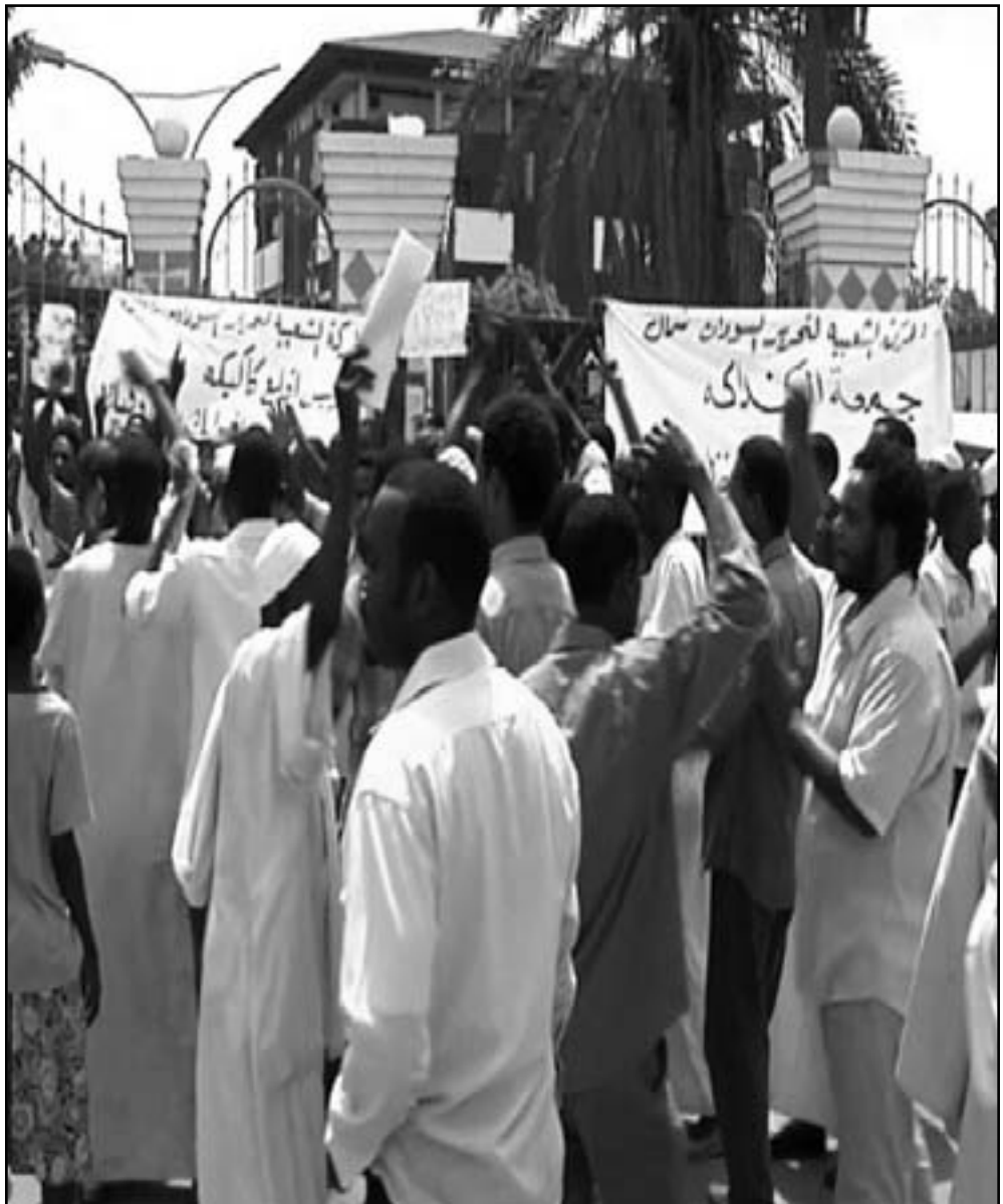
جانب من مظاهرة في الخرطوم تطالب برحيل النظام

الخرطوم - رويترز: قال شهود إن الشرطة السودانية أطلقت الغاز المسيل للدموع واستخدمت الهراوات لتفريق نحو 300 شخص كانوا يحتجون على الحكومة بعد صلاة الجمعة في أحدث مظاهرة مناهضة للرئيس السوداني عمر حسن البشير. وبدأت الاحتجاجات الشهر الماضي عندما أعلن البشير الذي يتولى السلطة منذ عام 1989 إجراءات تقشف صارمة تشتمل على إلغاء تدريجي لدعم الوقود. ولم تجذب المظاهرات في السودان بعد تلك الأعداد الكبيرة مثل مصر أو اليمن ولكنها تشكل تحدياً للحكومة التي تواجه أزمة اقتصادية وتكافح ارتفاعاً متصاعداً في أسعار الغذاء وعدداً من عمليات التمرد المسلحة. وقال شهود إن الشرطة في تكرار لأحداث الجمعة الماضية طوقت مسجد الإمام عبد الرحمن في ضاحية أم درمان في العاصمة الخرطوم وأطلقت الغاز المسيل للدموع عندما حاول نحو 300 شخص تنظيم احتجاجات بعد صلاة الجمعة. وقال أحد الشهود إن ضباط الشرطة استخدموا الهراوات لإعادة المصلين إلى