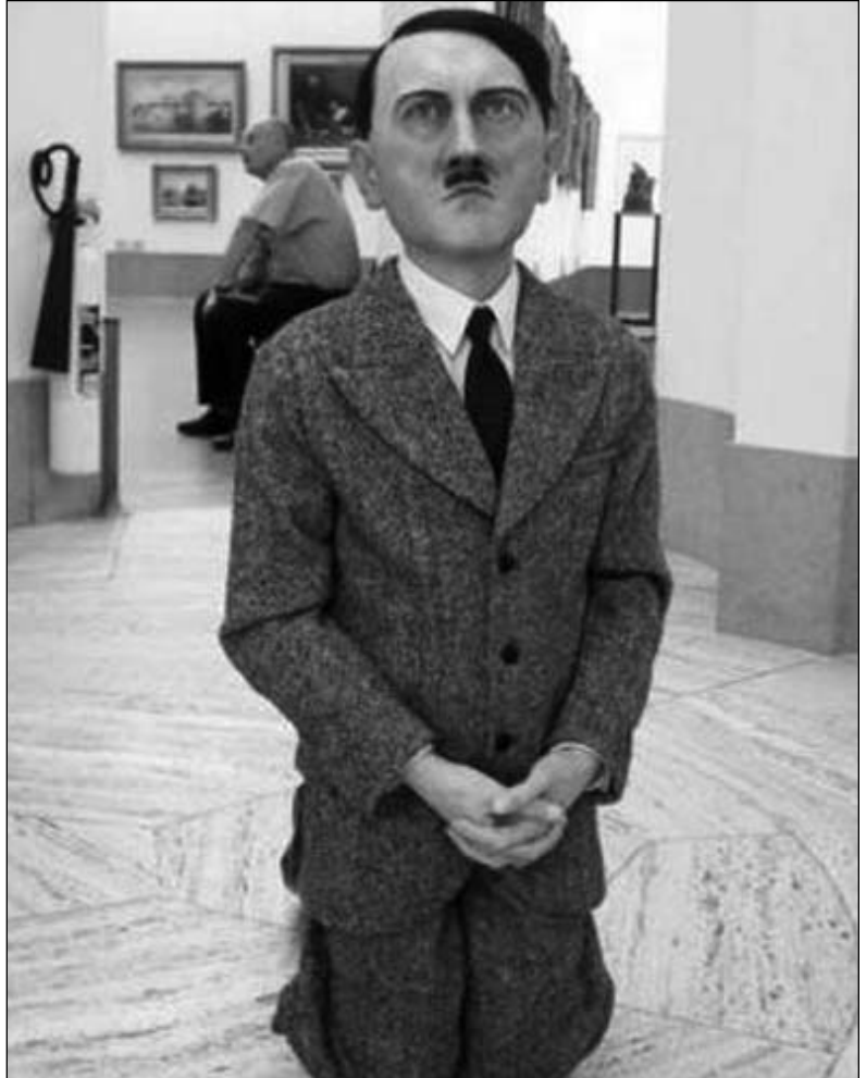
تمثال الفهرمر لماوريتزيو كوتيلان

ندرج في هذا السياق، نموذج الفنان البرازيلي