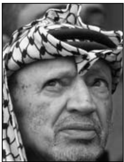
الرئيس الراحل ياسر عرفات

هناك تقاسم في الآراء هناك من اعتقد بضرورة قتله علناً وهناك من اعتقد بقتله سرا بشكل لا يربط مقتله بإسرائيل وهناك من اعتقد بإبعاده وطرده وهناك من قال يجب أن يتركه يتعفن داخل المقاطعة.