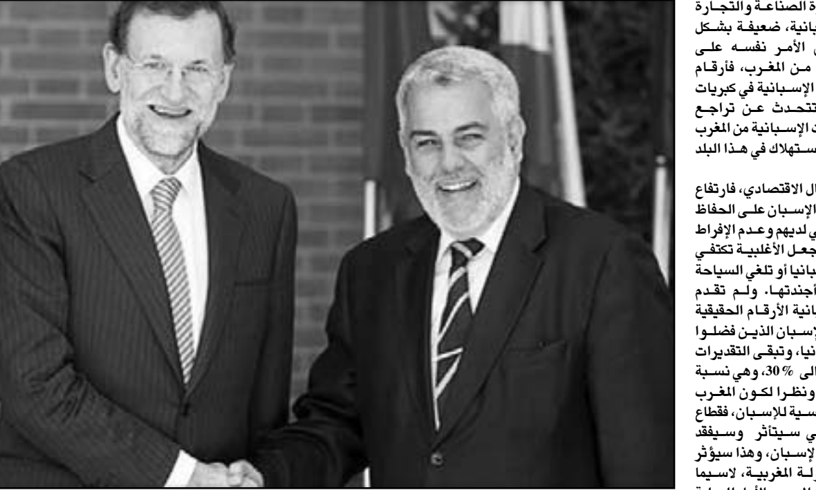
رئيس الحكومة المغربية عبد الإله ابن كيران رفقة نظيره الإسباني ماريانو راخوي

إحصائيات وزارة الصناعة والتجارة الخارجية الإسبانية، ضعيفة بشكل ملفت. وينطبق الأمر نفسه على واردات اسبانيا من المغرب، فراقم الغرف التجارية الإسبانية في كبريات المدن المغربية تتحدث عن تراجع واردات الشركات الإسبانية من المغرب بسبب تراجع الاستهلاك في هذا البلد الأوروبي. وادما في المجال الاقتصادي، فارتفاع البطالة وحرص الإسبان على الحفاظ على الأموال التي لديهم وعدم الإفراط في الاستهلاك، جعل الغالبية تحفظ بالسر داخل اسبانيا أو تلغي السياحة الخارجية من أجل تأمينها. ولم تقدم السلطات الإسبانية الأرقام الحقيقية لتراجع نسبة الإسبان الذين فضلوا البقاء في اسبانيا، وتبقى التقديرات في حدود الـ 25%، 30% وهي نسبة مرتفعة للغاية. ونظرا لكون الإقامة يشك وجه رئيسية للإسبان، وسيفقد السياحة المغربي سياحتا وسيفقد الكثير من السياح الإسبان، وهذا سيؤثر على موارد الدولة المغربية، لاسملا وأن الهجرة هي المصدر الأول للملعة الصعبة.