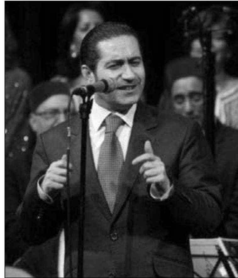
المطرب السوري حمام خيري

ومبدعة وثقافة وفن وهي ستجاوز هذه الازمة بأن الله وحام هو خير سفير لبلادنا وصوته يمكن أن يؤدي أكثر من أي سياسي..» لبنائون وسوريون تركوا خلاف الأرض وتوحدوا على الاندهاش بصوت حمام خيري، وقال اللبناني محمد الحاج الذي يناهز العقد الثامن من العمر «التيت من بيروت لاسمع القردود الحلبية وأنا تفاعلت بهذا الصوت القوي الشجي.. انا سمعت موشحات كثيراً ولكنه صوت فوق المستوى.. صوت نحاسي يطرأ الأذان».