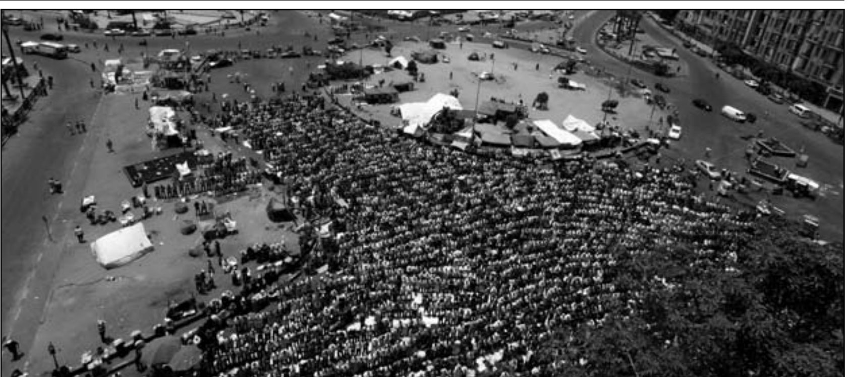
صلاة الجمعة في ميدان التحرير حيث تجمع متظاهرون دعماً للرئيس محمد مرسي

قال الدكتور ياسر على القائم بأعمال المتحدث باسم رئاسة الجمهورية ان الرئيس محمد مرسي يجري حالياً مشاورات مع كل القوى الوطنية في مصر للتوصل إلى الشخصية التي ستتولى رئاسة الحكومة الجديدة. وأضاف ياسر على - في تصريح للجمعة - أنه سيتم تسمية هذه الشخصية قريباً وبعد ان يستكمل الرئيس مشاوراته في هذا الصدد بعد عودته من زيارته لأديس أبابا التي تستغرق يومين حيث يشارك في القمة الأفريقية. وأشار المتحدث إلى ان الرئيس مرسي استقبل حتى الآن مجموعة من الشخصيات الوطنية التي تتمتع بالكفاءة والسمعة الحسنة والاحترام، وسيتم قريباً اختيار الشخص المناسب لرئاسة الحكومة الجديدة واصفاً هذا المنصب بأنه مهمة صعبة ومشاقة في هذه الظروف التي تمر بها مصر حالياً، متوقفاً ان تكون الحكومة الجديدة ائتلافية، مشيراً إلى ان القوى الوطنية سيكون لها إسهامها في اختيار الوزراء الجدد بعد مشاورات مع كل من رئيس الجمهورية ورئيس مجلس الوزراء، ونفى الدكتور ياسر على كل التكهنات التي تدور على الساحة السياسية في مصر حول شخصية رئيس مجلس الوزراء الجديد، وقال على سؤال حول