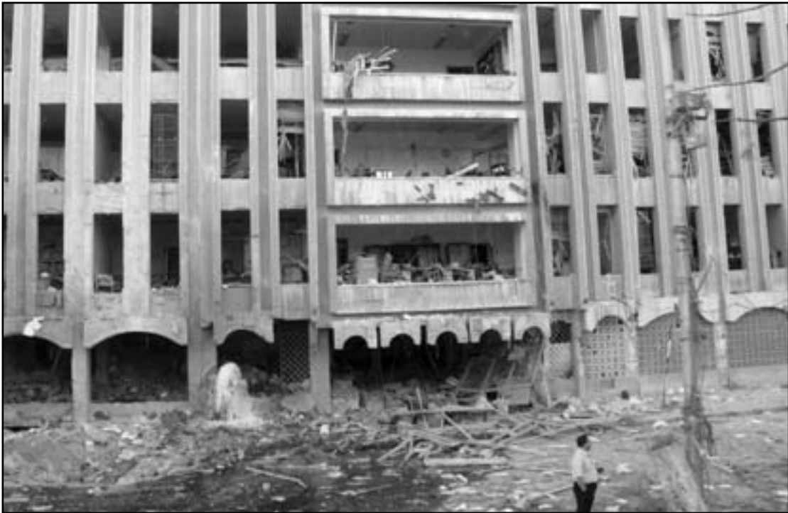
الاسرة الدولية مترددة بشأن التدخل العسكري في سوريا

قررت تجميد نقل طائرات التدريب من طراز (ب30)، الى السورين، وفي وقت قليل بضعة اشهر ان الطائرات ستنتقل الى سوريا كما هو مخطط، بدوى ان هذه طائرات تدريب فقط، وليست هجومية.