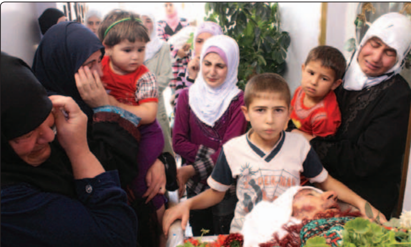
سوريون يبيكون احد ضحايا المجزرة التي نفذها الجيش السوري بقرية تريمسة

■ بيروت - عمان - وكالات: استيقظت سورية الجمعة على انباء مجزرة جديدة راح ضحيتها 220 شخصا معظمهم مدنيون من بينهم عائلات باكملها بقرية تريمسة في حماة حين صفتها طائرات الهليكوبتر والديبابات ثم اقتحمها افراد ميليشيا الشبيحة الذين نفذوا اعدامات، فيما اطلقت القوات النظامية النار على المظاهرات الجمعة في دمشق ومدينة حلب، كما اعلن عن مقتل 56 شخصا في اعمال عنف في مناطق مختلفة في البلاد. وقال نشطاء ان الذبحة وقعت الخميس فيما كان مجلس الامن الدولي يناقش مشروع قرار جديد بشأن سورية. وقالت واشنطن ان حلفاءم ذكروا ان هذا يظهر الحاجة الى القيام بتحرك قوي لكن روسيا استبعدت الموافقة على احداث مسودة وضعها. وقال مجلس قيادة الثورة في حماة لرويترز ان قرية تريمسة تعرضت لصفب باسلحة ثقيلة من القوات السورية ثم اجتاح القرية رجال ميليشيا موالون للحكومة و من يطلق عليهم الشبيحة وقتلوا الضحايا الواحد تلو الآخر، وقتل بعض المدنيين اثناء محاولتهم الهرب. وقال المجلس في بيان ان اكثر من 220 شخصا سقطوا امس في تريمسة، وهم قتلوا من جراء قصف الديبابات والروحيات والقصف الدفعي وعمليات الاعدام بلا محاكمة.