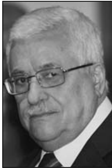
الرئيس الفلسطيني محمود عباس

وفي حادث آخر استشهد شاب فلسطيني وأصيب آخر بجراح، على أثر استهدافهم من قبل قوة من جيش الاحتلال الإسرائيلي في ساعات الصباح، خلال تواجدهم في منطقة حدودية فاصلة بين مصر وإسرائيل.