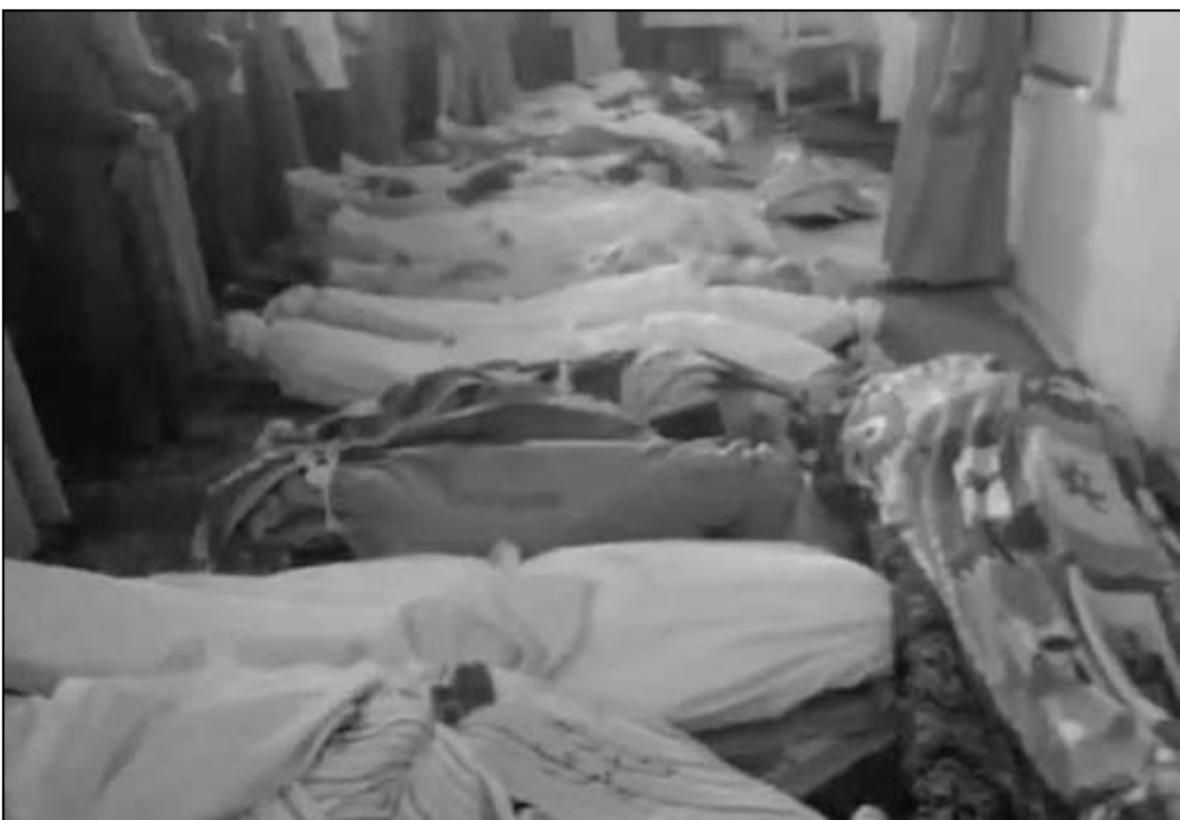
جثث قتلى مجزرة قرية التريسة

وعدت المعارضة السورية الى التظاهر الجمعة تحت شعار «اسقاط عنان، خادم الاسد وايران»، وذلك بعد ان عثقت المعارضة خلال الايام الاخيرة انتقاداتها لتحرك الموقف الدولي الخاص الى سورية، متهمة اياها بأنه يؤمن غطاء للنظام. وافاد ناشطون ان تظاهرات خرجت في عدد من المناطق منذ الصباح، مطالبة بالانقسام بين الدول الغربية من جهة وروسيا والصين من جهة ثانية. وكان الغرب يقدم المشور حول قرار حرجي سورية يهدد دمشق بعقوبات اذا لم توقف استخدام الاسلحة الثقيلة ضد المعارضة المسلحة. ورفضت موسكو الشروع الذي جاء بعد مشروع اول كان تقدم به الروس ونص على تمديد مهمة المراقبين الدوليين في سورية من دون ان يلحظ عقوبات. ورفض الغربيون الشروع الروسي.