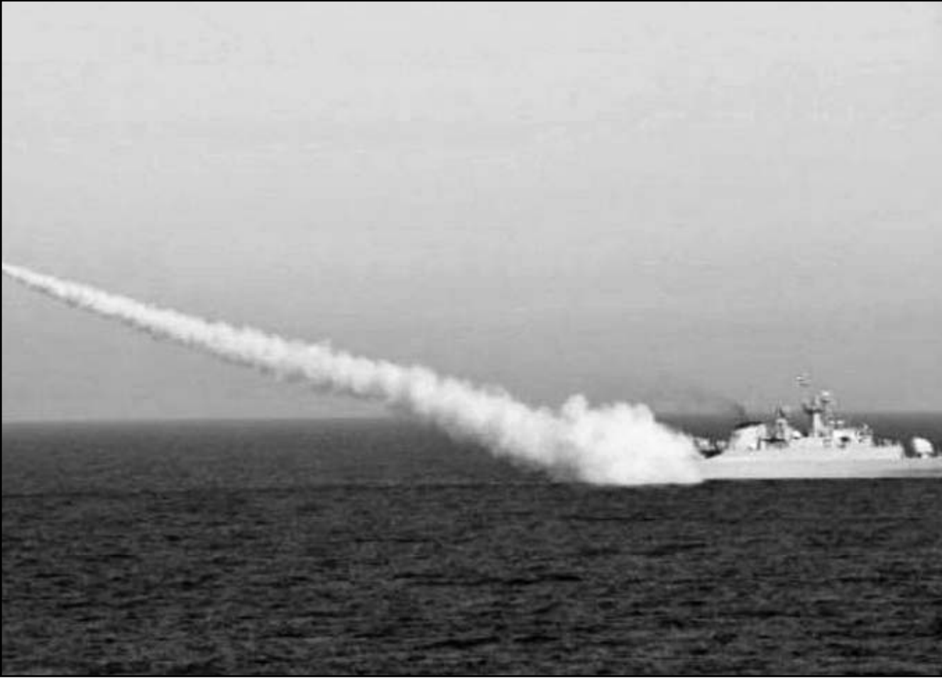
صورة من الإزديف لمناورات البحرية الإيرانية في مضيق هرمز

وحول العقوبات الجديدة التي أعلنتها امس وزارة الخزانة الأمريكية، قال سويداني «إن جميع أشكال الحظر والضغوط ستؤدي إلى مزيد من ازدهار صناعة النفط في البلاد». كانت وزارة الخزانة الأمريكية قد أعلنت مساء الخميس أنها فرضت عقوبات جديدة على شركات إيرانية تستهدف 11 كيانا و أربعة أشخاص لهم علاقة بالبرنامج النووي الإيراني وشبكات انتشار الصواريخ الباليستية التي تديرها وزارة الدفاع و منظمة صناعات الفضاء. وشملت العقوبات سلسلة من البنوك الإيرانية وشركات تعمل واجهة بها في ذلك مؤسسات مقرها في هونغ كونغ والمليزيا لمنع انتهاك العقوبات على تجارة النفط مع إيران. واعتبر المسؤول الإيراني ان «فرض أي شكل من الحظر النفطي سيؤدي إلى تقليص اعتماد الاقتصاد الوطني على العوائد النفطية». الذي أعلن قائد القوة البرية بالجيش الإيراني العميد احمد رضا بورديستان بأنه سيتم تنفيذ مناووه مشتركة للجيش والحرس الثوري في الضواحي الغربية لتهران. وأشار نائب رئيس لجنة الطاقة بمجلس الشورى الإسلامي ناصر سويداني في تصريح لوكالة «مهرو» الإيرانية للانباء نشر الجمعة إلى احتمال إغلاق مضيق هرمز في حالة تفتيش أو توقيف ناقلات النفط الإيرانية في الموانئ النفطية العالمية. وأضاف سويداني تجري في الوقت الحاضر المفاوضات المطلوبة مع مختلف القطاعات لتنفيذ هذه الخطة».