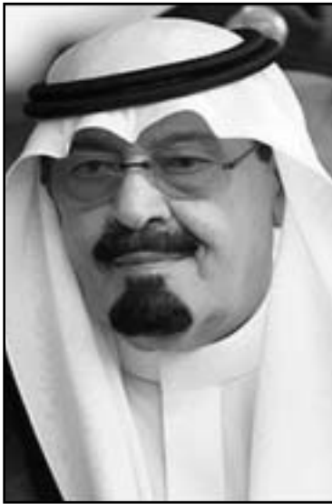
العامل السعودي الملك عبد الله بن عبد العزيز

وتكررت مصادر إسرائيلية أن المسلح الفلسطيني كان ينوي القيام بعملية ويخترق الحدود مع غزة.