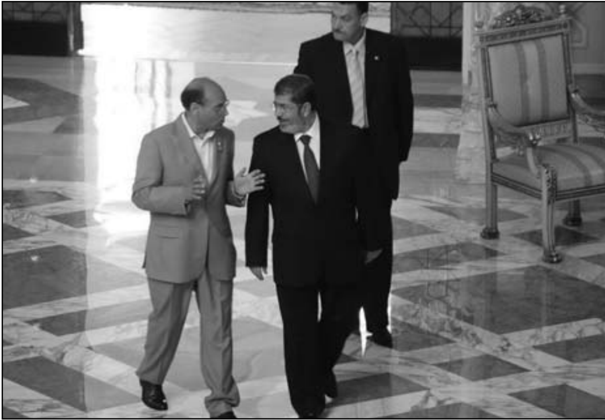
الرئيس محمد مرسي مع الرئيس التونسي المنصف المرزوقي في القصر الجمهوري بالقاهرة الجمعة