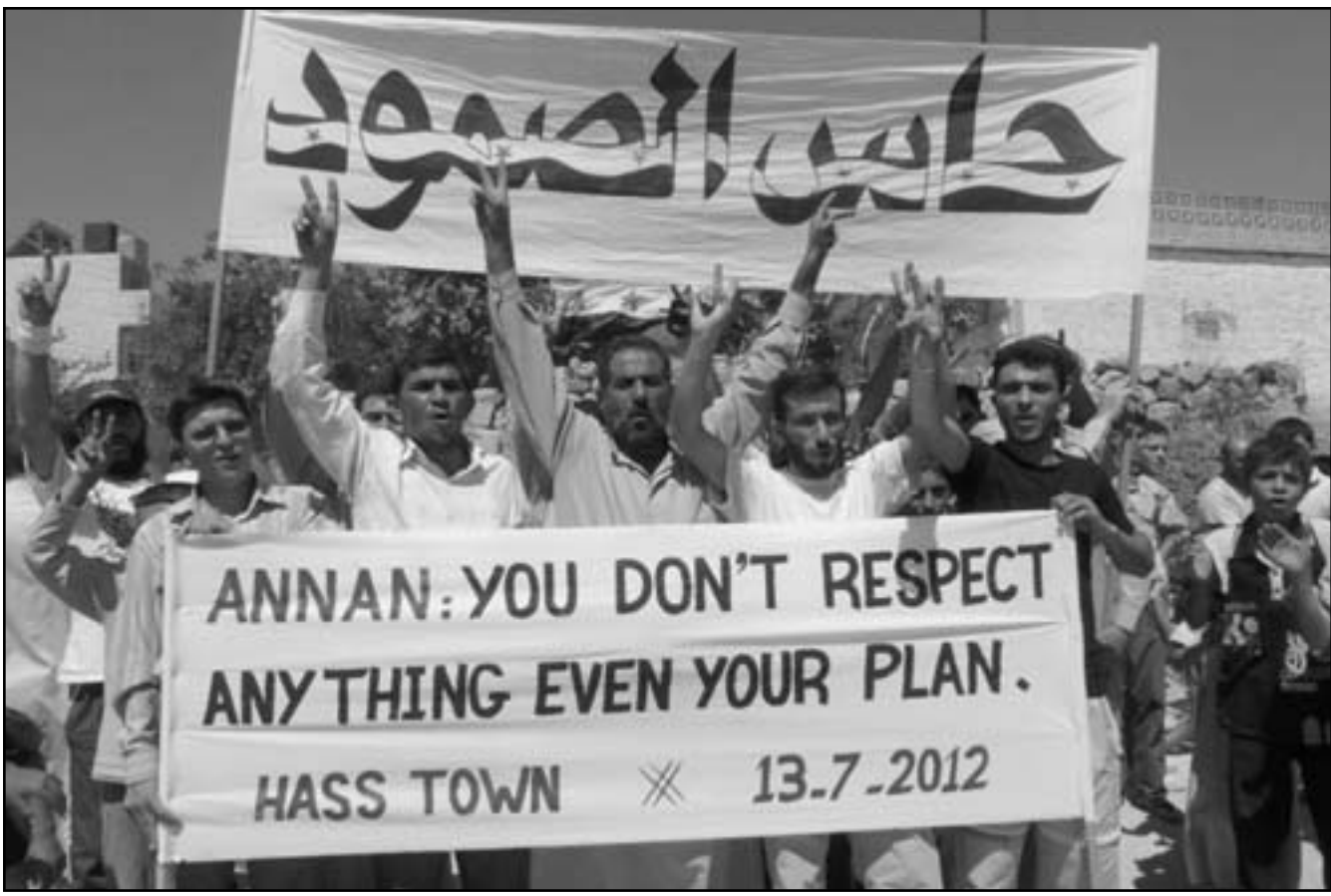
سوريون يتظاهرون ضد النظام في حاس

احرار الشام الذي يقول انه اقوى. ويزعم المقاتل القاعدي هذا انه يدعم التنظيم صديق لانه يهاجم امريكا وبريطانيا، ولا يخيف «احرار الشام» في الجبال. عن القاعدة لكن ما يميز التنظيم ان اعضاءه من المسلمين الجهاديين، وهو واحد من التنظيمات التي تعمل منفصلة عن الجيش السوري الحر، وقال قائد واحد من المجموعه منهم في خان شيخون بين ادب وحماة ان الهدف النهائي هو اقامة الشريعة، وتشير الى ان احرار الشام وتنظيمات اخرى تزاد قوة واصبحت تلعب دورا في الحرب منذ ان اعلن عنها قبل ستة اشهر، ونقلت عن مقاتلين في سراقب قولهم انهم تلقوا تدريبات في العراق والغابستان.