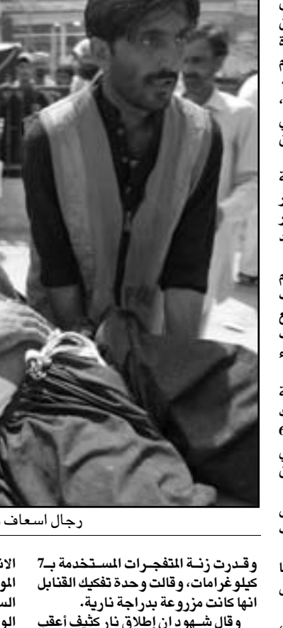
رجال اسعاف ينقلون احد المصابين في انفجار كويتا بباكستان

بازدرء القضاء على خلفية رفض حكومته قرار المحكمة العليا تنفيذ قانون المصالحة الوطنية الذي يقضي بإعادة فتح ملفات فساد تطلت سياسيين بينهم الرئيس الباكستاني أصف علي زرداري. وحكم على جيلاني بالسجن 30 ثانية، ليكون أول رئيس وزراء باكستاني في تاريخ البلاد يمثل أمام المحكمة ويدان بتهمة ازدرء القضاء. كما أعلنت المحكمة العليا الباكستانية بعدما ان جيلاني غير مؤهل للاستمرار في منصبه بسبب الحكم الذي صدر بحقه، وانتخب رئيس وزراء جديد مكانه. من جهة أخرى قتل 6 أشخاص بينهم نائب زعيم حزب عوامي الوطني وأصيب ما لا يقل عن 10 آخرين في انفجار وقع في بازار بمدينة كويتا في جنوب غرب باكستان قبيل زيارة رئيس الوزراء الباكستاني رجا برويز أشرف. وأفادت وسائل إعلام باكستانية الجمعة ان انفجارا وقع في بازار كوشلاك بكويتا صباحا ما أدى إلى مقتل 6 أشخاص بسبب الحكومة لإلغاء المحاكمة بسبب ازدرء القضاء واستبدال ذلك بتشريع جديد. ويذكر في القانون ان انتقاد قرارات المحكمة ببلغة مناسبة لا يعد ازدرء للقضاء. ويشار إلى ان هذا الأمر يأتي بعدما قضت المحكمة العليا في Islamabad في 26 أبريل/نيسان الماضي بإيدان رئيس الوزراء السابق يوسف رضا جيلاني