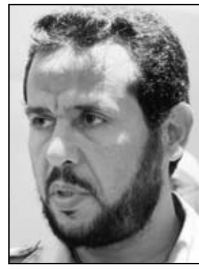
عبد الحكيم بلحاج

السياسي في ليبيا من جديد مهما كان التيار أو القيادة التي تستعمل إلى «أس السلطة في ليبيا» وقال «نحن مطمئنون لما سنسير عليه الأمور في ليبيا. الشعب الليبي لا يزال حديث العهد بالثورة، والتغير الجذري الذي أحدثته. ولن يسمح بان يكون بينهم من يوصفون بإزلام القذافي». وتابع «التوازن الذي نسعى لإيجاده عبر تشكيل للوحدة الوطنية للبين وتحقيق صالح الوطن». وفي رده على سؤال حول ما إذا كانت الأحزاب مع تشكل «التحالف الوطني» ستقبل التعاون مع تحالف القوى الوطنية لتشكيل الحكومة إذا استمر الأخير في تصدده نتائج الانتخابات. أعرب بلحاج عن احترامه و«التحالف الوطني لا طرح فيها» ومنها مسألة الدعم الخارجي «ففي المشاركة والتوافق مع معظم الكيانات التي تشكل التحالف الوطني». وأضاف «نحن نسعى لإيجاد توازن داخل المؤتمر الوطني يحقق مصلحة الوطن العليا ويضمن ويكفل اعتدال الأمور بصورة تنعكس على أداء الحكومة والمؤتمر الوطني في شكله التشريعي حتى لا يكون هناك ميل أو استئثار في إدارة الأمور. وحول تفسيره لعدم تحقيق تيار الإسلام السياسي ليبيبا لاغلبية بشكل واضح حتى الآن مقارنة بالشهد في كل من مصر وتونس حيث تمكن هذا التيار من البداية من تصدر المشهد السياسي عبر تحقيق أغلبية سهلة وضمانة. عزز بلحاج الأمر إلى أن كل المكونات السياسية ذات مرجعية