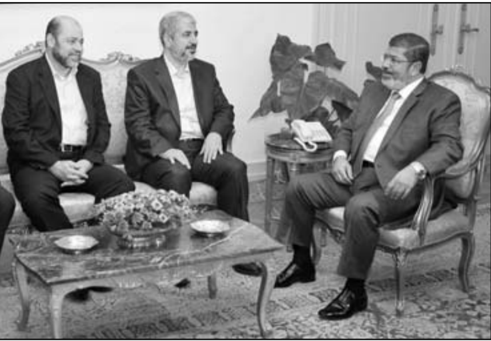
الرئيس المصري محمد مرسي خلال لقائه رئيس المكتب السياسي لحركة حماس خالد مشعل في القاهرة

القاهرة - 1 ف ب: التقى الرئيس المصري محمد مرسي مع الرئيس الفلسطيني محمود عباس في القاهرة الأربعاء، وذلك في إطار سلسلة من اللقاءات التي تعقد في إطار الحوار الوطني للإذاعة الفلسطينية. وقال عزام الأحد رئيس وفد حركة فتح للحوار الوطني للإذاعة الفلسطينية الرسمية، إن مرسي الذي التقى عباس في مسافة واحدة من كل الأطراف الفلسطينية وأنها ستبقى على القضية الفلسطينية وليس مع الحركات. وأضاف الأحد: «كما أكد الرئيس مرسي أن مصر ستبقى، بغض النظر عن الحاكم والسياسي الذي يحكمها، تدعم القضية الفلسطينية باعتبار ذلك مصلحة قومية عليا». وذكر أن مرسي تعهد بملف أكبر جهد ممكن للمضي قدما في ملف المصالحة الفلسطينية. وأشار الأحد إلى أن عباس أكد بدوره خلال اللقاء على ضرورة تراجع حركة حماس عن قرارها الذي اتخذته قبل أسبوعين بتعليق عمل لجنة التفاوض المركزية في قطاع غزة. وأضاف الرئيس عباس أكد أن الهدف الأساسي من حكومة التوافق الوطني الذي تشكلها بموجب تفاهات المصالحة هو إجراء الانتخابات الرئاسية والتشريعية والجلس الوطني، ومرسي تعهد هذا الموقف تماما.