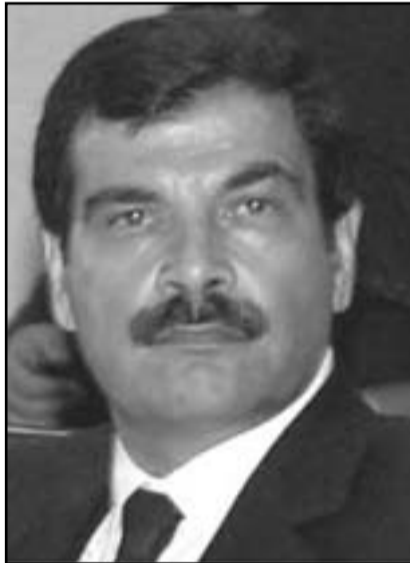
قتل اصف شوكت هز النظام السوري

منذ أربع سنوات واربعة أشهر ومنظمة حزب الله تحاول الشار لتصفية قائدها العسكري عماد مغنية، حتى الان معت من ذلك جهده استخباري كبير قاده الوساد، بالتعاون مع جملة أجهزة استخبارات في العالم، حصاد الاسابيع الاخيرة يدل كم هو حزب الله متمسك للعمل، يكاد يكون بكل ثمن: في بداية النشر القى القبض على شبيط له بعد لعملية في كينيا، وقبل اسبوع - في قبرص. اما بلغاريا فكانت في الهم والقلق في بداية السنة، واهداف اوروبية ايضا وبالظنر الى حقيقة ان حزب الله ادع «ملفات عمليات، عن عشرات الاهداف الاسرائيلية واليهودية في العالم واسرائيل لا يمكنها ان تدافع عن كل مواطن يسافر الى الخارج، فان عملية أمس كانت محتمة تقريبا. يمكن فقط العجب لماذا لم نتخذ من قبل.