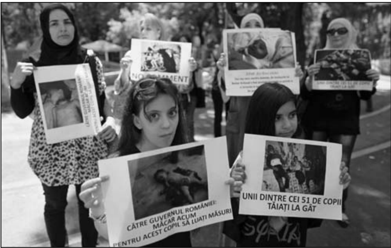
اطفال سوريين في بوخارست يشاركون باحتجاج ضد مجازر النظام

ضربة للنظام وبداية لحماد دم وفي النهاية ترى كل التقارير ان الاعتقال ضربة قوية حيث نقله لوس انجليس تايمز، عن مسؤول قوله ان صف شوكت كان رجلا متفندا وان كان الجيش الحر قادرا على الوصول في دمشق فسبون هذا مؤثرا على كل مسؤول كبير في النظام، ويجمع كل الملحقين على ان النهاية اقتربت ولكنها ستكون محملة بالالام والعنف، ولعل غموض الحادث يلقي بكامله على التحليلات حيث نقلت «الغارديان» عن محلل في الشأن السوري قوله ان الجنرالات ربما كانوا يحضرون لانقلاب او ان عملية امنية قد حدثت، اي تصفية. وتقول «ديلي تلغراف» انه ايا كانت حقيقة ما حدث فهي تؤكّد من مصداقية المعارضة كحركة تمرّد قوية، ويتساءل محللون عن سبيل محل قادة لا يعوضون بالنسبة للنظام، مما يؤشر الى ازيمته ووب نهايته، والسؤال هل سيرتد هجوم الاربعة سبيلما على المقاومة من خلال استفزاز شراسة النظام وقوته قبل موته ما؟ سؤال ستجيب عليه الایام المقبلة.