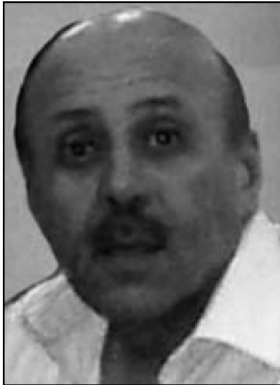
علي ملوك سيحالوف انقاذ الوضع

الخارجية وفي وسائل الاعلام الامريكية، برغم انها من يزالون الى الآن يتملقون الربيع العربي، عندهم اوام