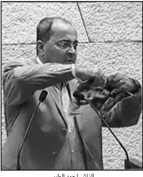
النائب أحمد الطيبي

عنصرية قاشية، وليس غريباً أن تأتي من ممثل حركة كهانا في الكنيست. وقال زحالقة: لقد أكدنا أكثر من مرة أن العنصرية لا تندرج ضمن حرية التعبير، بل هي عمل جنائي يجب أن يعاقب عليه القانون. هكذا قوا بين معظم الدول في العالم، وحتى في القانون الإسرائيلي هناك بنود كثيرة ضد العنصرية والتحريض العنصري، لكنها لا تفعل وتبقى حبر على ورق. وبعث زحالقة رسالة إلى المستشار القضائي للحكومة، يهودا فانشتاين، طالبه فيها بتقديم عضو الكنيست ميخائيل بن آري إلى المحكمة بسبب العمل العنصري والاضطهاد الذي قام به، وقال زحالقة: «إن هذا الموضوع هو امتحان للجهاز القضائي الإسرائيلي، الذي امتنع حتى الآن عن تقديم قيادات دينية وسياسية للحكومة بسبب تصريحاتها وسلوكياتها العنصرية. واعتبر زحالقة تمزيق كتاب الإنجيل جزء من التحريض العنصري المأفوف ضد الجماهير العربية الفلسطينية في البلاد، مشيراً إلى أنه سبق ذلك اعتداء على مقابر ومساجد على الجماهير العربية كلها، وليس على المسيحيين فقط.