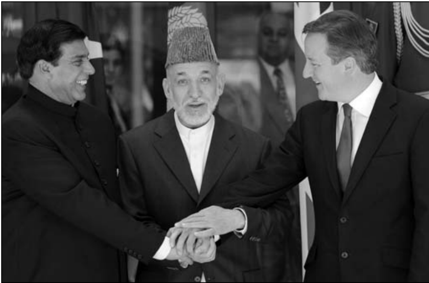
الرئيس الافغاني حامد كرزاي ورئيس الوزراء البريطاني ديفيد كاميرون ونظيره الباكستاني برونيز مشرف خلال القمة الثلاثية في كابول