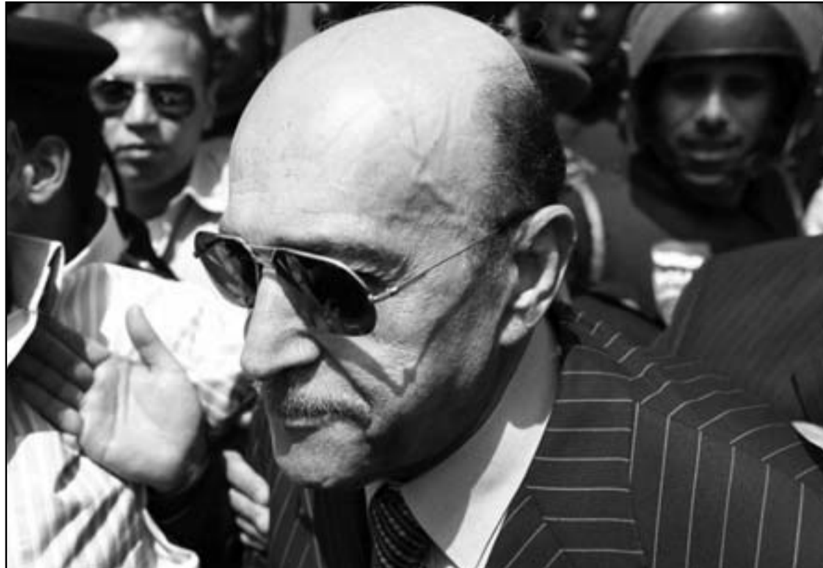
اللواء الراحل عمر سليمان

القاهرة - اف ب: توفي نائب الرئيس المصري السابق اللواء عمر سليمان الذي عرف خصوصاً لترؤسه لفترة طويلة جهاز المخابرات خلال حكم الرئيس السابق حسني مبارك، الخميس في الولايات المتحدة، كما افادت وكالة انباء الشرق الاوسط. وقالت الوكالة ان «نائب الرئيس السابق اللواء عمر سليمان توفي في وقت مبكر الخميس في مستشفى بالولايات المتحدة» عن 77 عاماً.