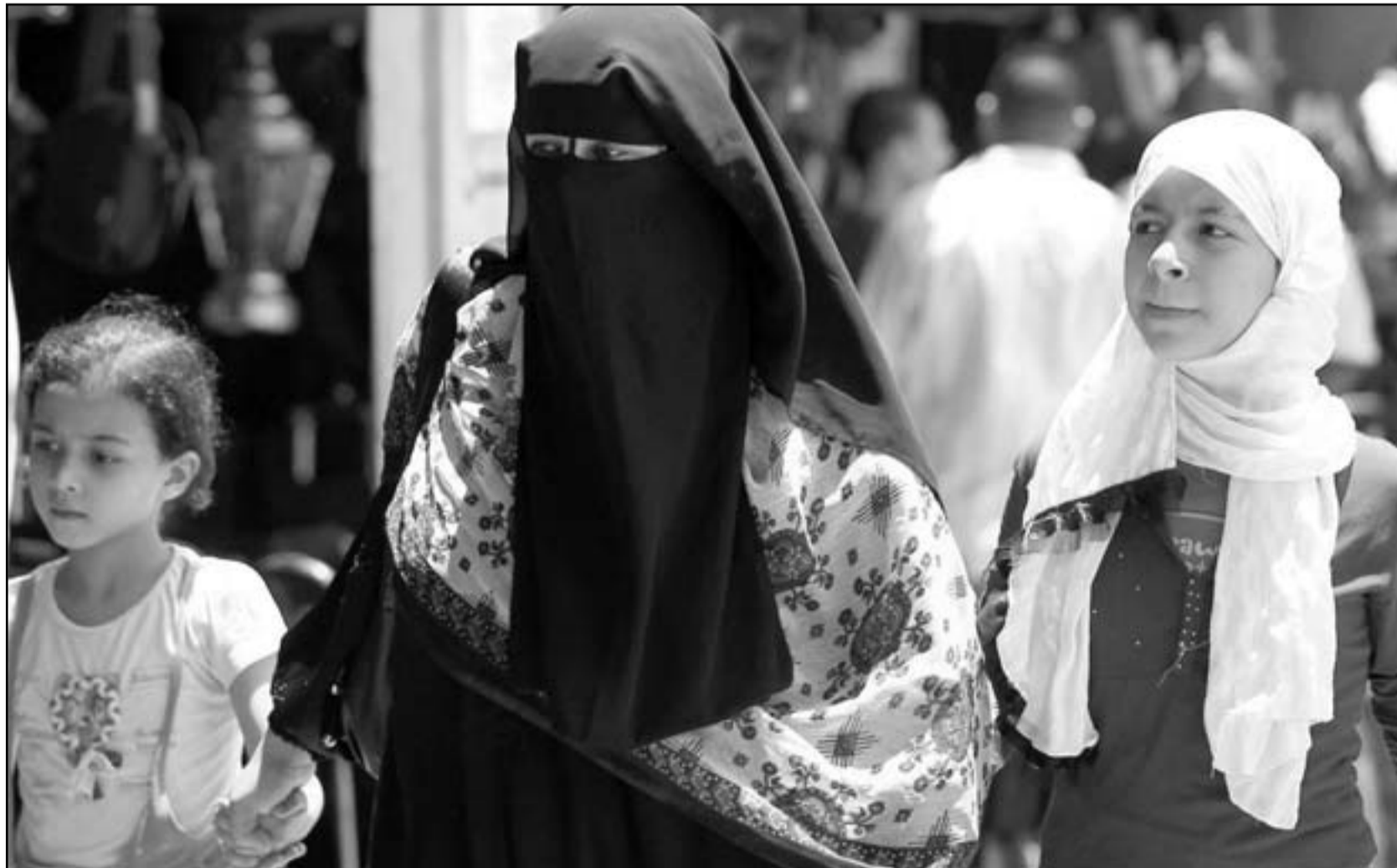
سيدة مصرية مع بناتها في أحد شوارع القاهرة أمس