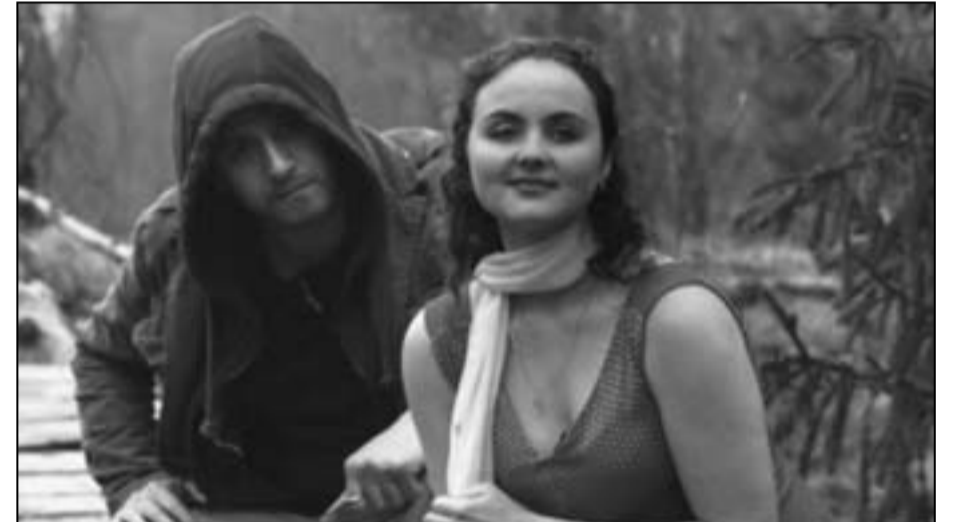
لقطة من الفيلم المصري «طريق العودة»

القاهرة - (د ب أ) - كشف مهرجان الإسكندرية لأفلام دول البحر المتوسط عن عدد من برامج دورته الـ28 التي تقام خلال الفترة من 12 إلى 19 أيلول/سبتمبر القادم والأفلام المشاركة فيها. وقال المهرجان الذي يرأسه كاتب السيناريو والناقد وليد سيف في بيان تلقى وكالة الأنباء الألمانية (د.ب.أ) نسخة منه إنه يستحدث في دورته الجديدة لأول مرة برنامجا بعنوان «سينما خارج المألوف» يتضمن عددا من التجارب السينمائية الجريئة التي حالت شروط المسابقة الدولية دون مشاركتها في التناقص على الجوائز.