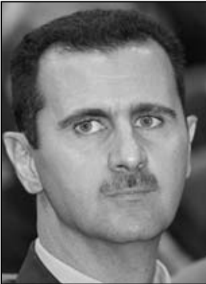
الاسد سيرحل الى روسيا

خبراء جهاز الامن الذين سافروا هذه الليلة الى بورغاس للتحقيق في العملية التي جانب سلطات الامن البلغارية، سيفحصون بقايا العبوة لعلمهم يحدون اوجه شبه عجوبات وضعت اليد عليها في تاندينا وجورجيا، هذا سيساعد في تعزي «المؤامرة» الايرانية» والبنثانية، ولكن حتى لو وجد «المسدس الذخ، حقا فان اسرائيل سجد صعوبة في الرد. إذ رغم المشاعر المتطرفة، رغم الامم والغضب والخوف من عمليات اخرى، محظوران يلغي الامر الملح الامم الهام: في السياق الايراني هذا هو النووي، وفي السياق اللبثاني هذا ان يفحص بالاعقاب عملية فتاكة بل بسبب وسائل قتالية استراتيجي، قد تهدد ليس فقط مجموعة سياح بل تهددنا جميعا، وعلى قرب شديد.