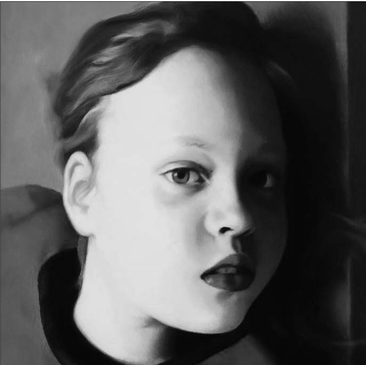
لوحة لجيرهارد ريشتر

استبدال الأنواع الفنية التي عبر وجودها عن خلاصة وعي بصري استطاع الإنسان من خلالها أن يخلق جمالاً مجاوراً وموازيا لجمال الطبيعة بأنواع فنية لا ترى في النظر إلا وسيلة لاستنباط طرق جديدة في التفكير، وكما ارى فإن الخط الجوهري يكمن في عدم الالتفات إلى أنه ليس هناك ما يجمع بين السارين. فالفنون البصرية الجديدة لا تكتمل ما انتهت إليه الفنون التشكيلية وما من مقاربة تاريخية ممكنة بينهما، بمعنى أن الرسم والنحت كانا يشكلان عالماً لا يتقاطع إلا في حدود ضيقة مع العالم الذي شكلته فنون التجهيز والحدث والاداء الجسدي والأرض والفيديو والفاهيم، وحده التصوير الفوتوغرافي يذكرنا بالتحدي الذي عاشه الرسم أيام الاصباغ، أشعر بالأسى من أجل هذا الرسم الذي هو واحد من أقوى رسامي عصرنا، يكفيه لكي يكون موجوداً بقوة في تاريخ الفنون الطبيعية من خلال بول سيزان. ربما لا يميل أحد إلى اعتبار السيادة المطلقة التي تعيشتها الفنون البصرية الجديدة نوعاً من الموضة، الساعات اطراف عديدة في أنجاحها، الخوف من مفهوم الموضة تدعمه سخرية البعض التي غالباً ما تنتقل من وصف الآخرين برضى الوهم، لكن لا يدل استسلام البيئات والفنية كلها من غير استثناء بشكل مطلق للفنون الجديدة على وجود توطؤ فني، ما الذي يعنيه اصرار صالة فنية لها سلطانها على المتاحف مثل غاليري ساجي في لندن على التخصص بعرض الرسوم الأبروتوتكية فقط؟ البعلق أن لدى القيمين