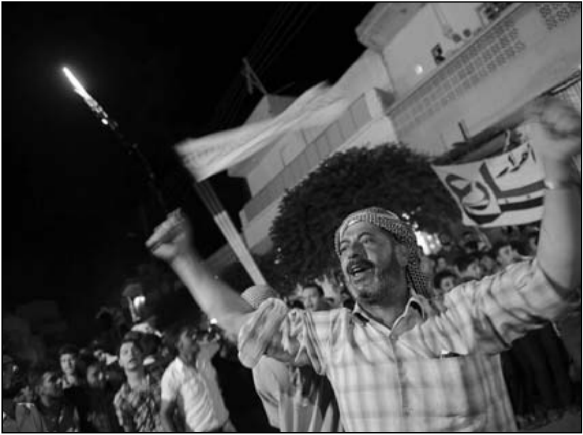
السوريون يريدون اسقاط الاسد ولكنهم يخشون من البديل

محاضر في شؤون الشرق الاوسط في جامعة بار ايلان معايري 8/30/2012