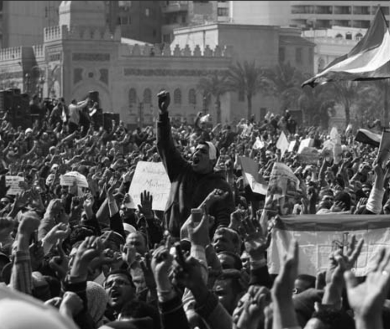
مظاهرات في ميدان التحرير