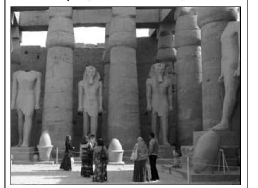
لقطة من مسلسل «المواطن خان»

وأضافت أن الفرصة ما زالت قائمة أمام وزارة الثقافة للالتزام بتعهداتها التي وقعت عليها رسميا منذ عام تقريبا وتؤكد أن عدم تدارك هذا الأمر قد يسبب فضيحة دولية كبرى لصر في وقت لا تحتمل فيه مثل هذا الأمر، في إشارة إلى دور المهرجانات في الجذب السياحي بعد نحو 20 شهرا من الركود في قطاع السياحة منذ الاحتجاجات الشعبية التي انتهت حكم الرئيس السابق حسني مبارك في فبراير شباط 2011. ولم يتسن على الفور الاتصال بمسؤولين في وزارة الثقافة للحصول على تعليق. وتتنافس في المهرجان عشرة أفلام تمثل فرنسا وألمانيا ورومانيا وفرنلندا وبلغاريا وأستونيا وإسبانيا واليونان والبرتغال ومصر التي تشارك بفيلم «بعد الموعظة» ليسري نصر الله. ويشترك الفيلم المصري في المسابقة الرسمية المهرجان كان في مايو أيار وهو يتناول جوانب من الأحداث التي تلت الاعتداء بالخیل والجمال على المتظاهرين في ميدان التحرير بالقاهرة في الثاني من فبراير شباط 2011 والمعروف إعلاميا ب«موقعة الجمل» ويعتبره مراقبون من الأحداث المهمة التي أسهمت في خلع مبارك. وقال المهرجان في وقت سابق إن جميع عروضه تصبها ترجمة للغة العربية ليحقق «أهم الأهداف التي أقيم من أجلها». تعزيز الوعي السينمائي في صعيد مصر بعدما عانى من تجاهل طويل وألقت جميع دور العرض فيه بالرغم من كونه من أهم البقاع الأثرية والحضارية في العالم جمع، حيث تعد مدينة الأقصر التي تقع على بعد نحو 690 كيلومترا جنوبي القاهرة متحفا مفتوحا. والمهرجان الذي يستمر ستة أيام ينظم مسابقة للأفلام القصيرة تضم 40 فيلما من 20 دولة في بريطانيا وفرنسا وألمانيا وإسبانيا وإيطاليا والنمسا والسويد ورومانيا والبرتغال وأيرلندا وروسيا وبولندا والنشيك وهولندا واليونان وسويسرا وأستونيا وبلجيكا ومقدونيا إضافة إلى مصر.