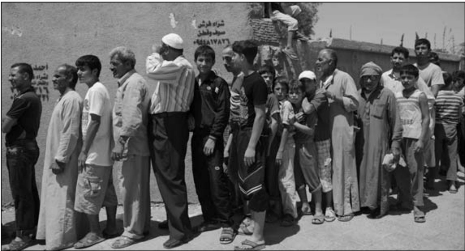
سوريون يصطفون امام مخبز لشراء الخبز في حلب

وقالت «هيومن رايتس ووتش» و«أقل ما يقال إن الهجمات عشوائية ومستهدفة ويشير نمط واعداد الهجمات إلى أن القوات الحكومية تستهدف المدنيين». وأضافت «الهجمات العشوائية المستهدفة وكذلك الهجمات المتعمدة كالأهداف من جرائم الحرب» وتابعت المنظمة التي أودت بحياثا منها إلى حلب أن هجوما يوم 16 أغسطس آب أسفر عن مقتل نحو 60 شخصا وإصابة أكثر من 70. وأجبر نقص المواد الغذائية في حلب الكثير من المخازين على إغلاق أبوابها مما يؤدي إلى أضرار في الأحياء السكنية مما أدى إلى ارتفاع