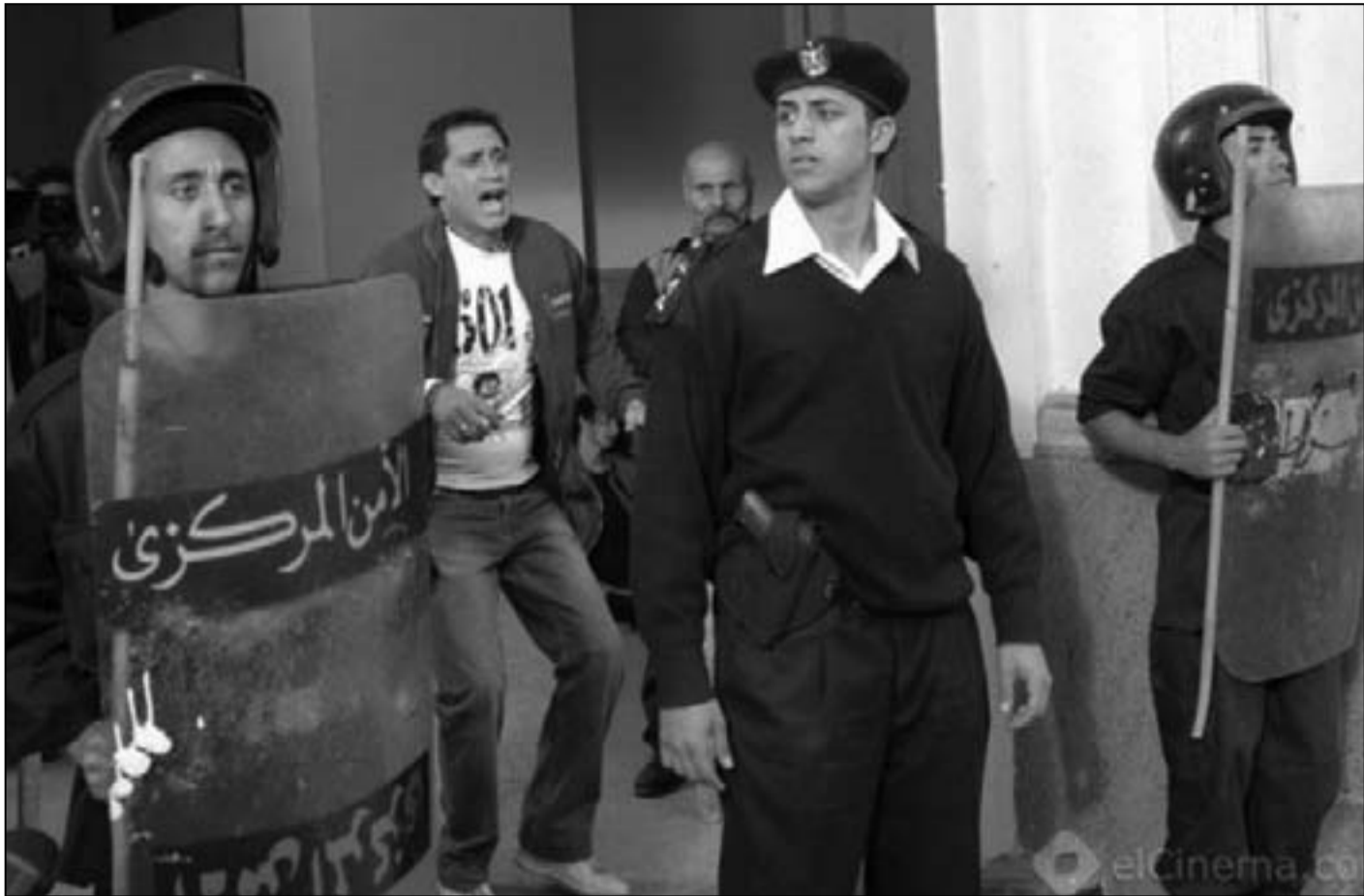
لقطة من فيلم «حظ سعيد»

باحتجته كمطلب رئيسي لنجاح الثورة، فبينما كان مبارك يتحدث عبر شاشة التلفزيون عن ايمانه بحق الشعب بعد ان ضاق علي الخناق كانت الشرطة تزاد بطشا وتكتليا بكل من يقع تحت يدها من العناصر المناهضة، وقد تكررت هذه المشاهد بما يشبه التأكيد على ان الكذب كان عنوان النظام حتى آخر لحظة، وأن نجاح اي محاولة من محاولات الاحتواء من جانب مبارك كانت ستؤدي الى مزيد من الكوارث. وهذا المعنى الدرامي السياسي يثبت وقوف المخرج والكاتب على الاختيار الوحيد الاضرب وهو المصي قوما نحو استكمال الثورة وهذا بالطبع ما حدث، يلجج الكاتب والسينارست توفيق الي محاولات الاستقطاب التي جرت من قبل معظم التيارات السياسية لتجديد سعيد، لاسيما جماعة الاخوان المسلمين لدعم مشروعها وتأكيد حضورها، بيد ان الوقوف الي جانب الجماهير كان هو الملاذ الامن له بعيدا عن اي توجهات او تشوهات