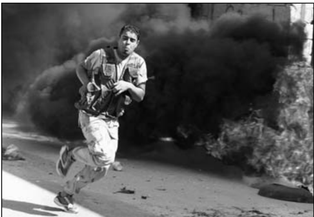
سوريا ستصبح أفغانستان جديدة وستشكل تهديدا لجلارتها

حربا أهلية وثبوت طابع النظام السوري القاتل لمن كان ما يزال يحتاج الى برهان، ولم تستع اية كلمة اعتذار من البيت الأبيض أو أي تفسير للسياسة المخطئة، انتقل وقاص ادارة اوباما الآن الى الجانب الثاني تماما، فقد أصبح الاسد شريرا وينبغي تأييد المتمردين السنين عليه بصورايخ ارض - جو مثلا أو