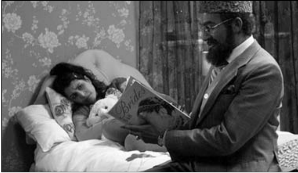
لقطة من مسلسل «المواطن خان»

■ لندن - (يو بي اي) اتهم منتقدون تلفزيونية الإذاعة البريطانية (بي بي سي) بإهانة المسلمين والترويج بصورة نمطية عن الآسيويين، بسبب بثه مسلسلاً هزلياً عن زعيم جالية مسلم بعنوان «المواطن خان». وقالت صحفية «ديلي ميل» اليوم الأربعاء إن إدارة (بي بي سي) تلقت أكثر من 200 شكوى بعد بث الحلقة الأولى من المسلسل تتهمه ب «السخرية من الإسلام وعدم احترام القرآن»، لعرضه مشهداً تقوم فيه ابنة خان بارتداء الحجاب وهي تضع كمية كبيرة من مساحيق التجميل على وجهها والنظارة بأنها تقرّ القرآن، حين تدخل والدها إلى المنزل. وأضافت أن أحد المشاهدين كتب في شكواه بأن المسلسل الكوميدي «تمتيط رهيب وجاهل ومرؤع للمسلمين الآسيويين»، في حين كتب مشكك آخر أن المسلسل «مخيب