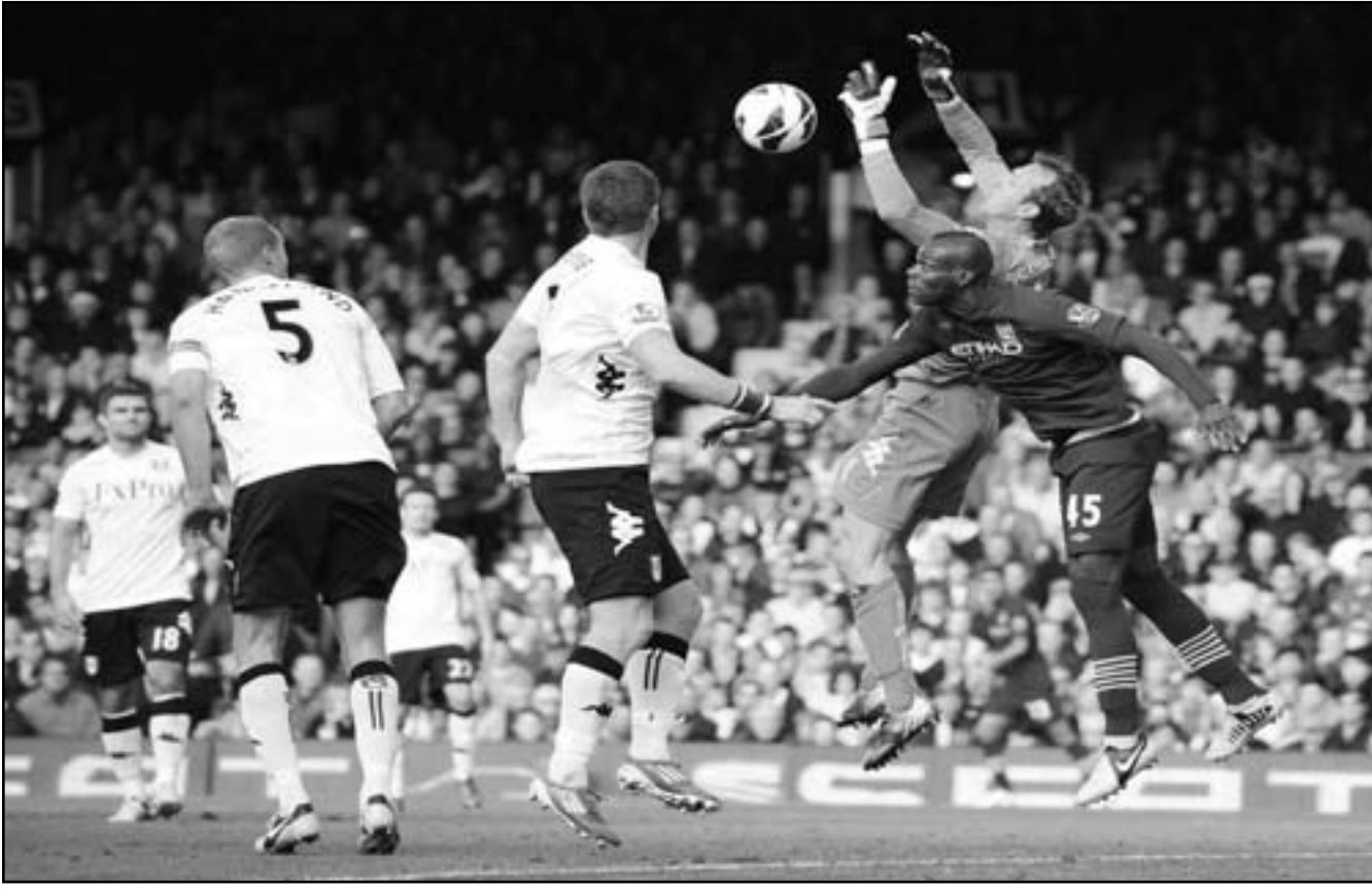
ماريو باتولي نجم مانشستر سيتي (يمين) قفز في الهواء في صراع على الكرة

المجموعة الثانية الأخرى غدا. أما في الجمعة الأولى ، يلتقي دينامو كييف الأوكراني مع دينامو زغرب الكرواتي وبورسو البرتغالي مع باريس سان جيرمان الفرنسي غدا الأربعاء.