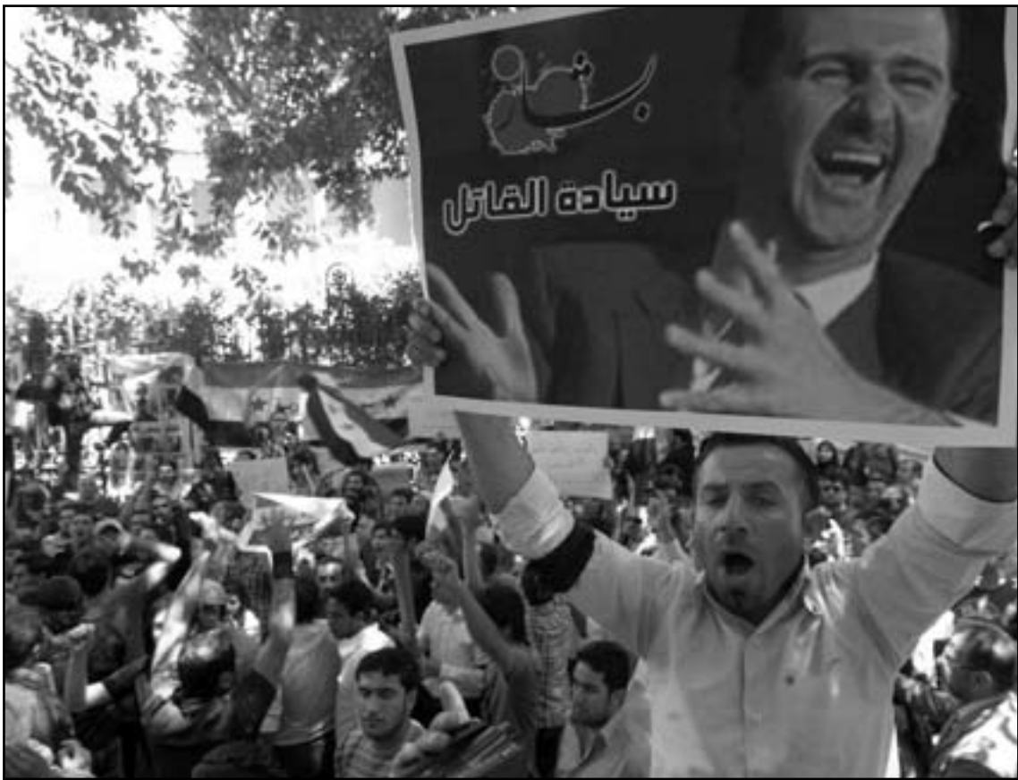
امريكا اصيحت اقل حماسة في تأييد الثورات العربية

استنتاج يتناسب مع اجمل الميزان هو ان نهج اوباما حقق نتائج متواضعة، باستثناء، وللمفارقة، مجال واحد، في بداية عهد حكمه لم يتقدم عليه بشكل بارز، ولكن يعتبر موضوعا يندمج به سياسة الامنية الدولية المنصب - التحول الديمقراطي. في هذا ايضا، كان الانجاز حقيقيا فقط بالنسبة للشرط المسبق اللازم للتحول الديمقراطي - وهو - اضعاف او ابعاد أنظمة الحكم المطلق ولكن يمكن ان نغزو هذا الانجاز فقط بمقدور نشاطات اولى اوباما. ففي بداية العام 2012 لم تتوفر أدلة كثيرة على ان سقوط الحكام المطلقين بالفعل خفف تشنوء ثقافات ومنظمات من سياسية ديمقراطية. الفرضية خلف رد الفعل التقاضي للثورات التي توسس، في مصر، في ليبيا، وفي اليمن والانتفاضات ضد النظام السوري، والمخلفة جدا بتعبير «الربيع العربي» هي ان مثل هذه الثورات يمكن استعمل بالفعل. ولكن التطورات منذئذ تشير الى امكانية الاكثر احتمالاً، في ان تكون القوى الاسلامية في الراجح الاكبر من الوضع الناشئ، وحتى لو حظيت النزع الاسلاميه بتأييد اوسع من ذلك الذي حظي به والديمقراطيون، والذين تسمح سوطهم لهم بالارتباط، فان النظام الجديد من شأنه، في نهاية المطاف الا يكون أكثر ليبرالية من النظام القديم، بل وبخاصة بقدر أقل من سلفه الاقليات والنساء. باختصاص، بعد منظره العطف الالية نحو موجه غير مسبوقة في