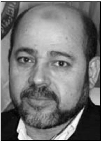
موسى ابو مرزوق