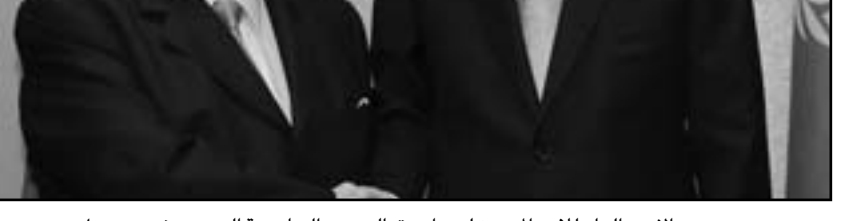
الامين العام للأمم المتحدة لدى استقباله وزير الخارجية السوري في نيويورك

الامين العام للأمم المتحدة لدى استقباله وزير الخارجية السوري في نيويورك. وكان المعلم ان لدى سورية «مخزونا استراتيجيا من الفخ والمواد الغذائية والدواء يكفي لعدة اشهر». وكانت منظمة الامم المتحدة للاغذية والزراعة (الفاو) اعلنت مطلع آب (اغسطس) الماضي ان ثلاثة ملايين سوري بحاجة عاجلة للغذاء والمساعدة في مجالات الحاصلات الزراعية وليس له ولبنان تلبية هذه الحاجات سيحتاج في الاشهر المقبلة الى ملايين الدولارات.