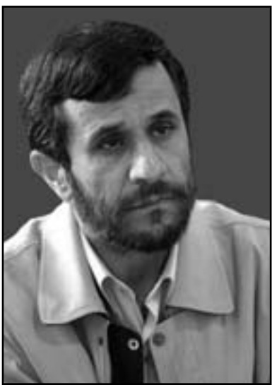
الرئيس الإيراني أحمدى نجاد

مجموعة I+5، قال ان إيران قدمت مقترحاتها وتامل باعتماد خطوات إيجابية بخصوص هذا الملف، وتضم مجموعة I+5 الدول الخمس دائمة العضوية في مجلس الأمن وهي بريطانيا والصين وروسيا وفرنسا والولايات المتحدة إضافة إلى ألمانيا، واستطرد أن الأمريكيين هم الطرف الأساسي الآخر في المفاوضات النووية والتجربة أثبتت بان الأمريكيين لا يتخذون قرارات مهمة في أيام الانتخابات. وقال أحمدى بتعلق بالآزمة السورية، أوضح الرئيس الإيراني بان البعض يتصور بان تسوية النزاع في سورية يتحقق بدعم احد الأطراف ضد الطرف الآخر إلا انه اسوأ الحلول لان تغلب احد الأطراف على الطرف الآخر بالحرب لا يؤدي إلى نهاية النزاع بل بداية لرحلة طويلة من اندعام الأمن نظراً للتركيبة القبلية للنظام الاجتماعي في سورية. واكد ان تسوية الازمة في سورية تتحقق من خلال التفاهم الوطني والاتفاق لاجراء انتخابات حرة ونزيهة ليقرر الشعب السوري بحرية مستقبله السياسي واحترام هذا القرار من قبل الجميع. وشارك في تصريحاته في التصريحات التي أوردتها وكالة الأنباء الإيرانية «إرنا» مساء الأحد ان كانت الدول الغربية تحصر على اقرار الأمن، فإنه يتعين وفي خطوة أولى وصحيحة ان تنسحب من المنطقة. وحول مفاوضات إيران النووية مع