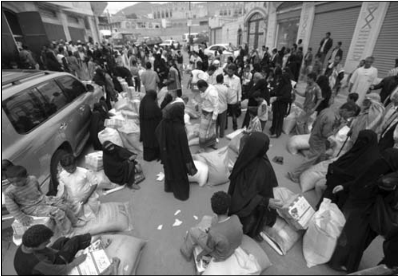
صنعا من اندرو هاموند:

وقال برنامج الأغذية العالمي إن نصف اليمنيين تقريباً يعانون من الجوع في الوقت الذي يضعف فيه عدم الاستقرار السياسي ارتفاعا عالميا في أسعار الغذاء والوقود مما يجعل اليمن يعاني من ثالث أعلى معدل لسوء التغذية بين الأطفال في العالم. ويشهد اليمن اضطرابات منذ ثورة العام الماضي ضد حكم الرئيس علي عبد الله صالح الذي استمر 33 عاما عندما انهارت سيطرة الدولة الضعيفة بالفعل على المناطق النائية مع انقسام الجيش إلى فريقين أحدهما مؤيد لصالح والآخر مناضل له واستيلاء متشددي القاعدة على بعض المناطق. وقال المتحدث باسم برنامج الأغذية العالمي باري لرويتز إن اليمن الذي يضطر إلى استيراد معظم احتياجاته الغذائية بسبب ندرة الارض الصالحة للزراعة يعاني أيضا من ارتفاع أسعار الغذاء والوقود العالمية. وقال كيم «لا يستطيع خمسة ملايين شخص أو 22 في المئة من السكان توفير الطعام لأنفسهم أو شراء ما يكفي لإطعام أنفسهم...معظم هؤلاء من العمال الذين لا يملكون أراضي ولذلك لا يزرعون طعامهم ولا يستطيعون شراءه أيضا بسبب ارتفاع أسعار الغذاء».