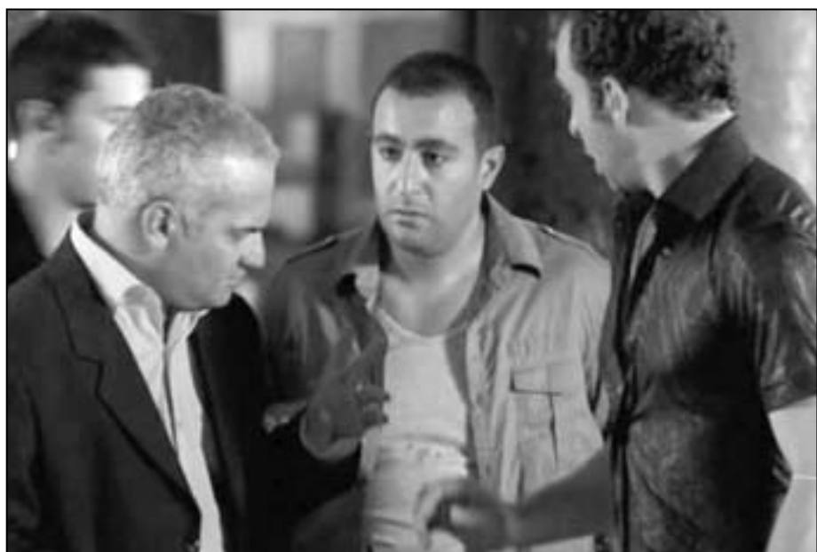
احمد السقا في لقطة من فيلم «الدبلر»