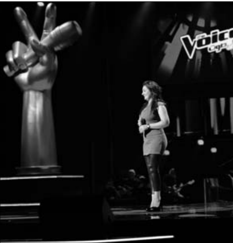
أميمة أمسعي (القدس العربي)