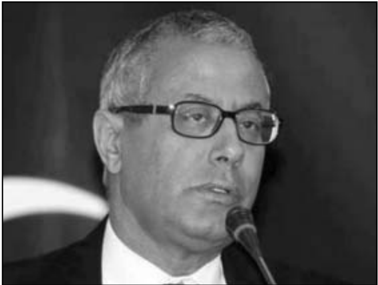
علي زيدان رئيس الوزراء الليبي المنتخب