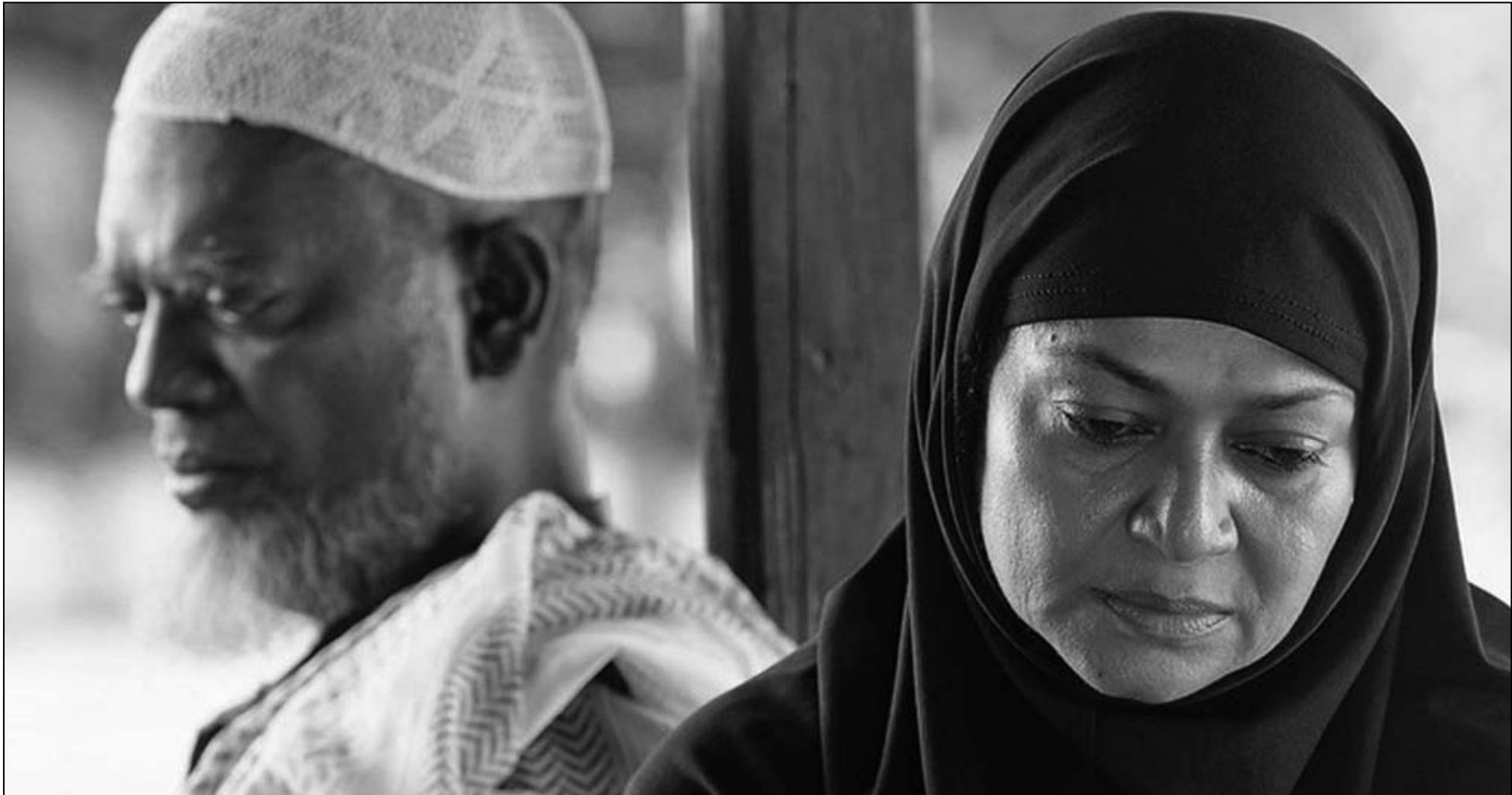
لقطة من فيلم «أبو ابن آدم»