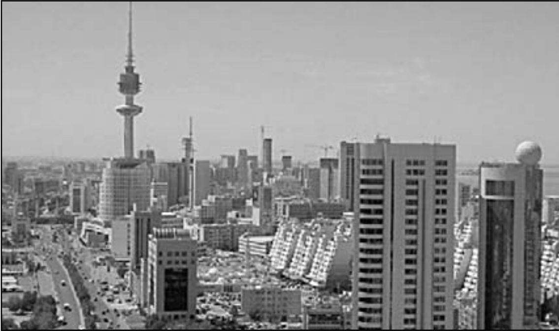
أبراج ادارية في وسط الكويت تبحث عن مستأجرين

الأسبوع الماضي، وهو ما جعل أوساطا اقتصادية تخوف من تراجع الحكومة عن تنفيذ إصلاحاتها الاقتصادية الموعود. وأبدت بورسلي تخوفا من أن تتراجع أولوية إنقاذ القطاع العقاري وإصلاح الاقتصاد تدريجيا مع الزمن لاسيما مع انشغال المؤسسات المسؤولة عن الإصلاح بالعديد من الملفات الأخرى المهمة.