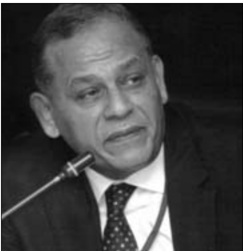
أنور عصمت السادات

دليل ويكفل لهم حماية قانونية تامة طالما يتم عملهم في إطار مصارحة الشعب بحقيقة ما يحدث من حوله.