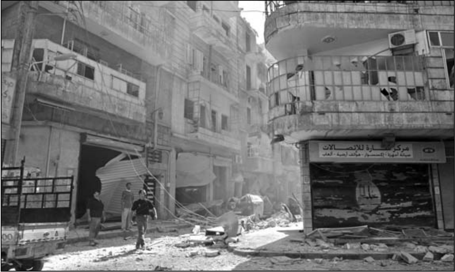
سوري يتفقد آثار الدمار بعد قصف عنيف تعرضت له مدينة حلب

مجالبيها الجويين امام الطائرات المدنية التابعة للبلد الاخر. ولا تقيم تركيا وارمينيا علاقات دبلوماسية بسبب خلافهما حول عمليات ترحيل الارمن والمجازر بحقهم في ظل السلطنة العثمانية عام 1915 حيث ترفض انقرة اعتبارها «ابادة».