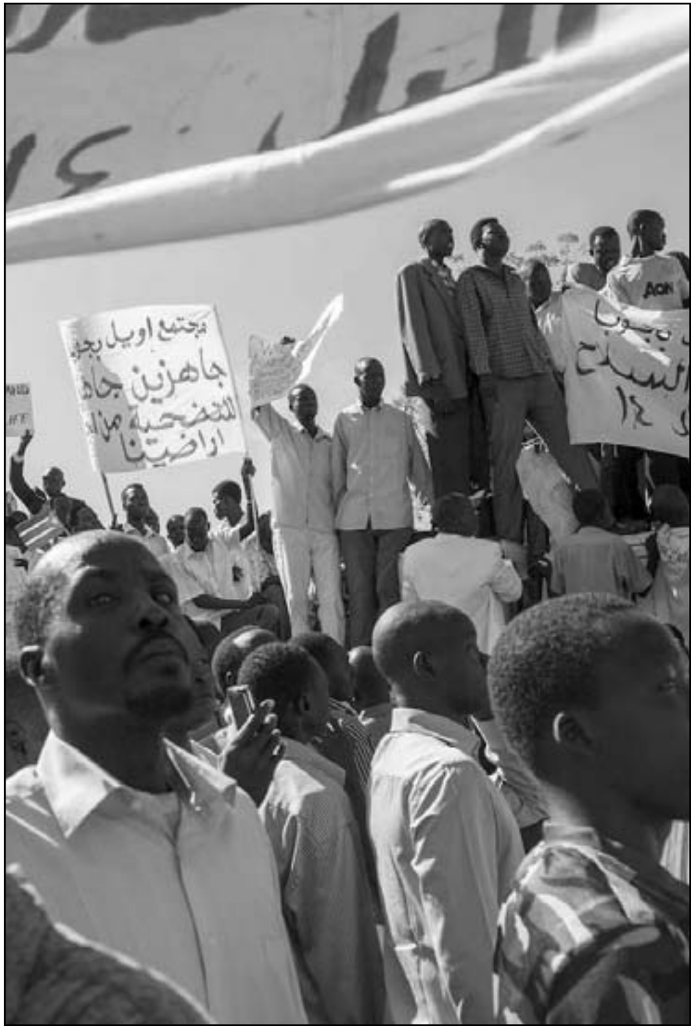
سودانيون في الجنوب يتظاهرون ضد الاتفاق مع الخرطوم

وأشار التقرير إلى إحصائيات وزارة الصحة والسكان المصرية التي كشفت عن أن نسبة تعاطي المخدرات في القاهرة تصل إلى 7٪ من عدد سكانها (حوالي 18 مليون