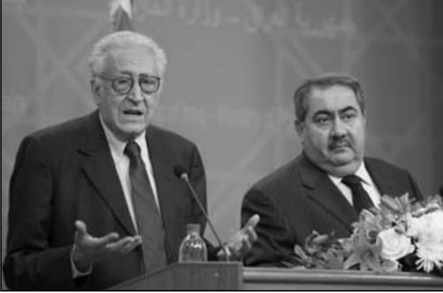
وزير الخارجية العراقي في مؤتمر صحفي مع المبعوث الاممي في بغداد

الثلاثاء النظام السوري الى تطبيق وقف احادي لاطلاق النار، ردت عليه دمشق بطلب ايفاء مبعوثين الى الدول التي تدعم «المجموعات المسلحة، والزلمها بتوظيف نفوذها أمامه لحدود المنطقة.