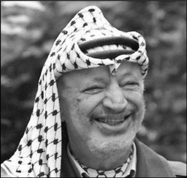
الرئيس الفلسطيني الراحل ياسر عرفات

ولفتت أيضا إلى أن المبني الذين تحفظ فيه الأسلحة أو الذي يستخدم كعقر عسكري لطوارئ، يمثل هدأ عسكريا مسموحا به، مشيرة إلى أن الجيش الإسرائيلي يتحمل مسؤولية تحذير السكان المدنيين قبل الهجوم، وتعددت التقييمات التي تقول، نقلا عن ضابط رفيع المستوى في شعبة الاستخبارات العسكرية (أمان) الذي قال ان استراتيجية كل من إسرائيل وحزب الله لتقليلان في بعض النقاط الرئيسية، لافتا إلى أنه في النهاية توصل الجانبان إلى قاعة في نهاية حرب لبنان الثانية بأنه من الأفضل، في الوقت الحاضر، تحاشي جولة جديدة من الحرب على أساس أن الثمن سيكون مرتفعا جدًا، على حد تعبيره.