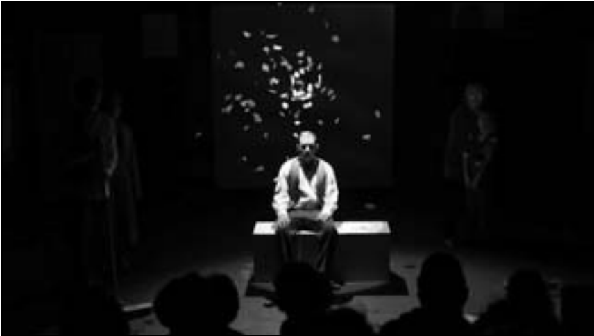
مشهد من مسرحية «استراحة على متن الريح»

■ عمان - رويترز: يقدم الكاتب المسرحي نديم صوالحة مسرحية «استراحة على متن الريح» على مسرح مركز الحسين الثقافي بالعاصمة الأردنية غمان بعد النجاح الكبير الذي حققه العرض المسرحي في لندن.