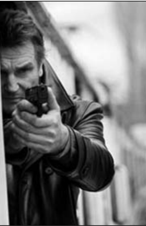
لقطة من فيلم «اختطاف»

■ لوس انجليس - (رويترز) - حافظ الجزء الثاني من فيلم (اختطاف) على صدارة إيرادات السينما في امريكا الشمالية للاسبوع الثاني على التوالي محققا 22.5 مليون دولار.