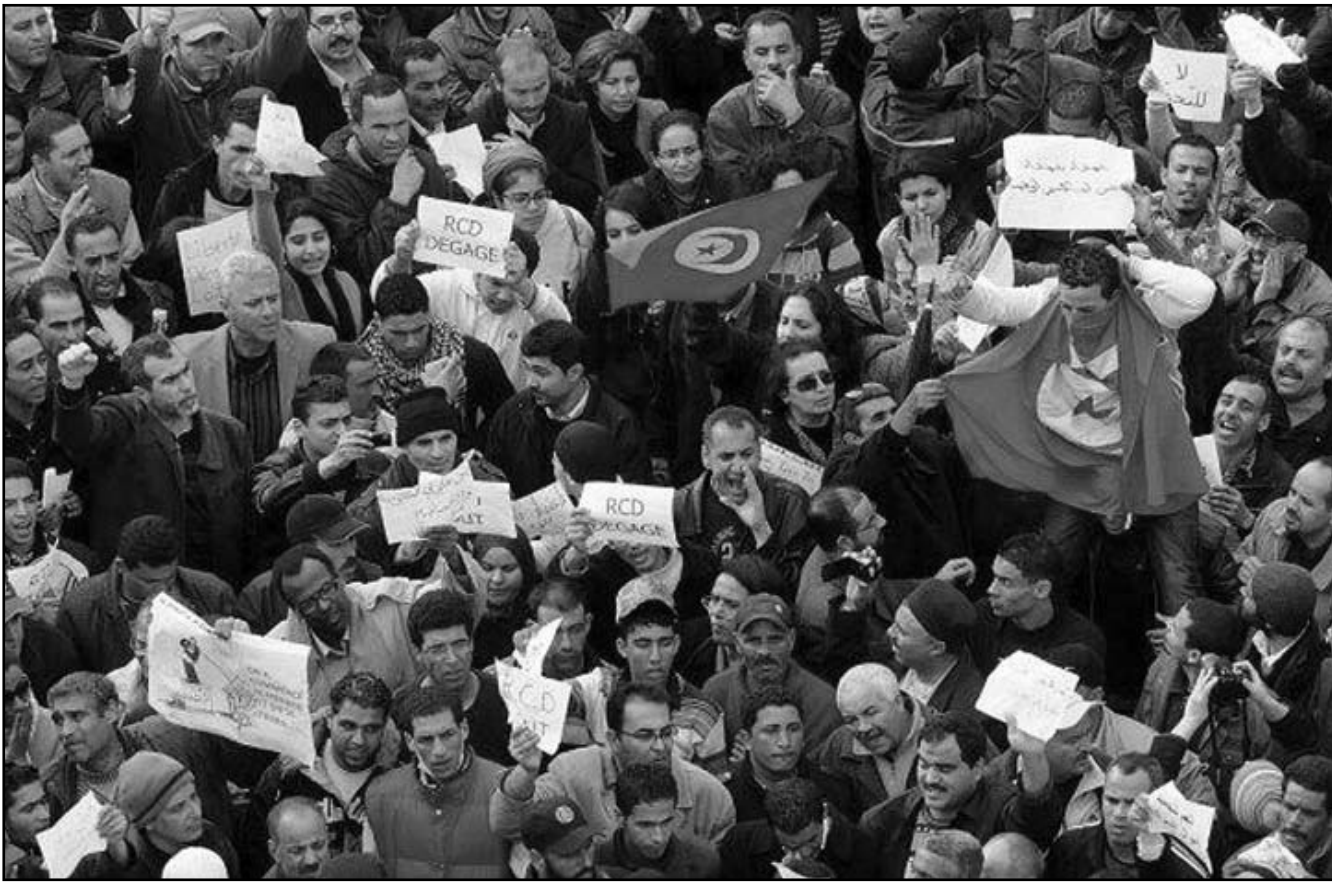
جانب من مسيرة اثناء الثورة التونسية اولى الثورات العربية

والدين في التاريخ السياسي المدوّن، بثلاثة أنماط رئيسية هي: نمط الدولة المتماهية مع الدين، الدولة الثيوقراطية (الدينية) القائم حكمها على ادّعاء تطبيق أحكامه، والدولة القائمة شرعيتها -وأحياناً بالتجاور مع شرعيات الحكم وسياساته، ثم الدولة الحادية تجاه الدين/ الأديان، الدولة الإمبراطورية من النمط الآسيوي القديم (الصينية واليابانية والإيرانية القديمة) وهي الدولة العلمانية الحديثة القائمة على شرعيات مدنية بشرية، لا مكان فيها لأي نوع من أنواع استغلال الدين في السياسة.