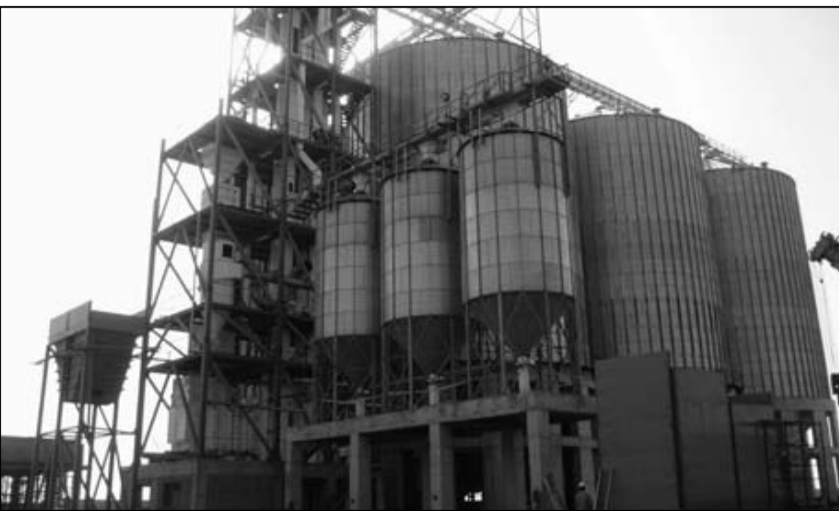
مجمع صوامع حكومي لتخزين القمح بمصر

في محاصيل الحبوب وتوفير فرص عمل. وأكد الوزير على أن هذا المشروع القومي سيكون له دور كبير في المساهمة في تأمين الغذاء بمصر... الفكرة أن نزرع فيه ما نريده حسب رؤيتنا.. وقال عبد المؤمن أن الوزارة ستعيد قريباً طرح 100 ألف فدان للاستثمار الزراعي في مشروع توشكي في جنوب مصر وذلك بعد انقضاء الطرح الأول دون تلقي أي طلبات.