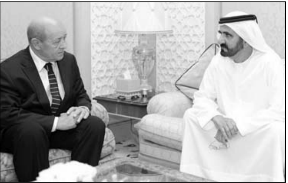
الشيخ محمد بن راشد آل مكتوم خلال لقائه وزير الدفاع الفرنسي جان إيف لودريان في دبي

ووزير لودريان الاحد القاعدة الفرنسية في ابوظبي وقاعدة الظفرة الجوية الاماراتية، ومن المقرر ان يزور