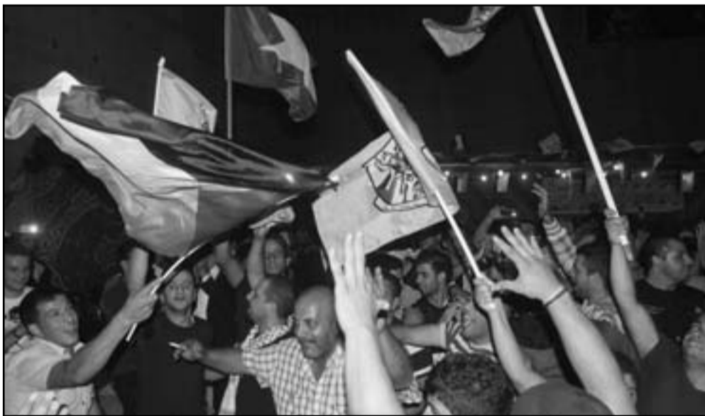
فتح تحتفل بفوزها في بيت لحم