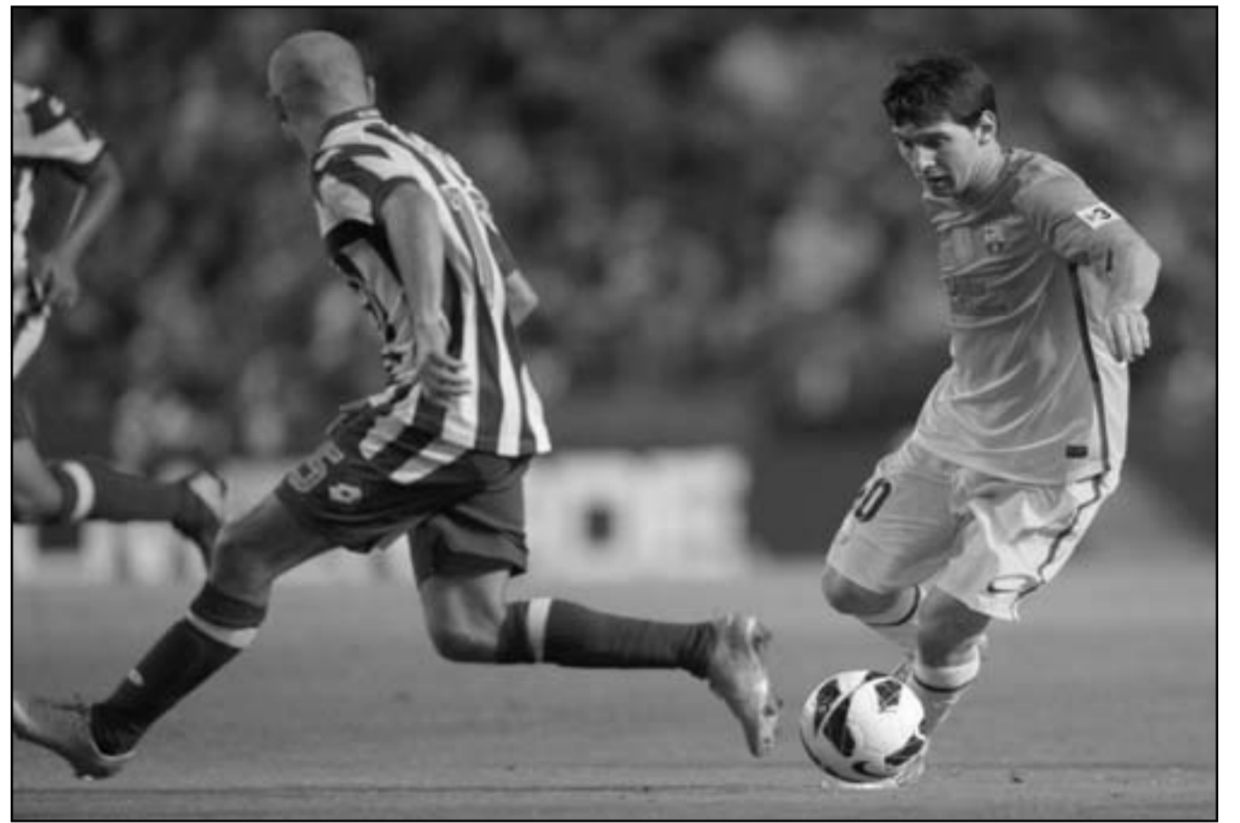
ليونيل ميسي نجم برشلونة (يمين) يحاول الانفراد بالكرة

■ مدريد - د ب أ: تالقت النجم الأرجنتيني ليونيل ميسي وأحرز ثلاثة أهداف «هاتريك» ليقود فريقه برشلونة نحو فوز عسير على ضيفه دييورتيفو لاكورونيا 4/5 في الجولة الثامنة من بطولة الدوري الإسباني، ليعاود الفريق انفراداً بالصدارة مؤقتاً. وفطر برشلونة في انتصار عريض بعد تقدمه 3/0 صفر في البداية، قبل أن تتأزم الأمور مع اهتزاز شبكته أكثر من مرة ثم طرده مدافعه الأرجنتيني خافيير ماسكيانو، إلا أن صاحب الضيافة لم يتمكن من التعادل قط واكتفى في النهاية بإلقاء المشرف. وتخلص برشلونة مؤقتاً من شراكة أتلتيكو مدريد في الصدارة، قبل أن يواجه فريق العاصمة ضيفه ريال سوسيداد الأحد في نفس الجولة، كما أعاد الفارق مع غريمه التاريخي ريال مدريد إلى ثماني نقاط بعد أن كان ريال مدريد قد فاز على سلتا فيجو بهدفين فقط. وتجسد رصيده دييورتيفو لاكورونيا، الذي نال خسارته الرابعة على التوالي، عند ست نقاط في المركز الثامن عشر، علماً بأنه لم يحقق أي انتصار منذ الجولة الأولى.