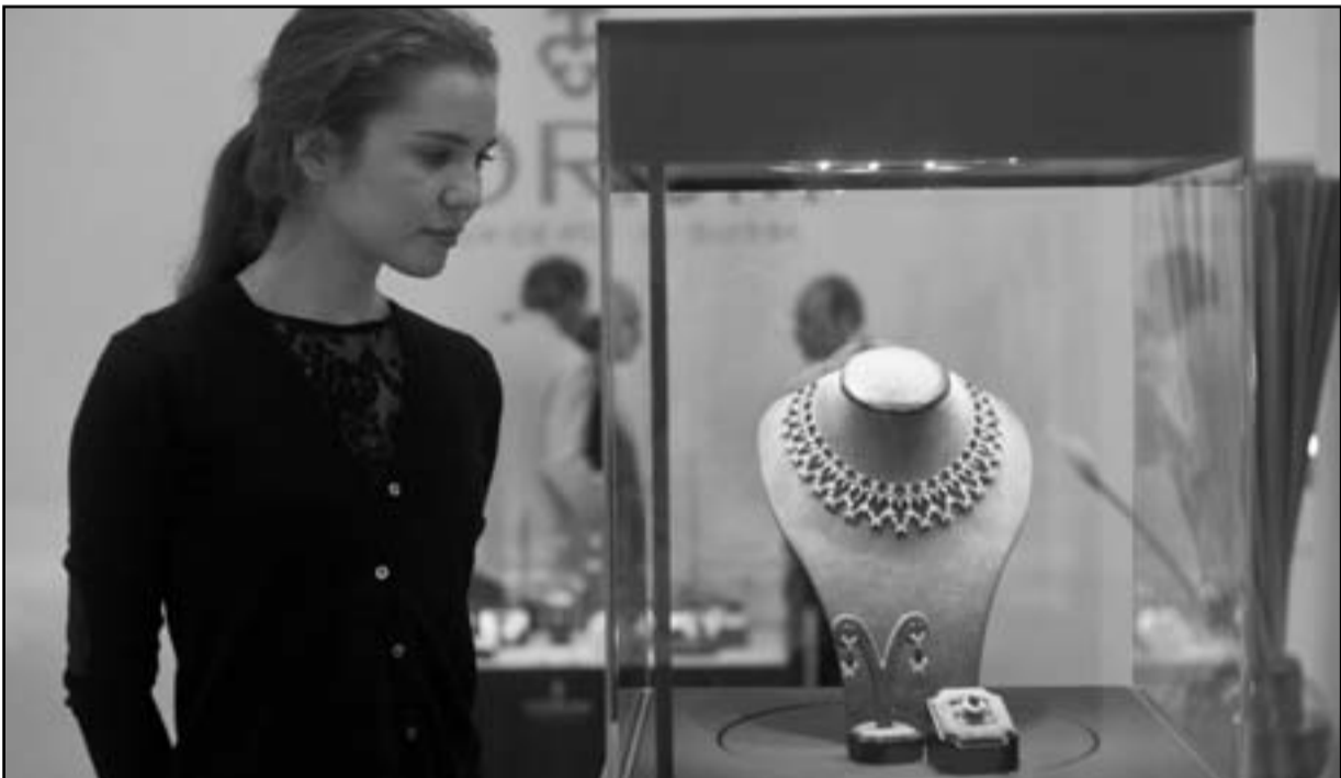
متسوقة بمعرض الجواهر في المنامة

وبعد سنتين من التقشف عادت أيرلندا إلى تسجيل نمو «هش»، بحسب صندوق النقد الدولي، وشهدت نسبة بطالة تقارب 15 بالمئة من عد اليد العاملة الفعلية في البلاد. ولا تزال اليونان والبرتغال، الدولتان الاخريان في منطقة اليورو اللتان حصلتا على مساعدة دولية، تشهدان وفي تقرير نشر في بداية تشرين الاول/أكتوبر أكد