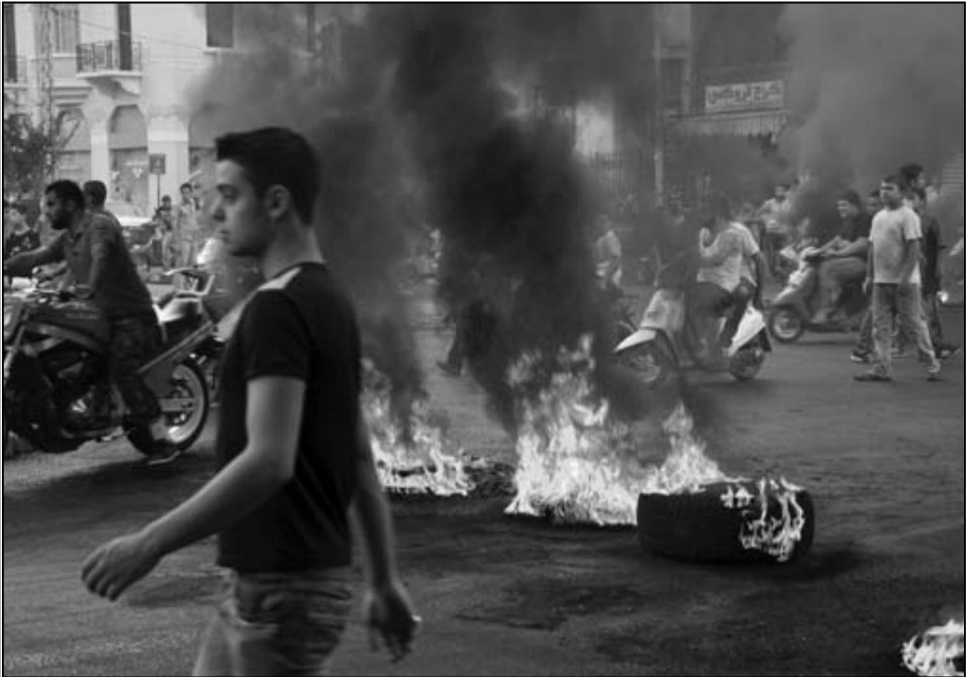
لبنانيون غاضبون يحرقون اطارات في بيروت خلال تشييع جثمان وسام الحسن