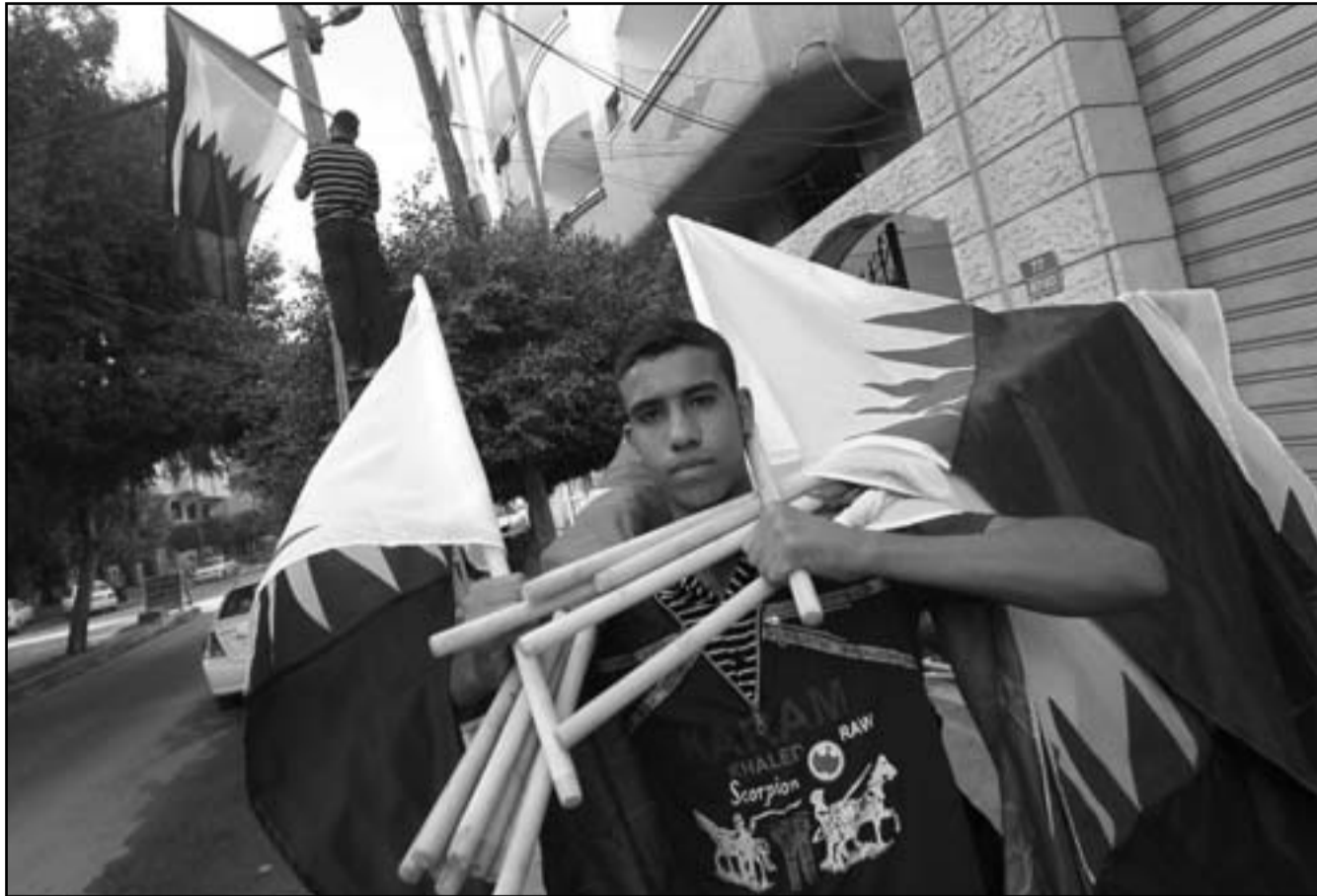
فلسطيني يحمل اعلام قطر لتزيين شوارع غزة

نحو 300 مليون دولار في قطاع غزة، وأرسلت قبل أيام مناقصات على عدة شركات في القطاع للبدء في تنفيذ هذه المشاريع. ويتوقع أن تبدأ هذه الشركات بتنفيذ المشاريع عقب زيارة الشيخ حمد، حيث سيتم تنفيذها بمواد خام سيتم توريدها من مصر عبر معبر رفح البري، بعد موافقة السلطات المصرية على ذلك. وكان السفير محمد العمادي رئيس اللجنة القطرية لإعمار غزة أعلن موافقة الرئيس المصري محمد مرسي على إرسال مواد البناء لاستخدامها في إعادة الإعمار. وكان هنية يبحث خلال اتصال هاتفي مع الرئيس مرسي سبل تسهيل تنفيذ المشاريع القطرية، وذلك خلال اتصال هاتفي بين الرجلين. وفي غزة شرعت حكومة حماس بتنفيذ مشاريع الإسكان الرئيسية بآلات كبيرة، تبرز المشاريع القطرية المنوي تنفيذها وأهميتها للسكان. وعلى الشارع المحاذي لمبنى المجلس التشريعي وضعت لافتة كبيرة كتب عليها «شكراً قطر»، كذلك وضعت لافتات دعائية كبيرة تبرز أهمية المشاريع، بالتأكيد على أنها ستوفر فرص عمل جديدة. وكانت أجهزة الأمن نفذت خلال الأسبوعين الماضيين تدريبات شملت إجراء مناورات تم خلالها انتشار كافة عناصر أجهزة الأمن في الشوارع، على ما يبدو فإن تلك التدريبات استهدفت التمرن على تأمين موكب أمير قطر خلال الزيارة. وتحمل زيارة أمير قطر معاني سياسية كبيرة لحركة حماس التي شكلت قيادة السلطة الفلسطينية، منذ سيرة حماس على غزة. وكانت معلومات أكدت أن قيام قطر