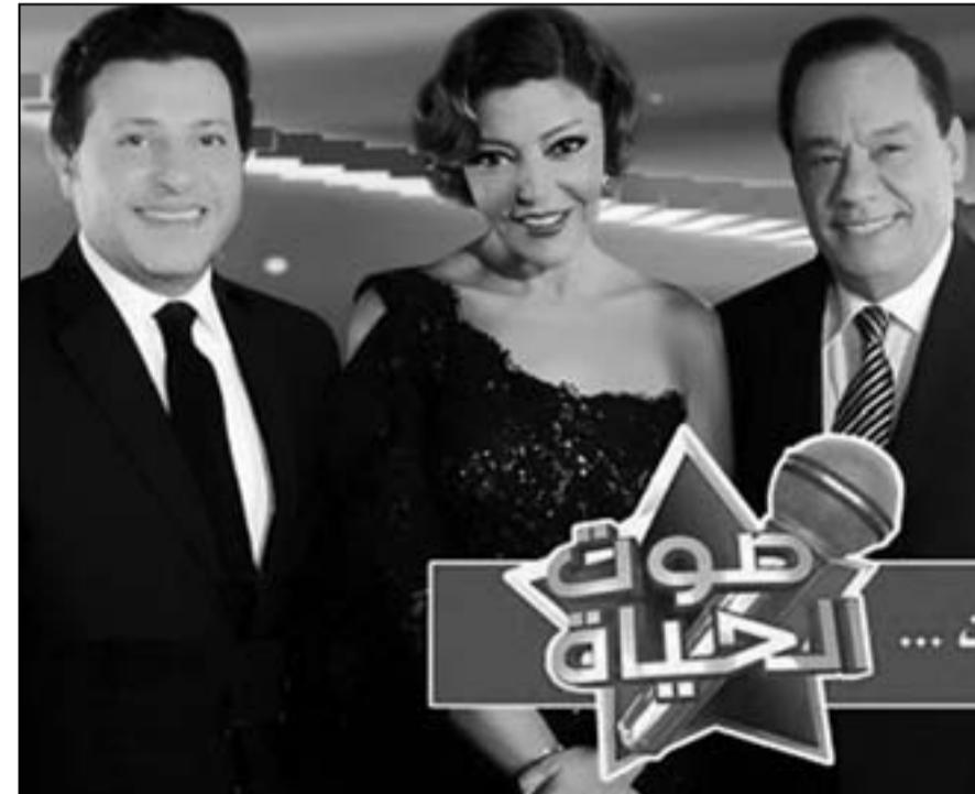
برنامج «صوت الحياة»

ولعل المشاهد قد جمع في ذاكرته ردود فعل «العديمين» الذين أطالوا في التعبير عن مشاعر الخوف التي انتابهم لحظة المواجهة، وحاضرهم شيخ انقطاع الأنفاس وهروب أو انكماش ثبرات الأصوات التي كانت حاسمة في قرار الإقصاء وإعلان حالة الوفاة، وصحيح أن كثيراً من هذه الأصوات