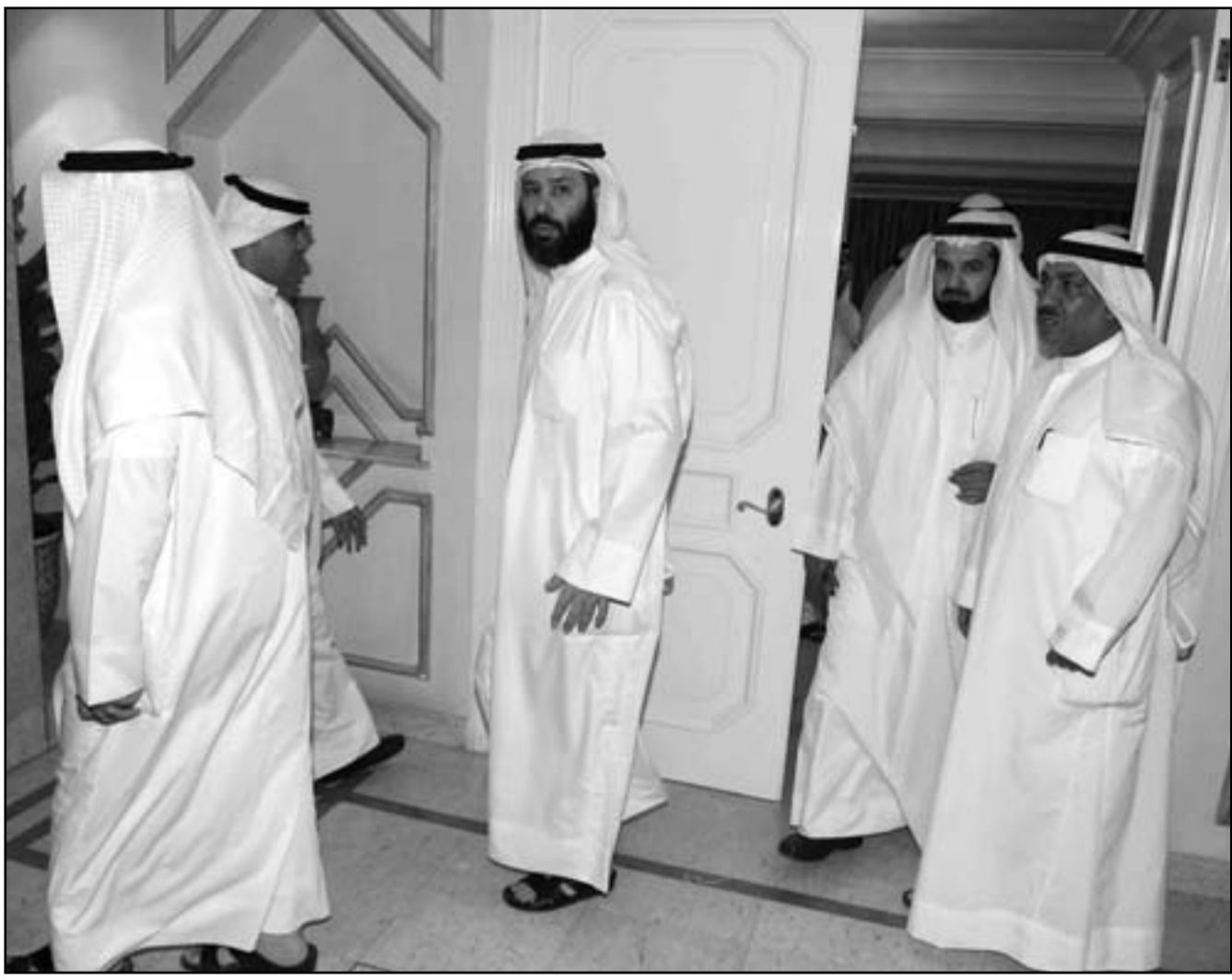
أعضاء من المعارضة الإسلامية الكويتية يجادلون قاعة الاجتماعات بعد دعوتهم للتظاهر لتعديل القانون الانتخابي

سواهم... وأضافت ان «أي مظاهر للشغب والعنف والحريص على الإشارة والتعدي على المتكلمات العامة والخاصة والصالح العليا لامن البلاد، سوف يجابه بكل الشدة والحزم». واكد امير الكويت الشيخ صباح الاحمد الصباح الذي كان حل البرلمان في 7 تشرين الاول/أكتوبر، الجمعة انه اتخذ هذه الخطوة «لحماية الوحدة الوطنية، بما ان القانون يشكله الحالي يؤدي الى انقسامات قلبية وطائفية». وقال في كلمته الجمعة انه يشعر بالاسف والالم لان «هذه الامرات التي تشل بلدنا وتهدد امننا وتعطل أعمالنا من صنع نافر من ابناثنا». ورأى ان هناك «من يتعمد وضع العصي في الدواليب وعرقلة المسيرة (...) لا يريد التفاهم ولا يقبل التوافق، يتخذ من الشوارع والساحات منبرا للأثرة والشحن والتخريض ويحاول دفع الشباب نحو البلاد وسلامة أهلها». لكن القرار ادلى الى رد فعل غاضب لدى مجموعات المعارضة ونواب سابقين أعلنوا انهم سيقاطعون الانتخابات المقبلة ودعوا الكويتيين الى ان يحذوا حذوهم. وقال شيوخ قبائل بدوية من ضمنهم زعيم اكبرها العوازم، انهم سيديعون افراد قبائلهم مقاطعة الانتخابات في هذه الدولة الخليجية النفطية الصغيرة التي يبلغ عدد سكانها 1,2 مليون نسمة. وقال النائب الاسلامي السابق وليد الطبطبائي على حسابته على تويتر «انه في الاثناء، حذرت وزارة الداخلية الكويتية في بيان السبت من انها لن تسمح مطلقا بتنظيم اعتصامات او تجمعات او الخروح بمسيرات وجلسات او مبيت في أي مكان خارج نطاق المساحة المقابلة لمجلس الامة المختصة بحرية التعبير السلمي عن الرأي إن شاء من المواطنين وحدهم دون المعارضة من جمعيات وافراد، الشعب