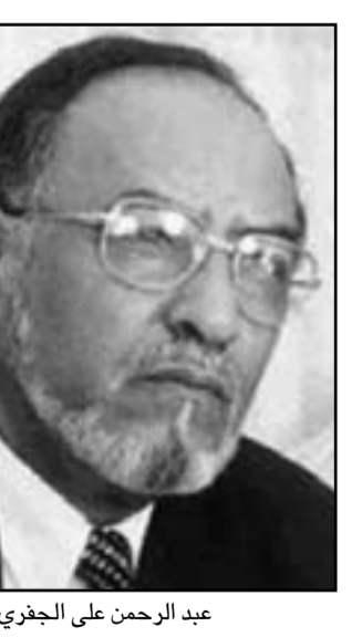
عبد الرحمن على الجفري

القاهرة - يو بي آي: يتهم المعارض اليمني عبد الرحمن على الجفري الأحد، الأمم المتحدة بتجاهل حل القضية الجنوبية، ويكرس سرفاء دول الاتحاد الأوربي ودول الخليج المحافظة على الوحدة اليمنية التي تمت بت شمال وجنوب اليمن في مايو/أيار 1990.