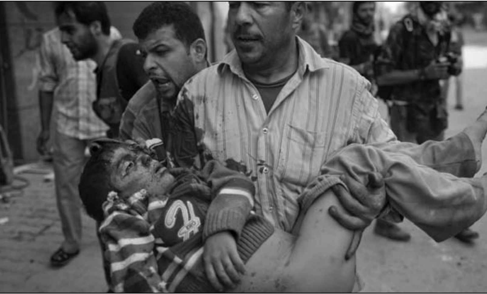
سوري ينقل طفلا أصيب بالقصف على مدينة حلب