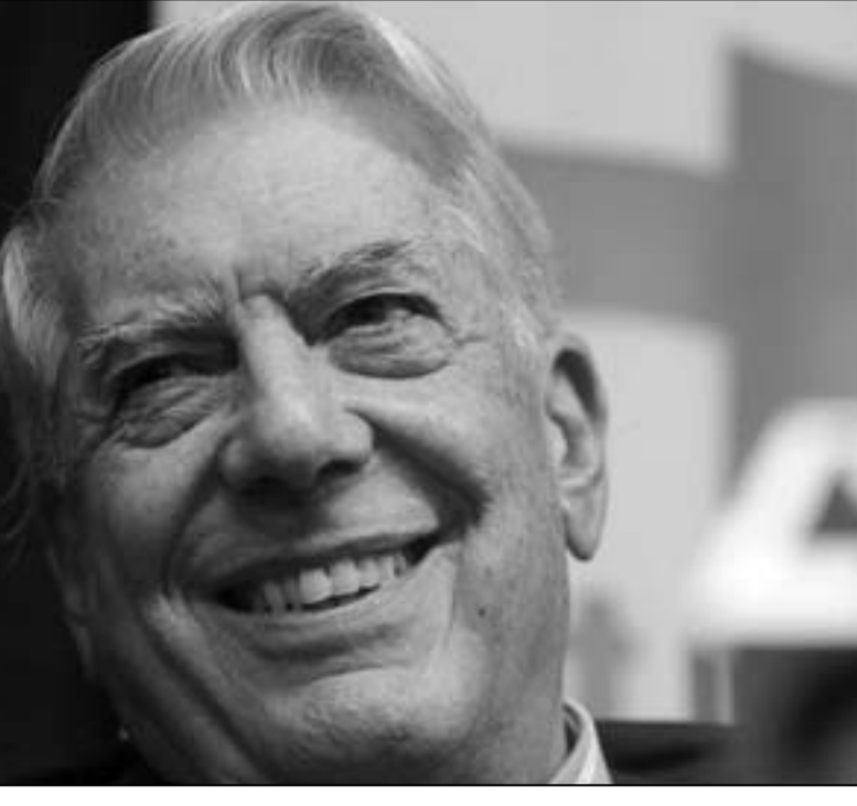
ماريو برغاس يوسا

ولد ماريو برغاس يوسا في مدينة «أريكيبا» بالبيرو عام 1936، وهو حاصل بالإضافة إلى نوبل في الآداب العالمية على عدّة جوائز أدبية هامة أخرى منها «ميغيل دي سيرفانتيس» 1994، و«أمير أستورياس» في الآداب 1986، وجائزة «بلانيتا» الإسبانية في الرواية عام 1993 فضلا عن جوائز أدبية أخرى في مختلف أنحاء العالم.