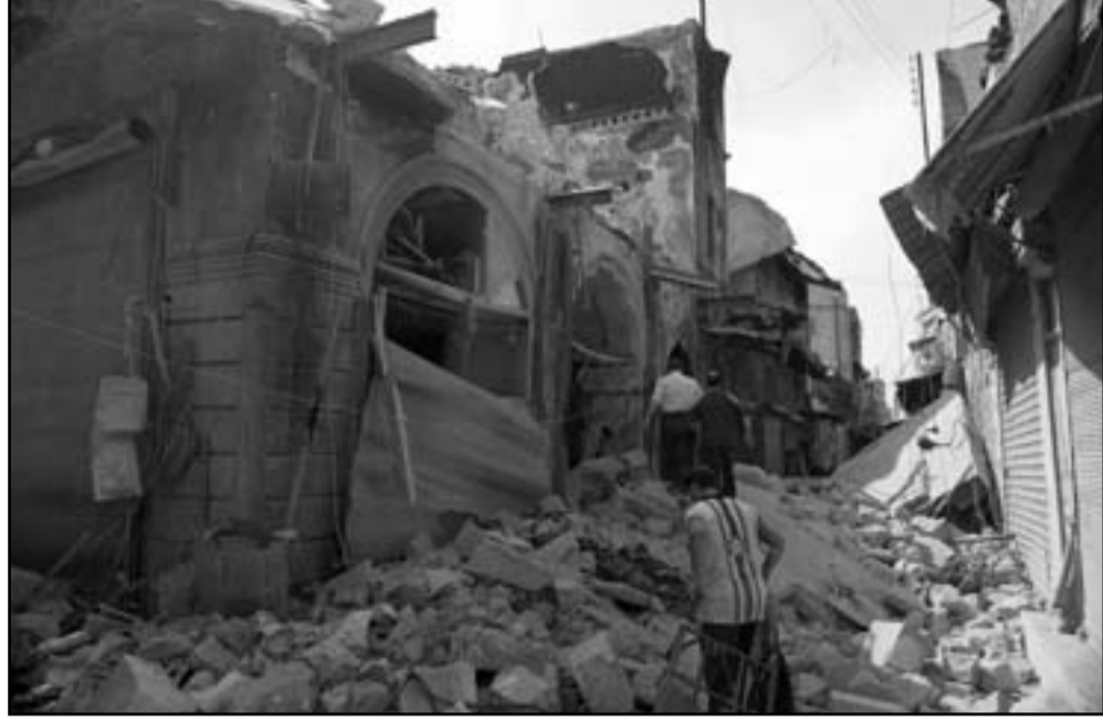
رفض حماس تأييد الاسد في حربه اغضب الإيرانيين

ان لعبة قطر واضحة، فالحديث عن التآليف بين الطامح الأخذة في الكبر للأسرة المالكة ورئيسها، والعقيدة الوهابية التي يمتسك بها حكام الامارة. لكن يتم الحديث ايضا عن لعبة بقاء أساسها ضمان أمن قطر ووجودها، ان أكثر سكانها عمال اجانب يقيمون في الامارة لكهم لا يتمتعون بثمرات الوفرة والثراء الذي أسقط نظام معمر القذافي، الشريعة قبل ذلك. ان قطر تسلك وتكثرتا قوة من القوى الكبرى الإقليمية ذات أهمية وقوة