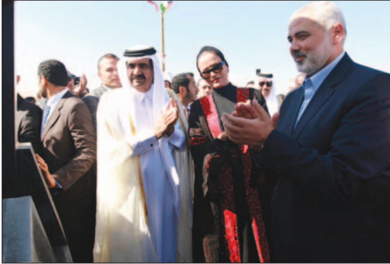
غزة - «القدس العربي» - من أشرف النهرو:

كسر أمير قطر الشيخ حمد بن خليفة آل ثاني عزلة حكومة حركة حماس الاسلامية في قطاع غزة الثلاثاء بزيارة رسمية أثارت استياء إسرائيل والقيادة الفلسطينية في الضفة الغربية، ودعا إسرائيل إلى قبول بسلام عادل أو أن «تجبر عليه». ودعا الشيخ حمد بن خليفة آل ثاني، مساء الثلاثاء، الفلسطينيين إلى تحقيق المصالحة، والتوحد لمواجهة قضاياهم الوطنية، كما أعلن ذلك عن رفع قيمة المنحة المقدمة من بلاده لإعادة إعمار قطاع غزة إلى 450 مليون دولار، وهو ما دفع بإسماعيل هنية رئيس الحكومة المقالة للإعلان عن إنهاء الحصار المفروض على السكان.