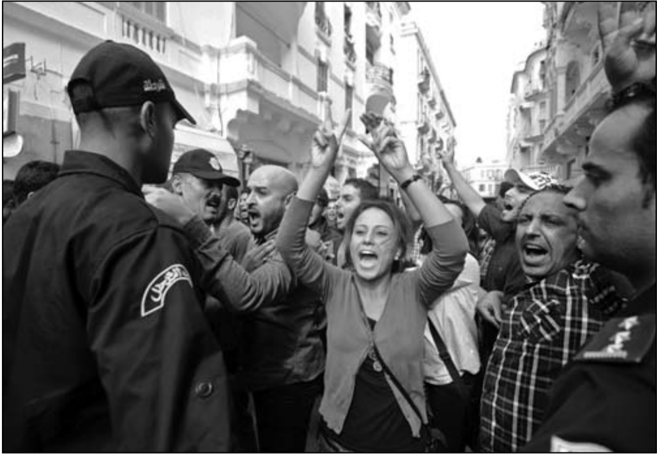
تونسيون يتظاهرون مطالبين باستقالة الحكومة

بعد الإطاحة في 14 كانون الثاني/يناير 2011 بالرئيس مخلوع زين العابدين بن علي واستقالة حكومة محمد الغنوشي آخر رئيس وزراء في عهد بن علي في نهاية شباط/فبراير 2011 تحت ضغط شعبي. ووصف السياسي مقلد نقض بانه «أول عملية اغتيال سياسي في تونس بعد الثورة» ودعا معارضي هذه الرابطة التي حصلت على ترخيص بالعمل ويعتبر معارضون هذه الرابطة التي حصلت على ترخيص بالعمل في حزيران/يونيو الماضي من الحكومة التي يرأسها حمادي الجبالي أمين عام حركة النهضة، «منظمة إرهابية» مكونة من «مليشيات عنيفة» تاتمر بأوامر حركة النهضة التي تنفي هذه الاتهامات. والاتين ندد راشد الغنوشي رئيس حركة النهضة بقتل لطفى نقض لكنه سر على الرابطة حماية الزادة. وقال الغنوشي في تصريح لإذاعة إن التمتين إلى الرابطة «هم الذين صنعوا وقادوا الثورة، ونحن «استعدوا شرعية عنهم من نضالهم، و«لا احد له الحق في إنهاء هذه الشرعية».