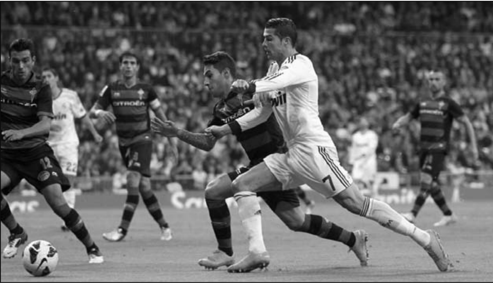
كريستيانو رونالدو نجم ريال مدريد (يمين) ينفذ بالكرة

اختباره الصعب الأول ببطولة دوري الأبطال الحالية اليوم عندما يستضيف شالكة على ملعب «الإمارات» ضمن منافسات المجموعة الثانية. فيما يلتقى مونبلييه الفرنسي مع أولينياكوس اليونانى فى مباراة المجموعة الثانية الأخرى.