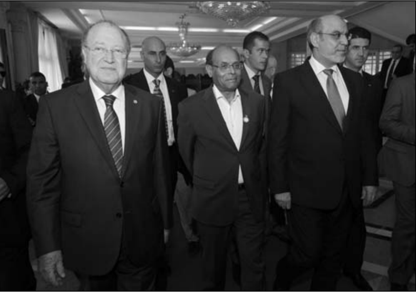
الرئيس التونسي متصفح المرزوقي ورئيس الوزراء حمادي الجبالي ومصطفى بن جعفر رئيس المجلس الوطني التأسيسي في طريقهم لعقد جلسة برلمانية