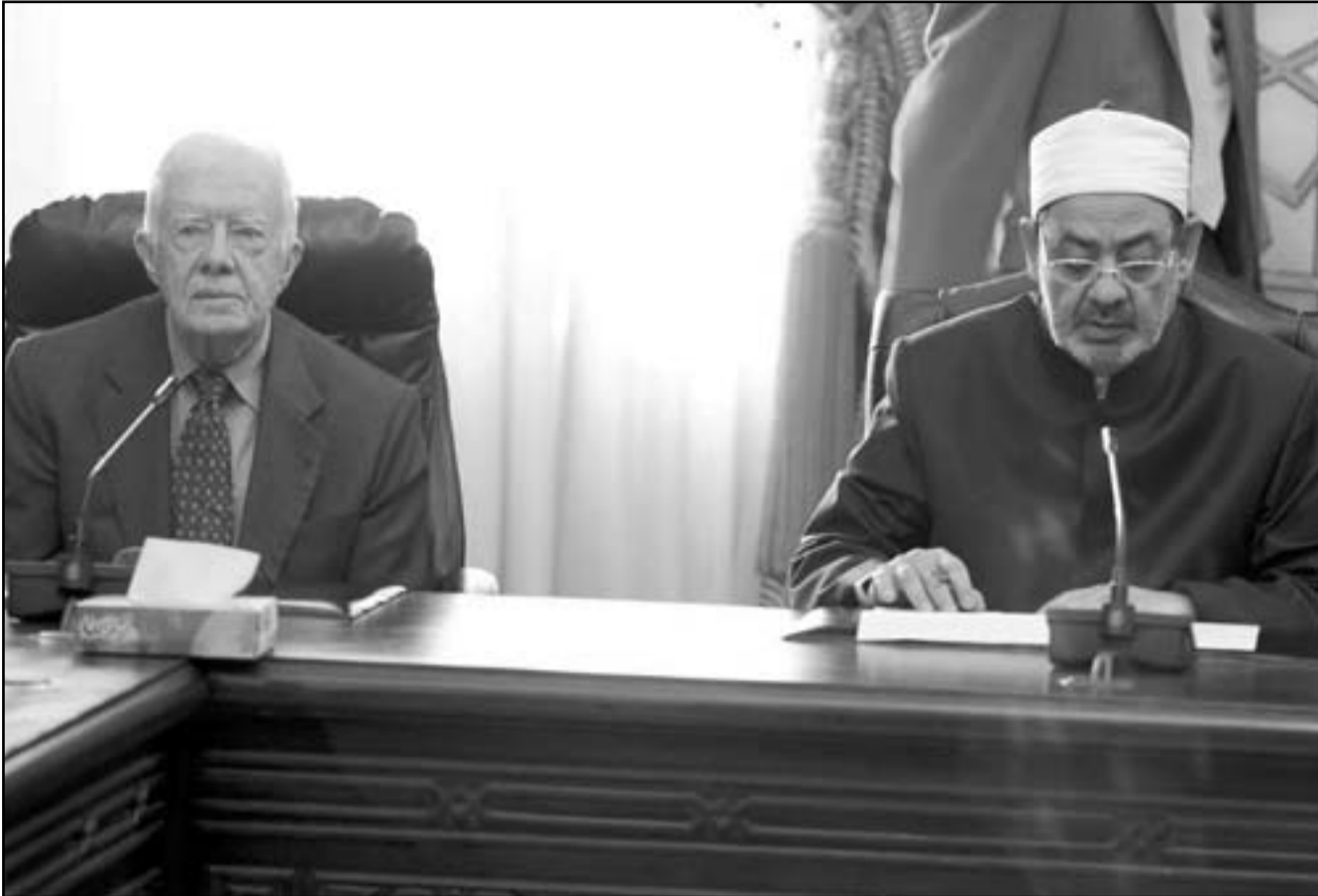
شيخ الأزهر الدكتور أحمد الطيب اثناء استقباله الرئيس الأمريكي الاسبق جيمي كارتر في القاهرة امس