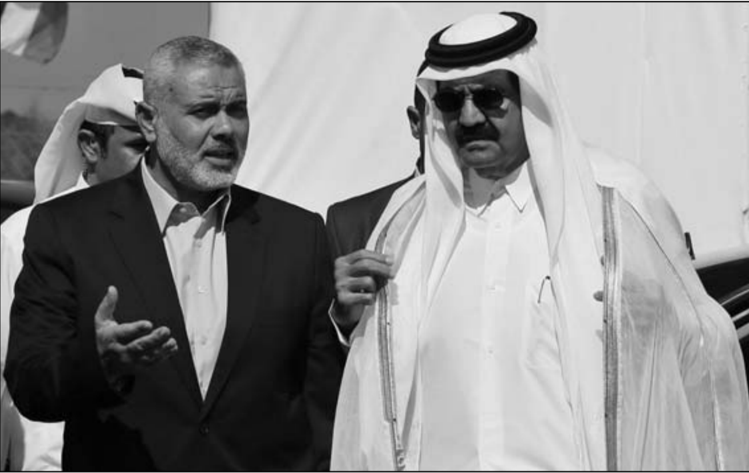
أمير دولة قطر الشيخ حمد بن خليفة آل ثاني ورئيس وزراء الحكومة الفلسطينية المقالة اسماعيل هنية خلال افتتاح حي سكني في خان يونس