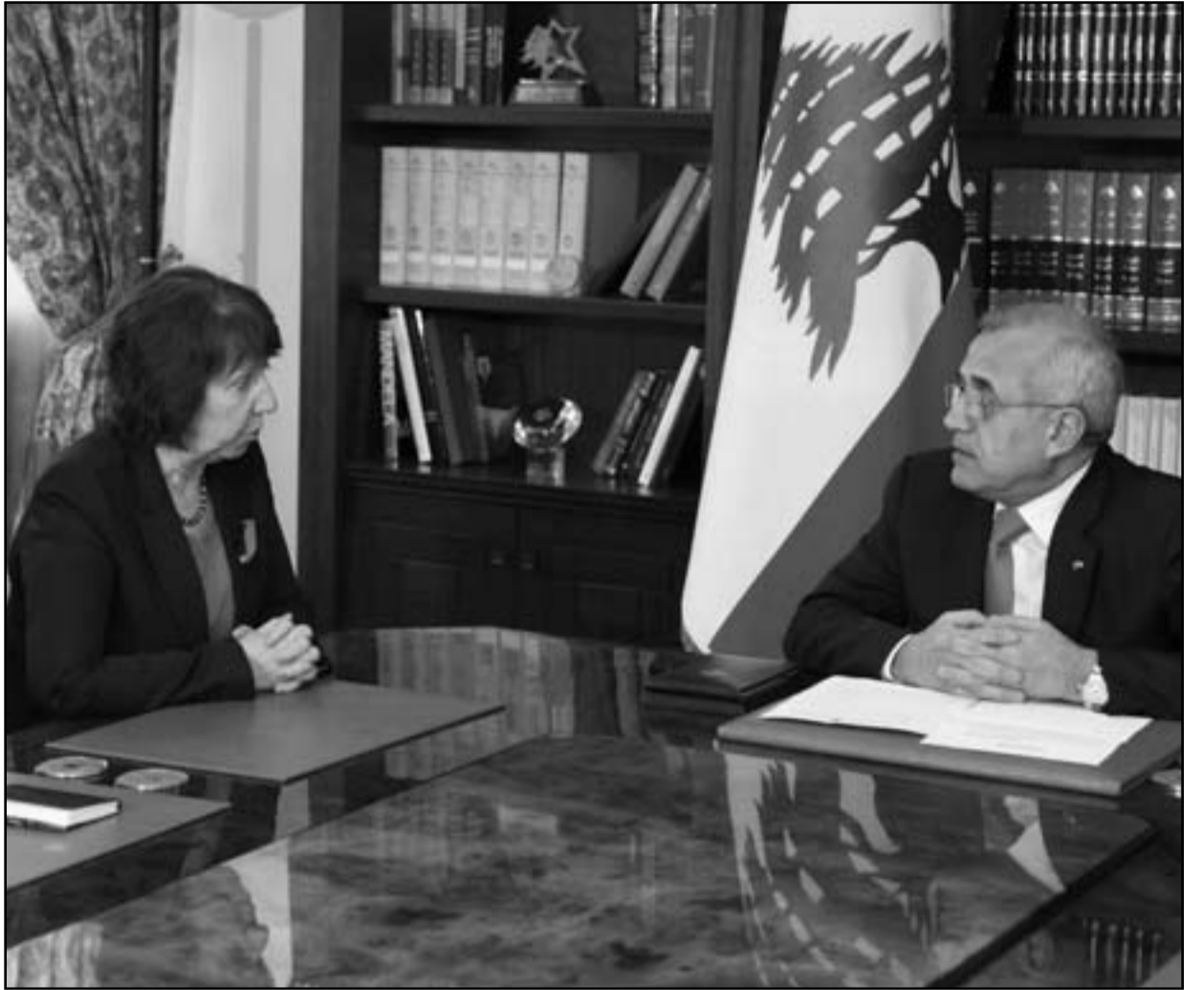
فلسطينيون يشيعون جثمان شاب قتل في مواجهات في مخيم صبرا في بيروت