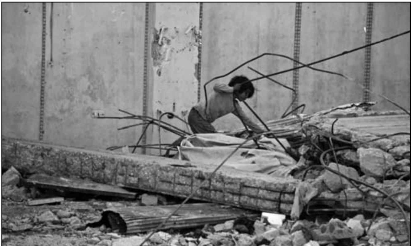
طفل سوري يلهو على انقاض منازل دمرت بالقصف الجوي على حلب

دمشق - اسطنبول - القاهرة - بيروت - وكالات: قالت قناة (سي. إن. إن) ترك ان قذيفة مضادة للطائرات اطلقت من سورية سقطت على مركز طبي في منطقة ریحانلي بإقليم هاتاي في تركيا امس الثلاثاء لكن لم ترد على الفور تقارير عن حدوث إصابات، في الوقت الذي افاد فيه المرصد السوري لحقوق الإنسان بان نحو 50 سورية قتلتوا الثلاثاء على انحاء متفرقة من سورية، فيما شن الطيران الحربي السوري الثلاثاء غارة جوية على حلب شمال سورية، وتابعت القوات النظامية الهجوم في دمشق. وذكر المرصد السوري لحقوق الإنسان ويتخذ من لندن مقره في بيان وصلت نسخة منه لوكالة الأنباء الألمانية: «ارتفع إلى 36 عدد الشهداء المدنيين الذين انضموا الثلاثاء إلى قافلة شهداء الثورة السورية».