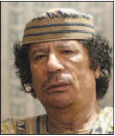
الزعيم الليبي الراحل معمر القذافي

وسائل الإعلام الليبية من أجل تصوير هؤلاء السجناء الذين تمنح لهم الرتبة الخضراء، وكذلك صور معمر القذافي، حتى يكتمل المشهد. ونكر باسم الهاشمي الصول أنه يحاول إبطال الصورة الحقيقية حتى لا يتخذ الشعب الليبي في الداخل والخارج بهذه «المسرحية» التي تهدف للإلتعاب بتصفية الجيوب التابعة للقذافي في بني وليد، وأن هؤلاء كانوا مدجنين بالأسلحة. وكان الصول قد نفى قبل أيام أن يكون الموالون للعقيد القذافي وراء اغتيال السفير الأمريكي في ليبيا، مشدداً على أن مسؤولين في السلطة الليبية الجديدة هم من كلفوا جماعة إسلامية بتدبير وتنفيذ عملية اغتيال السفير الأمريكي، وأن الفوضى التي تعم في ليبيا تقف وراء ما يسميها الصول بـ «الحكومة المصطنعة» التي يطالب برحيلها.