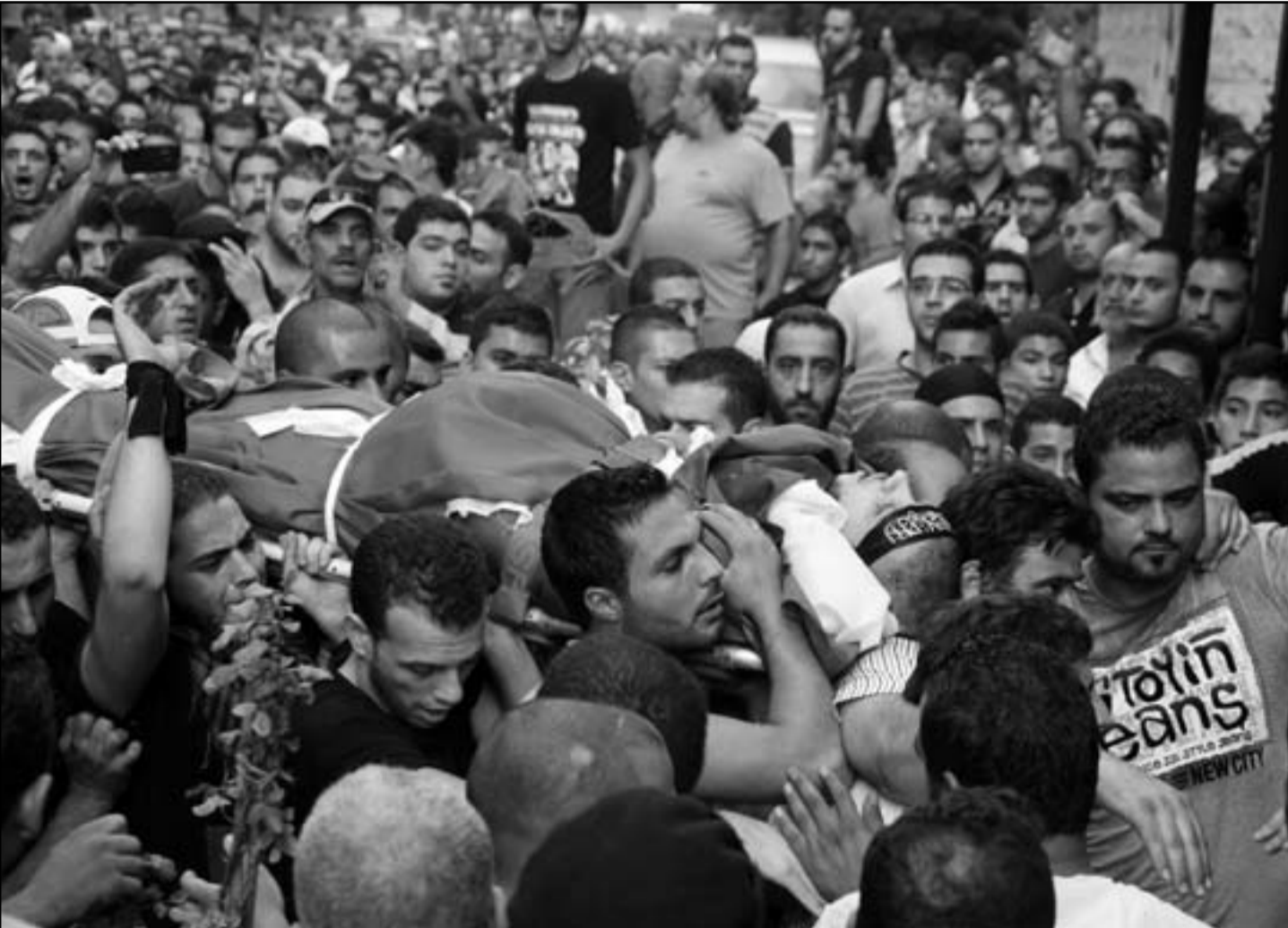
فلسطينيون يشيعون جثمان شاب قتل في مواجهات في مخيم صبرا في بيروت