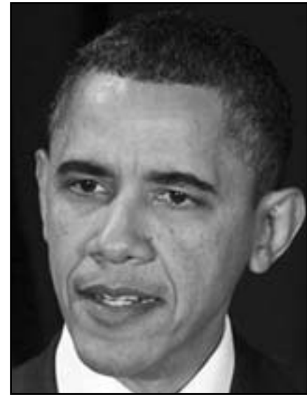
الرئيس الأمريكي باراك اوباما

وتسبب ذلك التصريح الغريب في إصدار تعليقات ساخرة ليس فقط من جانب انصار اوباما ولكن ايضا من جانب معقني ليبراليين ومحافظين. يذكر أن ترامب، الذي أبدى تأييده للمرشح الجمهوري ميت رومني في انتخابات الرئاسة الأمريكية، مؤيد منذ فترة طويلة لحركة تهدف إلى البحث عن دليل بأن اوباما لم يولد في الولايات المتحدة و ثم لا يكون مؤهلا ليرأس البلاد. وضمن نظريات المؤامرة، هناك دعوات بإصدار مزيد من السجلات لنشاط جنسية اوباما. وبعد سنوات من تردد نظريات المؤامرة، اظهر اوباما شهادة ميلاده المفصلة العام الماضي. وكان اوباما قد سخر العام الماضي من اصرار ترامب على أن يقدم اوباما شهادة ميلاده، غير أن اوباما تجاهل تلك التصريحات هذه المرة.