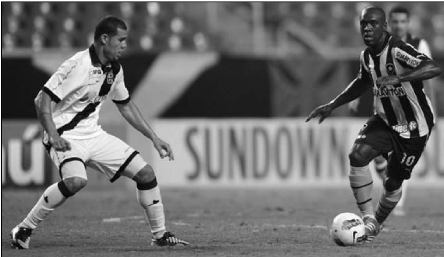
كلارنس سيدورف نجم بوتا فوجو (يمين) يتغرد بالكرة

لنهايات كأس أمم أفريقيا 2013، باستثناء إسلام سليمان الذي خضع أمس لعملية جراحية في الركبة ستعده عن الملاعب لمدة لا تقل عن ثلاثة أسابيع. وأكد البوسني وحيد خليلودزيتش المدير الفني للمنتخب الجزائري لكرة القدم أن فريقه لديه فرصة حقيقية في التأهل للدور الثاني بطولة كأس الأمم الأفريقية التي تقام مطلع العام المقبل بجنوب أفريقيا وأن المباراة الأولى المقررة أمام تونس هي الأصعب وستكون حاسمة في بقية مشواره الأفريقي. وأوقعت قرعة البطولة ، التي سحبت الأربعاء بمدينة ديربان بجنوب أفريقيا ، منتخب الجزائر ضمن المجموعة الرابعة إلى جانب منتخبات كوت ديفوار وتونس