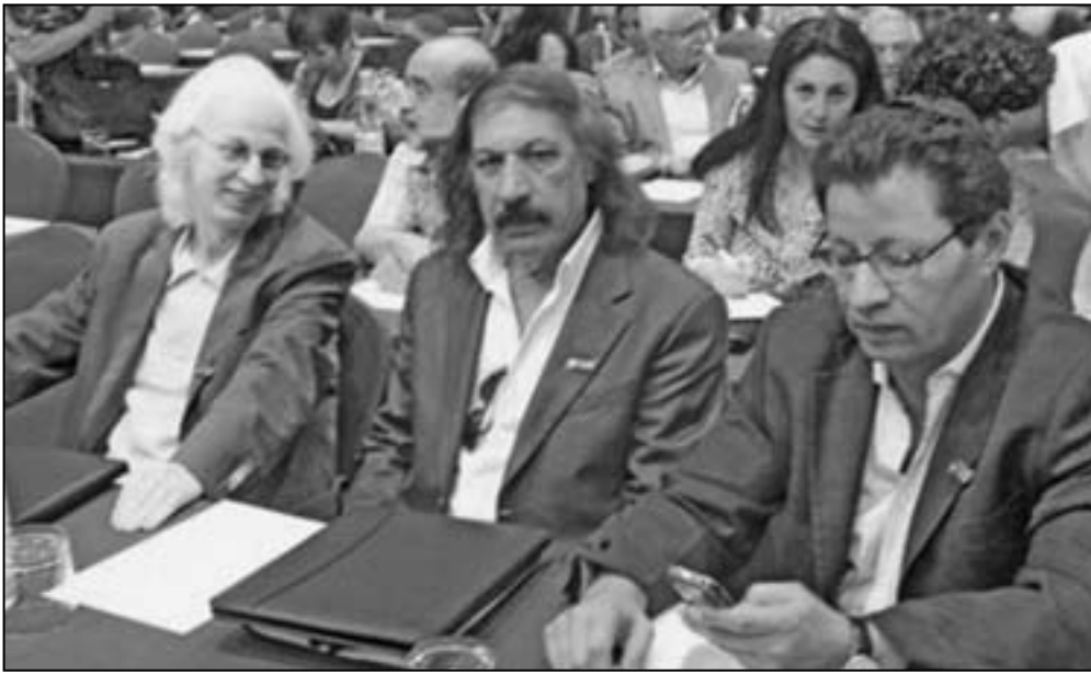
من مؤتمر «رابطة الكتاب السوريين» في القاهرة

بسبب مضايقتهم لنا في المشروع، وهو ما تأكد من عبثه وعدم صحتة.