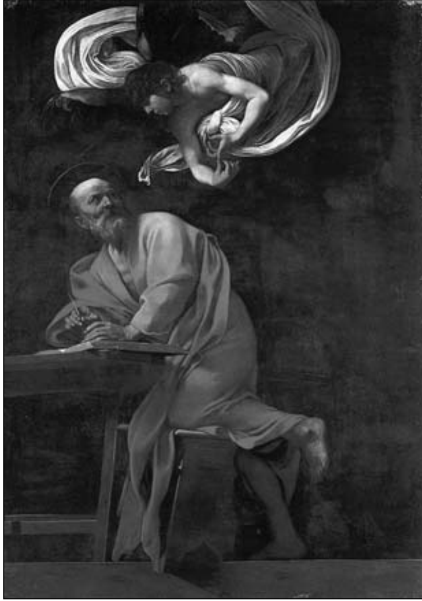
من أعمال كارافاجيو

تولوز ومونبيلييه، المدينتان الأكبر فيما عُرِف قديما بإقليم لانجودو، جنوبي فرنسا، كانتا قد تأثرتا بالكارافاجية منذ بدايات القرن السابع عشر، ما جعلهما مناسبتين لتنظيم معرض كهذا، وعرض المتحان في المدينتين تشكيلتين متكاملتين من الأعمال الكارافاجية: في تولوز عُرضت الأعمال الفلامية والهولندية، من الرسامين الأوائل الذين سافروا إلى إيطاليا (مونتوروست، شيفر، ستوم، سويرتز...) إلى المتأثرين بهم (جوردانز، رامبرانت...)، أما في مونبيلييه فعرضت الأعمال الفرنسية والإيطالية والإسبانية، من كارافاجيو واتباعه الأوائل (جنطيشي، مانفريدي...) إلى المتأثرين بهم من الأسبان والفرنسيين، كما عُرضت أعمال واقعية لجورج