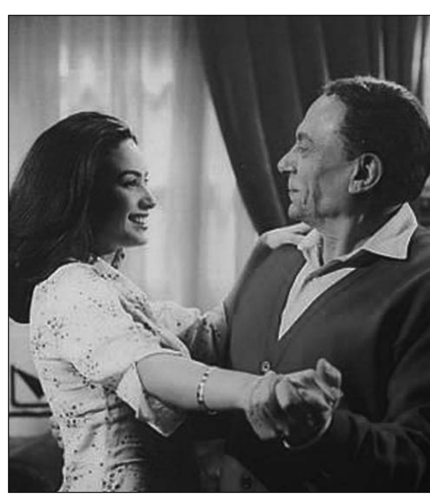
لقطة من فيلم «عمارة يعقوبيان»

الخشاخ على الاعمال السينمائية لأحضرى هو انطلاق الحريات ووضع خريطة عمل تدعم مشروعا سينمائيا جديدا يشابه في صفاته وأناقته فيلم عمارة يعقوبيان لأشهر الممثلين المصريين أمثال نوري الشريف وعادل امام ويسرى وأسعد يونس وآخرين. في الختام السينما العربية تنازع ، بل انها تلفظ أنفاسها الاخيرة ومع ذلك هناك صمت غير مفهوم.....السينما اليوم هي من اهم العوامل لتحديد اتجاه المجتمعات وتوجيهها فكريا