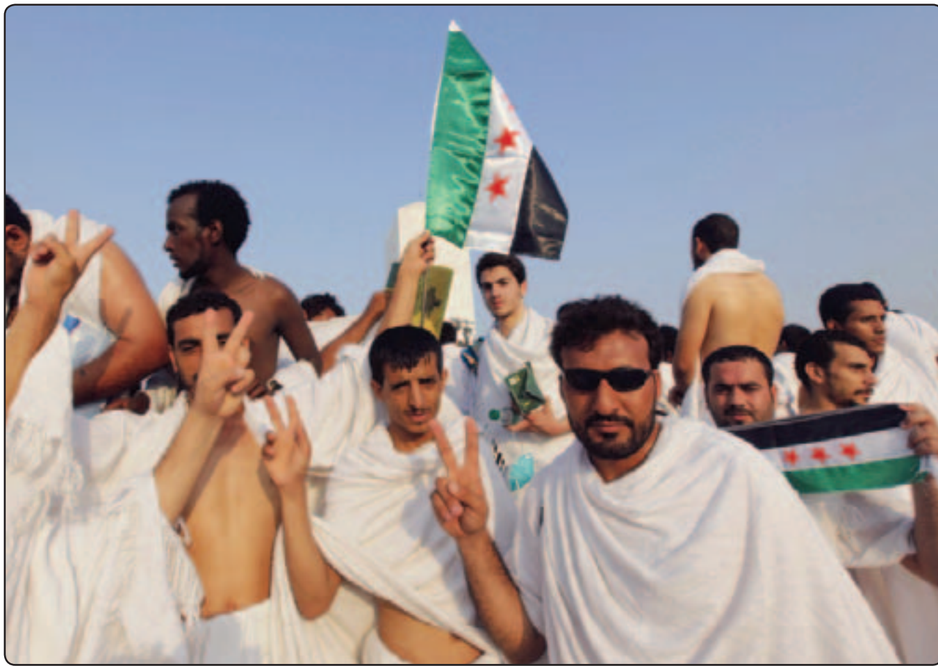
سوريون يرفعون علم الثورة أثناء تاديتهم مناسك الحج على صعيد عرفات