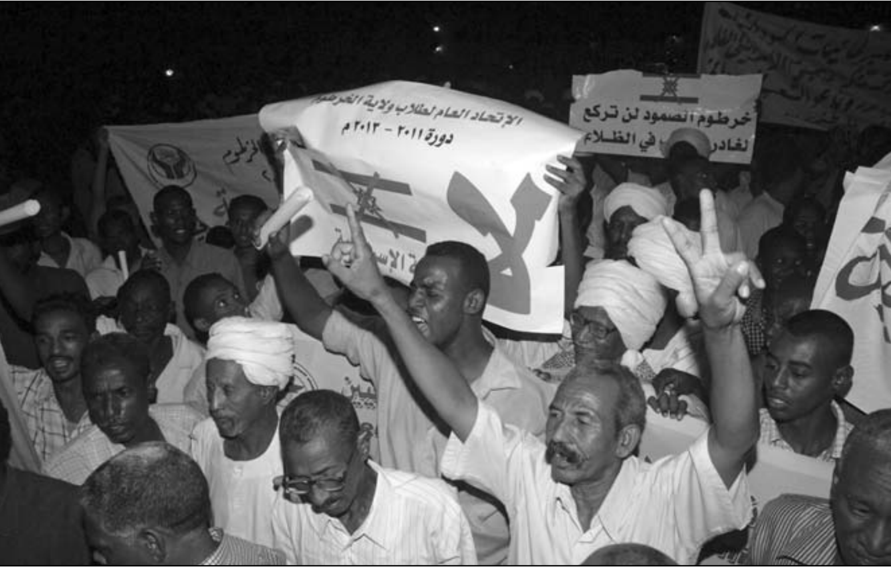
مظاهرون سودانيون يتدنون بتفجير مصنع للأسلحة في العاصمة الخرطوم أمس

وكان مصنع «البرموك» بجنوب العاصمة السودانية الخرطوم تعرض للقصف بطيران حربي في الساعات الأولى من يوم أمس الأربعاء، فيما اتهم السودان رسمياً إسرائيل بشن الهجوم الذي راح ضحيته اثنتان من المواطنين السودانيين. وطالب مجلس الوزراء السوداني، في اجتماع طارئ عقده الليلة الماضية، مجلس الأمن الدولي وجميع شعوب العالم وحكوماته بإدانة الهجوم «الذي يمثل جريمة تهدد السلم والأمن الدولي».