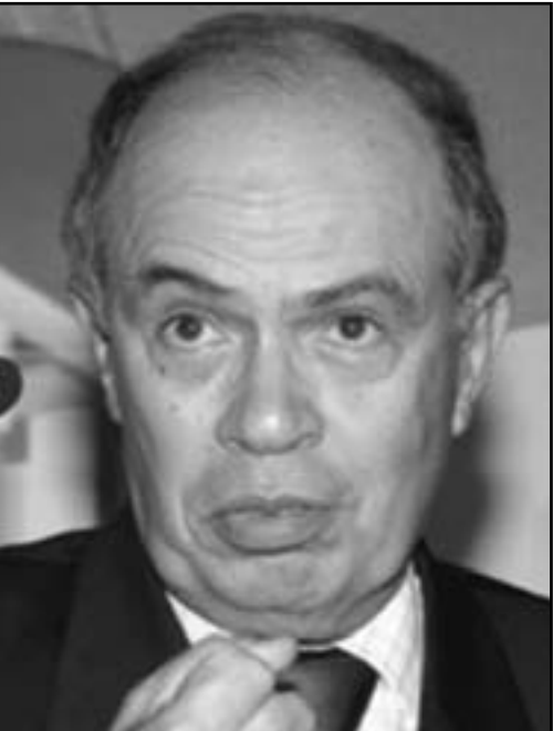
فتح الله ولعلو

■ هل يمكن أن نتحدث أيضاً في موضوع تطور الاقتصاد على مدى وجود الديمقراطية في البلدان المعنية؟ ■ تطور الاقتصاد مرتبط بعاملين: أولهما قدرة الشعوب على الانخراط في ثقافة العمل والاجتهاد، وثانيهما قدرة الشعوب على ابتكار مؤسسات تدريبية وسياسية قائمة على العقلنة، وهذا يمكن الديمقراطية. في الواقع، حين ارتبط الاقتصاد العالمي بالرماسالية فقد ارتبط في الواقع باقتصاد السوق، أي باقتصاد المنافسة،