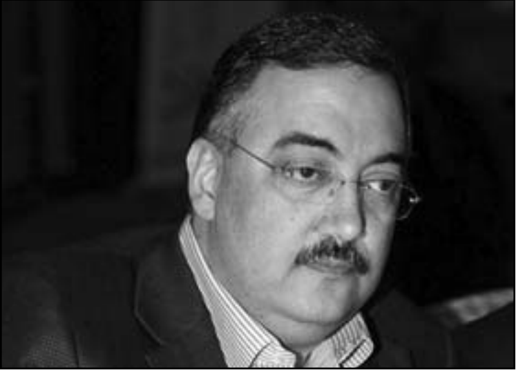
العميد وسام الحسن

من يفسح المجال لسفير نظام القتل بطلس الحقائق عبر الاعلام ان لا علاقة لنظامه بجرميته اغتيال اللواء وسام الحسن ومن قضي معه، وثار موقف شهيب من الوزير منصور جملة تساؤلات عما اذا كانت جبهة الضالعات التي لا يزال حتى الساعة ورئيسها متمسكاً بالحكومة، بدأت ترسل اشارات الضوء الاخضر لاستقلالها من بوابة شن الهجوم على وزير في الحكومة.