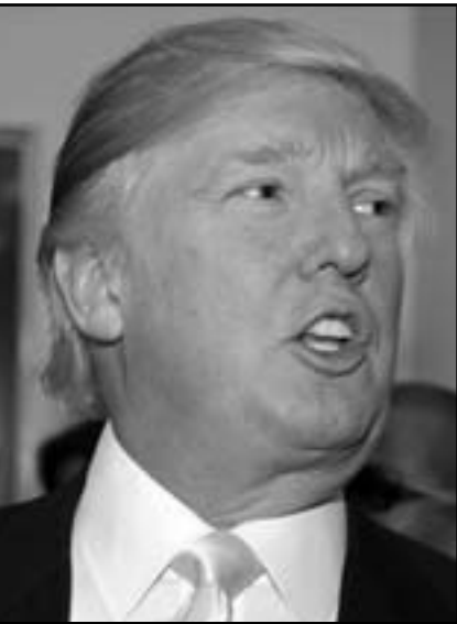
الملياردير الأمريكي دونالد ترامب