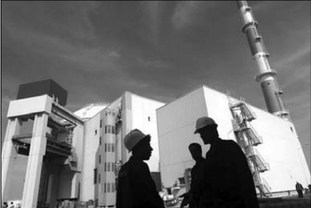
المقارنة بين الطيران الى السودان والطيران للمنشآت الذرية الايرانية مهمة

ايضا، قبل بضع سنين نشر ان سلاح الجو الاسرائيلي هاجم واحدة من هذه القوافل في الصحراء السودانية، مهما تكن الدولة التي تصنعها، عملية جراحية جوية من هذا النوع لا تكون مرتجلة، لأن الاستعدادات لها تمتد لشهورا طوية من اجل الملازمة بين الخطط الجوية هناك على ابناء الفرقية وسيئاتها، وفي سفن او امرك عسكرية وتدريبات، وتشارك فيها