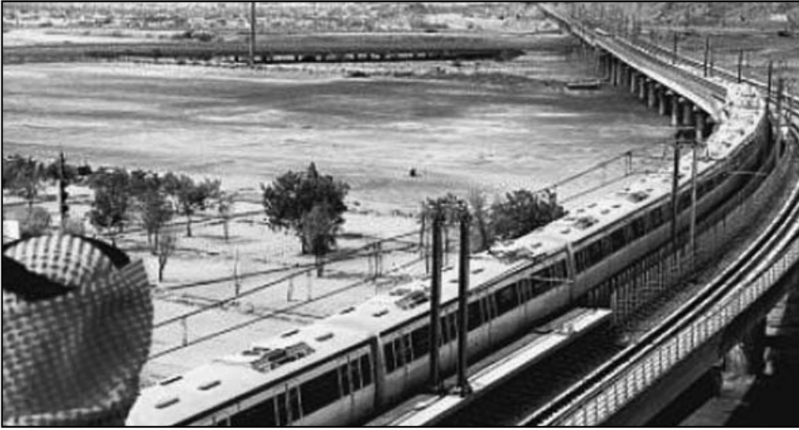
رسم تخطيطي للقطار المزمع إنشاؤه في مكة المكرمة

وتتنافس أربعة ائتلافات تضم 33 شركة من 15 دولة وخصوصاً فرنسا وإيطاليا وسويسرا وكندا والمنايا والسعودية للفوز بمشروع قطار الرياض مع شبكة طولها 175 كلم وحافلات عدة مما سيخفف من الازدحام الخانق في