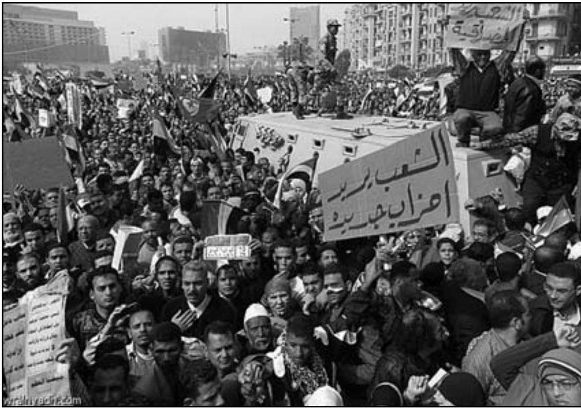
الجماهير العربية طالبت بالبحرية ومرسي يتحدث عن الخبز والغاز

بل والمعارضن لسياسته الاقتصادية بانه من غير السليم الحديث عن فشل اقتصادي في اداء النظام الجديد، وذلك لان الامر كفييل بان يؤدي الى انهيار مصر.