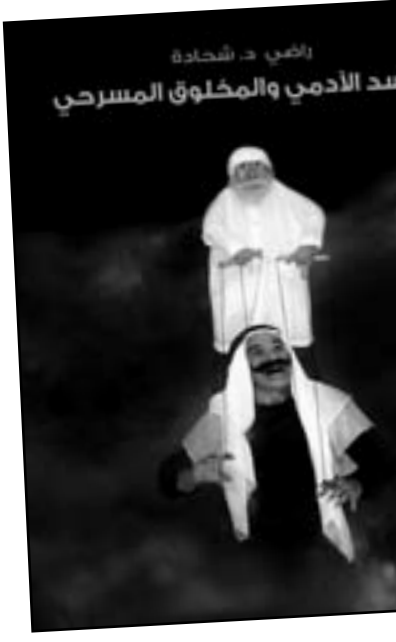
الاصح شحادة الحسد الأدمي والمخلوق المسرحي

والأفلام المشاركة تمثل كلا من كينيا ونيجيريا وأوغندا وتشاد وتنزانيا ورواندا وجنوب أفريقيا. وقال البيان إن المهرجان الذي يستمر عشرة أيام سينظم «ندوة كبرى تحمل عنوان (اليوم الإفريقي)». وتتناول دور السينما الإفريقية كوسيط