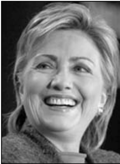
وزيرة الخارجية الأمريكية هيلاري كلينتون