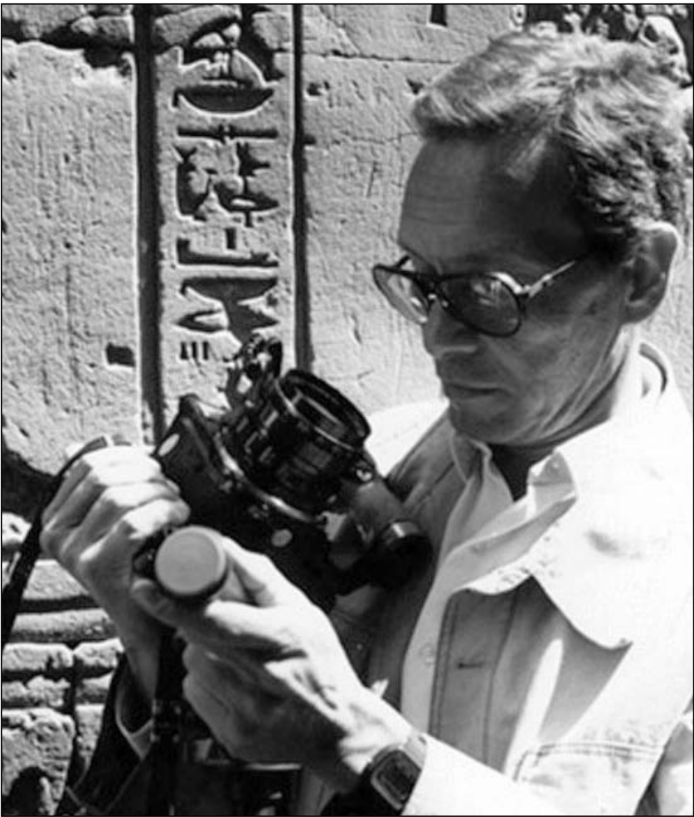
شادي عبد السلام

بترميمه، وبعد أن تم ترميمه قدمه سكورسيزي بنفسه في الدورة 63 لمهرجان كان السينمائي عام 2010، وفي العام التالي قام بترميم فيلمه القصير «الفلاح الفصح»، المأخوذ عن نص مصري قديم مكتوب على بردية عمرها حوالي 4000 سنة، وكان فيلم «الفلاح الفصح» قد حصل على العديد من الجوائز منها جائزة مهرجان فينيسيا السينمائي عام 1970.