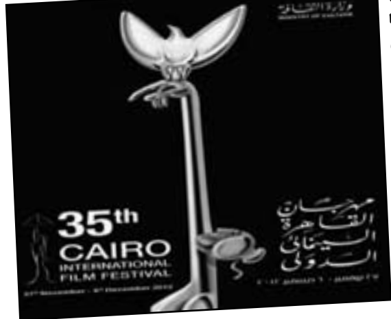
35th CAIRO INTERNATIONAL FILM FESTIVAL