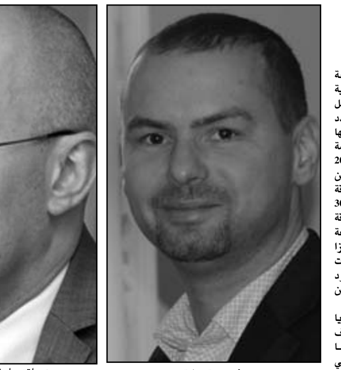
وزير اقتصاد لاتفيا دانيال بافلوتس

لاتفيا دولة صغيرة بدأت تأخذ مساحة كبيرة على خارطة السياحة العلاجية في العالم، وصغر حجمها هذا يجعل من السهل على زوارها الاستمتاع بعدد كبير من مناطقها التي تتنوع فيما بينها العاصمة ريغا التي تم اختيارها عاصمة ثقافية للاتحاد الأوروبي لعام 2014 بمبانيها التاريخية في الجزء القديم من المدينة وبالشواطئ الرملية في منطقة بريمولا التي لا تبعد عن العاصمة سوى 30 كيلومتراً إلى الطبيعة الخلابة في منطقة سيغولدا التي أيضاً لا تبعد سوى ساعة بالسيارة عن العاصمة، التي بلدة لوزا والتي توجد بها مستشفى تقدم خدمات علاجية من الدرجة الأولى على الحدود الروسية إن جبحون الهدوء والبعد عن ضوضاء المدن.