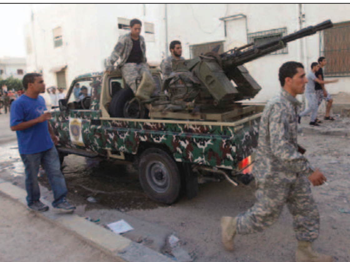
جانب من المواجهات بين الميليشيات الليبية المتناحرة في العاصمة طرابلس امس