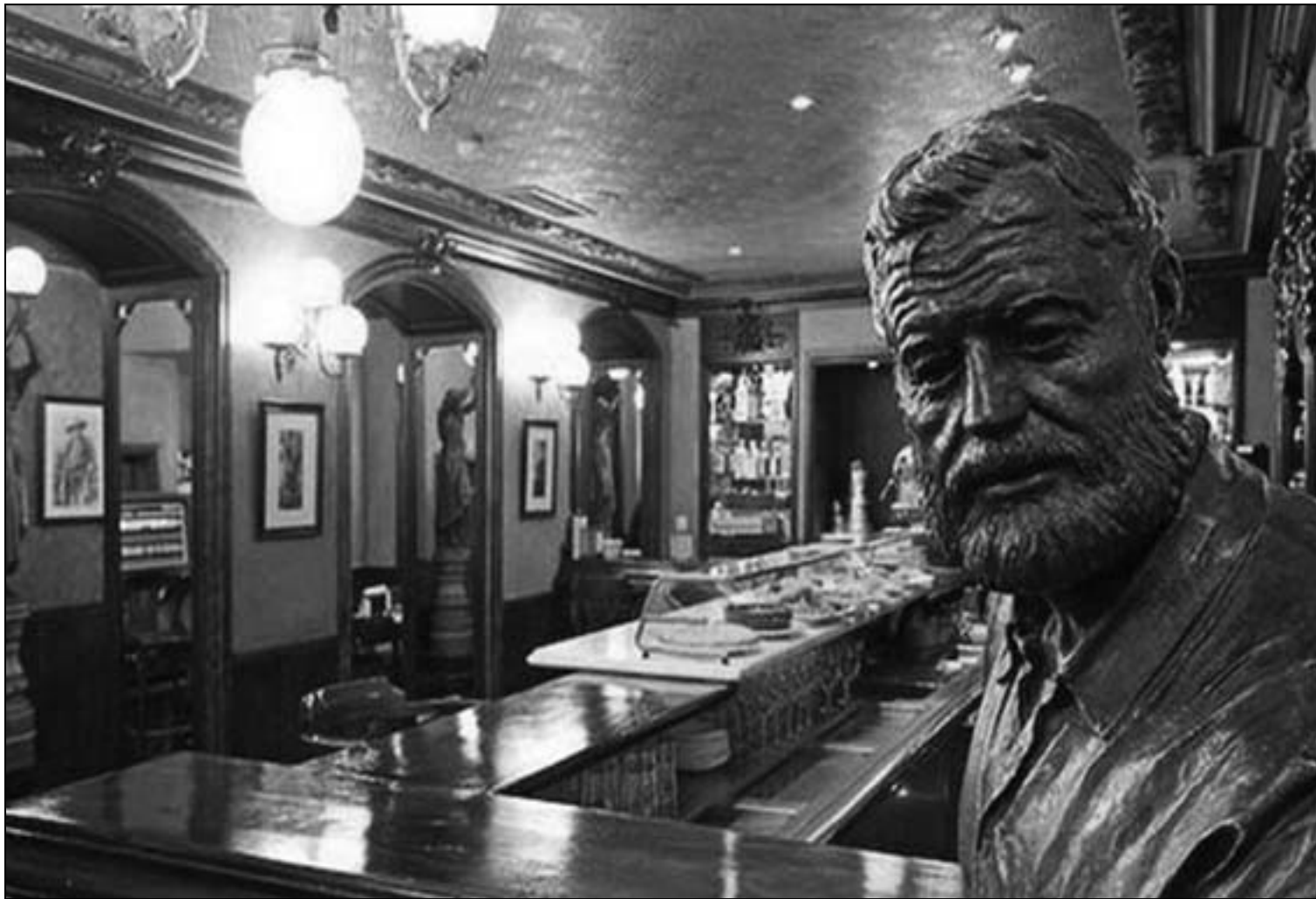
مجسم لارنست همنغواي في مقهي إيرونيا الأدبي بباميلونا الذي ما زال مفتوحا لاستقبال الزوار حتى يومنا هذا

من غرائب الصدفة التي تواجهنا عند الحديث عن مقهي «خيخون» الشهير، كونه أسس هو الآخر في نفس العام الذي أسس فيه مقهي «إيرونيا» المذكور آنفا وهو عام 1888. هذا المقهي ذو أهمية ثقافية كبرى في التاريخ