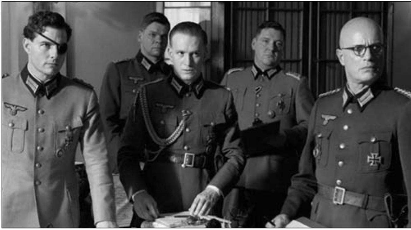
لقطة من الفيلم