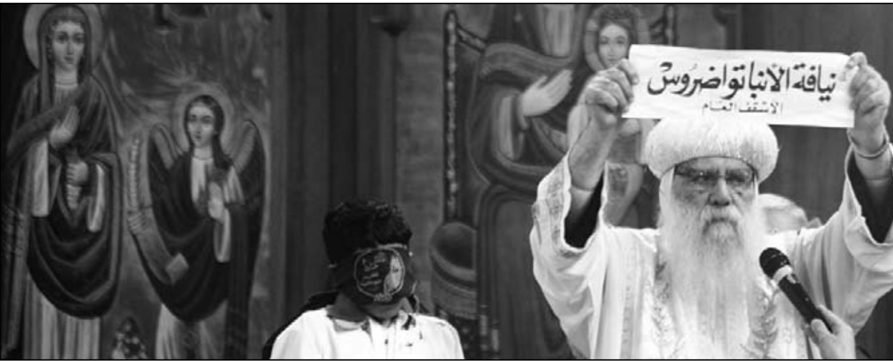
الأنبا باخوميوس يعلن فوز الأنبا تواضروس

القاهرة - وكالات: اختارت «القرعة الهيكلية» في الكنيسة القبطية الأرثوذكسية، امس الأحد، الأنبا تواضروس، أسقف عام البحيرة، ليكون البابا 118، خلفاً للبابا الراحل شنودة الثالث. وجرى في مقر بطريركية الأقباط الأرثوذكس في مصر، مراسم «القرعة الهيكلية» لاختيار البابا الجديد، بقداًس إلهي، وتم اختيار الطفل بيشوي جرجس مسعد للمشاركة في مراسم القرعة. وضع التقاط طفل لورقة تحمل اسم الأنبا تواضروس من بين ثلاث ورقات في إناء زجاجي على مذبح الكاتدرائية المرقسية بالقاهرة نهاية عملية طويلة لاختيار البطريك الجديد للكنيسة القبطية الأرثوذكسية في خطوة يأمل المسيحيون من مصر أن تساعدهم على تهدئة مخاوفهم من الأوضاع التي تتغير بسرعة في البلاد.