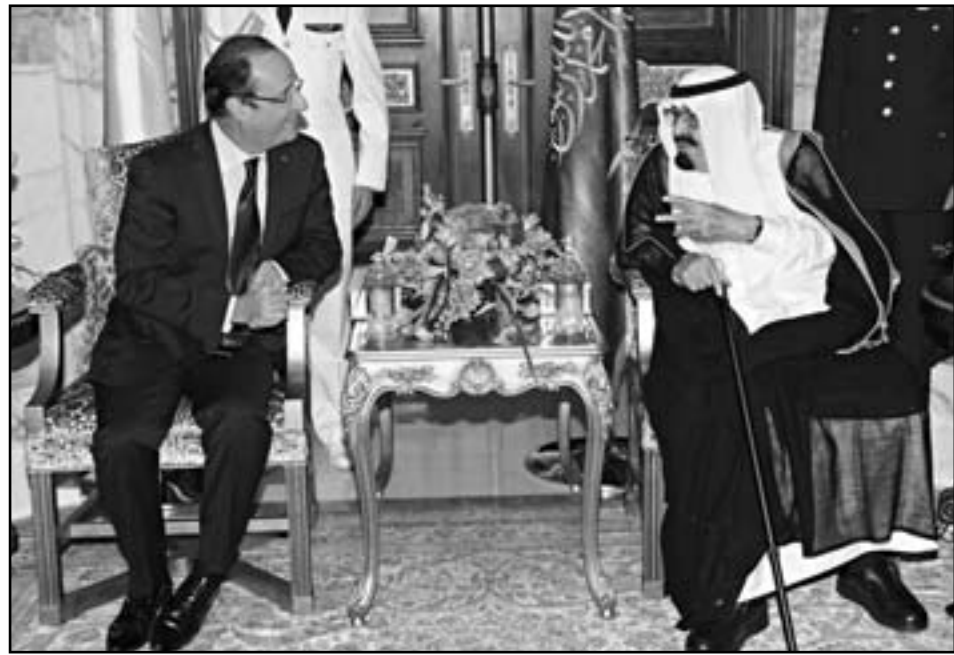
العاهل السعودي الملك عبد الله بن عبد العزيز خلال لقائه الرئيس الفرنسي فرانسوا أولاند

الرياض - ب.أ: وصل إلى جدة على ساحل البحر الأحمر أمس الأحد الرئيس الفرنسي فرانسوا أولاند في زيارة إلى السعودية. هي الأولى له بعد توليه السلطة في بلاده في أبريل الماضي، لإجراء محادثات مع العاهل السعودي الملك عبد الله بن عبد العزيز تتركز على الملفين السوري والإيراني. ويرافق الرئيس الفرنسي خلال زيارته للمملكة وفد وزاري رفيع المستوى يضم وزير الخارجية الفرنسي لوران فابيوس، ووزيرة الدولة للتجارة الخارجية نيكول بريك، ومستشار أولاند للدبلوماسية بول جان أوريزي، والسفير الفرنسي في الرياض برتران بيزانسون. ومن المقرر أن يقيم العاهل السعودي حفل غداء تكريما للرئيس أولاند. ويلقي الرئيس أولاند خلال الزيارة مع ولي العهد وزير الدفاع الأمير سلمان بن عبد العزيز ووزير الخارجية الأمير سعود الفيصل وعدد من كبار المسؤولين. وكان الرئيس الفرنسي قام أمس بزيارة خاطفة إلى بيروت أكد خلالها رفض بلاده لزعزعة استقرار لبنان وتصميمها على حمايته، في مواجهة «الأخطار» الناتجة عن الأزمة القائمة في سورية المجاورة. ونكرت وكالة الأنباء السعودية الرسمية «واس» السبت أن الجانبين السعودي والفرنسي سيبحثان خلال اللقاء «العلاقات الثنائية بين البلدين وسبل تعزيزها في مختلف المجالات بالإضافة للقضايا الإقليمية والدولية ذات الاهتمام المشترك». وأكد السفير الفرنسي لدى السعودية برتران بيزانسون أن هناك «تطابقا في وجهات النظر بين الرياض وباريس على ضرورة معارضة الرئيس السوري بشار الأسد السلطة إضافة إلى ذلك فإرأنا أننا نلتقي حول لبنان». وقال بيزانسون لصحيفة «الرياض» أمس إن الرئيس الفرنسي فرانسوا أولاند، سيقوم بإجراء محادثات مع العاهل السعودي الملك عبد الله بن عبد العزيز «حكيم الشرق» حول