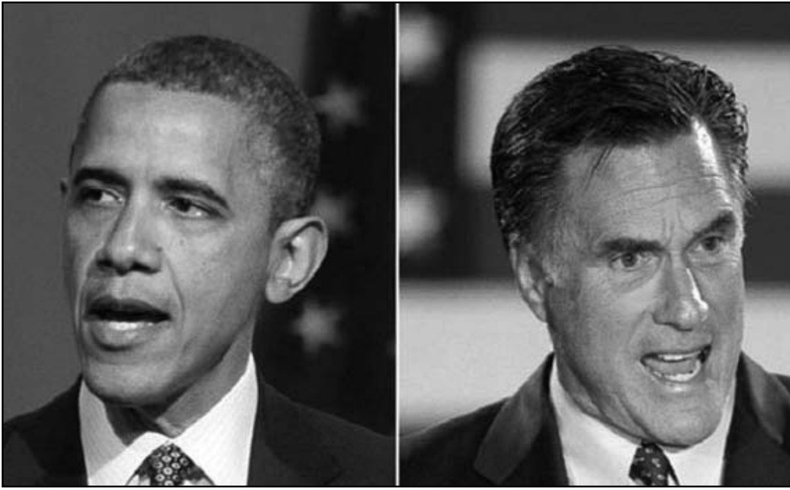
الرئيس الامريكي باراك اوباما