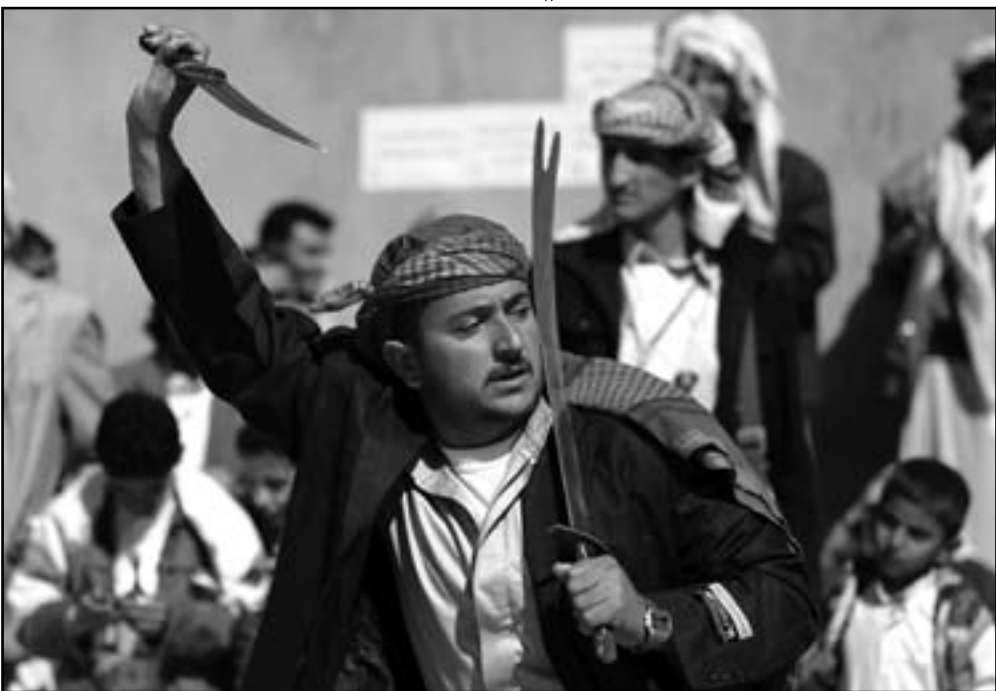
يمنيون يحتفلون بعيد الغدير السبت في صنعاء

صنعاء - يوب بي: كشف مصدر أممي يمني، امس الأحد، عن أن صفقة الأسلحة التي صادرتها سلطات ميناء عدن جنوب اليمن السبت تخص رجل أعمال وقيادي في حزب التجمع اليمني للإصلاح «الإخوان المسلمون»، وأن محاولات جرت للأفراج عن الصفقة من قبل مسؤولين في الحكومة اليمنية.