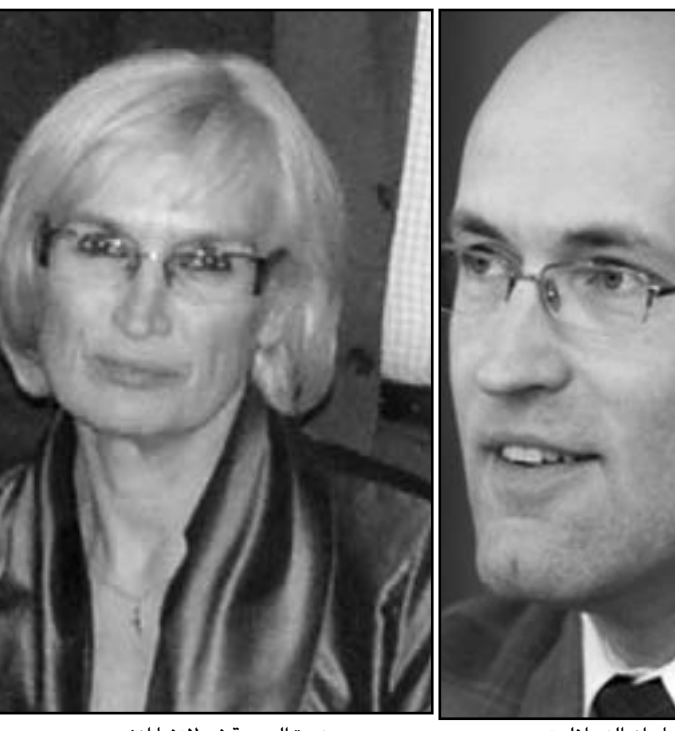
وزيرة الصحة في لاتفيا انغريد سيرسين