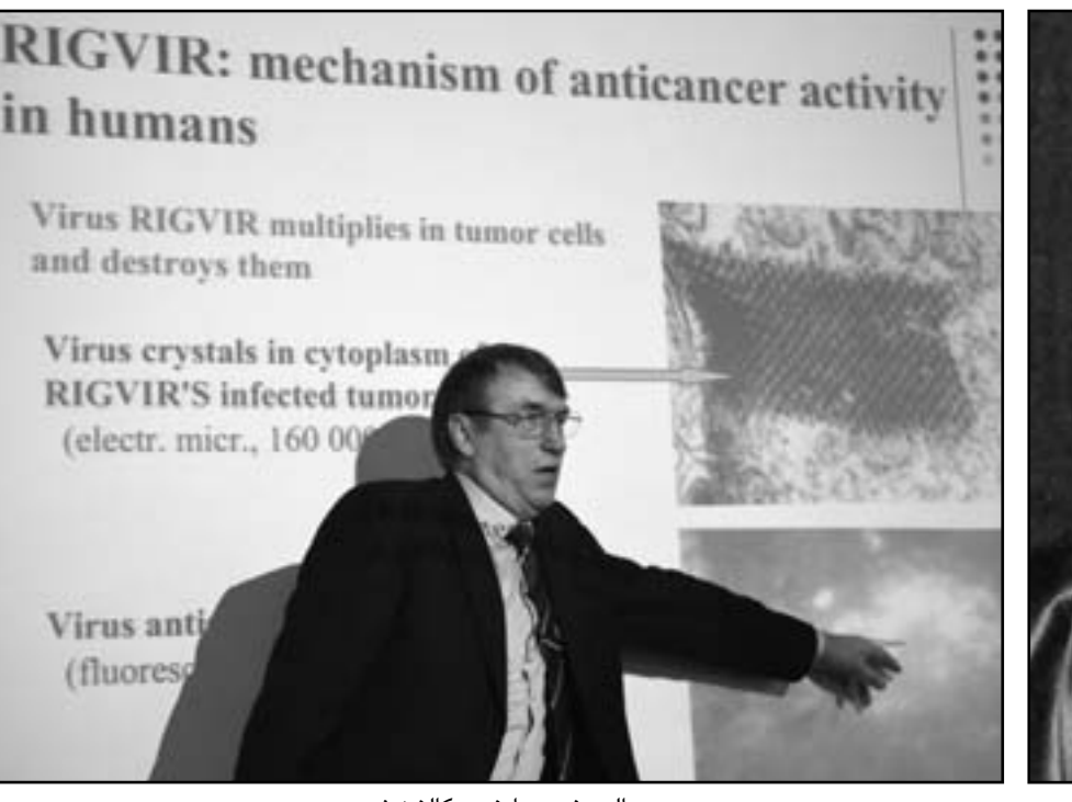
البروفيسور ايفرس كالفينيش