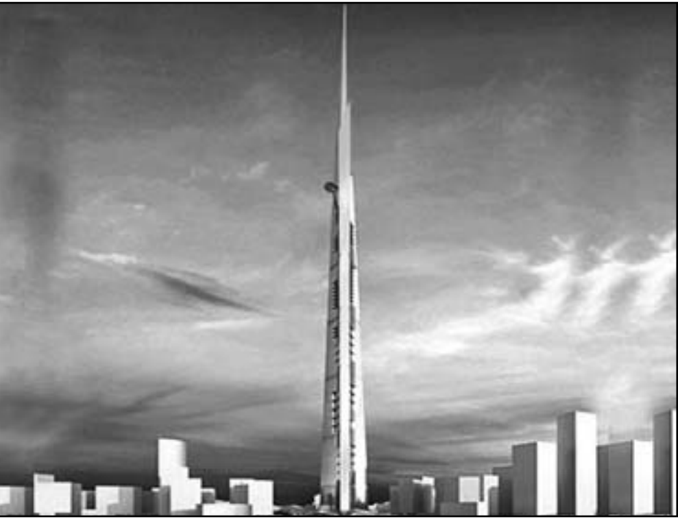
رسم تخيلي لكامل مشروع برج الملكة في جدة

■ الرياض - د: أكد الملياردير السعودي الأمير الوليد بن طلال، تحت إشراف مجموعة بن لادن المطور الرئيسي للمشروع، وأضاف البيان أن اختيار شركة باور العالمية لتنفيذ أساسات المشروع جاء باعتبارها الشركة الأولى في الترتيب العالمي للشركات المتخصصة في الأعمال الأساسية الميكنة. وأعلن الوليد بن طلال في نيسان/ أبريل 2012 عن ضخ مجموعة بن لادن السعودية المحدودة ملياراً ونصف المليار ريال مقابل حصة تتراوح بين 16.63 بالمائة في شركة جدة الاقتصادية المالكة للمشروع جدة العملاق، والذي يتضمن أعلى برج في العالم، وذلك ضمن المرحلة الأولى لإنشاء أعلى برج في العالم بمدينة جدة والذي سيكون ارتفاعه يزيد على 1000 متر. وحصلت شركة جدة الاقتصادية في شباط/ فبراير 2012 على الترخيص النهائي لإنشاء البرج، ويشمل شركاء شركة جدة الاقتصادية كلا من شركة الملكة القابضة بنسبة 33.35 بالمائة وشركة أبرار العالمية القابضة بنسبة 33.35 بالمائة. ويقع المشروع شمال مدينة جدة ويحتل مساحة 5.3 مليون متر مربع، وتبلغ الكلفة الإجمالية للمشروع مدينة الملكة نحو 75 مليار ريال سعودي (20 مليار دولار).