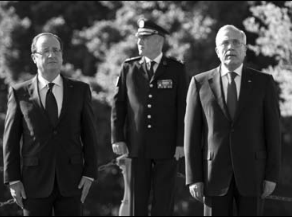
الرئيس اللبناني ميشال سليمان ونظيره الفرنسي فرانسوا هولاند يستعرضان حرس الشرف في بيروت

بلاדם بكرامة وأمان.. وأضاف: «في الموضوع السوري، قد أكدت للرئيس هولاند حرص لبنان على تجنب التداعيات السلبية للأزمة في هذا السبيل، معرباً عن عزم الدولة اللبنانية على التعاون مع القوة الدولية لتفكيك كامل المهمة المتوكله إليها بعيداً عن أي مخاطر أو تهديد». وأضاف: «بمبادرة من الرئيس السوري، وبموجب دعوة من الرئيس الفرنسي، تم عقد اجتماع بين الرئيسين في بيروت وسالمة في دمشق، وذلك في إطار من فيينا الحريري موقوف في 14 آذار من