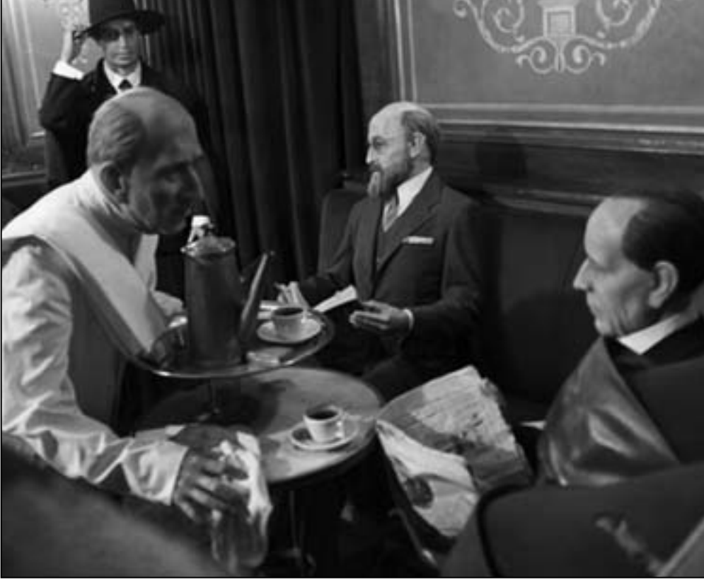
مجسمات لادباء بمتحف الشمع بمدريد تمثل إحدى مقاهي العصر الأدبية منها مقهي خيخون الشهير

وفي هذا المقهي تم تأسيس الإذاعة الوطنية الإسبانية عام 1936، ولهذا المقهي مجلة أدبية أسست منذ 1999 وهي تنشر العديد من المواضيع الأدبية والإبداعية للكتاب الإسبان خاصة المضمنين لدينة سلامانكا، والغريب أن هذا المقهي لا يؤمه فقط الأدباء، بل كان يجتمع فيه كذلك التجار الكبار وأصحاب الماشي والصناعات الكبرى، كما يرثاه الحاصون والأطباء وأساتذة كرسية جامعة سلامانكا الشهيرة التي تقدمت جامعة في إسبانيا (أسست عام 1218 م)، ولقد عاشت في معلمه الفاخر العال الإسباني ألفونسو الثالث عشر (جد العال الإسباني الحالي خوان كارلوس الأول دي بوربون)، ومن الشخصيات العالمية التي زارت هذا المقهي ذلك الرئيس الفرنسي السابق جيجي كارتر، والرئيس الفرنسي الراحل فرانسوا ميتران، ومن السياسيين الإسبان البارزين رئيس الحكومة الإسبانية السابق خوسيه لويس رودريغيس ثاباتيرو، والزعيم الشيوعي التاريخي الإسباني المتوفى مؤخرا سانتياغو كازييو.