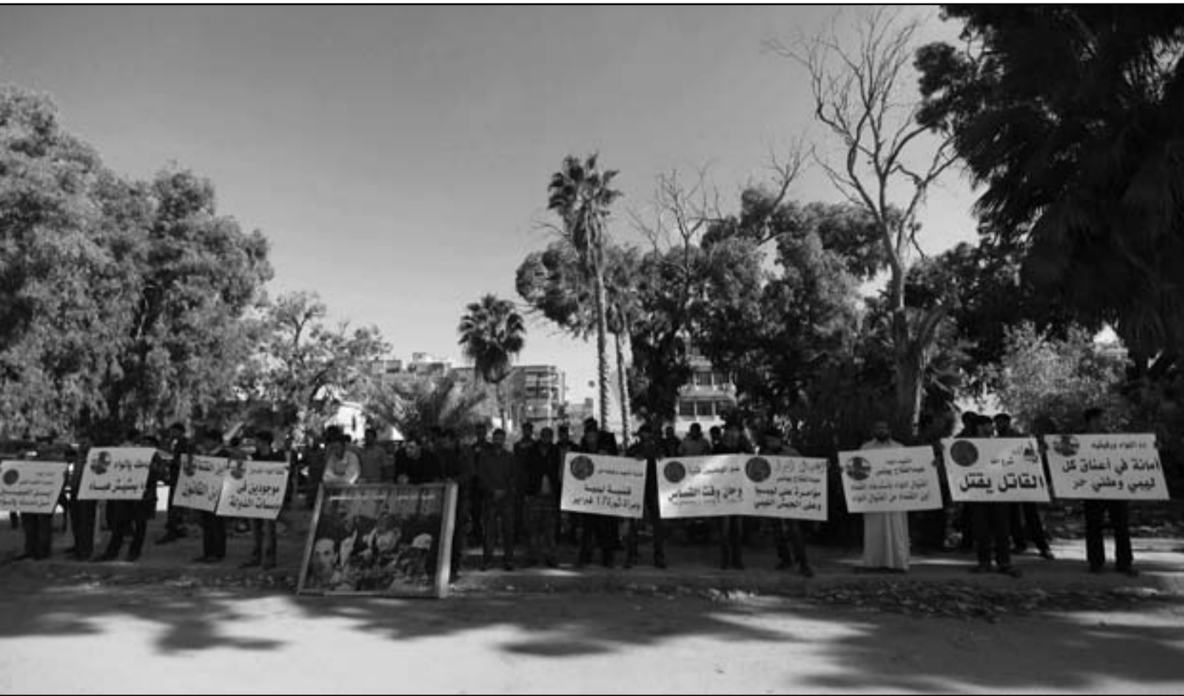
ليبيون من قبيلة عبد الفتاح يونس الذي اغتيل في بداية الثورة الليبية خلال وقعه احتجاجية في بنغازي

الاوروبي والأمم المتحدة قبل ان يسلم السلطة في اب (اغسطس) هذا العام الى رئيس المؤتمر الوطني العام المكون من 200 عضو والذي انتخب في الشهر السابق. وعاد عبد الجليل إلى بلدة البيضاء مسقط رأسه حيث شاهده السكان في الأونة الأخيرة يشترى الخبز ويمارس لعبة كرة القدم.