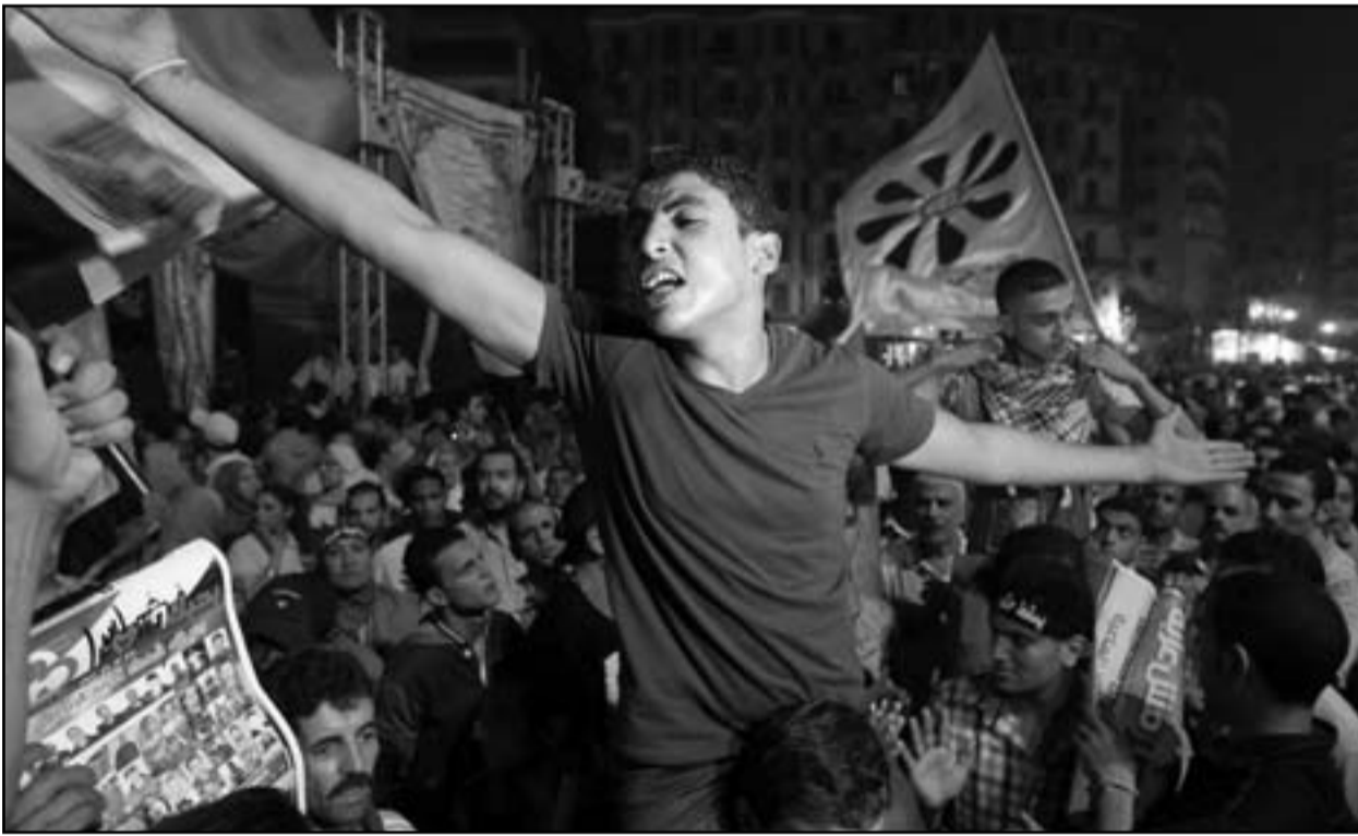
مصريون أقباط يتظاهرون بالمطالبة بحل الجمعية التأسيسية للدستور

وقال «إن الدستور الذي يلجح لاقامة دولة دينية مرفوض»، في إشارة إلى رغبة الأحزاب السلفية إلى إضافة مواد في مشروع الدستور الذي تشير إلى الالتزام ب «أحكام الشريعة الإسلامية». وأكد البابا الجديد ان «الكنيسة لن تبعد عن السياسة تحت رعايتي (...) الكنيسة مؤسسة روحية لكنها موجودة في المجتمع ولها دور اجتماعي مبني على المواطنة».