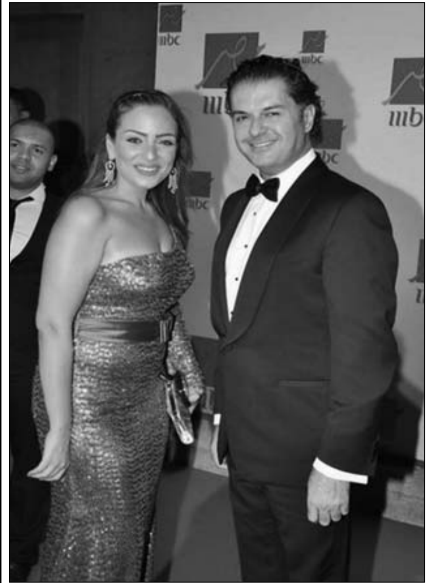
بعض النجوم خلال حفل «إم بي سي مصر»

القاهرة (د ب أ) - قبل إطلاق بثها الرسمي كشفت شبكة تليفزيون الشرق الأوسط «إم بي سي» عن الخريطة البرمجية الكاملة لأحد قنواتها التليفزيونية «إم بي سي مصر» التي ينطلق بثها في الثامنة من مساء الجمعة التاسع من تشرين الثاني/نوفمبر الجاري بتوقيت العاصمة المصرية القاهرة. وتبدأ القناة الجديدة بثها، وفقاً لبيان تلقت وكالة الأنباء الألمانية (د.ب.أ) نسخة منه بأولى الحلقات المباشرة للبرنامج العالي «ذا فويس» أو «أحلى صوت» بصيغته العربية تحت إشراف المديرين النجوم العراقي كاظم الساهر والمصرية شيرين عبد الوهاب والتونسي صابر الرباعي واللبناني عاصي الحلاني. وفي التاسعة مساءً تعرض «إم بي سي مصر» البرنامج الحواري الكوميدي المسجل «الليلة مع هاني» الذي يقدمه الممثل المصري هاني رمزي يومياً من السبت إلى الثلاثاء. وفي تمام العاشرة مساءً يرصد البرنامج اليومي المباشر «جملة مفيدة» تقديم الإعلامية منى الشاذلي كل ما يحدث في مصر بالتحليل والتفصيل والنقد على مدار ساعتين يومياً عاد الخميس والجمعة. وتقدم القناة في منتصف الليل لعشاق الرياضة وكرة القدم خاصة برنامج «سوبر ماتش» ويقدم الاحتمالات التي أقامتها مؤخراً في القاهرة لإعلان عن انطلاق القناة من داخل قاعة صلاح الدين المحلية والعربية والعالمية.