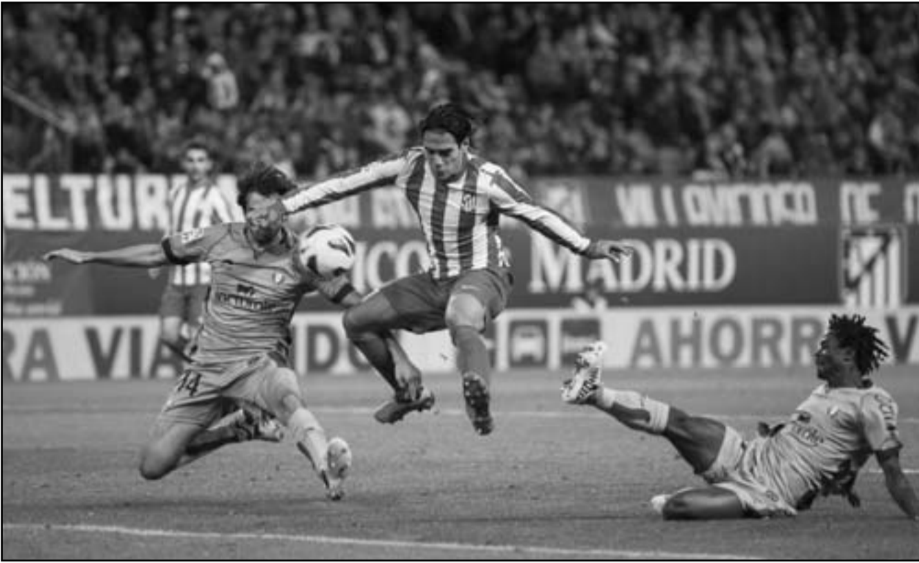
راداميل جارسيا نجم اتلتيكو مدريد (وسط) قفز في الهواء خلال المنافسة على الفوز بالكرة

ويستمر غياب جيلين جونسون وبيبي ريبينا عن صفوف ليفربول اليوم للإصابة، مع وضع رودجرز في اعتباره مباراة ليفربول القادمة بالدوري الإنكليزي أمام تشيلسي أثناء وضعه لتشكيل فريقه الخاص بمباراة اليوم. كما يتمتع نيكاسل بموقف قوي في المجموعة الرابعة، ويستطيع النادي الإنكليزي أن يحجز مكانه في الدور التالي من الدوري الأوروبي في حال فوزه على كلوب بروج البلجيكي مع عدم فوز مارينيو البرتغالي على بورود الفرنسي في مباراة المجموعة الرابعة الأخرى. كما يتمتع إنتر ميلان الإيطالي وروبيو كازان الروسي بموقف جيد في المجموعة الثامنة قبل لقاءهما مع بارتيزان لجراد الصربي ونفتشي باكو الأذاري على الترتيب، حيث