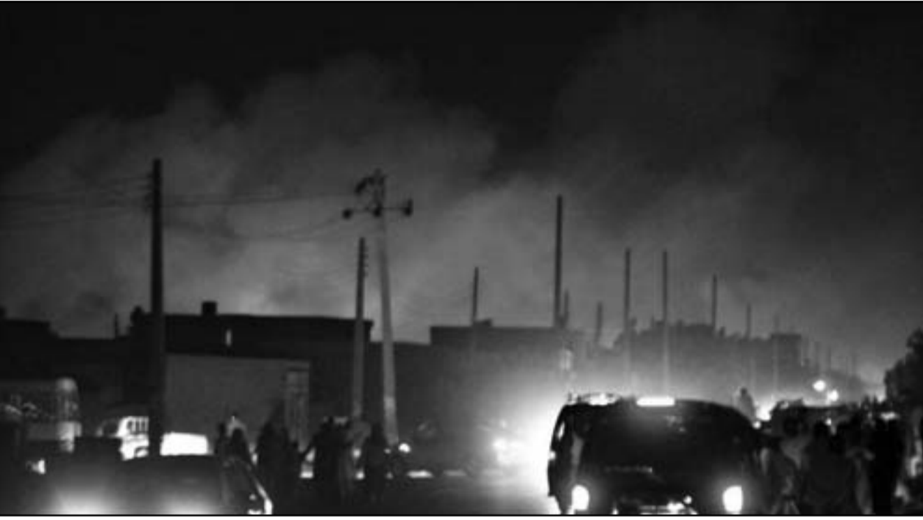
مصنع اليروك العسكري في الخرطوم الذي تعرض للصف الشهر الماضي

التهديد المتزايد للإنترنت وبعد أيام من الكشف عن أن بريطانيا تتعرض لنحو 1000 هجوم إلكتروني كل ساعة، بحيث ستوفر المشورة للشركات البريطانية بشأن كيفية الحد من الأضرار الناجمة عن الهجمات الإلكترونية التي تتعرض لها ومنعها في المستقبل. وأشارت الصحيفة إلى أن الوحدة الجديدة ستغطي مؤسسات القطاع العام، لكن من المرجح أن يتم توسيع عملها ليشمل القطاع الخاص، وستقدم خدماتها لشركات القطاعين العام والخاص. وكانت وكالة التنصت وجمع المعلومات الاستخباراتية البريطانية أطلقت مؤخراً مسابقة لتشجيع أفراد الجمهور من ذوي المهارات على تطوير الحماية ضد الهجمات الإلكترونية والتصدي للجرم عبر شبكة الإنترنت، وتجنيد الناجحين للعمل لديها، بعد أن حذرت من أن تقدم تكنولوجيا الاتصالات حذت من قدراتها على التنصت على الإرهابيين والجرميين، واعتراض المكالمات التي تستخدم تكنولوجيا الاتصالات.