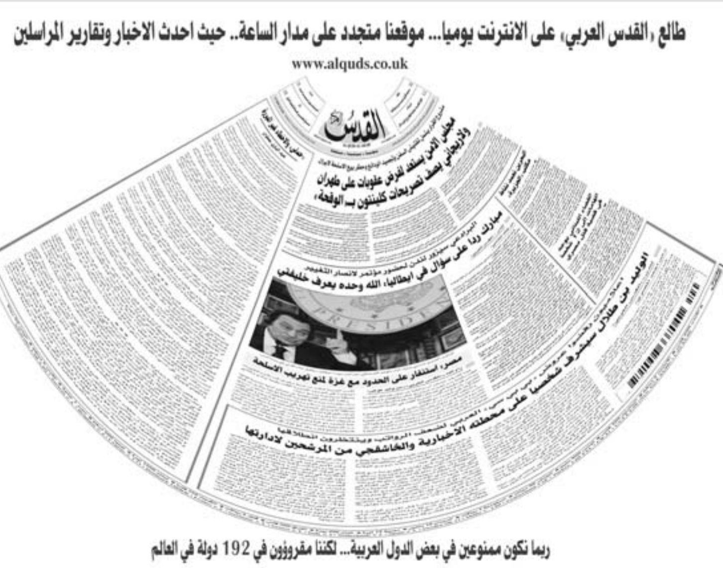
ربما تكون ممنوعين في بعض الدول العربية... موقعنا متجدد على مدار الساعة.. حيث أحدث الاخبار وتقارير المراسلين

■ الجزائر - يو بي اي: كشف الأمين العام لمنظمة الناقلين الجويين العرب، عبد الوهاب نفاع، أن قيمة حجم صناعة الطيران العربية بلغت 100 مليار دولار أميركي سنويا. ونقلت صحيفة (الشرق) الجزائرية امس الأربعاء عن نفاع قوله إن صناعة الطيران العربية حققت معدلات نمو هامة خلال العقد الأخير بلغت 274% وهي الأعلى في العالم، مشيراً إلى أن حجم صناعة الطيران العربية أسهم بـ 100 مليار دولار من الناتج الوطني السنوي للدول العربية. وأوضح أن هذه الصناعة تولف 3 ملايين شخص في العالم العربي في جميع القطاعات الإنتاجية عالية القيمة المضافة، مؤكداً أن الطيران العربي «أصبح ناقلاً عالمياً لا يمكن تجاهزه». وأشار إلى أن صناعة الطيران العربية كانت في العام 2001 تمثل ما يعادل 1% من النقل الجوي في العالم أجمع، بينما حالياً تمثل أكثر من 10% من صناعة الطيران في العالم، حيث سجلت حركة شركات الطيران العربية معدلات نمو مهولة قدرت بـ 27%