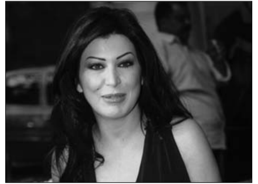
جومانا مراد وأليفيا نيوتن جون

بدأت الممثلة السورية جومانا مراد أمس الاثنين تصوير أول مشاهد دورها في الفيلم المصري الجديد «الحفلة» الذي تشارك في بطولته أحمد عز ومحمد رجب وروبي وأحمد السعدني ويخرجه أحمد علاء. ■ وقالت جومانا مراد لوكالة الأنباء الألمانية (د.ب.أ) إن الفيلم يعد «خطوة جديدة» في مشوارها السينمائي الذي ضم عددا من الأفلام الناجحة وأنها تقدم من خلاله دورا يعد مفاجئة لجمهورها حيث لم تقدم تلك النوعية من الأدوار سابقا. ■ وكشفت عن طبيعة الدور حيث قالت إن الشخصية التي تقدمها تضم الرومانسية مع الكوميديا «في سياق اجتماعي يضم علاقات متشابكة بين الأبطال الأربعة الذين تربطهم علاقات معقدة ينتج عنها الكثير من الضحك». ■ وأضافت الممثلة السورية المقيمة في القاهرة أنها تستعد حاليا لبطولة فيلم جديد بعنوان «أشرف التلت» ينتجه محمد السبكي وتدور أحداثه بالكامل في منطقة شعبية بينما لم يتم بعد تحديد اسم البطل الذي يقوم بدور «أشرف التلت» الذي يهوى استخدام الأسلحة البيضاء في الدفاع عن نفسه. ■ وقالت جومانا مراد إن المنتج محمد السبكي أبلغها أنه يجري مفاوضات مع الممثلين عمرو وسعد وخالد صالح للقيام بدور البطولة. ■ وأشارت إلى أنها تجهز أيضا لمسلسل تلفزيوني جديد رفضت الكشف عن تفاصيله التي من المقرر أن تعلن خلال مؤتمر صحفي يضم فريق العمل قبل بدء التصوير في الفترة القادمة. (أ د ب)