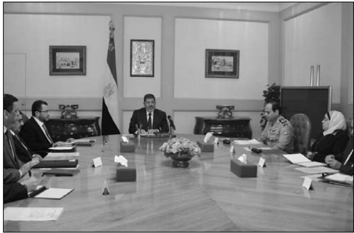
الرئيس محمد مرسي اثناء اجتماعه مع رئيس الوزراء ووزير الدفاع وعدد من مساعديه في القاهرة أمس

أكدت ان رد فعله حتى الان هو نفس رد مبارك خلال عملية «الرصاصة المصنوعة»