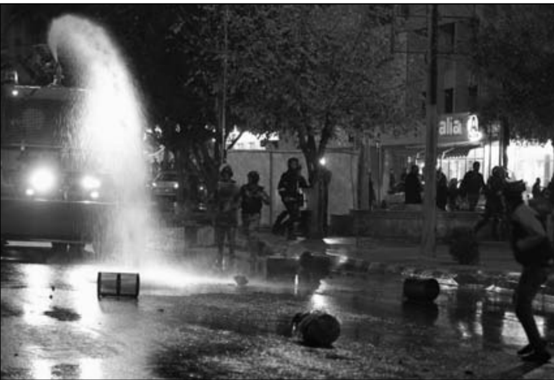
مظاهرون يغلقون الطريق العام في جبل الحسيني مساء الأربعاء

وأقدم محتجون أردنيون مساء الأربعاء على إحراق مؤسسات حكومية وخاصة في محافظتي