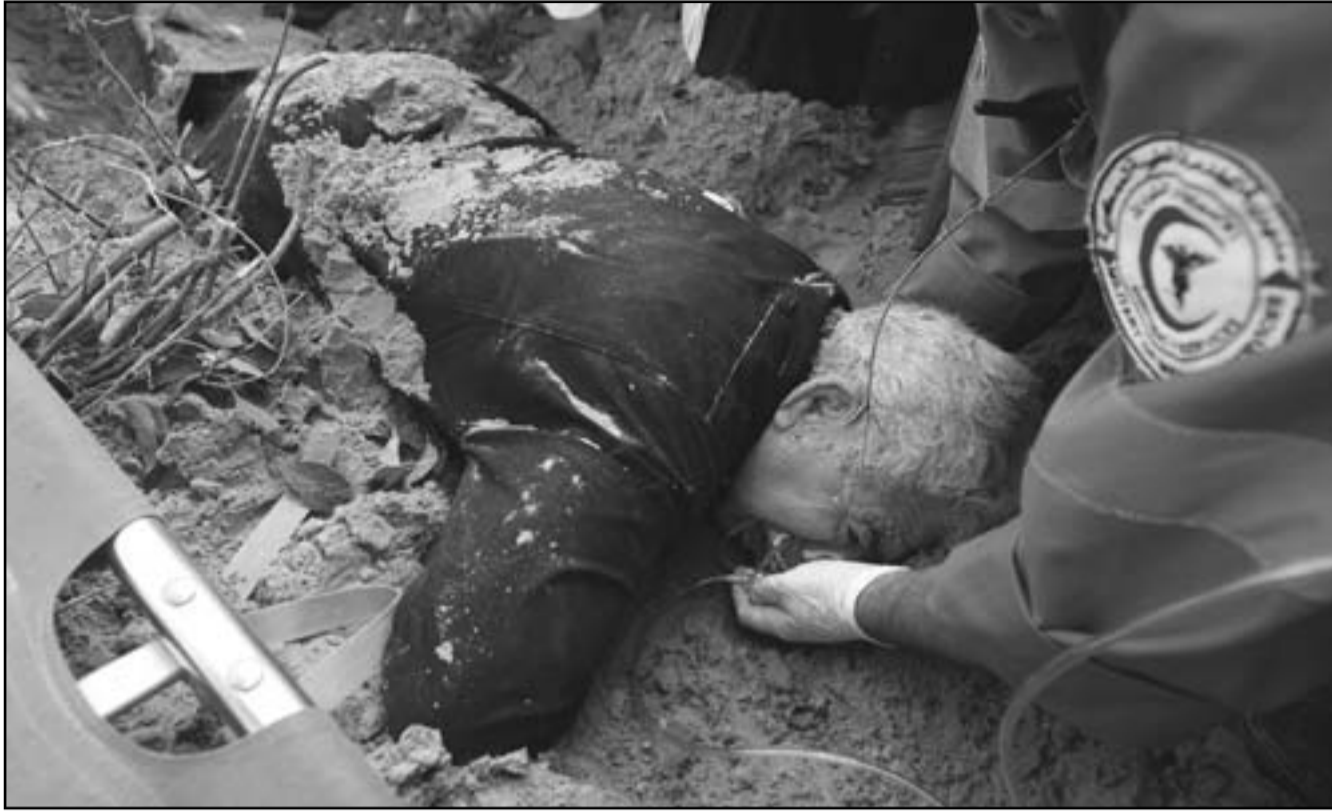
رجل اسعاف يحاول انقاذ رجل اصيب بغارة اسرائيلية على غزة أمس

الصواريخ، وقال مصدر عسكري أن سلاح الجو يركز جهوده في المرحلة الراهنة على استهداف الخلايا المسلحة في قطاع غزة المكثفة بإطلاق الكافات والصواريخ، لكنه أشار إلى أن عناصر حماس قامت بتغيير أساليب نشاطها مستخلصة العبر من عملية «الرصاصة