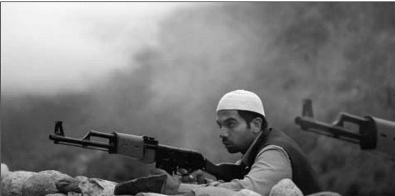
لقطة من فيلم «شبهيد» للمخرج هانسال ميها

استثنائية للتعرف على جديد صناعة السينما الهندية، ولعلها وسيلته معرفة أين وصلت هذه السينما بعد مرور 100 سنة على أول فيلم أنتجته، مشيداً في الوقت نفسه بالدور الكبير الذي لعبه الكاتب والمخرج ياش شوبرا الذي توفي هذا العام، معتبراً أن أعماله «تبقى حاضرة وملمحة للأجيال المقبلة في السينما الهندية».