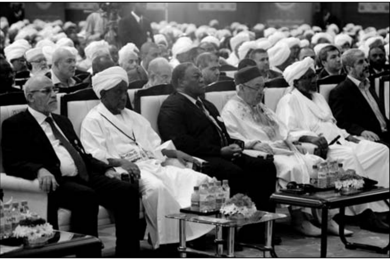
خالد مشعل والشيخ راشد الغنوشي والدكتور محمد تديع اثناء حضور مؤتمر للحركة الاسلامية في السودان امس

لكلينتون أنه «ما لم يتوقف العدوان الإسرائيلي فإن الأمور ستصاحب بصورة تخرجها عن نطاق السيطرة، كما تطالب الولايات المتحدة باستخدام ما لديها من الصلاات مع إسرائيل لوقف هذا العدوان». وأوضح المتحدث باسم الخارجية أن سفير مصر في واشنطن قد نقل الرسالة ذاتها إلى مستشار مصر القومي الأميركي توم دو نيلسون، وذلك بناء على تكليف من وزير الخارجية المصري. وكان مجلس الأمن الدولي عقد جلسة مشاورات مغلقة طارئة يطلب من مصر لبحث التصعيد الأخير في قطاع غزة وجنوب إسرائيل. وقامت السلطات المصرية امس أيضا بفتح معبر رفح البري الحدودي مع قطاع غزة بشكل دائم وعلى مدار 24 ساعة، استعدادا لاستقبال أي جرحى فلسطينيين جراء الهجوم الإسرائيلي على القطاع.