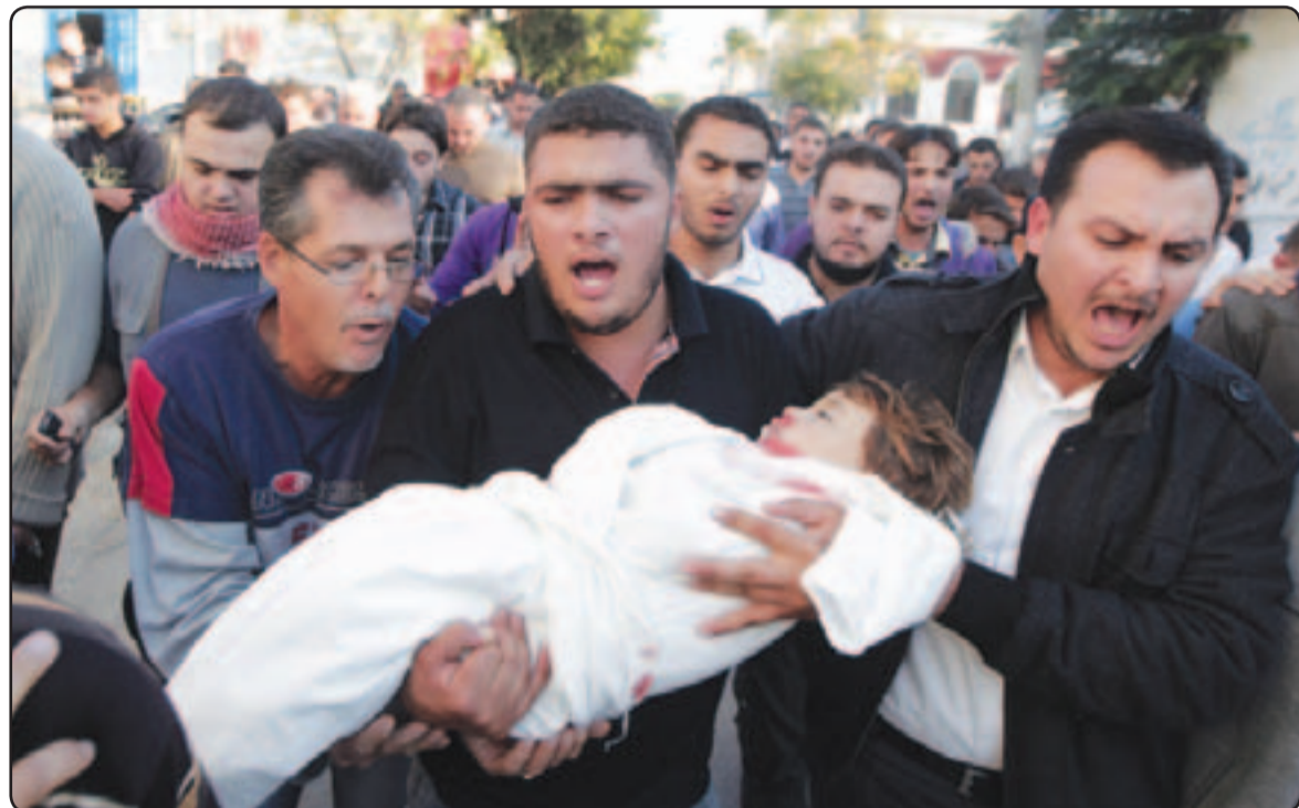
فلسطينيون يشيعون طفلا استشهد بغارة اسراييلية على القطاع