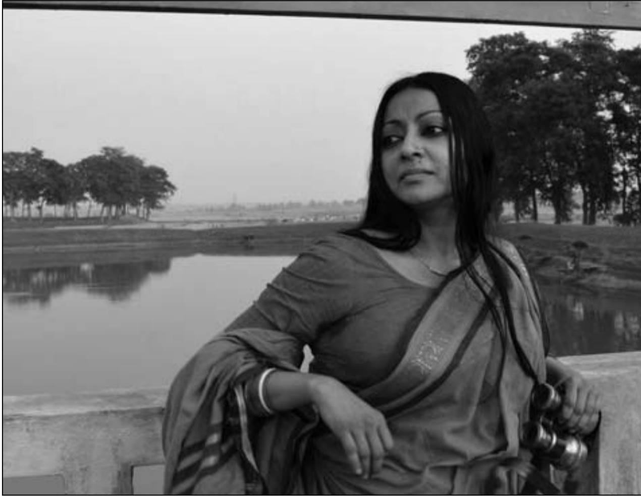
لقطة من فيلم «رباعيات» للمخرج بودهادب داسغوبت