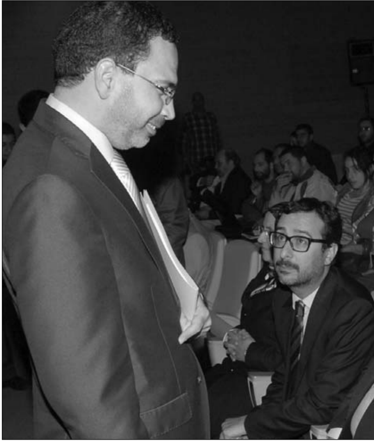
وزير الاتصال الخلفي ومدير دوزيم الشيخ

كما سجل المجلس النقابي استمرار تدرج أوضاع المستخدمين المتعاقدين «les freelances» والعاملين عن طريق المقاولين من الباطن «les prestataires» (intérimaires)، حيث ججزت الإدارة حتى اليوم، عن تسوية