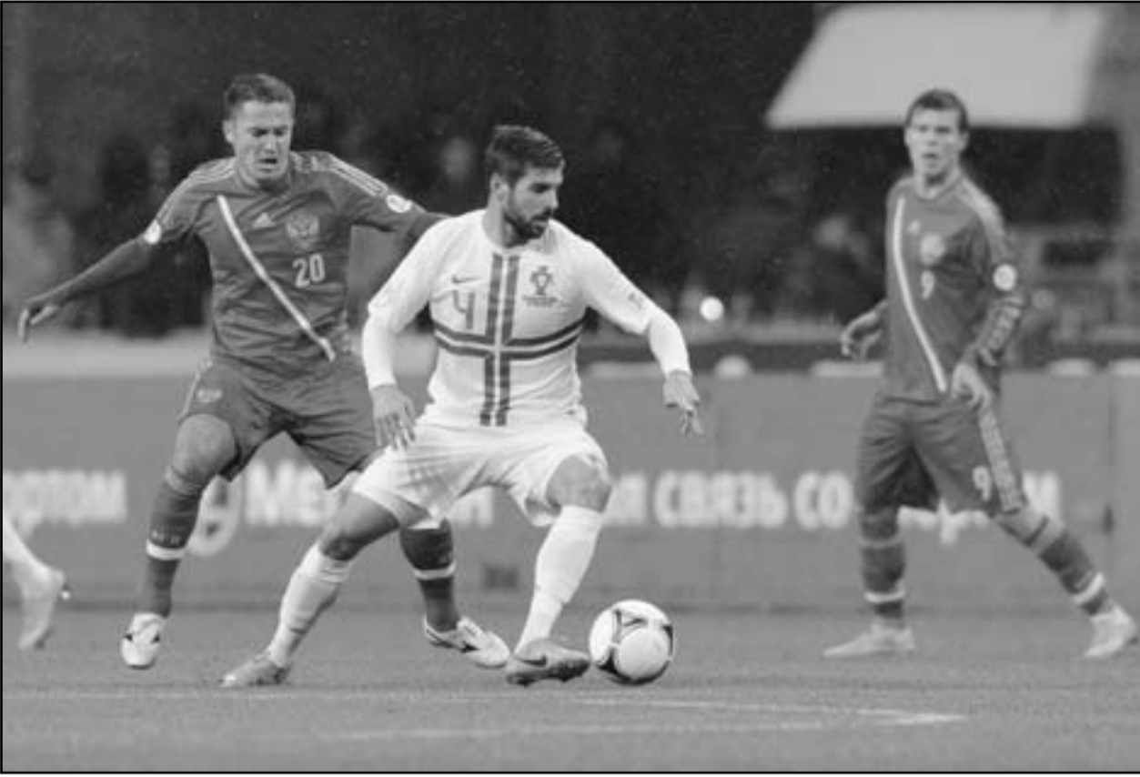
نجم منتخب البرتغال ميغيل فسو (وسط) يحاول الانفراد بالكرة في تصفيات كأس العالم 2014 في لقاء فريقه مع منتخب روسيا

■ لشبونة - (رويترز): قال باولو بينتو مدرب منتخب البرتغال الأول لكرة القدم إنه يتعين على الأندية عدم التدخل في شؤون المنتخب بعدما انتقد رئيس بورتو قرار الاتحاد بلعب مباراة ودية دولية في الجابون في وقت سابق من الأسبوع الجاري وقبل أيام قليلة من جولة مباريات في دوري أبطال أوروبا. وقال بينتو في تصريحات صحفية الجمعة «لا تدخل في عمل رؤساء الأندية ومن ثم فلا أقبل أي تدخل في عملي سواء جاء من رئيس بورتو أو من غيره».