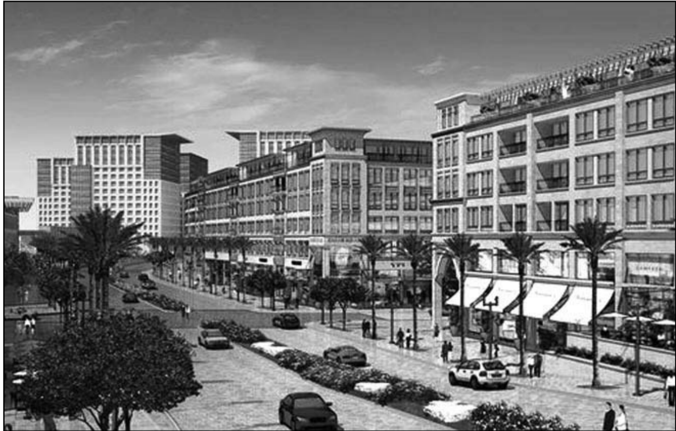
رسم بالكمبيوتر لجانب من مشروع كايرو غيت في إحدى ضواحي القاهرة

غير أن هناك بوادر قوة تظهر في قطاعات استثمارية أخرى في مصر، وقالت شركة جونز لانغ لاسال للاستشارات إن «هؤلاء المستثمرين يدركون حقيقة أن الفرص في المنطقة في الأجل المتوسط تبقى مواتية جدا».