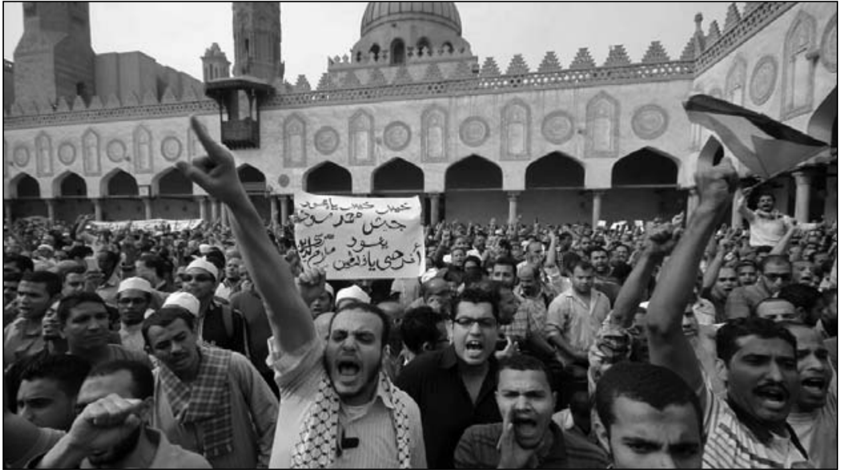
الاف المسلمين في الجامع الازهر يرفعون العلم الفلسطيني اثناء مظاهرة بعد صلاة الجمعة

وحذّر الطيب من أن «العدوان» الإسرائيلي على غزة لا يستهدف الفلسطينيين والمصريين وحدهم «بل يسعى إلى استئصال الفلسطينيين جميعا في الضفة الغربية وقطاع غزة»، مطالبا الفلسطينيين بالتوحد والتكاتف وأن يكونوا على قلب رجل واحد «في مواجهة الصهاينة (الإسرائيليين)».