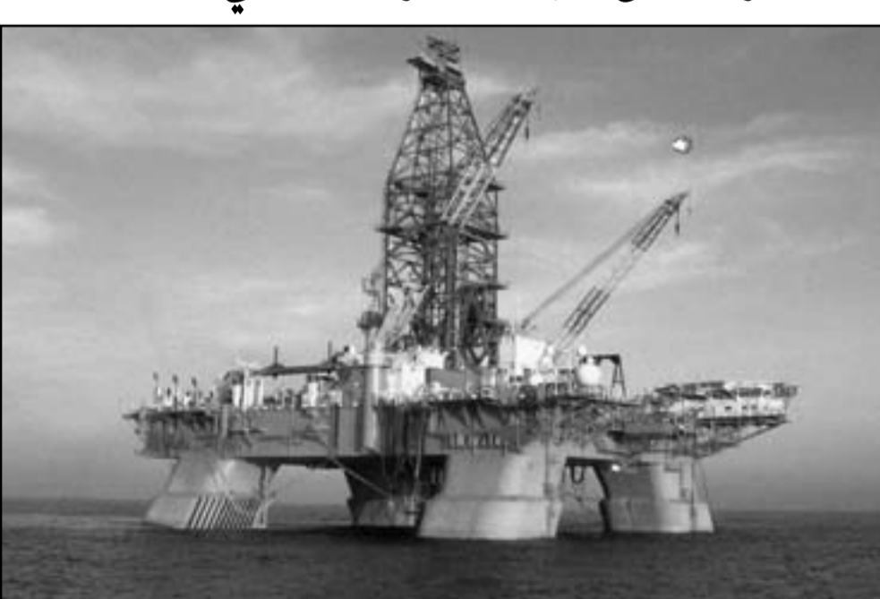
منصة ديب ووتر هورايزون

■ هيوستون/واشنطن - رويترز: وافقت شركة بريتش بتروليم (بي بي) النفطية البريطانية على دفع غرامات قدرها 4.5 مليار دولار والإقرار بالحفر ديب ووتر هورايزون التي تسببت في أسوأ تسرب نفطي بحري في تاريخ الولايات المتحدة. وقالت (بي بي) يوم الخميس إن التسوية تتضمن غرامة جنائية قدرها 1.256 مليار دولار هي الأكبر من نوعها في التاريخ الأمريكي. ويتضمن الاتفاق أيضاً تسوية مع لجنة البورصات والاوراق المالية الأمريكية وتعويضات مالية ستدفع إلى المؤسسة الوطنية للأسماك والحياة البرية والأكاديمية الوطنية للعلوم. وقال محللون إن الاتفاق سيسمح للشركة بالتركيز مجدداً على إنتاج النفط رغم أن عضواً واحداً على الأقل في الكونغرس تساعل عما إذا كان الاتفاق سيضر بقرص ولايات أمريكية في الحصول على تعويضات. وأودى الانفجار الذي وقع في نيسان/ابريل 2010 في خليج المكسيك ديب ووتر هورايزون في منحة التكسيك بحياة 11 عاملاً. وتسرب 4.9 مليون برميل من النفط من بئر ماكوندو إلى مياه الخليج على مدى 87 يوماً مما أحدث تلوثاً في السواحل الأمريكية من تكساس إلى فلوريدا. وقالت الشركة النفطية إنها ستقر بالذنب في 11 اتهاماً بالمسؤولية الجنائية عن مقتل العالمين واتهام واحد بتعلق بإعاقة عمل الكونغرس ووجنتين. وقال يوب بولدي الرئيس التنفيذي للشركة البريطانية بكلتا في بي بي شعر بالأسفل للخصائر في الأرواح بسبب حادث ديب ووتر هورايزون إلى