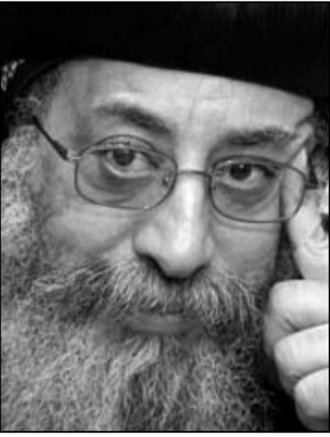
البابا تواضروس الثاني

■ القاهرة - اف ب: تنتظر تواضروس الثاني البابا الجديد لأقباط مصر تحديات جسام بالنسبة للأقباط سواء داخل الكنيسة مثل الملفات المتعلقة بإعادة ترتيب الكنيسة نفسها وطريقة إدارتها أو خارجها مثل تلك المتعلقة بوضع الأقباط في مصر ولا سيما بعد وصول الاسلاميين الى الحكم.