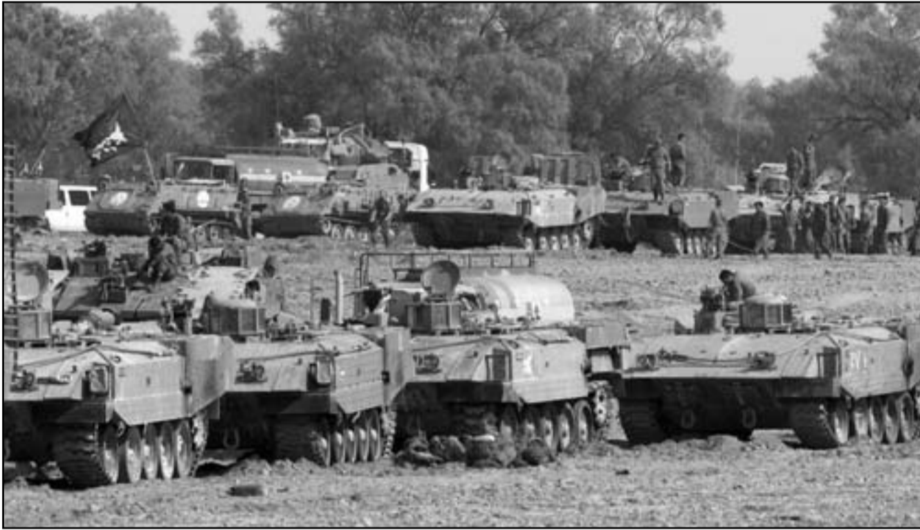
ديابات اسرائيلية تحاصر قطاع غزة

ان حكومة بلاده تجري اتصالات مع مصر على مستوى السفارات. ودعا المسؤول الكبير في حزب العمل بيايم بن العياز حكومة بلاده لحواسلة العملية الفلسطينية في القطاع ان قواعد الهدنة قد تغيرت، لكن رئيسة حزب ميرتس زهافا ليفيدور ليبرمان ان بلاده لن تقبل بوقف إطلاق النار لا يضمن الهدوء ووقف عمليات إطلاق الصواريخ، لكن في ذات الوقت نكثت الإذاعة الإسرائيلية عن مصادر سياسية قولها