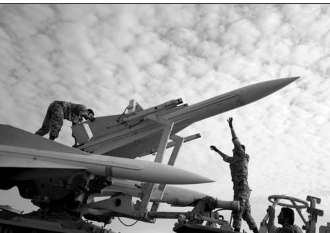
جنود إيرانيون يجهزون صواريخ لإطلاقها في احد التدريبات على إطلاق صواريخ بعيد المدى