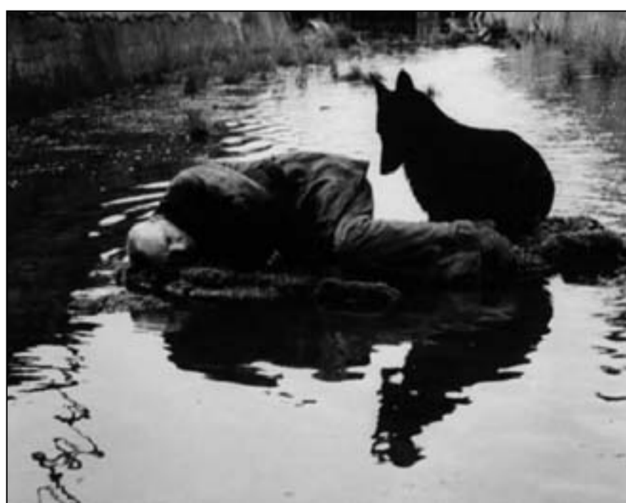
لقطة من فيلم «القتلة» لتاركوفسكي

القاهرة - (رويترز) - في قراءة تحليلية مقارنة بين قصة «القتلة» للروائي الأمريكي أرنست هيمينغواي والفيلم الروسي المأخوذ عنها للمخرج الروسي أندريه تاركوفسكي تخلص الباحثة المصرية أمل الجمل إلى أن تاركوفسكي - بفيلمه الذي أخرجه في الرابعة والعشرين بالاشتراك - مبدع استثنائي في نمده.