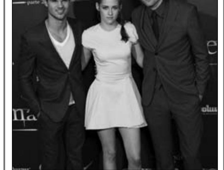
روبرت باتينسون، كريستين ستورتار وتايلو لوتنر