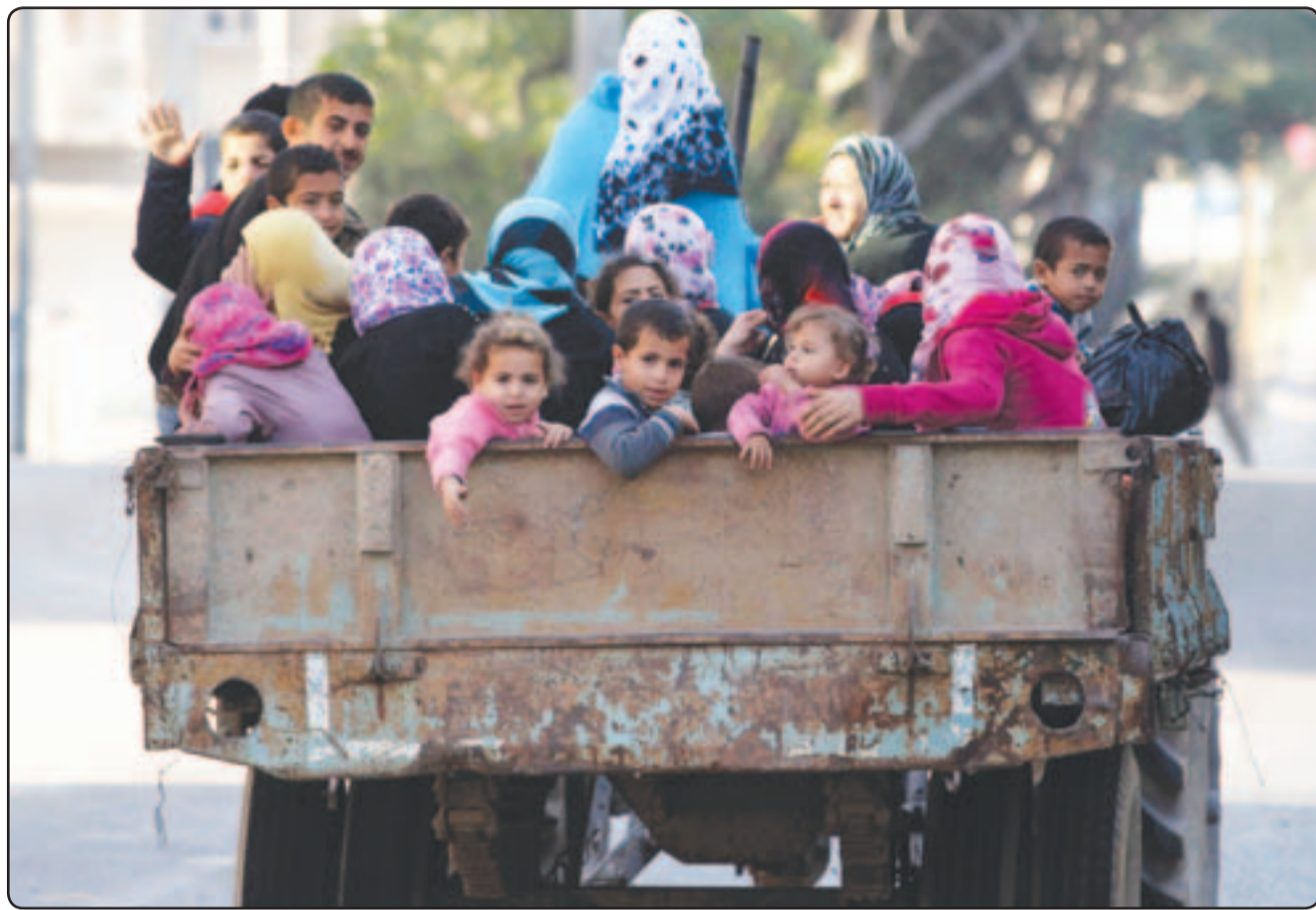
عائلات غزية تغادر مناطق استهدفتها الغارات الاسرائيلية