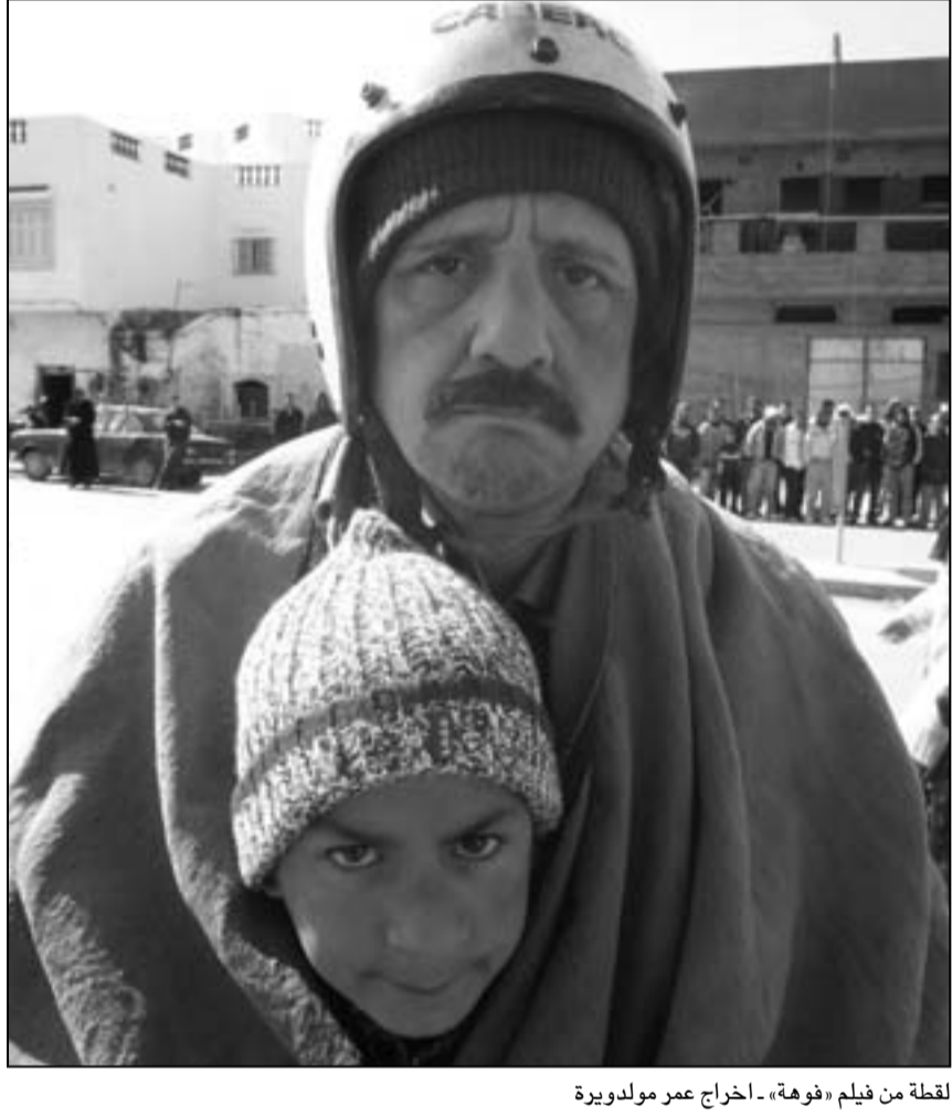
لقطة من فيلم «فوهة» - إخراج عمر مولديرة

خلال عرضه العالمي الأول، وقصة نايدا التي تصل إلى قاعة أن الأحلام لا تتحقق إلا عند مفارقة الواقع، هذا ما ستقوله تقول لنا نايدا التي لم تتجاوز العشرين من عمرها، وهي تهجر قريتها لتلاحق حلمها الحرام، فإذا بها تخطو إلى عالم موسيقي خيالي، وترى سيرة حياتها مسرعة في ثلاثة أجزاء، وتبقى في أرض الواقع مع المخرجة في بوحة، الفرنسية المولد و«نذبات فوق صوتية» الذي تتبع من خلاله ختى