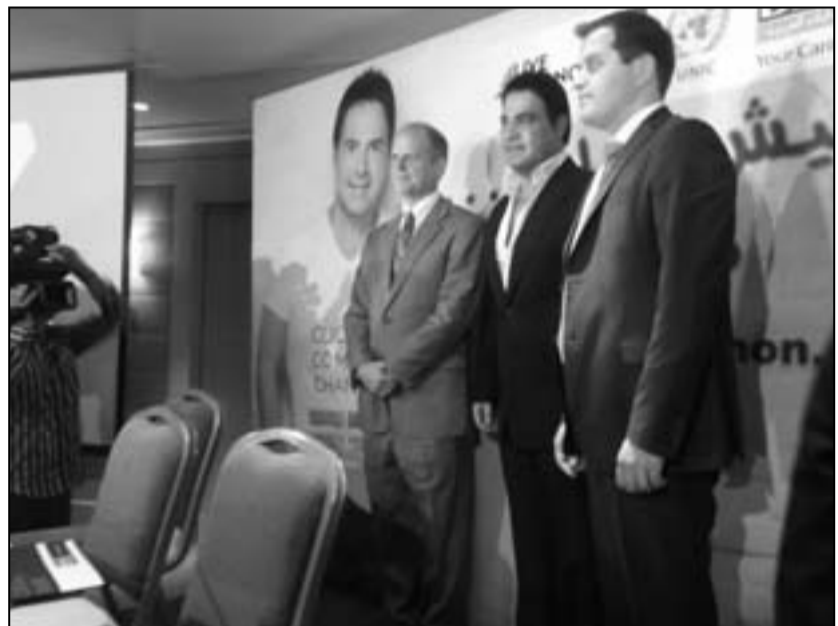
عاصي الحلاني (وسط)