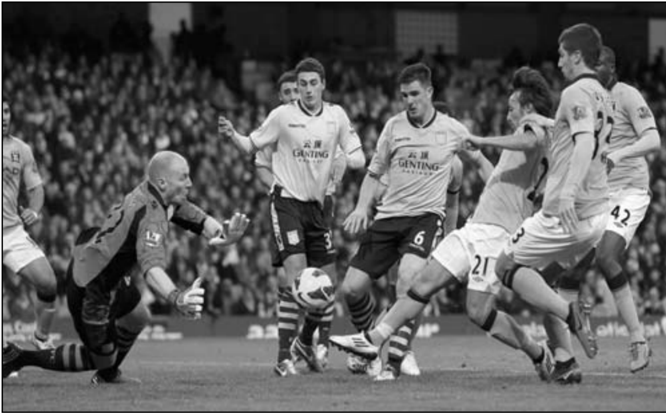
ديفيد سيلفا نجم مانشستر سيتي (الثالث الى اليسار) يسجل هدفا في مرمى استون فيلا في الدوري الانكليزي

■ الرياض - (بنا): يسعى الهلال لمواجهة مطاردة الفتح المتصدر عندما يستضيف الريعاء على استاد الملك فهد الدولي في الرياض الاهلي الجريح في قمة مباريات المرحلة الثالثة عشرة من الدوري السعودي في كرة القدم. ويبلغ غدا أيضا الفتح مع الاتفاق والوحدة مع التعاون، وتستكمل المرحلة الخمسين فيلتقي الاتحاد مع الشعلة، والرائد مع نجران، وهدر مع الشباب والفيصلي مع النصر. ويتصدر الفتح الترتيب برصيد 29 نقطة، مقابل 26 نقطة للهلال و23 للشباب. يدخل الهلال المباراة متسلحا بمعنويات لاغية العالية بعد ان حولوا تأخرهم أمام التعاون بهدف الى فوز صريح بأربعة أهداف، والنتيجة تؤكد نجاحته الهجومية ان يعتبر صاحب أقوى خط هجوم في الدوري حتى الان ولدي لم يافت بعد. وحتى الآن سجل بنزيمة ستة أهداف في الموسم الحالي وصنع ثمانية أهداف لزملائه، وأحرز بنزيمة هدفا خلال الفوز على مانشستر سيتي 2/3 في أيلول/سبتمبر الماضي. وقال بنزيمة عقب الفوز على بيلباو: «الشيء الأكثر أهمية هو عودة النشاط المعتاد لريال مدريد في الموسم الماضي، تحركاتنا كانت جيدة وتميراتنا كانت مثققة». ولدى سؤاله حول ما إذا كان قدم أفضل أداء له مع ريال مدريد أمام بيلباو، أوضح بنزيمة «لقد استمتعت حقاً بنفسي، ولكنني أعتقد أن أفضل ما لدي لم يافت بعد». وهو ما يحمل رسالة تحذير واضحة لمانشستر سيتي فيما يتعلق بحلم التأهل لدور الستة عشر لدوري الأبطال. (د ب أ)