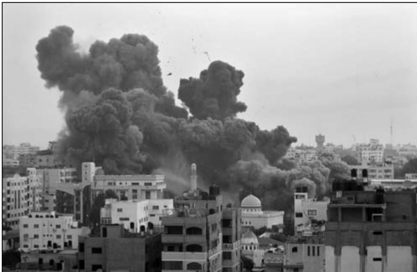
معركة اسرائيل مع حماس تعرض كرسى ملك الاردن للاهتزاز

من اصل 80)، فانهم يريدون أن يضمنوا انفسهم هذه المرة انجازا مثريا للانطباع. في حزيران من هذا العام أقر البرلمان قانون انتخابات جديد، بموجب 17 مرشحا من أصل 140 عضوا في البرلمان يفترض ان ينتخبوا