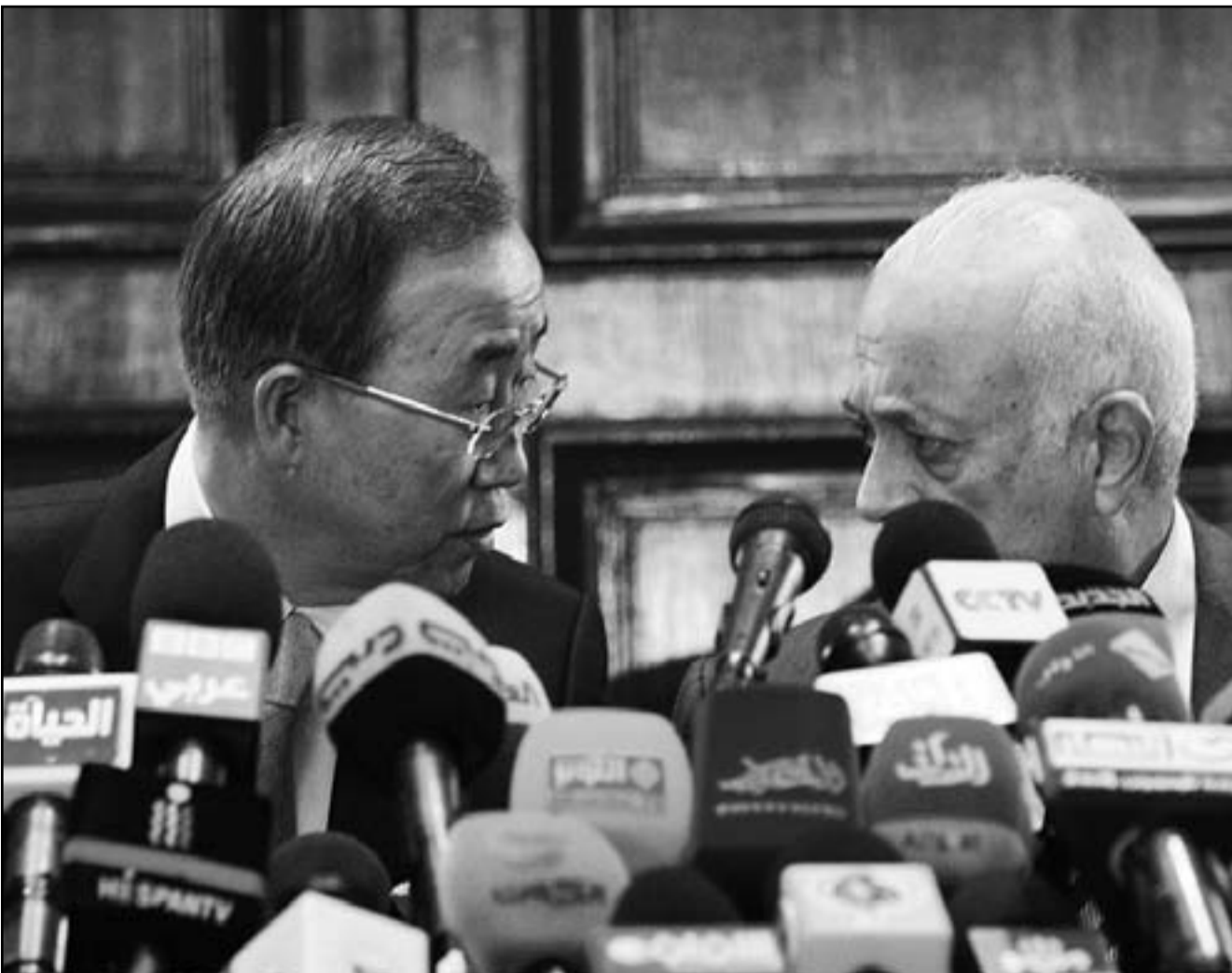
الأمين العام للجامعة العربية نبيل العربي والأمين العام للأمم المتحدة بان كي مون خلال مؤتمرهما الصحفي في القاهرة

من جانبهم، قال عدد من مقيمي الدعوى أن جماعة الإخوان المسلمين لم تعدل أوضاعها وفقا للقانون المنظم للجمعيات الأهلية والذي أوجب على جميع الجمعيات ومنها جماعة الإخوان المسلمين أن تعدل أوضاعها وفقا لأحكامه، كما ألزم كل جماعة تقوم بأى نشاط من أنشطة الجمعيات أن