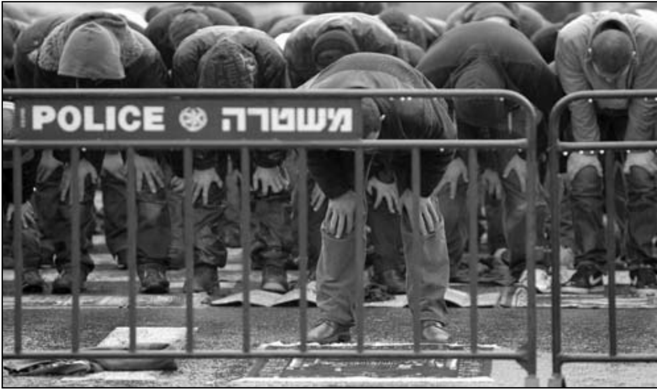
فلسطينيون يصلون خارج أسوار القدس بعد ان منعتهم اسرائيل من الوصول الى الاقصى لاداء صلاة الجمعة