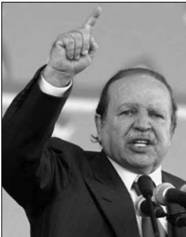
الرئيس الجزائري عبد العزيز بوتفليقة

عندما وصل الرئيس بوتفليقة إلى الحكم سنة 1999 قرر أن يفتح عدة ورشات إصلاح، بما في ذلك إصلاح قطاعي التعليم والقضاء، وقد تم تشكيل لجان لهذا الغرض، منها لجنة بن علي بن زاغو لإصلاح التعليم، والتي كانت بوتفليقة في نيسان (أبريل) 2011، وتم تجسيدها بمراجعة مجموعة من القوانين التي تنظم الحياة السياسية، قرر الرئيس بنزاغو أن يقوم بقراءة ثانية لها، أي مراجعتها وإصلاح الإصلاحات في إطار سياسة «للملف در».