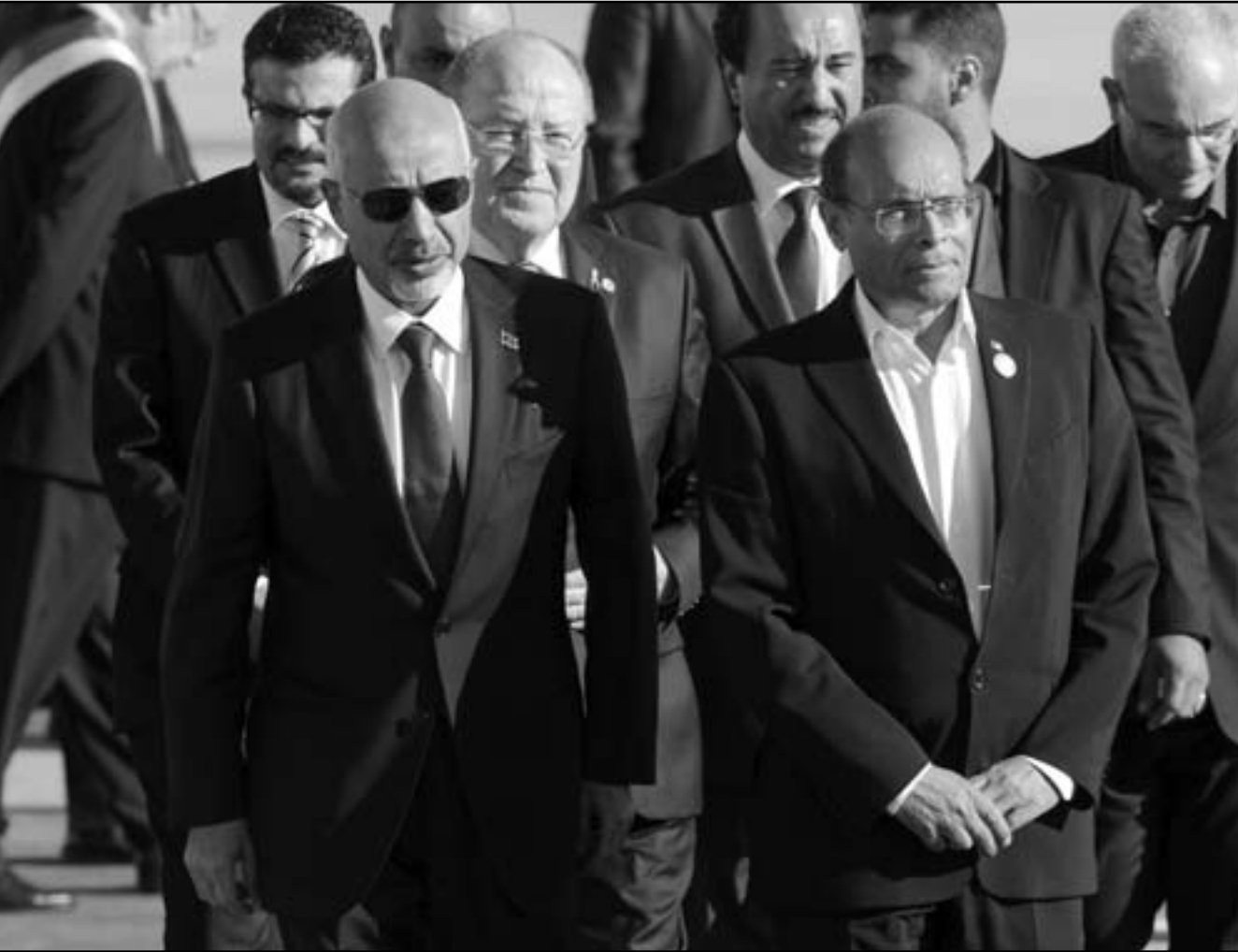
الرئيس التونسي منصف المرزوقي خلال لقائه رئيس المجلس الوطني الليبي محمد المقرفي في تونس

كما دعته أيضا إلى حماية وضمان الحريات الأساسية وحقوق الإنسان العالمية وفقا لإلتزامات تونس والعمل على إرساء الديمقراطية والتعددية.