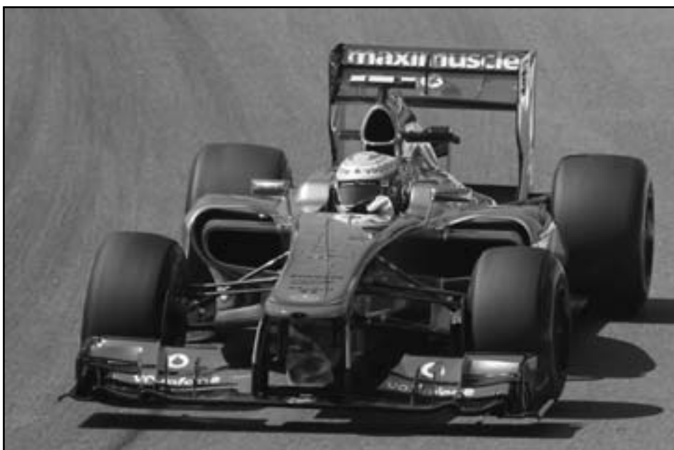
لويس هاميلتون سائق مكلارين في التجارب الحرة الأولى لسباق البرازيل

ساو باولو - (رويترز): سجل البريطاني لويس هاميلتون سائق مكلارين أفضل زمن في التجارب الحرة الأولى لسباق البرازيل الجولة الختامية لموسم بطولة العالم لسباقات فورمولا 1 للسيارات الجمعة وهو السباق الأخير له مع الفريق. وكان هاميلتون بطل العالم عام 2008 قد أحرز اللقب على حلبة انترلاجوس ووصل إلى البرازيل بعد فوزه بسباق جائزة الولايات المتحدة الكبرى في تكساس يوم الأحد الماضي. وسجل هاميلتون أسرع لفة على الحلبة بعدما قطع مسافتها في دقيقة واحدة و14.134 ثانية. وحل الألماني سباستيان فيتل بطل العالم ومتصدر البطولة الذي يقترن من اللقب الثالث على التوالي في المركز الثاني بفارق 0.009 ثانية عن هاميلتون. وجاء الإسباني فرناندو ألونسو سائق