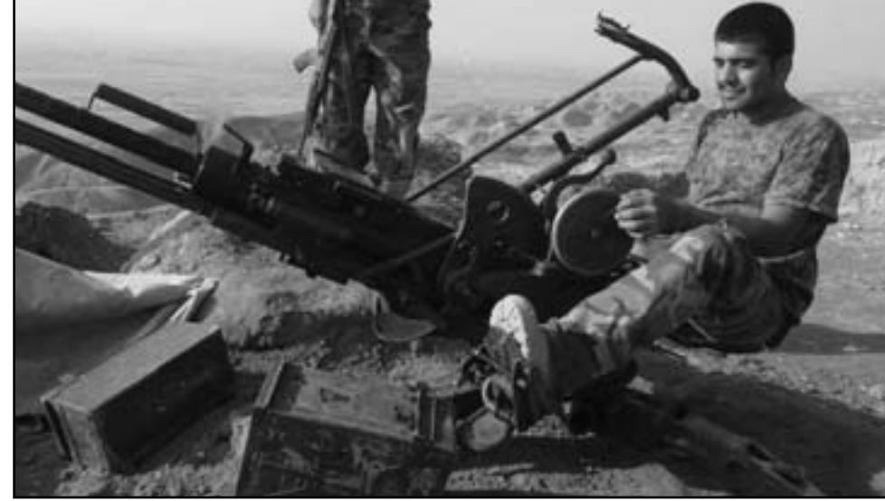
مقاتلان من البشمركة بالقرب من ديالى

وقال «رغم جهود تهدئة الموقف دخلت قوات البشمركة بقاذفات الصواريخ والمدفعية خنقن»، كما دخل آخرون يرتدون الملابس المدنية خانقين وكركوك.