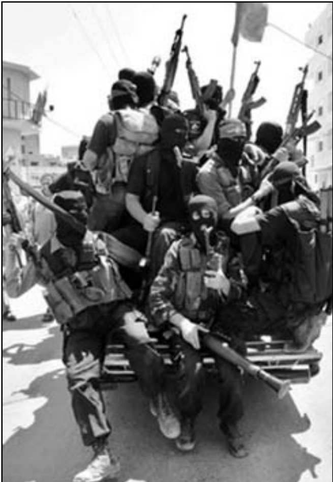
قذرة حماس على اطلاق الصواريخ فاقت التقديرات الاسرائيلية

بالنسبة للجهة الاسرائيلية الداخلية، ونسب هذه الحرب الى القبة الحديدية، البها والى الغرر الأمنة. كانت قذرات هاتين السيلتين مندشة كمع كل الاحترام كان يوجد شيء ما اشكالي ولا يلائم كثيرا التراث الاسرائيلي في ايمان وسائل الدفاع. نجت حماس في جعل حاريتها باهظة الكلفة جدا من جهة مالية ربما ابهظ من ان تُطاق. فالقراينة محدودة.