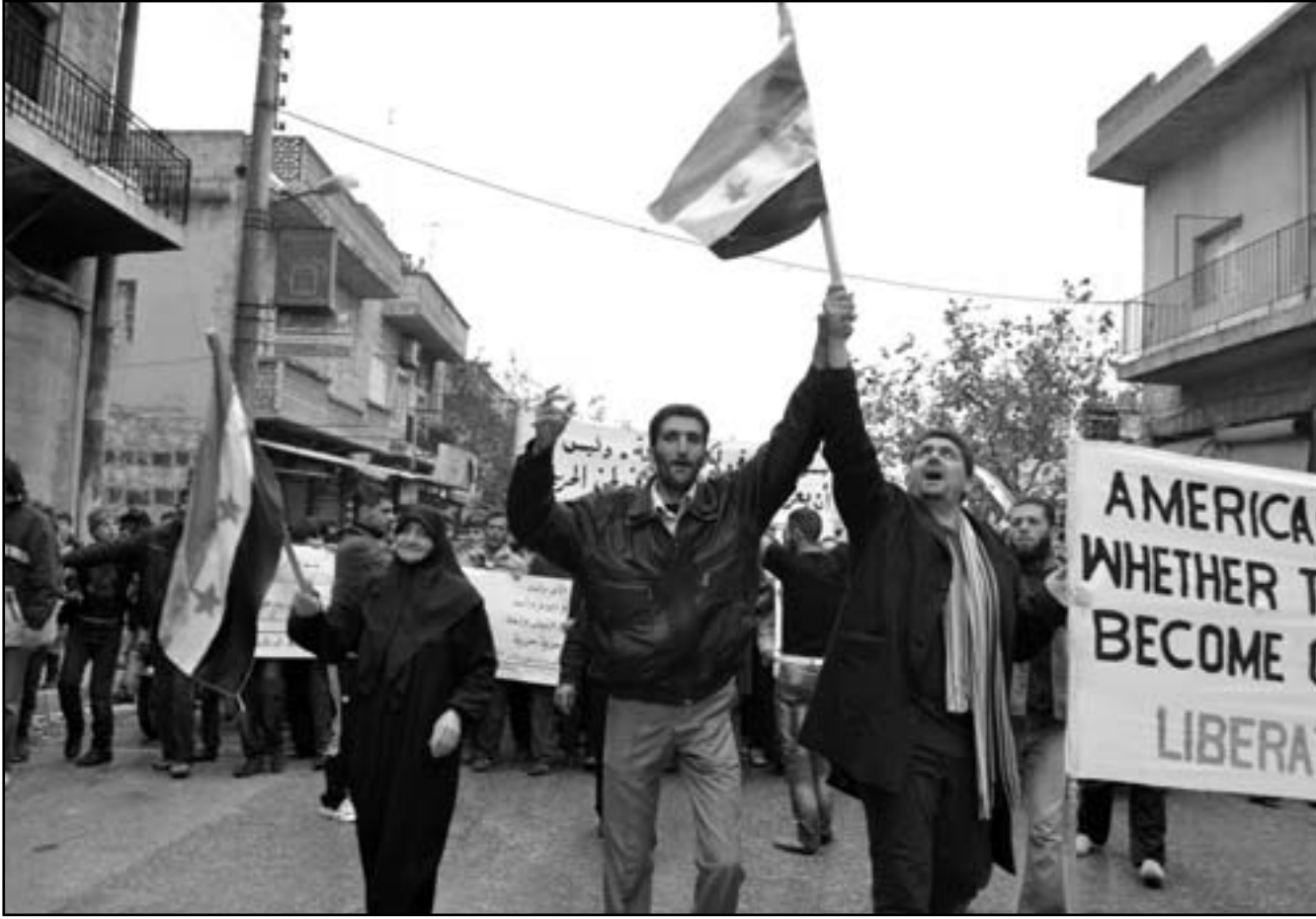
سوريون يتظاهرون في كفرنبل ضد النظام السوري

المعارضة، والتي يرأسها الكاتب المرموق جلال صايد العظم، قوات النظام بقتل الرويلي. وقالت الرابطة في بيان «أعدمت