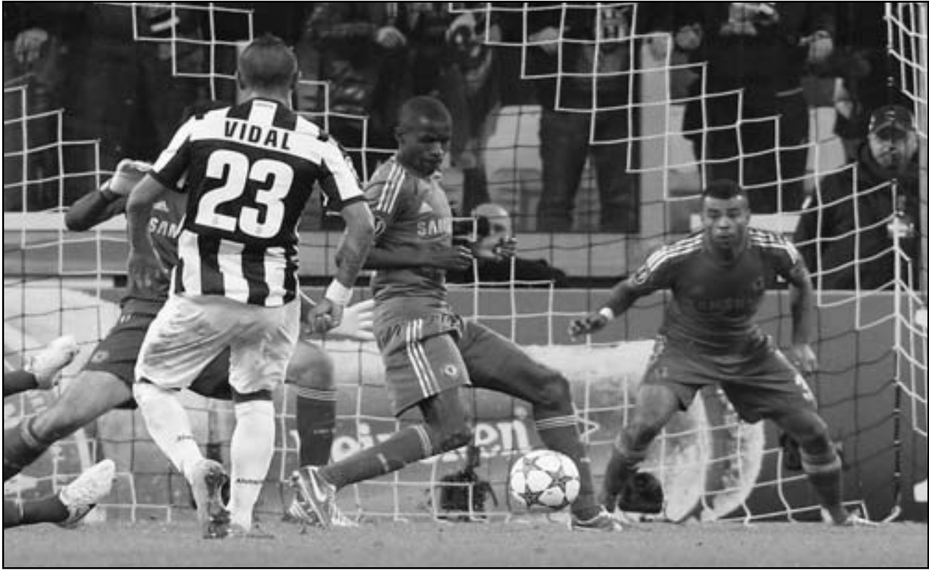
ارتورو فيدال نجم يوفنتوس رقم (23) يسدد هدفا في مرعى تشيلسي في دوري ابطال أوروبا

بين مانشستر سيتي وتشيلسي، في مباراته الـ32 لبطولة الدوري الأوروبي لكرة القدم، بعد تعادله في الجولة الخامسة قبل الأخيرة من دور المجموعات أمام ضيفه يانج بويز السويسري يوم الخميس. وأهدر «الريد» على ملعبهم «أنفيلد» التقدم مرتين عن طريق حوجو شيلبي وجو كول في الدقيقتين 33 و72، ليتعادل ضيفه بهدفين سجلهما الأرجنتيني زاؤول بوباديا ولاعب مونتيجرو (الجيل الأسود) إيلساد زيفرو تيتش في الدقيقتين 52 و88. ورفعت هذه النتيجة رصيد الفريقين إلى سبع نقاط، حيث يحتل ليفربول المركز الثاني للمجموعة الأولى بفارق الأهداف أمام يانج بويز الثالث. وكان أنجي الروسي قد حافظ على صدارة المجموعة الأولى، بفوزه في وقت سابق يوم الخميس على ضيفه أودينيزي الإيطالي 2/ صفر، ليرفع رصيده إلى عشر نقاط مقابل أربع نقاط للفريق الإيطالي الأخير. وتبقى بطاقتا التأهل متاححتان أمام الفرق الأربعة قبل الجولة الأخيرة، التي يحل فيها ليفربول ضيفا على أودينيزي، فيما يستضيف يانج بويز أنجي في سويسرا.