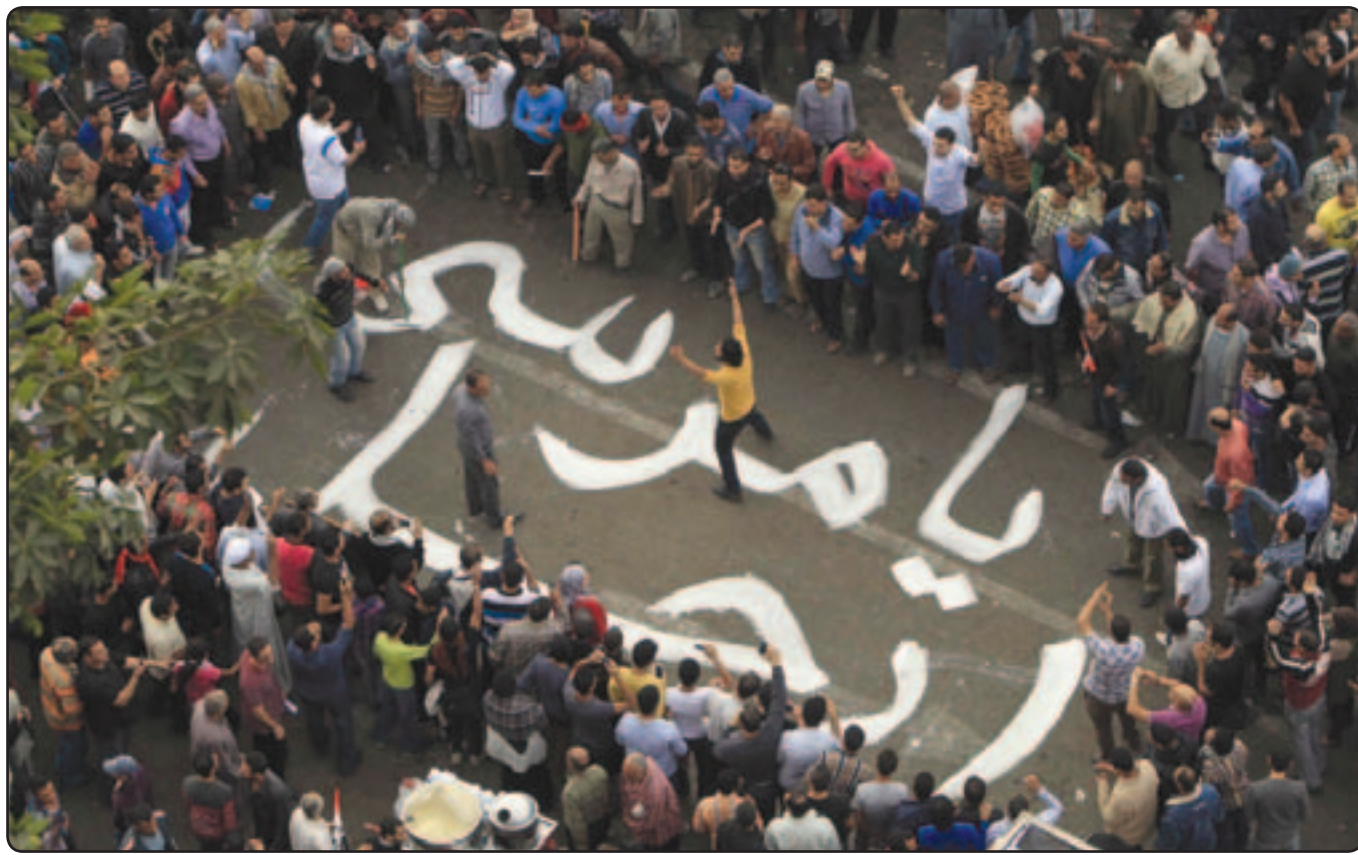
متظاهرون في ميدان التحرير يطالبون برحيل الرئيس محمد مرسي