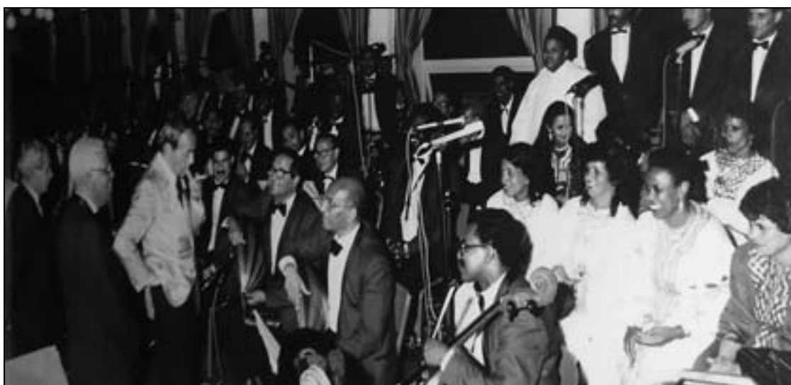
الراحل الملك الحسن الثاني في لقاء دعم للفنانين